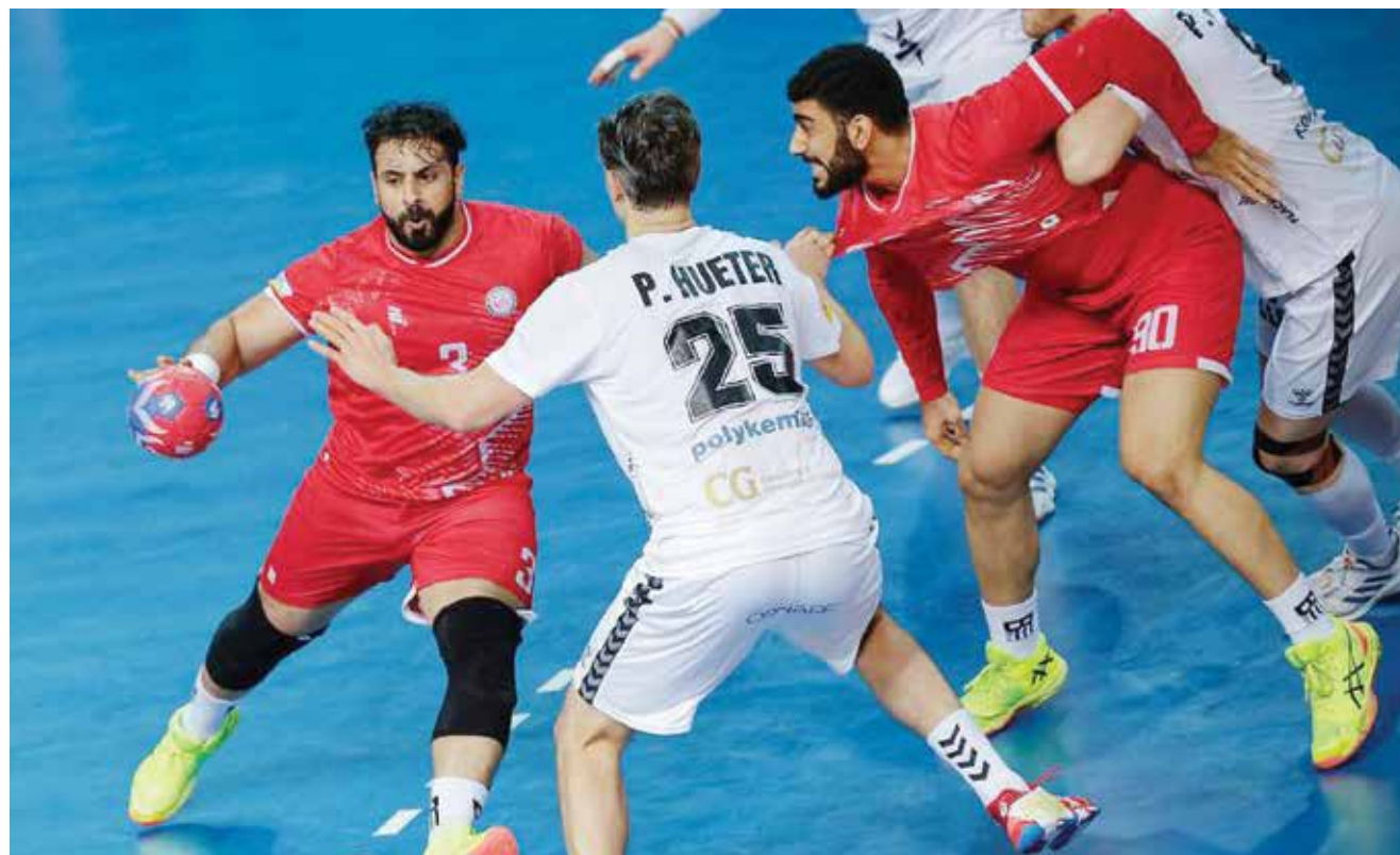
O جانب من اللقاء.

وقال عبدالله الفرج أيضاً «الأسماء التي ستشارك في بطولة قطر المفتوحة هي مخرجات دوري خالد بن حمد لجيل الذهب، ولا يزال مشروع سمو الشيخ خالد بن حمد آل خليفة الطموح هذا يمثل أهم العوامل لاستكشاف المواهب».