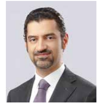
○ وزير البلديات.

تساهم هذه الإجراءات في دعم قطاع التجارة البيطرية وخلق فرص عمل حريصة على فيه، إضافة إلى تحسين جودة الخدمات المقدمة للمربين والمستثمرين في هذا المجال.