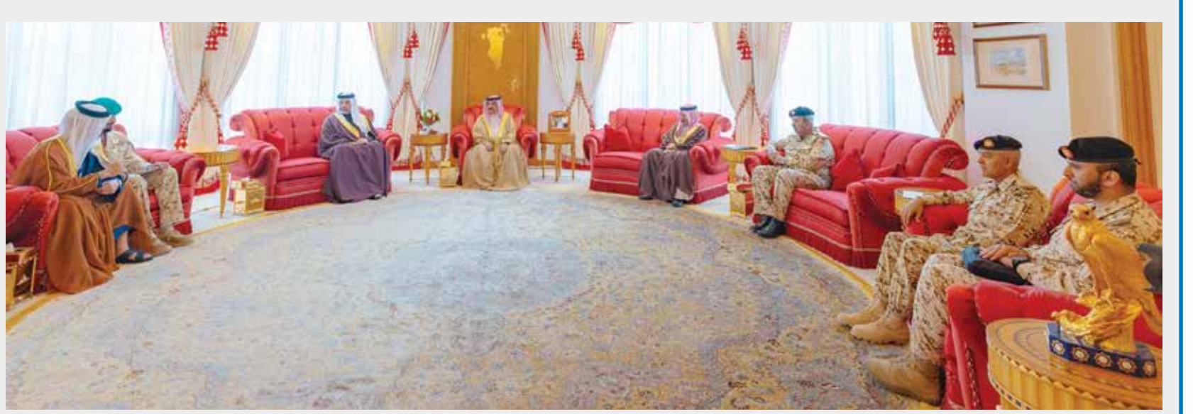
○ جلالة الملك المعظم خلال استقباله عددا من كبار المسؤولين.