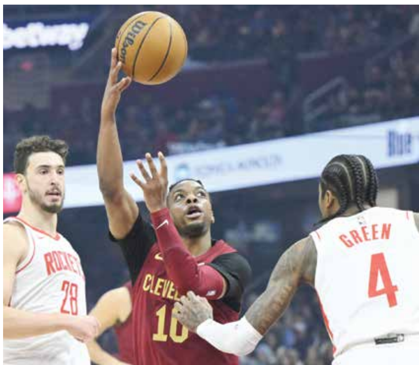
O من لقاء كافاليرز وروكتس.

من أصل ثمان محاولات واكثى فيه بـ١٣ نقطة، سقط غولدن ستايت ووريز على أرضه أمام جاره لوس أنجليس ليكرز ١٠٨-١١٨ بعدما عجز عن إيقاف أنتوني ديفيس (٣٦ نقطة مع ١٣ متابعاً) والخمضرم ليجرون جيمس (٢٥ نقطة مع ١٢ تمريرة حاسمة).