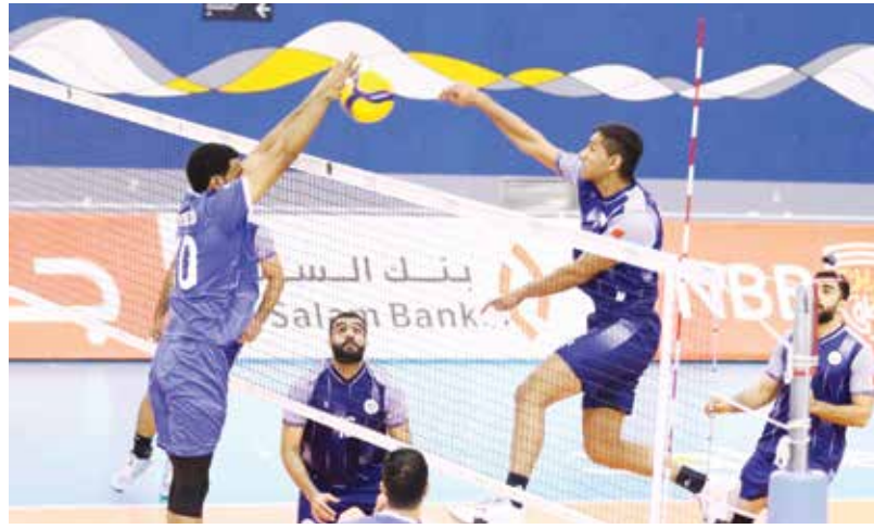
○ من لقاء البستين والتضامن.