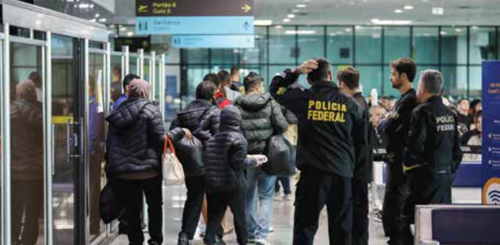
٥ مجموعة من المهاجرين الذين تم إعادهم إلى البرازيل.

وتعهد دونالد ترامب، حمله الانتخابية، بإطلاق «أكبر برنامج ترحيل في التاريخ الأمريكي»، وتفاسخ البيت الأبيض الأسبوع الماضي بتوقيف مئات «المهاجرين غير النظاميين المجرمين»، مشيرا إلى ترحيلهم بطائرات عسكرية وليست مدنية، خلافا لما كان يحصل سابقا. والجمعة، وصل ٢٦٥ مهاجرا مطرودا من الولايات المتحدة إلى غواتيمالا في ثلاث طائرات، بحسب السلطات المحلية.