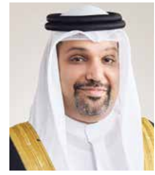
○ وزير المالية.

لسنة ٢٠٢٤ بشأن تنظيم الضريبة على المشاريع متعددة الجنسيات، ويحث أية موضوعات أخرى تحال إليها من قبل الوزارة للفحص والنظر. وتصدر اللجنة توصيتها في الاعتراض المقدم إليها مسببة، وترفعها إلى الوزير أو من يفوضه خلال تعيين يومًا من تاريخ تقديمها إليها على أن يصدر الوزير أو من يفوضه قراره باعتقاد التوصية أو تعديلها أو إلغاؤها خلال ثلاثين يوماً من تاريخ ورودها.