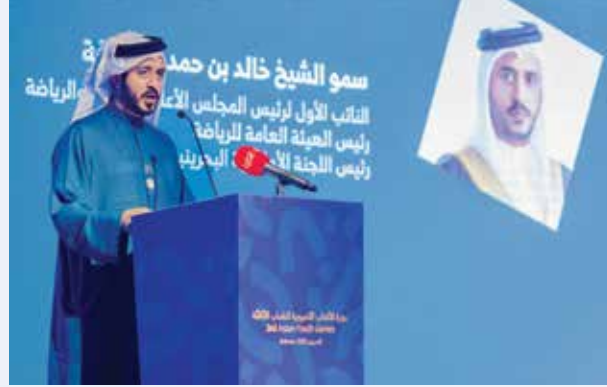
○ سمو الشيخ خالد بن حمد يلقي كلمته.