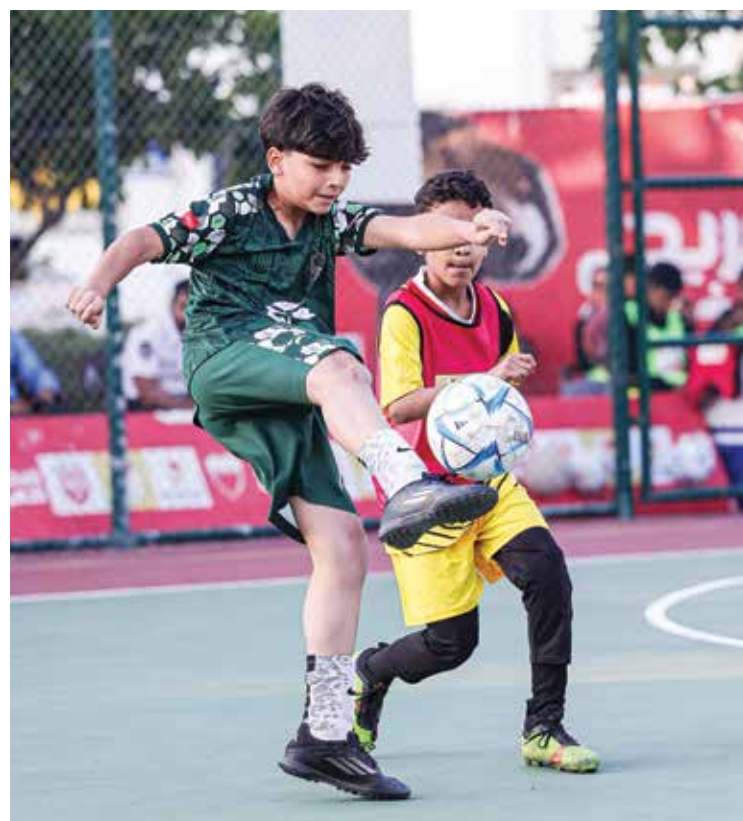
O جانب من المنافسات.

ومع ختام منافسات محافظة المحرق، فقد اكتمل عقد الفرق المتاهلة للأدوار النهائية، والتي ستقام اليوم الإثنين بعد تأهل أربعة فرق عن كل محافظة، حيث سيحتضن ملعب تمكين شباب أبو قوة مواجهات دور ال١٦ والدور ثمن النهائي، فيما سيقام يوم الأربعاء المقبل اليوم الختامي لمبادرة دوري «فريج الذهب» بإقامة مواجهتي نصف النهائي والمباراة النهائية. واسفرت مرحلة المحافظات عن تأهل فريج الوسطي وفريج أبو صيب وفريج السهلة الشمالية وفريج الجسرة عن المحافظة الشمالية، وفريج لبنان وفريج شمال وفريج جنوب