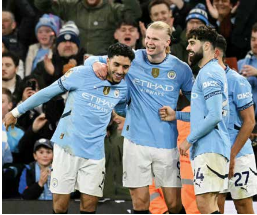
○ هالاند يحتفي بمرموش.

وفرض هالاند نفسه نجما في المباراة التي قلب فيها سيتي تخلفه بهدف إلى فوز ١-٣ بعدما سجل الهدف الثاني وصنع الثالث لفيل فودن وساهم في ارتقاء فريقه إلى المركز الرابع، على الرغم من البداية المخيبة لوفاده الآخر الأوزكي عبدالقادر