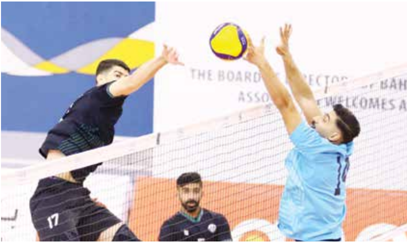
○ من مباراة بني جمرة وعالي.