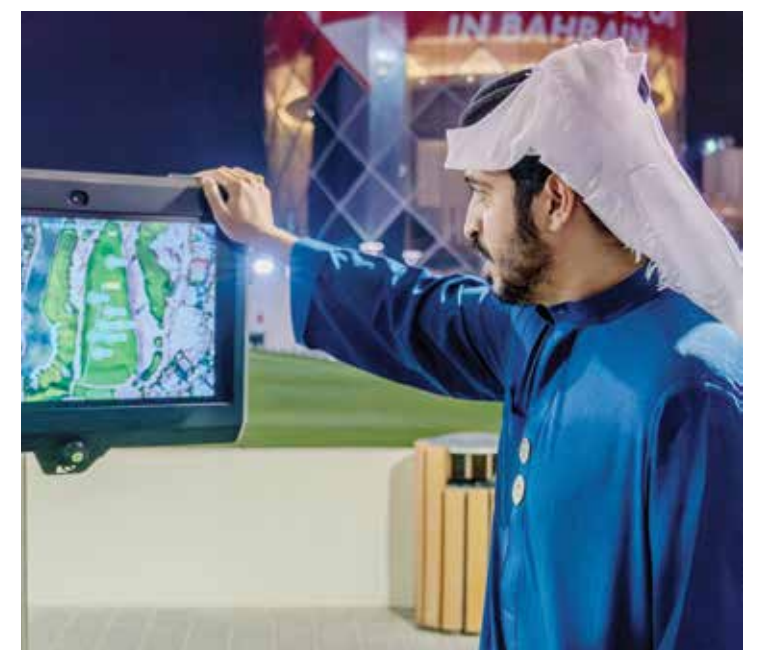
○ سمو الشيخ خالد بن حمد آل خليفة.

قام سمو الشيخ خالد بن حمد آل خليفة، النائب الأول لرئيس المجلس الأعلى للشباب والرياضة رئيس الهيئة العامة للرياضة رئيس اللجنة الأولمبية البحرينية بزيارة النادي الملكي للجولف بمنطقة الرفاع في ٢٦ يناير ٢٠٢٥ للاطلاع على استعدادات النادي لاستضافة جولة بابكو إنرجيز الدولية للجولف التي ستقام خلال الفترة من ٣٠ يناير لغاية ٢ فبراير ٢٠٢٥، وذلك بحضور سمو الشيخ عيسى بن علي آل خليفة نائب رئيس اللجنة الأولمبية البحرينية والسيد فارس مصطفى الكوهجي الأمين للجنة الأولمبية البحرينية والقبطان وليد العلوي رئيس مجلس إدارة النادي الملكي للجولف وعدد من ممثلي دي بي ورلد العالمية للجولف. وقام سموه بجولة ميدانية في كافة أرجاء النادي وأطلع من خلالها على مدى جاهزية النادي لاستضافة الجولة