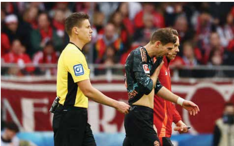
○ غوريتسكا يغادر الملعب.

أوروبا. وتحديث تقارير عدة عن إمكانية رحيل غوريتسكا (٢٩ عاما) عن بايرن بعد وصول البرتغالي جواو بالينيا، لكن إصابة الأخير فتحت الباب أمامه للعودة إلى التشكيلة الأساسية لفريق المدرب البلجيكي فنسان كومباني الذي يتصدر الدوري بفارق ٦ نقاط عن باير ليفركوزن حامل اللقب.