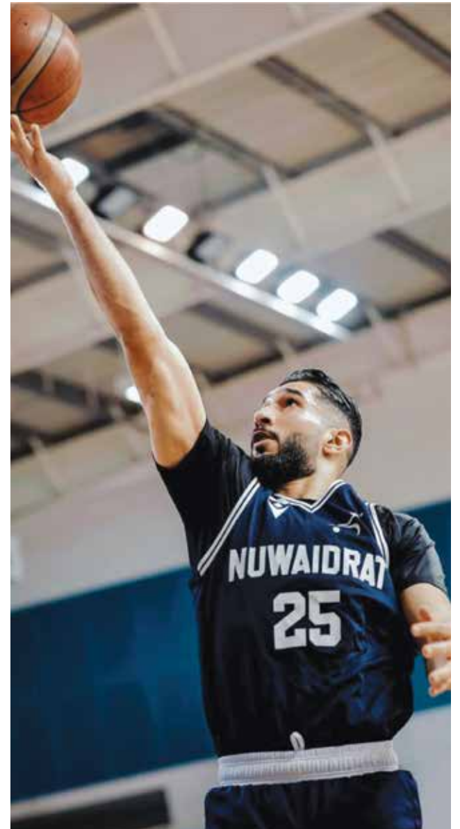
○ جانب من المنافسات.

أرى أن مستوى اللاعبين المحليين في الفريق هو الداعم الأكبر للمحترف المتواجد معنا، وقد لعبنا عدة مباريات