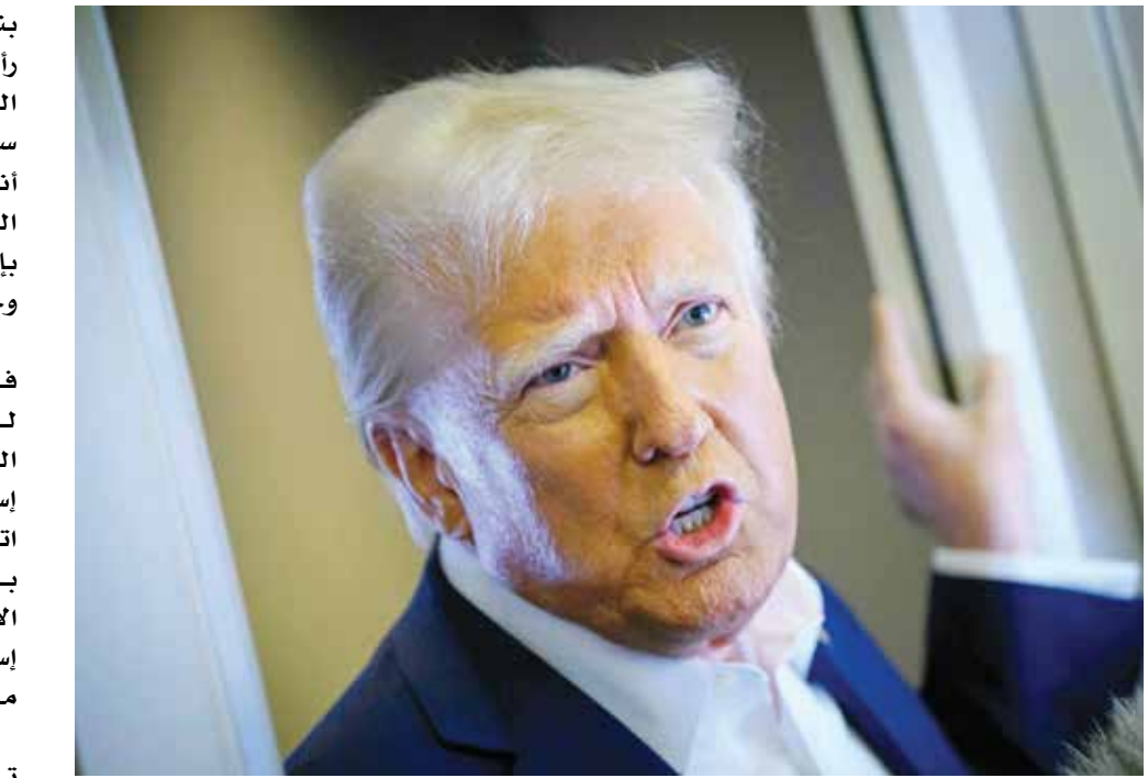
دونالد ترامب.

بنقل سكان قطاع غزة، في حين رأى وزير المال الإسرائيلي اليميني المتطرف بتسليل سموتريتش أمس الأحد أنه «فكرة رائعة»، قائلا إن الفلسطينيين «سيكون بإمكانهم بناء حياة جديدة وجيدة في أماكن أخرى». ويعد ١٥ شهرا من الحرب في قطاع غزة دخل اتفاق لوقف إطلاق النار حيز التنفيذ في ١٩ يناير، لكن إسرائيل وحماس تبادلتا اتهامات أمس الأحد بانتهاك بنوده بعدما اتاح السبت الإفراج عن أربع رهائن إسرائيليات مقابل مائتي معتقل فلسطيني. ودخل تطبيق هدنة هشة تنص على تسليم حماس رهائن احتجزتهم في هجوم السابع من أكتوبر إلى إسرائيل مقابل إفراج السلطات الإسرائيلية عن معتقلين فلسطينيين أسبوعه الثاني، علما بأنه تم توقيع الاتفاق في اليوم الأخير لإدارة جو بايدن. سلف ترامب، رغم تشديد الرئيس الأمريكي الحالي على الدور الذي لعبه للتوصل إليه، وتعهدت إدارة ترامب الجديدة تقديم «دعم ثابت» لإسرائيل من دون عرض تفاصيل سياستها في الشرق الأوسط.