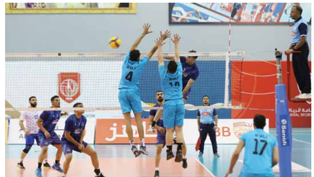
O جانب من مباراة المعامير وعالي.

استعاد فريق المعامير نغمة الفوز التي غابت عنه في الجولة الثانية بعد فوزه المهم على حساب فريق عالي بثلاثة أشواط مقابل شوط ٢٥-١٢، ٢٥-٢٢، ٢٥-٢٠، ٢٥-١٥ في لقاء الجولة الثالثة من دوري عيسى بن راشد (دوري الاتحاد) لكرة الطائرة، الذي احتضنته صالة عيسى بن راشد في الرفاع، وإداره الدوليان محمد خاتم (١) ومحمد