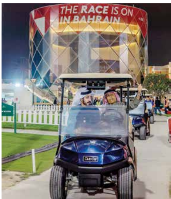
○ سموه يطلع على التحضيرات النهائية.