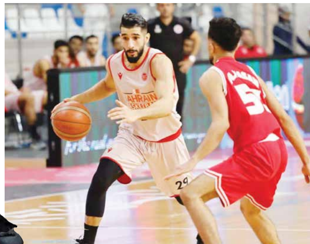
○ المشاركة مع منتخب الرديف.