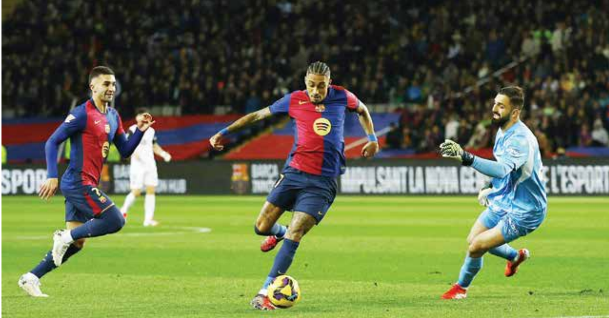
○ من لقاء برشلونة وفالنسيا

مختلف المسابقات بعد هزيمته أمام فالنسيا ١-٠ ولاتسيو الإيطالي ٣-١ في الجولة السابعة من مسابقة الدوري الأوروبي «يوروبا ليغ»، ليتجمد رصيده عند ٢٨ نقطة في المركز التاسع، فيما رفع خيتافي الذي حقق فوزه الخامس، رصيده إلى ٢٣ نقطة.