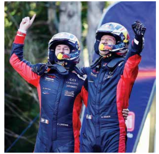
O أوجيهه يحتفل بالفوز.

ميلبورن - (أ ف ب): أحرزت التشيكية كاتيرينا سيناكوكا لقبها العاشر في البطولات الكبرى على صعيد زوجي السيدات، وذلك بعد تتويجها أمس الأحد بصحبة الأمريكية تايلور تاوسند بلقب أستراليا المفتوحة، أولى بطولات الفرانك سلام، في كرة المضرب. وتغلب الزوجي الذي يتصدر التصنيف على التايوانية سو-واي هسيه واللاتفية ليلينا