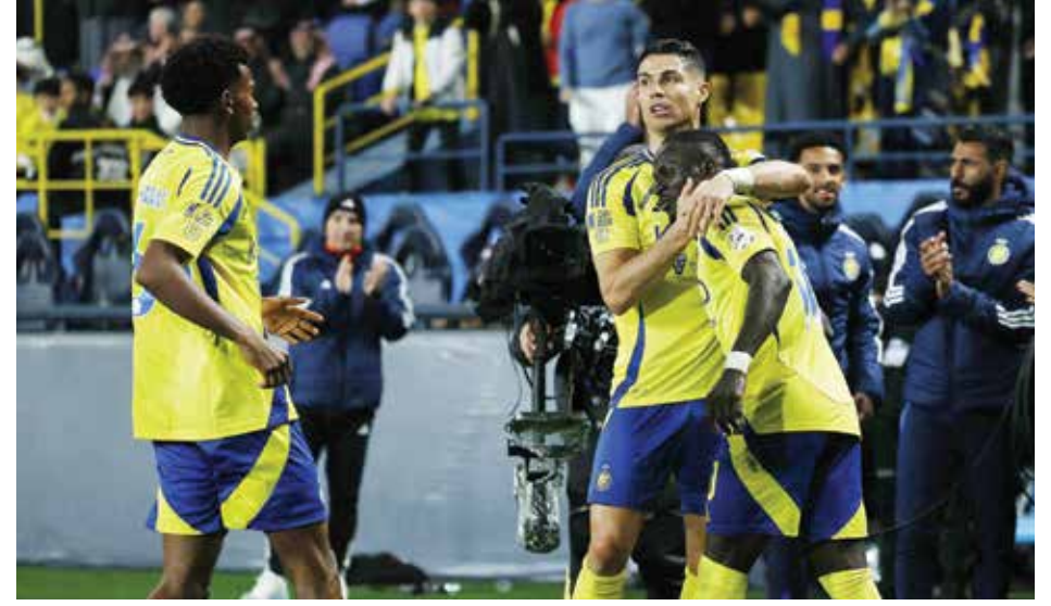
○ فرحة لاعبي النصر بتسجيل الهدف الثالث.

وبعدما افتتح البرازيلي ريشارليسون التسجيل لتوتنهايم برأسية إثر عرضية من الإسباني بيدرو بورو (٣٣)، عادل الأهداف جايمي فاردي النتيجة مطلع الشوط الثاني بتسديدة من داخل منطقة الجزاء بعد عرضية زاحفة من الجامايكي بوبي دي كوردوفا ريد (٤٦). وأعطى المغربي بلال الخنوس التقدم لليستر بتسديدة جميلة من خارج منطقة الجزاء إلى يسار المرمى (٥٠).