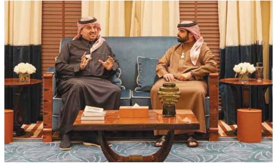
○ سلمان بن محمد يستقبل فهد بن جلوي.