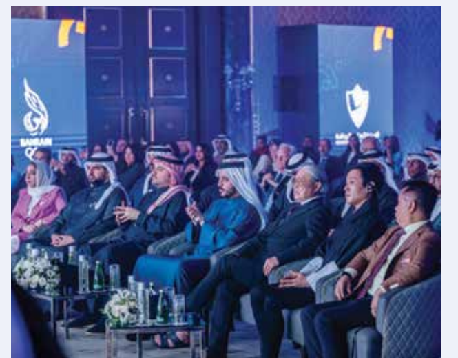
○ حضور رسمي كبير.

بحضور سمو الشيخ خالد بن حمد آل خليفة النائب الأول لرئيس المجلس الأعلى للشباب والرياضة ورئيس الهيئة العامة للرياضة رئيس اللجنة الأولمبية البحرينية دشنت اللجنة الأولمبية البحرينية شعار دورة الألعاب الآسيوية الثالثة للشباب والتي ستحتضنها المملكة من ٢٢ إلى ٣٠ أكتوبر ٢٠٢٥ في الحفل الذي أقيم مساء أمس الأحد ٢٦ يناير ٢٠٢٥ بفندق الريز كارلتون. وشهد حفل التدشين عدد من أصحاب السمو والمعالي والسعادة والوزراء وكبار القيادات الآسيوية بالمكتب التنفيذي بالمجلس الأولمبي الآسيوي والمديرين والمسؤولين في اللجنة الأولمبية البحرينية والهيئة العامة للرياضة وممثلي الاتحادات الرياضية وعدد من المدعوين والضيوف. وبهذه المناسبة ألقى سمو الشيخ خالد بن حمد آل خليفة كلمة رحب فيها بالحضور وأعرب سموه عن بالغ شكره وامتنانه لحضرة صاحب الجلالة الملك