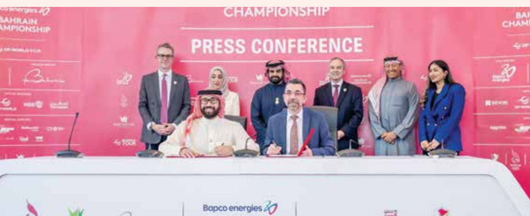
○ من حفل التوقيع.

في إطار دور الشراكة والمبادرات المجتمعية التي تعزز الارتقاء بالرعاية الصحية، قدم مستشفى رويال البحرين رعاية طبية لبطولة «بابكو إنرجيز» الدولية للجولف، والتي ستحتضنها مملكة البحرين خلال الفترة من ٣٠ يناير الجاري إلى ٢ فبراير القادم، برعاية كريمة من صاحب الجلالة الملك المعظم. ويشارك في البطولة مجموعة استثنائية من النجوم العالميين من اللاعبين الفائزين بألقاب البطولات الكبرى، وأساطير كأس رايدر ونجوم جولة دي بي ورلد، مما يسלט الضوء على مكانة البحرين المتنامية كوجهة عالمية رائدة للجولف.