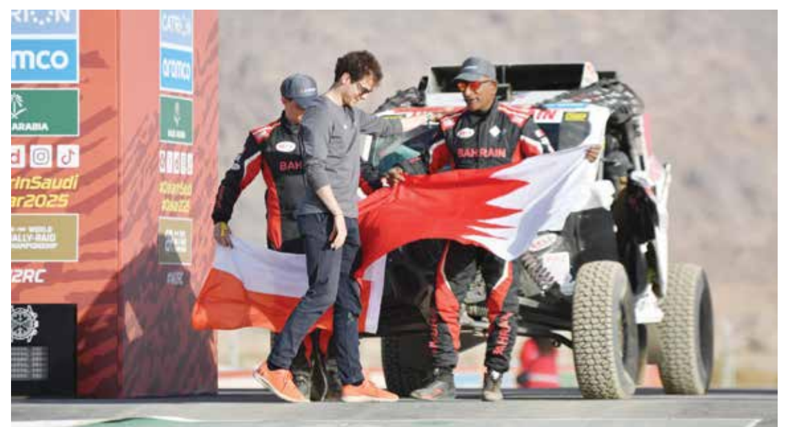
○ من مشاركته في رالي دكار.

رالي حائل الدولي، الذي يتم تنظيمه سنوياً في منطقة حائل بالمملكة العربية السعودية، يعد