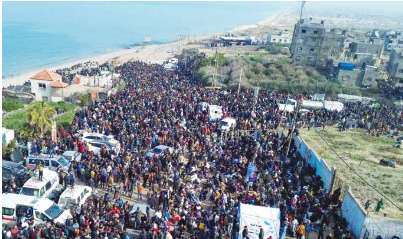
حشود من النازحين تسعى للعودة إلى ديارها شمال قطاع غزة.

تطور مفاجئ قال مسؤول بدحركة الجهاد الإسلامي لرويترز: إنه سيتم الإفراج عن ٣٠ فلسطينياً مقابل إطلاق سراح الرهينة أرييل يهود، وأكد ان الرهينة الإسرائيلية أرييل يهود سيُفرض عنها قبل الجولة المقبلة من تحرير الرهائن المقرر لها بحسب اتفاق الهدنة يوم السبت المقبل.