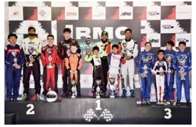
○ منصة التتويج.