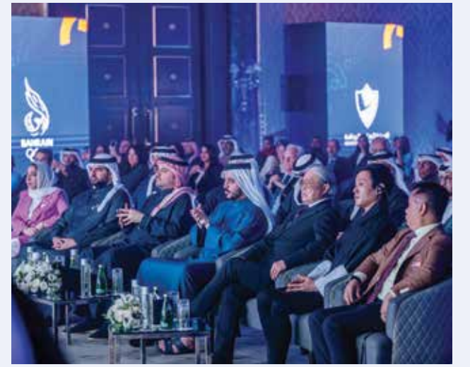
○ حضور رسمي كبير.

بحضور سمو الشيخ خالد بن حمد آل خليفة النائب الأول لرئيس المجلس الأعلى للشباب والرياضة رئيس الهيئة العامة للرياضة رئيس اللجنة الأولمبية البحرينية دشنت اللجنة الأولمبية البحرينية شعار دورة الألعاب الآسيوية الثالثة للشباب والتي ستحتضنها المملكة من ٢٢ إلى ٣٠ أكتوبر ٢٠٢٥ في الحفل الذي أقيم مساء أمس الأحد ٢٦ يناير ٢٠٢٥ بفندق الريذ كارلتون. وشهد حفل التدشين عدد من أصحاب السمو والمعالي والسعادة والوزراء وكبار القيادات الآسيوية بالمكتب التنفيذي بالمجلس الأولمبي الآسيوي والمديرين والمسؤولين في اللجنة الأولمبية البحرينية والهيئة العامة للرياضة وممثلي الاتحادات الرياضية وعدد من المدعوين والضيوف. وبهذه المناسبة ألقى سمو الشيخ خالد بن حمد آل خليفة كلمة رحب فيها بالحضور وأعرب سموه عن بالغ شكره وامتنانه لحضرة صاحب الجلالة الملك