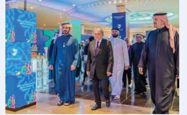
○ أثناء وصول سموه.