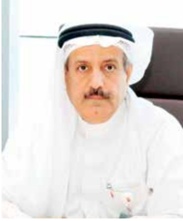
بقلم: عدنان يوسف

ولو تحدثنا على سبيل المثال عن بعض أسباب الأزمات المالية فإن التمويل المالي الإسلامي يمكن أن يسهم في علاج مثل هذه الأسباب من خلال عدة جوانب منها تعديل أسلوب التمويل العقاري، ليكون بإحدى الصيغ الإسلامية منها أسلوب المشاركة