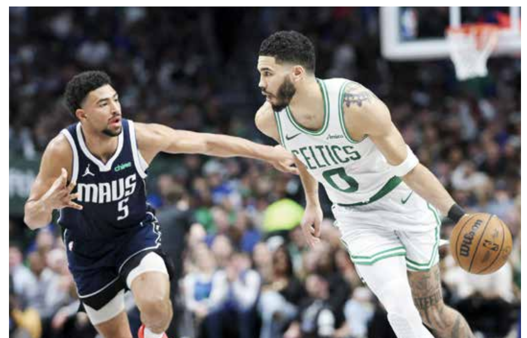
O تايتوم يقود سليتكس إلى الفوز

نقطة من وايت. ورغم جهود كايري إرفينغ (٢٢ نقطة) وكوينتين غرايمز (٢٠) ودانيال غافورد (١٩) مع ١٥ متابعاً) تواصلت معاناة وصيف البطل في ظل غياب نجمه المطلق لوكا دونتشيتش بسبب إصابة في ريلة الساق تعرض لها يوم عيد الميلاد، ومنى بهزيمته الحادية عشرة من أصل ١٦ مباراة خاضها من دون السوفيتي. ورأى النجم اللاتفي كريستابس بورزينغيس الذي سجل ١٨ نقطة في مباراته الأولى على ملعب فريقه السابق منذ أن غادره في فبراير ٢٠٢٢ أنه «كنا كالأسد الموسم الماضي لكن في بعض مباريات هذا الموسم كنا مثل هرة اليضة»، منتقدا بذلك افتقاد فريقه للثبات الذي قاده الموسم الماضي إلى إحراز اللقب.