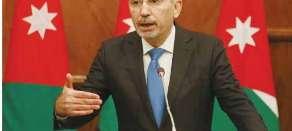
الصفدي: ثوابت الأردن واضحة ولن تتغير.