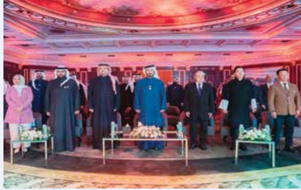
○ سموه يعلن رعاية جلالة الملك للدورة.