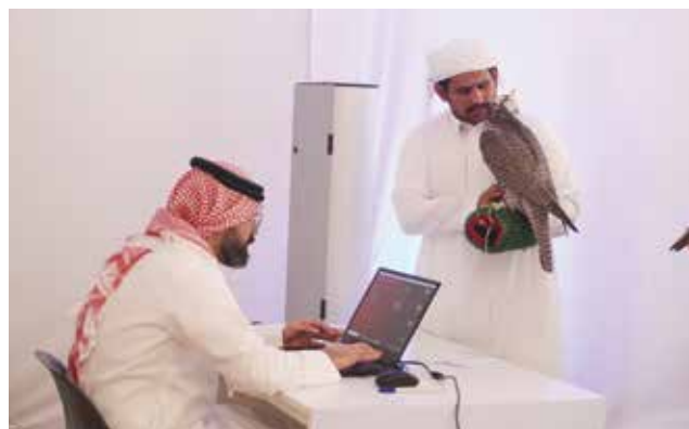
○ جانب من عملية التسجيل والتشبية للسباق الدولي للصقور