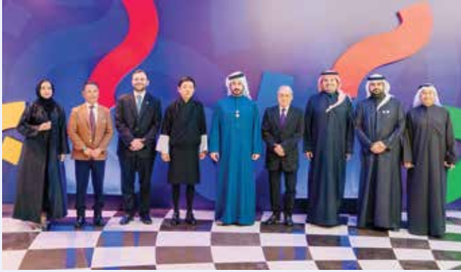
○ سموه يثمن الدعم الملكي.