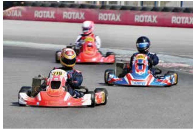
○ من منافسات بطولة تحدي البحرين.

□ مشكلة الأندية انها (تتسرّع) طلب الحلول لمشاكل الكهرباء والصيانة؛ لأنها على تواصل مع الرياضيين يومياً، وتجد نفسها أمام (ضغوطات) كبيرة، كل ذلك ليس بعيداً عن الهيئة التي تعمل مع سائر الوزارات والهيئات لتذليلها؛ وهو ما اتضح من ردود (د. عسكر) في إجابته عن بعض المفردات المعطوحة!