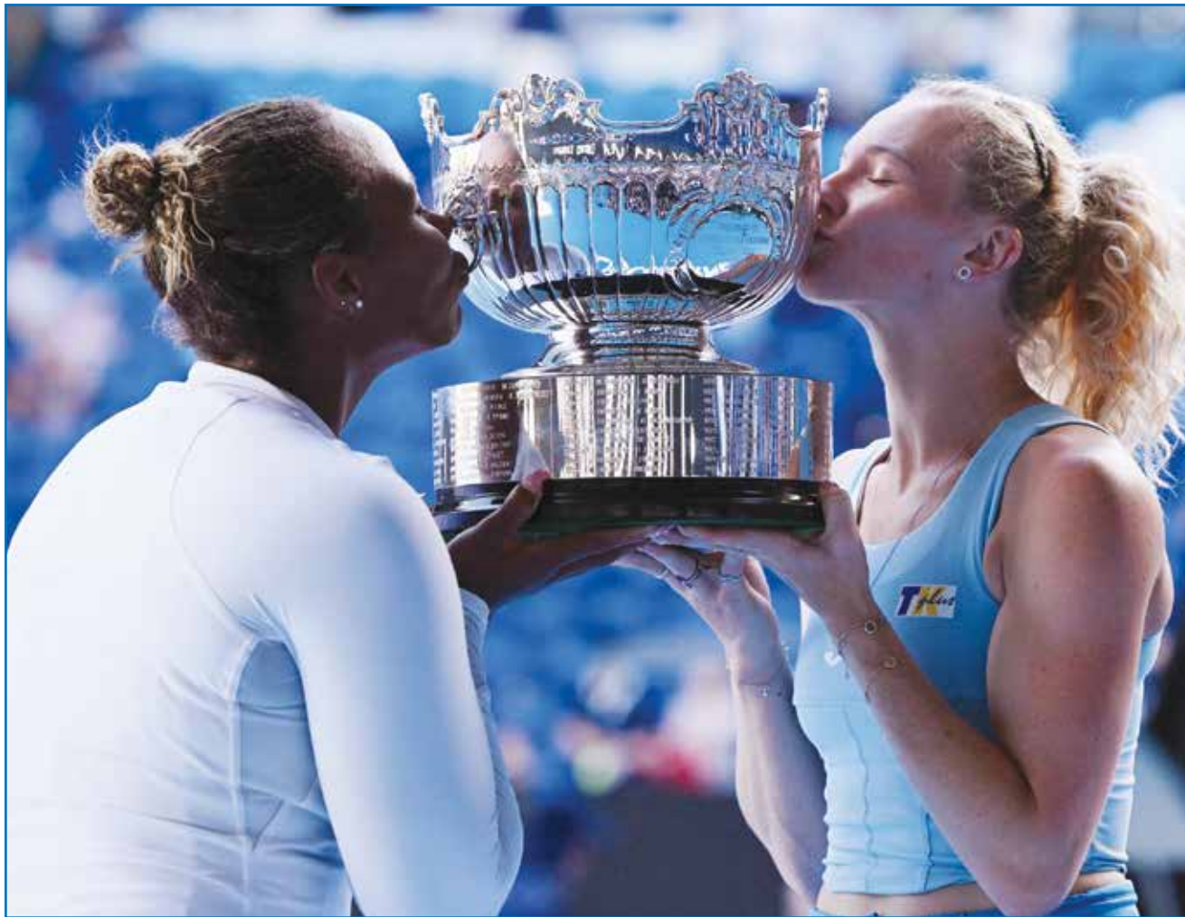
O سيناكوكا وتاوسند تحتفلان بالفوز

أديلايد - (أ ف ب): فاز الإكوادوري جوناثان نارفايز بلقب سباق تور داون أندر للدراجات أمس الأحد بعد هيمنته على صدارة الترتيب العام للسباق، في الوقت الذي فاز فيه الأسترالي سام ويلسفورد بالمرحلة النهائية من السباق. ووقع حادث تصادم قبل ١,٤ كم من خط نهاية المرحلة السادسة التي امتدت لمسافة ٩٠ كم، لكن نارفايز تفادى الوقوع في المتاعب وحافظ على فارق التسع ثوان التي تفصله عن الإسباني خافيير رومو، محققاً أول لقب ضمن جولة بطولة العالم في مسيرته. وبات نارفايز أول دراج من الإكوادور يفوز بلقب سباق تور داون أندر، في النسخة الخامسة والعشرين من السباق، وذلك بعد أن حل وصيفاً خلال نسخة العام الماضي. وبدا نارفايز المرحلة الأخيرة للسباق متفوقاً بفارق تسع ثوان عن رومو، ونجح في الحفاظ على هذا الفارق ليتوج باللقب. وصعد نارفايز إلى منصة التتويج ثلاث مرات خلال المراحل الست للسباق الذي جاء كأول سباق للجولة العالمية للموسم الحالي.