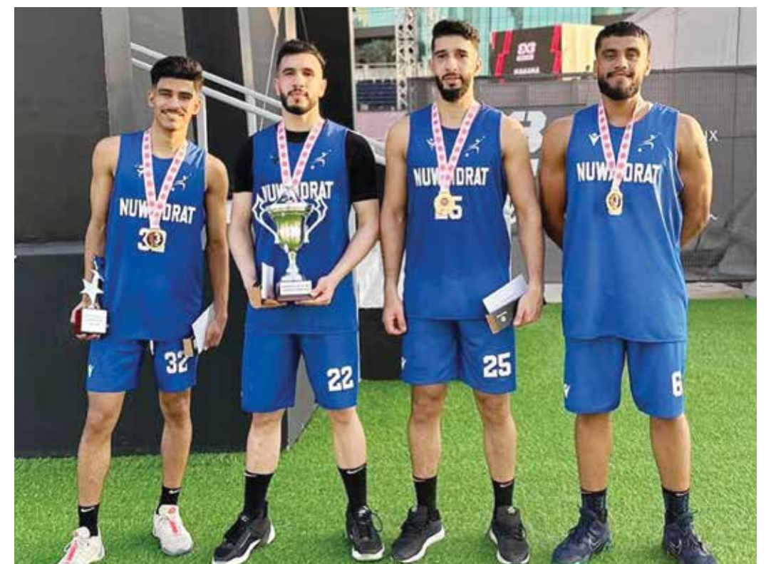
○ التويج ببطولة 3x3.