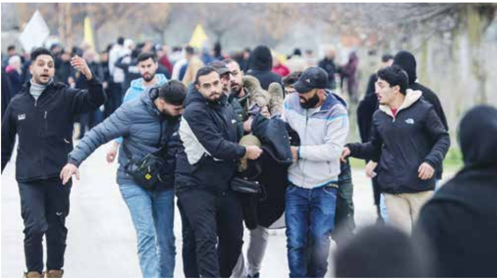
٥ لبنانيون ينقلون مصابا بنيران إسرائيلية في قرية برج الملوك جنوبي لبنان.

بيروت – (وكالات الأنباء): أعلنت وزارة الصحة اللبنانية أن ٢٢ شخصا على الأقل قتلوا وأصيب العشرات جراء إطلاق الجيش الإسرائيلي النار في مناطق بجنوب البلاد يحاول المئات دخولها أمس الأحد رغم عدم انسحاب جيش الدولة العبرية منها.