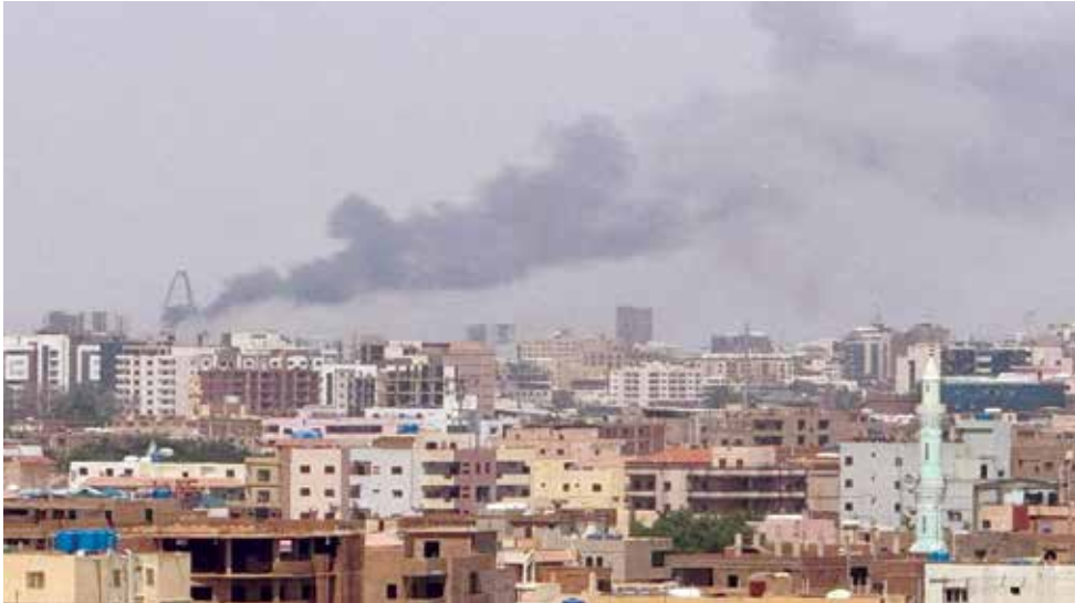
٥ أحد مشاهد النزاع السوداني. (أرشيفية)

من جهته، أكد متقي أنّ سلطات طالبان «تتأكد من وصول المياه إلى الجانيين»، الأفغاني والإيراني، مشيرا إلى أنّ «المنطقة بأكملها