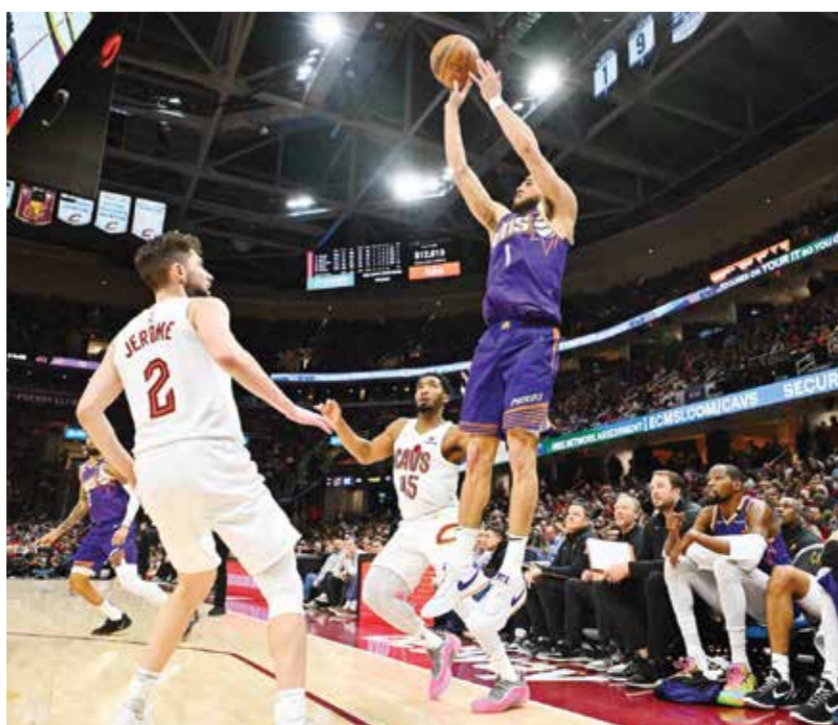
○ من لقاء كافاليزز وصنز (أ ف ب)

في المقابل، برز كيفن دورانت في صفوف صنز بتسجيله ٢٣ نقطة مع سبع كرات مرتدة، فيما اكتفى ديفين بوكر الذي سجل ٣٠ نقطة على الأقل في آخر خمس مباريات، بـ١٥ نقطة فقط.