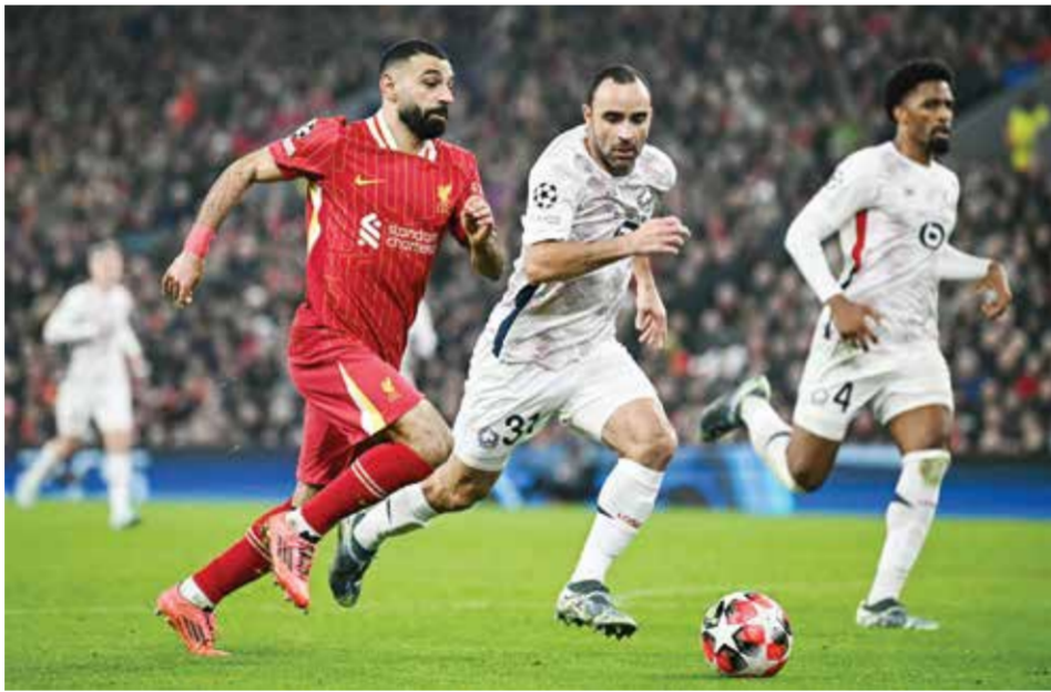
من لقاء ليفربول وليل.

وحصد كل فريق نقطة واحدة ليرفع يوفنتوس رصيده إلى ١٢ نقطة في المركز الرابع عشر بفارق نقطة واحدة عن كلوب بروج صاحب المركز السابع عشر.