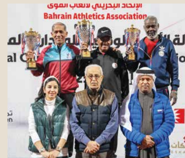
○ من تتويج الأبطال.