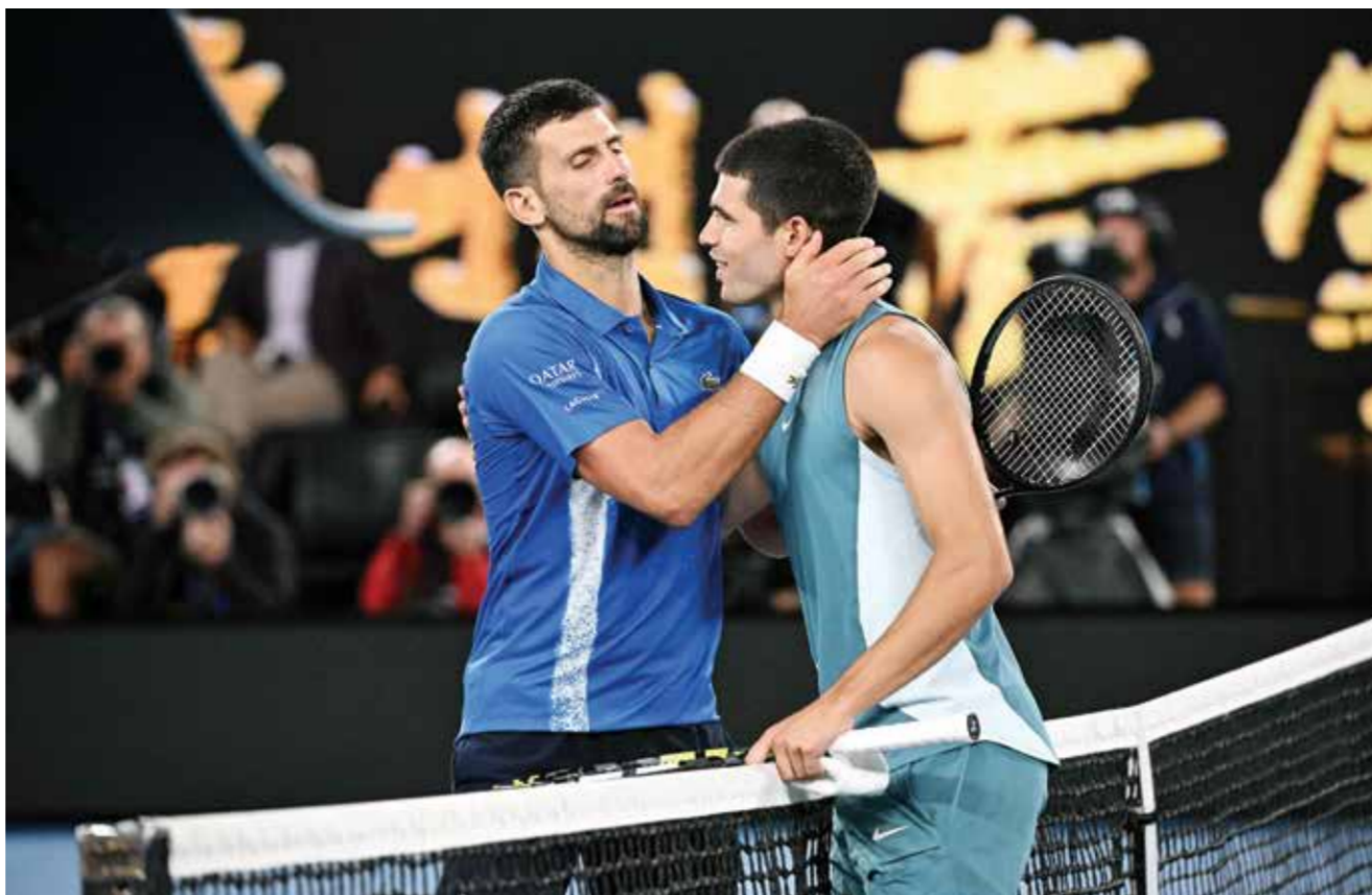
○ ديوكوفيتش يودع ألكاراس.

وشارت سابالينكا لخسارتها أمام المخضرمة بالفتشنيكوفا (٣٣ عاما) في دور الـ٣٢ لبطولة رولان غاروس عام ٢٠٢١، وحقت فوزها الثاني في أربع مواجهات مع الروسية بعد الأول في نصف نهائي دورة مدريد عام ٢٠٢١. وقالت سابالينكا «بصراحة، كنت أصلي فقط، وأحاول إعادة الكرة في هذه الظروف الصعبة»، مضيفة «كان اللعب صعبا. أنا سعيدة جدا لأنني تمكنت بطريقة ما من الفوز بهذه المباراة بطريقة سحرية».