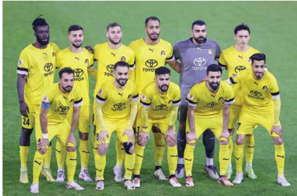
○ فريق الأهلي.