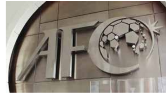
○ شعار الاتحاد.

ممتازة من الاتحاد الآسيوي لكرة القدم نحو رقمته السجلات. سيسهم هذا النظام في دعم نمو وتطوير الاتحادات الوطنية، كما أنني واثق بأنه سيحفزنا على تنظيم المزيد من المباريات لبناء القدرات داخل اتحاداتنا».