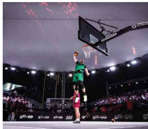
○ من استضافة البحرين للجولة العالمية.

وبحسب جدول المباريات، سيلعب منتخبنا مباراة الثلاثاء يوم الجمعة أمام المنتخب الياباني، فيما يلاقي منتخب أمريكا يوم الأحد القادم، وبناء على المركز الذي يخرج به في هذه المجموعة سيلتقي المنتخب الواقع في الترتيب نفسه بالمجموعة المقابلة لتحديد التصنيف النهائي في سلم الترتيب العام.