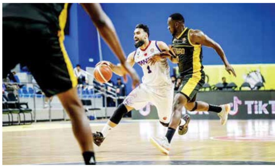
○ جانب من اللقاء.

وسيلتقي المنامة ثاني المجموعة الثانية مع الأهلي البحريني ثالث المجموعة الأولى في ثلاث مواجهات قوية، الفائز في لقاءين سيتأهل للدور النصف نهائي.