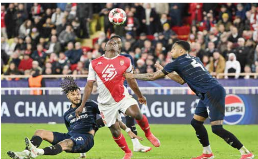
من لقاء موناكو وأستون فيلا.