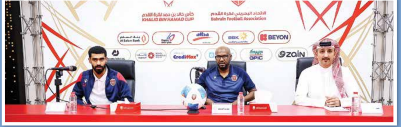
○ من مؤتمر فريق المحرق.