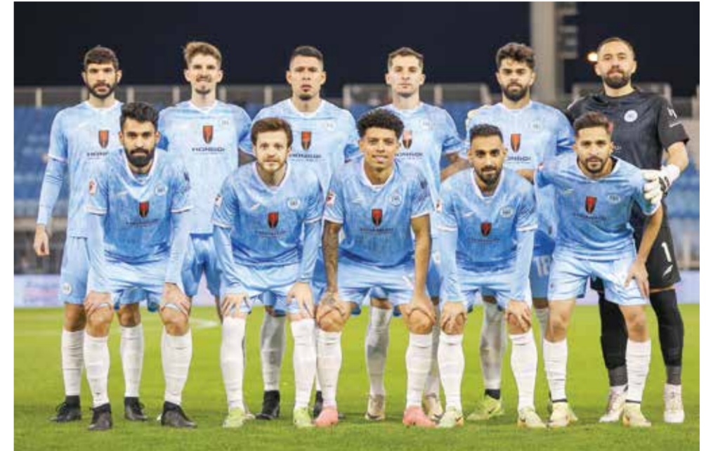
○ فريق الرفاع.