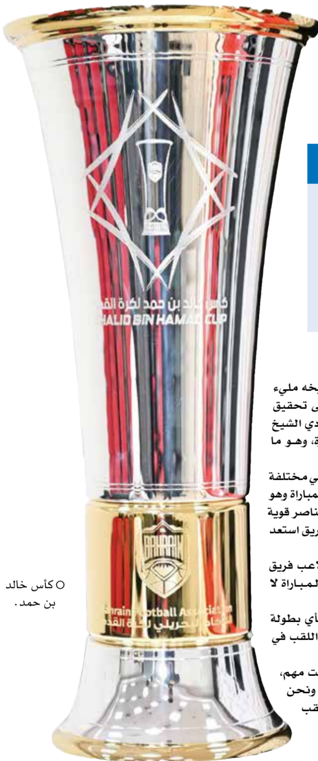
○ كأس خالد بن حمد.

أبدت الأندية الأربعة (الخالدية، المحرق، الرفاع، الأهلي) رغبتها الجادة والقوية في تحقيق لقب النسخة الأولى من بطولة كأس سمو الشيخ خالد بن حمد آل خليفة لكرة القدم، والتي تقام للمرة الأولى هذا الموسم بتنظيم اتحاد الكرة وبرعاية شاملة من العديد من الشركات والجهات الداعمة. وقال ممثلو الأندية من مدربين ولاعبين خلال المؤتمرات الصحفية التي عقدت أمس الثلاثاء في مقر اتحاد الكرة للحديث عن استعداداتهم أن هذه المسابقة تمثل أهمية بالغة بالنسبة إلينا، وسوف نسعى إلى تحقيق لقبها في النسخة الأولى، مؤكداً أن التغطية الإعلامية التي تحظى بها مسابقة