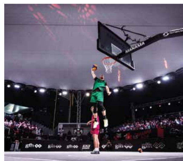
○ من استضافة البحرين للجولة العالمية.

وبحسب جدول المباريات، سيلعب منتخبنا مباراة الثلاثاء يوم الجمعة أمام المنتخب الياباني، فيما يلاقي منتخب أمريكا يوم الأحد القادم، وبناء على المركز الذي يخرج به في هذه المجموعة سيلتقي المنتخب الواقع في الترتيب نفسه بالمجموعة المقابلة لتحديد التصنيف النهائي في سلم الترتيب العام.