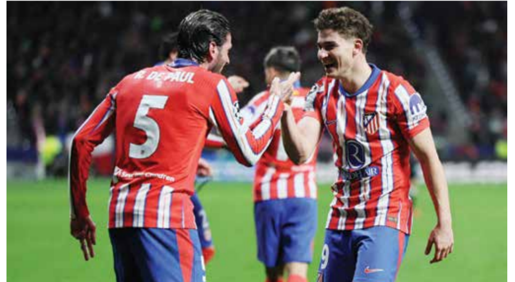
فرحة الفاريز بتسجيل الهدف الثاني.