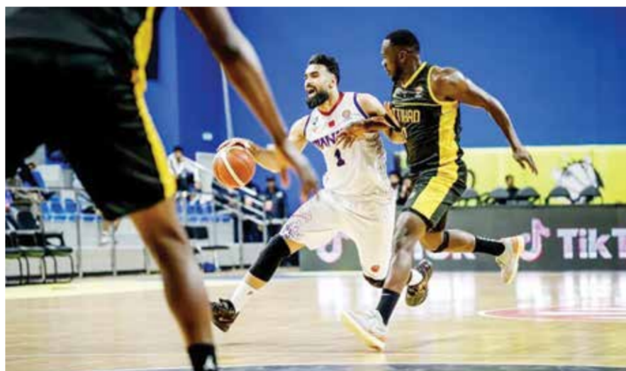
○ جانب من اللقاء.

وسيلتقي المنامة ثاني المجموعة الثانية مع الأهلي البحريني ثالث المجموعة الأولى في ثلاث مواجهات قوية، الفائز في لقاءين سيتأهل للدور النصف نهائي.