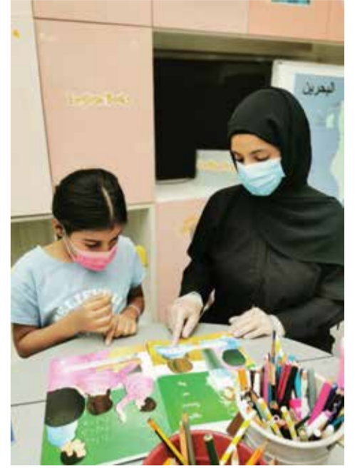
○ تكريم الملحقة الثقافية بالقاهرة.