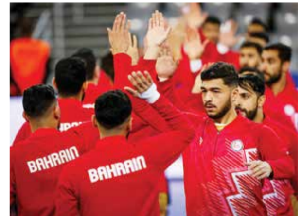
○ منتخبنا يتحضر لملاقاة كويا.