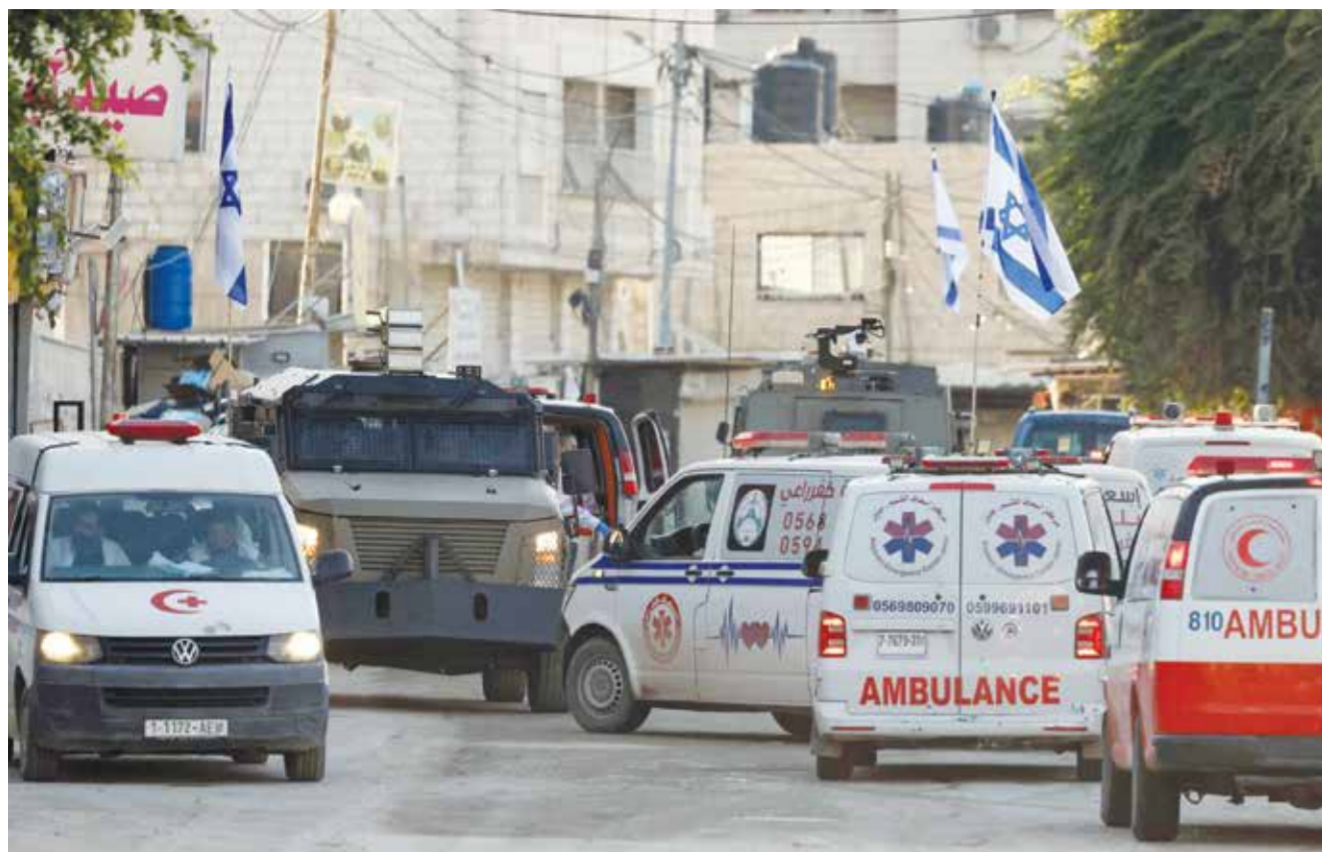
قوات الاحتلال تمنع سيارات الإسعاف من الوصول إلى ضحايا عدوانه في جنين.