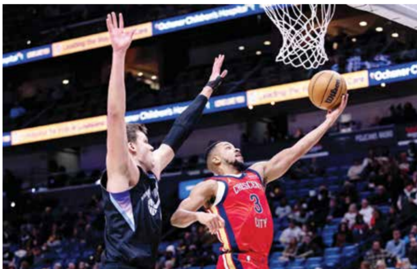
○ مالكوم يقود بليكانز إلى الفوز.

بتسجيله ٣٤ نقطة مع ست تمريرات حاسمة، فيما لم ينفع الخاسر تالغ نجمه تاري يونغ بتسجيله ٢٧ نقطة كأحد سبعة لاعبين في صفوف فريقه سجلوا ١٠ نقاط أو أكثر. وتخلص ديترويت بيستونز من خسارتين متتاليتين على أرضه بفوزه على هيوستن روكتس ١٠٧-٩٦ بفضل ٣٢ نقطة مع تسع متابعات وسبع تمريرات حاسمة لكيد كاتينغهام و١٦ نقطة و١٤