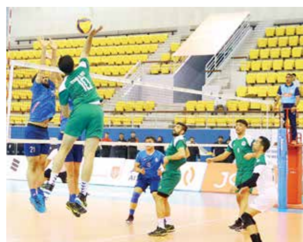
○ من لقاء اتحاد الريف والدير.