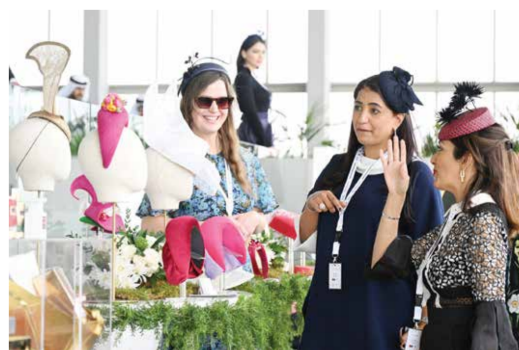
○ من فعالية الرويالتي العام الماضي.

كما قرر نادي راشد للفروسية وسباق الخيل طرح تذاكر مجانية خاصة للجماهير النسائية عند بوابة دخول الجمهور في يوم السباق، بالإضافة إلى توفير التذاكر عبر الموقع الإلكتروني للنادي Bahrainrurfclub.com لجميع الفئات، حيث ستكون الدعوة مفتوحة لكافة الجماهير حتى لا يفوتوا فرصة الحضور والاستمتاع بالأجواء الاستثنائية المميزة لفعاليات «أمسية رويالتي»، بجانب متابعة المنافسات المثيرة للأشواط