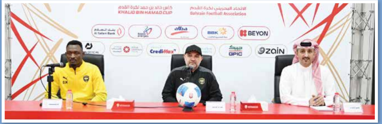
○ من مؤتمر فريق الخالدية.