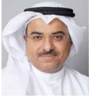
○ يوسف اليوسف.

الماضي، أعلنت انفسكتورب اتفاقها للاستحواذ على ايبببولي Epipli، وهي شركة رائدة وسريعة النمو في مجال المدفوعات البديلة، إذ ستدعم انفسكتورب نموها وانتشارها الدولي في جميع أنحاء أوروبا في خطة ما بعد الاستحواذ. تعليقا على هذه الخطوة، قال يوسف اليوسف، رئيس مجموعة استثماري انفسكتورب: يمكن Investcorp Wealth للمستثمرين من تحقيق النجاح في المشهد المالي الديناميكي اليوم، يجب أن يكون الاستثمار مجزياً، ولهذا السبب صمّمنا تطبيق Investcorp Wealth الذي يمنح المستثمرين المهنيين القدرة على إدارة محافظهم الاستثمارية بنشاط ومواكبة آخر التحديتات من خلال تطبيق آمن وسهل الاستخدام.