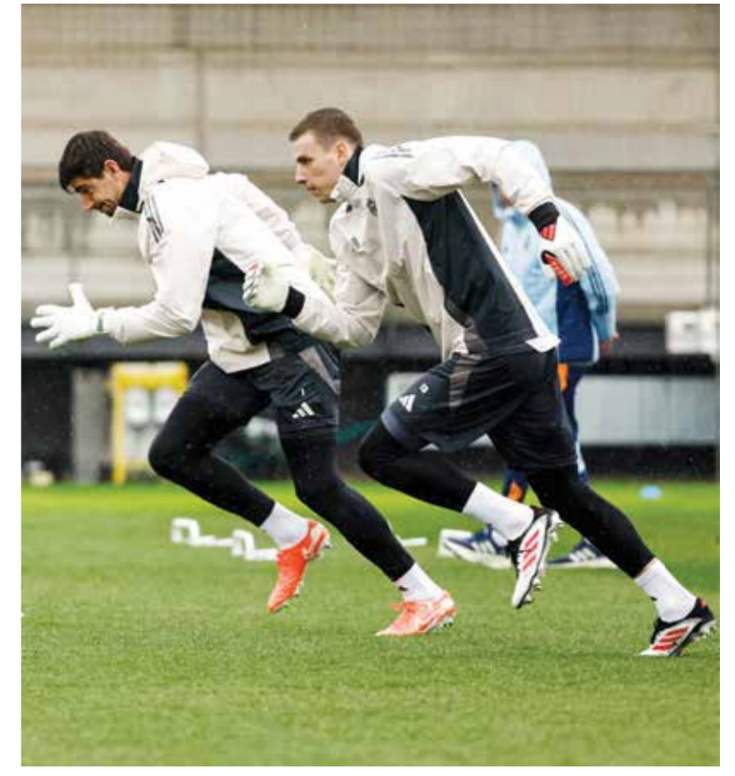
○ تدريبات ريال مدريد.

وأضاف بوتراجينيو: «اللعبة على ملعب المنافس يزيد من صعوبة اللقاء، وعلينا أخذ ذلك في الاعتبار، لكن، من الواضح أننا نتطلع إلى اللعب بحماسة كبيرة وعلى أمل العودة إلى قرعة الدور قبل النهائي». وتابع في حديثه، الذي نقله الموقع الإلكتروني الرسمي للريال: «ليغانيس يمر بلحظة رائعة في الوقت الحالي. لقد حقق سلسلة انتصارات، وهو بحالة جيدة. سيكون منافسا خطرا للغاية».