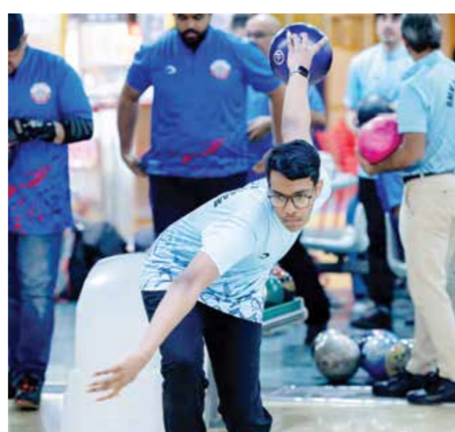
○ من منافسات الدوري.

أما المركز الرابع فقد جاء فيه فريق الحالة بمجموع ٤٩٦٧ وبرصيد ١٠ نقاط، وفي المركز الخامس جاء فريق البسيتين بمجموع ٤٣٠٢ وبرصيد ٨ نقاط، وجاء الاتفاق في المركز السادس بمجموع ٤١٢٤ وبرصيد نقطتين، في المركز السابع فريق الصم بمجموع ٤٣٣٩ ويدون رصيد من النقاط وفي المركز الثامن فريق مدينة عيسى بمجموع ٤٣٠٠ ومن دون رصيد من النقاط.