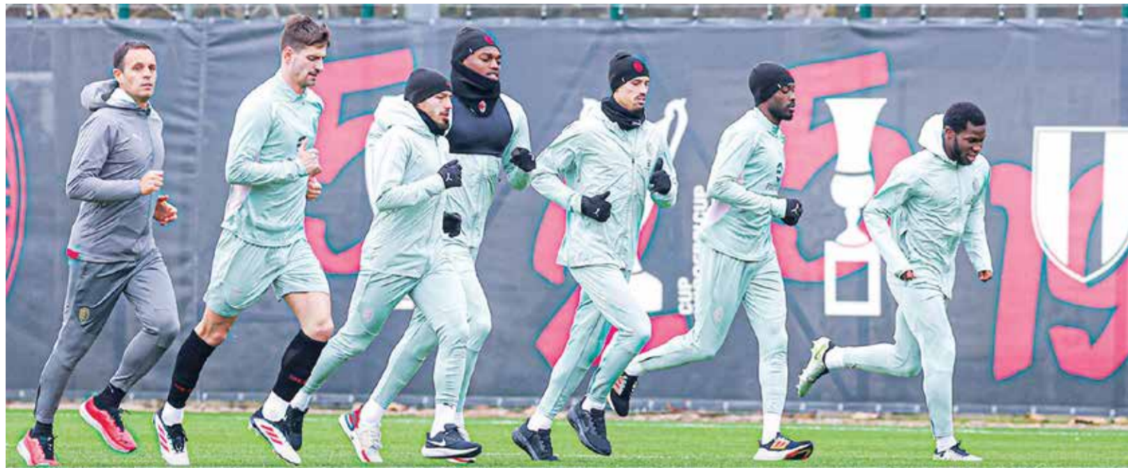
○ تدريبات ميلان