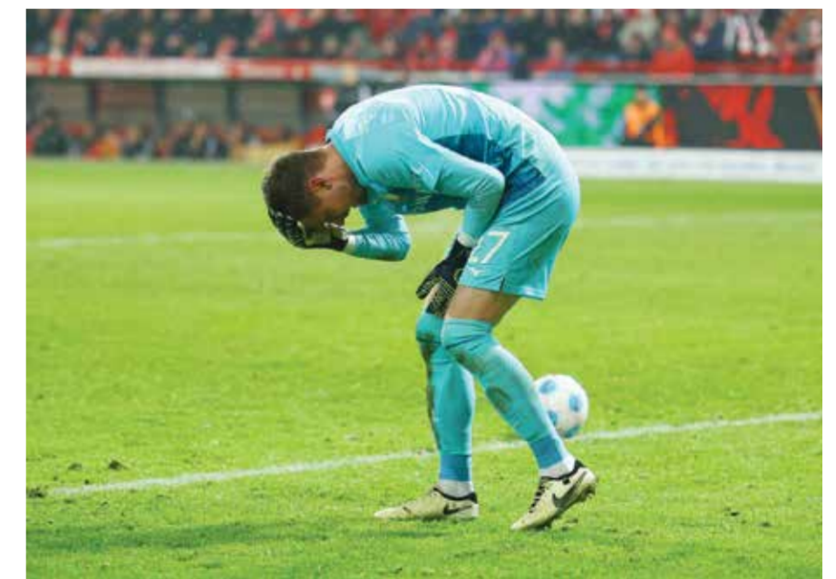
○ إصابة درويش.

وتشمل أبرز ميزات النظام إمكانية التحكم في الوصول بأمان، وإتاحة تقديم البيانات في الوقت الفعلي، فضلا عن إدارة المباريات التعليمية،