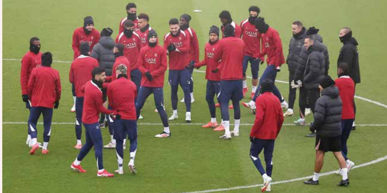
○ تدريبات سان جرمان

إلى ذلك، يأمل باريس سان جرمان في أن يكون أداء جناحه الدولي برادلي باركولا الذي حسم الفوز في المباراة الأسبوع الماضي بتسجيله هدفا وتمريضه كرة حاسمة أمام نلس (١-٢)، بمثابة إشارة إلى أشياء أفضل قادمة من لاعب لم يسجل في دوري أبطال أوروبا هذا الموسم. وسيزداد الضغط على باركولا (٢٢ عاما) في مركزه على الجناح الأيسر بعد التعاقد مع الدولي الجورجي خفيشبا كفاترانتسخيليا من نابولي الإيطالي الأسبوع الماضي مقابل ٧٠ مليون يورو. ومع ذلك، فإن النجم الجورجي غير مؤهل لهذه المباراة ولا يمكن تسجيله في المباراة ضد شتوتغارت أيضا، لذلك ستكون لدى باركولا فرصة لإثبات نفسه ضد سيتي.