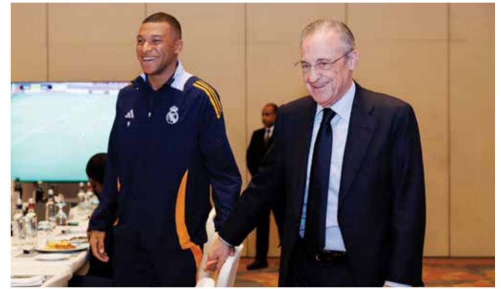
○ بيريس يدعم مبابي

قال كونسيساو بعد الخسارة المستحقة لفريقه في تورينو الخطوة الأولى للفوز