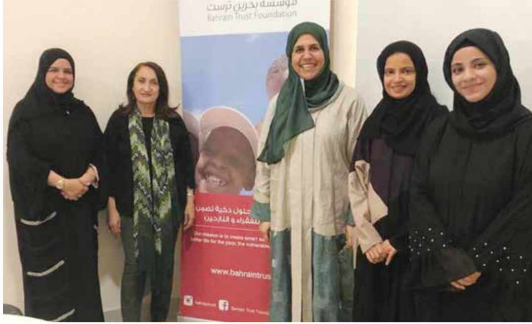
○ معرض للوسائل التعليمية.