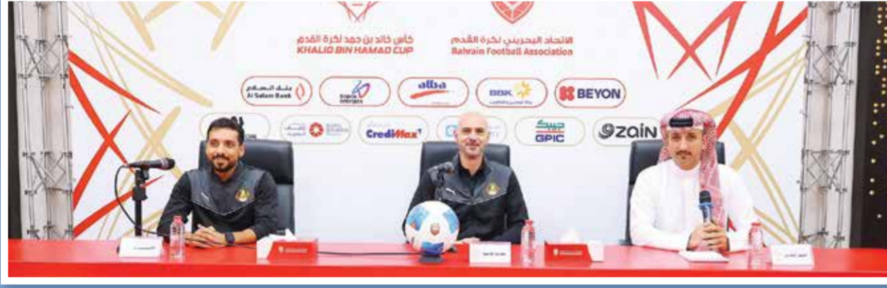
○ من مؤتمر فريق الأهلي.