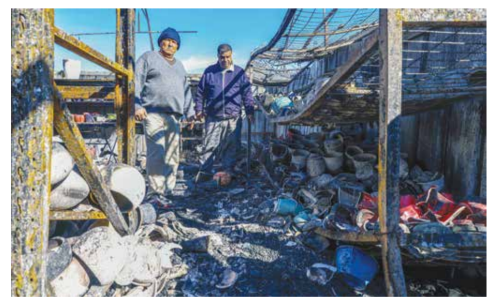
فلسطينيان يفحصان ممتلكاتهما التي أحرقتها قطعان المستوطنين.