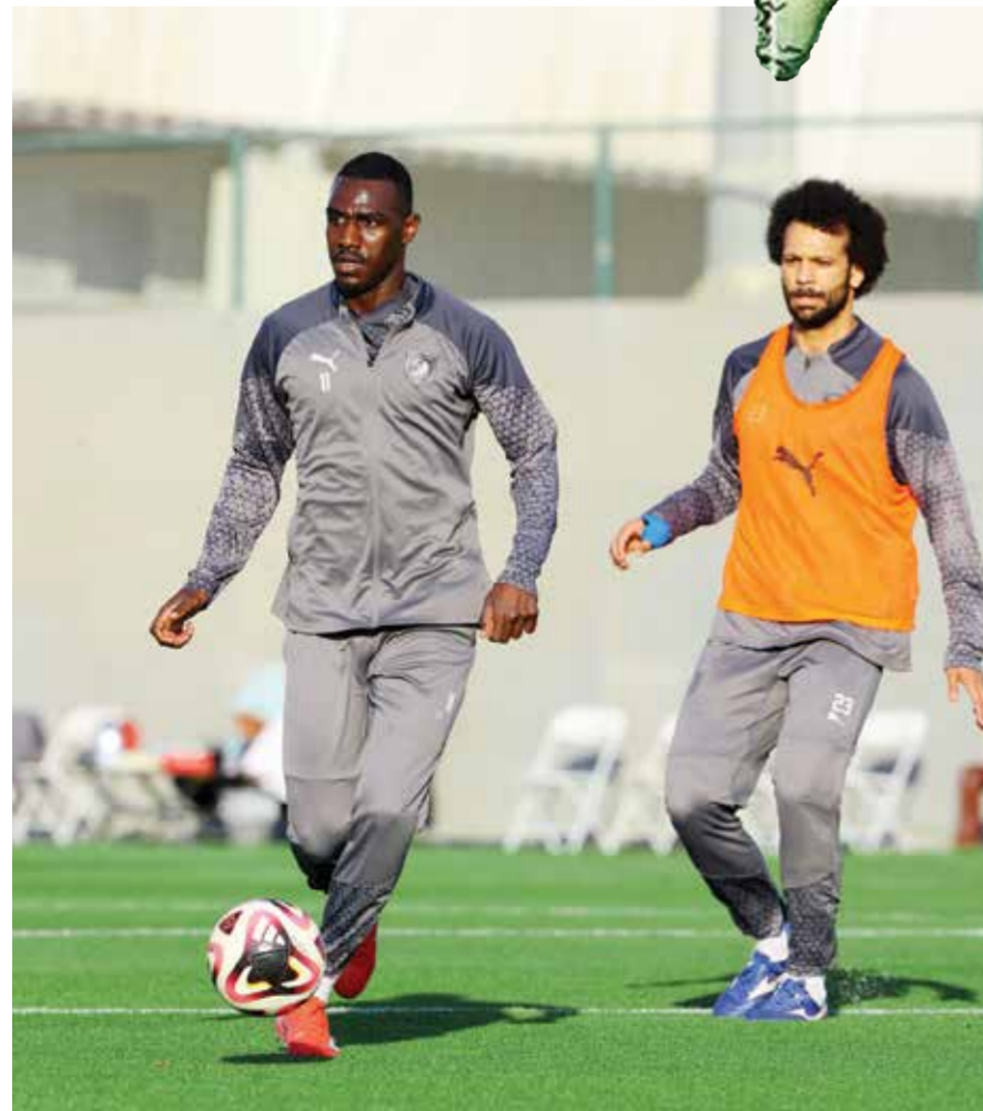
○ تدريبات الدحيل.

الدوحة - (أ ف ب): يتطلع الدحيل إلى تعزيز صدارته للدوري القطري لكرة القدم عندما يلتقي مع الريان غدا الخميس في المرحلة الثانية عشرة، فيما يأمل المطاردان المباشران السد حامل اللقب والأهلي إلى مواصلة ضغطهما عندما يواجهان قطر والغرافة تواليا. ويتفوق الدحيل بفارق ثلاث نقاط عن السد والأهلي وهو يسعى إلى مواصلة صحوته بعدما عوض خسارته المفاجئة أمام الخور ٢-١ في المرحلة الأخيرة من دور الذهاب، بفوز على الوكرة ٤-١ في المرحلة الماضية. ولن تكون مهمة رجال المدرب الفرنسي كريستوف غالتيهيه سهلة أمام الريان الخامس (١٦ نقطة) والذي ضرب بقوة في مستهل مشواره مع مديره الجديد البرتغالي ارتور جورج يفوز كبير على أم صلال ٦-٢، لكنه سقط أمام شباب الأهلي الإماراتي ٣-١ في درع التحدي ضمن الكأس السوبر القطرية-الإماراتية. وقال غالتيهيه «مقبلون على مواجهة مهمة أمام فريق قوي، ستكون بمثابة تحد كبير لنا. سنكون مطالبين بالحفاظ على الصورة ذاتها التي ظهرنا عليها في مستهل الإياب، وأن نقدم المستوى نفسه في الذهاب مع تدارك الأخطاء التي ظهرت خلال المباراتين اللتين خسرناهما».