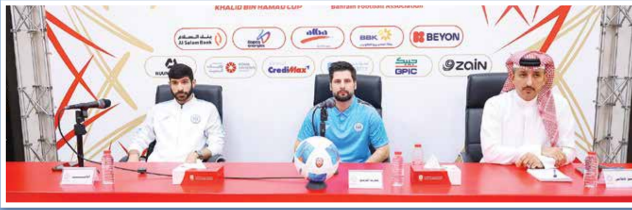
○ من مؤتمر فريق الرفاع.