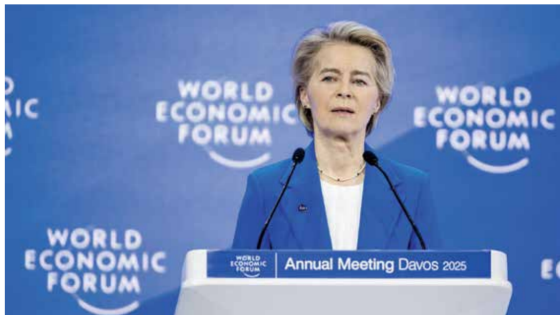
○ رئيسة المفوضية الأوروبية تلقي إحدى الكلمات الافتتاحية في دافوس. (أ ف ب)

دافوس - (أ ف ب): عبرت رئيسة المفوضية الأوروبية أمس في دافوس عن توجه أوروبا للبحث عن حلفاء جدد واعتماد البراغماتية في التعامل مع دونالد ترامب مقابل انتعاج سياسة اليد الممدودة مع الصين.