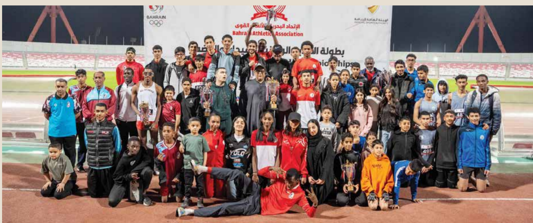
○ صورة جماعية.

تحت رعاية محمد عبداللطيف بن جلال رئيس الاتحاد البحريني لألعاب القوى نظم الاتحاد بطولة الأندية للشباب للمضمار لفتي الأشبال والشباب للموسم الرياضي ٢٠٢٤ - ٢٠٢٥ والتي أقيمت على ستاد البحرين الوطني بمشاركة ستة أندية وهم كلاً من البسيتين، البحرين، ستر، الشباب، واحدة.