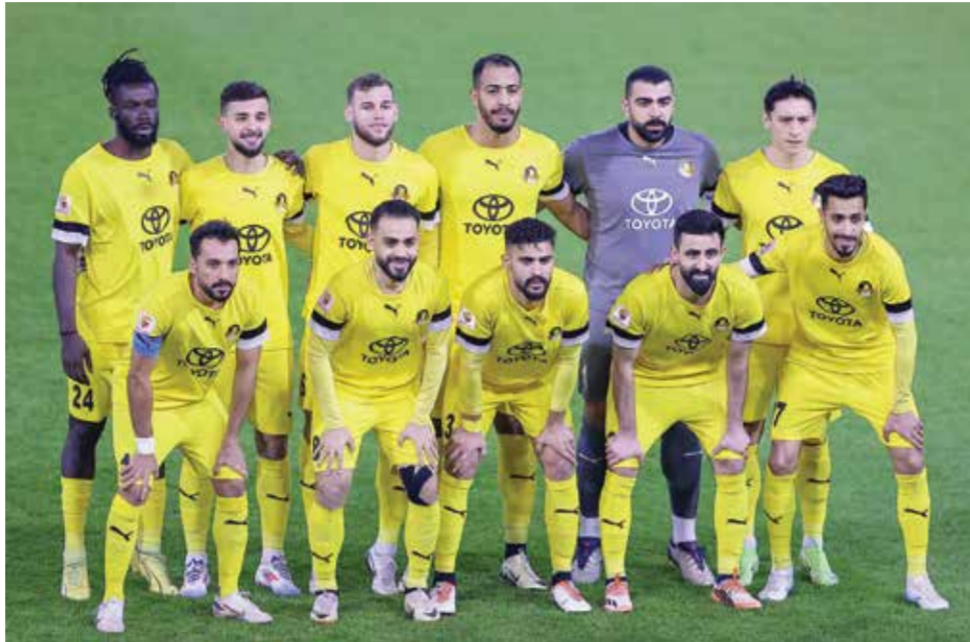
○ فريق الأهلي.