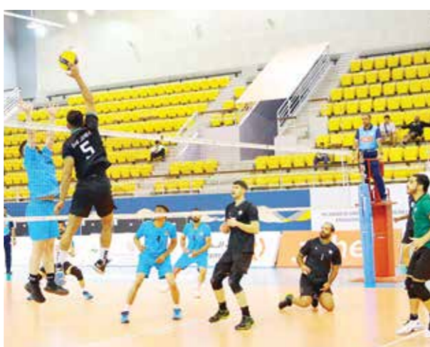
○ من لقاء بني جمرة وعالي.