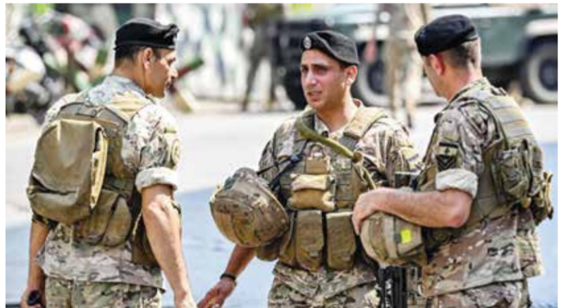
عناصر من الجيش اللبناني.

الاتحاد الأوروبي لتضاض إلى تلك التي تعهدت الولايات المتحدة بتقديمها الأسبوع الماضي والتي تتخطى قيمتها ١١٧ مليون دولار في مجال الأمن.