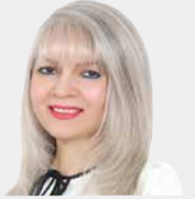
أجرت الحوار: هالة كمال الدين

يقول الأديب الألماني جوهان غوته: «ما قيمة حياتي إن لم أعد مفيداً للآخرين»؟ بالفعل مساعدة الغير تجعل منك إنساناً عظيماً، وخاصة إذا كانت دون انتظار أي مقابل، فالتعاون هو قانون الطبيعة والشئ الوحيد القادر على إنقاذ البشرية، لذلك يمثل أهم الصفات التي يتحلى بها المرء، وبه تبني الأمم وتتقدم، ومن تربي عليه كان خير سند وعون لمن حوله. من هنا اتخذت هذه المرأة من التعاون رسالة لها في الحياة، عملاً بمقولة ألبيرت اينشتاين التي تؤكد أن الحياة التي نعيشها من أجل الآخرين هي الحياة الوحيدة التي تستحق العيش، والذي تراه وسيلتها للتخلص من الهموم والألام ونافذتها نحو الشعور بالرضا والسعادة.