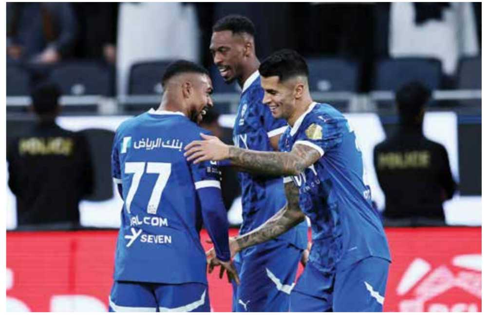
فرحة لاعبي الهلال بتسجيل الهدف الثاني.

وارتكب شتشيزني خطأ جديدا من خلال إعاقة التركي كريم أكتوركوغلو