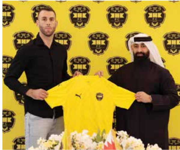
○ من تقديم ايفانوفيتش بحضور الرئيس محمود جناحي.