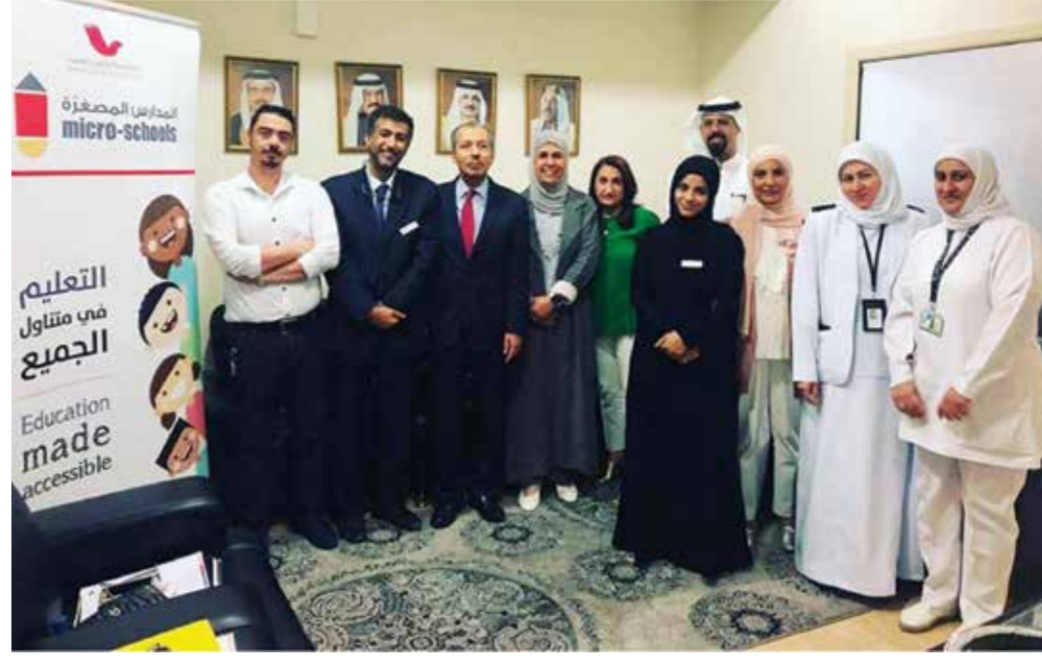
○ تكريم من وزير التعليم العالي المصري.