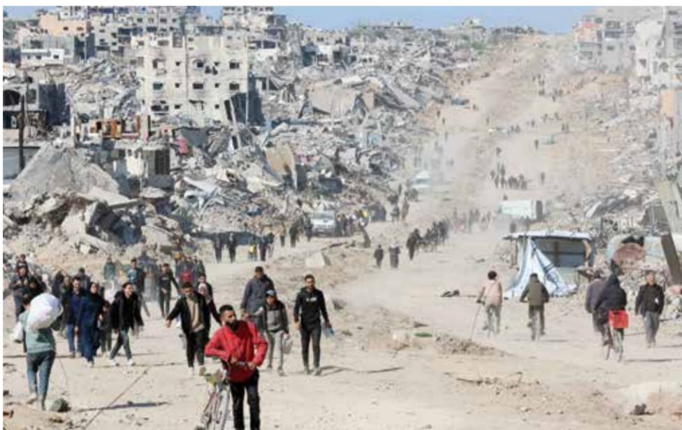
فلسطينيون يعودون إلى مناطقهم في مخيم جباليا رغم حجم الدمار. (أ ف ب)

إن قطر تعتقد أن إدارة ترامب، حتى قبل أن تصبح إدارة ترامب... كانت داعمة للغاية لهذا الاتفاق، وأضاف: «من خلال كل الاتصالات التي تجريها معهم... إنهم يؤمنون بهذا الاتفاق». وبموجب الاتفاق من المقرر أن تستمر المرحلة الأولى من الصفقة المكونة من ثلاث مراحل ستة أسابيع مع إعادة ٣٣ رهينة من غزة مقابل نحو ١٩٠٠ أسير فلسطيني. ومن المتوقع أيضاً أن تبدأ الأطراف محادثات بشأن وقف إطلاق نار دائم خلال المرحلة الأولى، وهو ما لم يتم الاتفاق عليه بعد، ما يؤدي إلى المرحلتين الثانية والثالثة.