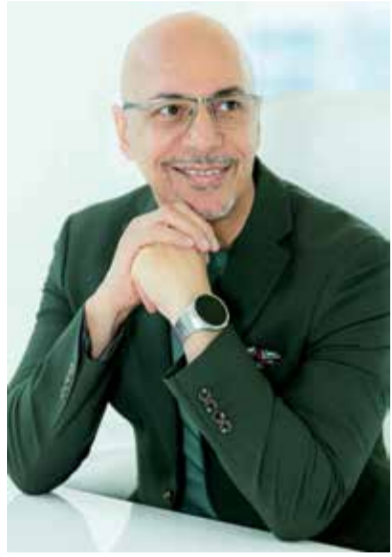
○ أشرف اعلام

حتى لو كانت أكثر من احتياجات المالك، وأحياناً تكون هذه الوجاهة مكلفة جداً ولكنها مطلوبة من قبل الشخص الغني؛ فقد يصرف مبالغ كبيرة سنوياً على عقار لا يستخدمه سوى أيام أو أسابيع في السنة، فقط من أجل الوجاهة الاجتماعية والشعور بالتميز!