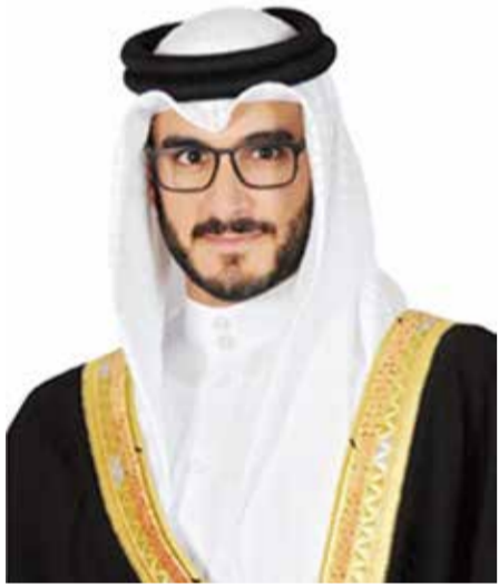
○ سمو الشيخ عيسى بن سلمان.

المنشود من تبادل للخبرات وأفضل الممارسات الدولية والتنوع المعرفي. كما جرى خلال اللقاء استعراض العلاقات الأخوية العميقة بين مملكة البحرين ودولة الإمارات العربية المتحدة الشقيقة، وسبل تعزيزها والدفع بها نحو مستويات أشمل بما يعود بالخير والنماء لصالح البلدين وشعبهما الشقيقين.