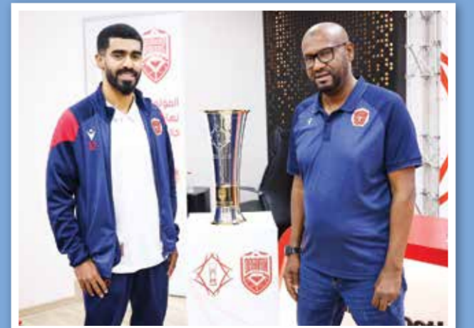
○ الشمالان والخلاصي.