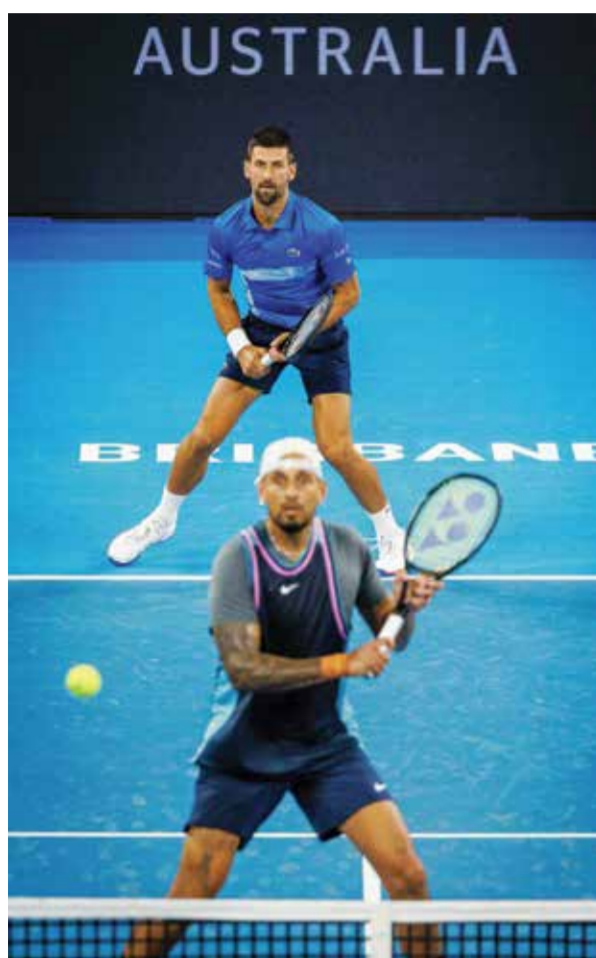
O ديوكوفيتش وكيريوس