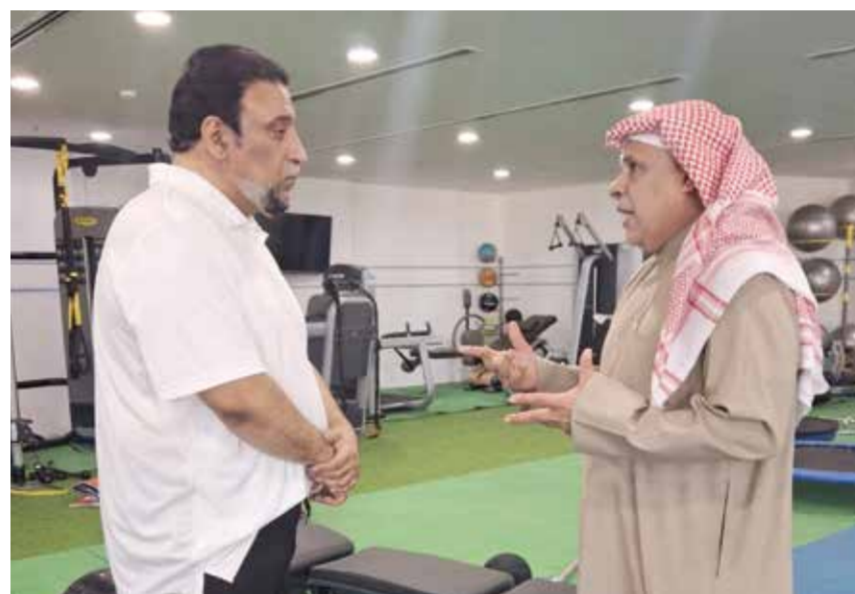
○ خلال حديثه إلى الملحق الرياضي في «أخبار الخليج».