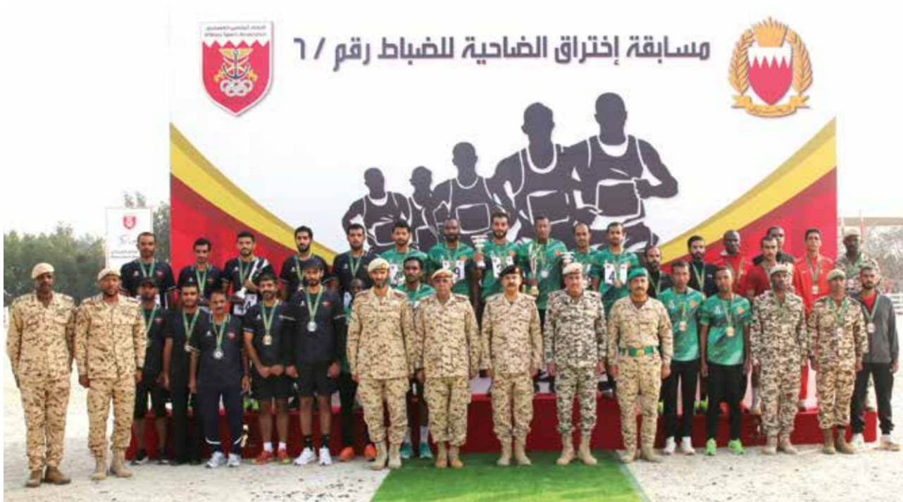
○ صورة جماعية.

اختتمت مسابقة الضاحية العسكرية لضباط مسافة ٥ كيلومترات في نسختها السادسة لأسلحة ووحدات قوة دفاع البحرين بحضور اللواء الركن غانم إبراهيم الفضالة مساعد رئيس هيئة الأركان للعمليات في الاتحاد الرياضي العسكري بقوة دفاع البحرين وذلك صباح أمس، وفي نهاية المسابقة قام مساعد رئيس هيئة الأركان للعمليات بتسليم الكؤوس والميداليات على الفائزين.