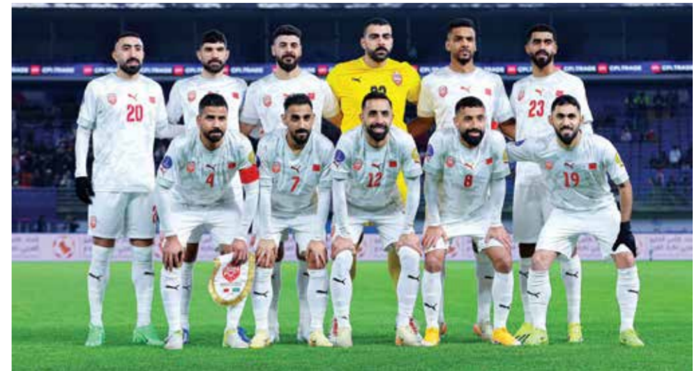
منتخبنا الوطني الأول لكرة القدم.