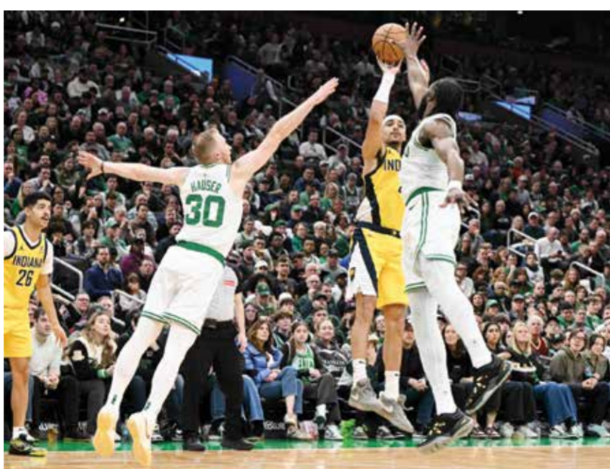
O من لقاء بايسرز وسلتيكس.