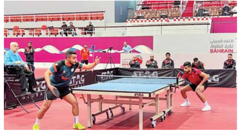
○ من منافسات الدوري.