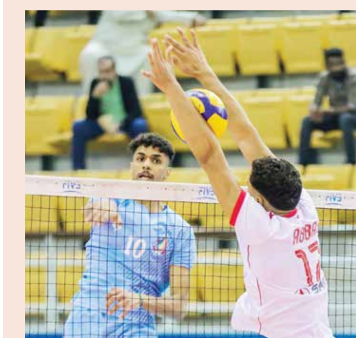
○ من لقاء المحرق والشباب.

□ مرارا وتكرارا، رسالة بالعربي الفصح، نوجهها إلى حكم الكرة الطائرة ونقول له فيها: أنت لست بسيف مسلط على رقاب اللاعبين، فمهمتك التحكيمية لا تقتصر على حفظك بنود القانون وتمكنك منه للخروج بالمباراة إلى بر الأمان، ما لم يكن لديك صدر واسع، وابتسامه عريضة، والجدال بالتي هي أحسن بدلا من العيوس وإشارات التهديد والوعيد لامتنصاص الشحن والضغط والأحمال المختلفة التي تفرضها طبيعة المنافسات الرياضية على اللاعبين، ولا يعني ذلك تنازلك عن سوء سلوك البعض الذي يخولك القانون من أوسع أبوابه لمجازاتهم.