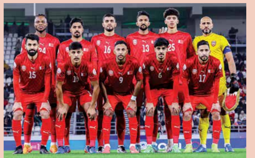
○ منتخبنا الوطني الأول لكرة القدم.