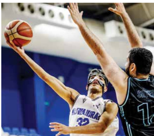
○ لقطة من لقاء النويدرات وسماهيج.