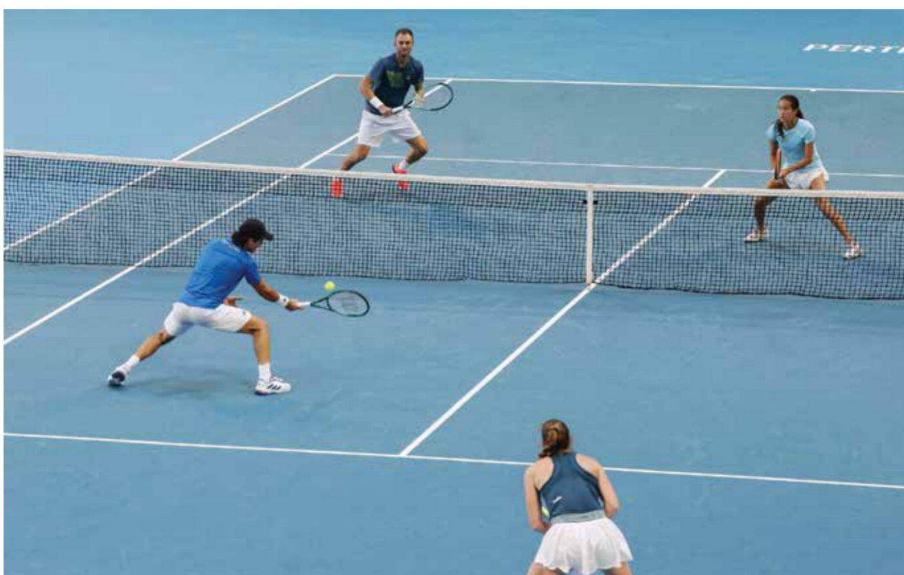
O من لقاء اليونان وكازاخستان.