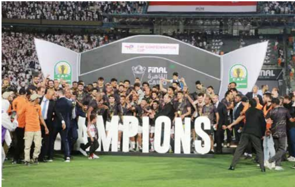
○ الزمالك بطل الكونفدرالية