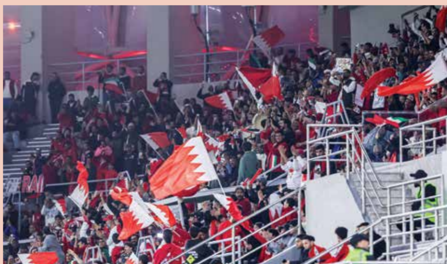
○ الجماهير البحرينية تساند المنتخب.