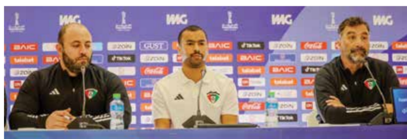
من المؤتمر الصحفي لمنتخب الكويت

يخوض منتخبنا الوطني الأول لكرة القدم مواجهة مرتقبة أمام صاحب الأرض والجمهور المنتخب الكويتي اليوم الثلاثاء، عند الساعة ٨:٤٥ مساءً على استاد جابر الأحمد الدولي، ضمن الدور نصف النهائي من بطولة كأس الخليج العربي في نسختها السادسة والعشرين والمقامة في الكويت، في الفترة من ٢١ ديسمبر ٢٠٢٤ حتى ٤ يناير ٢٠٢٥. وتتأهل هذه المواجهة بعد تأهل منتخبنا وهو متصدراً للمجموعة الثانية برصيد ٦ نقاط بعد فوزين أمام السعودية (٢-٣) والعراق (٠-٢)، وخسارة