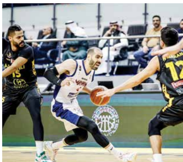
○ لقطة من لقاء المنامة والأهلي.