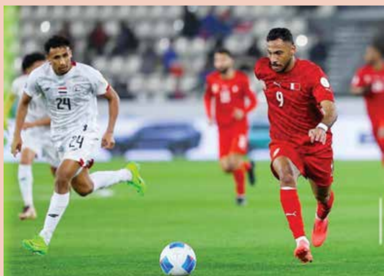
○ من لقاء منتخبنا مع المنتخب اليمني.