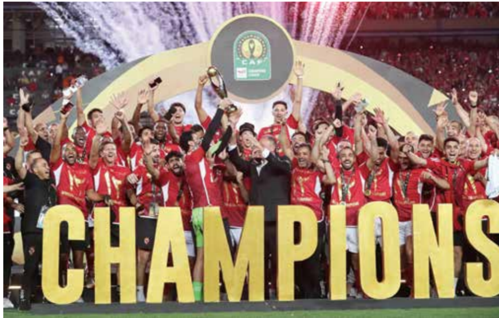
○ الأهلي بطل إفريقيا