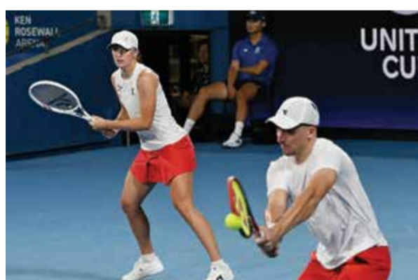
O شفيونتيك تعود بقوة.

وقال كيريوس: «فوجئت حقا بعدم ثقته في نفسه ببعض اللحظات. قلت له يا أخي أنت الأعظم على الإطلاق، انطلق وافلعلعل ما عليك فعله.»