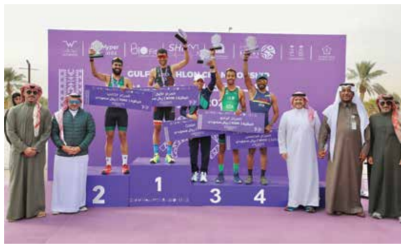
○ تتويج قرش بالذهبية.