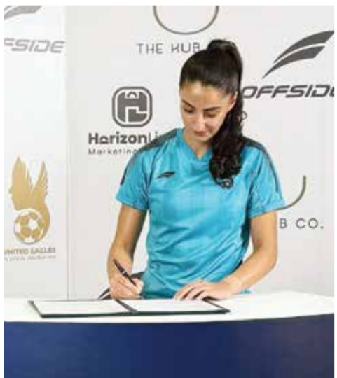
○ من توقيع عقد الاحتراف في الدوري السعودي للسيدات.