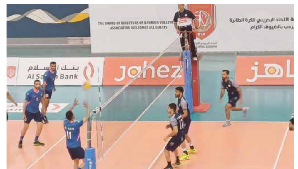
من لقاء التضامن والدير.