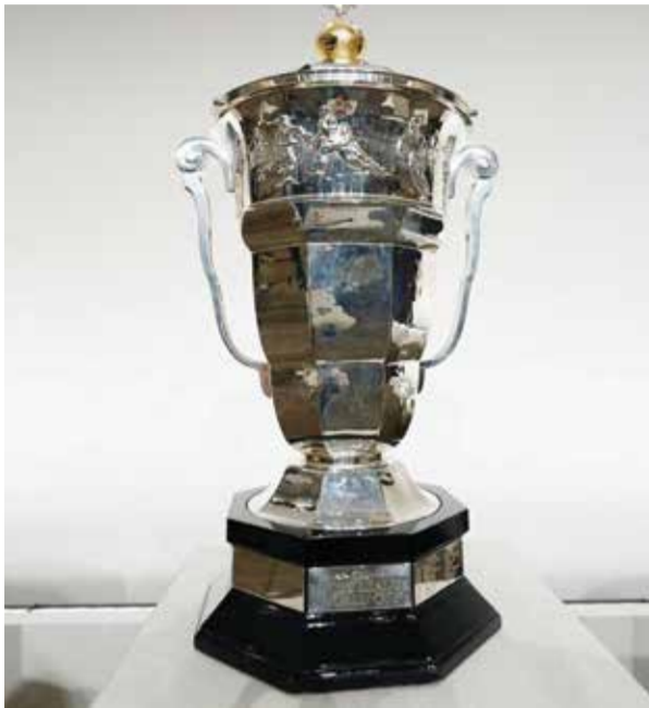
كأس السوبر الفرنسي