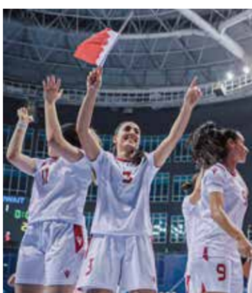
○ من تكريمها بجائزة أفضل لاعبة في إحدى مباريات الدوري السعودي.