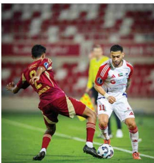
من لقاء الشارقة والوحدة

وعاد كايو ليسجل الهدف الثاني له والرابع للشارقة في الدقيقة ٧٧، فيما سجل الوحدة هدفه الثاني عن طريق براهيماء دياز في الدقيقة ٨٦.