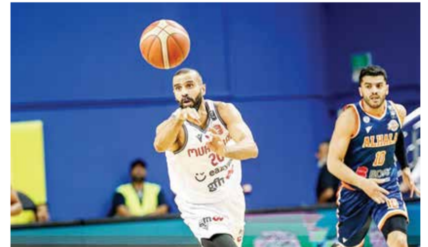
جانب من اللقاء.

حقق فريق المحرق فوزاً عريضاً على منافسه الحالة بنتيجة (١٥/٨٥) في المباراة التي جمعتهم أمس الأحد على صالة اتحاد السلة بام الحصم، وذلك ضمن منافسات الجولة الرابعة من الدور التمهيدي لدوري زين لكرة السلة للدرجة الأولى للموسم الرياضي ٢٠٢٤-٢٠٢٥. وجاءت نتائج الفترات كالتالي: الفترة الأولى (٢٩-١٨)، لصالح المحرق والفترة الثانية (٢٣-١٦) للمحرق، والفترة الثالثة (٢١-٣٠) للحالة، والفترة الرابعة (٣٢-٢١) للمحرق. وكان أفضل المسجلين في صفوف المحرق ميتشل