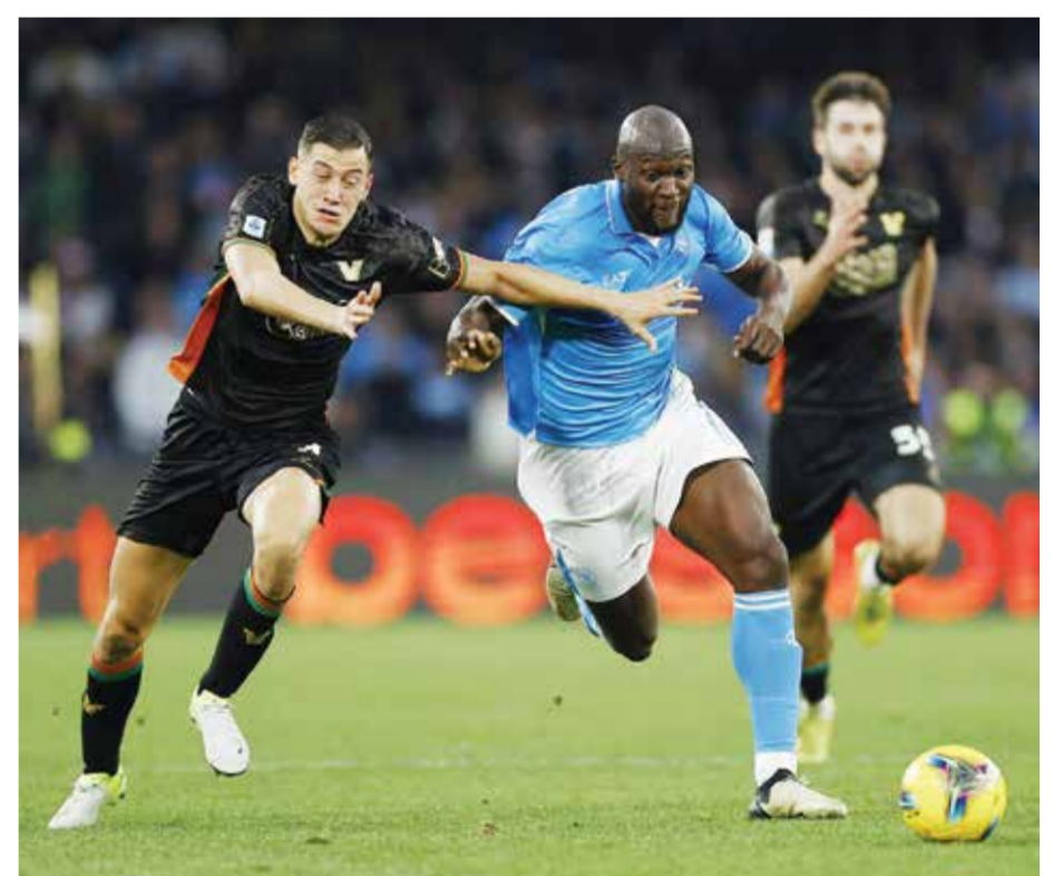
○ من لقاء نابولي وفينيتسيا.

وفي المقابل، مني لستر بهزيمة رابعة تواليا وخامسة متتالية على يد سيتي، ليتجمد رصيده فريق المدرب الهولندي رود فان نيستروي عند ١٤ نقطة في المركز الثامن عشر مؤقتا.