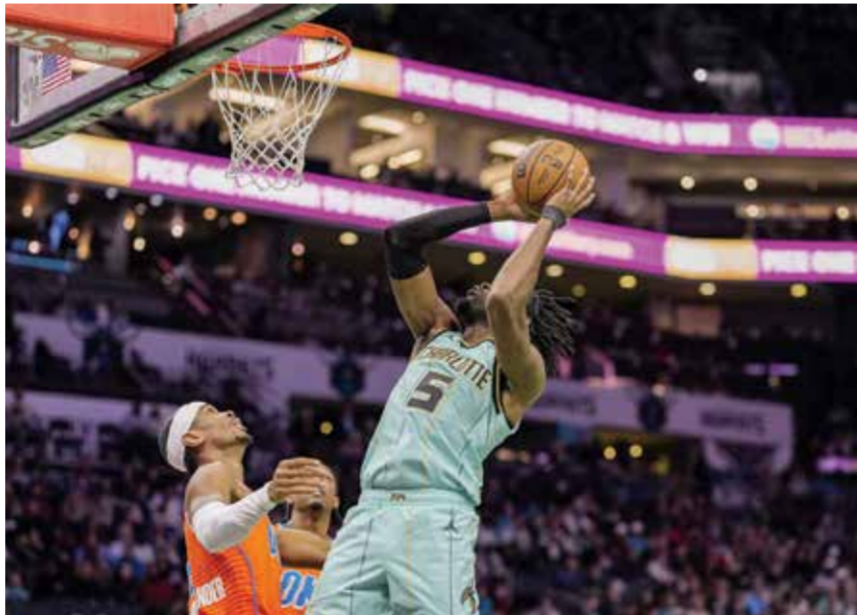
○ من لقاء ثاندر وهورنتس.

وفي سان فرانسيسكو، سجل الكونغولي جوناثان كومينغا ٣٤ نقطة، معادلا أعلى رقم له في مسيرته، وأحرز ثلاث رميات حرة في آخر ٢٩ ثانية لمساعدة غولدن ستايت ووريورز للتغلب على ضيفه فينيكس صنز بنتيجة ١٠٩-١٠٥.