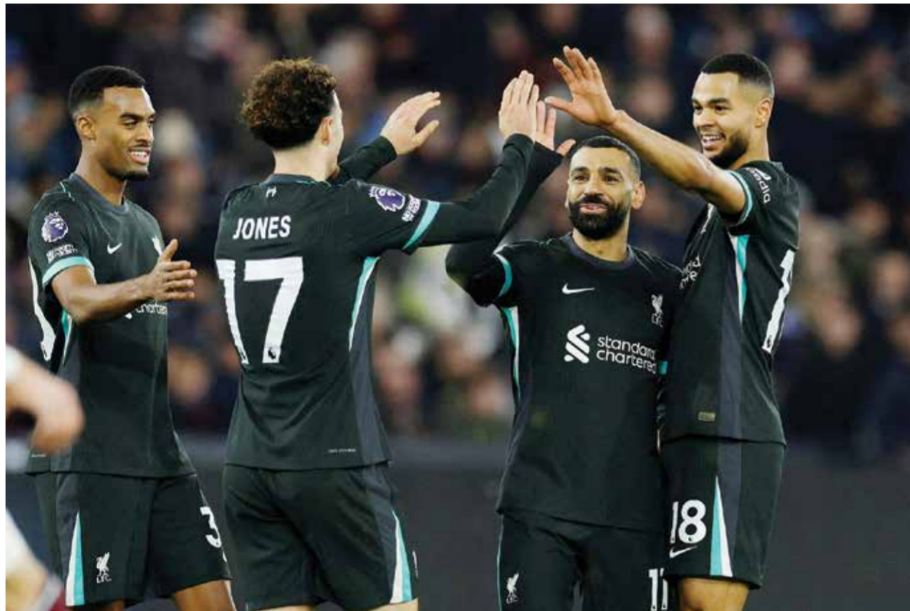
○ فرحة لاعبي ليفربول بتسجيل الهدف الثالث.

البدل النروجي يورغن ستراند لارسن (٨٧). ومُنِي الفريق اللندني الآخر فوتهام بالمصير ذاته، إذ كان متقدما على ضيفه بورنموث بهدفين للمكسيكي راوول خيمينيس (٤٠) والويلزي هاري ويلسون (٧٣) مقابل هدف للبرازيلي إيفانيلسون (٥١). قبل أن يتلقى هدف التعادل ٢-٢ في الدقيقة ٨٩ عبر البدل البوركنيني دانغو أوتارا، مكتفيا بنقطة رفع بها رصيده إلى ٢٩ بفارق نقطة خلف ضيفه السادس.