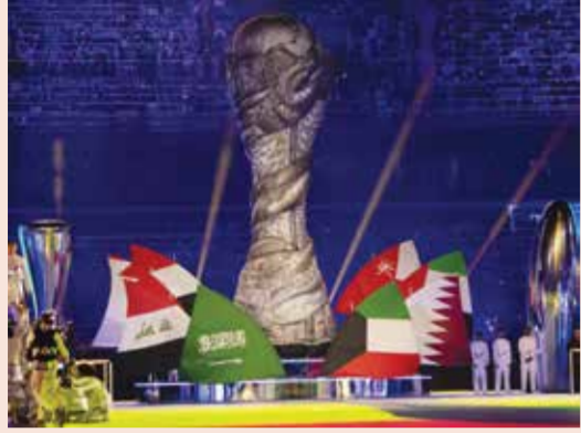
من حفل الافتتاح