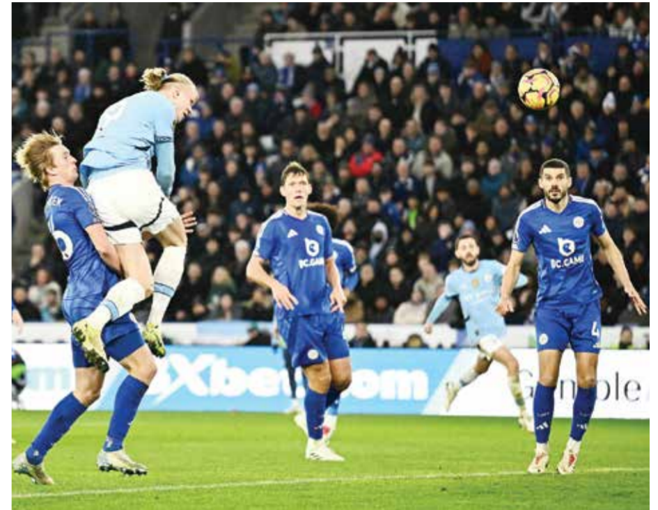
○ هالاند ينهي صيامه التهديفي.

وصار (الملك المصري)، كما تطلق عليه جماهير لليفربول، أول لاعب يسجل ويصنع في ٨ مباريات مختلفة لنفس الموسم في تاريخ الدوري الإنجليزي الممتاز. وأضاف ترينت ألكسندر آرنولد الهدف الرابع لليفربول في الدقيقة ٥٤، فيما تكفل (البدل) البرتغالي ديوجو جوتا بإحراز الهدف الخامس للضيف في الدقيقة ٨٤، من صناعة صلاح، الذي عزز صدارته أيضا لقائمة أكثر اللاعبين تقدما للتمريرات الحاسمة في البطولة هذا الموسم بـ١٣ تمريرة حاسمة، متفوقا بفارق ٣ تمريرات على أقرب ملاحقيه بوكايو ساكا، نجم