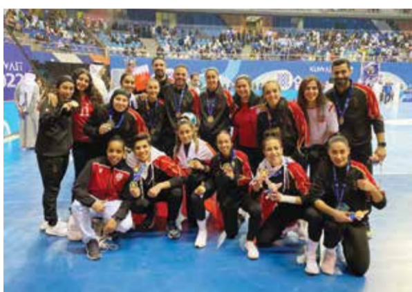
○ تحقيق المركز الأول في البطولة الخليجية للمرة الثانية ٢٠٢٢.