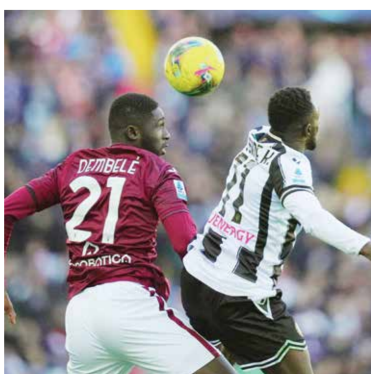
○ من لقاء أودينيزي وتورينو.

وبقي أودينيزي في المركز التاسع بـ٢٤ نقطة، فيما تقدم تورينو إلى المركز