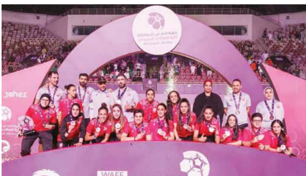
○ تحقيق المركز الثالث في بطولة غرب آسيا عام ٢٠٢٢.

من أهم الأمور التي يحتاج إليها المنتخب هي إقامة دوري ثابت ومستمر، وزيادة عدد المباريات والمعسكرات المحلية والدولية لاكتساب المزيد من الخبرة والاحتكاك. - ما هي استعدادات منتخب السيدات لتصفيات آسيا؟ استعداداتنا تضمنت فترة تحضيرية مكثفة استمرت مدة ٤ أشهر، شملت تمارين يومية في فترتين صباحية ومسائية، بالإضافة إلى أربع مباريات ودية، اثنتين منها مع الكويت واثنتين مع المنتخب الإندونيسي. وسنأسفر إلى تايلاند قبل أسبوع من التصفيات للاستعداد الأمثل لخوض التصفيات.