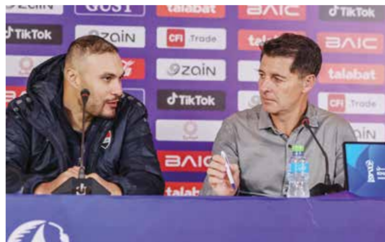
○ كاساس في المؤتمر الصحفي.

مشاور التصنيفات المؤهلة لكأس العالم.. وودع منتخب العراق الوطني خليجي ٢٦ بعد خسارته أمام نظيره السعودي بثلاثة أهداف لهدف.