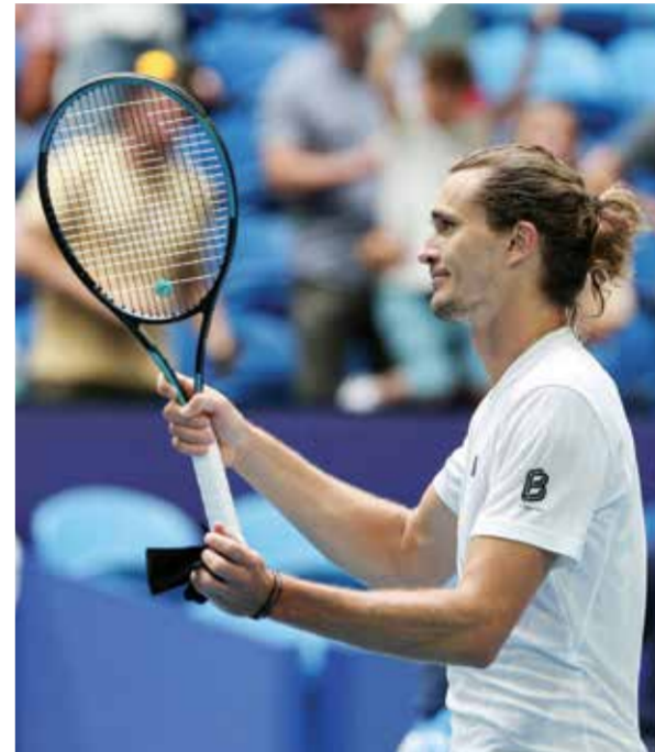
○ زفيريف (١٦ ف ب)

وبغياب النجم لبيرون جيمس بداعي المرض أيضا، فاز فريقه لوس أنجلوس ليكرز على ضيفه ساكرامنتو كينغز ١٣٢-١٢٢، وذلك بفضل أنتوني ديفيس الذي سجل ٣٦ نقطة مع ١٥ متابع و٥ تمريرات حاسمة.