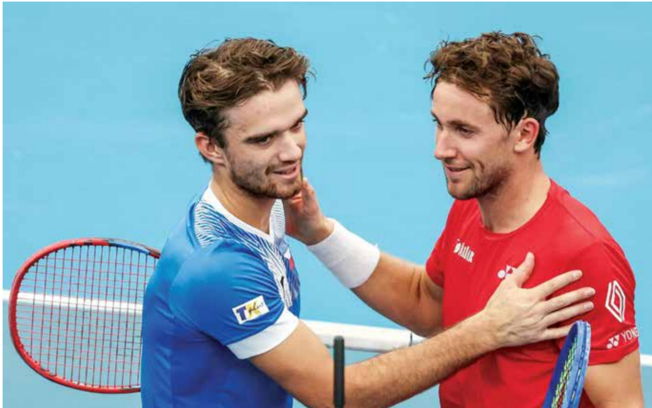
○ رود وماتشاك (١٦ ف ب)

وعندما سُئلت عما إذا كانت لا تزال تمتلك الحافز للعودة إلى القمة، أجابت «نعم، بالتأكيد»، محذرة من أنها ليست من النوع الذي يستمر في اللعب إلى ما لا نهاية إذا لم تحقق النتائج.