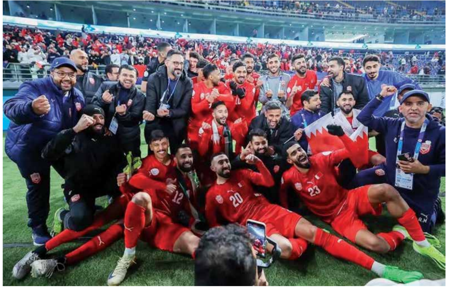
○ فرحة بحرينية بالانتصار.