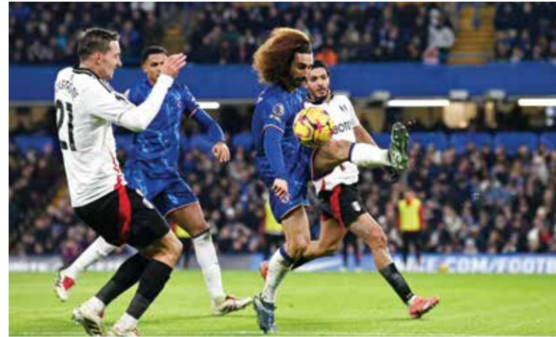
○ لحظة من مباراة فولهام و تشلسي.