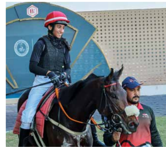
○ الفارسة المتمرنة ضي السعودون.