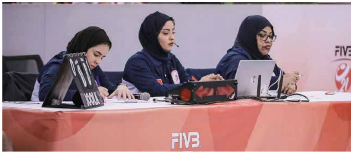
○ أثناء وجودها على طاولة التسجيل في إحدى البطولات التي استقبلتها المملكة.