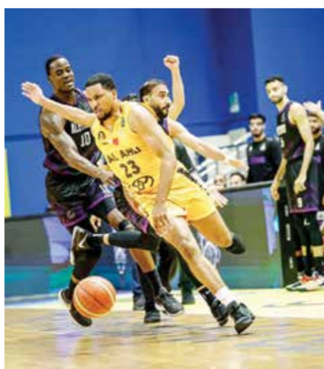
○ لقطة من لقاء الأهلي والاتحاد.