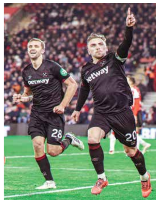
○ فرحة لاعبي ويستهام بالهدف الوحيد.

ورفع بورنموث، الذي تعادل للمباراة الثانية في لقاءاته الثلاثة الأخيرة بالمسابقة، رصيده إلى ٢٩ نقطة في المركز الخامس بترتيب المسابقة. في المقابل، أصبح في جعبة كريستال بالاس ١٧ نقطة، ليظل في المركز السابع عشر، متفوقا بفارق ٥ نقاط على مراكز الهبوط.