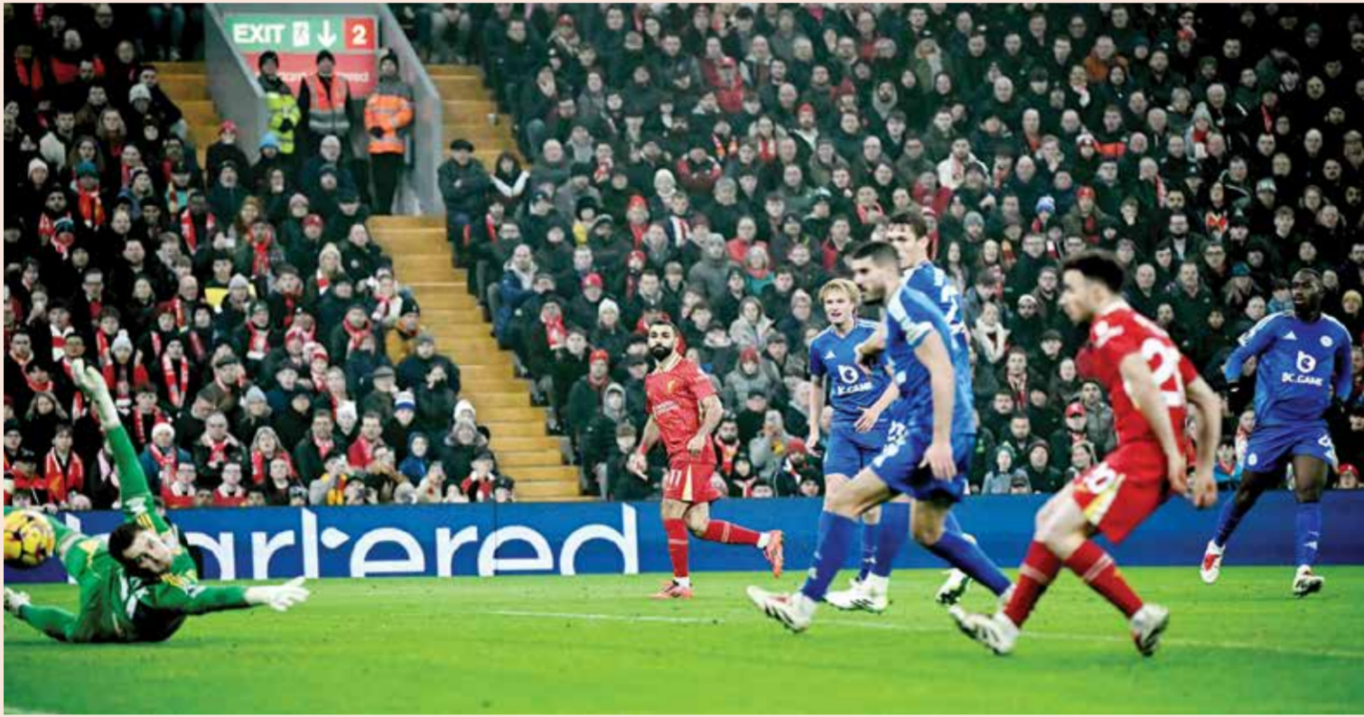
○ محمد صلاح يحرز الهدف الثالث.

ورفع صلاح رصيده إلى ١٦ هدفا معززا صدارته لترتيب الهادفين بفارق ٣ أهداف عن مهاجم مانشستر سيتي النرويجي اربلينغ هالاند الذي أهدر ركلة جزءا في تعادل فريقه أمام إيفرتون ١-١.