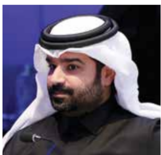
○ سمو الشيخ خليفة بن علي بن عيسى آل خليفة.

شارك نائب رئيس الاتحاد البحريني لكرة القدم سمو الشيخ خليفة بن علي بن عيسى آل خليفة، في اجتماع (المؤتمر العام) الجمعية العمومية العادية لاتحاد كأس الخليج العربي لكرة القدم، الذي عُقد ظهر الخميس ٢٦ ديسمبر، بفندق