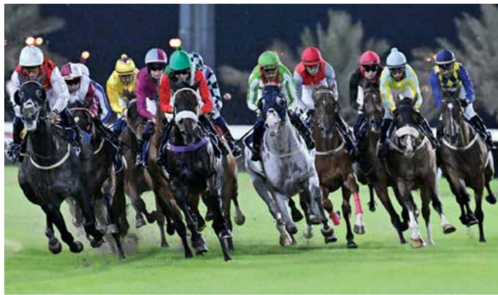
○ منافسات قوية يشهدها السباق العاشر.

وبلغاً للقانون الأساسي واللوائح المنظمة للنادي أنه في حالة عدم اكتمال النصاب القانوني في الاجتماع الأول، سيتم عقد الاجتماع الثاني في الساعة السادسة من مساء يوم الأحد الموافق ١٢ يناير ٢٠٢٥، وفي حالة عدم اكتمال النصاب سيتم تأجيل الاجتماع إلى الساعة السابعة من مساء نفس اليوم، ويكون الاجتماع الثالث صحيحاً إذا حضره ١٠٪ من الأعضاء الذين يحق لهم الحضور.