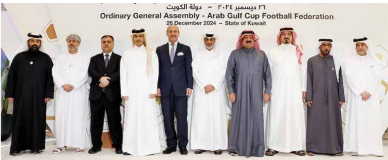
○ من اجتماع اتحاد كأس الخليج العربي.

وحضر حفل التوقيع سمو الشيخ عيسى بن علي آل خليفة نائب رئيس اللجنة الأولمبية والدكتور حسين علي المسلم مدير عام المجلس الأولمبي الآسيوي. ويهذه المناسبة أعرب سمو الشيخ خالد بن حمد آل خليفة عن سعادته الكبيرة باستضافة