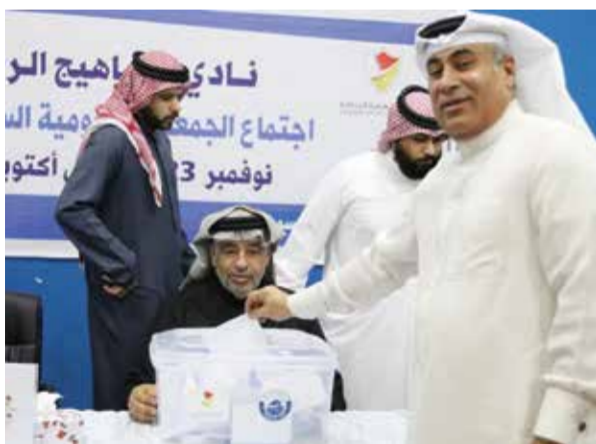
○ من انتخابات نادي سماهيج.