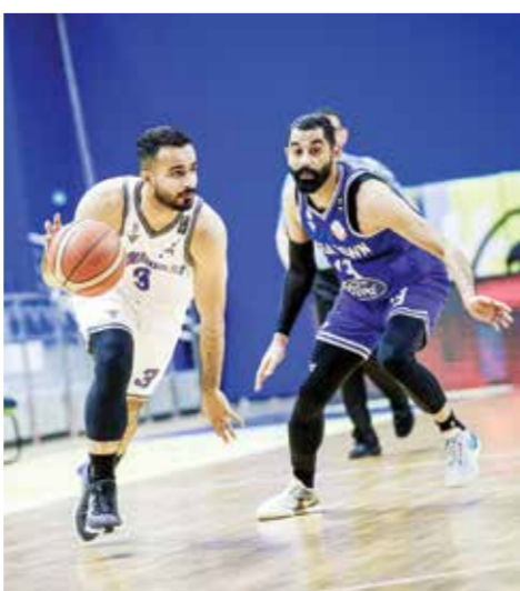
○ لقطة من لقاء النويدرات ومدينة عيسى.

الرياض/الكويت - (د ب أ): أعلن اتحاد كأس الخليج العربي لكرة القدم أمس الخميس منح السعودية حق استضافة للنسخة القادمة من كأس الخليج العربي «خليجي ٢٧» في عام ٢٠٢٦. وعقد اتحاد كأس الخليج العربي أمس الجمعية العمومية العادية على هامش بطولة كأس الخليج «خليجي ٢٦»، التي تستضيفها الكويت حالياً وتستمر حتى ٣ يناير المقبل. واعتمدت الجمعية العمومية لاتحاد كأس الخليج العربي استضافة السعودية للنسخة القادمة من بطولة كأس الخليج (خليجي ٢٧)، التي ستقام في سبتمبر ٢٠٢٦. وجاء اعتماد الجمعية العمومية