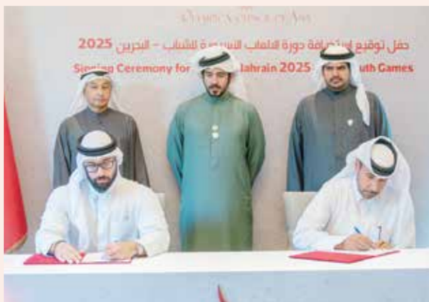
○ خالد بن حمد يشهد توقيع الاتفاقية.

وأضاف أن البحرين قد أثبتت مراراً وتكراراً قدرتها على تنظيم الأحداث الرياضية الدولية الكبرى، ونحن واثقون أن استضافة دورة الألعاب الآسيوية للشباب ستكون تجربة استثنائية، تتيح للرياضيين الشباب من مختلف أنحاء آسيا فرصة التنافس في بيئة رياضية متميزة.