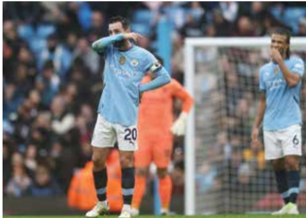
○ سيتي يضع الفوز مجددا. (أ ف ب)

مانشستر - (أ ف ب): واصل مانشستر سيتي حامل اللقب سقوطه المدوي واكتفى بالتعادل مع ضيفه إيفرتون ١-١ أمس الخميس في افتتاح المرحلة الثامنة عشرة من الدوري الإنجليزي لكرة القدم، مستمرا في كابوسه الذي أبعده ١١ نقطة مؤقتا عن ليفربول المتصدر.