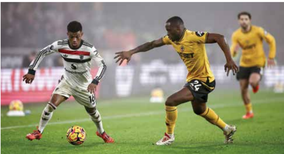
○ لحظة من المباراة.