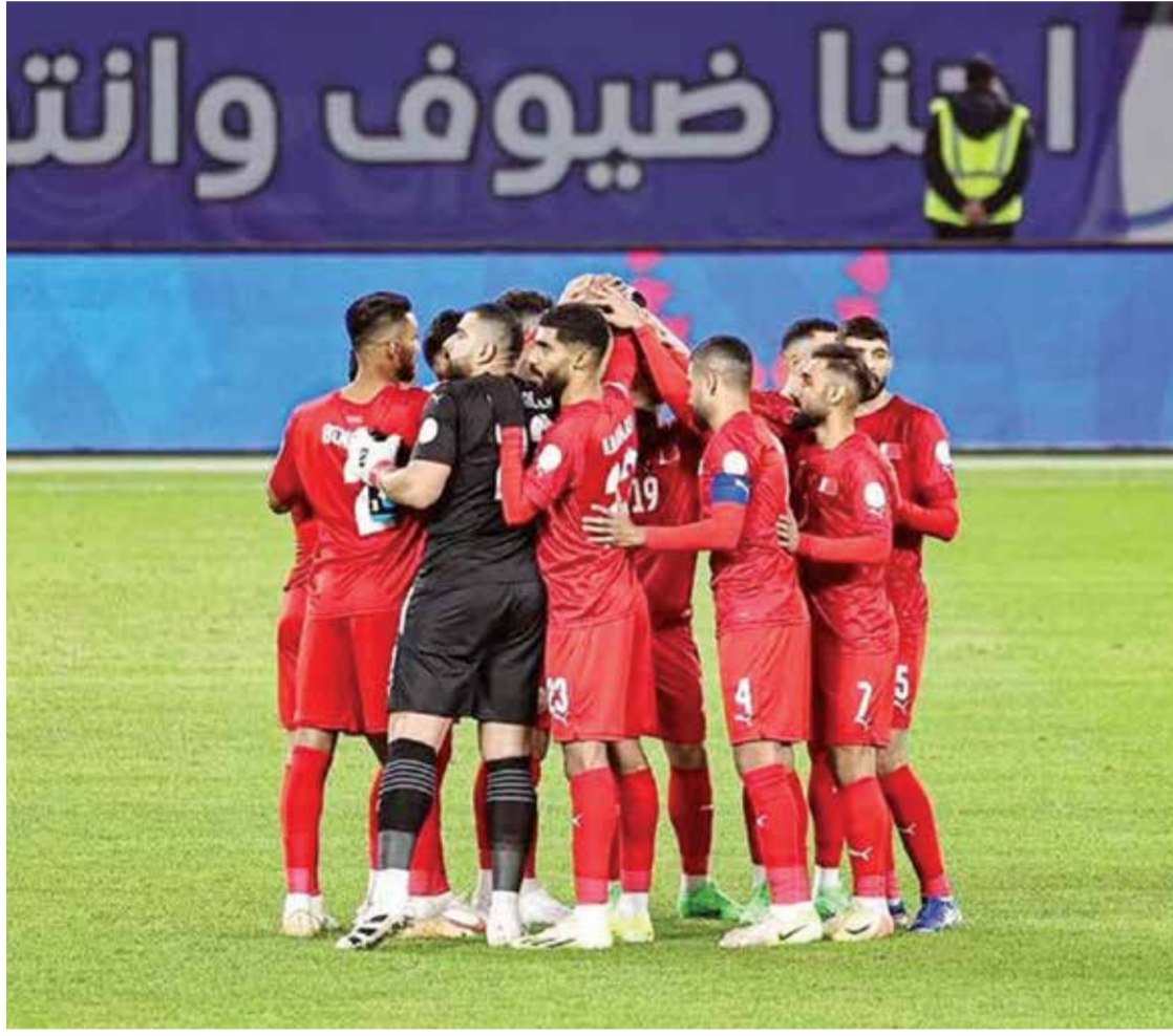
○ منتخبنا الوطني.