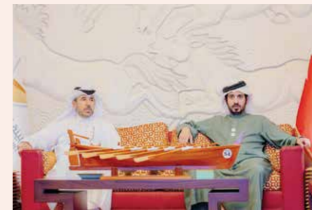
○ سموه بجانب نائب رئيس المجلس الأولمبي الآسيوي.

ومن جهته توجه الدكتور ثاني بن عبدالرحمن الكواري نائب رئيس المجلس الأولمبي الآسيوي عن منطقة غرب آسيا بالشكر الجزيل إلى مملكة البحرين على دعمهم المستمر للرياضة في المملكة والقارة الآسيوية بشكل عام. وأضاف «إننا نتطلع إلى تعاون مثمر في المستقبل