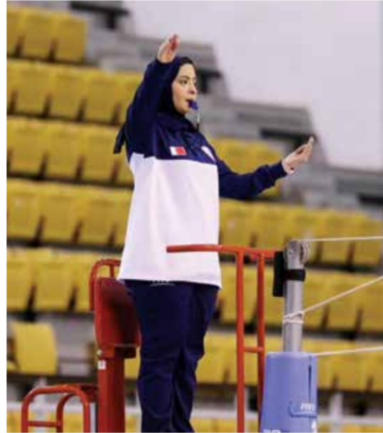
○ تدبير إحدى مباريات مسابقة الفئات العمرية.