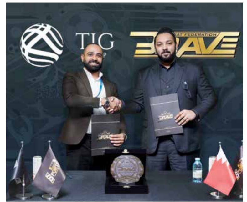
○ من توقيع الاتفاقية.