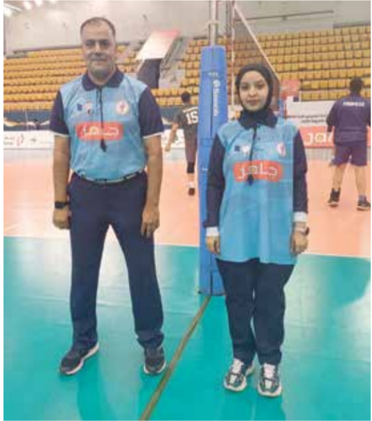
○ مراقبة خط في إحدى مباريات الرجال.