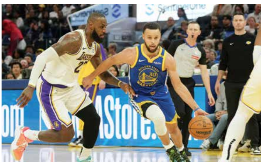
○ جيمس يتفوق على كوري

وقال المصنف الثاني على العالم: «إنها الرياضة الوحيدة في العالم (بدون عطلات). حتى الدوري الألماني (بوندرسليجا) لديه عطلات في عيد الميلاد للعام الجديد». وقال زفيريف: «لم أفر بأي لقب في البطولات الأربع الكبرى... لا يخفى على أحد أن هذا سيكون الهدف الرئيسي خلال السنوات الست أو السبع المقبلة».