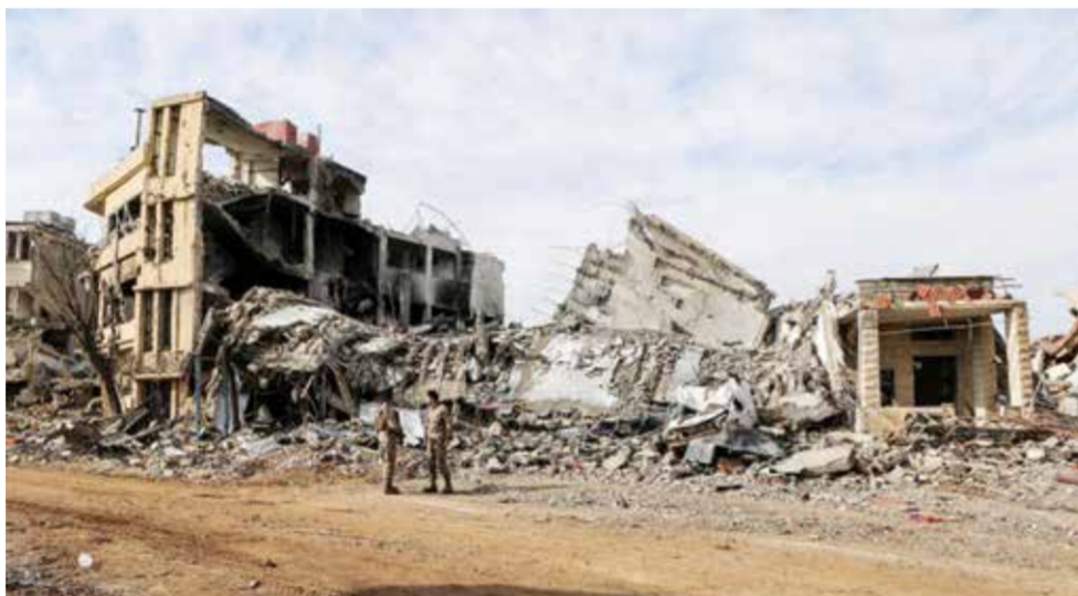
○ دمار هائل جراء العدوان الإسرائيلي على لبنان.

سيادة لبنان ومواطنيه وتدمير القرى والبلدات الجنوبية»، على وقع توغل قواته الخميس في عدة نقاط، في جنوب البلاد بينها وادي الحجير والقطرنة. وقال إنه «عزز انتشاره في هذه المناطق، تزامناً مع متابعته الوضع مع قوة واللجنة الخماسية للإشراف على اتفاق وقف إطلاق النار.