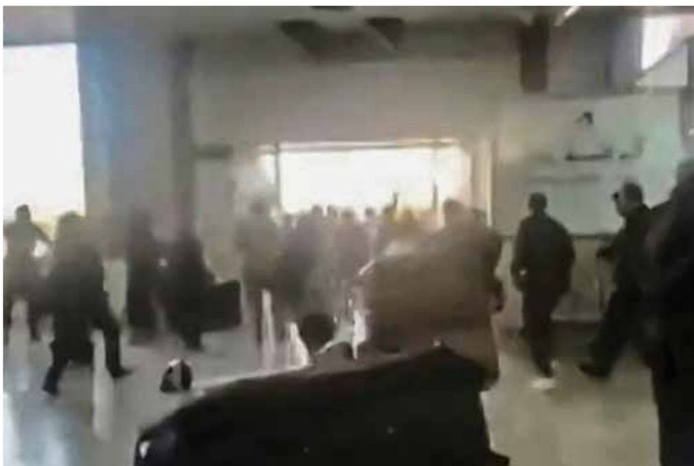
○ لحظات مرعبة بين مسافرين في مطار صنعاء خلال الغارات الإسرائيلية.

رويترز - في الذكرى السنوية العشرين لأمواج مد عاتية (تسونامي) في المحيط الهندي أودت بحياة نحو ٢٣٠ ألف شخص، توافد ناجون وأسر ضحايا على مقابر جماعية وأضاعوا الشموع وتبادلوا التعازي في أنحاء منطقتي جنوب شرق آسيا وجنوب آسيا أمس الخميس. حدثت أمواج تسونامي في ٢٦ ديسمبر ٢٠٠٤ عقب زلزال بقوة ٩,١ درجات كان مركزه قبالة ساحل إقليم أتشيه بإندونيسيا، لتجتاح أمواج بلغ ارتفاعها ١٧,٤ متراً سواحل إندونيسيا وتايلاند وسريلانكا والهند وتوسع دول أخرى. وسجلت إندونيسيا في ذلك الوقت أكثر من نصف إجمالي عدد القتلى.