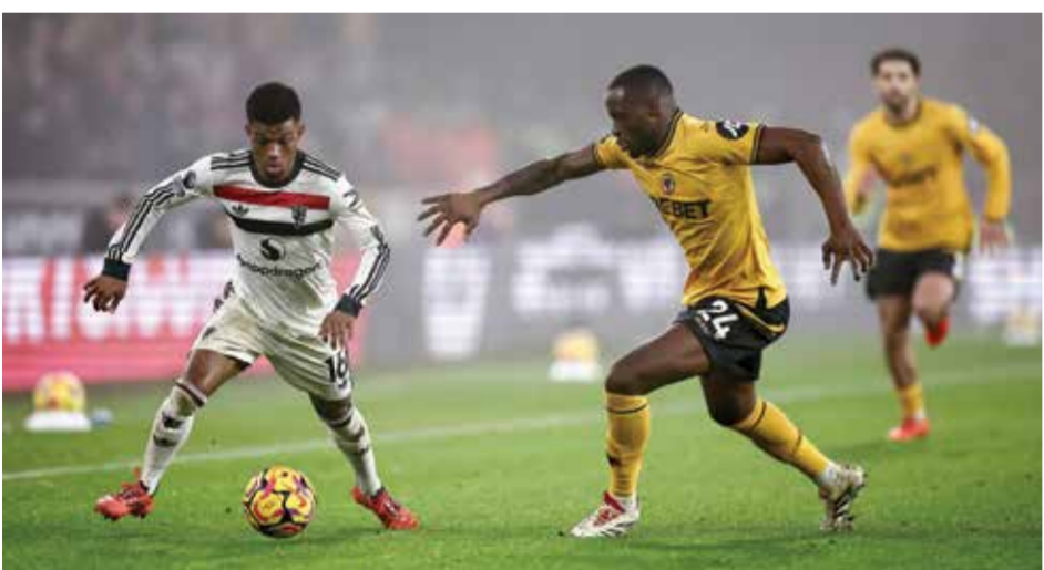
○ لحظة من المباراة.

على الجانب الآخر، يحتل أستون فيلا المركز التاسع برصيد ٢٨ نقطة، بفارق نقطة خلف نيوكاسل الخامس وبورنموث السادس، ويفارق الأهداف خلف مانشستر سيتي، حامل اللقب، صاحب المركز السابع وفولهام صاحب المركز الثامن. وتقدم نيوكاسل عن طريق أنتوني جوردون في الدقيقة