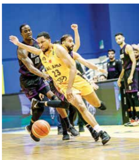
○ لقطة من لقاء الأهلي والاتحاد.