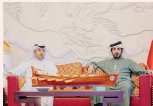
○ سموه بجانب نائب رئيس المجلس الأولمبي الآسيوي.

وأضاف: إننا نتطلع إلى تعاون مثمر في المستقبل