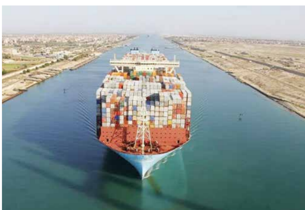
لتعزيز دور هذا القطاع الحيوي في خدمة الاقتصاد القومي.

الشحن وتسريع حركة مرور السفن في الاتجاهين. واطلع الرئيس المصري خلال الاجتماع على الإجراء التي اتخذتها هيئة قناة السويس لمواجهة آثار التحديات في البحر الأحمر وباب المندب، وكذلك الجهود المبذولة نحو تحديث أسطول الصيد وفقاً للمواصفات والمعايير الدولية بالاعتماد على أحدث الأنظمة التكنولوجية المتطورة، حيث وجه الرئيس المصري في هذا الصدد باستمرار العمل على إنهاء مشروعات تطوير القناة بهدف تقديم أفضل الخدمات