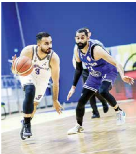
○ لقطة من لقاء النويدرات ومدينة عيسى.

الرياض/الكويت - (د ب أ): أعلن اتحاد كأس الخليج العربي لكرة القدم أمس الخميس منح السعودية حق استضافة النسخة القادمة من كأس الخليج العربي «خليجي ٢٧» في عام ٢٠٢٦. وعقد اتحاد كأس الخليج العربي أمس الجمعية العمومية العادية على هامش بطولة كأس الخليج «خليجي ٢٦»، التي تستضيفها الكويت حالياً وتستمر حتى ٣ يناير المقبل. واعتمدت الجمعية العمومية لاتحاد كأس الخليج العربي استضافة السعودية للنسخة القادمة من بطولة كأس الخليج (خليجي ٢٧)، التي ستقام في سبتمبر ٢٠٢٦. وجاء اعتماد الجمعية العمومية