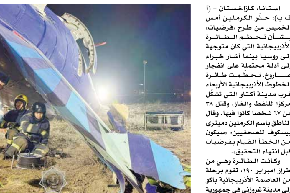
○ خبراء يفحصون حطام طائرة الركاب الأذربيجانية.

ويحسب موقع «فلايت رادار»، لتتبع حركة الملاحية الجوية، انحرفت الطائرة عن مسارها المحدد وحلقت فوق بحر قزوين، ثم قامت بالدوران في أجواء المنطقة حيث تحطمت في نهاية المطاف. وقالت الخطوط الجوية الأذربيجانية: إن الطائرة «نفذت هبوطاً اضطرارياً، على مسافة حوالي ثلاثة كيلومترات من أكتاو».