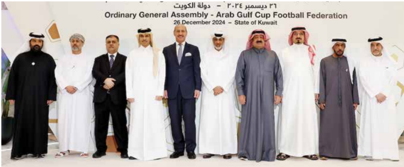
○ من اجتماع اتحاد كأس الخليج العربي.

ويهذه المناسبة أعرب سمو الشيخ خالد بن حمد آل خليفة عن سعادته الكبيرة باستضافة