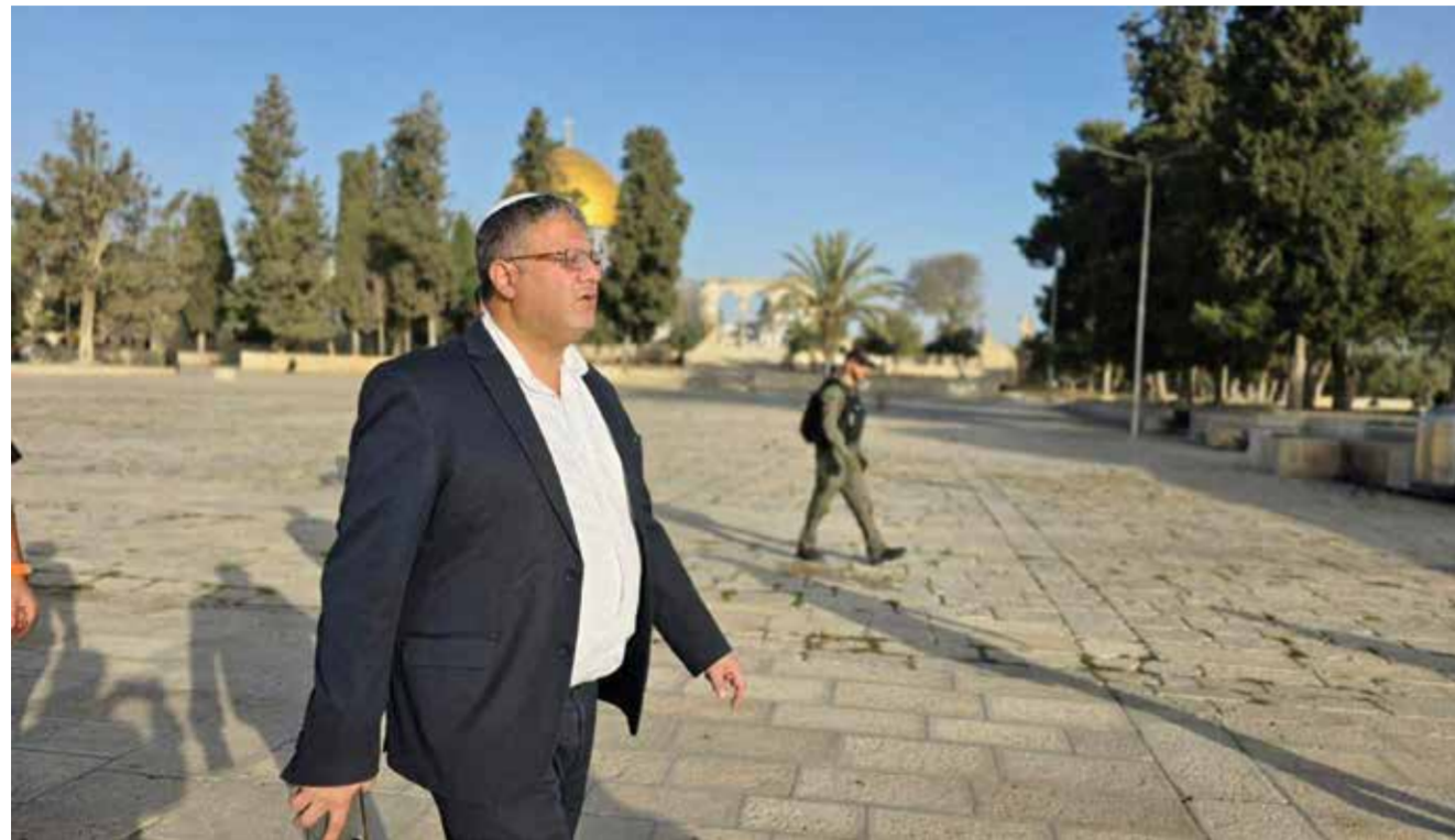
○ اليميني المتطرف خلال اقتحامه المسجد الأقصى تحت حراسة مشددة من شرطة الاحتلال.

المسجد الأقصى المبارك. وقال المتحدث باسم وزارة الخارجية في بيان أمس إن مصر تحذر من تلك التصرفات المتطرفة التي تشكل خرقاً فاضحاً ومستهجناً للوضع التاريخي والقانوني القائم في المسجد الأقصى المبارك، وما تمثله تلك الممارسات المرفوضة من استهانة وتآجيج لمشاعر المسلمين حول العالم، مطالبة إسرائيل بالتقيد بالتزاماتها كدولة قائمة بالاحتلال، مؤكدة ضرورة احترام وضعية المسجد الأقصى باعتباره مكان عبادة خالصاً للمسلمين.