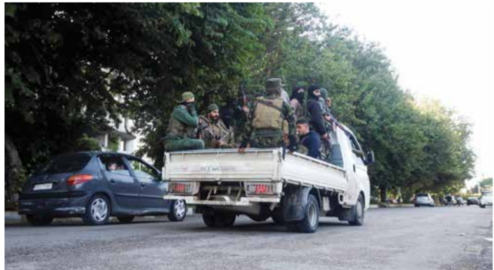
○ عناصر تابعة للسلطة السورية الجديدة في طرطوس.

هذا الشهر، مشيرة إلى أن الفعل «أقدمت عليه مجموعات مجهولة»، وحذرت في بيان من «إعادة نشر المقطع هدفها «إثارة الفتنة بين أبناء الشعب السوري في هذه المرحلة الحساسة». وأمس، أعلنت وزارة الإعلام السورية أنه «حرصاً على تعزيز الوحدة الوطنية وصون النسيج السوري بجميع مكوناته، يُمنع منعاً باتاً تداول أي محتوى إعلامي أو نشرة، أو محتوى خبري ذي طابع طائفي يهدف إلى بث الفرقة والتمييز بين مكونات الشعب السوري».