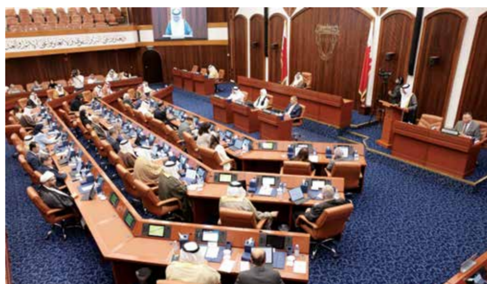
○ جلسة مجلس الشورى. (أرشيفية)

تتحصل عليها الدولة نتيجة لبيع النفط الخام في الأسواق العالمية، وبشكل احتياطيًا رصيناً تستطيع أن تستند عليه الدولة في الحالات الطارئة وهو ما تحقق عندما تمت الاستعانة بهذا الصندوق وذلك باستقطاع مبلغ ٤٥٠ مليون دولار لمواجهة الأزمة الاستثنائية (جائحة كورونا)، في سبيل دعم اقتصاد المملكة واستمرارية الاستقرار المالي وعدم التأخير في القطاعات الأساسية والحيوية. وأكدت أن زيادة أموال حساب احتياطي الأجيال القادمة يمنح السلطة القائمة على إدارته القدرة على توسيع مدارات الاستثمار والدخول في مشروعات استثمارية ذات جدوى عالية، وبالتالي زيادة العوائد الاستثمارية للحساب وتعظيم حجمه، مما يجعله قادراً على تلبية الاحتياجات المستقبلية للأجيال القادمة على المدى البعيد كلما اقتضت الحاجة إلى ذلك، تضادياً لأي اضطرابات مالية أو تقلبات اقتصادية سواء كانت متوقعة أو غير متوقعة. علمًا بأنه بلغ إجمالي مبالغ حساب احتياطي الأجيال بنهاية عام ٢٠٢٣ ما يقارب ٧٦٩ مليون دولار أمريكي. وتمنت اللجنة توافق مجلس النواب مع ما أوردته الحكومة من أسباب لتحتف عبارة «ومشتقاته»، من الفقرة الأولى من المادة، ليكون الاقتطاع على برميل النفط الخام المصدر دون مشتقاته، إذ إن إضافة هذه العبارة دون إيراد الوحدة المعيارية الدولية التي يتم بيع هذه المشتقات النفطية على أساسها وتحديد المشتقات المشمولة بالاقتطاع يؤدي إلى صعوبة في التطبيق، وخصوصاً أن أسعار هذه المشتقات مختلفة عن أسعار بيع النفط الخام.