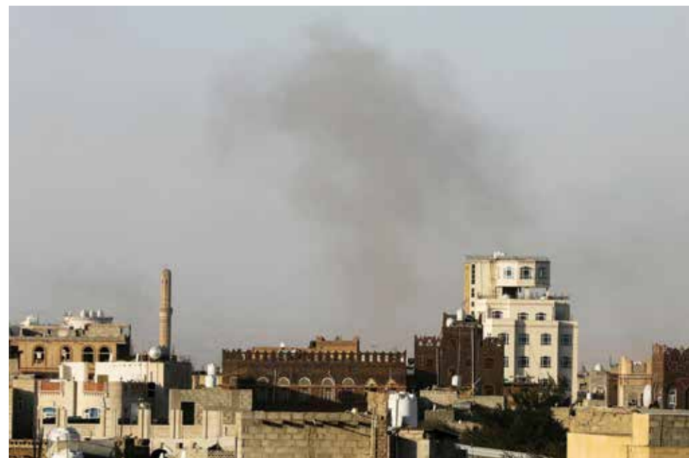
○ دخان يتصاعد من مطار صنعاء إثر الغارات الإسرائيلية.