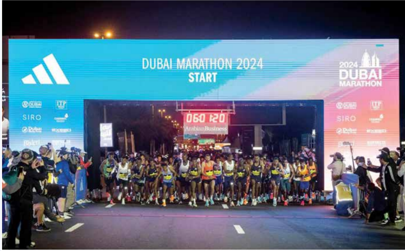
○ ماراثون دبي.

دبي - (وام): أعلنت اللجنة المنظمة لماراثون دبي ٢٠٢٥، إبرام شراكة مع «جينيس» للأرقام القياسية لتتيح للمشاركين فرصة للدخول إلى العالمية من خلال اختيار أرقام قياسية لتحطيمها. ويقام ماراثون دبي في نسخته الـ ٢٣ يوم الأحد الموافق ١٢ يناير ٢٠٢٥ بدعم من مجلس دبي الرياضي، حيث سيتيح الحدث منصة متميزة تجمع بين الرياضيين والهواة من جميع أنحاء العالم.