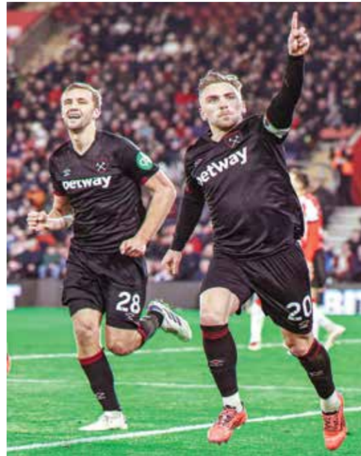
○ فرحة لاعبي ويستهام بالهدف الوحيد.

لندن - (د ب أ): ضاعف ويستهام يونايتد من جراح مضيفه ساوثهامبتون في بطولة الدوري الإنجليزي الممتاز لكرة القدم.