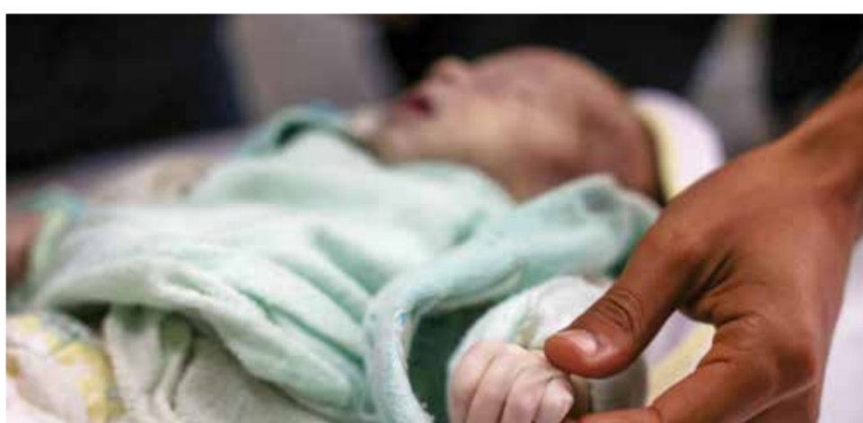
○ فلسطيني ممسكاً بيد الرضيع سيل الفصيح التي قضت نحبها بسبب البرد القارس.

ودخل اتفاق هدنة حيز التنفيذ في ٢٧ نوفمبر، بعد شهرين من بدء مواجهة مفتوحة بين إسرائيل وحزب الله اللبناني المدعوم من إيران. ويتبادل الجانبان الاتهامات بانتهاك الهدنة بشكل متكرر. وحضت يونيفيل الخميس مجدداً الجيش الإسرائيلي على الانسحاب في الوقت المحدد ونشر القوات المسلحة اللبنانية