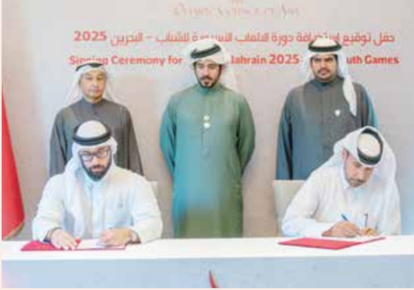
○ خالد بن حمد يشهد توقيع الاتفاقية.

وأضاف أن البحرين قد أثبتت مراراً وتكراراً قدرتها على تنظيم الأحداث الرياضية الدولية الكبرى، ونحن واثقون أن استضافة دورة الألعاب الآسيوية للشباب ستكون تجربة استثنائية، تتيح للرياضيين الشباب من مختلف أنحاء آسيا فرصة التنافس في بيئة رياضية متميزة.