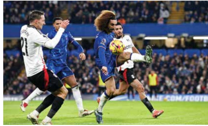
○ لحظة من مباراة فولهام و تشيلسي.

وبينما حاول لاعبو تشيلسي معاودة التقدم من جديد، أضاف رودريجو مونيز الهدف الثاني لفولهام في الدقيقة الخامسة من الوقت الضائع. ومن هجمة مرتدة، تلقى مونيز تمريرة عرضية من الجهة اليمنى من خلال ساشا لوكيتش، ليروض الكرة لنفسه داخل المنطقة، ويسدد دون مضايقة من أحد، واضعا الكرة على يسار روبرت سانشيز، حارس مرمى تشيلسي، الذي اكتفى بالنظر لها وهي تعانق شباكه، لينتهي اللقاء بفوز مثير لفولهام.