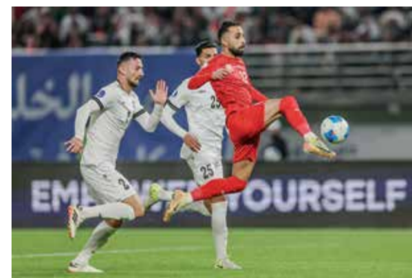
○ من لقاء منتخبنا الوطني أمام العراق.

الرياض/الكويت - (د ب أ): أعلن اتحاد كأس الخليج العربي لكرة القدم أمس الخميس منح السعودية حق استضافة للنسخة القادمة من كأس الخليج العربي «خليجي ٢٧» في عام ٢٠٢٦. وعقد اتحاد كأس الخليج العربي أمس الجمعية العمومية العادية على هامش بطولة كأس الخليج «خليجي ٢٦»، التي تستضيفها الكويت حالياً وتستمر حتى ٣ يناير المقبل. واعتمدت الجمعية العمومية لاتحاد كأس الخليج العربي استضافة السعودية للنسخة القادمة من بطولة كأس الخليج (خليجي ٢٧)، التي ستقام في سبتمبر ٢٠٢٦. وجاء اعتماد الجمعية العمومية