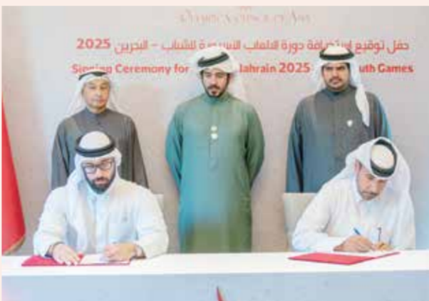
○ خالد بن حمد يشهد توقيع الاتفاقية.

وأضاف أن البحرين قد أثبتت مراراً وتكراراً قدرتها على تنظيم الأحداث الرياضية الدولية الكبرى، ونحن واثقون أن استضافة دورة الألعاب الآسيوية للشباب ستكون تجربة استثنائية، تتيح للرياضيين الشباب من مختلف أنحاء آسيا فرصة التنافس في بيئة رياضية متميزة.