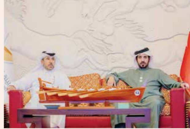
○ سموه بجانب نائب رئيس المجلس الأولمبي الآسيوي.

ومن جهته توجه الدكتور ثاني بن عبدالرحمن الكواري نائب رئيس المجلس الأولمبي الآسيوي عن منطقة غرب آسيا بالشكر الجزيل إلى مملكة البحرين على دعمهم المستمر للرياضة في المملكة والقارة الآسيوية بشكل عام. وأضاف «إننا نتطلع إلى تعاون مثمر في المستقبل