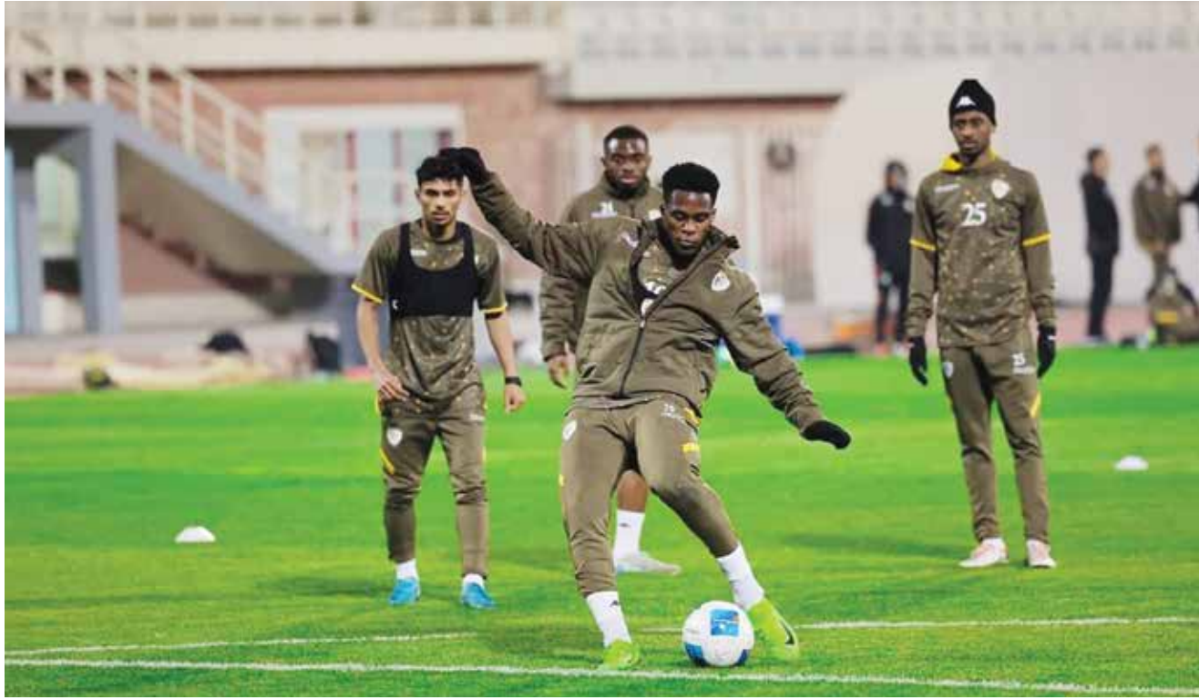
○ تحضيرات المنتخب العماني.