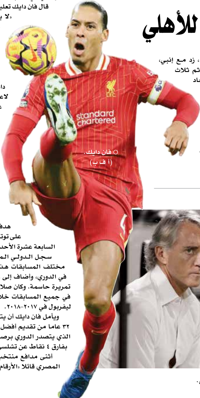
O فان دايك

وردا على التكهات حول إمكانية توليه تدريب نادي روما الذي يعاني من أزمة، أكد مانشيني أنه «ليس على اتصال بأحد»، مضيفا «سيحدث شيء ما، إنها مجرد مسألة وقت».