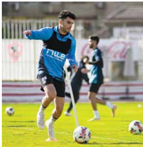
O تحضيرات الزمالك

أثنى مدافع منتخب هولندا على زميله المصري قائلا، الأرقام تتحدث عن نفسها.