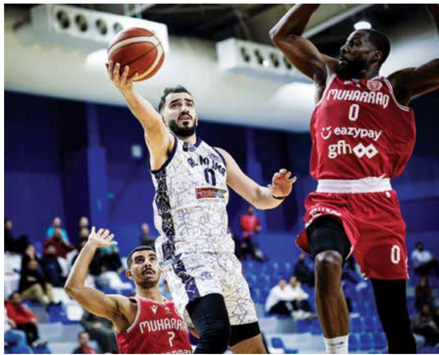
○ لقطة من مباراة المحرق والنجمة.