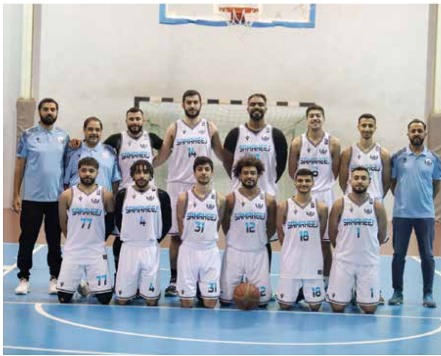
○ فريق سماهيج.