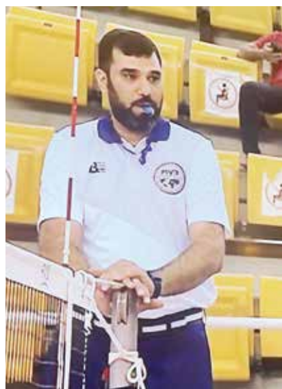
أثناء إدارته لإحدى منافسات الكرة الطاولة