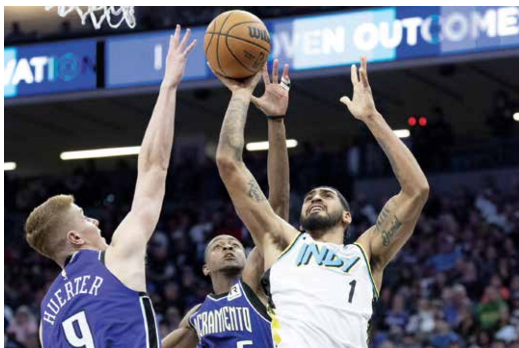
○ من لقاء بايسرز وكينغز

وأردف قائلا: «كنت مقتنعا تماما بأنني فعلت كل شيء وفقا للوائح ومعايير الوكالة العالمية لمكافحة المنشطات»، مشدداً على أنه «مدمر». وفاز بورسيل ببطولة ويمبلدون ٢٠٢٢ مع مواطنه ماتيو إيبين ثم بطولة أمريكا المفتوحة ٢٠٢٣ إلى جانب مواطنه الآخر جوردان تومسون. وأصدر الاتحاد الأسترالي للعبة على أن الإيقاف «لم يكن مرتبطاً باستخدام منتج منشطات بل بطريقة محظورة». هذا العام، فرضت الوكالة الدولية لنزاهة اللعبة عقوبات على الإيطالي يانك سينر، المصنف أول عالمياً، والبولندي إيفا شيفونيك الثانية بسبب تعاطي المنشطات.