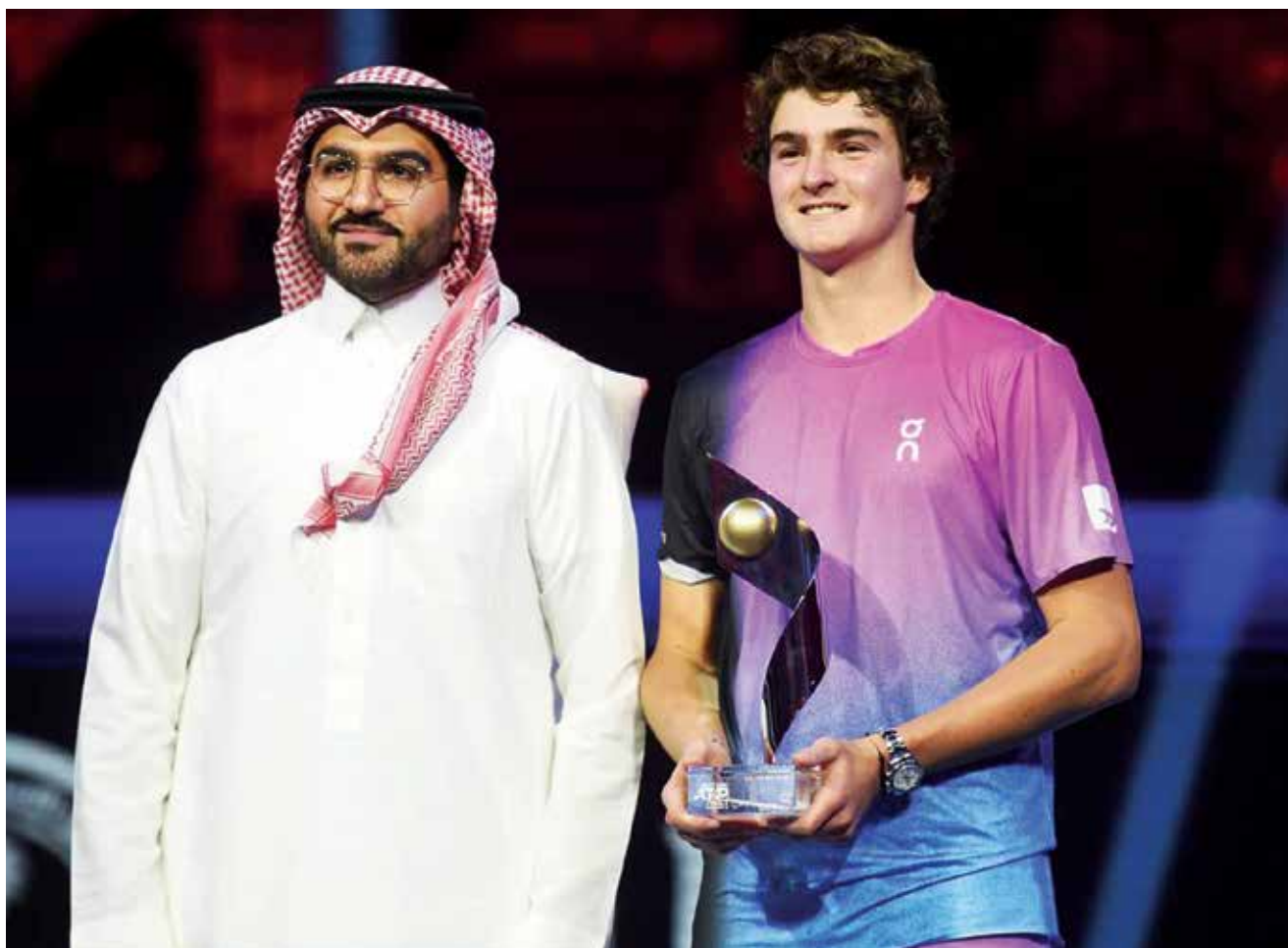
○ تنويج فونسيكا

ويحل النرويجي كاسبر رود في المركز السادس خلفه النجم الصربي المخضرم نوفاك ديوكوفيتش سابعا، ثم الروسي أندريه روبليف في المركز الثامن، والأسترالي أليكس دي مينور في المركز التاسع، بينما أكمل البلغاري جريجور ديميتروف قائمة العشرة الأوائل.