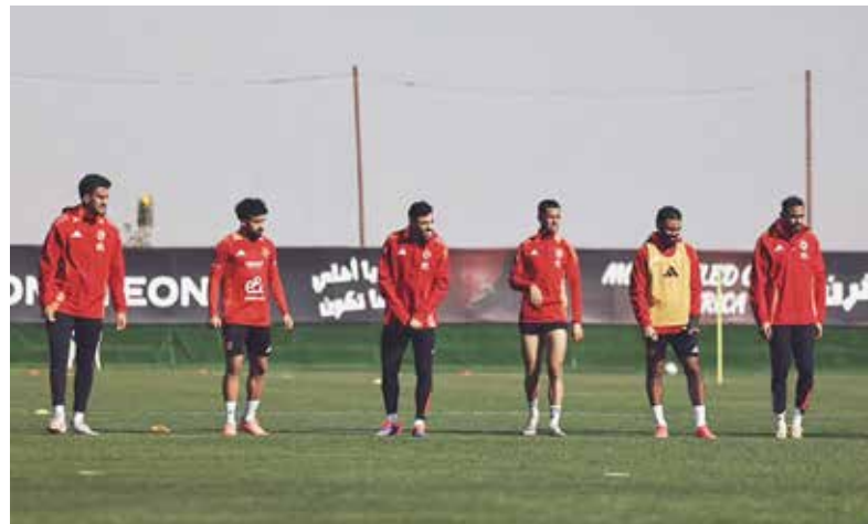
O تدريبات الأهلي