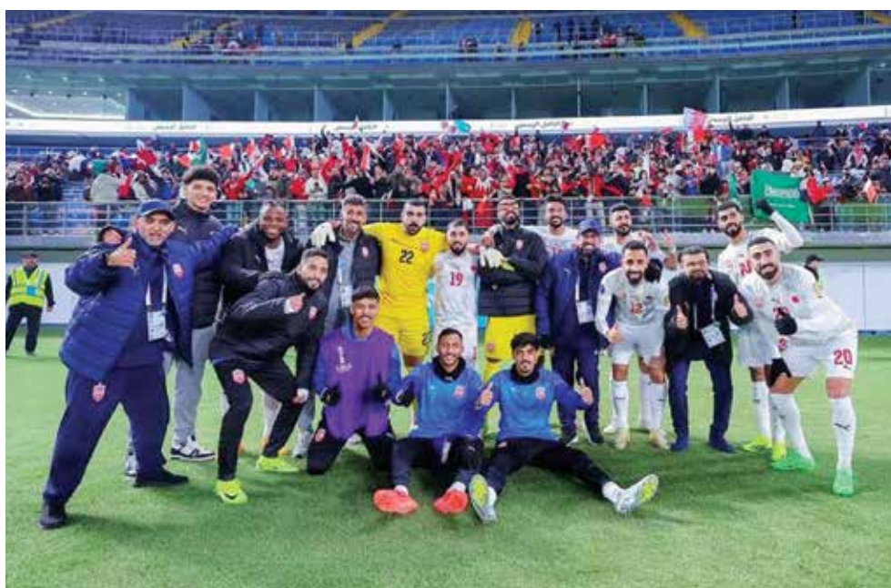
○ فرحة منتخبنا الوطني بالفوز.

وأكد زويد «أن الفوز على السعودية يعد خطوة مهمة نحو التأهل، حيث التغلب على منافس بحجم المنتخب السعودي يمنح منتخبنا الأفضلية في المجموعة، وخاصة مع تبقي مباراتين