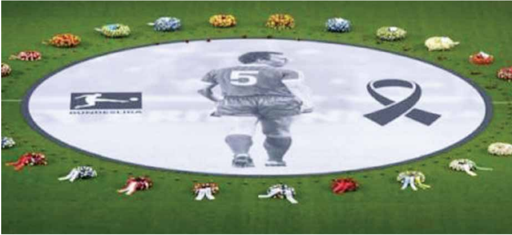
O من حفل تكريم بيكنباور