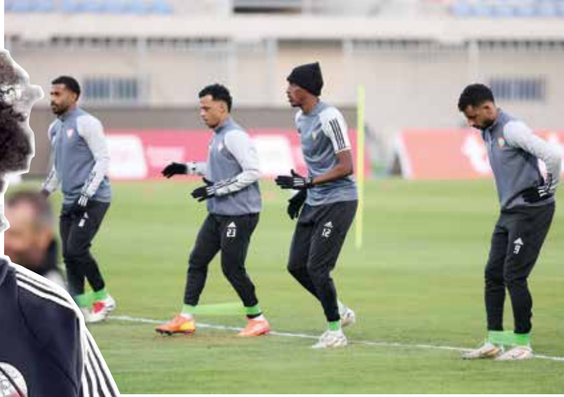
○ استعدادات الإمارات.

مباريات لم تعرف فيها طعم الانتصار. وودع «الأبيض» النسخة الماضية في العراق من دور المجموعات بثلاث هزائم، وتعادل مع قطر 1-1 في بداية مشواره بالنسخة الحالية، رافعا سلسلته إلى أربع مباريات من دون فوز.