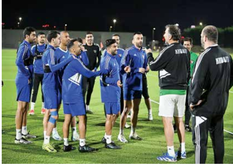
○ تدريبات الكويت.