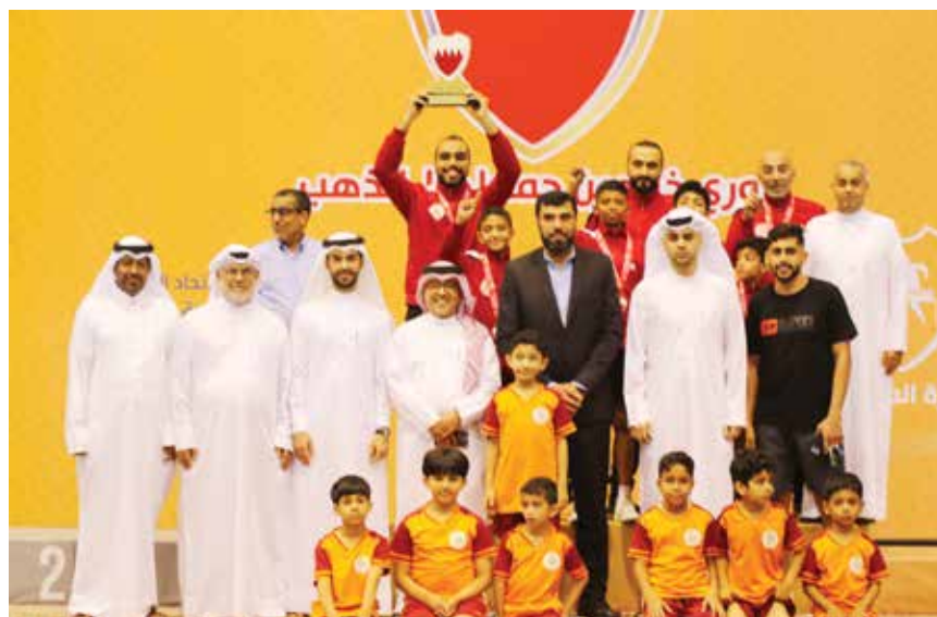
خلال توزيع صغار نادي سار في كرة الطاولة