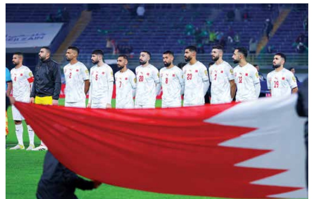
○ منتخبنا الوطني.