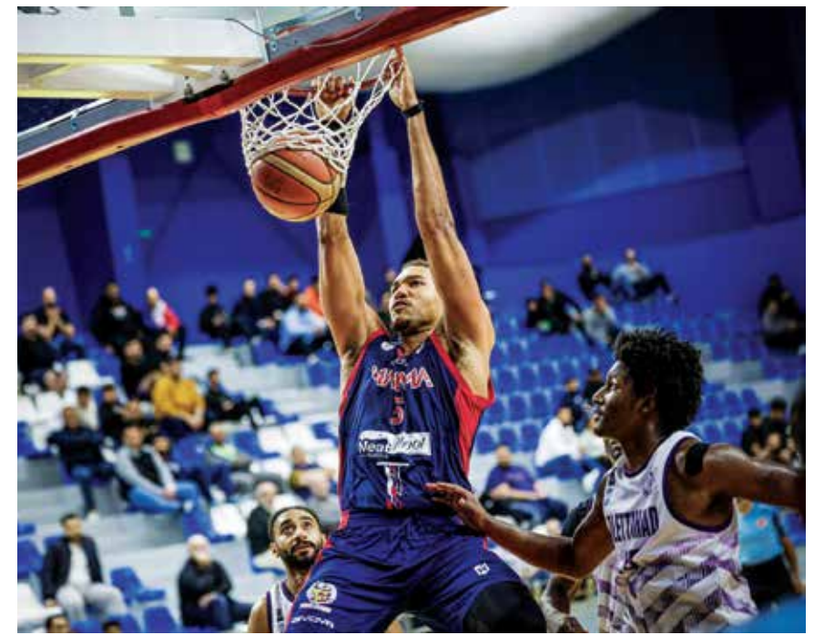
○ لقطة من مباراة المنامة والاتحاد.