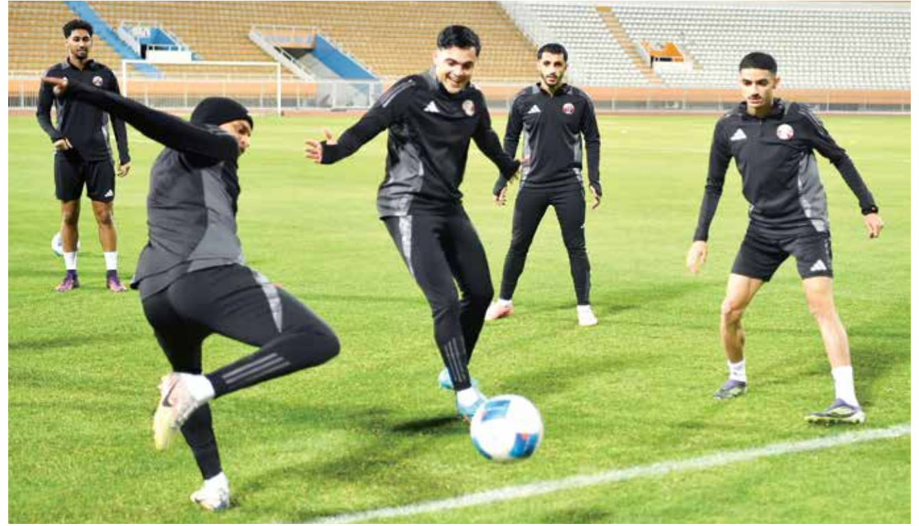
○ تدريبات المنتخب القطري.