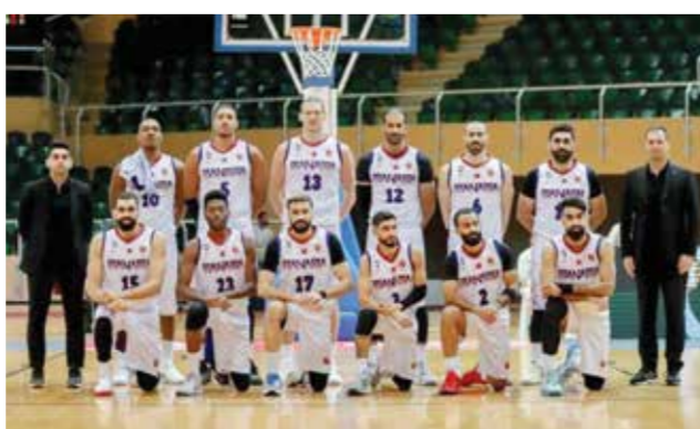
O فريق المنامة.

يدخل المحرق والمنامة المباراة وهما متصدران سلم الترتيب برصيد أربع نقاط لكل منهما، ويسعى الفريقان للظفر بنقاط المواجهة والانفراد بصدارة منافسات الدرجة الأولى، ويدخل المحرق المواجهة بعد تقديمه مستوى مميزاً في مواجهته أمام الاتحاد والنجمة، حيث قدم الفريق أداءً ثابتاً وكسب اللقاءين بفارق كبير، وفي المقابل يخوض المنامة اللقاء بعد فوزه بفارق مريح في الجولة الماضية أمام الاتحاد، ويعول الفريق على العديد من نجومه البارزين، ويملك الأفضلية على المنافس بامتلاكه ثلاثة محترفين، بينما يملك المحرق لاعبين محترفين، ويسعى الفريق لتأكيد تفوقه على منافسه المباشر حيث لن تكون مهمته سهلة، ومن المتوقع أن يحظى اللقاء بالحضور الجماهيري، نظراً إلى أهمية المواجهة وامتلاك الفريقين رابطتين