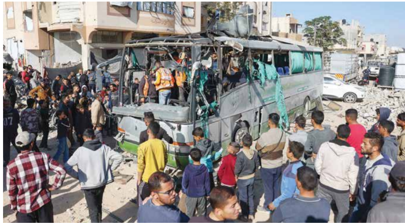
○ فلسطينيون يبحثون عن ضحايا وسط حطام حافلة قصفتها إسرائيل بمنطقة المواصي.

النار وقذائف المدفعية بشكل متكرر. وفي بيان قال مستشفى «العودة» في مخيم جباليا: إن حريقا اندلع في مستودع الأدوية المركزي للمستشفى إثر قصف الاحتلال الإسرائيلي للمنطقة المحيطة بالمستشفى. من جهة ثانية، أفاد المكتب الإعلامي الحكومي بغزة بأن قوات الاحتلال «مدعومة بأكثر من ١٧ آلية عسكرية وعشرات الجنود والطائرات اقتحمت المخيم الغربي في مخيم النصيرات أمس. وأضاف: «الاحتلال يرتكب جرائم مروعة في المخيم راح ضحيتها أكثر من ٥٠ شهيدا وجريحا كلهم مدنيون وأطفال ونساء». ولفت إلى «أن الجيش الإسرائيلي قام بنسف وهدم وقصف وتدمير أكثر من ٢٠ وحدة سكنية، في المخيم، مشيرا إلى أنه منذ بداية العدوان دمر أكثر من ١٥٠٠ وحدة سكنية في النصيرات. وفي بيان قالت كتائب القسام الجناح العسكري لحماس: إن مقاتليها استهدفوا «ناقلة جنود ربيوت ودبابه ميركافه صهيونية بقذائف الياسين ١٠٥، وأسقطوا طائرة مسيرة من نوع كواد كابتير في مخيم النصيرات».