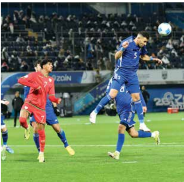
○ من لقاء الكويت وعمان.