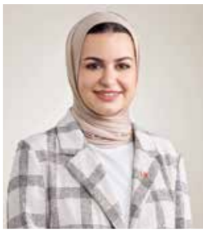
○ وزيرة الشباب.

الشباب (٢٠٢٣-٢٠٢٤)، وأوضح وزير شؤون الشباب قائلًا: «إن نقل الجمعيات إلى الوزارة سيخلق بيئة داعمة للشباب، وتتيح لهم فرصًا إضافية ليكونوا جزءًا من الفعاليات والمبادرات التي تقدمها الوزارة فضلًا عن تسخير كوادر الجمعيات الشبابية التي تؤمن بأنها تمتلك خبرات عالية من أجل تصميم وتنفيذ البرامج والمبادرات التي تلبى احتياجات الشباب وتعزز من الابتكار والإبداع بينهم، وتشجعهم على إطلاق مشاريع ومبادرات تخدم المجتمع وتدعم الرؤية الوطنية لتأهيل جيل قيادي مبدع».