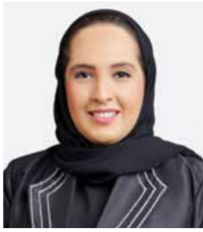
○ وزيرة الإسكان.

كل بنك ممول. وقالت الوزيرة إن التزامن الأوامر والتوجيهات بتوفير الخدمات الإسكانية للمواطنين مع احتفال مملكة البحرين بأعيادها الوطنية، وعيد الجلوس الخامس والعشرين لحضرة صاحب الجلالة الملك المعظم، وما يصاحبها من مناسبات وطنية، تضيف مزيدا من الفرحة على المواطنين، وتساهم في رقد جهود الوزارة الرامية إلى توفير السكن اللائق للمواطنين، بما يحقق الأهداف الإسكانية الواردة في برنامج التعمير 2023-2026. وهنأت الوزيرة أمينة الرميحي الممثلة في الخدمات الإسكانية، متمنية لهم سنا مباركا، ومؤكدة أن فريق العمل بالوزارة سيسخر طاقاته خلال المرحلة المقبلة لتسرع وتيرة توفير الخدمات للمواطنين المستفيدين. وفي سياق متصل قالت الوزيرة أمينة الرميحي إن الوزارة بدأت كذلك في تنفيذ توجيه صاحب السمو الملكي ولي العهد رئيس مجلس الوزراء، بزيادة عدد المنتفعين من برنامج «مزايا»، لعام 2024 بواقع 1400 مستفيد إضافي، حيث يتم حاليا العمل على إنهاء الإجراءات الخاصة بتخصيص مبالغ التمويل للمواطنين المتقدمين بطلبات الاستفادة من البرنامج حتى شهر ديسمبر من العام الحالي، وستشروع البنوك المشاركة في البرنامج في تنفيذ إجراءات الصرف وفقا للإجراءات المتبعة لدى