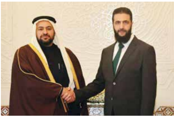
○ أحمد الشرع يستقبل وزير الدولة في وزارة الخارجية القطرية محمد الخليفي بدمشق. (أ ف ب)

دمشق - (أ ف ب): التقى القائد العام للإدارة الجديدة في سوريا أحمد الشرع أمس دبلوماسيين عربياً قدموا تيباعاً دعماً للشعب السوري، وناقش معهم الجهود المركزة في الفترة المقبلة. وأكد وزير الخارجية الأردني أيمن الصفدي عقب لقائه الشرع استعداد بلاده للمساعدة في إعادة إعمار سوريا، على ما نقل عنه التلفزيون الرسمي الأردني في أول زيارة لمسؤول أردني كبير لسوريا منذ إطاحة الأسد. ونقلت قناة «المملكة»، الرسمية عن الصفدي تأكيد «استعداد الأردن لتقديم كافة أشكال الدعم لسوريا»، مشيراً إلى أن «التجارة والحدود والمساعدات والربط الكهربائي من بين الملفات التي طرحت في المباحثات، إضافة إلى مناقشة الجوانب الأمني».