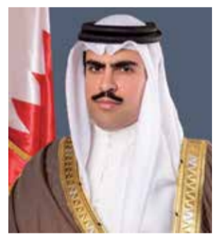
○ الشيخ عبدالله بن راشد.

العازف والملحن الموسيقي البحريني، هذا التكريم نتيجة لدوره في إبراز ودمج الثقافات بين الموسيقى الخليجية والإفريقية التقليدية، بالإضافة إلى قيامه بتأليف وإنتاج واداء الموسيقى لأطفال والإعلانات والحفلات الموسيقية، تم تضمينها ضمن مسلسلات تلفزيونية كبرى مثل (One Piece (Netflix) مسجلا فيه التشيلو الكهربائي والعود وأونديس مارتنوت.