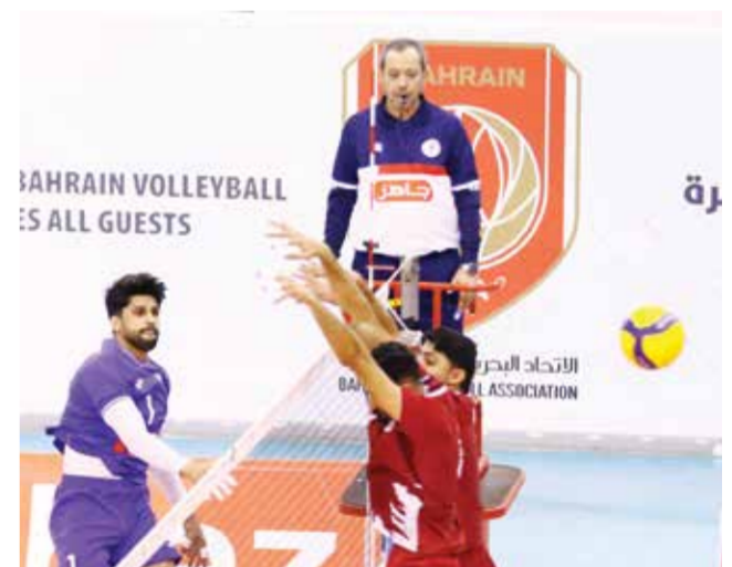
○ من لقاء دار كليب والشباب.