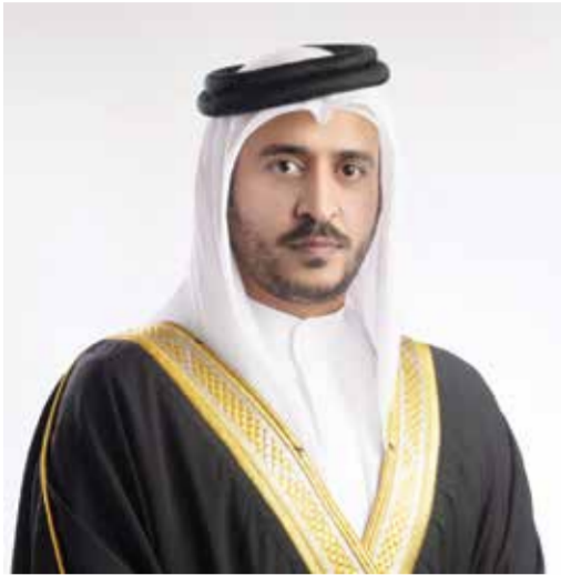
O سمو الشيخ خالد بن حمد آل خليفة.