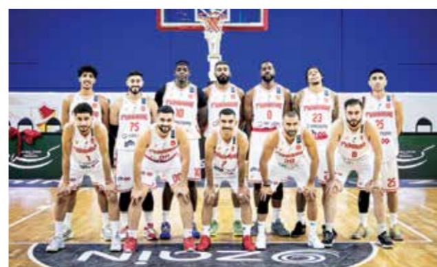
O فريق المحرق.

يبعث البهارة عن أول فوز في المنافسات، وذلك بعد تعرضه لخسارتين في الجولتين الماضيتين. وتقام المباراتين على صالة اتحاد اللعبة بأم الحصم.