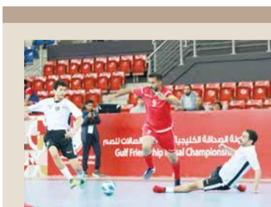
○ لحظة من لقاء البحرين والإمارات

□ اخيراً نقول (من لا يشكر المخلوق لا يشكر الخالق)؛ فالتحية للجماهير التي تعنتت للسفر خلف الفريق، غير (مُكرّثة) ببرودة الطقس؛ فشجعت الفريق وأزرتة ورفعت من معنويات اللاعبين وزادته حرارة؛ فردوا اليهم (الذين) وقدموا مباراة تليق برغبتهم في تحقيق لقبٍ شانٍ؛ ولم يكن غريباً عليهم ان يقوموا بتحيّتهم والقول (جماهيرنا الاعزاء؛ شكراً)!