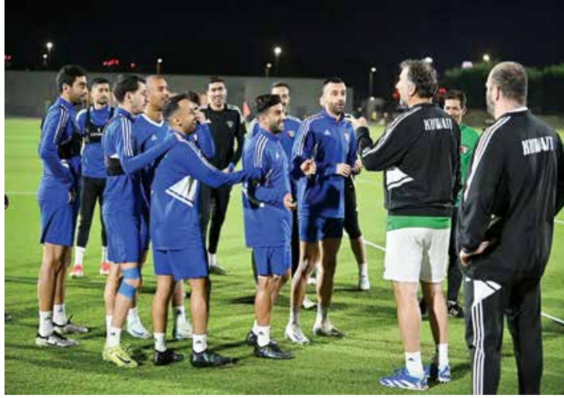
○ تدريبات الكويت.