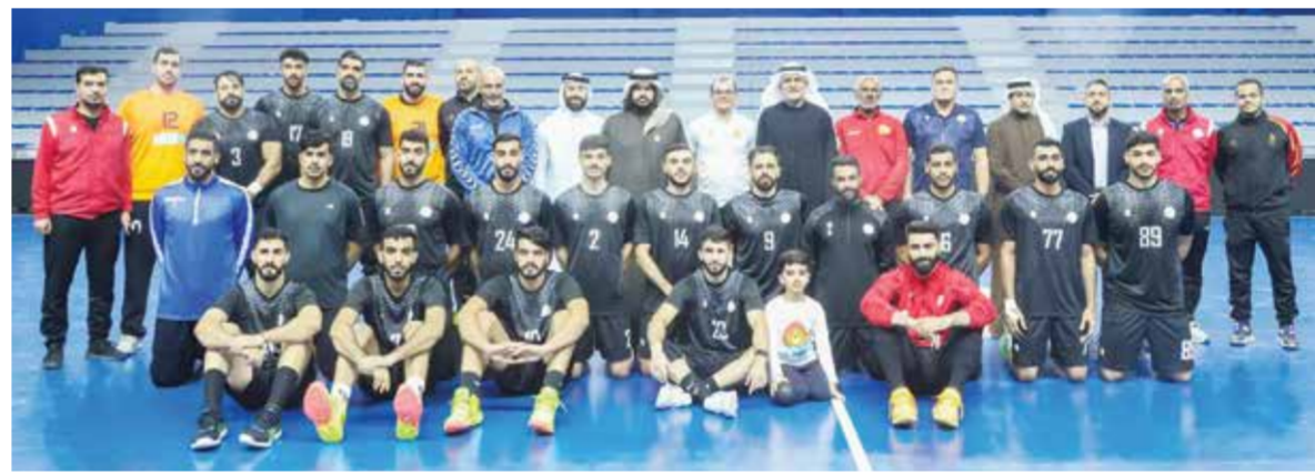
O سموه يتوسط أفراد المنتخب.