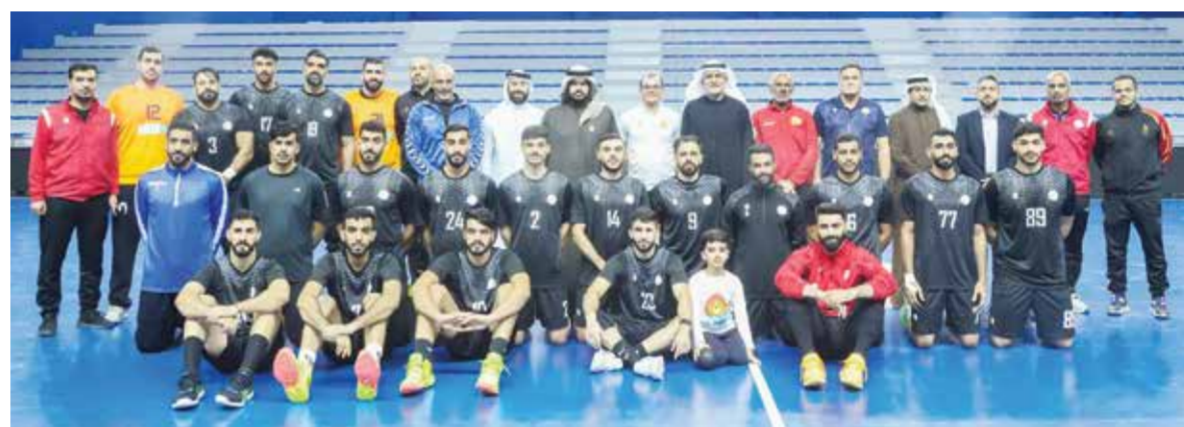
○ سموه يتوسط أفراد المنتخب.

أكد سموه أهمية مضاعفة الجهود في بطولة العالم وتقديم أفضل المستويات للوصول إلى أبعاد نقطة وتحقيق نتائج ايجابية تأكيداً للمكانة المتميزة لكرة اليد البحرينية، معبراً عن اعتزازه بما حققته اللعبة من إنجازات باهرة بعد نجاح منتخبنا لكرة اليد البحرينية للمنتخب الوطني في إنجاز كأس العالم في عام واحد. وأكد دعم اللجنة الأولمبية البحرينية للمنتخب الوطني في الاستحقاق العالمي، مشيداً بالجهود المبذولة من قبل الاتحاد البحريني لكرة اليد برئاسة السيد علي عيسى اسحاقى والجهازين الفني والإداري، متطلعا لأن تتكامل جميع تلك الجهود بتقديم أفضل المستويات والنتائج التي تليق بسمة كرة اليد البحرينية.