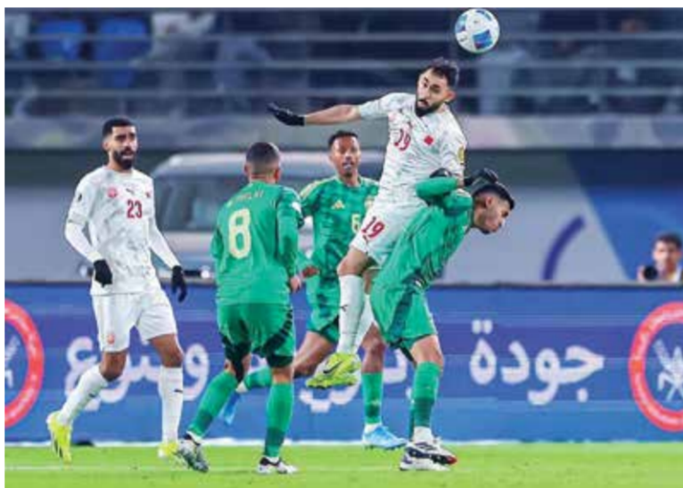
○ لحظة من المباراة.

وإختم عبدالرزاق تصريحه بالتأكيد على ضرورة دعم المنتخب خلال المرحلة المقبلة، مشدداً على أهمية الاستمرار بنفس الأداء والروح العالية لتحقيق المزيد من الانتصارات.