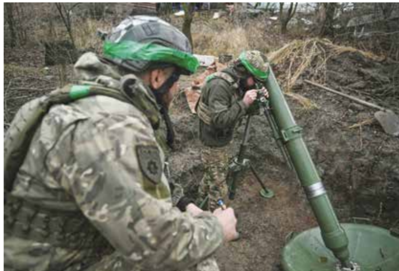
○ عنصران من القوات الأوكرانية في الخطوط الأمامية مع تقدم القوات الروسية في بلدة تورتسك.

المجاورة.. ومن جانبها وقالت رئاسة الأركان المشتركة الكورية الجنوبية في بيان «تقدر الخسائر التي تكبدتها القوات الكورية الشمالية التي شاركت مؤخراً في المعارك ضد القوات الأوكرانية بـ ١١٠٠ بين قتيل وجريح. وذكّرت رئاسة الأركان الكورية الجنوبية أن الاستعدادات الجارية تدفعها إلى الاعتقاد بأن كوريا الشمالية ستستعد لإرسال قوات جديدة إلى روسيا كتحزيزات أو في إطار عملية تبديل. وأضاف المصدر أن المعلومات الاستخباراتية التي جمعتها كوريا الجنوبية تشير إلى أن القوات الأوكرانية، وحذرت هيئة الأركان المشتركة من أن «ذلك قد يؤدي إلى زيادة التهديد العسكري الكوري الشمالي ضداً». وتم إرسال آلاف الجنود الكوريين الشماليين إلى روسيا في الأسابيع الأخيرة لدعم الجيش الروسي، بحسب