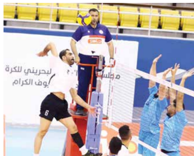
○ من مباراة النصر وعالي.

تتواصل اليوم منافسات الجولة الخامسة من الدوري العام، إذ يلعب في المباراة الأولى فريقا دار كليب ١٢ نقطة والشباب ٤ نقاط في تمام الساعة ٦ مساء، وفي المباراة الثانية فريقا عالي نقطة واحدة مع النصر ٩ نقاط، وتقام المبارتان في صالة عيسى بن راشد في الرفاع.