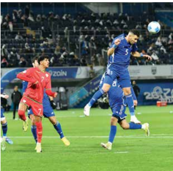
O من لقاء الكويت وعمان.