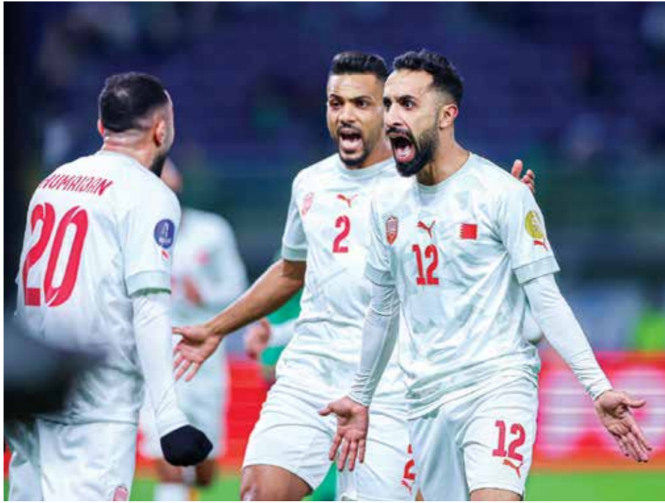
O فرحة بالانتصار الثمين.