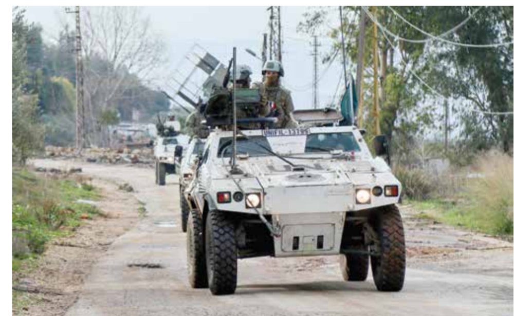
○ طالبت اليونيفيل إسرائيل بالإسراع في سحب قواتها من جنوب لبنان.