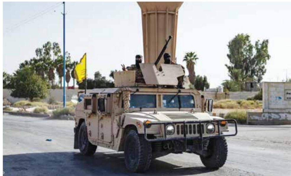
○ ارشيفية لعناصر من قوات سوريا الديمقراطية (قسد).

(سكاي نيوز عربية / الوكالات): أعلنت قوات سوريا الديمقراطية «قسد»، أمس، إفشال هجوم شنته فصائل موالية لتركيا على محيط سد تشرين في منتج. وأفادت «قسد» بأن قواتها قامت بعمليات تمهيط للقرى المحيطة بالسد. وقال مراسل «سكاي نيوز عربية»: إن قوات سوريا الديمقراطية أعلنت مقتل ١٥ من عناصرها في اشتباكات بريف حلب ومنتج وجسر قرقوقا وسد تشرين ودير الزور. ونقل يومية، أعلنت الإدارة الذاتية لشمال وشرقي سوريا خروج سد تشرين، أحد أهم السدود الحيوية في المنطقة، عن الخدمة بشكل كامل إثر استهدافه من قبل القوات التركية والفصائل المسلحة الموالية لها.