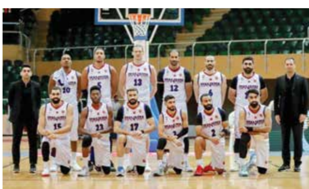
○ فريق المنامة.

يدخل المحرق والمنامة المباراة وهما متصدران سلم الترتيب برصيد أربع نقاط لكل منهما، ويسعى الفريقان للظفر بنقاط المواجهة والانفراد بصدارة منافسات الدرجة الأولى، ويدخل المحرق المواجهة بعد تقديمه مستوى مميزاً في مواجهته أمام الاتحاد والنجمة، حيث قدم الفريق أداءً ثابتاً وكسب اللقاءين بفارق كبير، وفي المقابل يخوض المنامة اللقاء بعد فوزه بفارق مريح في الجولة الماضية أمام الاتحاد، ويعول الفريق على العديد من نجومه البارزين، ويملك الأفضلية على المنافس بامتلاكه ثلاثة محترفين، بينما يملك المحرق لاعبين محترفين، ويسعى الفريق لتأكيد تفوقه على منافسه المباشر حيث لن تكون مهمته سهلة، ومن المتوقع أن يحظى اللقاء بالحضور الجماهيري، نظراً إلى أهمية المواجهة وامتلاك الفريقين رابطتين