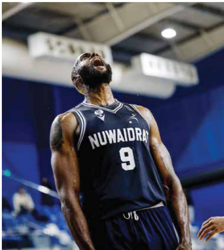
○ م. مالك.