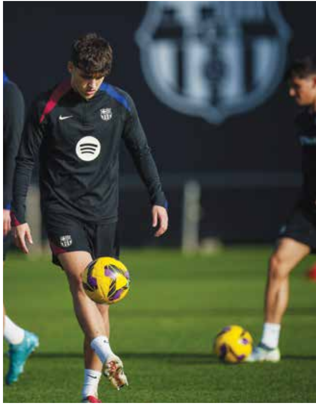
○ تحضيرات برشلونة