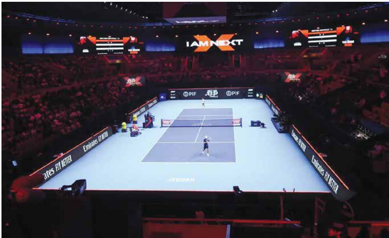
○ من منافسات البطولة

ونوه رئيس الاتحاد الدولي بالتحول المستمر لرياضة رفع الأثقال في قارة آسيا، والذي ظهر بقوة في الهيمنة الآسيوية على نتائج بطولة العالم لرفع الأثقال التي اختتمت مؤخرا بالبحرين، وتواجد خمسة من الأبطال الستة الأوائل في فئة الرجال من آسيا، بينما جاء السادس من كولومبيا، وكذلك في فئة السيدات التي تقاسمت مراكزها الأولى قارنات آسيا وأوروبا.