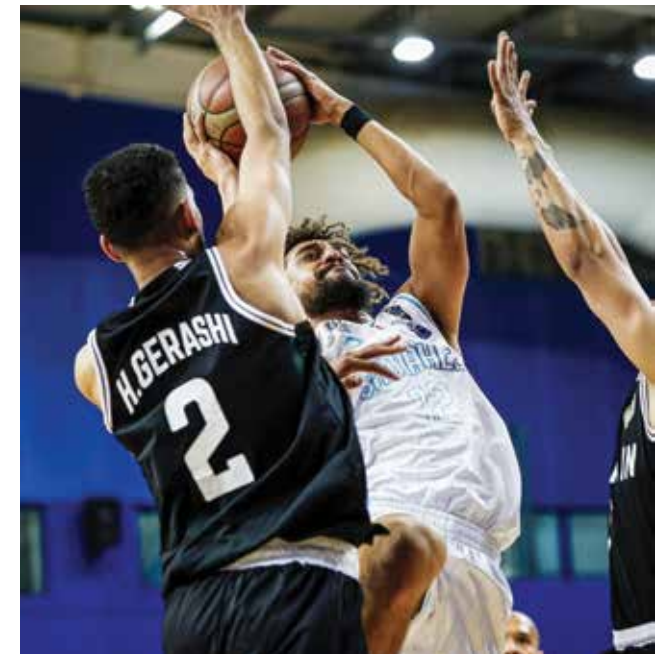
لقطة من مباراة سماهيح والبحرين.

تختتم اليوم منافسات الجولة الثانية لدوري زين لكرة السلة