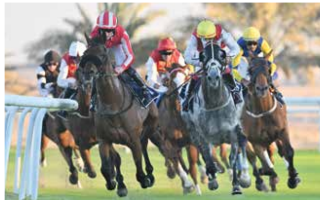
○ لحظة من السباق