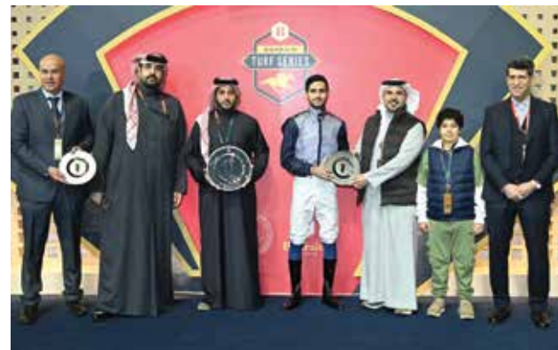
○ تتويج الفائزين