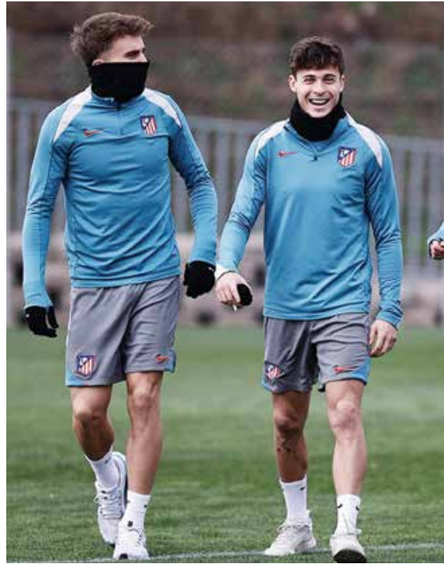
○ تدريبات أتلتيكو

برشلونة - (أ ب ف): في حين كانت بداية المدرب الألماني هانزي فليك مع برشلونة مثالية، صارح أتلتيكو مدريد للعودة إلى سباق الفوز باللقب، حيث ستكون المواجهة بينهما اليوم السبت حامية الوطيس لحسم معركة القمة في المرحلة الثامنة عشرة في الدوري الإسباني لكرة القدم.