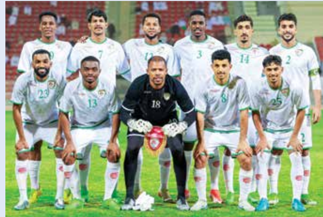
○ المنتخب العماني