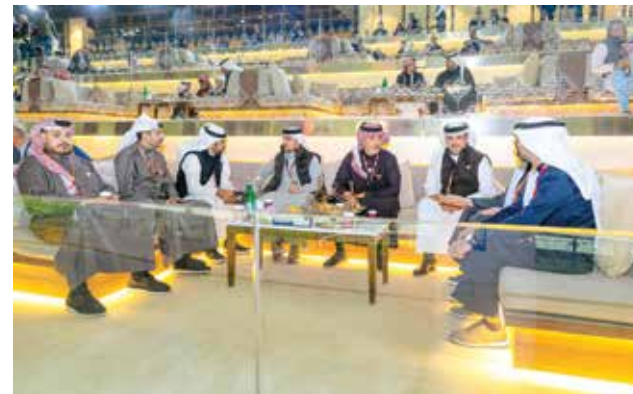
○ جانب من الحضور في السباق

فيكتوريوس تحقيق فوزه الثاني ومواصلة نتائجها المتقدمة. • الشوط الثاني: كأس نادي راشد للفروسية وسباق الخيل للفتة الثالثة من جيات الدرجة الأولى «نتاج محلي» لمسافة ٢٠٠٠ متر. استطاعت الفرس المرشحة «قليشا»، ملك سمو الشيخ حمد بن عبدالله بن عيسى آل خليفة مواصلة انتصاراتها المتتالية منذ الموسم الماضي،