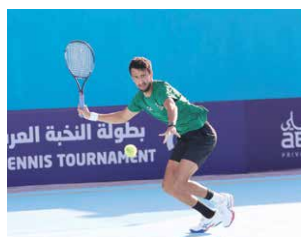
○ من منافسات البطولة.