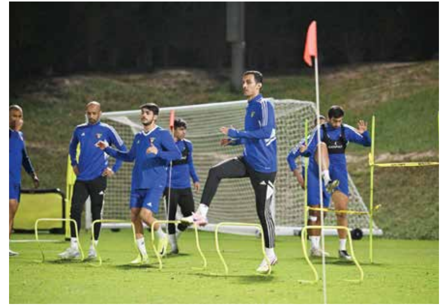
○ تدريبات منتخب الكويت.