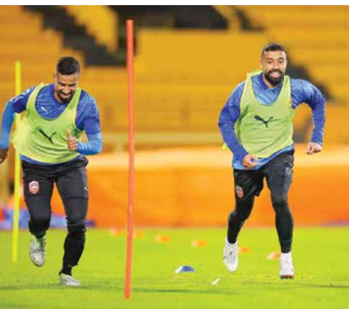
○ جانب من التدريب

يختم منتخبنا الوطني الأول لكرة القدم، اليوم السبت ٢١ ديسمبر ٢٠٢٤، سلسلة تدريباته التحضيرية التي تسبق مشاركته في منافسات النسخة السادسة والعشرين من بطولة كأس الخليج العربي لكرة القدم «خليجي ٢٦»، إذ سيبدأ المنتخب مشواره بقاء المنتخب السعودي غدا الأحد، على استاد جابر الدولي عند ٨،٣٠ مساءً، ضمن الجولة الأولى للمجموعة الثانية التي تضم أيضاً منتخبي العراق واليمن، واللذين سيلعبان عند ٥،٢٥ مساءً على استاد الصليبيخات. سيعقد المؤتمر الصحفي لمنتخبنا عند ١٢،٣٠ ظهر اليوم السبت، وذلك في المركز الإعلامي الرئيسي للبطولة بفندق كراون بلازا، ويسبقه عند ١٢ ظهرًا مؤتمر منتخب السعودية، وسيحضر مدرب المنتخب دراغان تالاييتش رفقة واحد من لاعبي منتخبنا خلال المؤتمر الصحفي. عمار في الافتتاح يشارك حكماً الدولي عمار