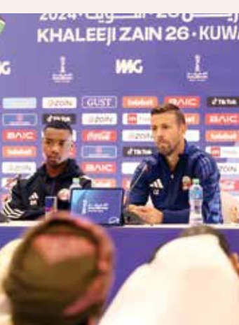
○ غارسيا ومدربو في المؤتمر الصحفي

الكويت - (قنا): أكد الإسباني لويس غارسيا مدرب المنتخب القطري لكرة القدم أن المنتخب استعدادا بالشكل الأمثل رغم قصر فترة الإعداد لخوض غمار منافسات النسخة السادسة والعشرين من كأس الخليج التي تفتتح غدا في الكويت وتستمر حتى الثالث من يناير المقبل. وأوضح المدرب في المؤتمر الصحفي أمس، أنه سعيد بتولي مهمة قيادة المنتخب في البطولة، والتي استعد لها «الأصم»، بصورة جيدة رغم قصر فترة التحضير الخاصة قبل انطلاق المنافسات، لافتا إلى أنه لمس مدى الشغف الكبير الذي يملكه اللاعبون والإصرار الذي أظهره على تحسين المستوى وتحقيق النتائج الإيجابية في البطولة الخليجية.