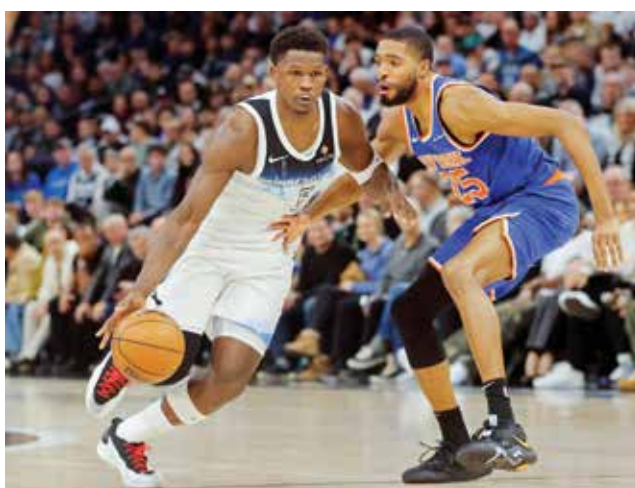
○ من لقاء تمبرولفز ونيكس

وتغلب بورتلاند ترايل بلايزرز على دنفر ناغتس ١٢٦-١٢٤ بفضل سلة في الثانية الأخيرة من أنفيري سيغونز الذي أنهى اللقاء بـ٢٨ نقطة مع ١٠ تمريرات، فيما ذهبت جهود النجم الصربي نيكولا يوكيتش (٣٤ نقطة) مع ٨ تمريرات حاسمة) والكندي جمال موراي (٢٤ مع ١٠ تمريرات حاسمة) وراسل وستبروك (١٩) سدى.