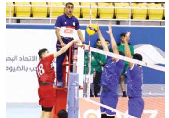
من لقاء الشباب والبسيتين.