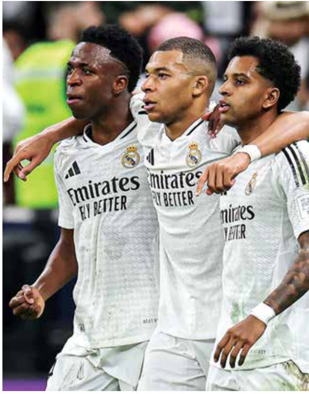
○ مبابي وفينيسيوس ورودریغو