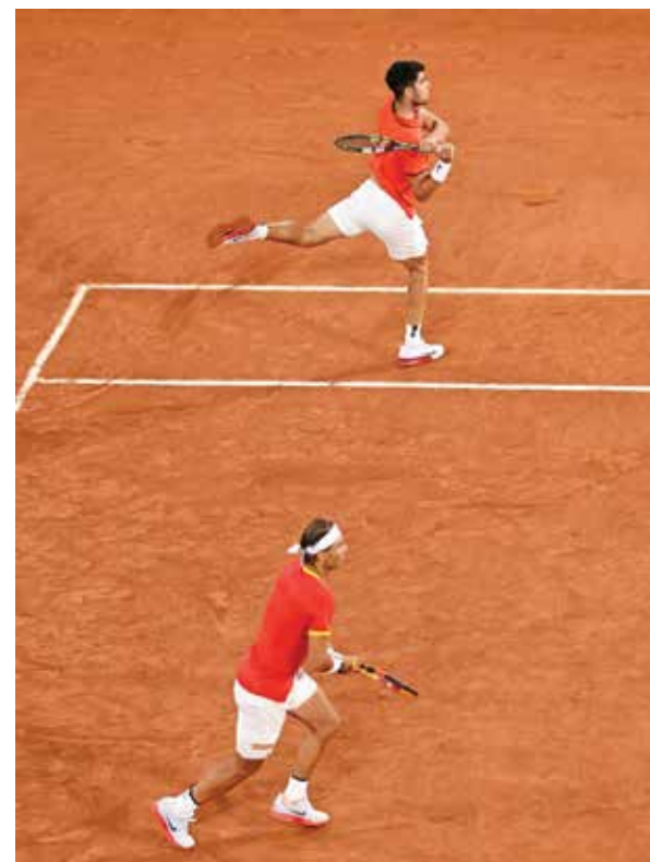
○ من مباريات التنس.

ويجب على الرياضيين دائماً تحديد مكان تواجدهم، بحيث يمكن خضوعهم للاختبار في غير أوقات المنافسات والبطولات، ويؤدي فشل الرياضي ثلاث مرات في تحديد مكان تواجده خلال فترة ١٢ شهر إلى تعرضه لعقوبات.