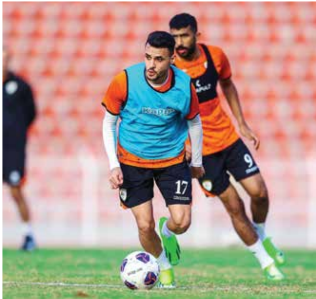
○ تدريبات منتخب عمان.