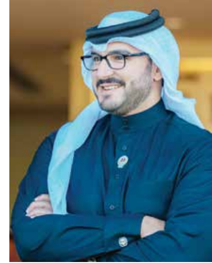
○ سمو الشيخ عيسى بن سلمان بن حمد آل خليفة