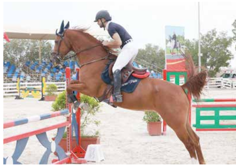
من سباقات قفز الحواجز.

وسيكون جمهور ومحبو وعشاق رياضة قفز الحواجز على موعد مع بطولة العيد الوطني لقفز الحواجز وهي رابع بطولات الموسم الجديد من صباح اليوم على ميدان الرفه بالاتحاد الرياضي العسكري وخصوصا بين الفرسان والاسطبلات المحلية وبناء على المستويات التي ظهر عليها المشاركون في البطولات الماضية.