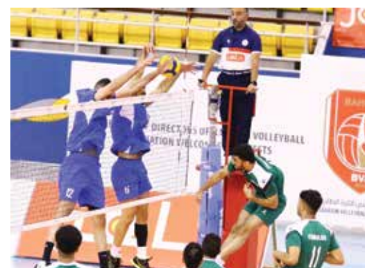
من لقاء النصر واتحاد الرفيف.