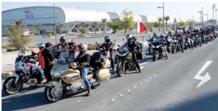
من مسيرة الدراجات.

أغنية مصورة خاصة بالعيد الوطني المجيد بعنوان «عشقي البحرين»، من كلمات والحن محمد مطر العميري، توزيع تركي عبدالرحمن، غناء بدر العنزي، كورال تيون شيك، تصوير عبدالنور عبدالله وحسن القمري، مونتاج سلمان الزياتي/جاسم أمير، وإنتاج MK STUDIOS.