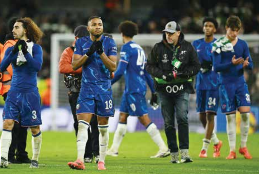
○ تشلسي يواصل انتصاراته.

لشلسي بأن يصبح على بعد نقطتين فقط من ليفربول بعدما حقق فريق المدرب الإيطالي إنسو ماريكا انتصاره الخامس تواليًا بتغلبه على برنتفورد ١-٢. وستكون الفرصة سانحة أمام تشلسي الذي أنهى دور المجموعة الموحدة من مسابقة كونفرنس ليغ، بالعلامة الكاملة بفوزه الخميس على شامروك روفرز الإيرلندي ٥-١، كي يتصدر وإن كان مؤقتًا حين يواجه الأحد مضيفه إيبرتون السادس عشر قبل اللقاء المرتقب بين ليفربول وتوتنهام، الفريق الذي لا يعلم أحد كيف سيظهر ضد «الحمر» في ظل موسمه المتقلب (٧ انتصارات مقابل ٧ هزائم وتعادلين).