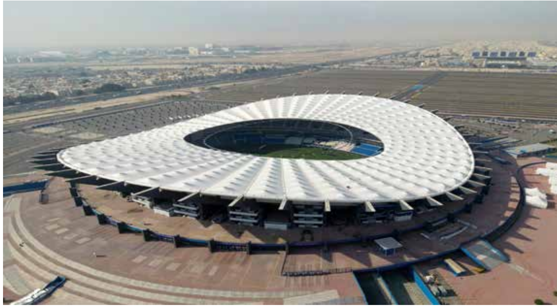
○ استاد جابر الأحمد الصباح.