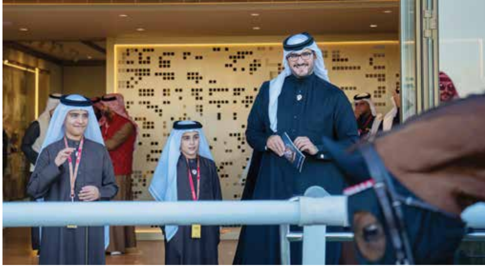
○ حضور رسمي كبير