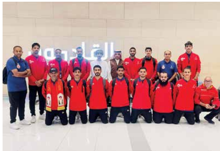
○ منتخب عمان أول الواصلين.

وَعُدَّ مساء يوم أمس الجمعة الاجتماع الفني للبطولة في مقر إقامة الوفود، بحضور ممثلي المنتخبات المشاركة وأعضاء اللجنة المنظمة، وخلال الاجتماع، تم اعتماد كشوف اللاعبين النهائية، مع التأكد من استيفاء جميع الشروط والمعايير المعتمدة في البطولة، كما تم تحديد أوان قمصان الفرق في المباريات لضمان سلامة التنسيق بين المنتخبات خلال المواجهات.