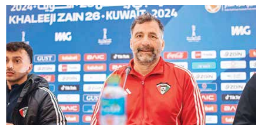
○ جانب من المؤتمر الصحفي

وأضاف أن المنتخب طوى صفحة المباراة الأخيرة في التصفيات الآسيوية المؤهلة إلى نهائيات كأس العالم ٢٠٢٦، وذلك بفضل العقلية الاحترافية التي يتوفر عليها اللاعبون الذين يدركون أن هناك فرصة جديدة لتغيير الصورة واستعادة المستوى الذي كانوا عليه خلال المراحل السابقة وخصوصا كأس آسيا الأخيرة ٢٠٢٣ والتي توجوا بلقبها، والفرصة المتاحة حاليا هي بطولة كأس الخليج التي يسعى الجميع لبذل قصارى جهده خلالها وتقديم أفضل مستوى ممكن لتحقيق نتائج جيدة وكسب دفعة معنوية عند العودة إلى التصفيات الموندiale.