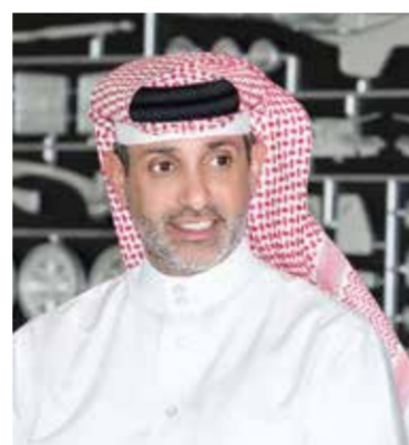
○ الشيخ سلمان بن عيسى آل خليفة.

الاستخدام الواحد مع توفير محطات مياه مجانية للجماهير، ومرافق إعادة تدوير للجماهير أكثر تطوراً وبرنامج التبرع بالطعام. ومن جانبه أكد الشيخ سلمان بن عيسى آل خليفة الرئيس التنفيذي لحلبة البحرين الدولية: «نحن فخورون للغاية بوصولنا على أعلى مستوى من الاعتماد للاستدامة من قبل الاتحاد الدولي للسيارات، وهو ما يعكس خطتنا الشاملة التي وضعناها ونفذناها على مدى عدد من السنوات لضمان مسؤوليتنا تجاه البيئة، وأشكر الاتحاد الدولي للسيارات على تقديره لجهودنا، فضلاً عن التوجيه والدعم الذي نتلقاه من الفورمولا وان وشركائنا لتحقيق أهدافنا، وختاماً سنواصل العمل الجاد في جميع مجالات