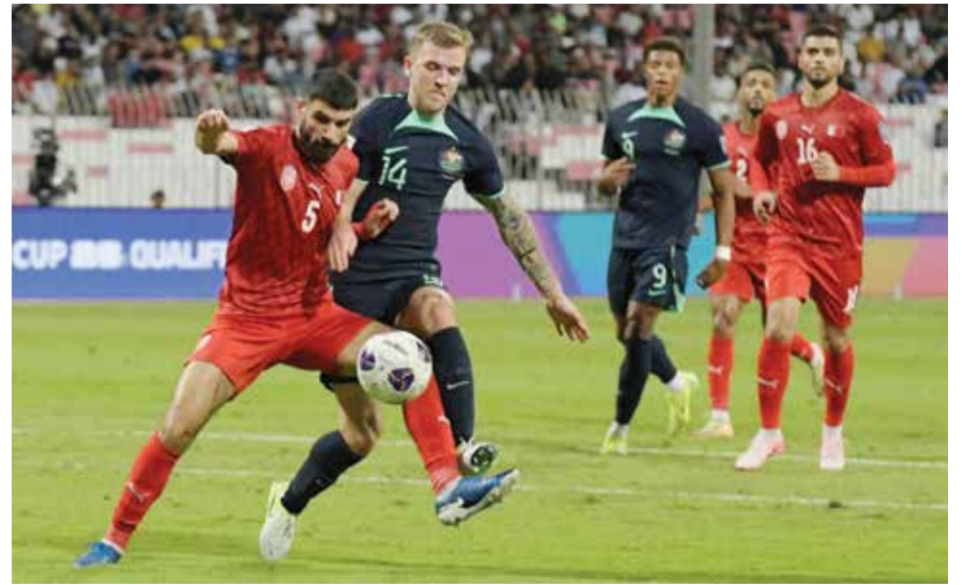
○ من لقاء البحرين وأستراليا.

السعودية: البداية كانت خاطئة، وهذا ما حدث، بدأنا المباراة كأنها ودية، وكما ذكرت من قبل أنني قبلت التحدي، لذا فأنا