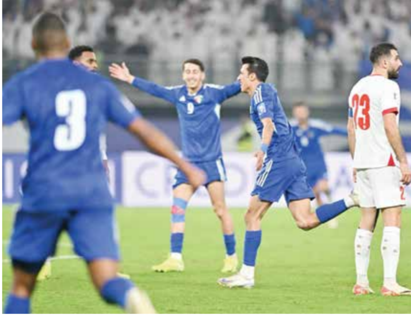
○ فرحة المنتخب الكويتي.

وأضاف: قمت في بداية الشوط الثاني بعمل تعديل، وتمكننا من اللعب بشكل أفضل والاستحواذ على الكرة واللعب في العمق،