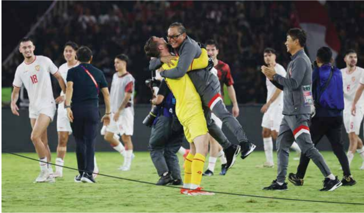
○ احتفال لاعبي إندونيسيا بالفوز.

أشاد شين تاي-يونغ مدرب منتخب إندونيسيا بمجهود اللاعبين بعدما حققوا الفوز على أرضهم أمام السعودية بنتيجة ٢-٠ يوم الثلاثاء على ستاد غيلورا بونغ كارنو في جاكرتا، ضمن الجولة السادسة من منافسات المجموعة الثالثة في الدور الثالث من التصفيات الآسيوية - الطريق إلى كأس العالم ٢٠٢٦.