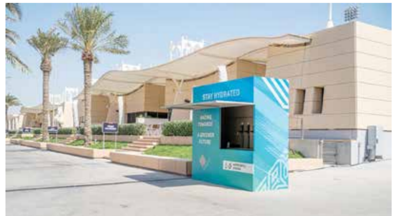
○ كابينة تعبئة الماء.

الشوط الثالث: كأس بورصة البحرين لجياد الدرجة الرابعة والمبتدئات «مستورد»، مسافة ١٤٠٠ متر. الخيول المشاركة: بيح وود ميك، ليكالييز