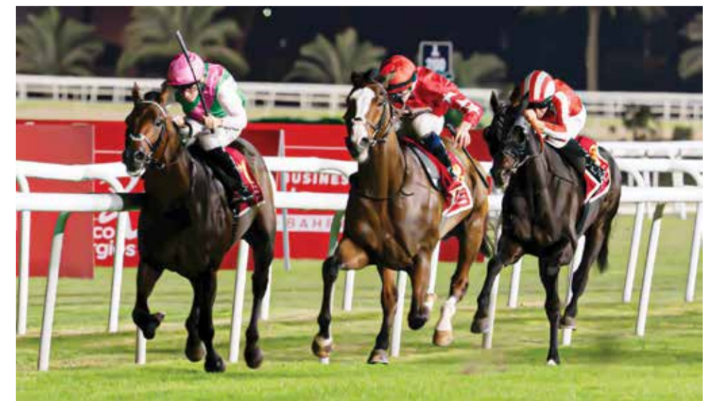
○ منافسات قوية يشهدها السباق الرابع للخيل.

تتبع الجائزة عملية تطبيق وتدقيق مفصلة حيث تم تقييم حلبة البحرين الدولية عبر العديد من المجالات بما في ذلك التزام تجاه الإدارة البيئية، والأهداف البيئية المحددة بوضوح، والتدقيق والقياس عبر المجالات بما في ذلك الطاقة والمياه وإدارة النفايات والنقل والخدمات اللوجستية والتنوع البيولوجي وانبعاثات الكربون. تمكنت حلبة البحرين الدولية من عرض خطتها الشاملة للاستدامة في جميع مرافق الحلبة، فضلاً عن العديد من المبادرات الرائدة، أبرزها: - منشأة إنتاج الطاقة الشمسية الرائدة والتي أنتجت أكثر من ٥ ملايين كيلوواط/الساعة من الطاقة النظيفة في عامها الأول، وهو ما يكفي لتغطية جميع الاستخدامات لسباق الفورمولا وان مع توفير سعة كبيرة، وهو ما يعادل تعويض