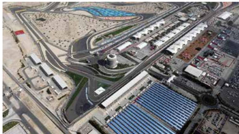
○ الخلايا الشمسية تزود الحلبة بالطاقة.