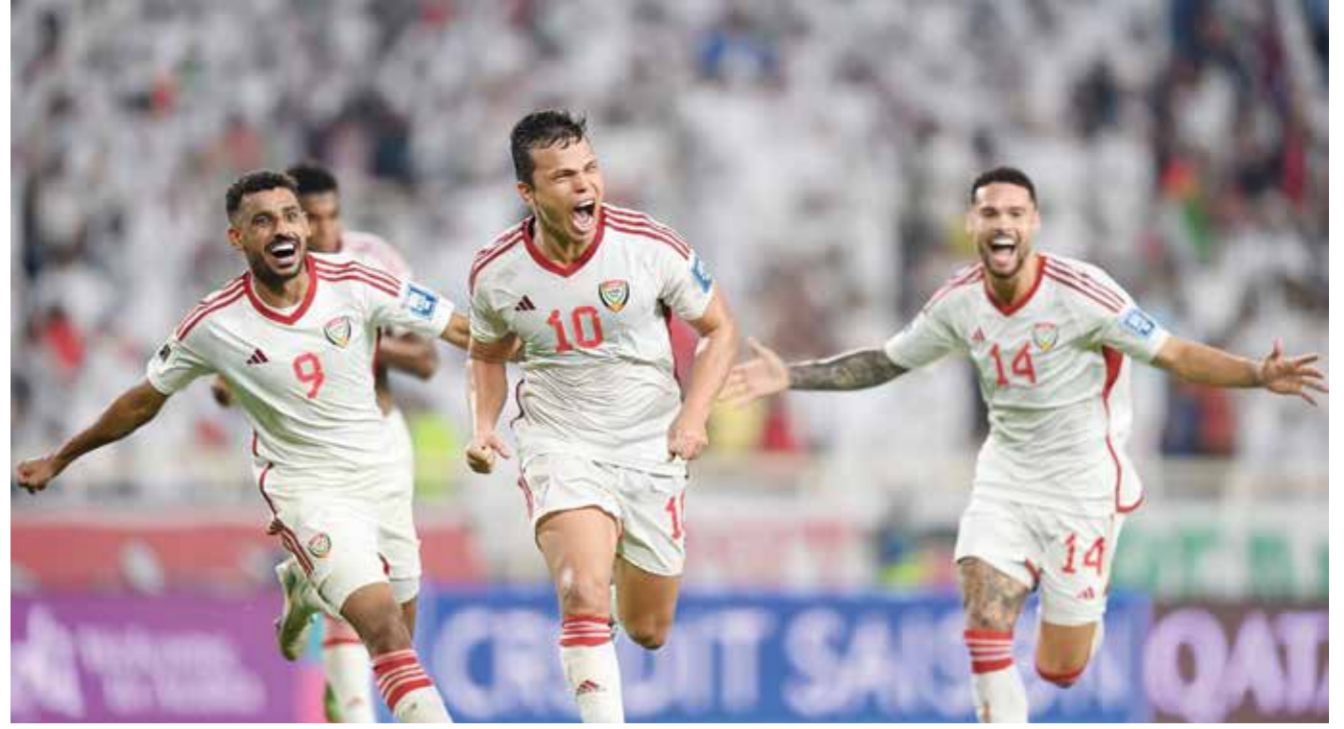
○ احتفالية الفوز.

وأوضح: حاولنا أن نعد في الشوط الثاني، من خلال استغلال المساحات ومهارات لاعبيننا والتغييرات التي أجريتها. لدينا متسع من الوقت حتى الجولة المقبلة، وسنعود بشكل أفضل. وشدد بالقول: الغيابات كان لها تأثيرها بكل تأكيد، لأن الأسماء الغائبة كبيرة، لكن حضور اللاعبين البديل كان إيجابياً في المباراتين الماضيتين من التصفيات. وختم: اللاعبين بذلوا مجهوداً كبيراً أمام العراق، وأنا سوف أعمل على علاج الأخطاء للعودة والحفاظ على ما تبقى من حظوظ بالتصفيات.