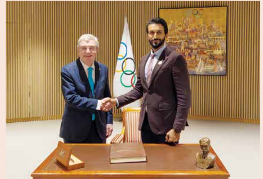
○ سمو الشيخ ناصر بن حمد مصافحا باخ.