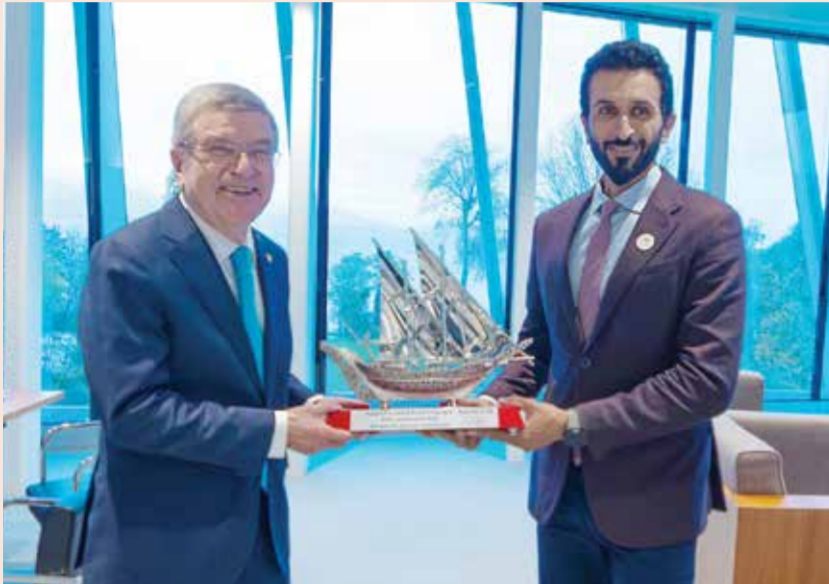
○ سموه مقبدا هدية لباخ.