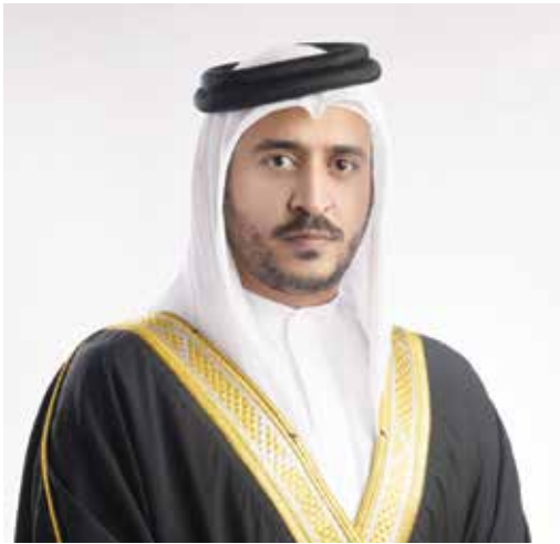
○ سمو الشيخ خالد بن حمد آل خليفة