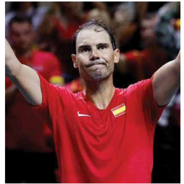
○ نادال (روبوتز)

وتوجه السويسري الذي تصدر لائحة أكثر اللاعبين فوزاً بالألقاب الكبرى (٢٠) قبل أن يتقدم عليه نادال (٢٢) ويعد ذلك الصربي نوفاك ديوكوفيتش (٢٤) إلى خصمه السابق بالقول: «جعلتني أعمل بجهد أكبر مما كنت