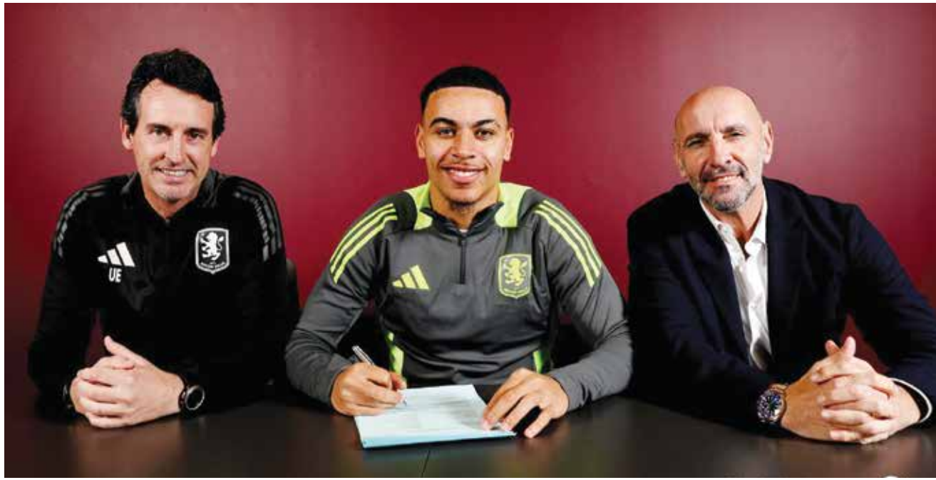
○ روجرز مع أستون فيلا حتى ٢٠٢٠.

القاهرة - (د ب أ): أعلن باتريس موتسيبي، رئيس الاتحاد الأفريقي لكرة القدم (كاف) أنه سيقوم بزيارة لكل من كينيا وتنزانيا وأوغندا الشهر المقبل. أوضح موتسيبي أن تلك الزيارة تأتي من أجل الاطمئنان على الملاعب والبنية التحتية تمهيدا لاستضافة الدول الثلاثة بطول كأس الأمم الأفريقية للمحليين التي ستقام في فبراير ٢٠٢٥ وقال موتسيبي في تصريحات للموقع الإلكتروني الرسمي لكاف، أمس الثلاثاء، إنه سيقوم بالزيارة للاطلاع على مدى التقدم والاستعداد للملاعب والبنية التحتية والمرافق الأخرى لاستضافة البطولة في هذه البلدان الثلاثة.