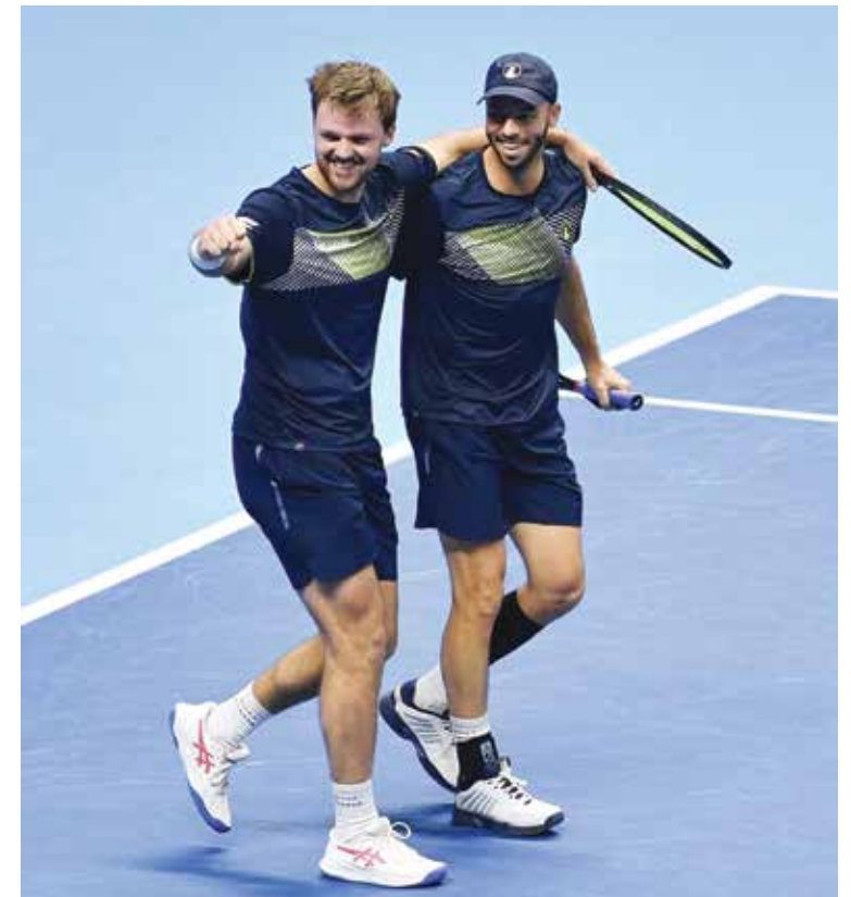
○ كرافيتس وبوتز.

ويتأهل الفائز من مواجهة ألمانيا وكندا لمواجهة إسبانيا يوم الجمعة المقبل في الدور قبل النهائي بالبطولة التي ستشهد وداع النجم الإسباني المخضرم رافايل نادال. وقال بوتز «بالتأكيد مواجهة إسبانيا ستكون بمثابة الكريمة على المعكة، ولكن لا تفكر في هذا الأمر، لأنه تنتظرنا مباراة صعبة أمام كندا».