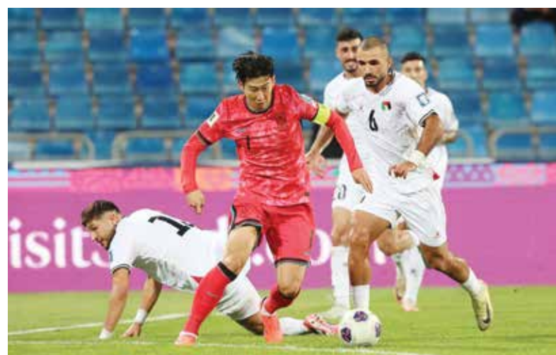
○ جانب من لقاء كوريا الجنوبية وفلسطين.

بكين - (د ب أ): عزز منتخب اليابان صدارته للمجموعة الثالثة بتصفيات آسيا المؤهلة لكأس العالم ٢٠٢٦ لكرة القدم في أمريكا والمكسيك وكندا، وذلك عقب فوزه على ضيفه الصيني ٣/١، أمس الثلاثاء،