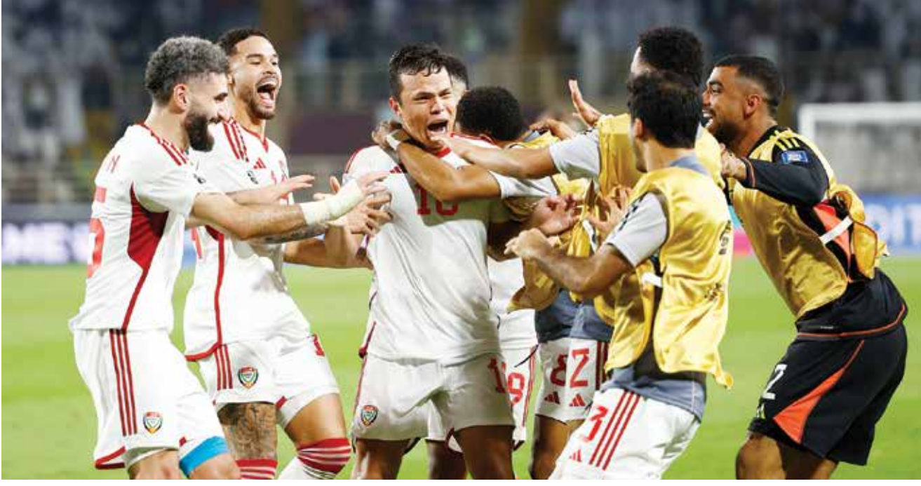
○ فرحة إماراتية.