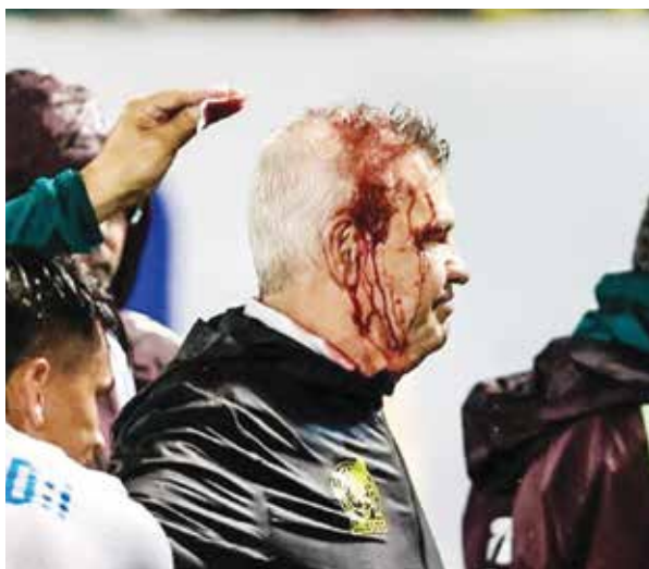
○ إصابة أجيري.

وأشاد مدرب منتخب المغرب بأداء اللاعبين والروح الجماعية والتأزر التي سادت أجواء الفريق طوال مسيرة التصفيات ونجاح المجموعة في تحقيق هدفها المتمثل في إنجاز تاريخي من خلال العلامة الكاملة برصيد كبير من الأهداف.