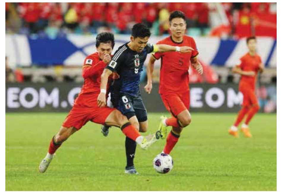
○ لقطة من المباراة.