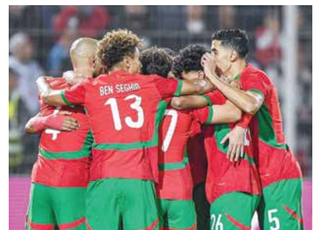
○ احتفالية الفوز على لیسوتو

شددت مدربة منتخب إنجلترا في حديثها، الذي نقلته وكالة الأنباء البريطانية (بي آيه ميديا) «بينما نواصل استعداداتنا، نريد اختبار أنفسنا ضد أفضل الفرق، ولهذا السبب اخترنا بعناية الولايات المتحدة وسويسرا. إنهما خصمان سيتحدا بطرق مختلفة في هذه النافذة وهذا هو بالضبط ما نريده».