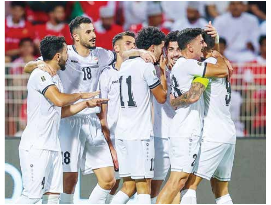
○ فرحة لاعبي العراق بالفوز.

جاكرتا - (أ ف ب): يبدو أن المنتخب السعودي دخل في نفق مظلم بعد سقوطه أمس الثلاثاء في جاكرتا أمام ضيفه الإندونيسي ٢-٠، وذلك في الجولة السادسة من منافسات المجموعة الثالثة للدور الثالث الحاسم من التصفيات الآسيوية المؤهلة إلى مونديال ٢٠٢٦. ودخل المنتخب السعودي إلى اللقاء على خلفية ثلاث مباريات من دون فوز في سلسلة بداها بخسارة أمام اليابان ٢-٠ على أرضه ثم بالتعادل السلبي مع كل من البحرين وأستراليا. وتأثر المنتخب السعودي بالتأكد باستمرار غياب نجم هجومه المصاب سالم الدوسري، بالإضافة إلى المخضرم سلمان الفرج ولاعب الوسط عبدالإله المالكي والمدافع عبدالإله العمري، كما يستمر غياب همد المولد الذي تعرض لحادث خطير بعد سقوطه عن شرفة منزله في دبي. وشهدت التشكيلة عودة