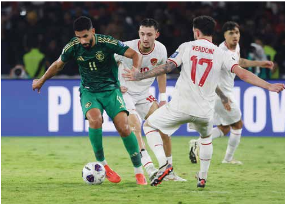
○ جانب من لقاء السعودية وإندونيسيا.

عن التعادل وترك خلفه الكثير من المساحات التي استغلها فردينان بالذات في الشوط الثاني ليضيف الهدف الثاني بعدما وصلته الكرة من كالفين فيرونك، فسدها في بادئ الأمر بالدفاع قبل أن تعود إليه ليطلقها في الشباك (٥٧). وحاول رونار تدارك الموقف، فجز بمصعب الجوير وعبدالله رديف بدلا من فراس البريكان وناصر الدوسري (٦١) ثم بسلمطان الغانم وصالح الشهري بدلا من فيصل الغامدي (٦٧) ياسر الشهري (٧٨) تواليا، لكن شيئا لم يتغير رغم بعض الفرص وأبرزها تسديدة صاروخية من خارج المنطقة لكن ارتدت من العارضة (٩٠+٧).