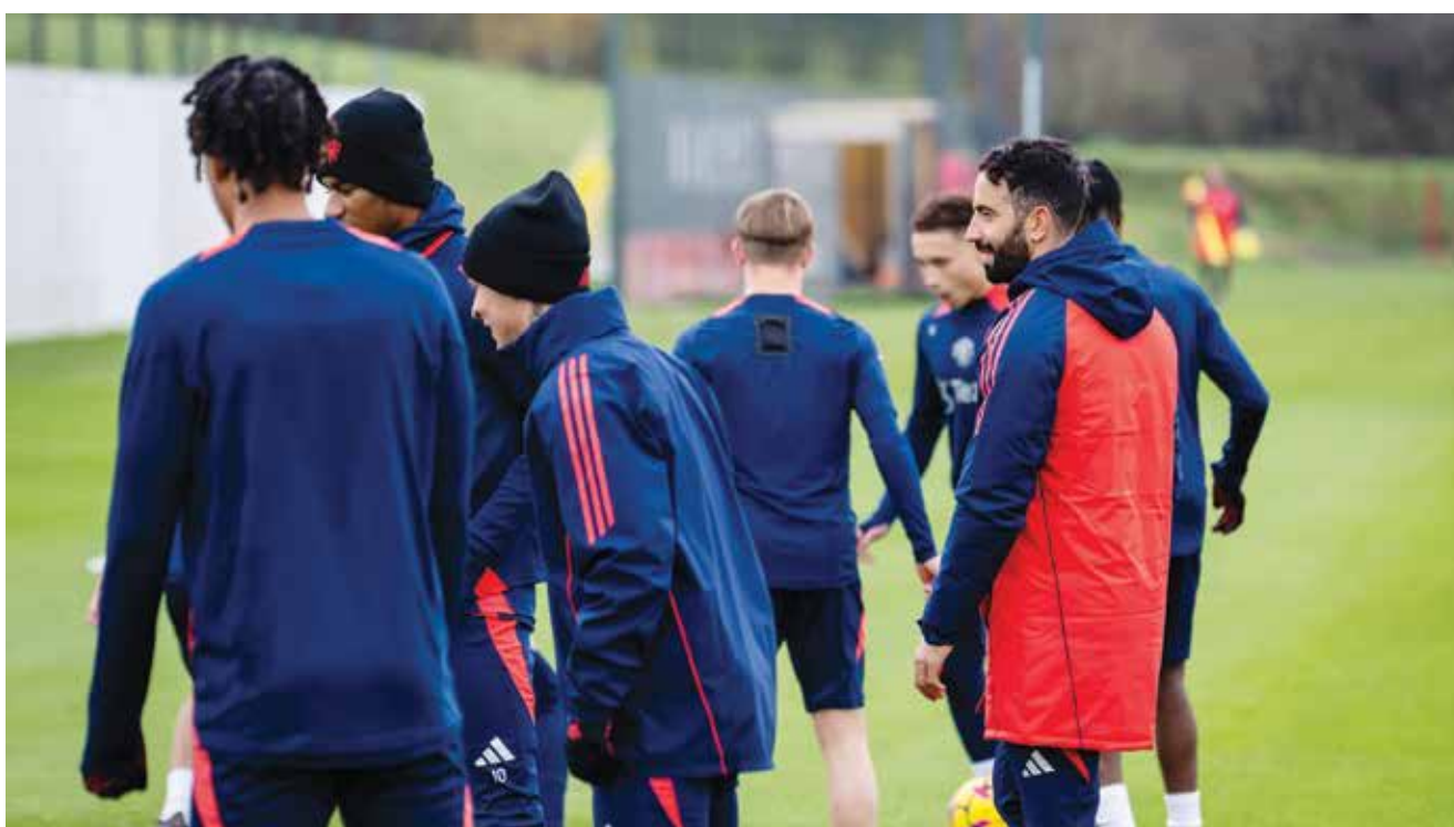
○ أموريم يتابع التدريبات

وسقط أجيري والدم ينزف من وجهه عندما تعرض للضرب أثناء اقترابه من رينالدو رويدا، مدرب منتخب هندوراس لمصافحته بعد انتهاء المباراة. وفتح اتحاد كونكاكاف تحقيقا، قبل أن يرفض عقوبة على هندوراس بسبب «فشلها في توفير تدابير أمنية كافية داخل الملعب». وحذر الاتحاد القاري أيضا من أنه ربما يتم فرض «عقوبات أكثر قسوة» إذا وقعت حوادث مماثلة في المباريات التي ستقام مستقبلا، حسبما أفادت وكالة الأنباء البريطانية (بي آيه ميديا).