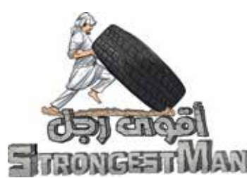
○ شعار البطولة.

وجهه سمو الشيخ خالد بن حمد آل خليفة النائب الأول لرئيس المجلس الأعلى للشباب والرياضة رئيس الهيئة العامة للرياضة رئيس اللجنة الأولمبية بتنظيم بطولة