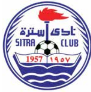
○ شعار نادي سترة.