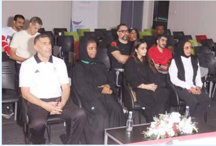
○ جانب من الحضور.