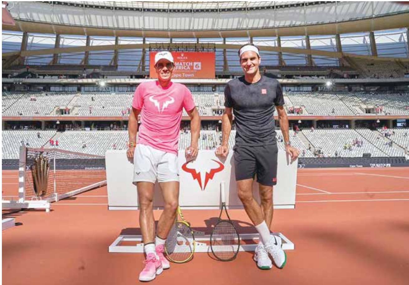
○ فيدرر ونادال

يذكر أن روبيري أصبحت الآن في الأربعين من عمرها، علماً بأنها أنهت مسيرتها الرياضية، وعملت كمديعة في أولمبياد باريس، حيث قامت بتحليل سباقات ألعاب القوى لصالح محطة (ان بي سي) التلفزيونية.