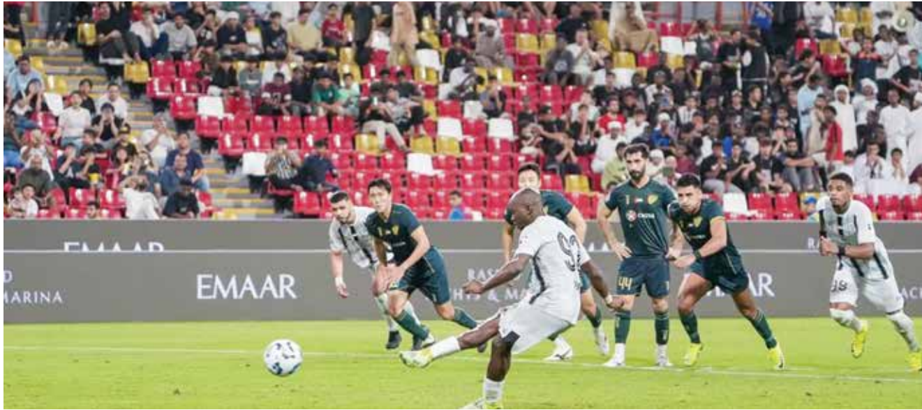
○ من مباريات الدوري.