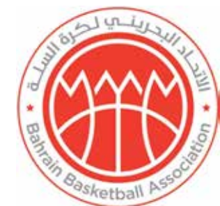
○ شعار اتحاد السلة.

تتواصل اليوم الأربعاء منافسات الجولة الثانية لكأس اتحاد السلة للموسم الرياضي ٢٠٢٤-٢٠٢٥، بإقامة مواجهتين ضمن الدور التمهيدي الأولى ستجمع بين الأهلي والنويدرات عند الخامسة والنصف مساءً، وفي المباراة الثانية مدينة عيسى في مواجهة النجمة عن الساعة السابعة والنصف مساءً.