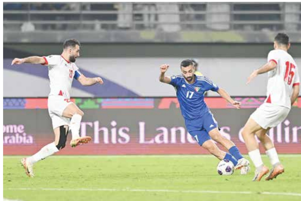
○ جانب من المباراة.

أما المنتخب الأردني فقد تراجع إلى المركز الثالث برصيد تسع نقاط.