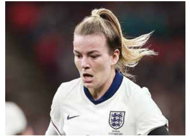
○ لورين هييمب.

لندن - (د ب أ): وقع مورجان روجرز، مهاجم فريق أستون فيلا، عقدا جديدا مدة ست سنوات مع النادي المنافس ببطولة الدوري الإنجليزي الممتاز لكرة القدم. ومن المقرر أن يبقى روجرز الآن في ملعب (فيلا بارك) حتى عام ٢٠٣٠، ليختتم أسبوعا ممتازا شهد ظهوره لأول مرة مع منتخب إنجلترا الأول في لقائه ضد اليونان،