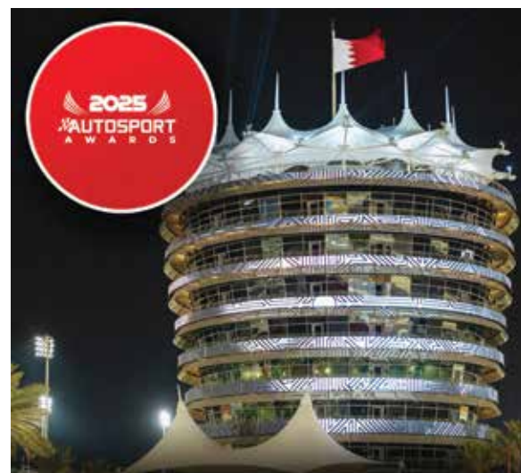
○ مجلة «أوتوسبورت».

وجدير بالذكر أن حفل توزيع جوائز «أوتوسبورت» يحضره كل عام أبرز نجوم رياضة السيارات والمشاهير وكبار الشخصيات في أمسية ساحرة للاحتفال بصناعة رياضة السيارات، حيث يتم تقديم العديد من الجوائز للسائقين والمهندسين والرعاة والحلبات ولجميع الذين برزوا خلال مختلف البطولات للموسم السابق.