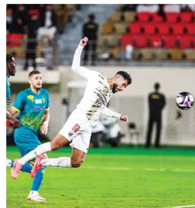
○ جانب من لقاء الاتحاد والعروبة.