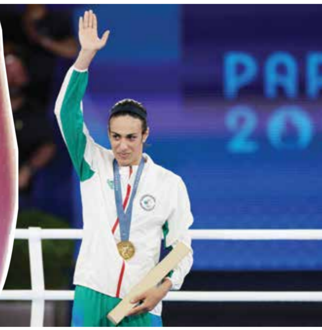
○ إيمان خليف

أنها «تشعر بالحزن بسبب الإساءات التي تلقاها إيمان خليف حالياً».