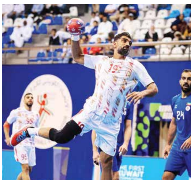
○ جانب من اللقاء.