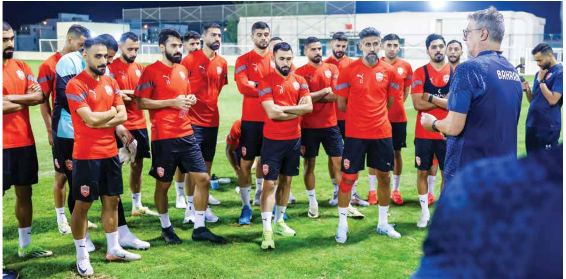
○ جانب من تدريب المنتخب.