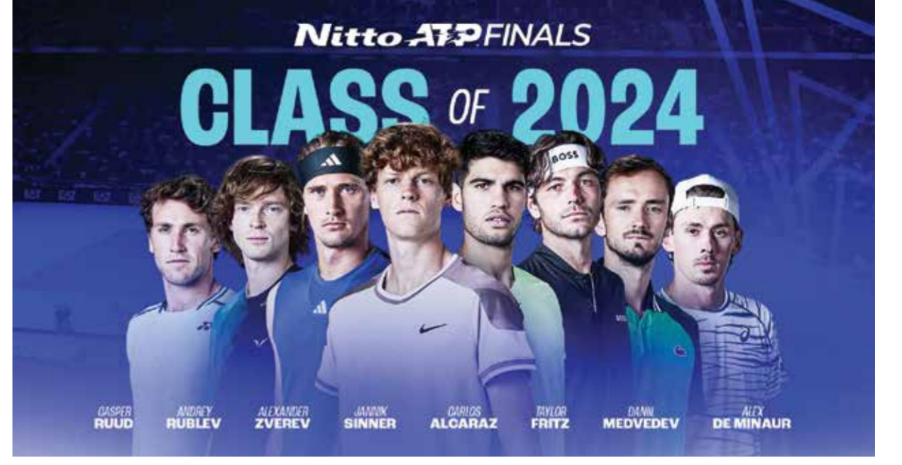
○ المشاركون في الجولة الختامية.

وجاء في رسالة مفتوحة من رابطة سائقي سباقات الجائزة الكبرى: «هناك فرق بين الشتائم التي تهدف إلى إهانة الآخرين والمزيد من الشتائم غير الرسمية، مثل الذي قد يستخدم المرء لوصف الطقس السيء أو حتى لوصف شيء غير حي مثل سيارة فورمولا-١، أو موقف السائق».