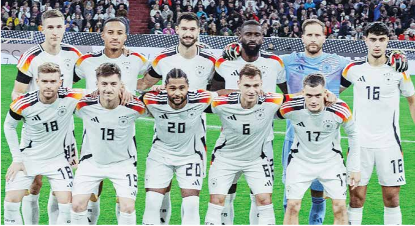
○ المنتخب الألماني

برلين - (د ب أ): يرى توني كروس أن المنتخب الألماني عاد إلى الوجود ضمن الفرق الكبرى في العالم، ولكنه شدد على أن من المبكر للغاية وضع آمال كبيرة على الفوز بلقب كأس العالم.