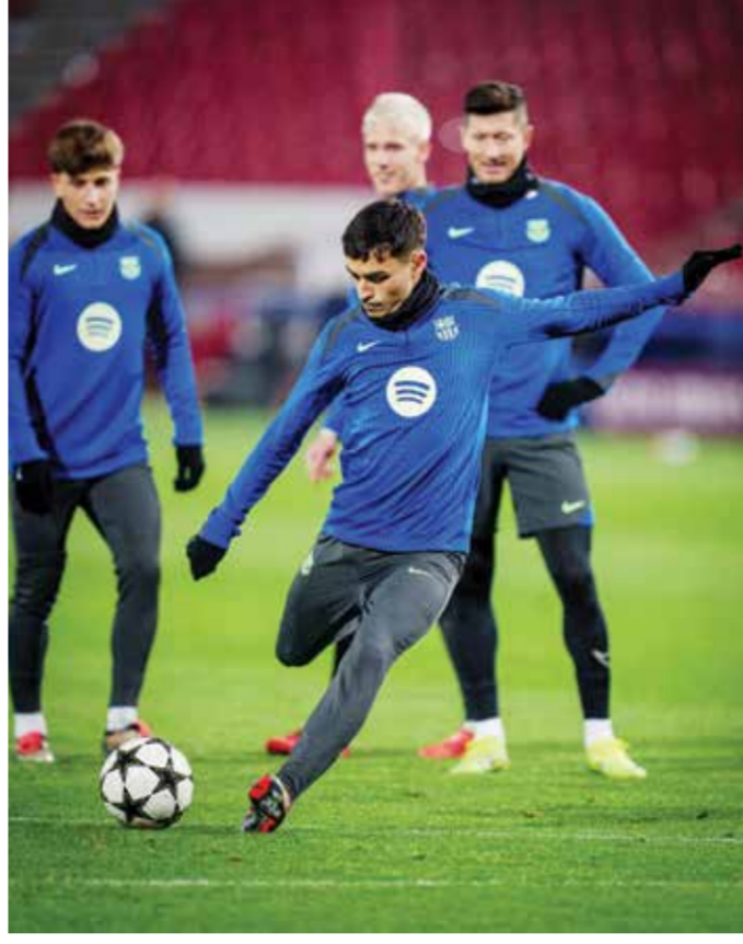
○ تدريبات برشلونة.