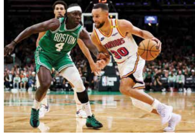
○ كوري يقود فريقه للفوز

ورفع ووريزر رصيده إلى سبعة انتصارات مقابل خسارة واحدة، بالتساوي مع فينيكس صنز وأوكلاهوما في صدارة المنطقة الغربية. على ملعب تي دي غاردن في بوسطن، كانت الفرصة مناسبة لتايتوم في توجيه رسالة لإبقائه بديلاً في تشكيلة المنتخب