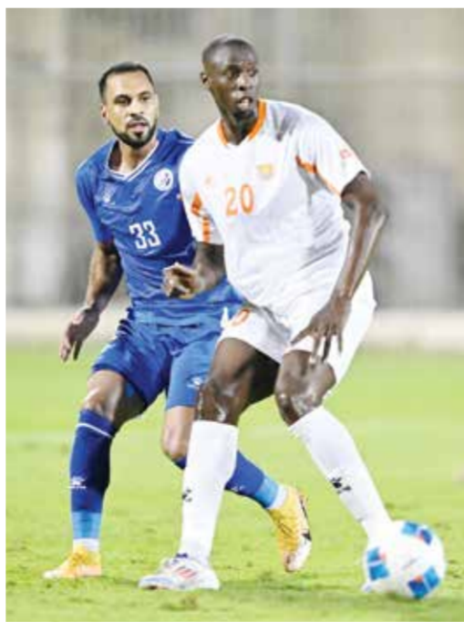
الحالة يتصدر مؤقتاً.