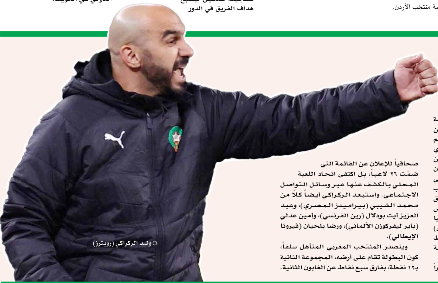
○ وليد الركراكي (رويترز)