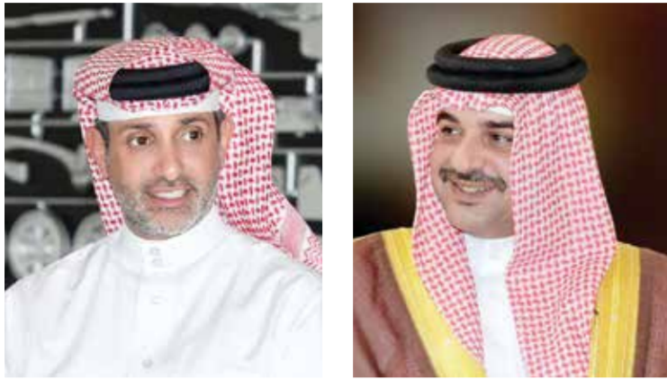
○ سمو الشيخ عبدالله بن حمد آل خليفة. ○ الشيخ سلمان بن عيسى آل خليفة.