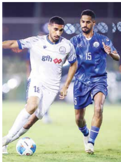
لقطة من مباراة الحد والبسيتين.