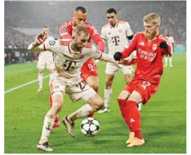
○ من لقاء بايرن ميونيخ وبنفيكا.

وقاد كريسيو (٤٩ عاماً) العين في الموسم الماضي للقب دوري أبطال آسيا للمرة الثانية في تاريخه، لكن الفريق عانى محلياً وخرج من كافة المسابقات خالي الوفاض وأنهى الدوري في المركز الثالث بفارق ٢٢ نقطة عن الوصل البطل. كما لم تكن بداية العين في الموسم الحالي مثالية، حيث تراجع إلى المركز الثامن برصيد ٨ نقاط بعد ٥ مباريات، وفشل في الفوز في ٤ مباريات بدوري أبطال آسيا للدرجة وخسر في آخر ٣ مباريات تالياً.