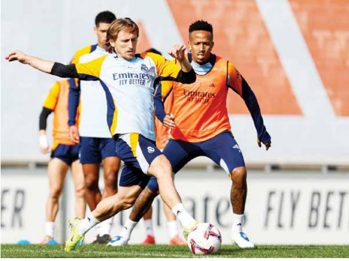
○ تحضيرات ريال مدريد.