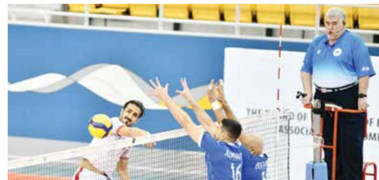
من لقاء الكويت وعمان