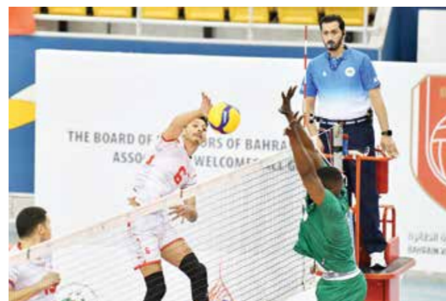
من لقاء المنتخبين التونسي والسعودي

تشهد منافسات النصف النهائي من بطولة المنتخبات العربية ٢٣ لكرة الطائرة مواجهة حامية، وتجمع المنتخبين التونسي والقطري في الساعة في تمام الساعة ٨:٠٠ مساء. وكان منتخب نسور قرقطاج قد تفوق على المنتخب السعودي في لقاء دور الربع النهائي بثلاثة أشواط مقابل لا شيء ٢٥-٢٢، ٢٥-١٥، وفي الوقت الذي كان فيه الشوط الأول والثالث قد جاء متكافئين قدم فيهما السعوديون أفضل أداء لهم حتى الآن. فإن التونسيين قد بسطوا أفضليتهم على الشوط الثاني. وفاز المنتخب القطري في الدور نفسه على المنتخب العراقي بثلاثة أشواط مقابل شوط ٢٥-٢٣، ٢٥-٢٥، ٢٥-٢٧، ٢٥-١٣، وكان المنتخب العراقي سباقاً إلى التقدم بالشوط الأول، قبل أن يعود زملاء رينان قائد قطر إلى أجواء الأشواط الثلاثة الأخيرة. وبهذه الخسارة التي تعرض لها المنتخب العراقي، فإنه سيقابل منتخب السعودية في الساعة مساء ٤:٠٠ لتحديد المراكز ٥-٨.