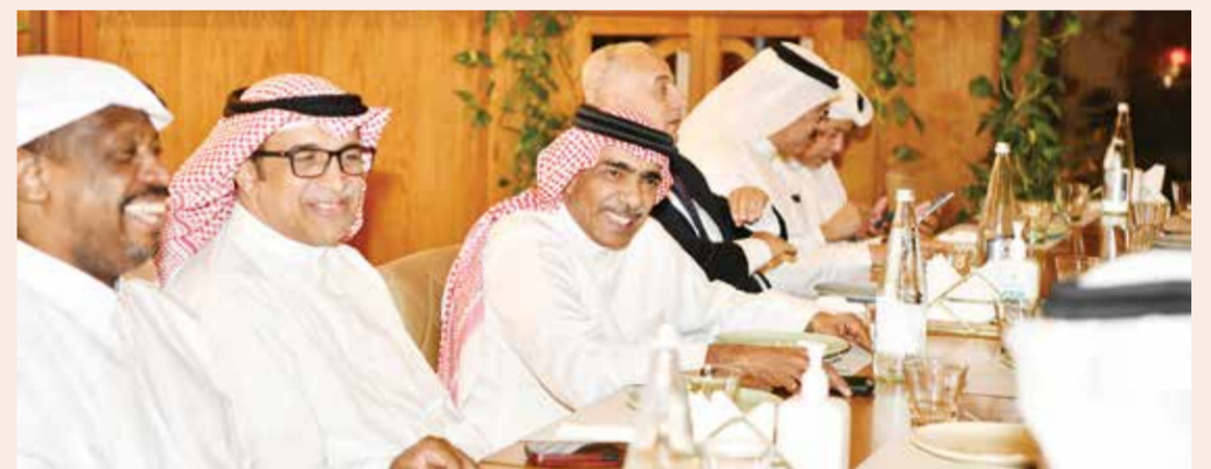
جانب من جلسة العشاء

وحضر حفل العشاء الشيخ علي بن محمد آل خليفة رئيس الاتحادين العربي والبحريني لكرة الطائرة والأمين العام للاتحادين العربي والبحريني فراس الحلواجي ورئيس لجنة الاحتكام خالد عبدالله ورؤساء وممثلو الوفود العربية المشاركة ورؤساء اللجان العاملة.