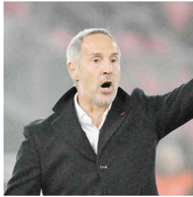
○ أدي هوتر (رويتز)

تابع «أنا سعيد برد فعل الفريق. لا يجب أن ننسى أن فريق مرسيليا هذا، قد ولد قبل شهرين».