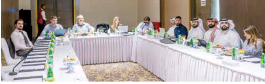
○ من اجتماعات الوفد.

شهدت منافسات دور الثمانية أجواءً حماسية وإثارة داخل وخارج حلبات النزاع، فقد كانت المستويات الفنية التي قدمها اللاعبون عالية خلال النزاعات، والتي كانوا يبحثون من خلالها للتأهل إلى دور نصف النهائي، في المقابل كان الحماس حاضراً في مدرجات صالة «هوميو أرينا»، من قبل المشجعين وخاصة من مشجعي المنتخب الأوزبكي، الذين أزروا وبقوة لاعبي منتخبهم في هذه النزاعات.