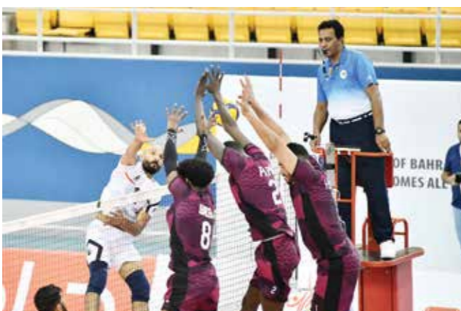
حائط صد ثلاثي قطري أمام العراق