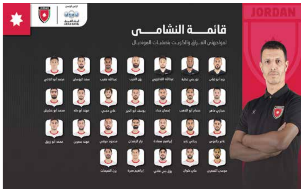
○ قائمة منتخب الأردن.