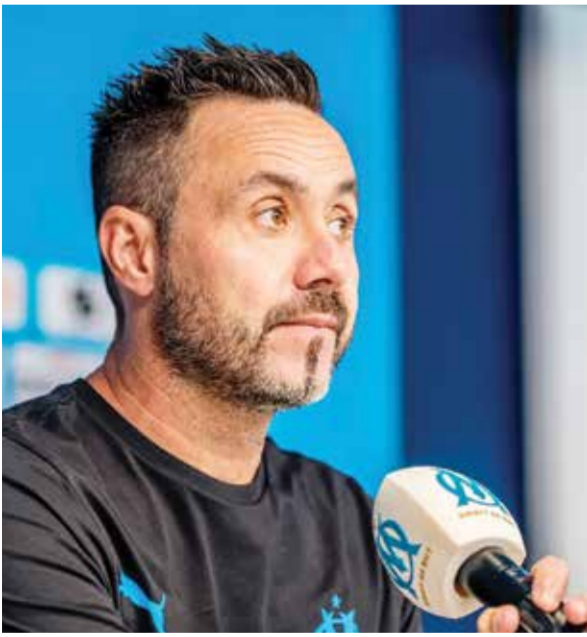
○ دي تيزيري