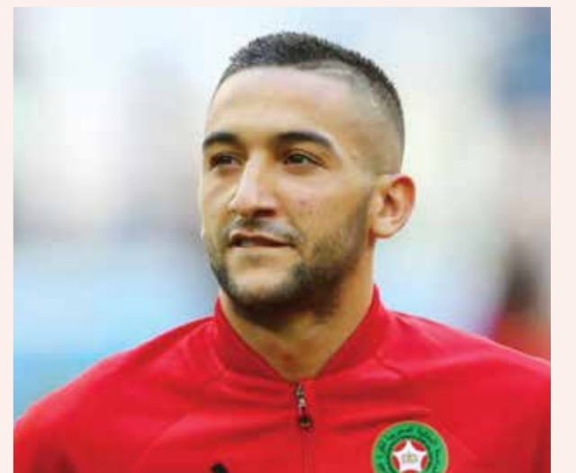
○ حكيم زياش

من بعدها في مباراتين ضمن الدوري ومسابقة الدوري الأوروبي (يوروبا ليغ). وبخلاف العادة، لم يعقد الركراكي مؤتمراً