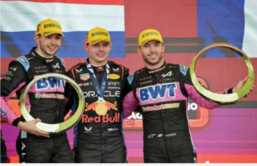
○ فيرستابن وسائقو الفورمولا يحتفلون بجائزة البرازيل.

لندن - (د ب أ): طلب سائقو بطولة العالم لسباقات سيارات فورمولا-١ من الاتحاد الدولي لسباقات السيارات (فيا) معاملتهم كناضجين وسط تصاعد الخلافات في البطولة، كما طالبوا رئيس الاتحاد محمد بن سليم بالتفكير مليا في الكلمات التي يتفوه بها.