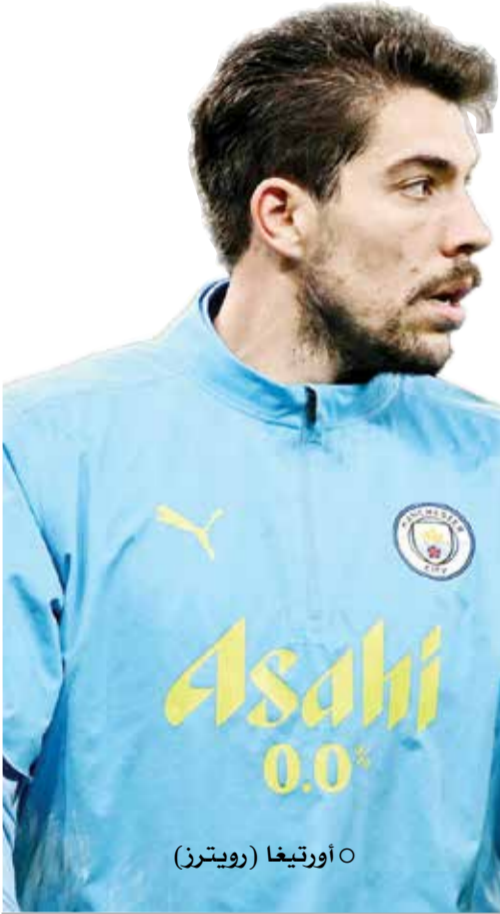
○ أورتيجا (رويترز)

ولم يشارك براندت مع المنتخب الألماني منذ نوفمبر العام الماضي، فيما نال نيمشا دعوته الدولية الأولى تحت قيادة المدرب السابق هانزي فليك في مارس الماضي.