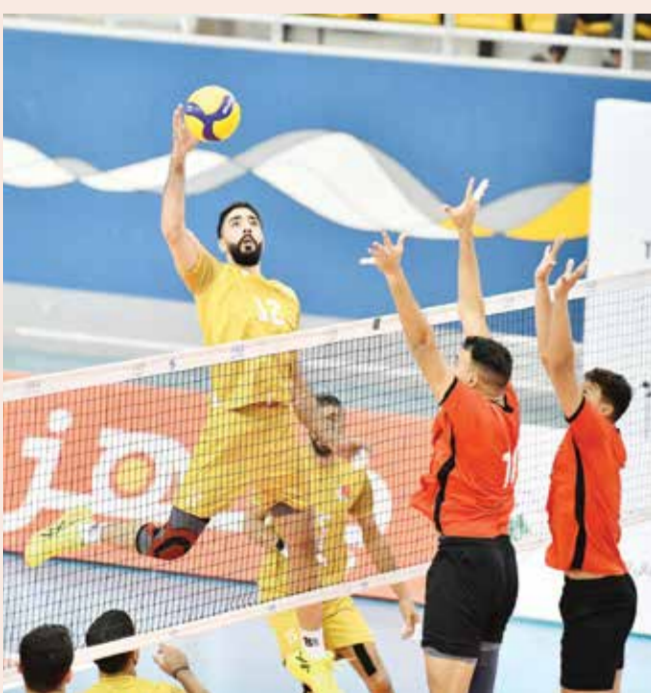
○ جانب من مباراة المنتخب أمام الأردن.

نقاط لرصيده ليصبح ٢١ نقطة في المركز الثالث بعد فوزه على حساب مضيفه فريق الخلود الخامس عشر برصيد ٧ نقاط. بهدف المغربي عبد الرزاق حمد الله، بينما يحتل الخلود المركز الخامس عشر برصيد ٧ نقاط.