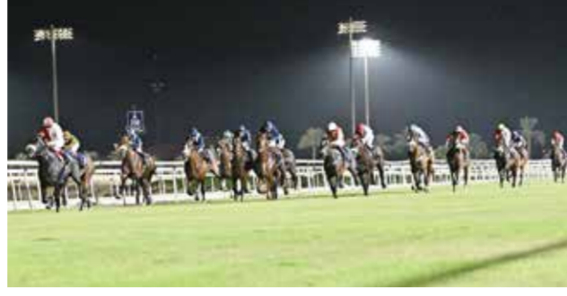
منافسات قوية يشهدها السباق الثاني للخيل.

مخصص لخيال قريه الفعاليات الترفيهيه بتصميم فريد، وستكون مفتوحة للجمهور خلال أيام السباقات الأسبوعية طوال الموسم، مع توفير أجواء مسائية خاصة. يمكن للراغبين شراء تذاكر الدخول عبر الموقع الإلكتروني bahrainturfclub.com..