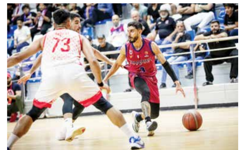
○ لقطة من المباراة.

خسر الفريق الأول لكرة السلة بنادي المنامة أمام ضيفه العربي القطري بالمباراة التي أقيمت على صالة اتحاد السلة بأم الحصم ضمن دوري غرب آسيا لكرة السلة (واصل) بنتيجة ٨٥/٨٤. وجاءت نتائج الفترات كالتالي: الفترة الأولى ١٥/٢٦ لصالح المنامة، والفترة الثانية ٢٥/٢٥ للعربي، والفترة الرابعة ١٩/٢٥ لصالح العربي.