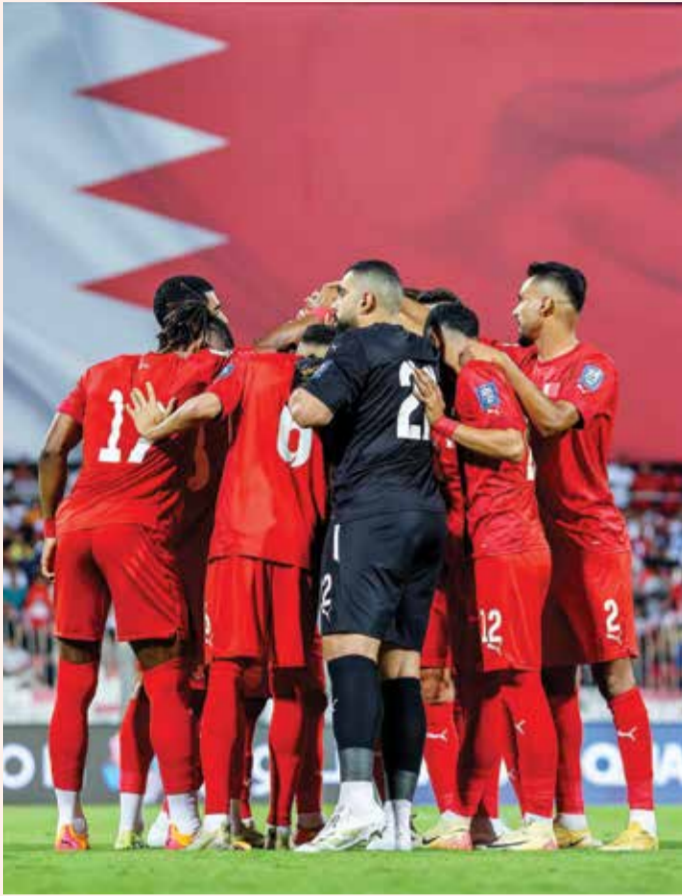
○ منتخبنا الوطني في مواجهة إندونيسيا

وأشاد سموه، بجهود سمو الشيخ خالد بن حمد آل خليفة النائب الأول لرئيس المجلس الأعلى للشباب والرياضة رئيس الهيئة العامة للرياضة رئيس اللجنة الأولمبية البحرينية في مواصلة ارتقاء الرياضة البحرينية والترويج المستمر لمكانة المملكة عبر احتضان البطولات العالمية والأقليمية والتأكيد المستمر على القدرة بنجاح كافة الفعاليات الرياضية التي تقام على أرض المملكة. ووجه سمو الشيخ ناصر بن حمد آل خليفة، الاتحاد البحريني لرفع الأثقال برئاسة السيد إسحاق إبراهيم إسحاق في الاستعداد الأمثل للبطولة والحرص على إخراجها بأزهى صورة تنظيمية تؤكد التطور الذي تسير عليه المملكة في احتضان البطولات العالمية.