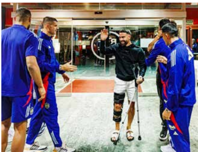
○ كارفاخال يزور بعثة المنتخب.

لندن - (د ب أ): خضع داني كارفاخال، لاعب فريق ريال مدريد الإسباني لكرة القدم، لعملية جراحية لعلاج الإصابة الخطيرة في أربطة الركبة، التي تعرض لها في المباراة التي فاز فيها فريقه مؤخراً على فياريال.