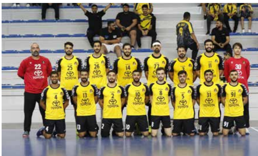
○ فريق الأهلي