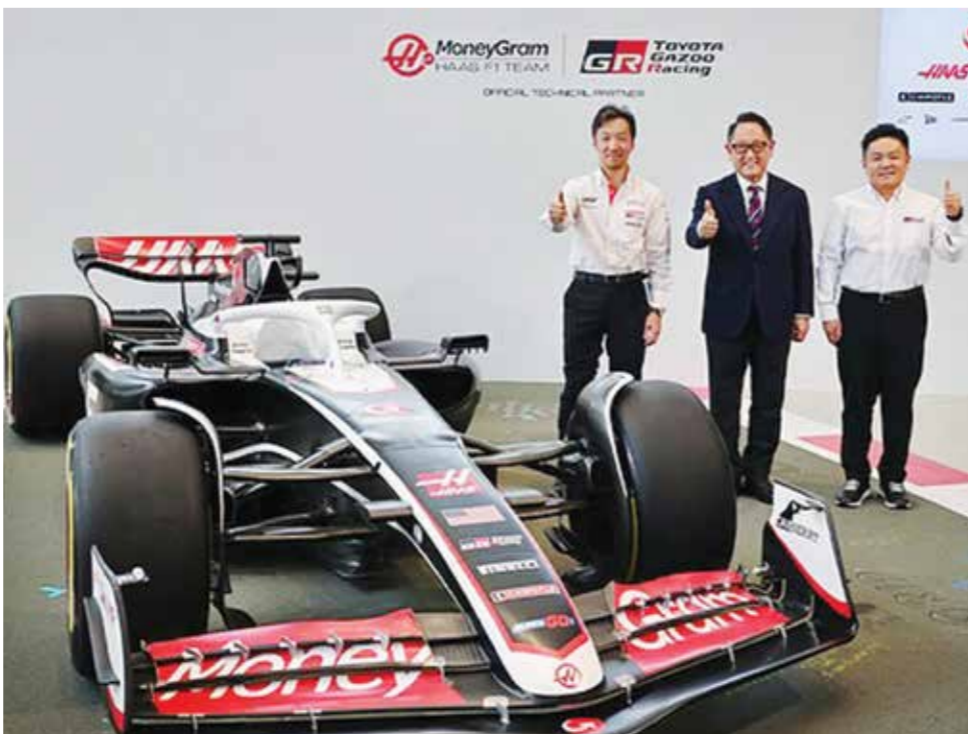
○ تويوتا تعود إلى الفورمولا ١

وسيدافع عن ألوان فريق هاس العام المقبل السائق الفرنسي إستيبان أوكون (٢٨ عاماً) الذي وقع معه عقداً سنوات عدة على أن ينتقل إلى صفوفه بعد مغادرته ألبين نهاية العام الحالي، ليترافق الوافد الجديد أيضاً الشاب البريطاني أوليفر بيرمان (١٩ عاماً).