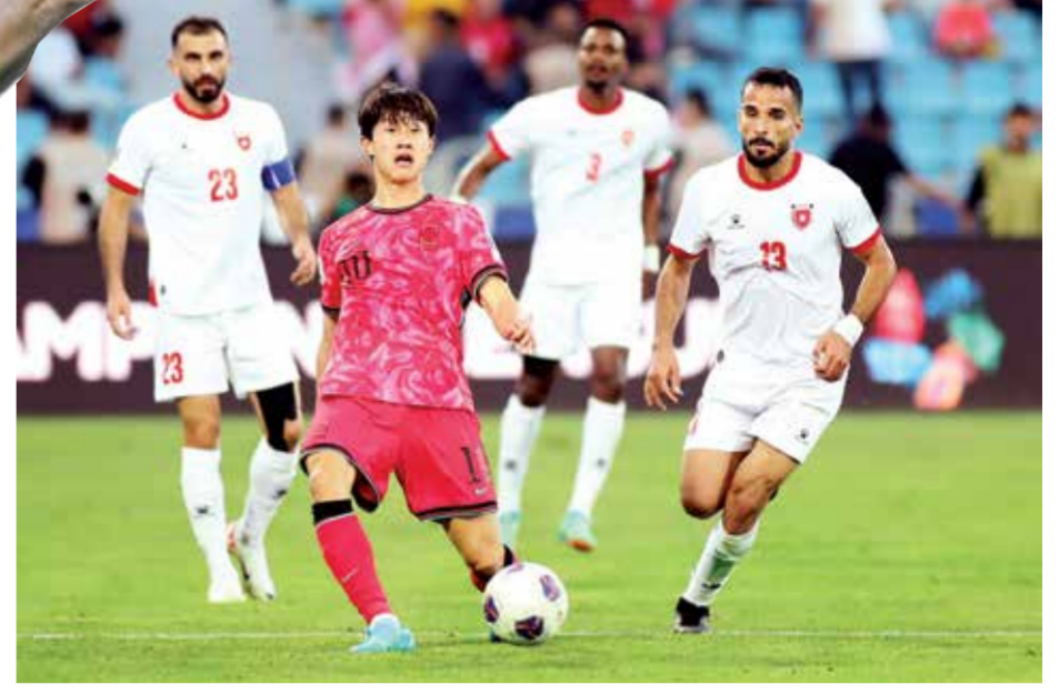
○ من لقاء كوريا الجنوبية والأردن