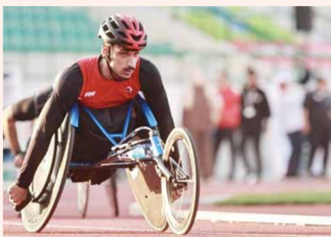
○ استعدادات مكثفة للمنتخب البارالمبي.

وقال النشيط في تصريح خاص لخبير الخليج الرياضي: «الفريق يسير في نسق تصاعدي منذ الجولة الأولى من الدوري، واستطاع اللاعبون تقديم