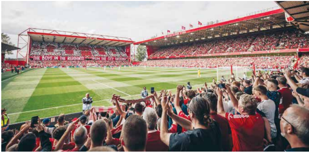
○ ملعب نوتنغهام

وظهرت جماهير أتلتيكو تصرفات عنصرية أو تمييزية، خلال خسارة فريقه ٤-٠ صفر من بنفيكا البرتغالي في دوري أبطال أوروبا الأسبوع الماضي. كما منع أندريخت البلجيكي من بيع تذاكر لجماهيره خارج ملعبه لمباراته في الدوري الأوروبي أمام فريق أرياف. إس في لانزيا في السابع من نوفمبر بعدما قرر اليويفا تطبيق «الإجراء التأديبي المعلق الذي فرض في ٢١ أكتوبر ٢٠٢٢ لإشعال الألعاب النارية وإلقاء الأشياء وأعمال التخريب واضطرابات الجماهير».