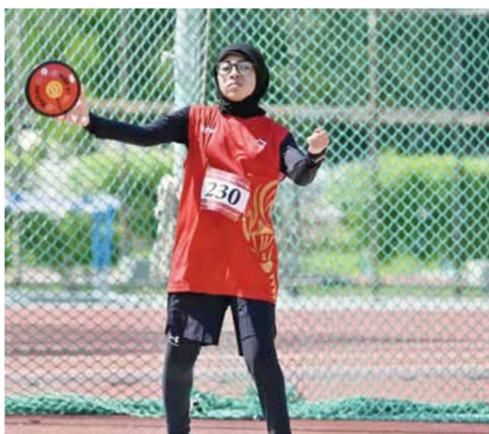
○ استعدادات مكثفة للاعبين المنتخب البارالمبي

وجاءت قائمة الفنادق التي وقع الاختيار عليها كالتالي: فندق ذا آرت، فندق ويندهام، فندق ذا كي، فندق جولدن تويليب، فندق ذا سفن، فندق سيتي سنتر، فندق ديفا، فندق آرمان، فندق المنزل، فندق IBIS، فندق رامي بالاس، فندق فراسر سويتس، فندق رامي جاردن، فندق سويس بيل سيف، فندق جلف كورت، فندق أورنج سويتس، فندق رامادا النمامة، فندق جلف، نوفوتيل، فندق سويس بيل، وفندق لي