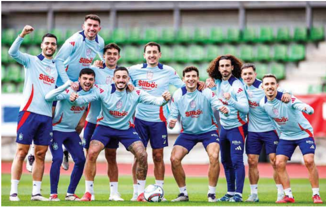
○ تدريبات إسبانيا.