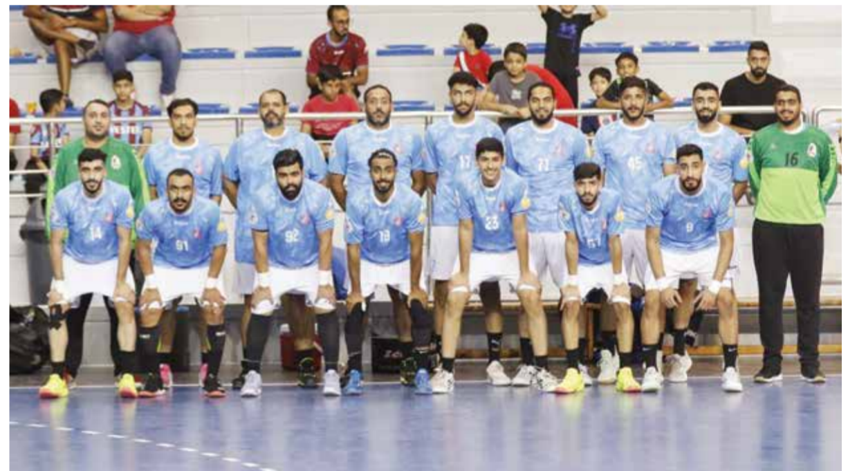
○ فريق الشباب