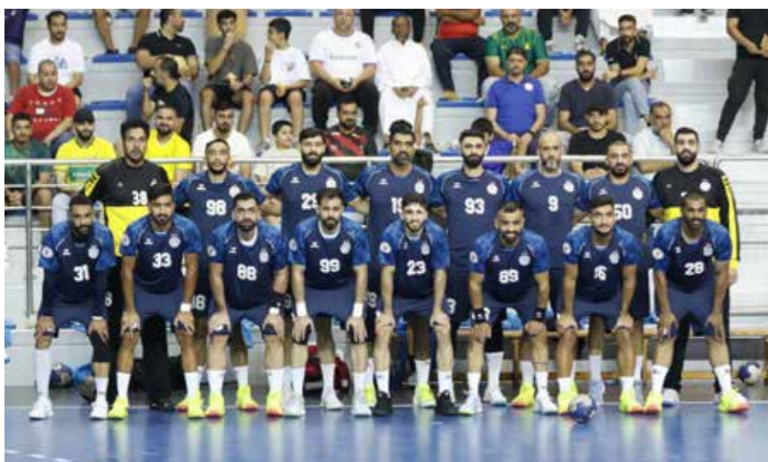
○ فريق النجمة