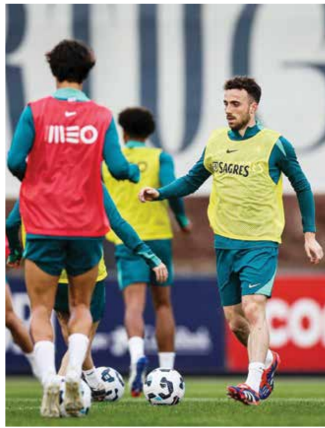
○ استعدادات البرتغال.