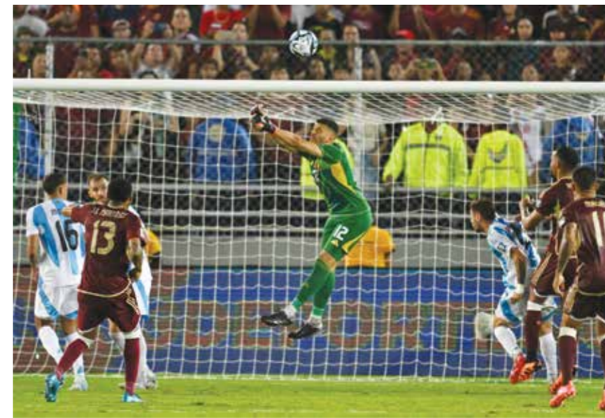
○ من مباراة الأرجنتين وفنزويلا

لمباراة الثانية تواليا فافتتحت بنقطة واحدة أبقتهما في الصدارة وعلى المسار الصحيح نحو التأهل إلى نهائيات ٢٠٢٦ بعدما رفعت رصيدها إلى ١٩ نقطة، مستغلة خسارة مباراتها المباشرة كولومبيا أمام مضيفتها بوليفيا ١-٠ سجله ميغيل تيرسيروس «ميغيليتو»، في الدقيقة ٥٨ في مباراة أقيمت في مدينة إل اتو التي تقع على ارتفاع