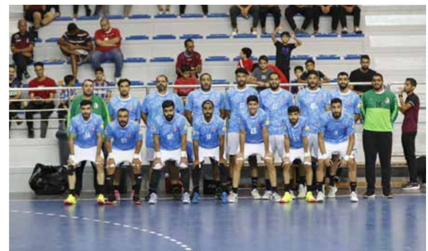
○ فريق الشباب