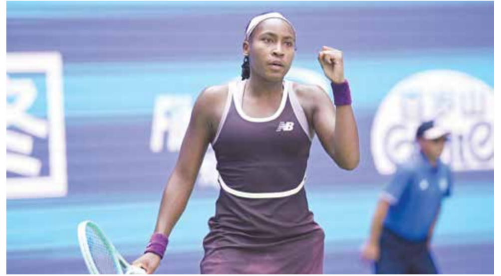
○ غوف. (أ ف ب)