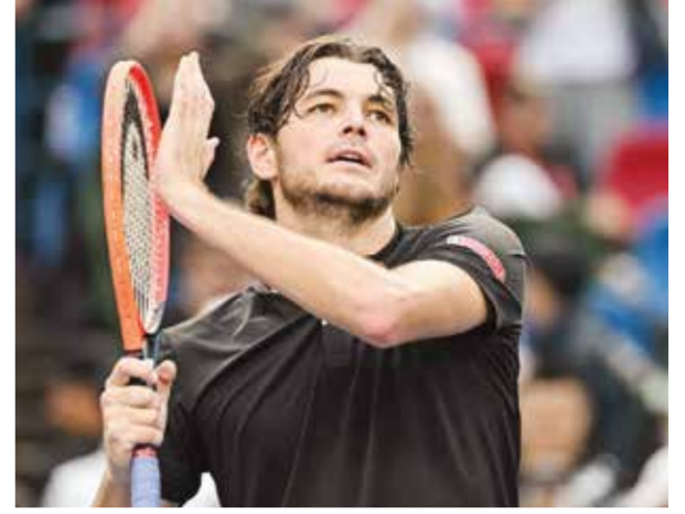
○ فريتس (أ ف ب)

وقال النادي الملكي في بيان إن «الحفلات الموسيقية في ملعب سانتياغو برنابيو لا