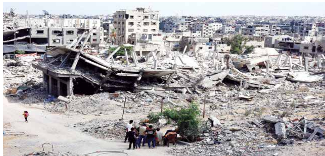
○ استمرار العدوان الإسرائيلي على غزة يضع العراقيل أمام حملة التطعيم الجديدة ضد شلل الأطفال.

الذي خلف ١٢٠٦ قتلى في الجانب الإسرائيلي. وأسفر القصف الإسرائيلي والعمليات البرية للجيش ردا على الهجوم عن سقوط ٤٢١٢٦ قتيلًا على الأقل في القطاع المحاصر والمدمر وفق آخر حصيلة أصدرتها وزارة الصحة التابعة لحماس.