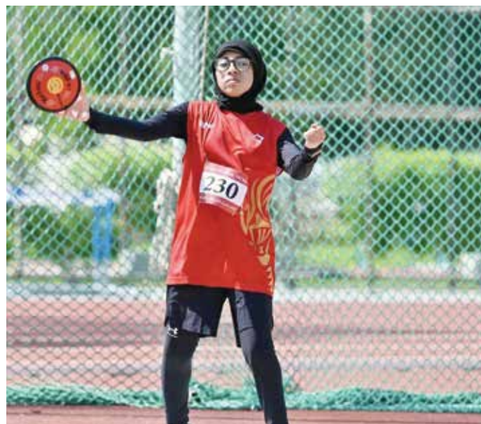
○ استعدادات مكثفة للاعبين المنتخب البارالمبي

وجاءت قائمة الفنادق التي وقع الاختيار عليها كالتالي: فندق ذا آرت، فندق ويندهام، فندق ذا كي، فندق جولدن تويليب، فندق ذا سفن، فندق سيتي سنتر، فندق ديفا، فندق آرمان، فندق المنزل، فندق IBIS، فندق رامي بالاس، فندق فراسر سويتس، فندق رامي جاردن، فندق سويس بيل سيف، فندق جلف كورت، فندق أورنج سويتس، فندق رامادا النمامة، فندق جلف، نوفوتيل، فندق سويس بيل، وفندق لي