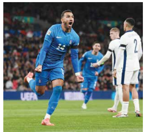
○ بافليديس (أ ف ب)

وتشغل ريد بول في العديد من المسابقات الرياضية إلى جانب كرة القدم، أبرزها بطولة العالم للفرمولو واحد مع فريق ريد بول ريسينغ المتوج بلقبين السابقين في الاعوام الثلاثة الماضية مع الهولندي ماكس فيرستابن، والصانعين في العامين الماضيين.