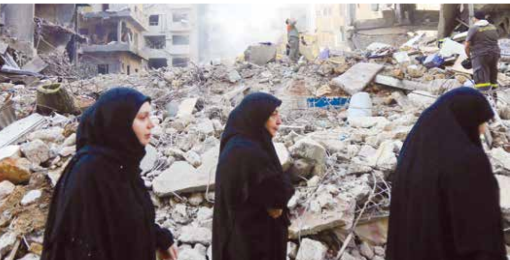
○ إسرائيل تخير اللبنانيين بين الانتفاض ضد حزب الله أو مواجهة الدمار. (أ ف ب)

الانتفاضة ضد حزب الله وإما إلى مواجهة الدمار مثل غزة، تنطوي على مخاطر أن يفهم منها على أنها تشجع أو تقبل العنف الموجه ضد المدنيين والأهداف المدنية، في انتهاك للقانون الدولي». كما نددت بالتشهير المستمر بالأمم المتحدة، وخصوصا الأونروا، والوكالة التابعة للأمم المتحدة والتي تخفت نحو ستة ملايين لاجئ فلسطيني منتشرين في غزة والضفة الغربية والأردن ولبنان وسوريا، ووصفته بأنه «غير مقبول». وقالت: «يجب أن يتوقف هذا النوع من الخطاب السام، من أي مصدر». وتشوب الخلافات منذ مدة طويلة العلاقة بين إسرائيل والأونروا، إذ تتهم الدولة العبرية الوكالة الأممية بأن بعض موظفيها شاركوا في