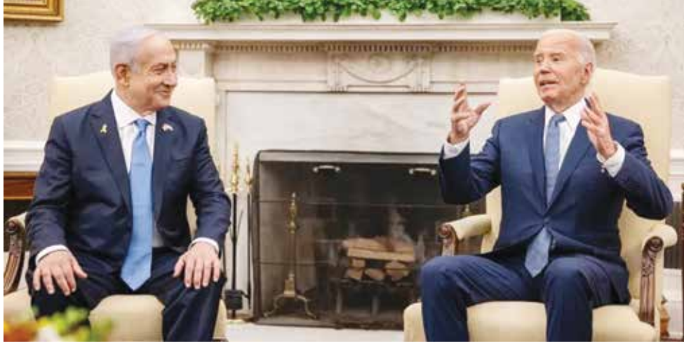
○ بايدن ونتنياهو خلال لقاء بالبيت الأبيض بواشنطن. (أرشيفية)