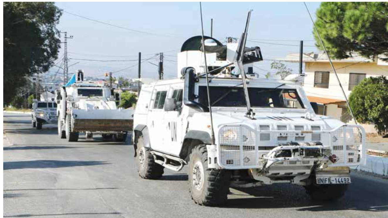
○ تنديد دولي بالهجمات الإسرائيلية على قوات اليونيفيل.