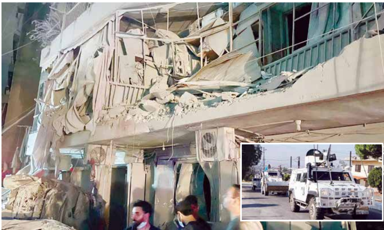
○ أحد المواقع المدمرة جراء الهجمات الإسرائيلية على لبنان.. وفي الإطار قوات اليونيفيل التي استهدفتها إسرائيل للمرة الثانية.

للحجرة التابعة للأمم المتحدة من أن نزوح مئات الآلاف من الأشخاص في لبنان «كارثي»، مشيراً إلى أن الدعم الدولي