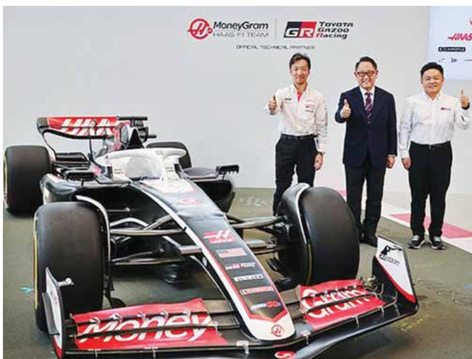
○ تويوتا تعود إلى الفورمولا ١