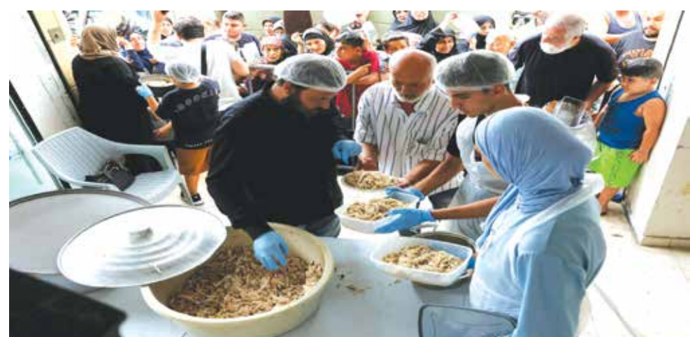
○ موجة النزوح الكبيرة تتطلب احتياجات ضخمة.

بيروت - (أ ف ب): حذر مسؤول في المنظمة الدولية للهجرة التابعة للأمم المتحدة من أن نزوح مئات الآلاف من الأشخاص في لبنان «كارثي»، مشيرا إلى أن الدعم الدولي لا يتناسب مع الاحتياجات، وسط قصف إسرائيلي يومي منذ أكثر من أسبوعين. وقال المدير الإقليمي للشرق الأوسط وشمال إفريقيا في المنظمة عثمان البليسي «مع هذه الموجة من النزوح، نرى احتياجات ضخمة... الوضع كارثي». كثفت إسرائيل غاراتها الجوية على لبنان منذ ٢٣ سبتمبر، مستهدفة ما تقول إنها بنى تحيية ومنشآت تابعة لحزب الله في جنوب لبنان وشرقه وضاحية بيروت الجنوبية. ومذاك، أدى القصف المتواصل إلى مقتل أكثر من ١٢٠٠ شخص ونزوح قرابة مليون آخرين. وقال البليسي لوكالة فرانس برس خلال زيارة لبيروت الخميس «لبنان يحتاج إلى مزيد من الدعم». ما تم تقديمه حتى الآن ضئيل ولا يتناسب مع الاحتياجات». بدأت المواجهات بين إسرائيل وحزب الله غداة اندلاع العدوان الإسرائيلي على قطاع غزة أكتوبر ٢٠٢٣ مع فتح الحزب اللبناني «جبهة إسادة» للقطاع. وأوضح عثمان البليسي أن المنظمة الدولية للهجرة «تحققت وتبعت» نحو ٦٩٠ ألف نازح في لبنان، مشيرا إلى أن نحو ٤٠٠ ألف آخرين غادروا البلاد، كثير منهم إلى سوريا المجاورة. ووفق الحكومة والمنظمة الدولية للهجرة، يعيش نحو ربع النازحين (أكثر من ١٨٥ ألف شخص) في لبنان، في مراكز إيواء رسمية مثل