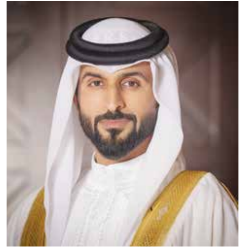
○ سمو الشيخ ناصر بن حمد آل خليفة

تحت رعاية سمو الشيخ ناصر بن حمد آل خليفة ممثل جلالة الملك للأعمال الإنسانية وشؤون الشباب، رئيس المجلس الأعلى للشباب والرياضة، تحتضن مملكة البحرين منافسات بطولة العالم لرفع الأثقال التي ستقام خلال الفترة من ٤ حتى ١٥ ديسمبر القادم، بمشاركة نحو ١٠٠٠ لاعب يمثلون ١١٤ دولة حتى الآن. ويهذه المناسبة، أكد سمو الشيخ ناصر بن حمد آل خليفة أن استضافة المملكة لبطولة العالم لرفع الأثقال تجسد الرعاية الملكية الفائقة التي تحظى بها الرياضة البحرينية من لدن سيدي حضرة صاحب الجلالة الملك حمد بن عيسى آل خليفة ملك البلاد المعظم في جعل مملكة البحرين قبلة رياضية لاحتضان مختلف الفعاليات وتساهم في