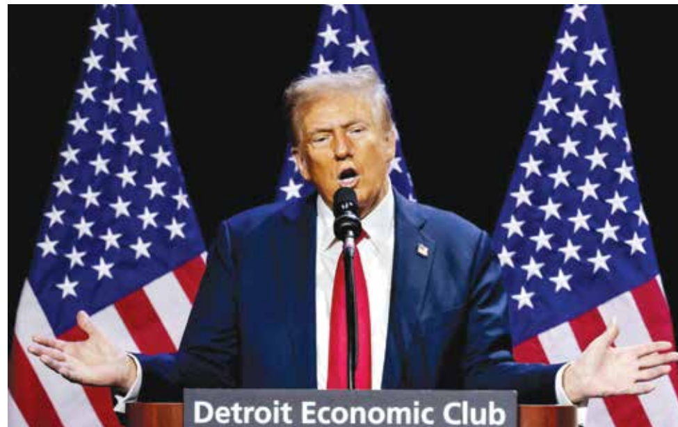
○ دونالد ترامب. (رويترز)

ويتابع «قد يشعر الناس وكأنهم مرغمون على قراءة منشوراته عند الاستيقاظ صباحا، في حين تتجاوز بعض المنشورات الحد الأقصى المسموح به على «تروث سوشال»، وهو ألف حرف، يأتي بعضها موجزا. وكنت مرة «أنا أكره تابلور سويت»، في انتقاد لنجمة موسيقى البوب التي تدعم كامالا هاريس بشكل علني. ويعد حسابها باستطلاعات رأي تمنحه تقدما، ويروابط مواقع وسائل إعلام محافظة وكذلك بمعلومات كاذبة حول ملفات مثل الإغهاض والهجرة. كما يحمل في منشوراته كامالا هاريس المسؤولية عن الهجرة غير النظامية عبر الحدود مع المكسيك، ويستخدم في كثير من الأحيان إحصاءات قديمة أو مضللة حول الجريمة بين صفوف المهاجرين. وبينما تتجاهل المرشحة الديموقراطية معظم هذه الإهانات والهجمات وفضلت استنفاذ غرور خصمها من خلال وصفه بغريب الأطوار، أو التشكيك في عدد المؤيدين