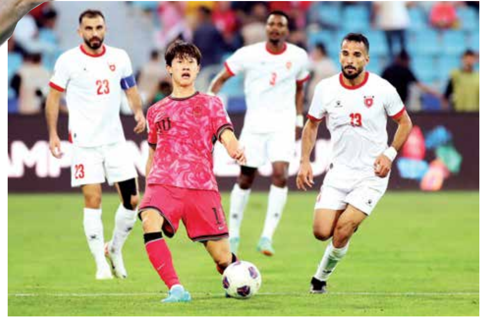
○ من لقاء كوريا الجنوبية والأردن