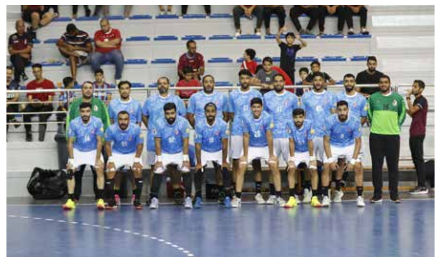
○ فريق الشباب