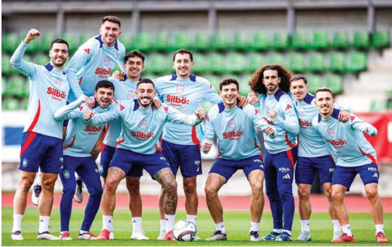
○ تدريبات إسبانيا.