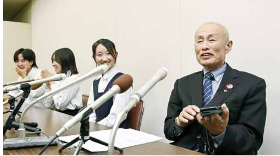
○ توشيوكي ميمامي الرئيس المشارك لنيهون هيدانكيو، يعقد مؤتمرا صحفيا في طوكيو بعد إعلان الجائزة.

من جهتها، رحبت رئيسة المفوضية الأوروبية أورسولا فون دير لاين أمس الجمعة بمنح جائزة نوبل للسلام للمنظمة اليابانية قائلة إن ذلك يعث برسالة قوية، فيما أشاد رئيس الوزراء الياباني شيجيرو إيشيبا أيضا بمنح الجائزة لنيهون هيدانكيو، قائلا إن القرار «يحمل معنى بالغ الأهمية». وقالت وزيرة الخارجية الألمانية أنالينا بيربوك إنها «أبناء جيدة فعلا خصوصا في هذه الأوقات القاسية مع تهديد قوى عدوانية باستخدام الأسلحة النووية».