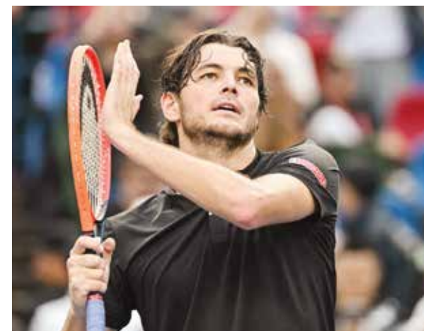
○ فريتس (أ ف ب)

وقال النادي الملكي في بيان إن «الحفلات الموسيقية في ملعب سانتياغو برنابيو لا