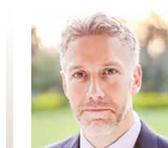
○ السفير البريطاني.

وأوضح السفير لونغ أن الزيارة قام بها الوزير لمملكة البحرين والمملكة الأردنية الهاشمية كانت تهدف إلى الاستماع إلى «أصدقاء مقربين» خلال هذه الظروف الحرجة التي تمر بها المنطقة. وأشاد السفير لونغ بالدور المحوري الذي تلعبه مملكة البحرين من خلال رئاستها لجامعة الدول العربية هذا العام من أجل إيجاد الأرضية المناسبة للحوار وتعزيز السلام في المنطقة، كما أثنى على جهود مملكة البحرين تحت قيادة حضرة صاحب الجلالة الملك حمد بن عيسى آل خليفة عاهل البلاد المعظم خلال قمة البحرين التي استضافتها المملكة في مايو الماضي، التي وصفها بأنها ناجحة من الناحيتين اللوجستية والدبلوماسية.