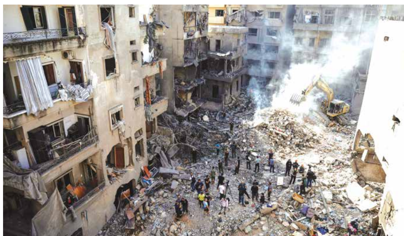
○ دمار هائل في موقع إحدى الغارتين الإسرائيليتين على وسط بيروت مساء الخميس.

لم يعد هناك مكان آمن في البلاد». ومنذ ٢٣ سبتمبر، كُثفت إسرائيل ضرباتها على معازل حزب الله وبنيتة العسكرية والقياضية، وقتلت الأمين العام للحزب حسن نصر الله في ضربة جوية ضخمة في الضاحية الجنوبية في ٢٧ سبتمبر. وأعرب وزير الخارجية الأمريكي أنتوني بلينكن أمس عن أمله في التوصل إلى حل دبلوماسي في لبنان ودعم واشنطن لجهود الدولة اللبنانية لفرض نفسها بمواجهة حزب الله.