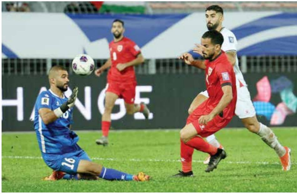
○ من لقاء الأردن وفلسطين