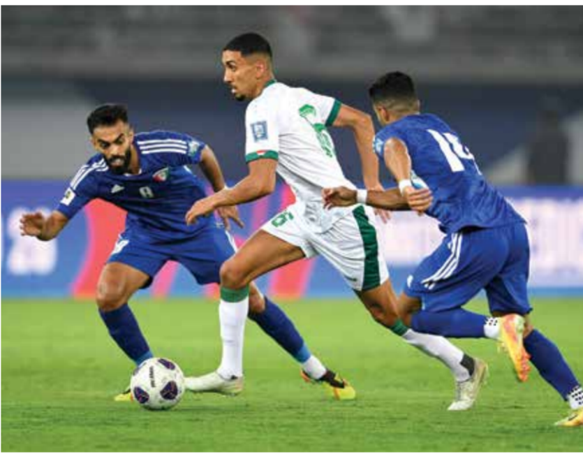
○ من لقاء الكويت والعراق