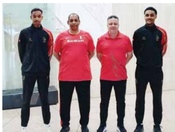
O وفد ألعاب القوى.

وأكد إسحاق إبراهيم إسحاق أن هذا الإنجاز العالمي المشرف يعكس ما يتمتع به سمو الشيخ ناصر بن حمد آل خليفة من عزيمة وإصرار، ويؤكد المكانة المتقدمة التي تتمتع بها مملكة البحرين في بطولات سباقات القدرة على الصعيد الإقليمي والعالمي، مشيراً إلى أن تحقيق هذه البطولة هو فخر واعتزاز للجميع في مسيرة تقدم وارتقاء القطاع الرياضي الوطني.