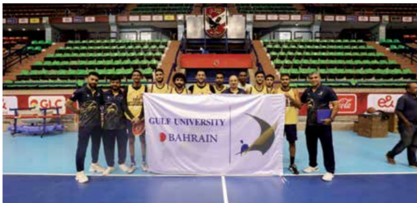
O فريق الجامعة الخليجية للسلة.

اختتمت الجامعة الخليجية معسكرها التدريبي في جمهورية مصر العربية بفوز مستحق على نادي الشباب الأهلي المصري بنتيجة ٨٥ - ٧١ في مباراة حماسية شهدت منافسة قوية بين الفريقين. وجاءت هذه المباراة الختامية ضمن سلسلة من المباريات الودية التي خاضها الفريق خلال معسكره التدريبي، حيث سبق له أن تغلب على كل من الجامعة الألمانية ونادي الجزيرة في مواجهات سابقة.