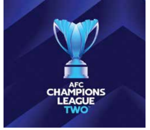
○ دوري أبطال آسيا ٢.