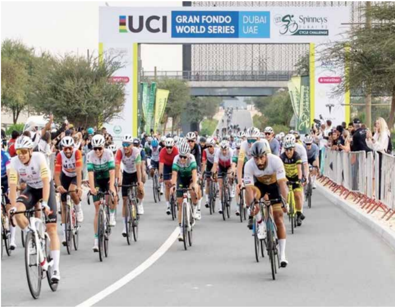
○ تحدي سبينس دبي

وجاء القرار في الوقت الذي تركز فيه باناسونيك أعمالها أكثر على منتجات مرتبطة بالمركبات مثل بطاريات السيارات الكهربائية، على الرغم من أن الإلكترونيات الاستهلاكية تظل مجالاً تجارياً رئيساً لها. وقال رئيس اللجنة الأولمبية الدولية توماس باخ في البيان الصادر عن الشركة: «إن اللجنة الأولمبية الدولية تدرك وتحترم تماماً أن على مجموعة باناسونيك أن تتكيف مع استراتيجيتها التجارية»، وأضاف الألماني: «لذا، تنتهي هذه الشراكة بطريقة محترمة وودية».