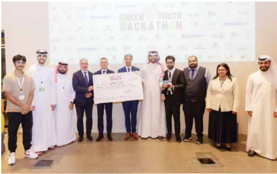
O إعلان الفائزين.