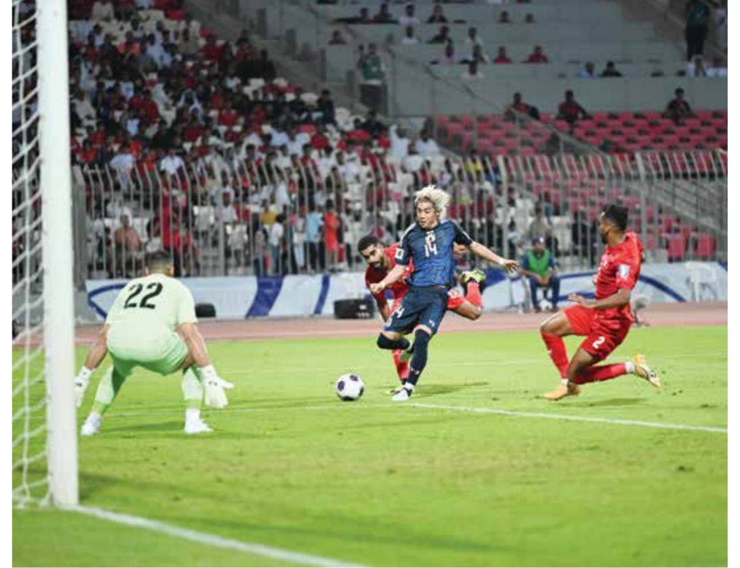
O لقطة من المباراة.