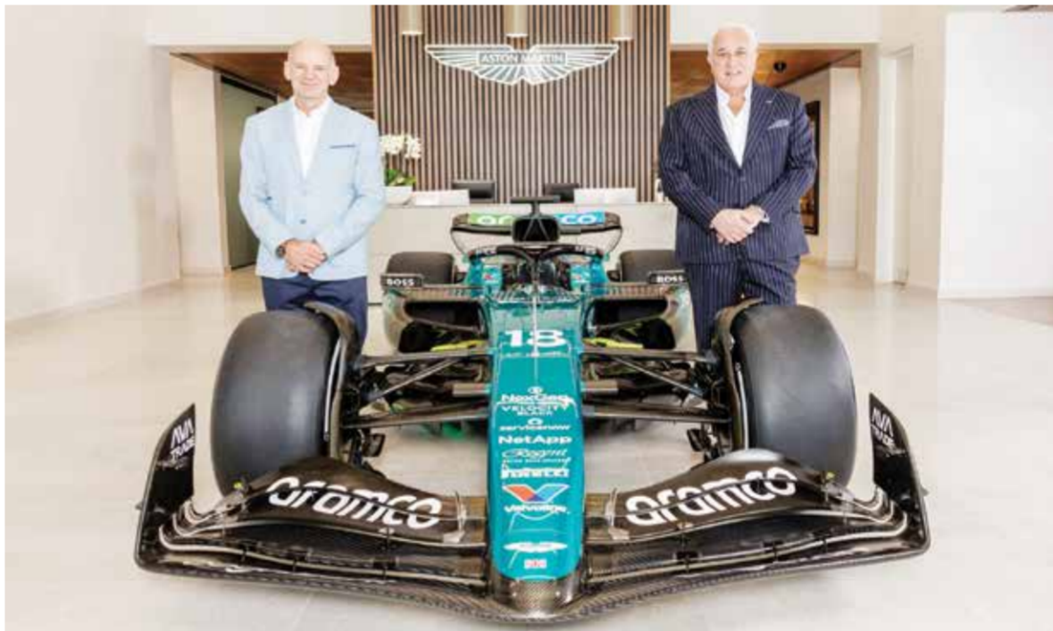
○ نيوي رسمياً في أستون مارتن

ويفضل تصميمه، أحرز ريد بول ستة القاب للصانين وسبعة للسائقين (٤ مع الألماني سيباستيان