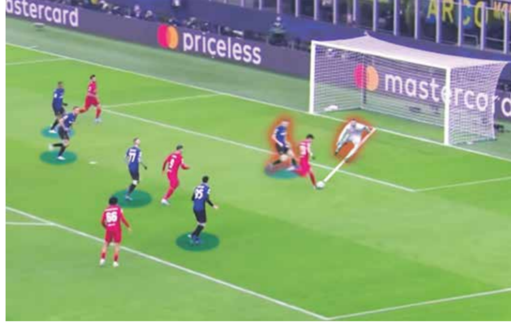
○ صورة رقمية لتحليل مؤشر «إكس جي»

بيروت (لبنان) - (أ ف ب) - على مدار السنوات الأخيرة، ومع دخول الإحصائيات والبيانات إلى عالم كرة القدم، ظهرت العديد من المصطلحات التي كانت تهدف بالأساس إلى منح فكرة دقيقة حول ما حدث في مباراة ما. ومن بين هذه المصطلحات الأكثر شيوعاً حالياً، يطلق على السطح مصطلح «إكس جي»، أو مؤشر الأهداف المتوقع، فماذا نعرف عنه؟