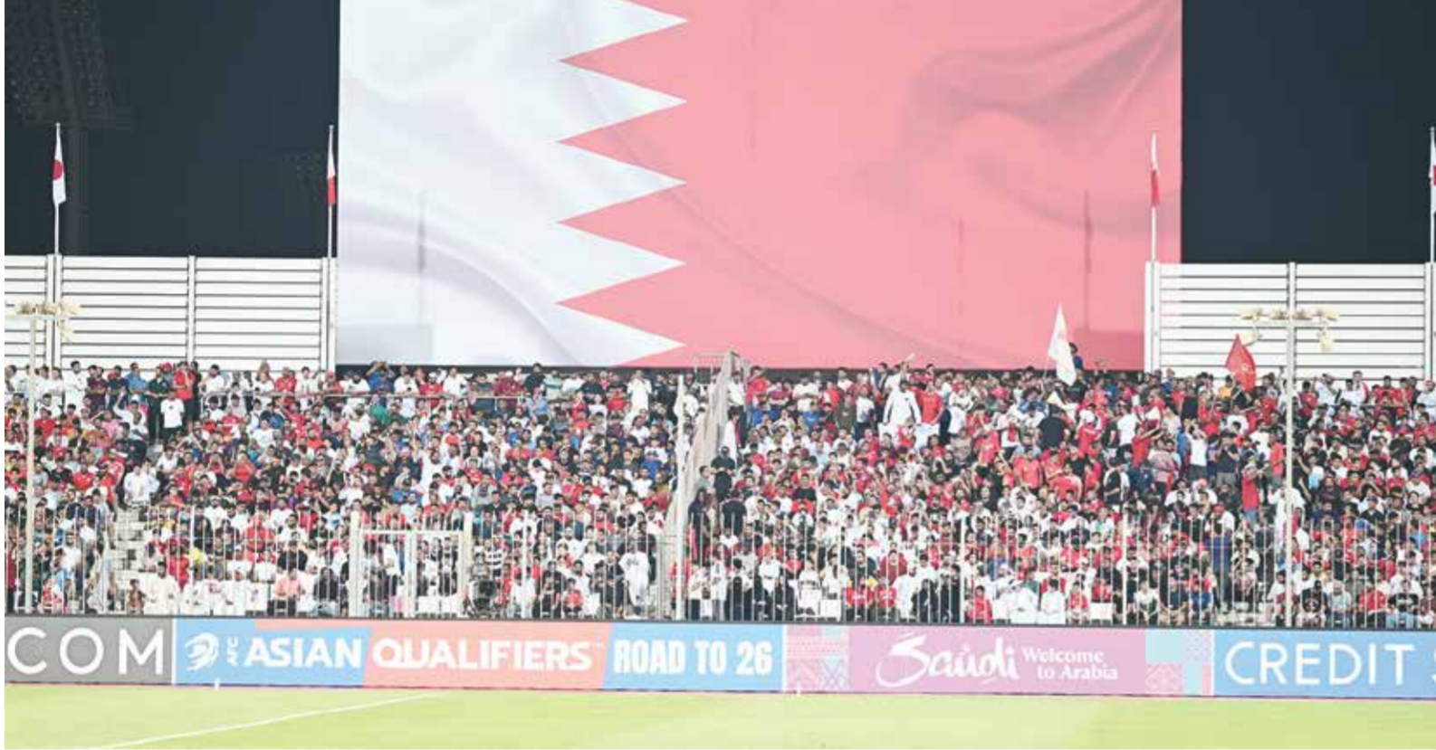
O الحضور الجماهيري الكبير في المباراة.