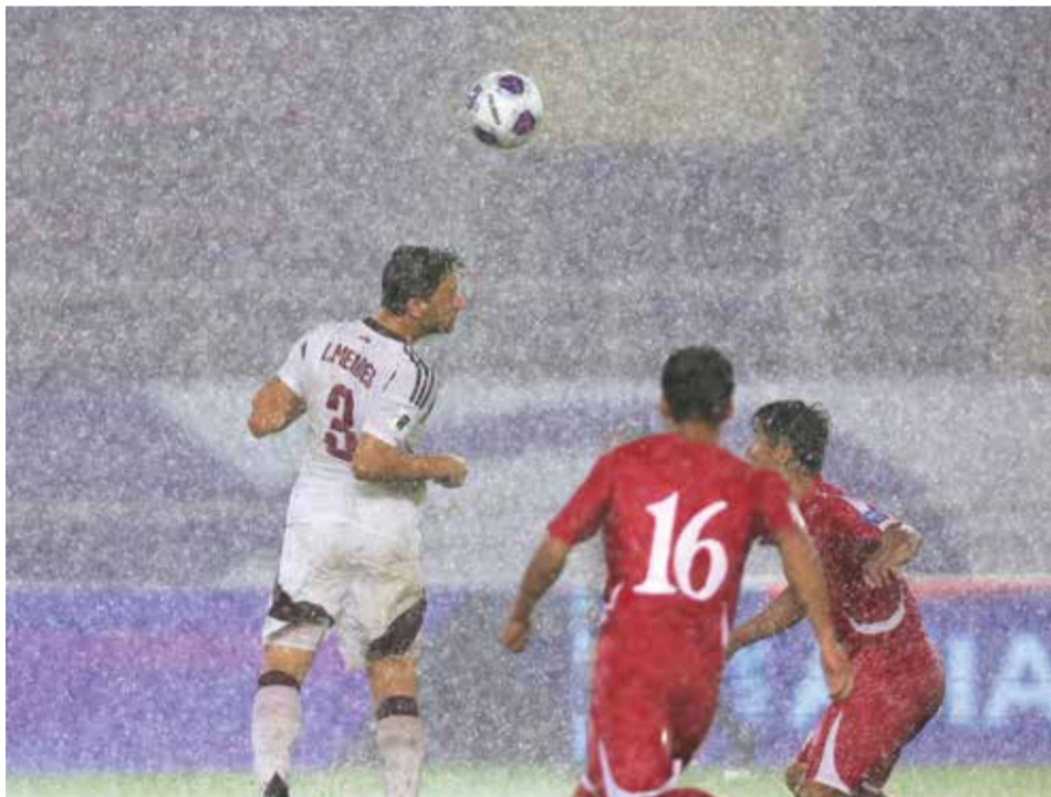
○ من لقاء قطر وكوريا الشمالية