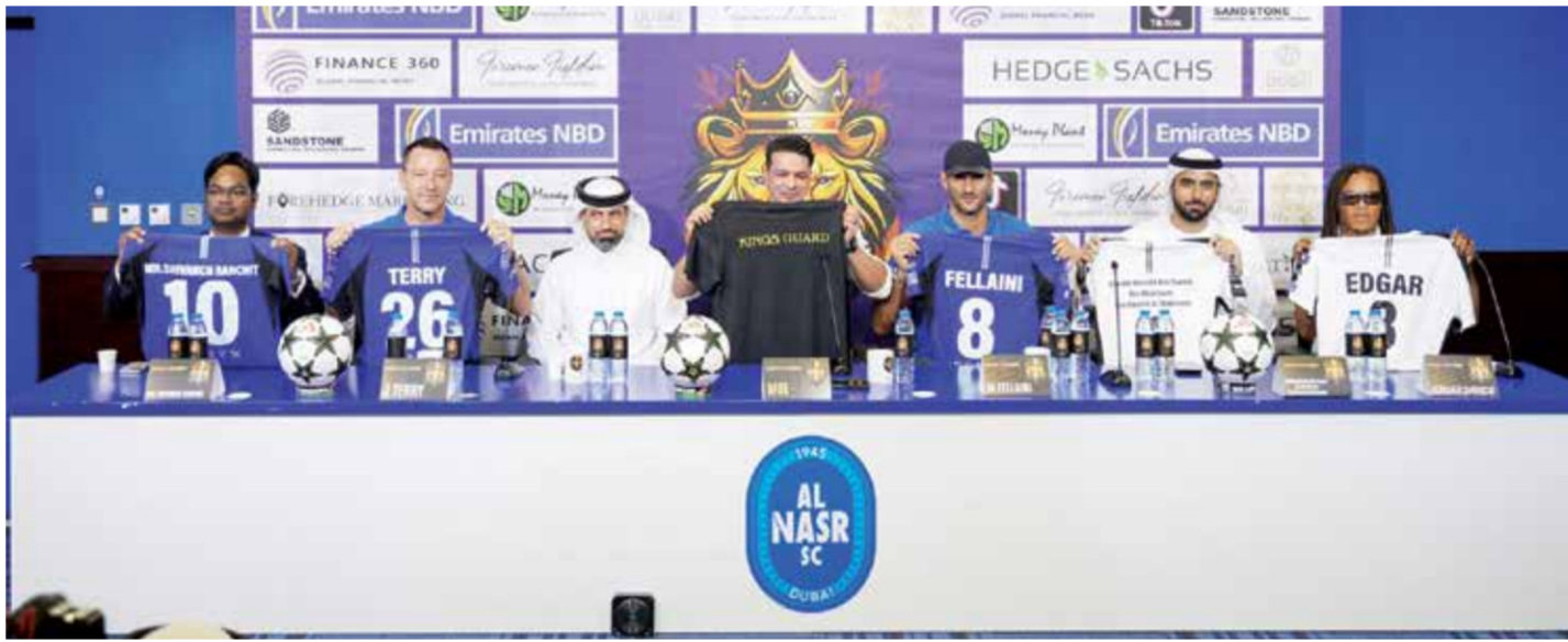
○ جانب من المؤتمر الصحفي.

وقال الشيخ خليفة بن سعيد بن مكتوم بن راشد آل مكتوم إنه حرص على المساهمة في هذه النسخة والمشاركة في نجاحها مؤكداً أن الرياضة جزء أساسي من حركة المجتمع، والرياضة في دبي تحظى باهتمام كبير وتحقق نجاحات متواصلة وتستقطب منظّمين ولاعبين عالميين ونوه إلى السعي إلى استقطاب لاعبين مميزين للفريق من أجل الفوز باللقب وتقديم حدث رياضي للجماهير يليق باسم دبي ومكانتها على خارطة الرياضة العالمية.