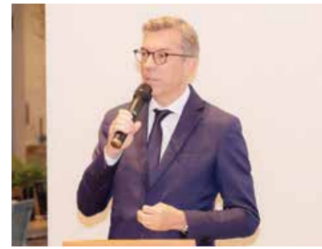
O السفير الفرنسي.

المستدامة)، سواء كانوا طلاباً أو مهنيين شباب، تتراوح أعمارهم بين ١٨ و ٢٧ عاماً. وقد نظمت هذه العملية بدعم من شركتي Fives ملتزمتان التزاماً كاملاً بتمكين الشباب في مجال ريادة الأعمال والتنمية المستدامة.