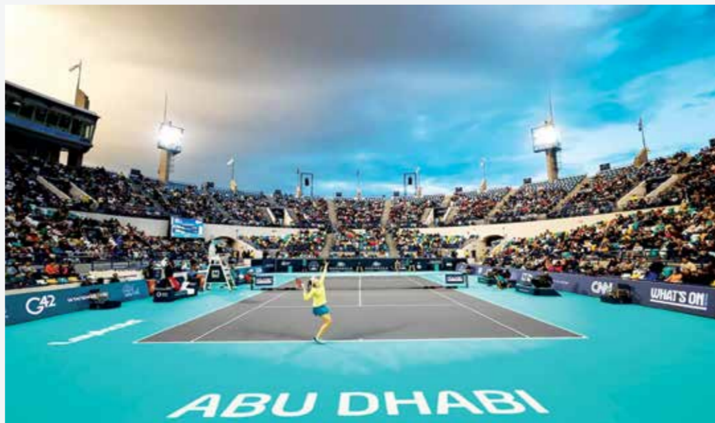
○ مبادلة أبوظبي المفتوحة للتنس