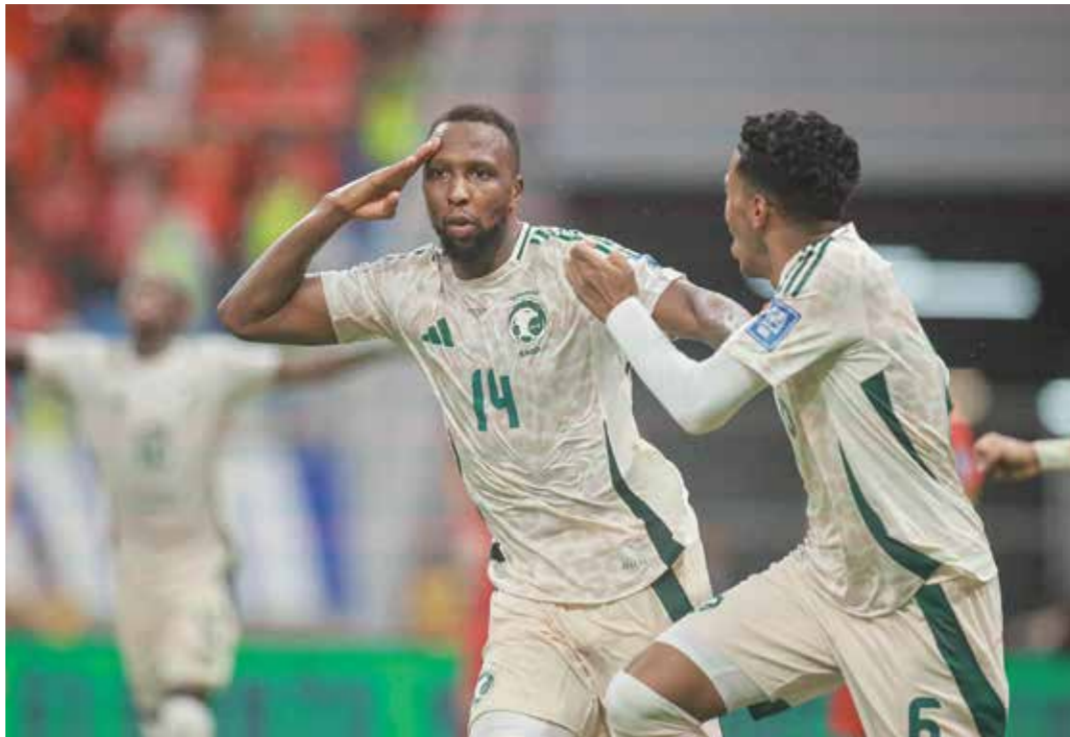
○ من لقاء السعودية والصين

والخسارة يتصد مزدوج. وفي حين بدا أن المباراة ذاهبة إلى التعادل، خطف كادش هدف الفوز من ركنية أيضا حيث ارتقى للكرة