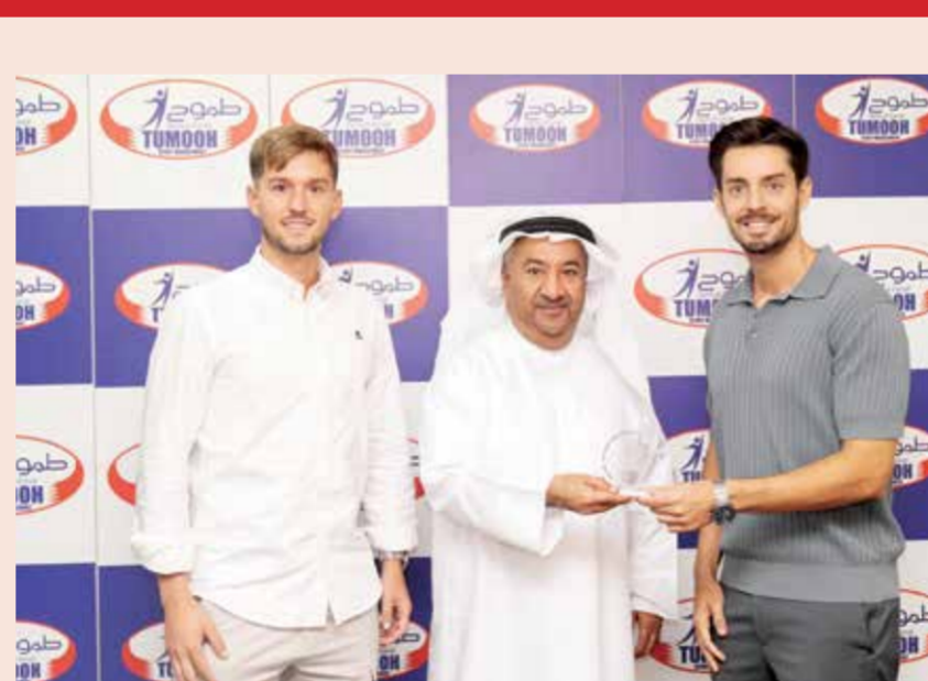
O بن جلال يقدم درعا تذكارية لمدير الأكاديمية.