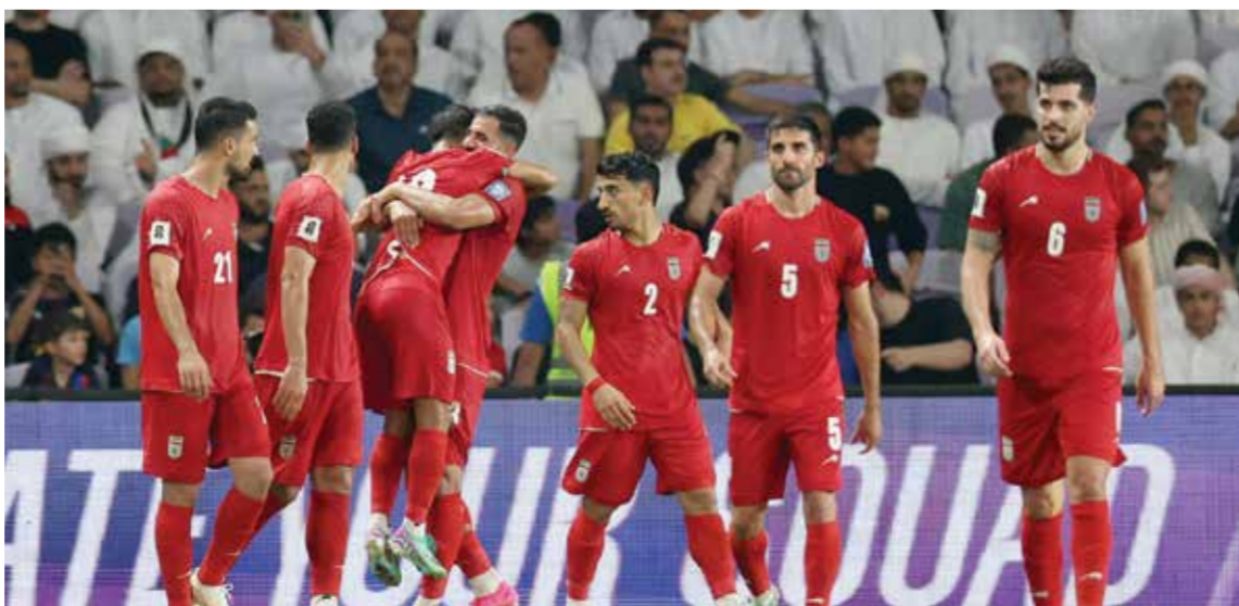
○ من لقاء إيران والإمارات

وبعدما كانت المباراة متجهة نحو التعادل، سجل مهاجم توتنهام سون هدفا رائعا بعد أن سد كرة قوية بقدمه اليسرى مانحا فريقه التقدم قبل ثماني دقائق من نهاية الشوط الأول.