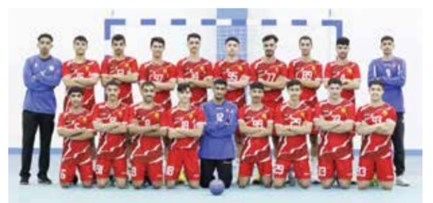
O منتخبنا الوطني للناشئين لكرة اليد.

يعكس العمل الجاد والانسجام بين جميع اللاعبين، ونحن نتطلع لتقديم مستويات مماثلة في المباريات الرسمية القادمة». يشار إلى أن المعسكر التدريبي في جمهورية مصر لم يقتصر على التدريبات والمباريات فحسب، بل شمل أيضاً فرصة للاستماع بالأجواء الإيجابية، وتعزيز روح الفريق من خلال التفاعل بين الأعضاء، إلى جانب التعرف على الثقافة المصرية. هذا التفاعل أضفى طابعاً من الحماسة وساهم في تعزيز استعداد الفريق للموسم القادم. وتواصل الجامعة الخليجية تشجيع طلابها على الانخراط في الأنشطة الرياضية، مع توفير بيئة داعمة تساهم في تعزيز قدراتهم البدنية والفكرية، وتحقيق إنجازات رياضية محلية ودولية.