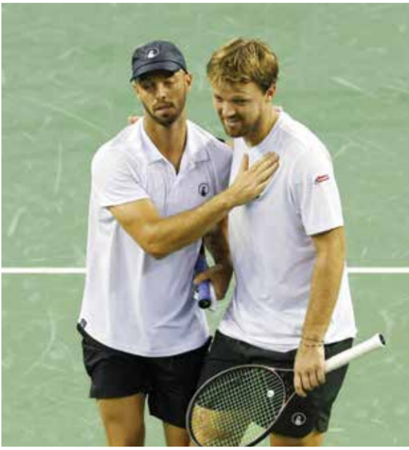
○ الفريق الألماني