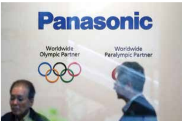
○ باناسونيك تهيء عقود من الرعاية

وتفتقد ألمانيا مصنعها الأول الكسندر زفيريف في مرحلة المجموعات للمنافسة، بالإضافة إلى الثاني المصاب يان لينارد شتروف ودومينيك كوبزر.