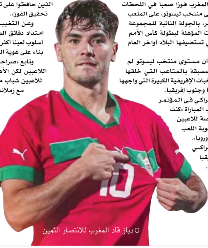
○ دياز قائد المغرب للانتصار الثمين

وكشف «لم نستغل جيداً الفرص الكثيرة المتاحة من خلال الكرات الثابتة والركنيات، لذلك نعمل على تعزيز الطاقم الفني بخبير في هذا المجال لتحسين أداء المنتخب مستقبلاً».