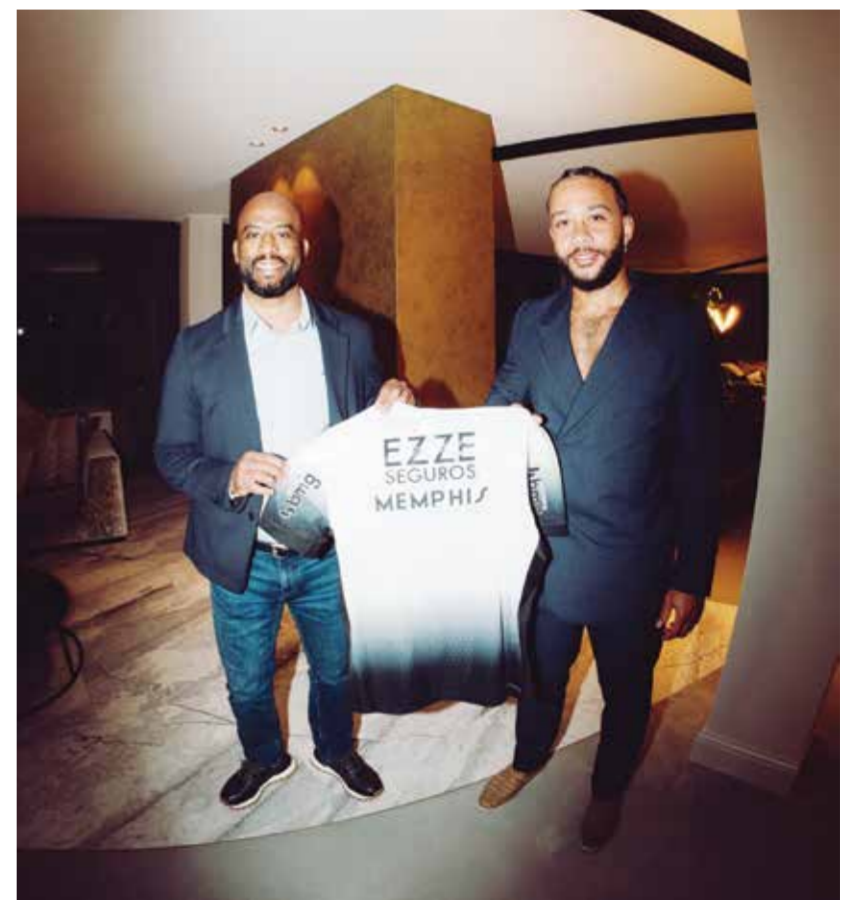
○ ديباي ينتقل إلى كورينثيانز.

لندن - (د ب أ): تواصل اتحاد أيرلندا الشمالية لكرة القدم مع نظيره الأوروبي (يويفا) بعد أن اشتكى المشجعون الأيرلنديون من «معاملة مخزية وغير مقبولة على الإطلاق»، من السلطات البلغارية أثناء حضورهم مباراة الفريق ضد مضيفه منتخب بلغاريا. واشتكى بيان صادر عن اتحاد مشجعي أندية أيرلندا الشمالية من حرمان الجماهير من الحصول على المياه والوصول إلى المراحيض أثناء احتجاجهم داخل ملعب (هريستو بوتيف) عقب اللقاء، الذي انتهى بفوز بلغاريا ١/٠ صفر الأحد، في الجولة الثانية للمجموعة الثالثة في القسم الثالث ببطولة دوري الأمم الأوروبية. وفي حادث منفصل، احتج أحد مشجعي أيرلندا الشمالية إلى العلاج في المستشفى بعد تعرضه لما وصف بأنه هجوم عنيف أثناء عودته إلى وسط المدينة بعد المباراة. وقال متحدت باسم الاتحاد الأيرلندي الشمالي لكرة القدم: «عند عودتنا إلى بلغاست اليوم، تواصلنا بشكل عالي المستوى مع مسؤولي يويفا للإشارة إلى أن مشجعينا ليس لديهم تاريخ سابق يجعلهم يستحقون نوع المعاملة التي تم الإبلاغ عنها». وأضاف المتحدث في تصريحاته، التي نقلتها وكالة الأنباء البريطانية (بي آيه ميديا): «نتوقع تحديثا في الوقت المناسب، ونريد أن نستغل هذه الفرصة لنشكر جماهيرنا على دعمهم المستمر». وفي بيانه الذي أصدره، ذكر اتحاد مشجعي أندية أيرلندا الشمالية: «لقد شهدنا المعاملة المخزية وغير المقبولة على الإطلاق لمشجعينا في بلوفديف الليلية الماضية».