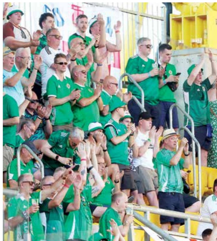
○ المشجعون الأيرلنديون

الفريق لفترة طويلة». ويستمر عقد موسيالا مع البطل التاريخي للدوري الألماني (بونديسليجا) حتى ٣٠ يونيو ٢٠٢٦. أوضح هاينر «اعتقد أنه يقدر حقا ما لديه في بايرن. وهو يعبر عن ذلك باستمرار. بالطبع نحن نعرف أيضا ما لدينا فيه». وأعرب هاينر عن «أمله وتفاؤله» بأن «نراه في بايرن لفترة طويلة قادمة». وكان موسيالا صرح مؤخرا بأنه لا يشغل نفسه بالتفكير في المكان، الذي سيلعب فيه بعد ٥ سنوات، لكن هاينر ألمح إلى أن مثل هذه التصريحات «مشروعة» تماما ولا تغير وجهة نظره بأن اللاعب قد يضاها طول فترة بقاء مولر في النادي.