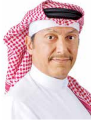
O وليد العلوي.

أشاد وليد العلوي رئيس الاتحاد البحريني لكرة السلة بفوز الأمين العام للجنة الأولمبية البحرينية فارس مصطفى الكوهجي بعضوية المكتب التنفيذي للمجلس الأولمبي الآسيوي بعد حصوله على ثقة الجمعية العمومية للقيادة الآسيوية، وذلك في اجتماع الجمعية العمومية الذي أقيم في الهند، مؤكداً إن ذلك يعد تنويحاً للثقة الدولية الكبيرة التي