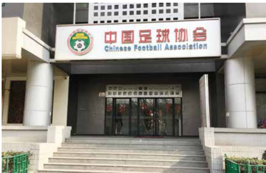
○ الاتحاد الصيني لكرة القدم.