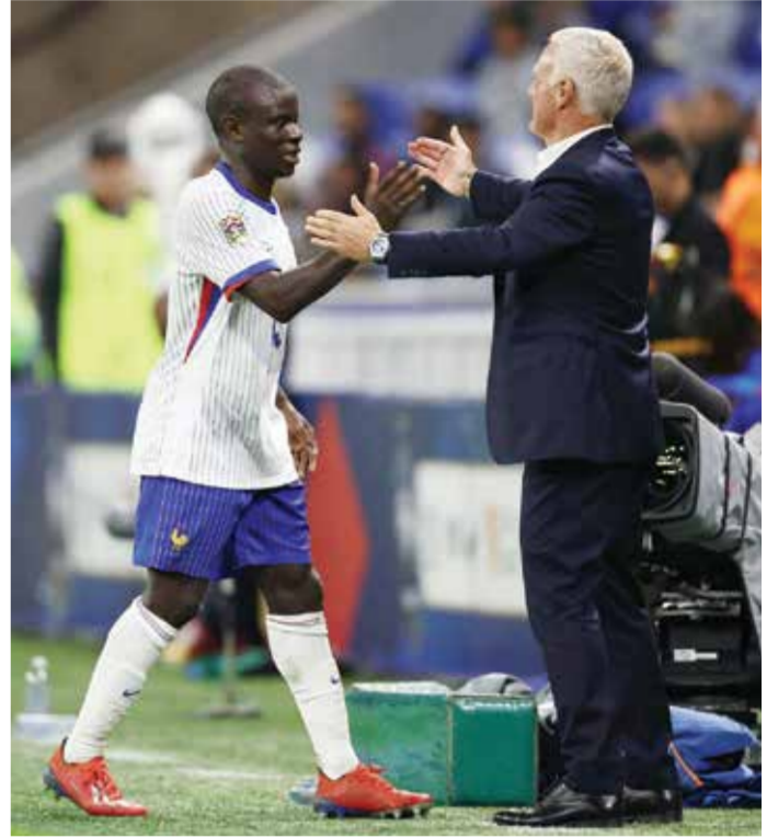
○ ديشان يطبق مبدأ المدارة (أ ف ب)

ليون - (أ ف ب): لم يكن مدرب المنتخب الفرنسي ديشان راضيا بالكامل عن وضع فريقه رغم استعادته توازنه وفوزه على غريمه البلجيكي ٢-٠ يوم الإثنين في الجولة الثانية من منافسات المجموعة الثانية للمستوى الأول من دوري الأمم الأوروبية لكرة القدم. وجاء فوز الديوك، على بلجيكا في ليون بعد ثلاثة أيام من الخسارة المؤلمة أمام إيطاليا ٣-١ على ملعب «بارك دي برانس» في باريس. وأفاد ديشان: «لا أريد القول إن كل شيء جميل، إنه تمت تسوية كل شيء. لا يوجد ارتياح. بطبيعة الحال أنا سعيد من ردة الفعل التي شاهدها وما قدمناه ضد فريق بلجيكي قوي جدا تسبب لنا بالمتاعب في الدقائق العشرين الأولى». واعتبر المدرب الذي قاد فرنسا إلى لقب مونديال ٢٠١٨ ووصافة مونديال ٢٠٢٢ أن معاناة فريقه في بداية اللقاء جاءت في سياق المعنويات المهزوزة الناجمة عن الخسارة ضد إيطاليا: «حيث لم تكن الفريق الأسوأ الجمعة (في الجولة الأولى)». وتابع: «لا أضع دائما الفريق في الظروف الأمل من خلال إجراء التغييرات»، في إشارة إلى خوضه اللقاء بتشكيلة مغايرة لمباراة إيطاليا. وأبقى ديشان على القائد والهداف كيليان