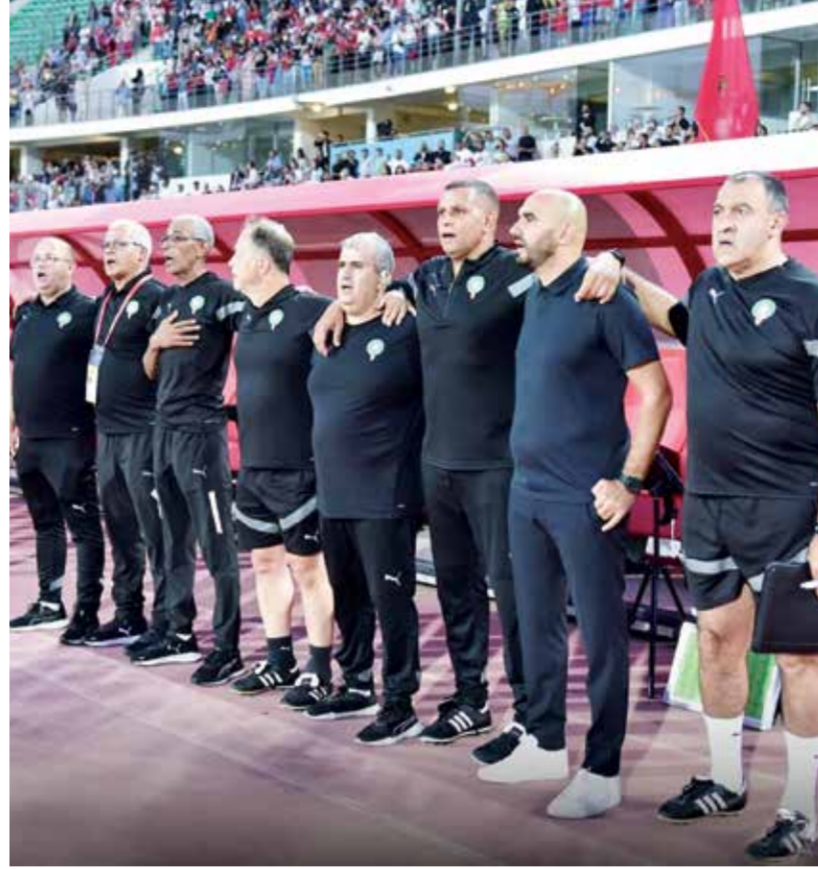
○ الجهاز الفني المغربي.

أضاف الركراكي «الواجهات في إفريقيا ليست بالأمر السهل. كنت أتوقع بعض الصعوبة كذلك لأنني أجريت تغييراً بنسبة ٩٠٪ على المجموعة لاسيما وأن بعض