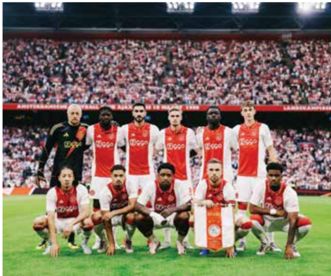
○ فريق أياكس.

أمستردام - (رويترز): قال أياكس أمستردام إنه تم إلغاء مباراة ثانية له في دوري الدرجة الأولى الهولندي لكرة القدم بسبب تهديدات بالإضراب من نقابة العاملين في الشرطة. وقررت السلطات عدم إقامة مباراة أياكس وأوترخت يوم الأحد المقبل في ملعب يوهان كرويف لأسباب أمنية.