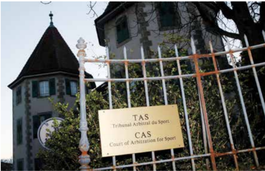
○ محكمة التحكيم الرياضي.

لجنة الاستئناف بالفيضا في قرارها الصادر في ٢٧ يوليو ٢٠٢٤ بعدما أثبتت مخالفات لقواعد الفيضا السارية على بطولة كرة القدم الأولمبية فيما يتعلق بمنع تسير طائرات مسيرة على مواقع التدريب».