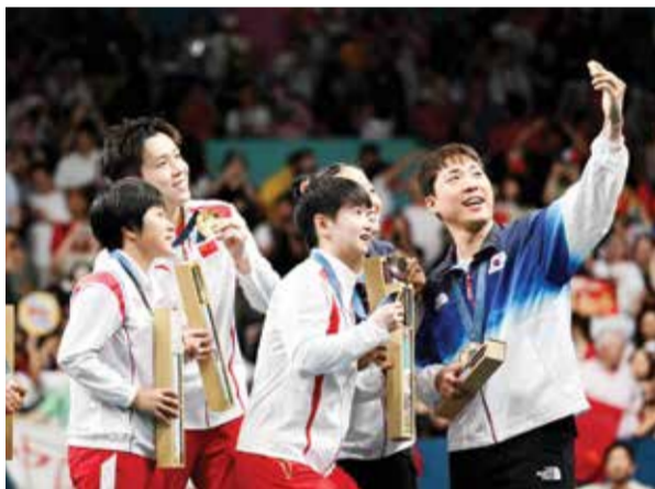
○ صورة تجمع لاعبي الكوريتين.

وقالت المحكمة في بيان «تقرر رفض الطلب الذي تقدمه به اللجنة الأولمبية الكندية والاتحاد الكندي لكرة القدم فيما يتعلق بعقوبة خصم ست نقاط من رصيد فريق كندا لكرة القدم للسيدات في بطولة كرة القدم بأولمبياد باريس ٢٠٢٤». وأضافت «سعى المتقدمون بالطلب للحصول على قرار من المحكمة بإلغاء أو تخفيف عقوبة خصم النقاط التي فرضتها