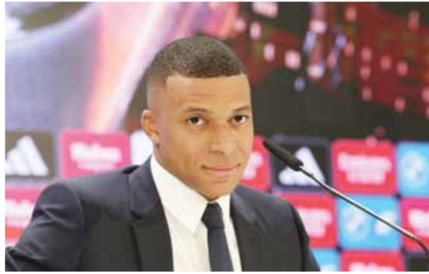
○ كيليان مبابي.

وقال رئيس بلدية كاين أريستيد أوليفييه «علينا أن نؤمن أن تلك الأوقات القليلة التي قضاه في كاين في شبابه تركت أثراً لدهاءه يا له من فخر رؤية بطل مثل مبابي يستمر في كاين».