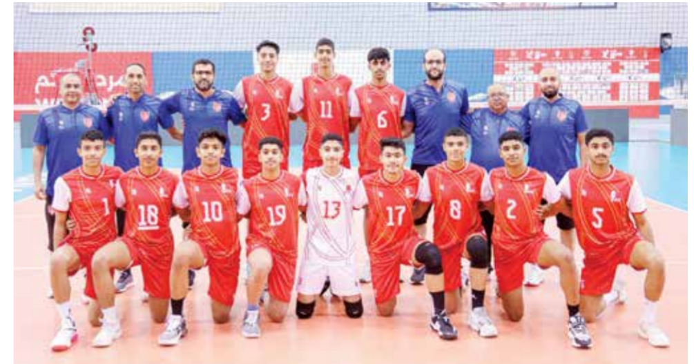
O منتخبنا الوطني للكرة الطائرة.