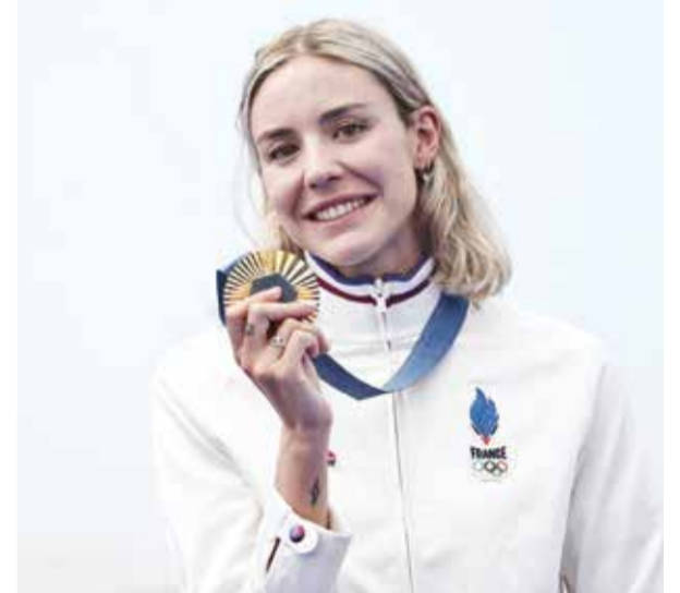
O كاساندر بوغران.

وتشارك أيضا الأمريكية ليلي كينج في الدور قبل النهائي للسباق، بعد فوزها بذهبية ١٠٠ متر صدر في أولمبياد ريو دي جانيرو ٢٠١٦ فضية سباق ٢٠٠ متر في طوكيو.