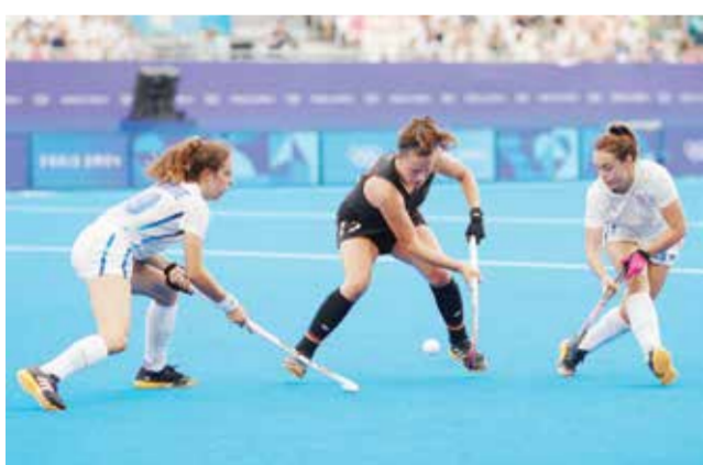
O جانب من اللقاء. (رويترز).