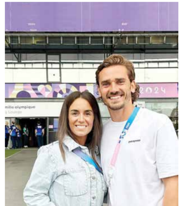
○ غريزمان متابعاً بشدة لأولمبياد.

وأشاد أحد المعلقين قائلاً: «هذه هي الروح الحقيقية للألعاب الأولمبية». ولا تزال كوريا الجنوبية في حالة حرب من الناحية الفنية مع جارتها الشمالية، بعد صراع اندلع بين عامي ١٩٥٠ و١٩٥٣ وانتهى بهدنة وليس بمعاهدة سلام.