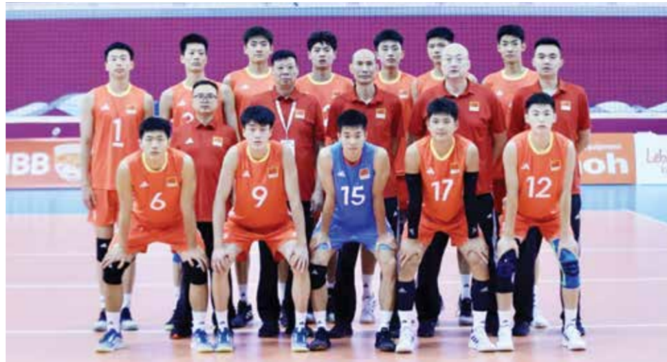
O منتخب الصين للكرة الطائرة.

□ شاهدنا لقاء منتخب فرنسا وكندا ضمن منافسات الكرة الطائرة في أولمبياد باريس ٢٠٢٤، وبغض النظر عن الفوارق بين المنتخبين التي تصب في صالح أصحاب الضيافة، إلا أن منتخب الديوك بدأ خطيرا بكل ما تعني الكلمة من معنى، قدم على مدار الأشواط الثلاثة التي استغرقتها المباراة فاصلا من الأداء الجنوني الخيالي على المستويين الهجومي والإرسال، وإذا ما استمر منتخب الديوك على هذا المنوال، فإن الميدالية الذهبية ربما لن تفلت منهم، وخاصة أن المنافسة على أرضهم وبين الآلاف المؤلفة من جماهيرهم.