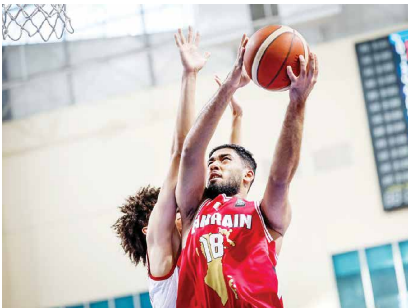
○ من لقاء منتخبنا للشباب وعمان.

وكانت قرعة الدور الثاني قد أوقعت منتخبنا