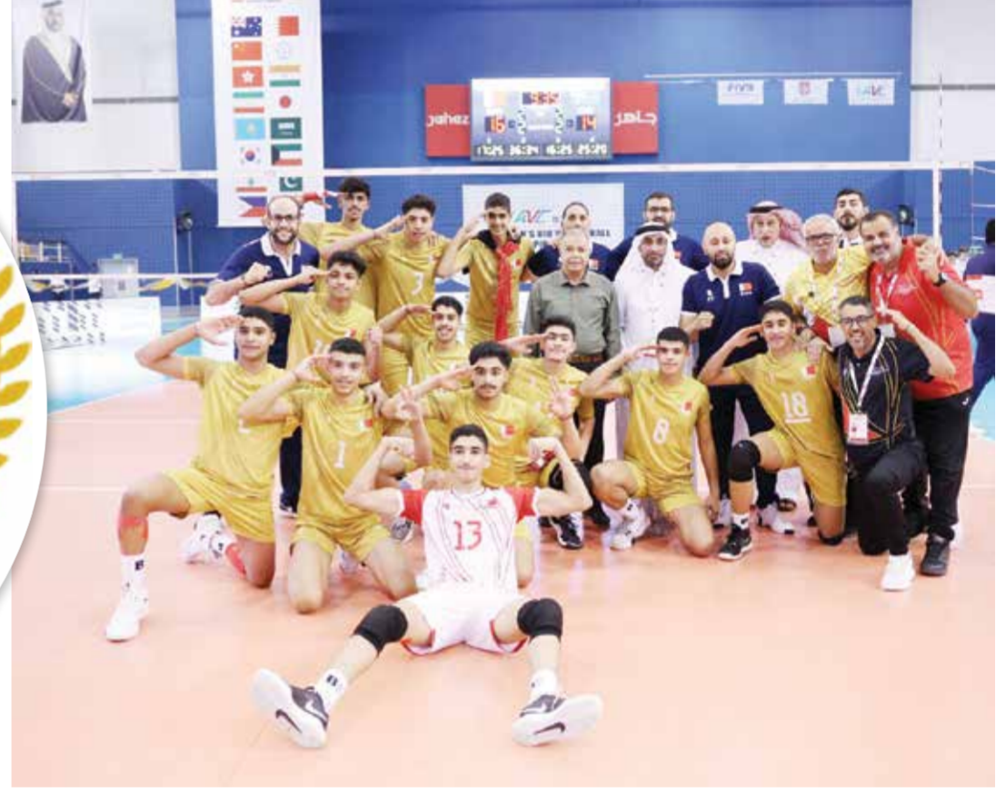
O منتخبنا الوطني تحت ١٨ عاما للكرة الطائرة.