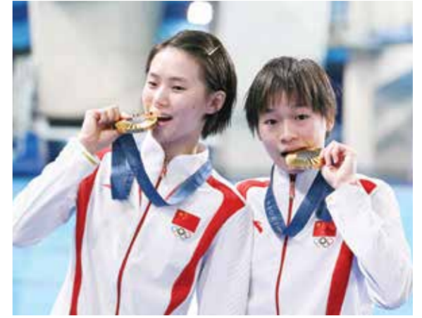
○ فوز قوان وتشين بالميداليات الذهبية.

منذ دورة الألعاب الأولمبية في بكين عام ٢٠٠٨، تواجدت العداءة دائماً على منصة التتويج للسباق الأبرز في رياضة أم الألعاب على مسافة ١٠٠