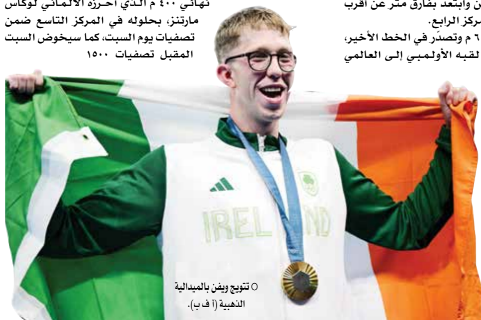
O تويغ ويفن بالميدالية الذهبية.

ورفع المنتخب الألماني رصيده إلى ست نقاط في المركز الثاني، وظل المنتخب الفرنسي بلا نقاط في المركز السادس الأخير.