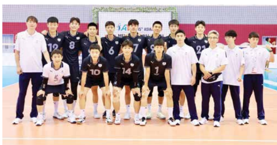
O منتخب كوريا للكرة الطائرة.

يواجه منتخبنا الوطني تحت ١٨ عاما للكرة الطائرة منتخب الصين في الساعة ٧،٠٠ من مساء اليوم في صالة عيسى بن راشد في الرفاع ضمن المجموعة E من منافسات الدور الثاني من بطولة آسيا المقامة في المملكة حتى ٥ أغسطس. وكانت قرعة الدور الثاني قد أوقعت منتخبنا بعد أن احتل المركز الثاني في منافسات الدور التمهيدي في المجموعة E إلى جانب منتخبات تايوان والصين وإيران. وكان منتخبنا قد حسم تأهله إلى الدور الثاني بعد تفوقه على المنتخب الأسترالي في المباراة المفضلية التي امتدت إلى الشوط الفاصل. ورغم أن منتخبنا قد حقق هدف التأهل إلى الدور الثاني بحسب الطموح المرصود من قبل القائمين على شأن المنتخب، غير أن مهمته في هذا الدور ابتداء من مباراة اليوم أمام الصين والغد أمام إيران أول وثاني المجموعة الثالثة لن تكون مستحيلة ولكنها صعبة لأمور متعددة ومنها الفوارق البدنية.