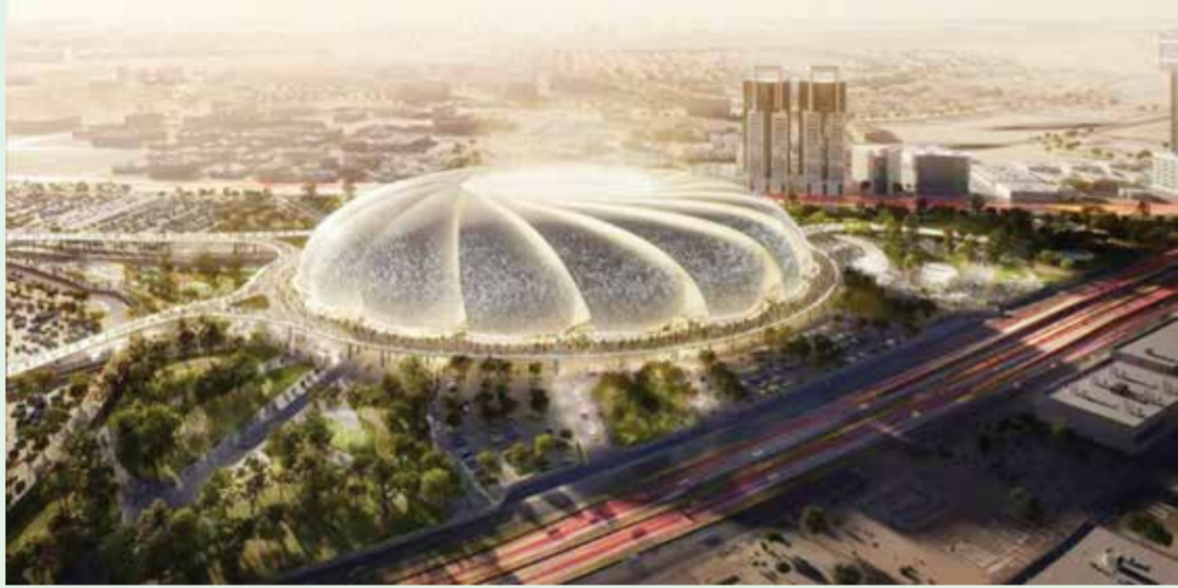
○ ملعب أرامكو