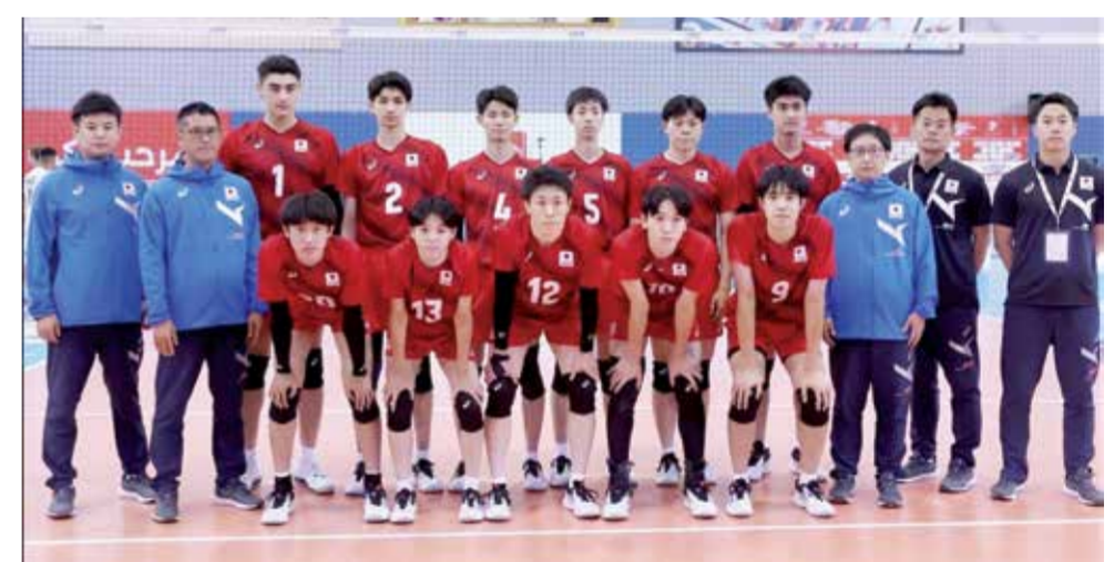
O منتخب اليابان للكرة الطائرة.