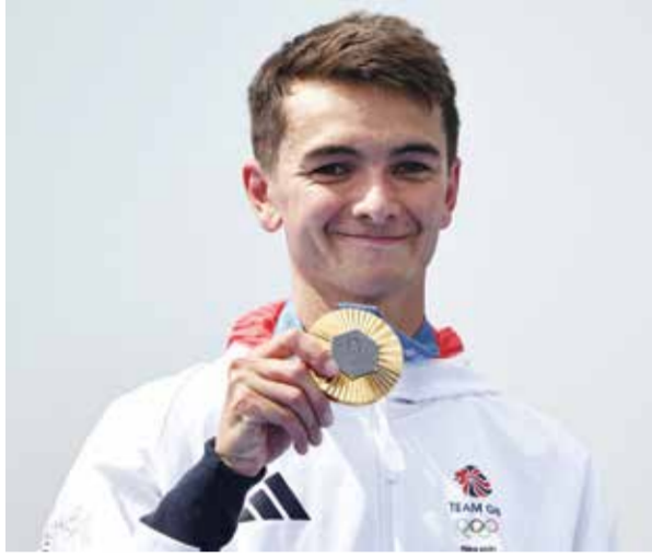
O أليكس بي. (أ ف ب).