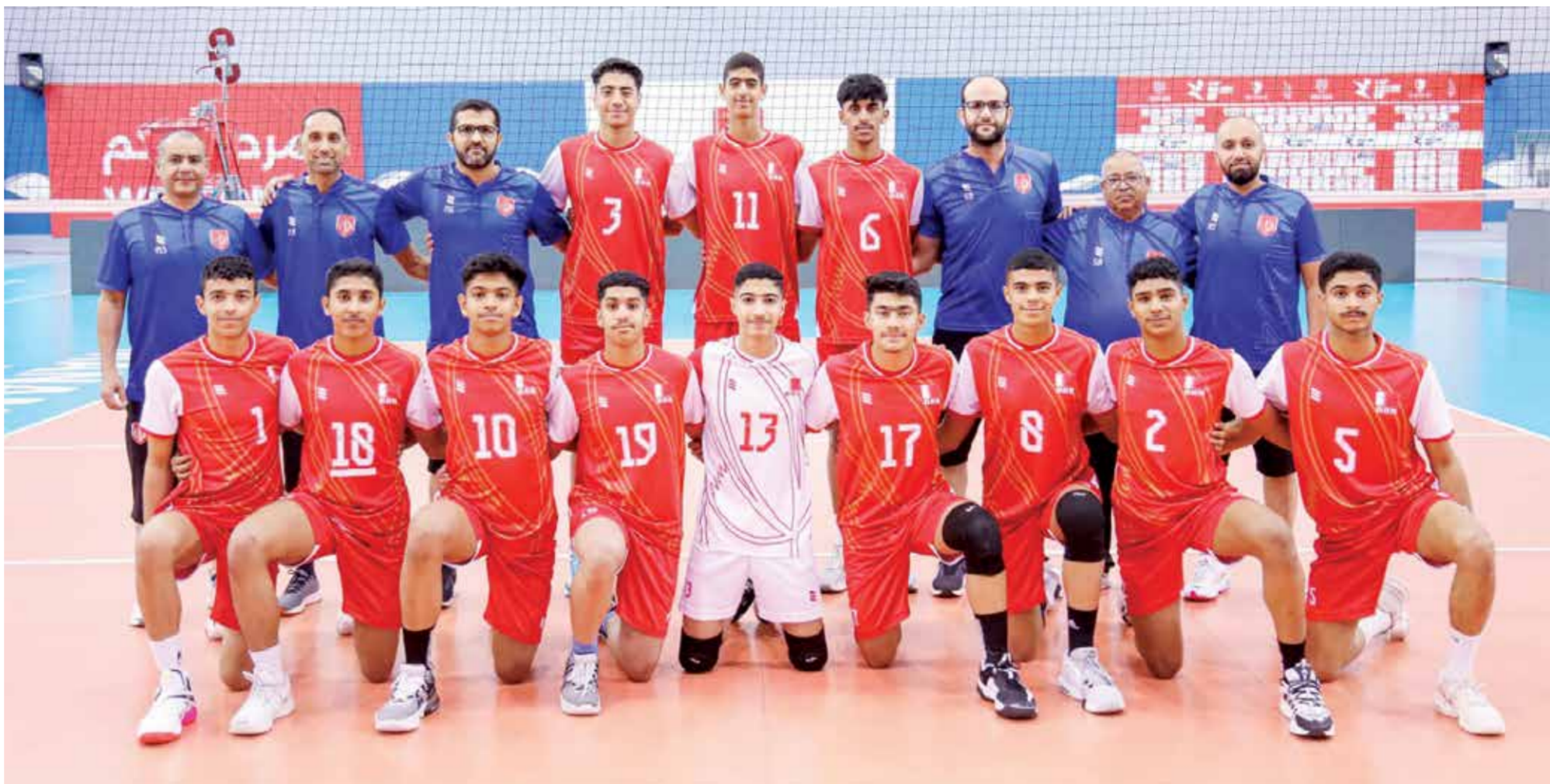
○ منتخبنا الوطني للكرة الطائرة.

المؤثر لتصعب مهمة استقبال الصينيين وكشف أعباءهم الهجومية. وكانت المنتخبات الثمانية المتأهلة إلى الدور الثاني قد وزعت على مجموعتين، إذ ضمت المجموعة E منتخبات الصين وإيران وتايلاند إضافة إلى منتخبنا الوطني، بينما ضمت المجموعة F منتخبات باكستان وكوريا واليابان وتايبيه الصينية. التفاصيل في الملحق الإلكتروني