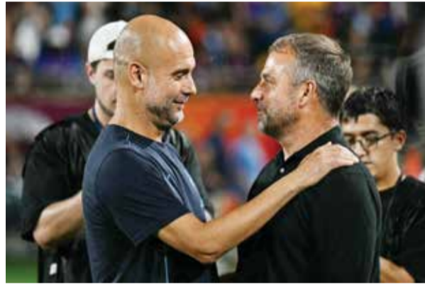
○ جورديولا يحيي فليك نهاية اللقاء.

ويُتوقع اكتمال العمل في الملعب الجديد الذي سيتم إنشاؤه في مدينة الخبر بحلول عام ٢٠٢٦م، ليصبح الملعب الرئيس لنادي القادسية المملوك لأرامكو السعودية، وأحد المقرات الرئيسية لفعاليات بطولة كأس آسيا التي ستستضيفها المملكة في عام ٢٠٢٧م. وتعمل «أرامكو السعودية» بالتعاون مع مجموعة «روشن»، المطور العقاري الوطني الرائد وإحدى شركات صندوق الاستثمارات العامة، على