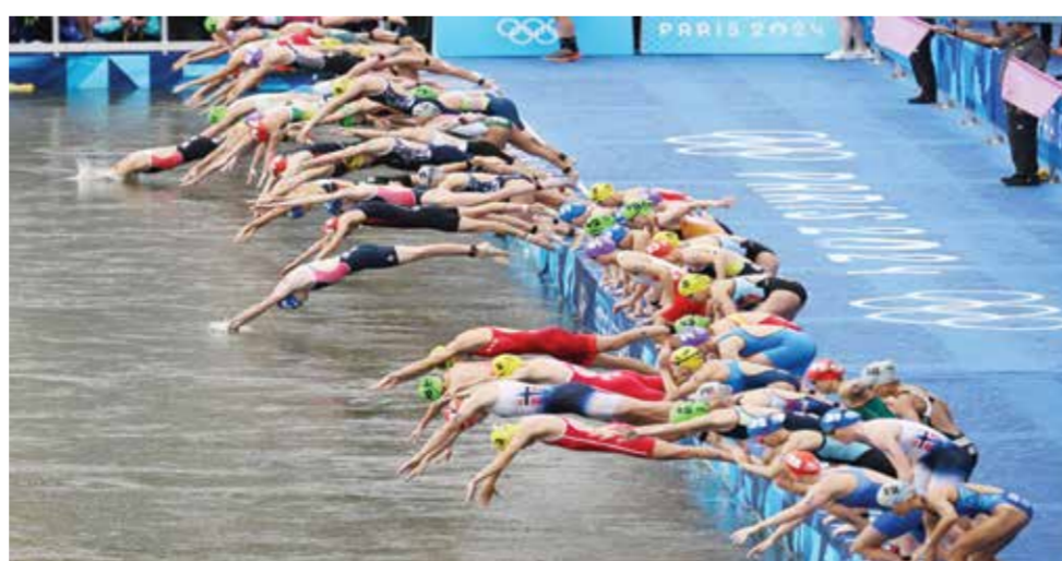
○ جانب من المنافسات.

للرياضيين، الذين خاطروا برؤية سباق الترياثلون الخاص بهم مجتازاً من منافسات السباحة حيث كان من الممكن أن يتحول إلى دوائلون (تسلسل الجري، ركوب الدراجة، الجري).