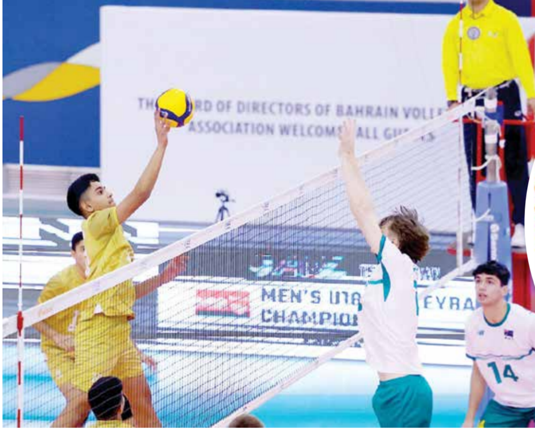
O لقطة من البطولة الآسيوية.