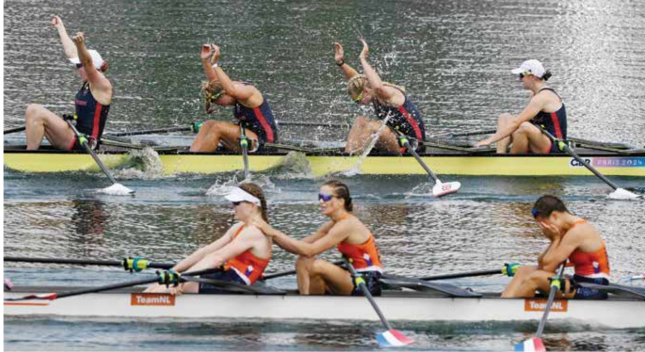
O احتفال سيدات بريطانيا وحسرة هولندية. (أ ف ب).

وقطع ابن الـ٢٦ عاما خط نهاية سباق الجري الذي كان الثالث في هذه المسابقة بعد السباحة في السنين والدراجات الهوائية، بزمن ١:٤٣،٣٣ ساعة، متقدما على النيوزيلندي هايدن وايلد (١:٤٣،٣٩)، صاحب برونزية أولمبياد طوكيو، والفرنسي ليو بيرجير (١:٤٣،٤٣) الذي منح بلاده الميدالية الثانية في المسابقة بعدما نالت صابحا ذهبية السيدات عبر كاساندر بوغران.