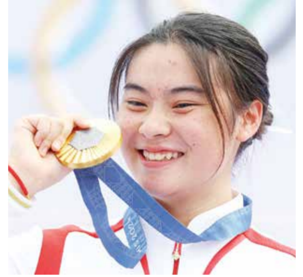
O دينج ياونين.

باريس - (د ب أ): فازت بريطانيا بالميدالية الذهبية في سباق رباعي مزدوج المجداف للسيدات، أمس الأربعاء، بأولمبياد باريس ٢٠٢٤.