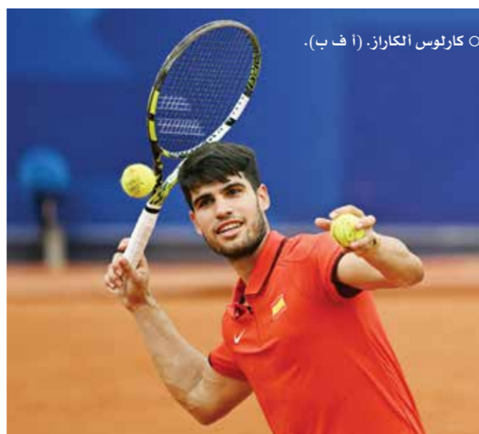
○ كارلوس ألكاراز. (أ ف ب).

وبات ألكاراز (٢١ عاما) أصغر لاعب يبلغ دور الثمانية في الأولمبياد منذ إنجاز ديوكوفيتش في أولمبياد بكين ٢٠٠٨.