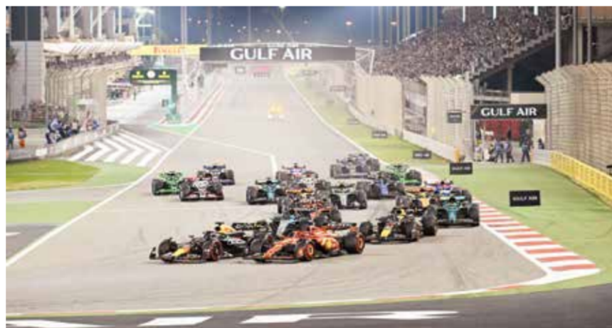
○ عروض مبكرة لحلبة البحرين.

وتعد المنصة الرئيسية ومنصة المنعطف الأول في حلبة البحرين الدولية من المواقع الرئيسية حيث يمكن لمشجعي السباق تجربة أكثر الأحداث إثارة في سباق الجائزة الكبرى. وأسعار التذاكر هي من بين الأكثر معقولة في العالم لمثل هذه المقاعد، ما يمنح الحضور تجربة لا تُنسى في واحدة من أكثر السباقات المرغوبة في الفورمولا وان.