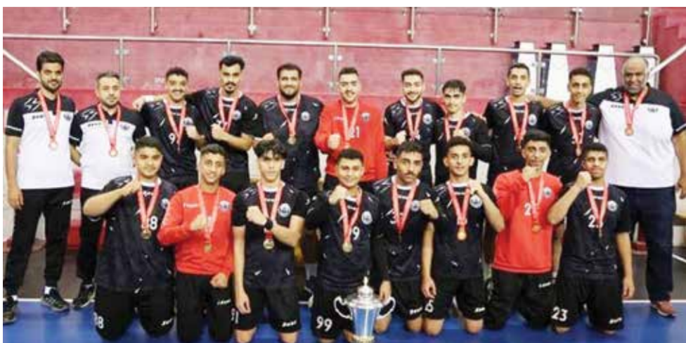
○ تتويج ناشئي سماهيج بلقب الدوري.

٦- هل ترى أن فريقك الجديد يمتلك مقومات المنافسة؟