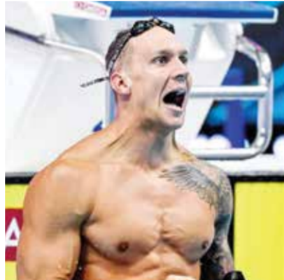
□ كايليپ دريسل