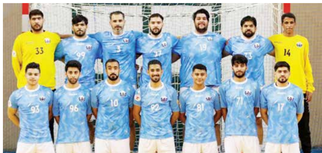
○ الفريق الأول لكرة اليد بنادي سماهيج.