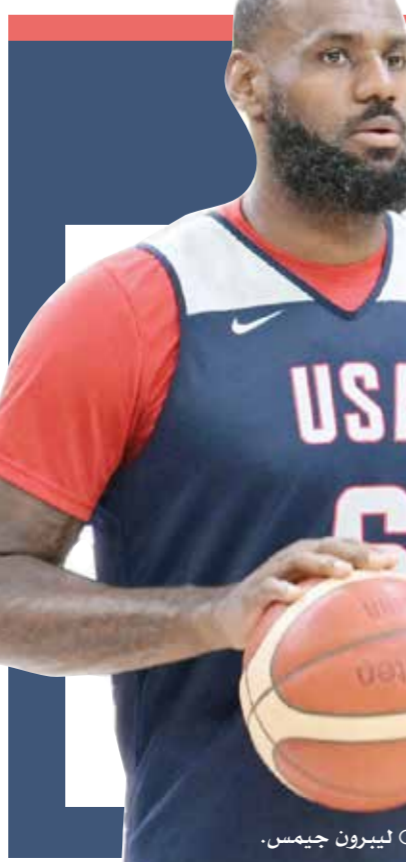
□ ليبرون جيمس.

- ٤٠٠ م حرة (سيدات): يجب أن يكون الرقم القياسي العالمي على المحك في واحدة من أكثر المواجهات المتوقعة في الألعاب، مع ثلاث سباحات في ذروة قوتهن في السباق. ستكون البطلة الأسترالية أريارن تيموس، حاملة اللقب، مرشحة بعد تسجيلها ثاني أسرع وقت على الإطلاق الشهر الماضي خلف أفضل رقم عالمي لها فقط وهو ٣:٥٥،٣٨ دقائق. فاجأت كايتي ليدبيكي في نهائي طوكيو المثير قبل ثلاث سنوات، حيث تسعى الأمريكية الرائعة إلى الانتقام. أفضل توقيت لليديكي هذا العام أيضا بثلاث ثوان تقريبا من تيموس، لكن لا يمكن استبعادها أبدا. تكمل الكندية الرائعة سامر ماکتوش، حاملة الرقم القياسي العالمي سابقا، الثلاثي المرشح بقوة للقب الأولمبي، لكن سبتين عليها أيضا رفع مستواها للحاق بتيموس.