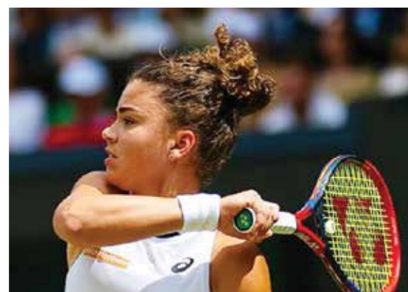
○ جاسمين باوليني

وقالت باوليني للصحفيين «من الغريب أن أعود إلى هنا بعد فترة قصيرة للغاية، أشعر باختلاف بعض الشيء. الكرات مختلفة وربما الملاعب مختلفة بعض الشيء أيضاً، والطقس مختلف أيضاً. لكنه دائماً مكان جميل للعب