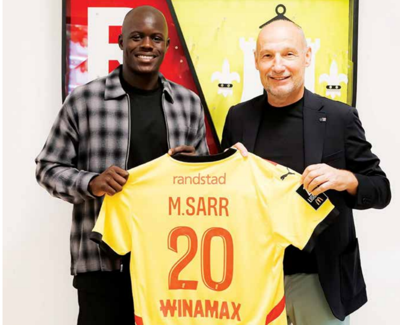
○ مالانغ سار