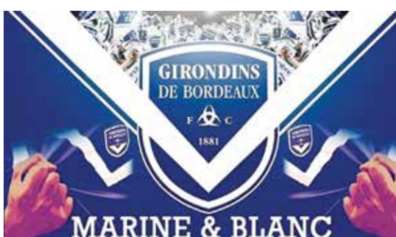
○ نادي بورديو

محتمل، إلا أن الصفقة فشلت. وهبط بورديو الواقع في جنوب غرب فرنسا إلى الدرجة الثانية عام ٢٠٢٢، بعد ١٢ عاماً من بلوغ ريع نهائي دوري أبطال أوروبا. وتدّد عمدة بورديو بيار هورميك بقرار مالك النادي جيرار لويس المولود في لوسمبورغ والذي يحمل الجنسية الإسبانية، إذ قال لوكالة فرانس برس «لقد علمت بنهول القرار المفاجئ والشخصي الذي اتخذته جيرار لويس. يؤكد هذا القرار الخيارات الإدارية الخطرة التي قادت نادينا في غضون ثلاث سنوات من النخبة إلى الهواة». مثل بورديو في تاريخه العديد من النجوم على رأسهم زين الدين زيدان، بالإضافة إلى بيكسينتي ليزارزو وكريستوف دوغاري، وأخيراً لاعب ريال مدريد الإسباني الحالي أوريليان تشواميني. وعلق ليزارزو المتوج بمونديال ١٩٩٨ عبر إنستغرام «أشعر باستياء كبير كحال كل من يحب النادي».