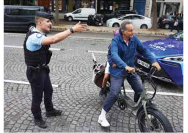
□ عنصر من الشرطة الألمانية.

باريس - (د ب أ): وصف رئيس الوزراء الفرنسي جابريل أتال الهجمات التي استهدفت شبكة القطارات السريعة بالبلاد أمس الجمعة بأنها «أعمال تخريب منسقة». وغرد أتال عبر منصة «إكس» أن آثار الهجوم على شبكة السكك الحديدية في يوم افتتاح دورة الألعاب الأولمبية ضخمة وحادة. وأضاف: «تمت تعبئة خدمات الاستخبارات ووكالات إنفاذ القانون للتعرف على الجناة في هذه الأعمال الإجرامية ومعاقبتهم». وأشار إلى أنه يفكر أيضا في جميع الفرنسيين الذين يستعدون لعطلاتهم: «أشاركهم الغضب وأقدر صبرهم وتفهمهم والروح المدنية التي يظهرونها».