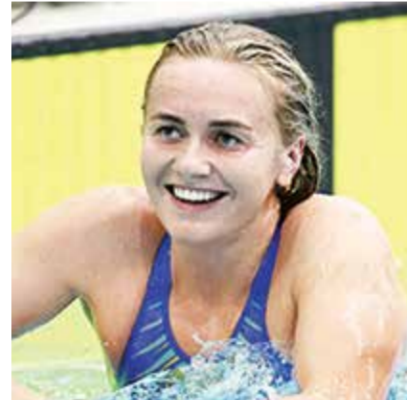
□ أريارن تيموس

- ١٠٠ م حرة (رجال): احتل النجم الأمريكي كايليپ دريسل المركز الثالث فقط في التجارب الأمريكية ولن يدافع عن لقبه، ما يجعل السباق مفتوحا على مصراعيه. تاهل المخضرم الأسترالي كايل تشالمرز، الحائز الميدالية الذهبية في عام ٢٠١٦ الذي جاء في المركز الثاني خلف دريسل في طوكيو، لكن سبتين عليه تقديم شيء مميز لصند الجبل القادم بقيادة الواعد الصيني بان جانلي، سيسعى الثنائي الأمريكي كريس جوليانو وجاك أليكسي والثلاثي الفرنسي داميان جولي وماكسيم غروسو إلى اقتحام المنافسة.