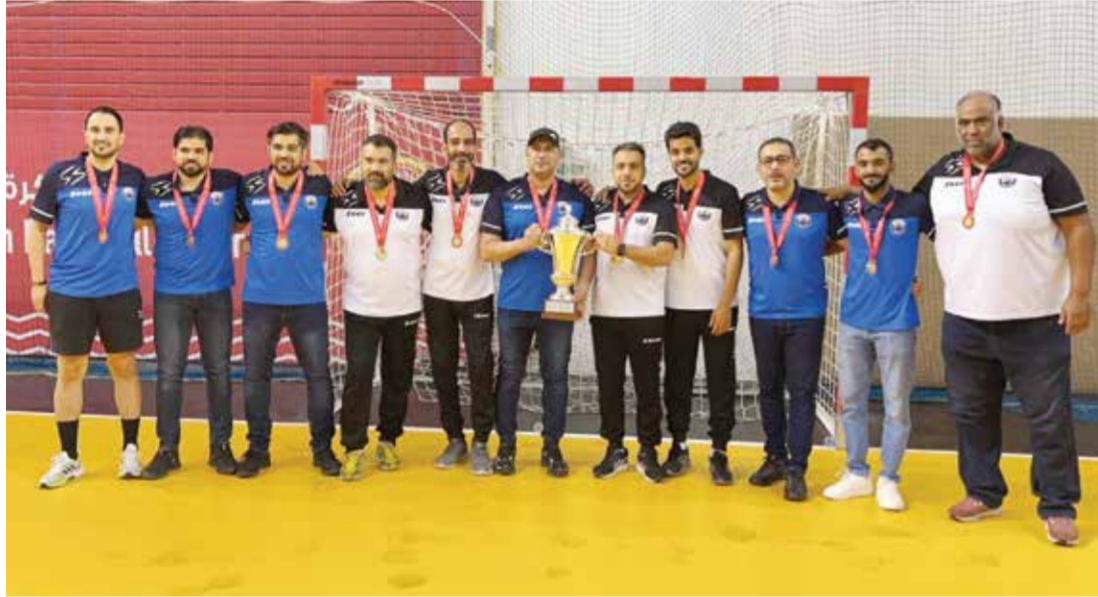
○ احتفال الجهاز الفني والإداري بتحقيق دوري الناشئين.

نستند على أسماء شابة ومتميزة من أبناء المنطقة