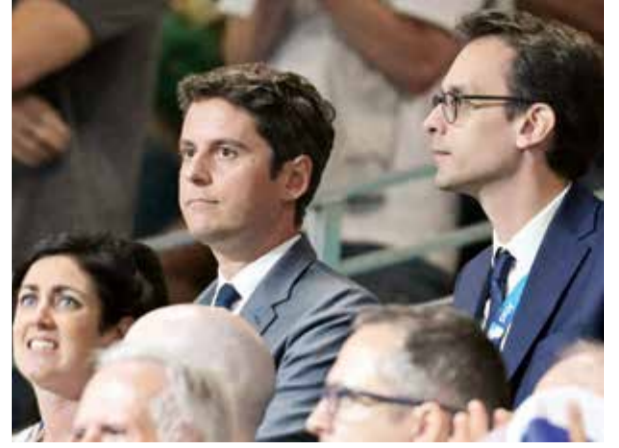
□ جابريل أتال

يحصل معظم هؤلاء الرياضيين اللاجئيين الذين يشاركون في ١٢ رياضة مختلفة في دورة الألعاب الأولمبية والبارالمبية في باريس، على الدعم