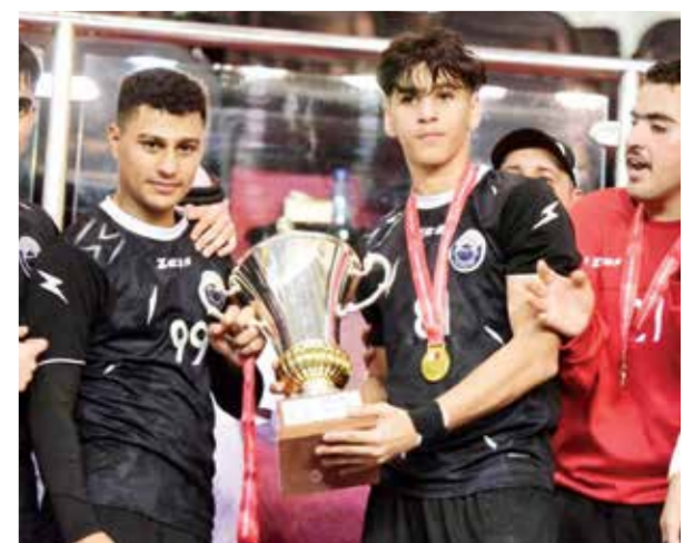
○ لاعبو سماهيج أثناء تتويجهم باللقب.