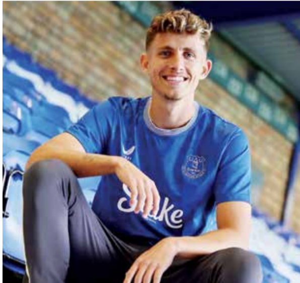
○ يسبر ليندستروم

باريس - (أ ب): تعرض نجم كرة القدم البرازيلية السابق زيكو لسرقة حقيبته التي كانت تحتوي على نقود وساعات والماس، على هامش انطلاق الألعاب الأولمبية الصيفية في باريس أمس الجمعة. وتقدم ارتور أنتونيس كويمبرا المعروف بزيكو، (٧١ عاماً) الذي شارك في ثلاث نسخ من كأس العالم بشكوى إلى الشرطة الفرنسية عقب تعرضه لسرقة من داخل سيارته في شمال باريس بعدما ترك النافذة مفتوحة، وذلك وفقاً لما أوضحه مكتب الادعاء. وأشارت صحيفة «لو باريزيان» إلى أن قيمة الممتلكات التي سُرقَت من زيكو تُقدر بـ ٥٤٢ ألف دولار، إذ تحتوي حقيبته على ساعة رولكس، وسلسلة من الألماس ونقود، فيما أشار مصدرٌ مقربٌ من القضية لوكالة فرانس برس إلى أن قيمة المبلغ المصرح عنه مبالغٌ فيها. وأحيلت التحقيقات إلى فرقة مكافحة الجريمة المنظمة التابعة للشرطة القضائية في باريس. ويوجد لاعب فلومينغو وأودينيزي الإيطالي ومدرب اليابان والعراق السابق في باريس كضيف مع البعثة الأولمبية البرازيلية.