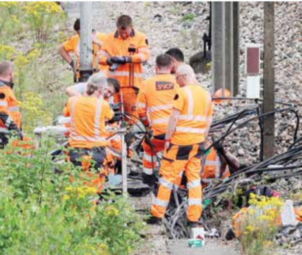
□ أثناء فحص شبكة السكك الحديدية المتضررة

□ ما تنمناه ألا يحدث مجزأ ما يعكر صفو الأولمبياد الحالي الذي عاش البارحة حالة افتتاح استثنائية، وحيث يتضرغ الأبطال اعتبارا من اليوم لحصاد الميداليات الملوثة؛ وان السباق الحقيقي سيكون على الذهب في منافسات الأوزان وضد الساعة، وحلمنا ان يتوج رياضونا بذهاب يشوق ما حصلنا عليه سابقا؛ وهذا عشمنا في ابطالنا وبالذات في أم الألعاب التي هي أمنا الأكبر.