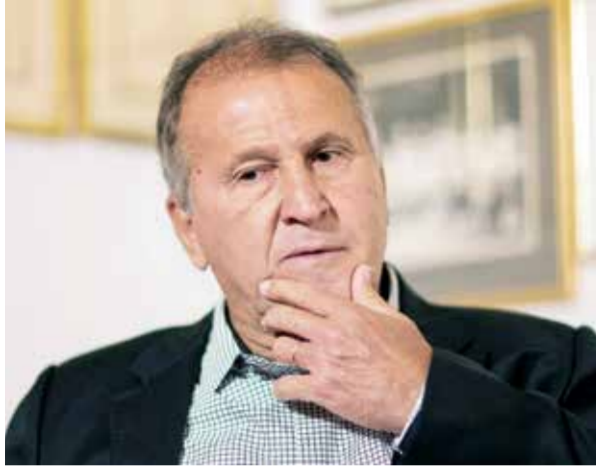
○ البرازيلي زيكو