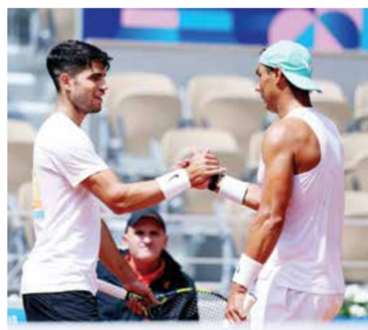
○ نادال وألكاراس

وجمع الإسباني، على ملاعب رولان غاروس ١٤ لقباً من أصل ٢٢ في مسيرته، وهو لم يذق طعم الهزيمة سوى ٤ مرات في ١١٦ مباراة. لكن مغامرته العام الحالي في البطولة الفرنسية انتهت عند الدور الأول على يد حامل اللقب الأولمبي الألماني ألكسندر زفيريف.