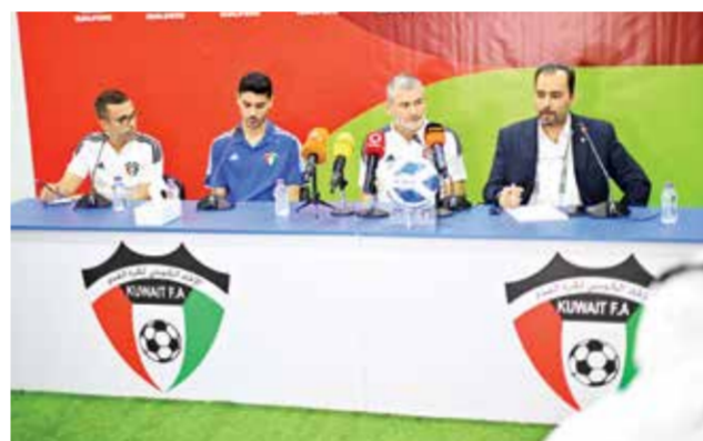
○ جانب من المؤتمر الصحفي لمنتخب الكويت