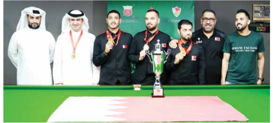
○ منتخب البحرين للسنوكر مُتوجًا بذهبية الفرق