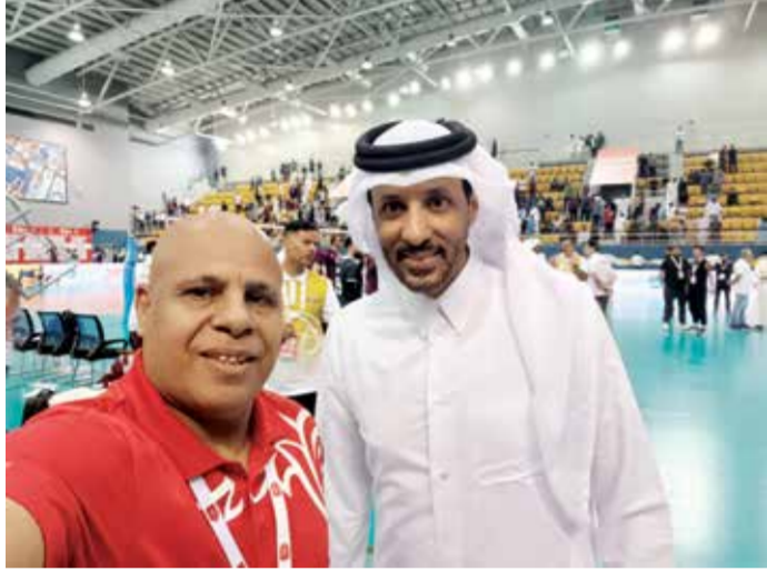
○ الكواري مع محرر الملحق الرياضي