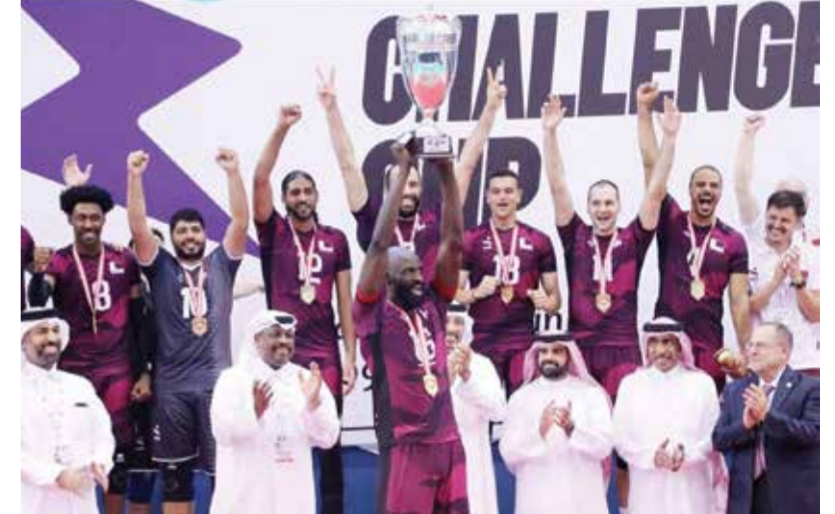
○ منتخب قطر يحتفل بكأس البطولة