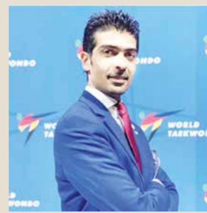
○ محمد بن جمال

فهو رئيس لجنة الباراتايكواندو الآسيوية، وحاصل على العديد من الاعتمادات الدولية الفنية والإدارية الصادرة من الاتحاد العالمي للتايكواندو كحكم دولي درجة أولى، وأحد اثنين في الخليج كمحاضر ومدرب فني وحاصل على المستوى الثالث «أعلى درجة» كمدرّب دولي، بالإضافة إلى مشاركته في معظم البطولات القارية والدولية الهامة كحكم ومشرف ورئيساً لبعض البطولات.