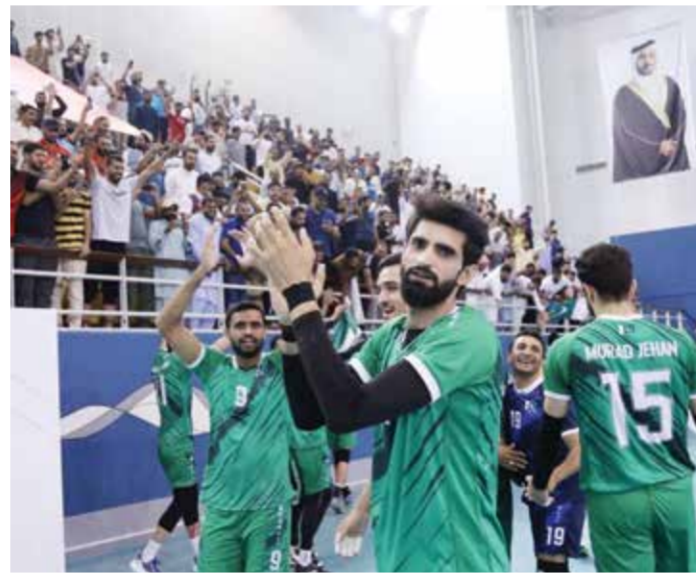
○ لاعب باكستان في لحظة يحيون جماهيرهم