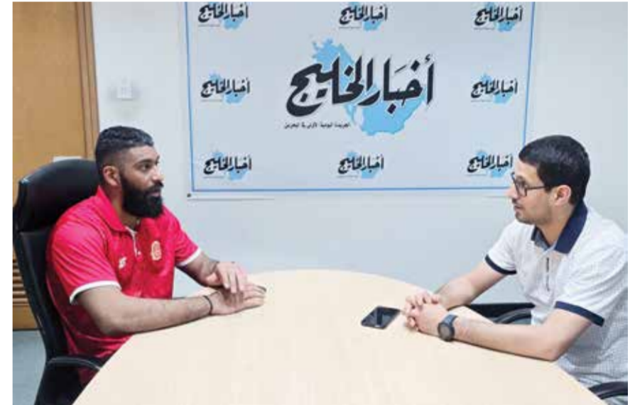
جانب من الحوار الصحفي