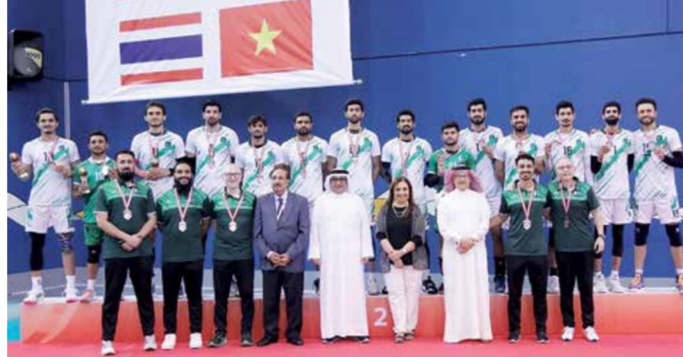
○ منتخب باكستان خلال التتويج