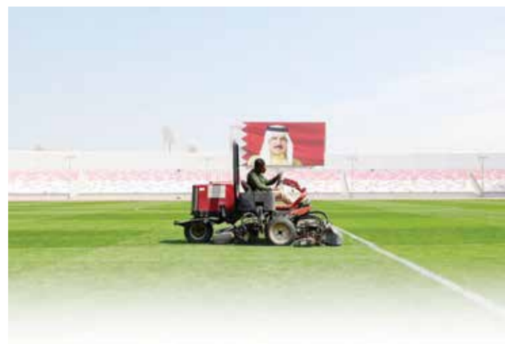
○ جانب من أعمال الصيانة