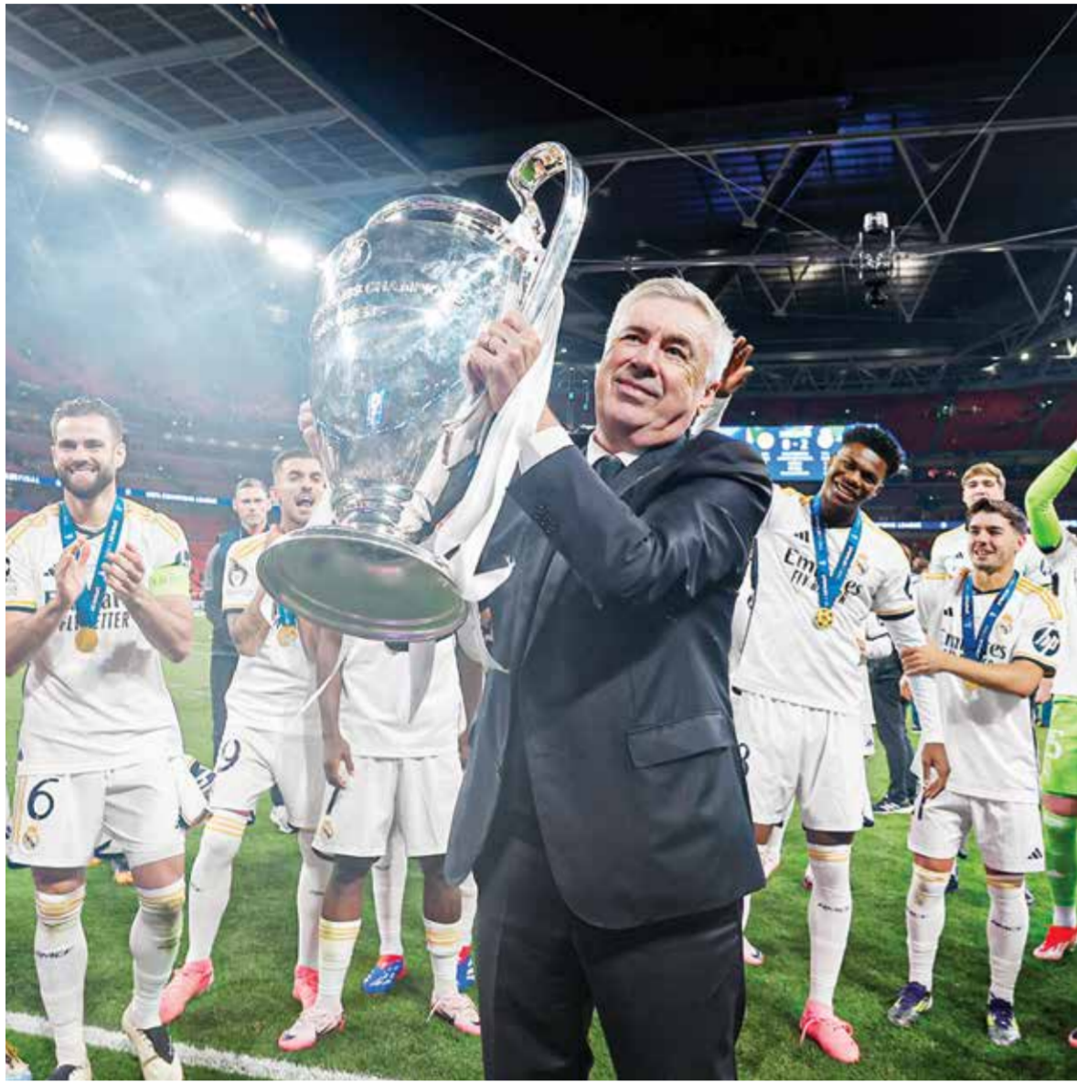
○ الريال بطل أوروبا

مدريد - (أ ف ب): أكد ريال مدريد الإسباني المتوج بلقب دوري أبطال أوروبا للمرة الخامسة عشرة في تاريخه في بيان أمس الاثنين، مشاركته في مونديال الأندية لكرة القدم بحلته الجديدة الموسعة العام المقبل، خلافاً لما قاله مديره الإيطالي كارلو أنشيلوتي في مقابلة صحفية. وقال النادي الملكي: «يعلن ريال مدريد أنه لم يُفكر في أي وقت بعدم مشاركته في مونديال الأندية الذي سينظمه الاتحاد الدولي لكرة القدم (فيفا) للموسم المقبل ٢٠٢٤/٢٥». وأضاف: «وبالتالي، سيشارك نادينا، كما هو مخطط، في هذه المسابقة الرسمية التي نخوضها بفخر وحماس كبيرين لجمع ملايين مشجعيها حول العالم يحملون مرة أخرى بلقب جديد».