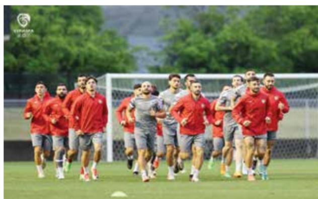
○ استعدادات سوريا

التي يعلمها الجميع. صحيح أن الأداء لم يكن بالمستوى المطلوب، لكن النتيجة كانت هي الأهم لأننا كنا بحاجة إلى التعادل من أجل حسم التأهل.. وستكون المواجهة الثانية في المجموعة بين لبنان وبنغلادش على استاد خليفة الدولي في قطر حيث يسعى الأول إلى إنهاء هذا الدور بفوز أول معنوي بعد اكتفائه بثلاثة تعادلات.