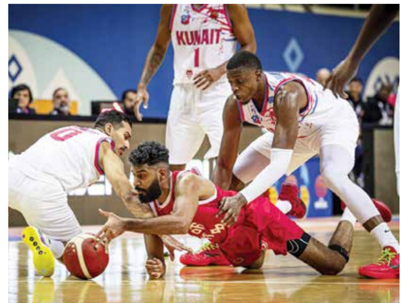
من مشاركة المحرق في بطولة واصل