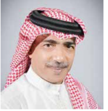
○ الشيخ علي بن محمد آل خليفة

أقام المنتخب الوطني للكاراتيه معسكراً تدريبياً مشتركاً مع نادي النجوم الرياضي بالملكة العربية السعودية بمشاركة عدد من الأندية السعودية، وذلك في إطار تحضيرات منتخبنا الوطني للمشاركة القادمة. ويأتي المعسكر من أجل رفع سقف التحضيرات للاعبين تمهيداً للمشاركة المقبلة، إضافة إلى زيادة الاحتكاك والخبرات والوصول إلى كامل الجاهزية. وشهد المعسكر بين المنتخب الوطني ونادي النجوم الرياضي مشاركة عدة أندية من المملكة العربية السعودية هي: أندية الهداية والفتح والابتناس، حيث أقيم المعسكر في مركز رواد القوة الرياضي. وأكد المدير الفني بالاتحاد البحريني للكاراتيه المدرب محمد العربي بومزبر أن المنتخب الوطني حقق كافة الأهداف المرجوة من المعسكر، وهي احتكاك اللاعبين وتقوية البنية الجسمانية وكسب اللاعبين الثقة في النفس وزرع روح التحدي والاصرار، مبيناً أن اللاعبين قدموا مستويات طيبة وبارزة طوال المعسكر، مشيراً إلى أن المعسكر تخلله عدد من المواجهات الودية بين اللاعبين، مقدماً شكره وتقديره إلى الاتحاد البحريني للكاراتيه على إقامة المعسكر التدريبي بالتعاون مع نادي النجوم الرياضي السعودي.