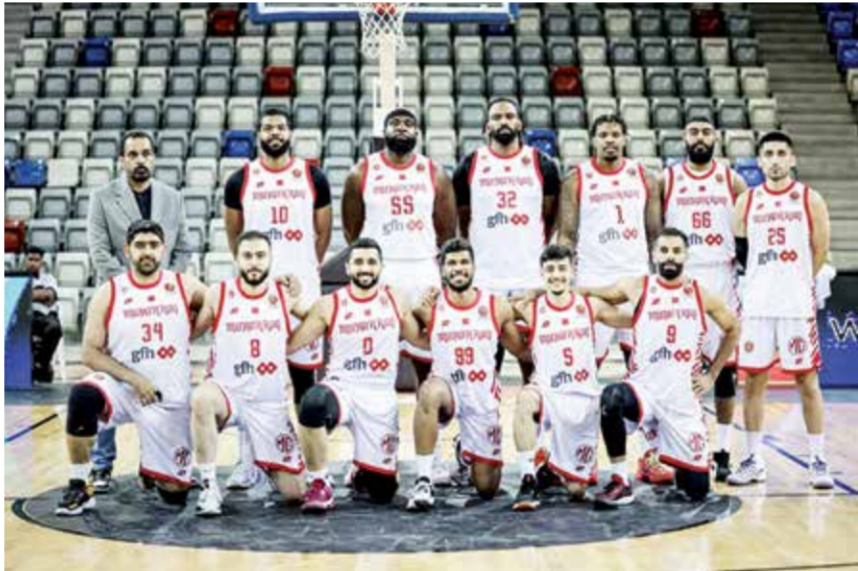
فريق المحرق لكرة السلة