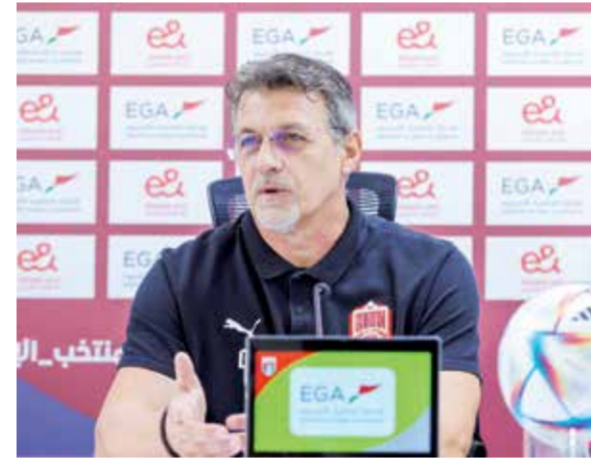
○ الكرواتي دراغان

عين الاتحاد الدولي لكرة القدم طاقم صيني لإدارة مباراة اليوم، بقيادة حكم الساحة مانينغ، والمساعد الأول زهو، والمساعد الثاني زهانغ شينغ، فيما سيكون ليو مان من هونغ كونغ حكماً رابعاً.