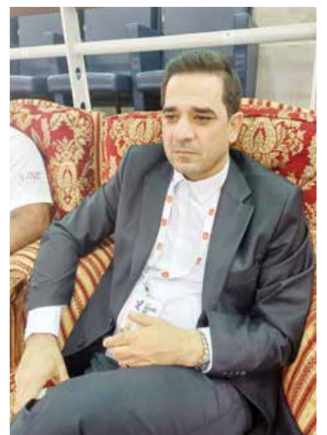
○ مهدي تقوي

وتابع رئيس اتحاد الطائرة الإيراني بأن منتخبه يمر بمرحلة من الإحلال والإبدال، وأنهم بعد منافسات دوري الأمم سيقدّمون على استبعاد أكثر من لاعب وإحلال آخرين مكانهم. وكشف مهدي تقوي للملحق الرياضي في (أخبار الخليج) عن أنهم في طريقهم للتعاقب مع مدرب من الطراز العالمي لقيادة المنتخب الإيراني خلال المرحلة المقبلة. ويمني رئيس الاتحاد الإيراني النفس ألا تطول فترة عودة المنتخب إلى سابق عهده كأحد المنتخبات التي يشار إليها بالبنان، فالكرة الطائرة من الألعاب التي لها شعبيتها الجارفة وجهورها الكبير في إيران، ومن هذا المنطلق لا نريد أن تتأخر عودة هذا المنتخب من أجل هذا الجمهور على حد تعبيره.