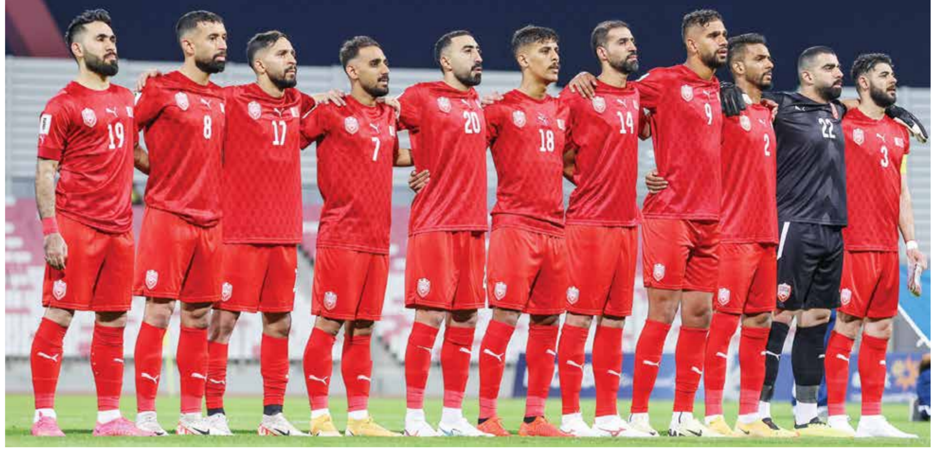
○ منتخبنا الوطني لكرة القدم