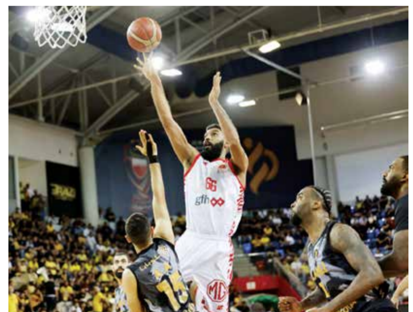
لقطة من المنافسات المحلية