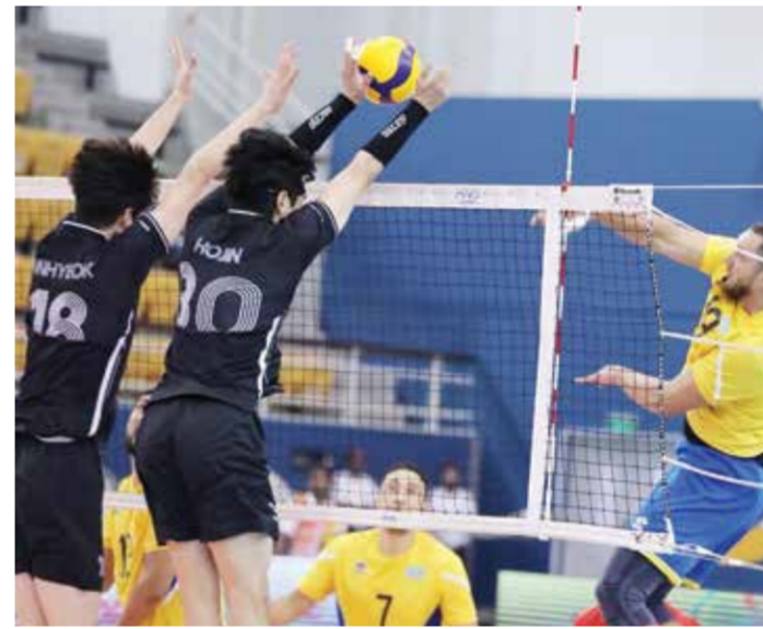
○ من لقاء كوريا وكازاخستان