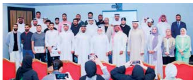
○ صورة جماعية للخريجين