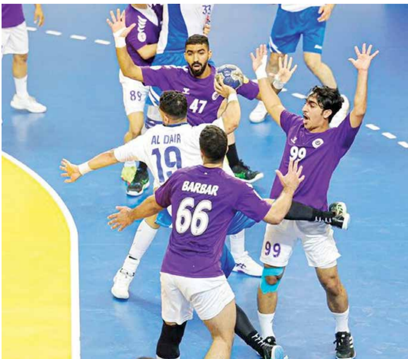
O من مباريات دوري خالد بن حمد