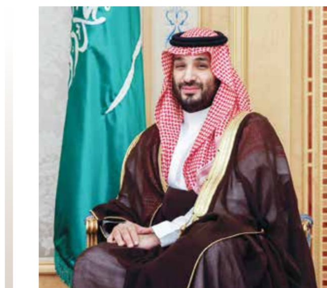
ولي العهد السعودي.

على غزة وتسهيل دخول المساعدات الإنسانية. وقال البيت الأبيض يوم الجمعة إن سوليفان سيزور السعودية وإسرائيل لبحث القضايا الثنائية والإقليمية بما في ذلك غزة والجهود المبذولة لتحقيق السلام والأمن الدائمين في المنطقة.