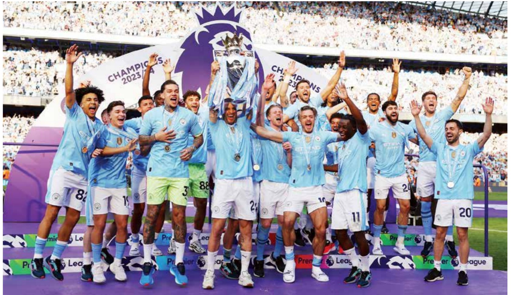
○ سيتي يحصل على لقبه الرابع توالياً

لندن - : فاز توتنهام هوتسبير على مضيفه شيفيلد يونايتد ٣-٠ صفر على استاد برامل لين في مباراته الأخيرة بالدوري الإنجليزي الممتاز لكرة القدم هذا الموسم أمس الأحد ليقتنص المركز الخامس ويتأهل للدوري الأوروبي. وساعدت النتيجة توتنهام على إنهاء الموسم برصيد ٦٦ نقطة، متراجعا بشارق نقطتين عن أستون فيلا صاحب المركز الرابع ومتقدماً بثلاث نقاط عن جاره اللندني تشيلسي. وسجل ديان كولوسيفسكي هدفين، بواقع هدف في كل شوط، بينما سجل بيدرو بورو أيضاً بتسديدة خاطفة لم تمنح حارس مرمى شيفيلد يونايتد ويس فودرينجهم أي فرصة للتصدي. وأنهى شيفيلد، الذي تأكد هبوطه الشهر الماضي، الموسم بأسوأ سجل دفاعي في تاريخ الدوري الإنجليزي الممتاز بعد أن تلقت شباكه ١٠٤ أهداف في ٣٨ مباراة.