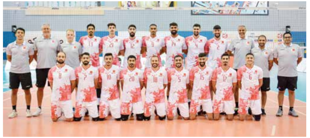
○ منتخبنا الوطني لكرة الطائرة

وعن آخر المستجدات قال إلبيتا إن كل شيء مستمر، ويسير بحسب طريقة العمل المقترحة