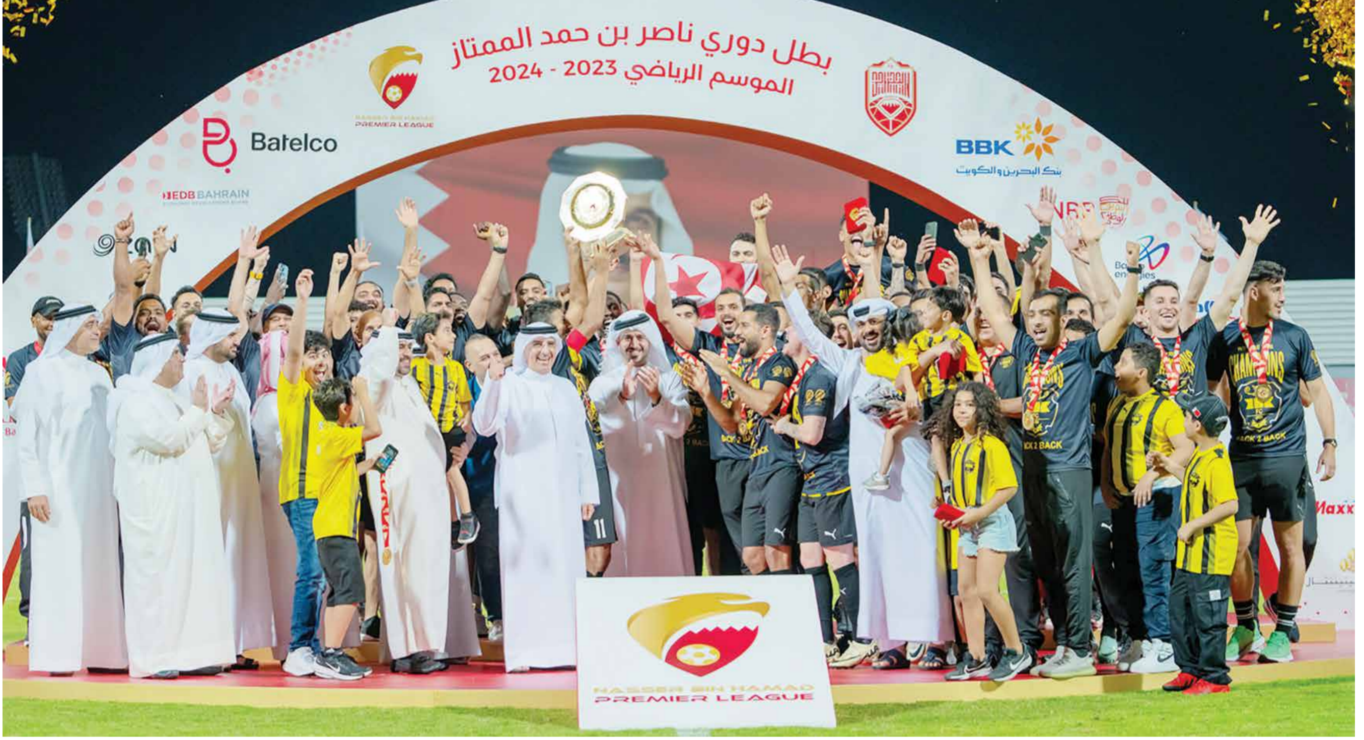
○ سمو الشيخ خالد بن حمد ويتوج الخالدية باللقب