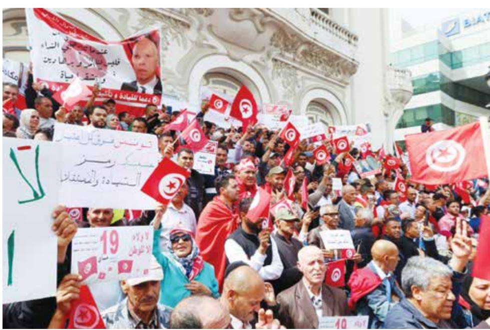
○ جانب من تظاهرة المؤيدين للرئيس التونسي.