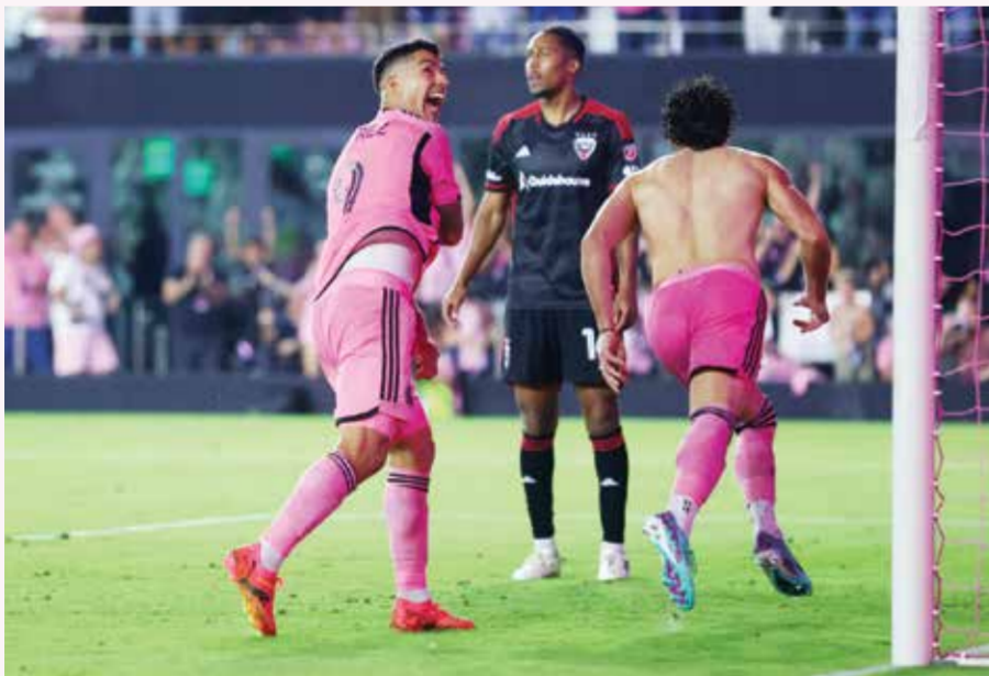
○ الهدف القاتل