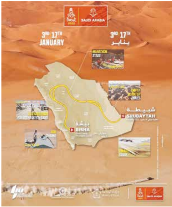
○ مسار الرالي السادس