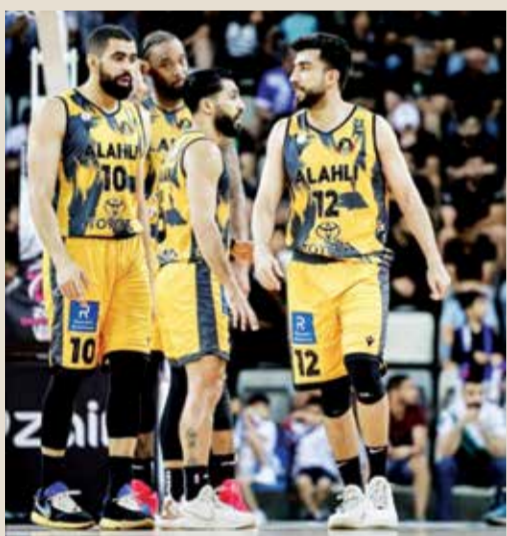
○ الأهلي يعول على الروح القتالية

□ ما يكتب في هذا المكان هو يعبر عن رأي وقناعة وفكر وثقافة الكاتب، وما يكتب هنا للقارئ بطبيعة الحال، ولكن في الوقت نفسه ليس القارئ الكريم ملزماً أو مجبراً أن يحرك رقبته إعجاباً بما يكتب، فقد يعجبه وقد لا، وهذا من حقه، ولكن ليس من حقه أبداً أن تستعرض عضلاتك المترهلة.