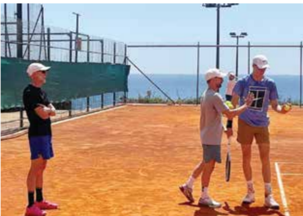
○ سينر أثناء التدريب

المفتوحة، ثم توج في روتردام وميامي، ليرفع عدد ألقابه في مسيرته إلى ١٣.