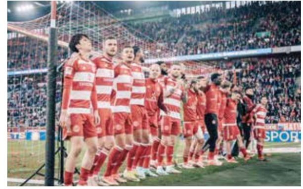
○ فريق دوسلدورف

وأضاف: «ستكون هاتان المبارياتان متقاربتين للغاية، وخاصة في كاستروير شتراسه (في بوخوم)، لكننا سنخوض المباريات بثقة كبيرة في النفس، وسنبذل كل ما في وسعنا مع جماهيرنا لتحقيق الترتي». وقال أوتافيو مونتيرو: «يأمل بوخوم الاستمرار في دوري الأضواء للموسم الثالث على التوالي».