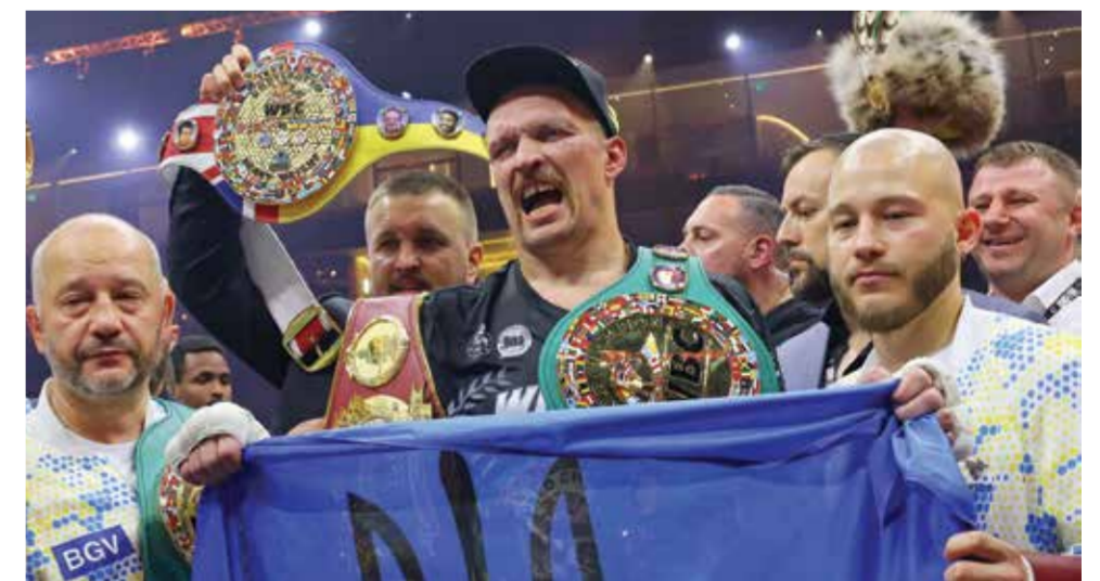
○ أوسيك يفوز بأول لقب عالمي. (أ ف ب)

وحسب الصور التي نشرها مساء السبت على مواقع التواصل الاجتماعي، ظهر سينر (٢٢ عاماً) وهو يحمل ترابلي في موناكو، حيث بقيم. ولم يكتب الإيطالي رسالة بل أرفق صورته بأربعة رموز تعبيرية، من بينها ساعة رملية والعلم الفرنسي، في إشارة من دون أدنى شك إلى سباقه مع الزمن للاستعداد لبطولة رولان غاروس (٢٦ مايو-٩ يونيو). وعندما أعلن رسمياً عدم مشاركته في دورة روما عقب انسحابه للإصابة في مدريد قبل مباراة ربع النهائي، أوضح سينر أنه سيعين عليه أخذ