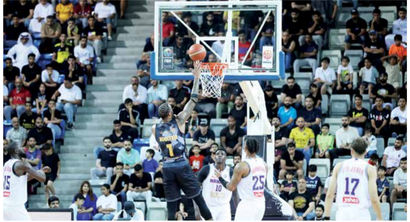
○ من لقاء الأهلي والمنامة الأخير