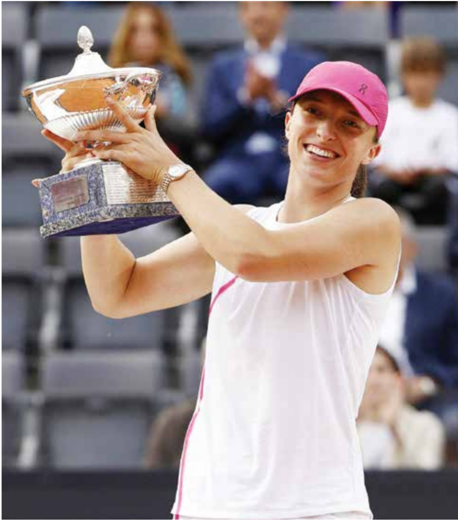
○ شفيونتيك تحمل لقبها الجديد (رويترز)

روما - (أ ف ب): أحرزت البولندية إيغا شفيونتيك المصنفة أولى عالمياً لقب دورة روما لمارسترز الألف نقطة في كرة المضرب بفوزها على اليلاروسية أرينا سابالينكا الثانية ٦-٢ و٦-٣ السبت في طريقها لإحراز لقبها الثالث في العاصمة الإيطالية بعد عامي ٢٠٢١ و٢٠٢٢. واللقب هو الحادي والعشرون لشفيونتيك (٢٢ عاماً) في مسيرتها والرابع منذ مطلع العام الحالي بعد دورات الدوحة واندريان ويلز ومدريد، ويأتي قبل ٨ أيام من انطلاق بطولة رولان غاروس الفرنسية، ثمانية البطولات الأربع الكبرى ضمن الفراند سلام، والتي ستكون البولندية أبرز المرشحات للتتويج بها ولا سيما أنها أحرزت اللقب ٣ مرات أعوام ٢٠٢٠ و٢٠٢٢ و٢٠٢٣. وبنات شفيونتيك أول لاعبة منذ الأمريكية سيرينا وليامس عام ٢٠١٣ تحرز لقب دورتي مدريد وروما في العام ذاته، كما حققت فوزها الثامن على منافستها في ١١ مواجهة جمعت بينهما والثالث توالياً. وقالت شفيونتيك: «نهائي آخر، ومباراة رائعة أخرى. بعد نهائي مدريد، كنت أدرك أن الأمور لن تكون سهلة، فالنتيجة قد تذهب بأي اتجاه في أي لحظة». ولم تخسر البولندية أي مجموعة في دورة روما.