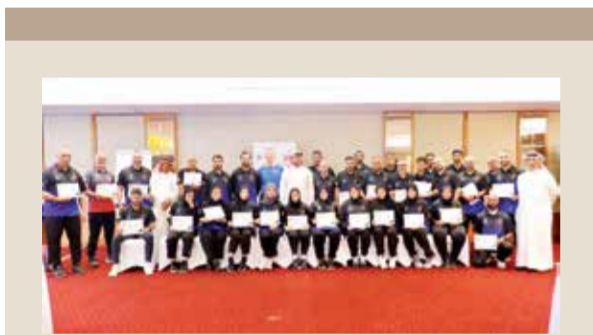
○ صورة جماعية للمشاركين.

سَأَلَ الْمَقَالَ مُشَوِّقًا إِلَيْكَ أَيَا سَلْمَانَ، فَهَلَّكَ رَحَلَتْ مُطَارِقًا عَنْهُ بِلَا اسْتِثْنَاءٍ، وَغَدَا الْمَقَالَ فِي الْجَرِيدَةِ مَبْتَمًا أَحْرَفَهُ مَهْمُومَةٌ كَلِمَاتُهُ مَتَعِبَةٌ وَسَطُورُهُ تَنْتَابُهُ أَحْزَانٌ.