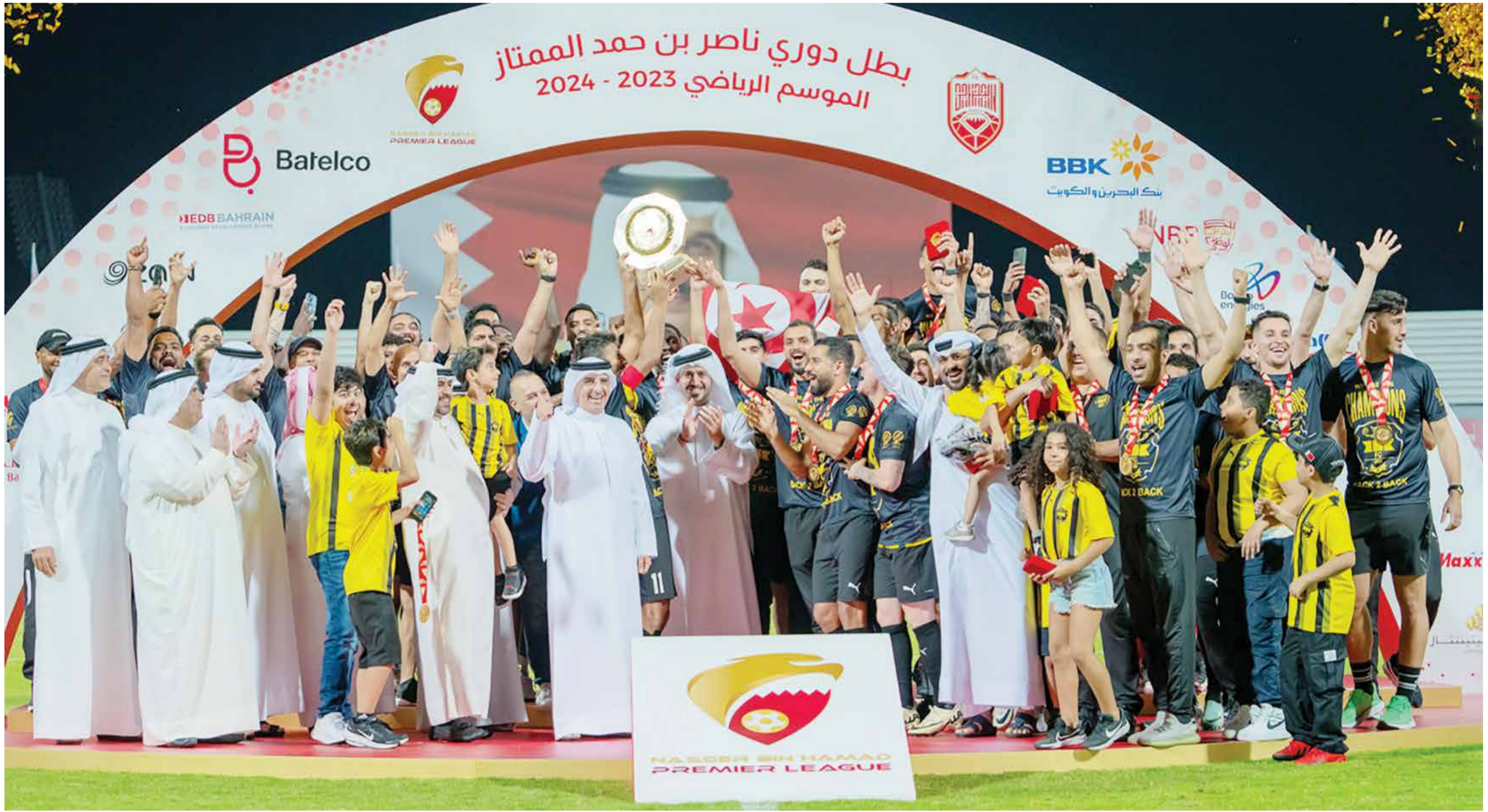
○ سمو الشيخ خالد بن حمد ويتوج الخالدية باللقب