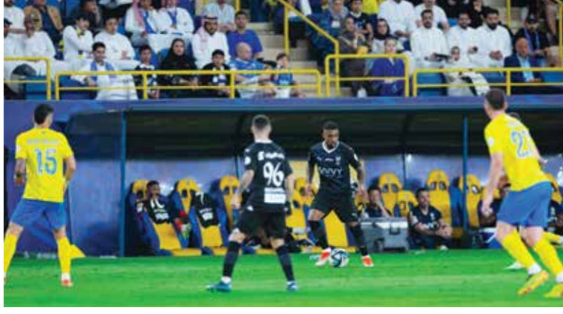
○ من لقاء النصر والهلال.

أوروبا في سوق الانتقالات، قال كالسادا، «بالتأكيد نعم، ولقد حدث بالفعل، (البرتغالي) روبن نيفيش و(الصربي) سيرغي ميلينكوفيتش-سافيتش كانا مطلوبين من فرق مهمة للغاية». أضاف «هنا يمكن للاعب أن يكون سعيداً وأنت لا تأتي فقط لكسب المال. الحياة جيدة والناس ساحرون والكثير من الحياة والحركة». مكتسحاً ألبها بخماسية في موسمه الأول بعد عودته إلى دوري المحترفين، ضمن الأهلي المشاركة في دوري أبطال آسيا للنخبة الموسم المقبل، بعدما ثبتت أقدامه في المركز الثالث «وهو المكان الذي نستحقه، حسب الجناح «الراقي» الجزائري رياض محرز».