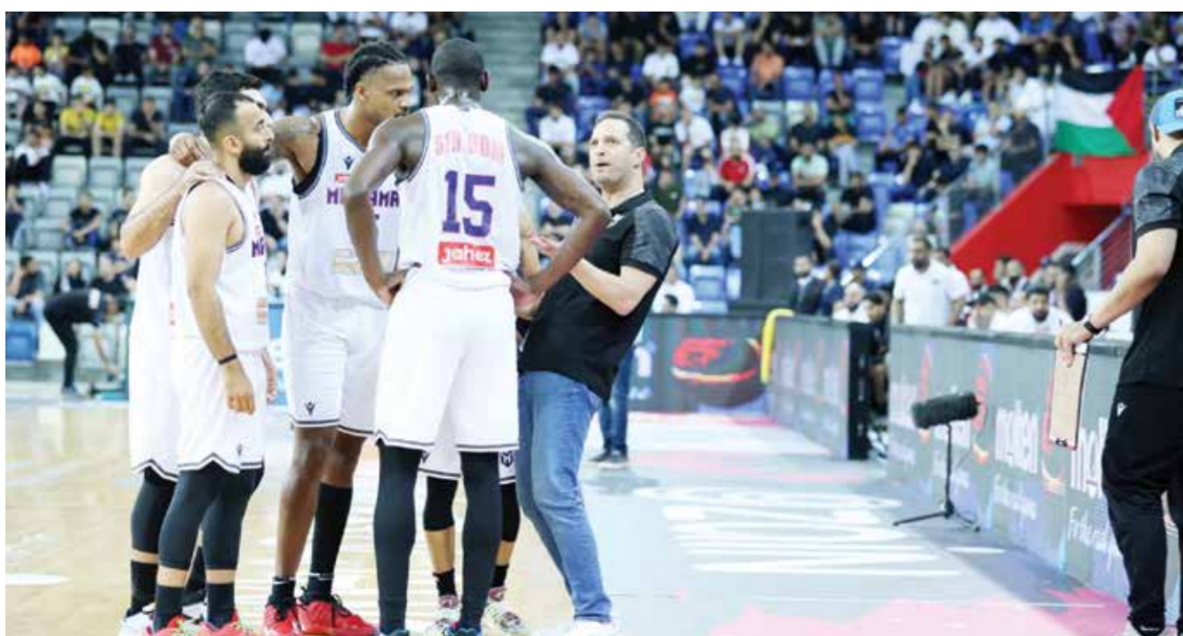
○ لينوس بحث عن الحلول ولم ينجح