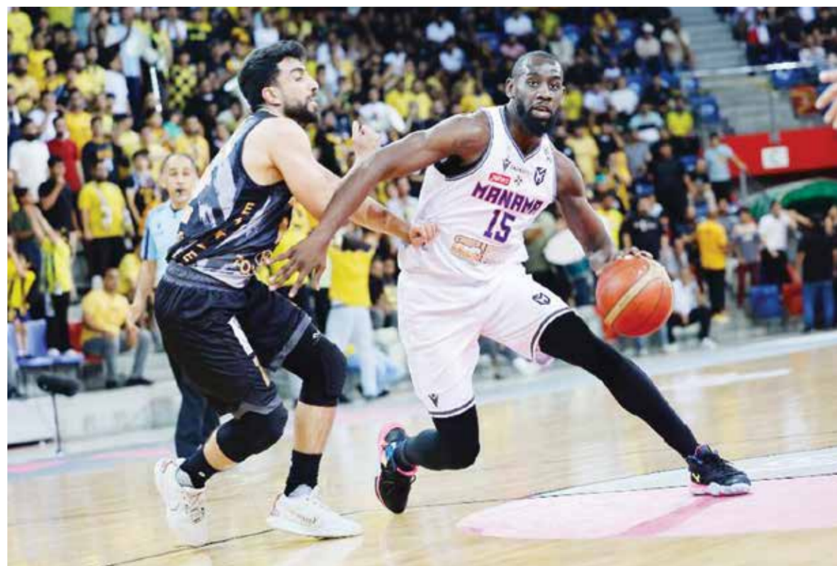
○ من لقاء سابق بين المنامة والأهلي.

ومن المؤكد أن جماهير الفريقين ستحتشد قبل ساعات من أجل دخول الصالة والاستعداد للتشجيع ومشاهدة هذه المواجهة المرتقبة.