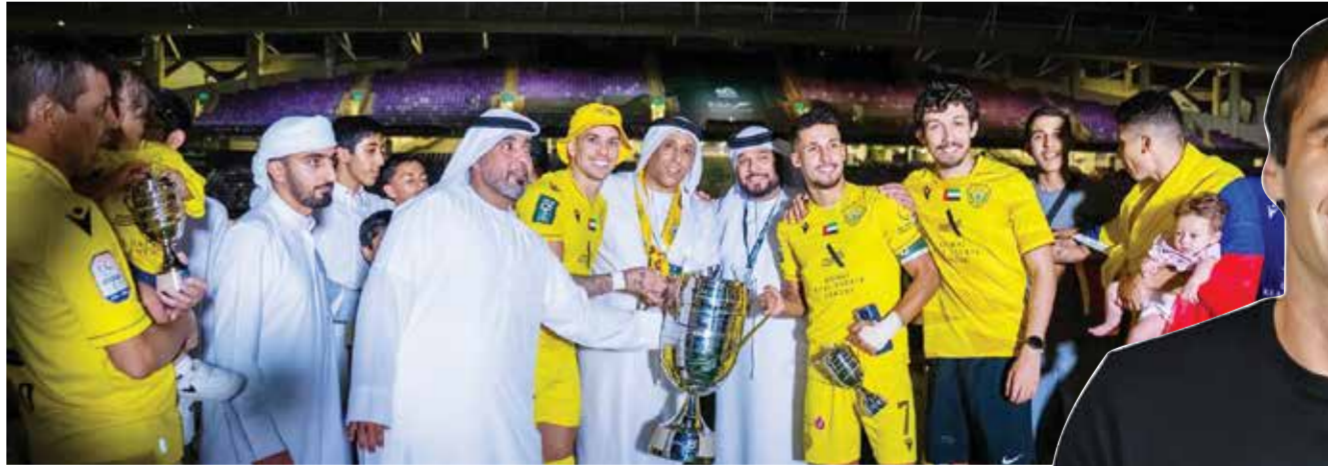
○ الوصل بطل كأس رئيس الدولة

دبي - (أ ف ب): يتطلع الوصل الممتشي بفوزه بلقب مسابقة كأس الإمارات لكرة القدم إلى استعادة نعمة الانتصارات واجتياز خطوة مهمة نحو إحراز الثنائية، عندما يحل ضيفاً على الاتحاد كلباء العاشر اليوم الثلاثاء في المرحلة الرابعة والعشرين من الدوري. أحرز الوصل كأس الإمارات للمرة الثالثة بفوزه الكبير على النصر ٤-٠ في النهائي للجمعة، ليحبي أمله بتحقيق ثنائية الدوري-الكأس للمرة الثانية في تاريخه بعد عام ٢٠٠٧، ولاسيما أنه يتصدر ترتيب الدوري بفارق ٦ نقاط عن وصيفه شباب الأهلي، حامل اللقب، مع تبقي ٤ مباريات للفريقين. ويسعى «الإمبراطور» أمام الاتحاد كلباء (٢٤ نقطة) لتعويض خسارته الكبيرة أمام الوحدة ١-٠ في المرحلة الماضية، قبل خوضه ثلاث مباريات قوية وحاسمة أمام كل من العين الرابع، وصيفه شباب الأهلي والنصر الخامس.