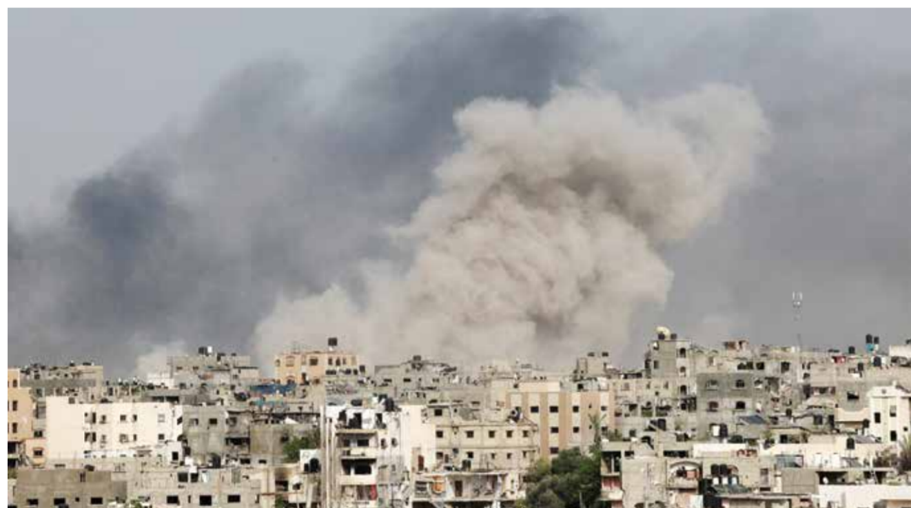
دخان يتصاعد من مخيم جباليا جراء القصف الإسرائيلي المكثف والمتواصل.