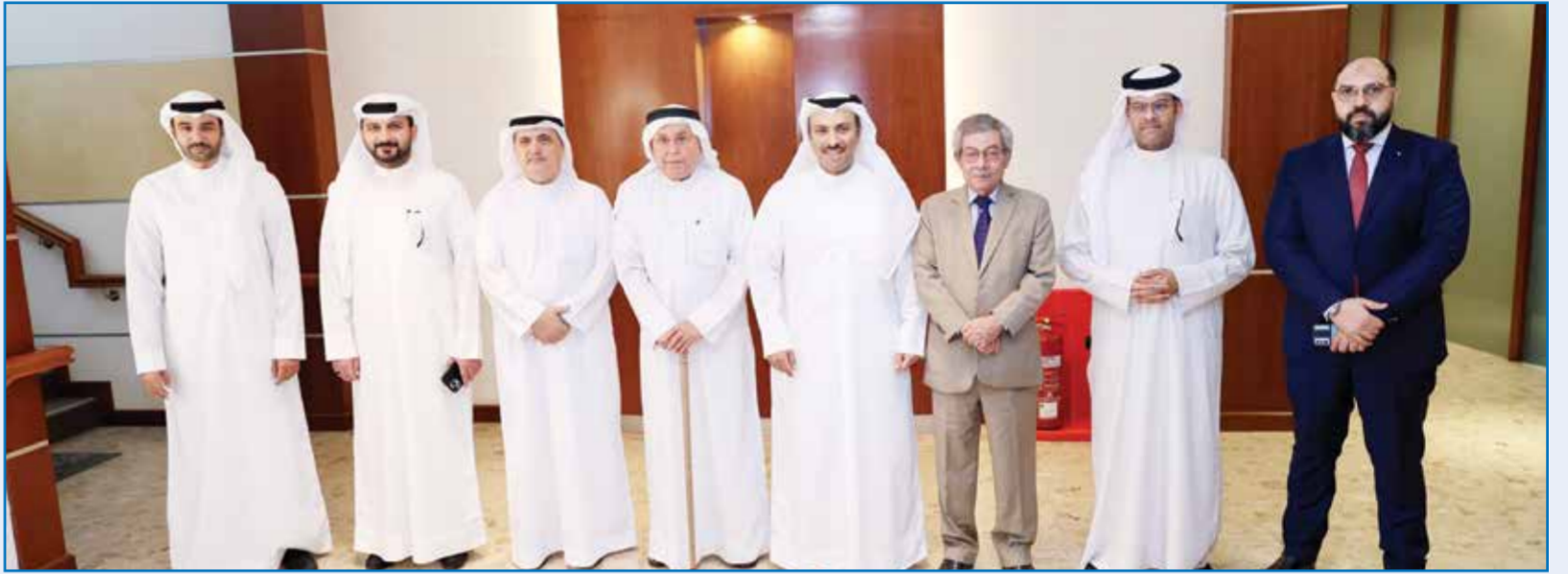
○ وزير الإعلام خلال زيارته «أخبار الخليج» ولقائه رئيس التحرير.