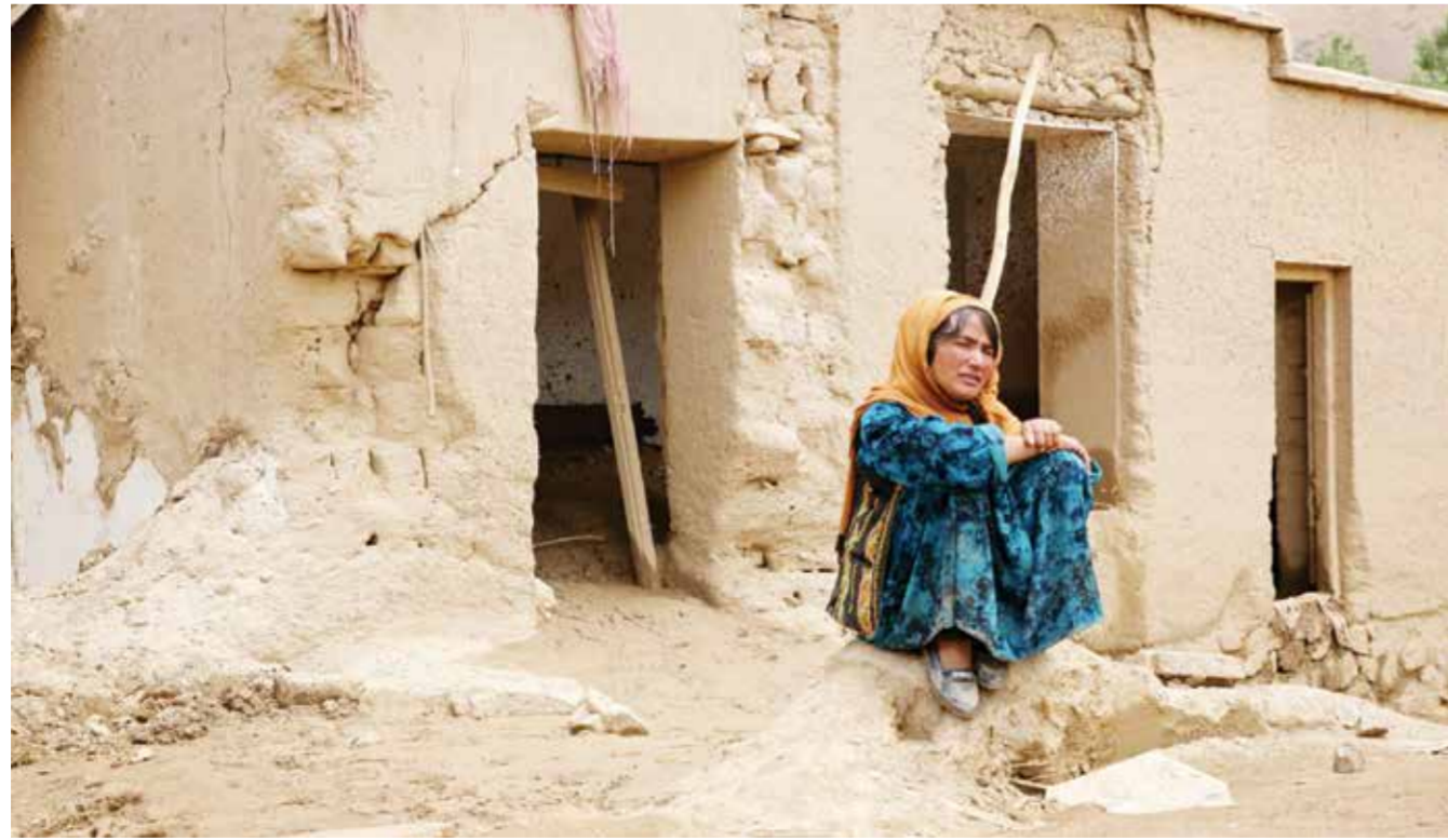
○ أفغانية أمام منزلها بعد الفيضانات.

قُتل ٦٦ شخصا جراء فيضانات جديدة في ولاية فارياب شمالي أفغانستان، التي تواجه سلسلة من الفيضانات، حسبما أعلن متحدث باسم الولاية، أمس الأحد. ووفق وكالة «فرانس برس»، أعلن عصمت الله مرادي أن أمطارا غزيرة هطلت مساء السبت في مناطق عديدة، أدت إلى مقتل ٦٦ شخصا في فارياب، وكانت فيضانات تسببت بها أمطار غزيرة أدت إلى مقتل ٥٥ شخصا، السبت، في ولاية غور (غرب)، بحسب السلطات. وسُجل مقتل ٣٠٠ شخص على الأقل في ولاية بغلان (شمال) الأكثر تضررا.