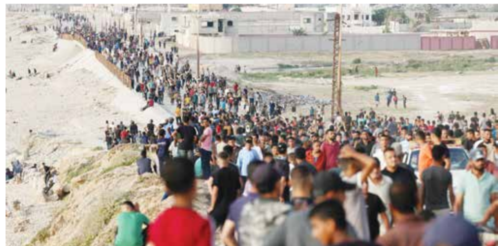
مئات من الفلسطينيين يحتشدون على أمل الحصول على مساعدات إغاثية بعد إقامة الميناء العالم.

وأعلم أن الأمين العام يشعر أيضا بقوة أن الأمم المتحدة بحاجة إلى أن تكون حاضرة على الطاولة عندما تتم مناقشة كل تلك الأمور». لكنه حذر من احتمال نشر قوة حفظ سلام تابعة للأمم المتحدة في الأراضي الفلسطينية، ذلك أنه قد يواجه باستخدام الفيتو من جانب الأعضاء الدائمين في مجلس الأمن، في حين أن ذلك يتطلب أيضا قبول الأطراف المتحاربة لوجود الأمم المتحدة.