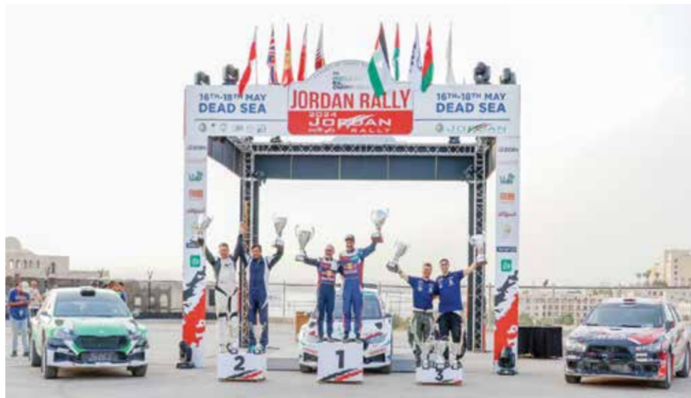
○ العطية يحتفل بفوزه الـ١٦

الأردن. هو الرالي المفضل بالنسبة لي والأصعب في الشرق الأوسط. للعودة بقوة مع السيارة الجديدة، نحن نتعلم الكثير. شكراً