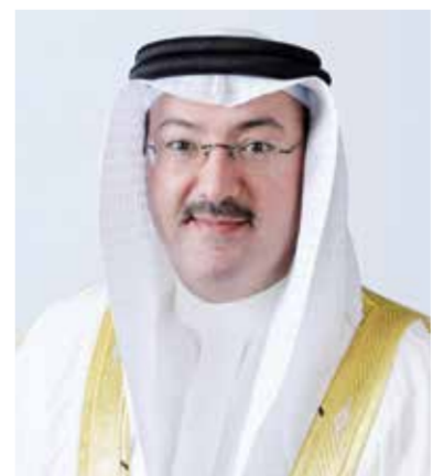
○ الشيخ محمد بن خليفة.

التنظيم العقاري إلى أن تقرير المنصة للربع الأول من العام الجاري يسلط الضوء على أهم المعلومات العقارية، بما فيها معاملات البيع، وقيمتها، وعدد تراخيص البناء الصادرة، فضلاً عن قيمة مشاريع البيع على الخريطة المرخصة، وقيمة المبيعات منها، التي سجلت جميعها نمواً تصاعدياً في مختلف مساراتها بما يرسخ من زخم القطاع ودوره في دعم الاقتصاد الوطني. واستعرض التقرير أعلى ١٠ تصانيف بحسب عدد معاملات البيع خلال الربع الأول من عام ٢٠٢٤، التي شهدت نمواً بنسبة ١٣%، حيث شكلت التصانيف ذات الطبيعة الخاصة (SP) نسبة ٢٢%، تلتها تصنيف السكن الخاص (RA) بنسبة ١٨%، ومن ثمّ تصانيف مناطق السكن المتصل (RHA) بنسبة ١٣% لترتفع بذلك قيمة معاملات البيع بنسبة ٢٣%.