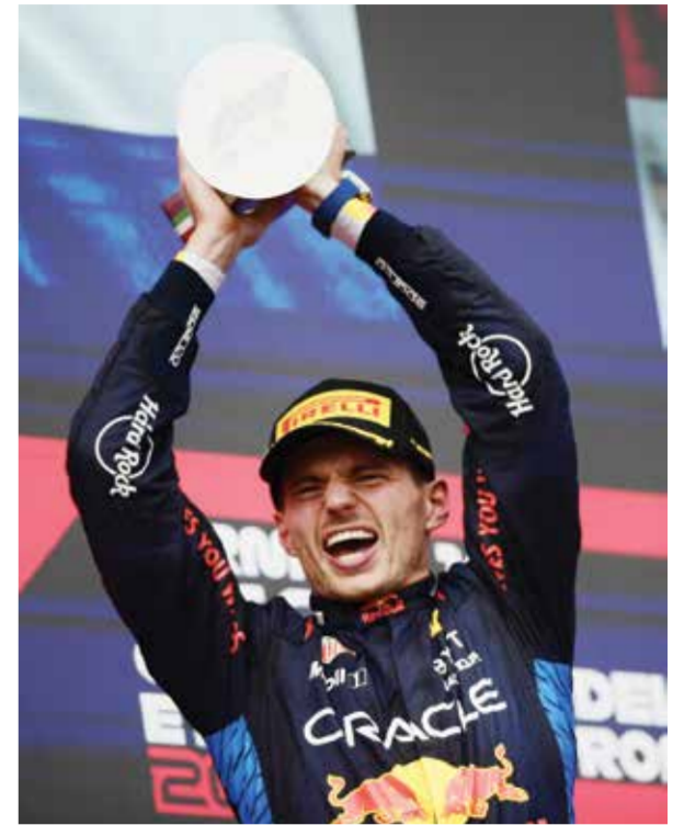
○ فرستابن يحقق فوزه الخامس. (رويترز)

روما - (أ ف ب): أحرزت البولندية إيغا شفيونتيك المصنفة أولى عالمياً لقب دورة روما لمارسترز الألف نقطة في كرة المضرب بفوزها على اليلاروسية أرينا سابالينكا الثانية ٦-٢ و٦-٣ السبت في طريقها لإحراز لقبها الثالث في العاصمة الإيطالية بعد عامي ٢٠٢١ و٢٠٢٢. واللقب هو الحادي والعشرون لشفيونتيك (٢٢ عاماً) في مسيرتها والرابع منذ مطلع العام الحالي بعد دورات الدوحة واندريان ويلز ومدريد، ويأتي قبل ٨ أيام من انطلاق بطولة رولان غاروس الفرنسية، ثمانية البطولات الأربع الكبرى ضمن الفراند سلام، والتي ستكون البولندية أبرز المرشحات للتتويج بها ولا سيما أنها أحرزت اللقب ٣ مرات أعوام ٢٠٢٠ و٢٠٢٢ و٢٠٢٣. وبنات شفيونتيك أول لاعبة منذ الأمريكية سيرينا وليامس عام ٢٠١٣ تحرز لقب دورتي مدريد وروما في العام ذاته، كما حققت فوزها الثامن على منافستها في ١١ مواجهة جمعت بينهما والثالث توالياً. وقالت شفيونتيك: «نهائي آخر، ومباراة رائعة أخرى. بعد نهائي مدريد، كنت أدرك أن الأمور لن تكون سهلة، فالنتيجة قد تذهب بأي اتجاه في أي لحظة». ولم تخسر البولندية أي مجموعة في دورة روما.