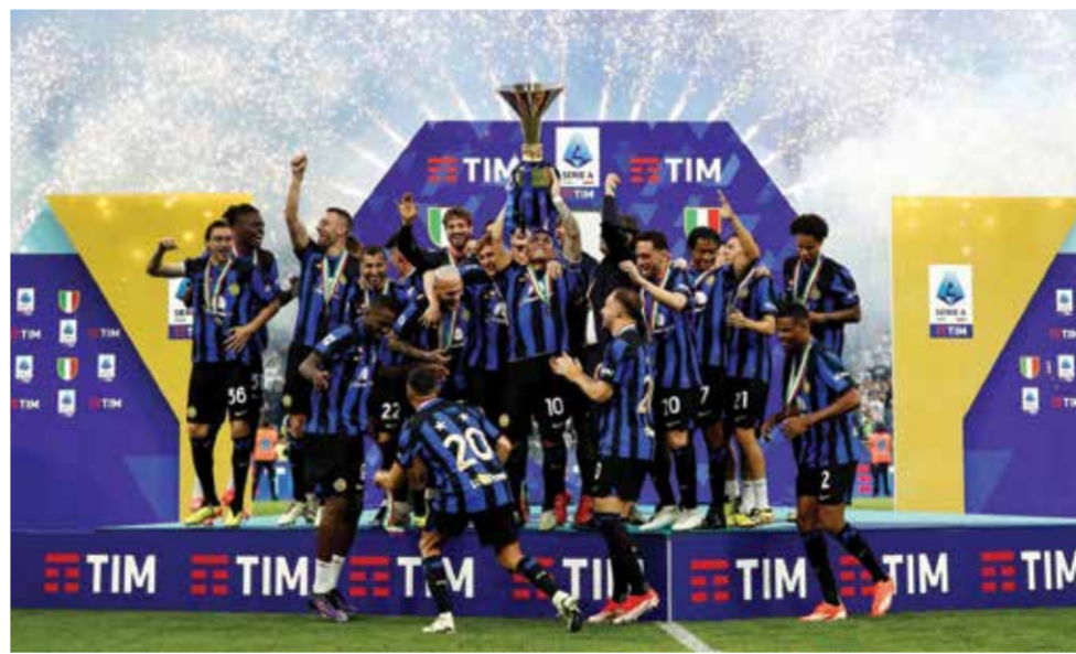
○ من تتويج إنتر ميلان باللقب

لندن - (رويترز): ضاع فوز أرسنال ١-٢ على إيفرتون سدى لتتحطم آمال أصحاب الأرض في نيل لقب الدوري الإنجليزي الممتاز لكرة القدم لأول مرة منذ ٢٠ عاماً في اليوم الأخير من الموسم أمس الأحد بعد فوز منافسه مانشستر سيتي ١-٣ على وست هام يونايتد. وبدأ فريق المدرب مايك آرتيتا اليوم في حاجة إلى الفوز مع ضرورة فشل مانشستر سيتي في التغلب على وست هام يونايتد، وهو سيناريو لم يعتقد سوى القليل داخل الإمارات أنه سيحدث. وبدأ الأمل ضاع عندما وضعت تسديدة إدريسا جاي، التي غيرت اتجاهها لتسكن الشباك أحر ركلة حرة، إيفرتون في المقدمة مع تقدم سيتي ٢-٠ صفر في ذات الوقت. لكن تاكهيرو تومياسو أدرك التعادل قبل نهاية الشوط الأول في نفس الوقت تقريباً الذي قلص فيه وست هام الفارق مع سيتي إلى ١-٢. وسجل كاي هافرتز هدف الفوز لأرسنال قبل النهاية ما يعني أن الفريق أنهى الموسم بستة انتصارات متتالية لكن كان لزاماً عليه الاكتفاء بالمركز الثاني للموسم الثاني على التوالي بعد أن حسم سيتي لقبه الرابع على التوالي وهو رقم قياسي يتخلبه على وست هام ١-٣. ورفع أرسنال رصيده إلى ٨٩ نقطة مقابل ٩١ لسيتي.