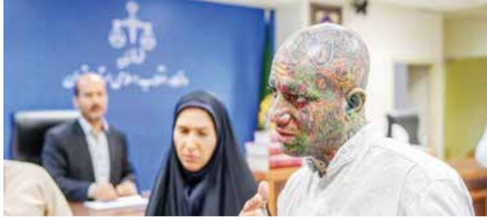
○ أمير تتلو أمام المحكمة.

وأعلنت السلطات القضائية الإيرانية في ديسمبر الفائت أن تركيا سلمت إيران الفنان بناء على أوامر من محكمة ثورية في طهران. وبدأت محاكمته في مطلع مارس بتهمة، أبرزها «تشجيع جيل الشباب على الدعاية»، و«الدعاية ضد» الجمهورية الإسلامية، و«نشر محتوى فاحش على شكل مقاطع مصورة وأغنيات».