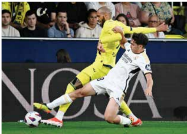
○ من لقاء ريال مدريد وفيلاريال

المدرب ميتشل بشارق أربع نقاط قبل مرحلة على الختام. صحيح أنه ضامن بطاقة المركز الرابع المؤهل إلى دوري أبطال أوروبا، لكن ألتيتيكو مدريد كان يمني النفس بأن تكون مباراته الأخيرة للموسم أمام جماهيره أفضل بكثير من الهزيمة المذلة أمام أوساسونا. ولحق قاش بغرناطة وأميريا إلى الدرجة الثانية بتعادله السلبي مع ضيفه لاس بالما في لقاء أكمله بعشرة لاعبين في ربع الساعة الأخير، بعدما بقي متخلفاً بشارق ٤ نقاط عن ريال مايوركا السابع عشر الذي تعادل بديره مع ضيفه الإسباني الأخير ٢-٢. وضمن بلباو المركز الخامس بعدما ابتعد بشارق خمس نقاط عن سوسيداد، بفوزه على ضيفه إشبيلية بهدفين نظيفين. وعمق سلطا غرناطة التاسع عشر بالفوز عليه ١-٢، رافعا رصيده إلى ٤٠ نقطة في المركز الرابع عشر.