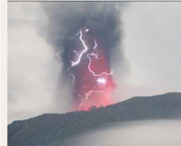
○ ثورة البركان.

قطرها سبعة كيلومترات. وكانت وكالة علوم البراكين في إندونيسيا قد رفعت مستوى التحذير من البركان إلى أعلى مستوى يوم الخميس، بعد أن ثار عدة مرات في وقت سابق من هذا الشهر.