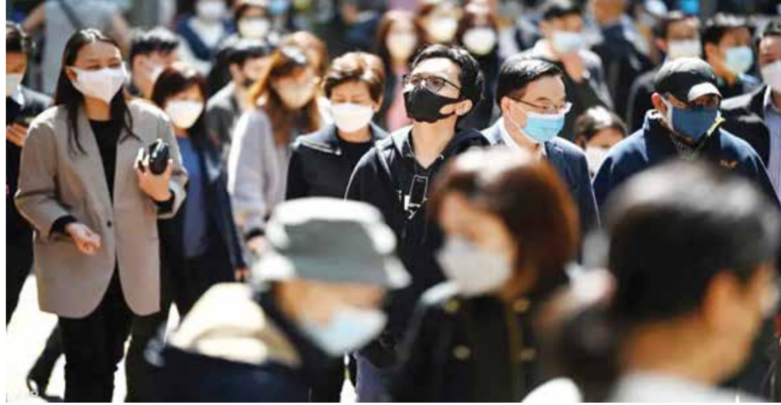
○ صورة تعبيرية.

من I.J.N بسبب عدد صغير من الطفرات في البروتين الشوكي الذي يساعد الفيروس بشكل أفضل على الهروب من نظام المناعة لدينا.