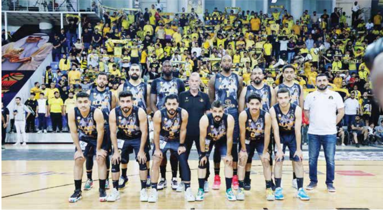
○ فريق الأهلي لكرة السلة