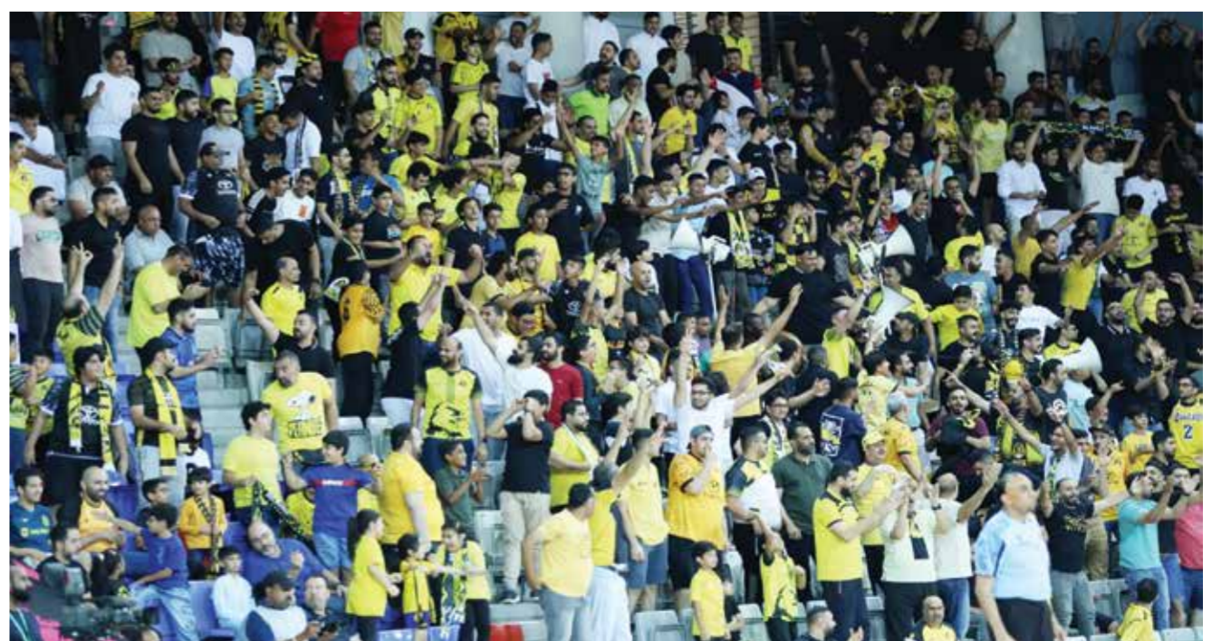
○ جماهير الأهلي في النهائي الثالث