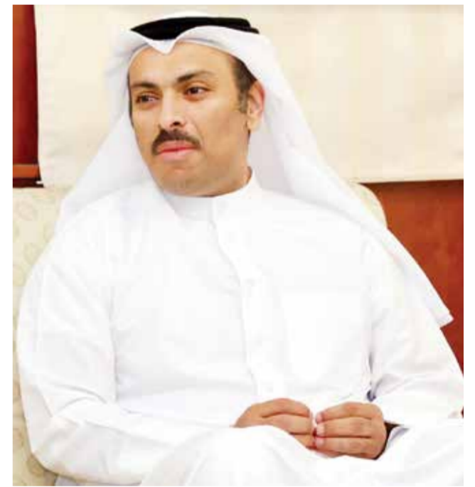
○ وزير الإعلام.

من جانبه نوه السيد زهره مدير التحرير بحرص وزير الإعلام على تشجيع الصحف المحلية على الاستمرار، مشيراً إلى أن هذا التحدي يواجه الصحافة في مختلف أنحاء العالم، مشدداً على أن كل وسائل التواصل الاجتماعي لم تتمكن من إزاحة الصحف الورقية عن مكانتها في البحرين، لأن هذه الصحف هي صوت