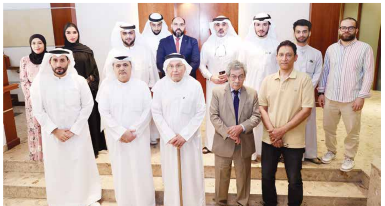
○ رئيس التحرير حرص على الإشادة بجهود فريق عمل الجريدة المشارك في تغطية أعمال القمة العربية بالبحرين.