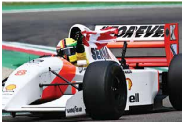
○ فيتيل يقود سيارات سينا، (أ ف ب)

ويشهد الرالي إقامة خمس مراحل على مسارات منفصلة، بهدف تقليص عدد المرات التي تتجاوز فيها السيارات الدراجات النارية، كما سيضم الرالي المرحلة التمهيديّة، والمرحلة الماراثونية، ومرحلة الانطلاق الجماعي، وغيرها من المراحل المثيرة التي سيهدها السباق، وسيضم مئات المشاركين إلى المنافسة في فئات مختلفة، لاستكشاف أروع المناظر الطبيعية الخلابة، والمناطق التاريخية في المملكة.