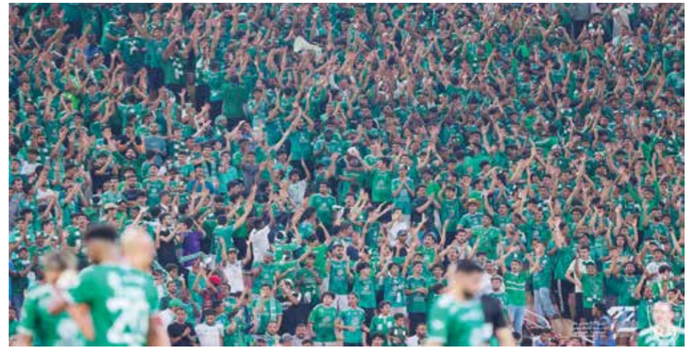
○ جماهير الأهلي

أمام ما يزيد على ٢٠ ألف متفرج احتشدوا في استاد «الأول بارك»، أوفت القمعة بوعودها، إذ عنونت الإثارة صافرتي البداية والنهائية بعدما نجح لاعب «العالمي» البرتغالي أوتافيو مونتيرو في التوقيع على أسرع الأهداف في تاريخ الـ «ديربي»، فيما أدرك وصيف متصدر