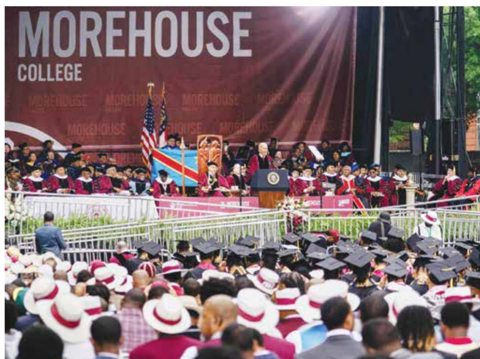
الرئيس الأمريكي لدى إلقائه كلمة في حفل التخرج بكلية مورهاوس. (أ ف ب)

الأمريكي لدى إلقائه كلمة في حفل التخرج بكلية مورهاوس. (أ ف ب)