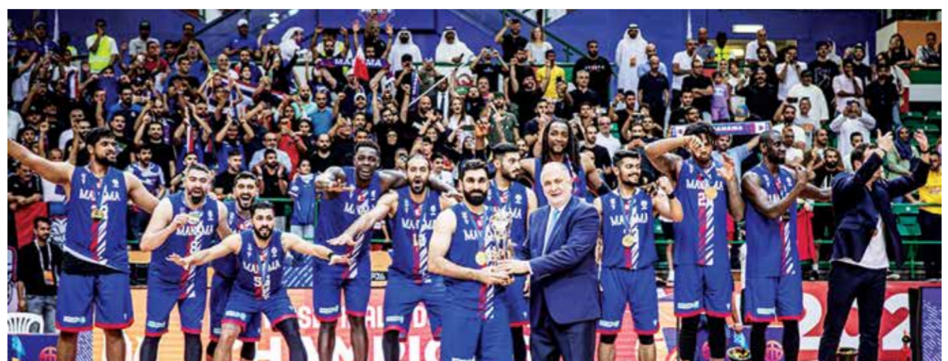
○ من تتويج المنامة بالسوبر ليغ الآسيوي

يزداد الضغط على ممثل الوطن فريق المنامة لكرة السلة الذي تنتظره مشاركة مهمة للدفاع عن لقبه في المرحلة النهائية من بطولة دوري غرب آسيا «السوبر ليغ» الفينل ٨، والتي تستضيفها العاصمة القطرية الدوحة خلال الفترة ما بين ٢٥ مايو حتى ١ يونيو القادم. وبحسب الخطة فإن بعثة نادي المنامة تسافر إلى دولة قطر بتاريخ