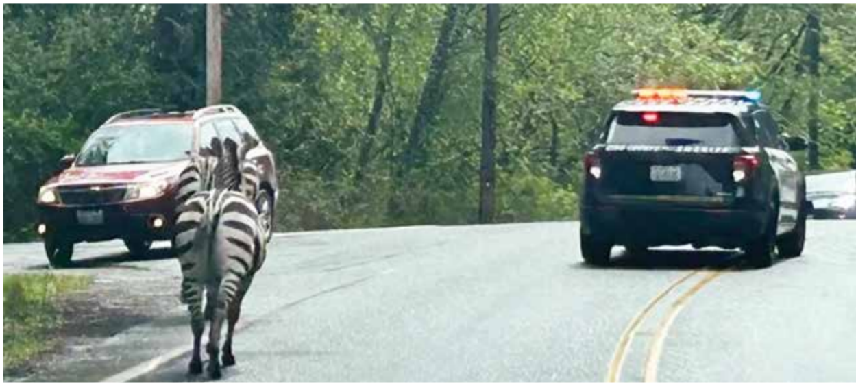
○ الحمار الوحشي الهارب.

باتت الهواتف الذكية تتوافق مع الشاشات الكبيرة بمساعدة التطبيقات، ما يسمح لك بالاستفادة من الهواتف القديمة بطريقة مبتكرة. وعانى كثير منا من الإحباط الناتج عن وضع أجهزة التحكم عن بعد الخاصة بالتلفزيون في غير موضعها أو عند حدوث خلل فيها، مما يعيق قدرتنا على الاستمتاع ببرامجنا المفضلة. ومع تقديم حلول مبتكرة مثل تطبيق «Google TV» والتطبيقات الأخرى، أصبح لدى المستخدمين الآن خيار التحكم في أجهزة التلفزيون، التي تعمل بنظام «أندرويد» مباشرة من هواتفهم الذكية.