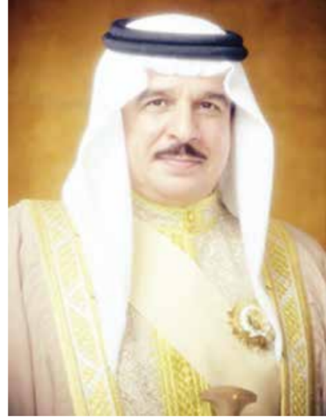
○ جلالة الملك المعظم.

بعث حضرة صاحب الجلالة الملك حمد بن عيسى آل خليفة ملك البلاد المعظم برقية تعزية ومواساة إلى أخيه خادم الحرمين الشريفين الملك سلمان بن عبدالعزيز آل سعود عاهل المملكة العربية السعودية الشقيقة. وأعرب جلالتهم في البرقية عن خالص التعازي وصادق المواساة لأخيه خادم الحرمين الشريفين في وفاة صاحب السمو الملكي الأمير بدر بن عبد المحسن بن عبدالعزيز آل سعود رحمه الله، سائلاً الله العليّ القدير أن يتغمّد الفقيد بواسع رحمته ورضوانه ويسكنه فسيح جناته، وأن يلهم العائلة المالكة الكريمة جميل الصبر وحسن العزاء. كما بعث صاحب السمو الملكي الأمير سلمان بن حمد آل خليفة ولي العهد رئيس مجلس الوزراء، برقية تعزية ومواساة إلى خادم الحرمين الشريفين الملك سلمان بن عبدالعزيز آل سعود عاهل المملكة العربية السعودية الشقيقة في وفاة صاحب السمو الملكي الأمير بدر بن عبد المحسن بن عبدالعزيز آل سعود رحمه الله. كما بعث صاحب السمو الملكي الأمير محمد بن سلمان بن عبدالعزيز آل سعود ولي العهد رئيس مجلس الوزراء، برقية تعزية ومواساة مماثلة إلى أخيه صاحب السمو الملكي الأمير محمد بن سلمان بن عبدالعزيز آل سعود ولي العهد رئيس مجلس الوزراء بالمملكة العربية السعودية الشقيقة.