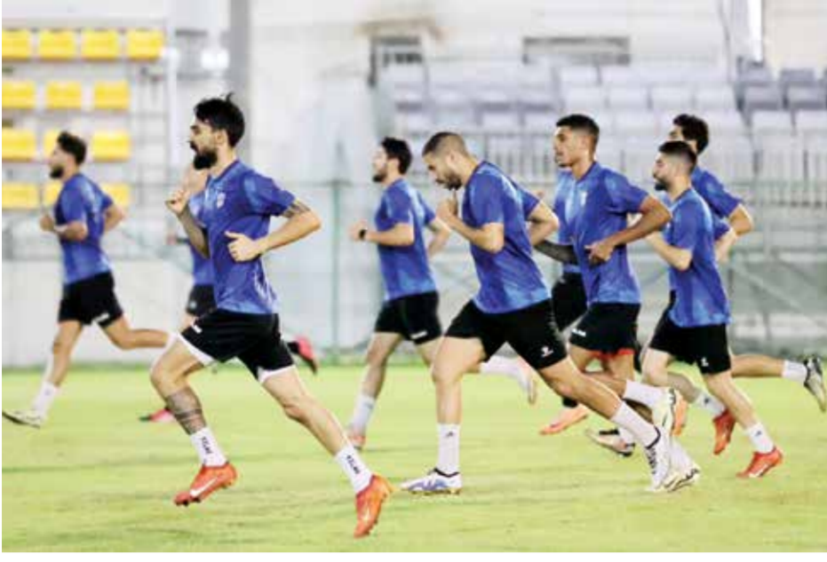
O من تدريبات العهد