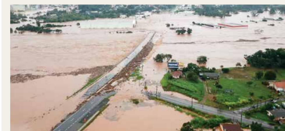
○ الفيضانات في ولاية ريو غراندي دو سول.

قدمت أوكرانيا يوم الأربعاء الماضي متحدثة أنشئت بواسطة الذكاء الاصطناعي تدعى فيكتوريا شي، ستؤدي مهمة الإدلاء ببيانات رسمية صادرة عن وزارة الخارجية. وقالت الوزارة إنها ستستخدم «الأول مرة في التاريخ» متحدثا رقميا يعتمد على الذكاء الاصطناعي لقراءة بياناتها، والتي سيظل البشر يكتبونها. ووفقا للمكتب الصحفي لوزارة الخارجية فإن التصريحات التي ستدلي بها فيكتوريا لن تكون صادرة عن الذكاء الاصطناعي، بل «مكتوبة ومتحقق منها من قبل أشخاص حقيقيين». ولتجنب التزييف، ستكون البيانات مصحوبة برمز QR الذي يربطها بالنسخ النصية على موقع الوزارة، وأشارت الوزارة إلى أن فيكتوريا لن تحل محل الناطق الرسمي باسمها، وهو إنسان، بل ستؤدي فقط المواضيع التفصيلية، وفق ما ذكرت صحيفة «دا جارديان» البريطانية. وعلق ديميترو كوليبا، وزير الخارجية الأوكراني قائلا: «إنه الجزء المرئي فقط الذي يساعدنا الذكاء الاصطناعي على توليده»، مضيفا أن اختيار ناطقة رسمية مؤلدة بواسطة الذكاء الاصطناعي، يهدف أيضا إلى «توفير وقت الوزارة وإمكاناتها». جدير بالذكر أن ملامح فيكتوريا استوحيت من المغنية ونجمة وسائل التواصل الاجتماعي الأوكرانية روزالي نومبري.