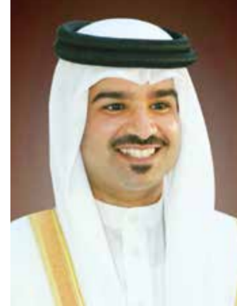
○ سمو الشيخ خليفة بن علي بن عيسى آل خليفة