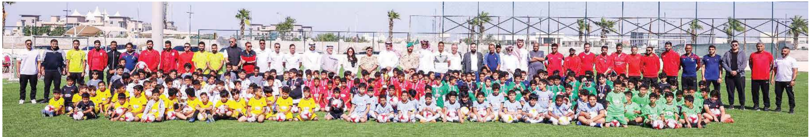
○ من فعالية النسخة الأولى للمهرجان