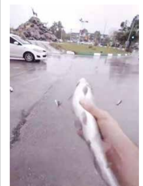
○ المطر السمكي.

وتحدث هذه الظاهرة عندما تنتقل الأسماك من البحر إلى البر، بفعل الأعاصير غالبا، في مناطق يوجد فيها تباين كبير في الرطوبة ودرجة الحرارة. جدير بالذكر أن العلماء ليسوا متأكدين تماما من سبب حدوث تلك الظاهرة الآن أو في الماضي، لكنهم يعتقدون أنها ناتجة عن العواصف أو تيارات الهواء القوية، التي يمكن أن تحمل المياه بما فيها من أسماك من المسطحات المائية الكبيرة، ونقلها إلى عدة كيلومترات قبل أن تسقط مجددا على الأرض.