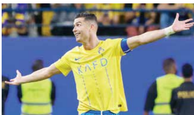
○ احتفال رونالدو بالهاتريك