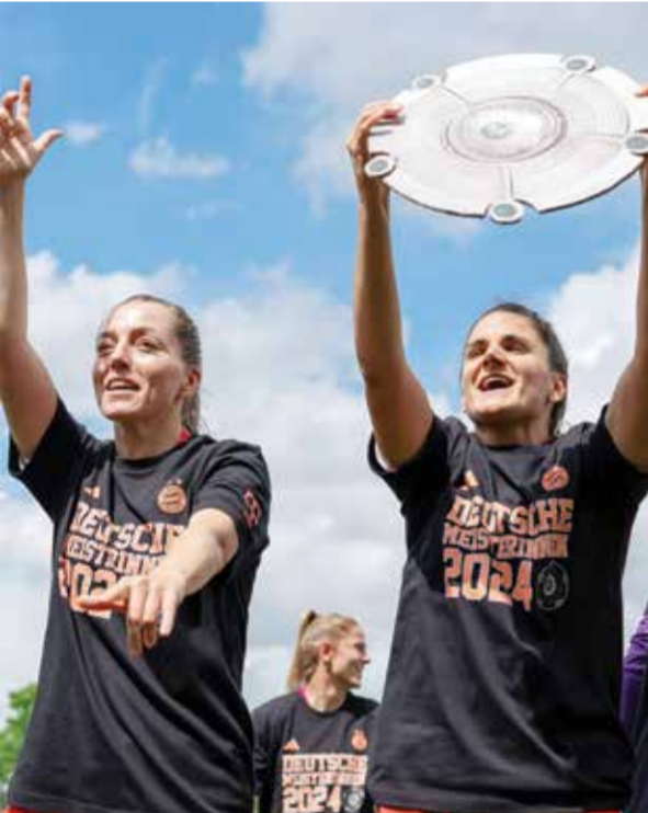
○ احتفال سيدات بايرن