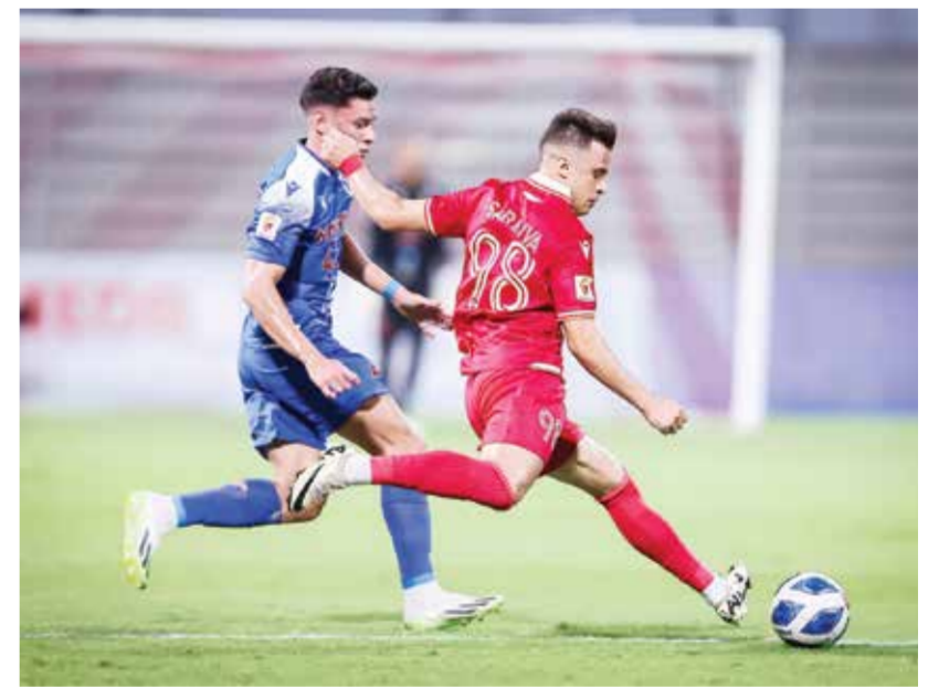
○ لقاء المحرق والمنامة