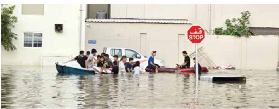
جانب من الأمطار التي شهدتها المملكة في الفترة الماضية.

وهذا هدر، لذلك يجب أن تنتهي مصارف الأمطار إلى مناطق للتخزين، وبعد أو خلال فترة الشتاء تصرف وتخلط بالمياه التي تمت معالجتها ومن ثم تصرف للزراعة، فإن كانت كميات كبيرة تصرف بصورة تدريجية.