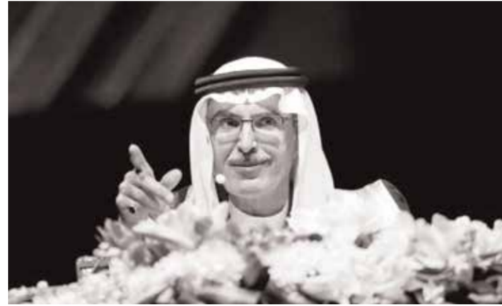
كتبت فاطمة اليوسف:

وكانم الساهر وصابر الربياعي وراشد الماجد وغيرهم الكثير. حصل الأمير الراحل على عدة تكريمات وجوائز وكرمه خادم الحرمين الشريفين الملك سلمان بن عبدالعزيز آل سعود عام ٢٠١٩م بمنحه وشاح الملك عبدالعزيز.