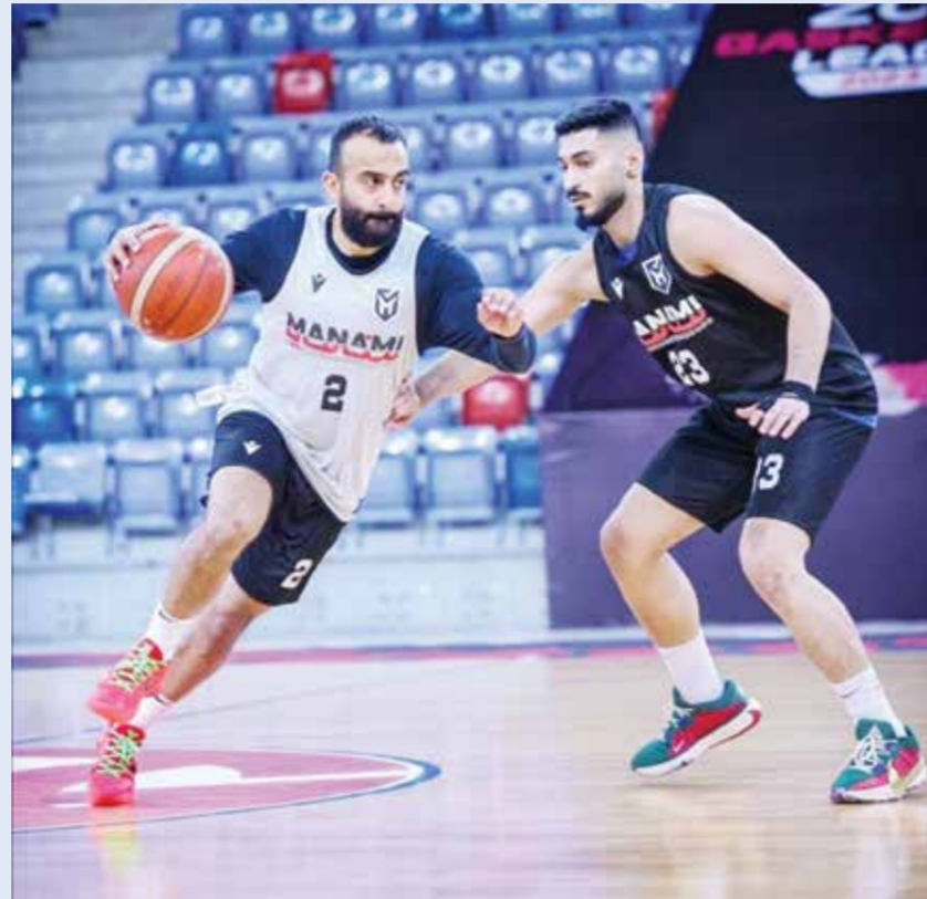
لقطة من تدريبات المنامة

توافدت الجماهير البحرينية بشكل كبير منذ اليوم الأول من بدء توزيع تذاكر مواجهة الفاصلة بين فرقي المنامة والكويت الكويتي يوم الاثنين القادم ٦ مايو على صالة خليفة الرياضية بمدينة عيسى، في نهائي منطقة الخليج لبطولة دوري غرب آسيا لكرة السلة (السوبر ليغ)، وقد نفذت يوم أمس السبت جميع التذاكر المجانية التي تم توزيعها على الجماهير. يذكر أن الجماهير البحرينية سجلت حضوراً غفيراً في المواجهة الأولى التي خسرها المنامة أمام الكويت الكويتي، والجدير بالذكر مباراة الاثنين حاسمة وتحدد هوية بطل الخليج.