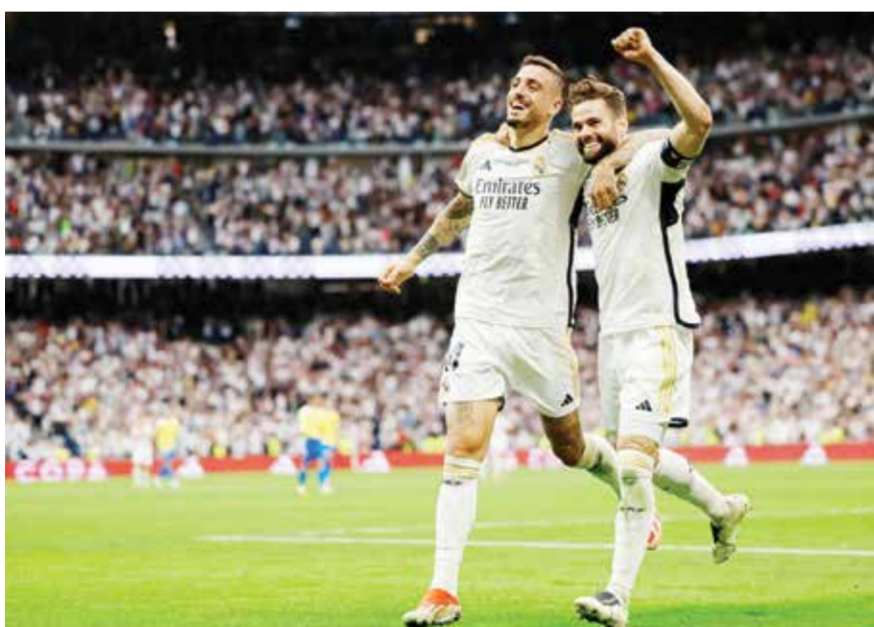
○ من لقاء ريال مدريد وقادش

تحت رعاية سمو الشيخ فيصل بن خالد آل خليفة وسمو الشيخ عبدالله بن خالد آل خليفة، أنجال سمو الشيخ الأول لرئيس المجلس الأعلى للشباب والرياضة رئيس الهيئة العامة للرياضة رئيس اللجنة الأولمبية البحرينية، تقام اليوم الأحد منافسات «مهرجان مواهب البحرين الثاني لكرة القدم» للمرحلة الابتدائية للمدارس الخاصة، والذي يتم تنظيمه بالشراكة بين «وزارة التربية والتعليم» وشركة طموح للإدارة الرياضية، ضمن خطة التعاون الثنائي بين الجانبين تجاه اكتشاف ورعاية اللاعبين الموهوبين في مجال اللعبة، وذلك على الملاعب الخارجية التابعة لاتحاد الكرة