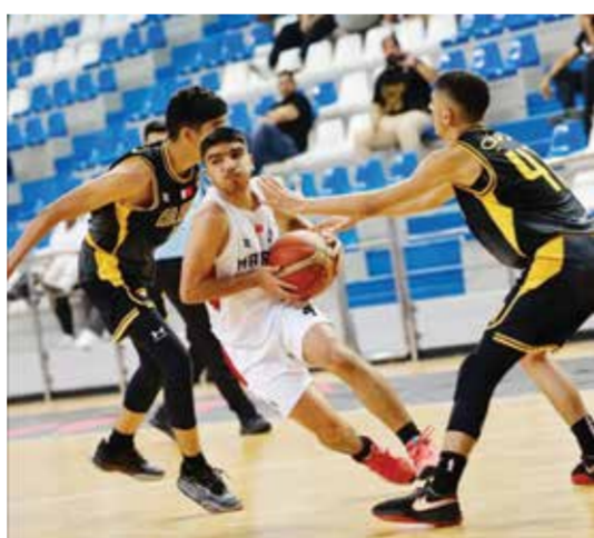
من لقاء المنامة والأهلي