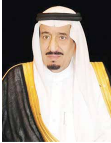
○ خادم الحرمين الشريفين.