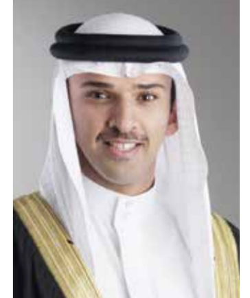
○ الشيخ علي بن خليفة بن أحمد آل خليفة