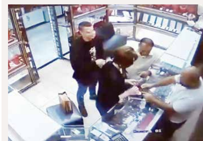
الكاميرات سجلت سرقة أحد محلات الذهب.

تمكنت مديرية شرطة محافظة العاصمة من القبض على رجل عربي وامرأة أوروبية لقيامهما بسرقة مصوغات ذهبية قيمتها 2120 ديناراً من أحد المحلات بمدينة الذهب بسوق المنامة. وأشارت المديرية إلى أنه فور تلقي بلاغ الواقعة باشرت الشرطة على الفور دورها الأمني في اتخاذ ما يلزم من مراجعة سجلات الكاميرات وإجراء عملية البحث والتحري، وتم تحديد هوية المتهمين والقبض عليهما بعد مغادرتهما المحل. وأكدت مديرية شرطة محافظة العاصمة أنه تم اتخاذ كافة الإجراءات القانونية وحالة القضية إلى النيابة العامة.