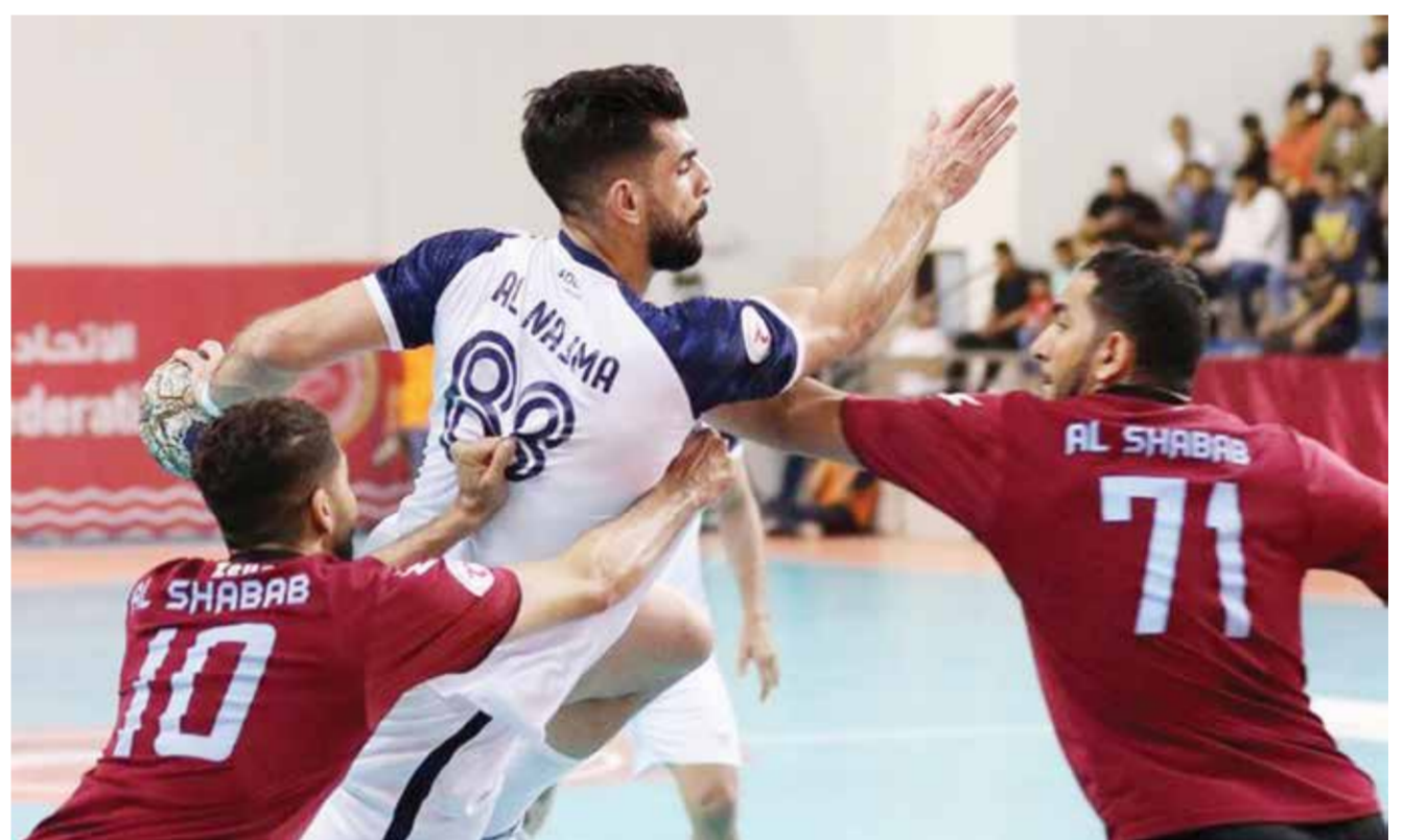
من لقاء سابق بين الشباب والنجمة

أوقعت قرعة البطولة الآسيوية الثامنة عشرة للشباب لكرة اليد التي سحبت أمس السبت، التي ستقام في العاصمة الأردنية عمان بمشاركة ١٣ منتخباً، وذلك في الفترة ١٦ حتى ٢٧ من شهر يوليو، منتخبنا الوطني للشباب لكرة اليد بالمجموعة الأولى إلى جانب منتخبي السعودية وهونغ كونغ. وقد ضمت المجموعة الثانية منتخبات الكويت وإيران والصين، فيما ضمت المجموعة الثالثة منتخبات الأردن والهند وعمان، بينما المجموعة الرابعة تضم اليابان وكوريا الجنوبية والصين تايبيه وقطر.