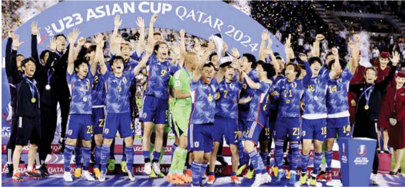
○ منتخب اليابان

كما هنا منتخب إندونيسيا بحصوله على المركز الرابع في البطولة وبلوغه الملحق العالمي المؤهل لأولمبياد باريس معرباً عن تمنياته بالتوفيق والنجاح للمنتخب الإندونيسي في مباراة الملحق العالمي أمام منتخب غينيا وإحراز البطاقة الآسيوية الرابعة في الدورة الأولمبية.