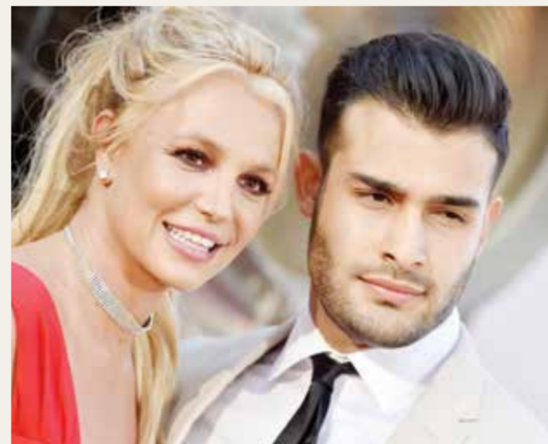
○ بريتنى سبيرز وسام أصغري.

وبعد تقديم طلب الطلاق، تحدثت أصغري (٣٠ عامًا) للمرة الأولى عن انفصاله عن سبيرز (٤٢ عامًا) بيان على وسائل التواصل الاجتماعي، جاء فيه: «بعد ست سنوات من الحب والالتزام تجاه بعضنا، قررت أنا وزوجتي إنهاء رحلتنا معا. سنتمسك