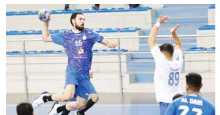
من لقاء الديبر وتوبلي