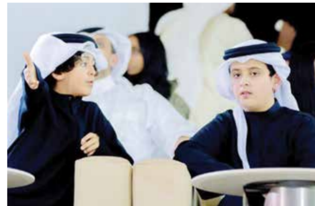
○ أنجال سمو الشيخ خالد بن حمد آل خليفة

طالباً)، مدرسة بوابة المعالي (١٤ طالباً)، مدرسة الرجاء (١٥ طالباً)، مدرسة المعارف الحديثة (١٣ طالباً)، مدرسة لؤلؤة الخليج العربي (٢٠ طالباً)، مدرسة برايتس العالمية (١٤