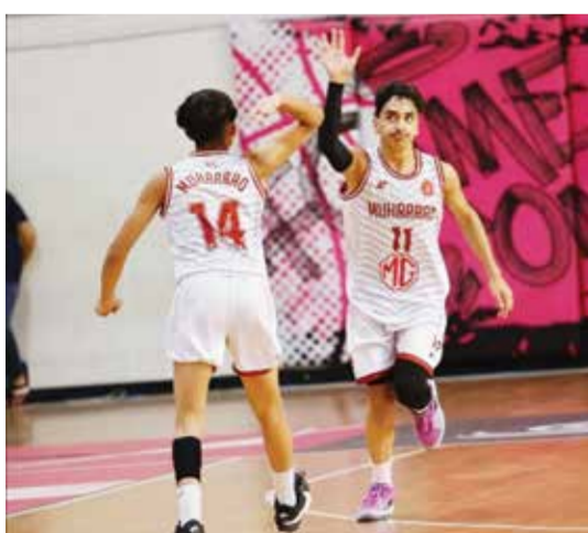
من لقاء المحرق وسماهيح

تختتم اليوم الأحد منافسات الجولة الأخيرة من الدور التمهيدي لدوري خالد بن حمد لكرة اليد بمواجهة القمة في الجولة والتي تجمع بين متصدر الدوري الشباب ومنافسه فريق النجمة، في تمام الساعة ٧:٤٥ مساءً على صالة اتحاد اللعبة بأم الحصم.