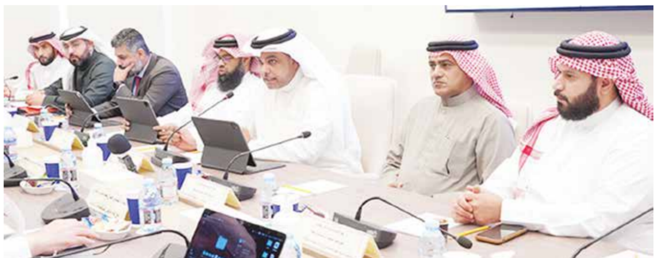
جانب من اجتماع لجنة التحقيق النيابية.

في الوزارات والهيئات والشركات الحكومية. واقترحت لجنة التحقيق في ختام توصياتها بتشكيل لجنة تحقيق برلمانية تناول ذات محاور عمل اللجنة الحالية للوقوف على الجوانب التي لم يتم استكمالها خلال مدة عمل اللجنة.