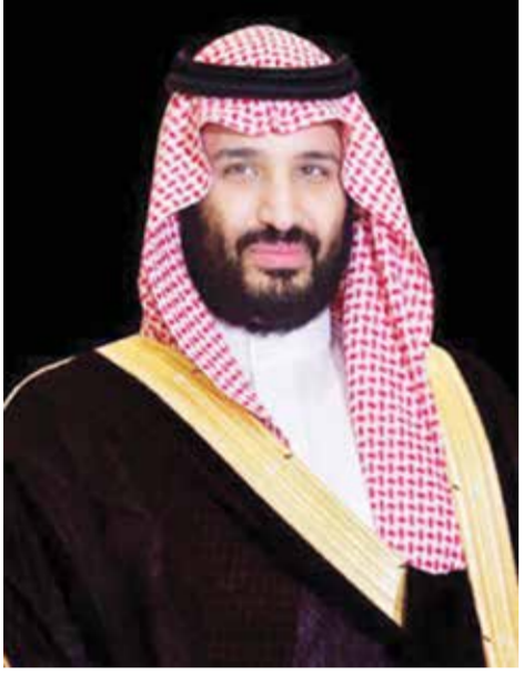
○ سمو ولي العهد رئيس الوزراء السعودي.