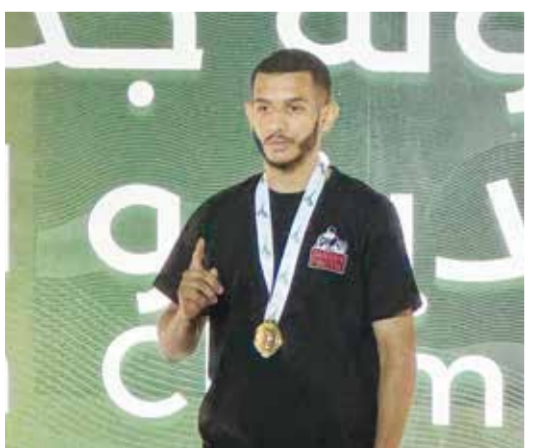
○ حصاد فريق المواي تاي