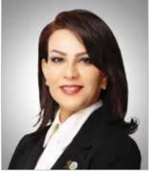
بقلم: الحمامية د. هنادي عيسى الجودر

على قيد الحياة وتشعر بوجوده معنا كل يوم حتى وإن كانت تفصلنا عنه المسافات، ولا عجب في ذلك فإن بدر الشعر هو ذلك الإنسان الذي آمن بأن الحب هو الحياة وبأننا نحيا الحب ونحب لنحيا ويكتمل الحب حينما نُصَدِّق بوجوده وبأن هناك إنساناً خلق لأجلنا، وقد صدقنا الرأي فالحب هو الذي يحيل صحارى القلوب إلى بساتين وهو الذي يبني الجسور ويمهد طرقاً الوصال واللقاء، وهو الذي ينشر طاقة العطاء والإيثار والصدق والثقة والإيمان، بل ويجعل