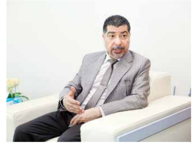
○ رئيس المؤسسة الوطنية لحقوق الإنسان.

أكد المهندس علي الدرازي، رئيس المؤسسة الوطنية لحقوق الإنسان، أن المؤسسة سعت إلى تقوية العلاقات مع منظمات المجتمع المدني، مشيراً إلى أنها استطاعت أن تشكل جسراً بين هذه المنظمات والجهات الحكومية. وأضاف أن المؤسسة تهتم بأن تكون الجمعيات الأهلية قابلة