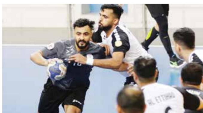
من لقاء التضامن والاتحاد