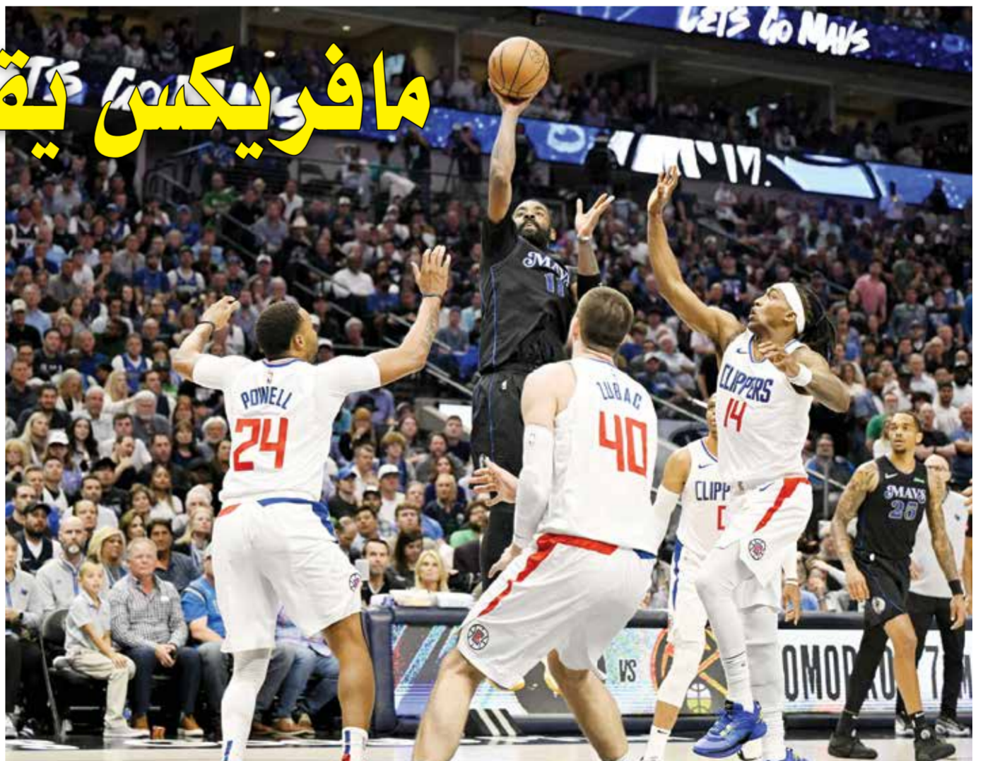
O من لقاء مافريكس وكليبرز

ولم تكن ٥٠ نقطة من دونوفان ميتشل كافية لحمل كليفلاند كافاليرز إلى نصف نهائي المنطقة الشرقية، إذ قلب مضيفه أورلاندو ماجيك الطاولة عليه محققاً الفوز ١٠٣-٩٦ وفارضا مباراة سابعة حاسمة. سجّل باولو بانكيري ١٠ من نقاطه الـ ٢٧ في الربع الأخير، وزرع ثلاثية قبل ٣:٣٩ دقائق وضعت فريقه في المقدمة خلال مباراة مثيرة. أضاف بطل العالم الألماني فرانست فاغندر ٢٦ نقطة لأورلاندو وسجّل جايلين ساغر ٦ ثلاثيات في طريقه لإنهاء المباراة برصيد ٢٢ نقطة.