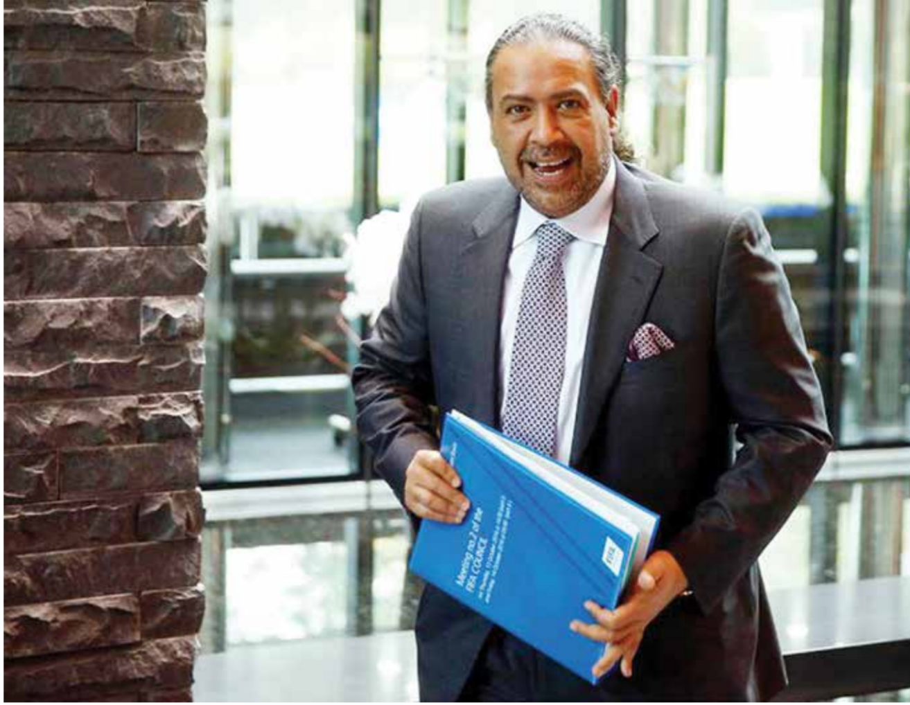
O الشيخ أحمد الفهد

ختم «هذه فرصة حياتي. مع الألعاب الأولمبية قد يشارك رجل ما. وأريد أحد الرياضيين الشباب أن يقول سأكون يوماً في هذا المكان».