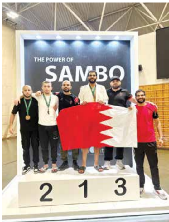
○ فريق البحرين