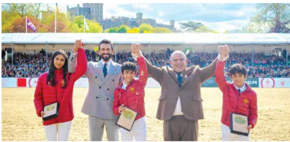
سمو ولي العهد رئيس الوزراء مع سمو الشيخ ناصر بن حمد وأنجاله.