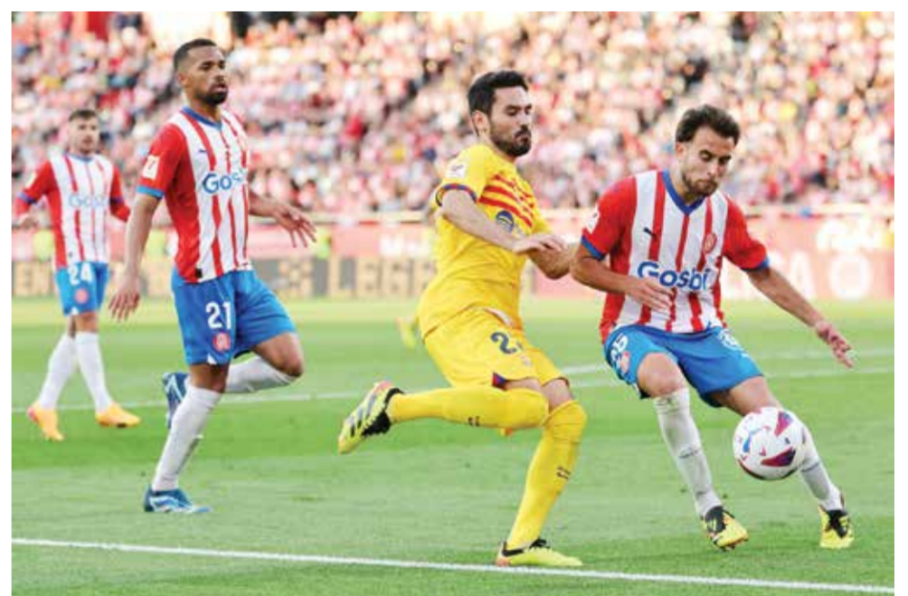
○ من لقاء برشلونة وجيرونا