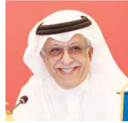
○ الشيخ سلمان بن إبراهيم آل خليفة

وتوه الشيخ سلمان بن إبراهيم آل خليفة بما أفرزته بطولة كأس آسيا تحت ٢٣ عاماً من مواهب شابة ستتمل واجهة المستقبل المشرق لكرة القدم الآسيوية داعياً الاتحادات الأهلية في القارة الآسيوية إلى مواصلة رعاية تلك المواهب لرغد منتخباتها الوطنية في المنافسات المقبلة.