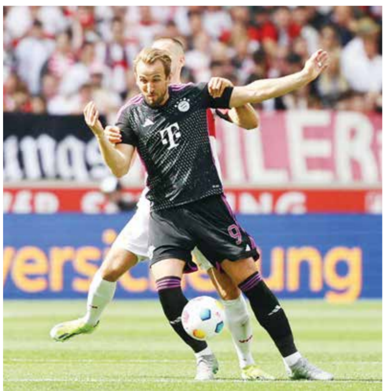
○ من لقاء شتوتغارت وبايرن ميونخ

وسقط كولن في فخ التعادل أمام ضيفه فرايبورغ سلباً، ويات قريباً من مرافقة دارمشتات إلى الدرجة الثانية، رفع رصيده إلى ٢٤ نقطة في المركز السابع عشر قبل الأخير بفارق أربع نقاط خلف ماينتس صاحب المركز السادس عشر الذي يخول لصاحبه خوض الملحق مع ثالث الدرجة الثانية، ويشارك ست نقاط خلف أونيون برلين ويوخوم.