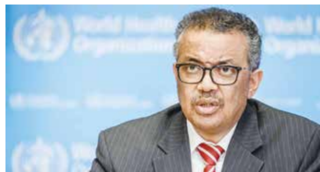
○ تيدروس أدهانوم جبرييسوس.

يمكن أن يصبح معزولا ولا يمكن الوصول إليه، خلال هجوم محتمل في رفح، وهو ما لن يترك سوى «سنة مستشفيات ميدانية فقط، في جنوب قطاع غزة».