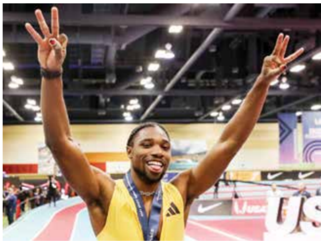
O نواه لايلز

وفاز لايلز بثلاث ذهبيات في بطولة العالم العام الماضي في بودابست في سباقات الـ ١٠٠ و٢٠٠ والتتابع أربع مرات ١٠٠ م، ليكون أحد أبرز المرشحين قبل أولمبياد باريس هذا