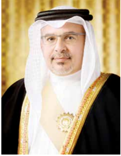
○ سمو ولي العهد رئيس الوزراء.