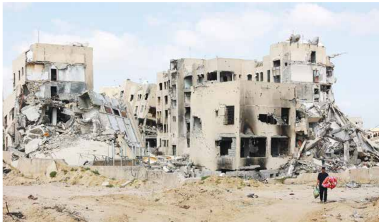
○ المقاومة الفلسطينية تصر على وقف العدوان الغاشم.

لم تستردهم إسرائيل بطريقة أو بأخرى بالقوة أو بممارسة ضغط عسكري كاف لإجبار حماس على التراجع».