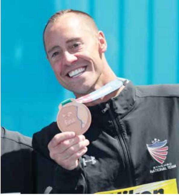
O من حصاد ماي