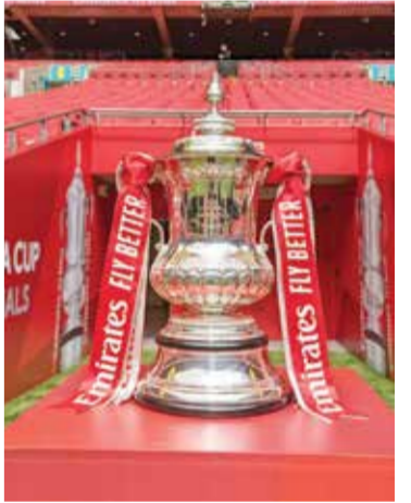
○ كأس الاتحاد الإنجليزي

لندن - (د ب أ): طالب عدد من الأندية الإنجليزية بمنح المقعد الرابع لإنجلترا في دوري أبطال أوروبا لكرة القدم للفريق الفائز بكأس الاتحاد الإنجليزي في محاولة لإثارة اهتمام الأندية الكبيرة في إنجلترا بالمسابقة العريقة. وكوّن ٣٤ فريقاً إنجليزياً كتكلاً أطلق حملة بعنوان «لعبة عادلة»، وأرسلوا خطاباً إلى وزيرة الثقافة لوسي فريزر قبل أيام قليلة لمطالبة الاتحاد الإنجليزي بالتراجع عن قرار إلغاء إعادة المباريات في كأس الاتحاد الإنجليزي. من جانبه قال نبال كوبر الرئيس التنفيذي لهذه