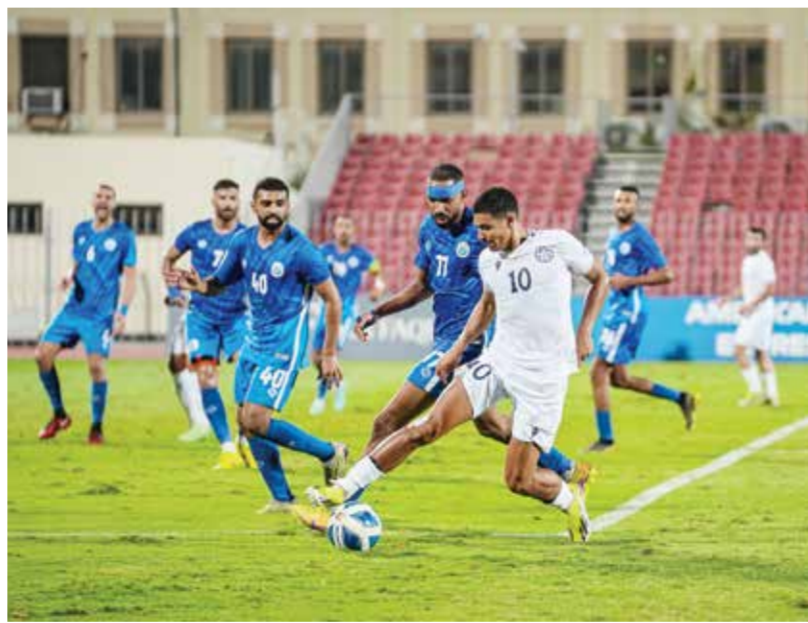
○ لقاء النجمة والبستين