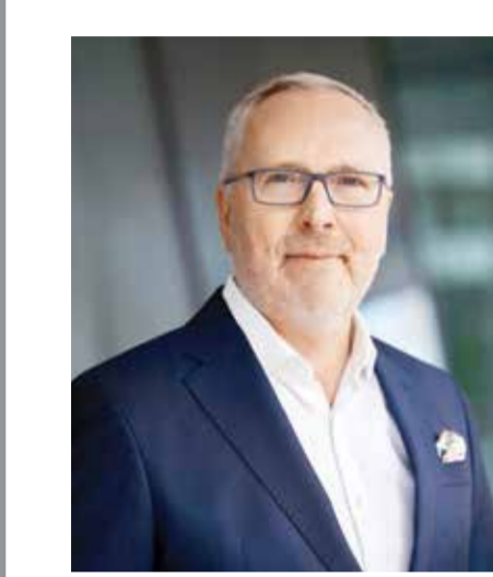
بـقلم: أولي هانسن ○

شهدت أسعار النحاس تراجعاً لليوم الثالث على التوالي، حيث أظهر الارتفاع الذي استمر مدة شهر علامات على فقدان الزخم، ويرجع ذلك بشكل رئيسي إلى ضعف توقعات الطلب على المدى القصير في الصين، إلى جانب مخاطر تصفية المراكز طويلة الأجل من قبل صناديق التحوط التي راكمت مراكز طويلة كبيرة خلال الشهرين الماضيين. بشكل عام، نحافظ على نظرة إيجابية طويلة الأجل بالنسبة إلى هذا المعدن، وذلك توقعاً للطلب القوي من قطاعات مختلفة، بما في ذلك السيارات الكهربائية وشبكات الكهرباء ومراكز بيانات الذكاء الاصطناعي، في ظل التوقعات بانخفاض إنتاج المناجم الحالية خلال السنوات المقبلة.