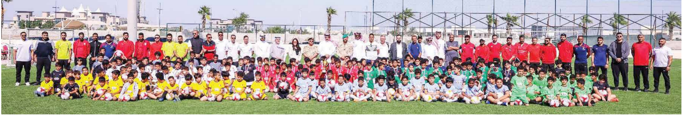
○ من فعالية النسخة الأولى للمهرجان