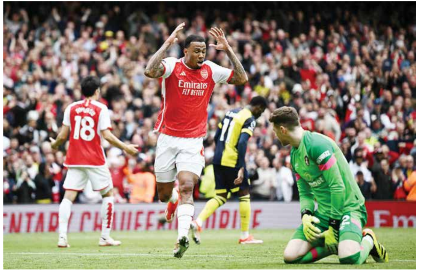
○ من لقاء أرسنال وبورنموث