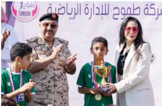
○ لقطة من فعالية النسخة الأولى للمهرجان

من منافسات مهرجان مواهب البحرين لكرة القدم للمدارس الحكومية مشاركة ٨ أكاديميات مدرسية ويعد ٢٠٠ طالب من المرحلة الابتدائية، حيث حققت أكاديمية مدرسة سترة اللقب في تلك النسخة.