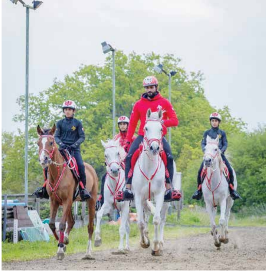
O سموه يقود تدريب الأناجال