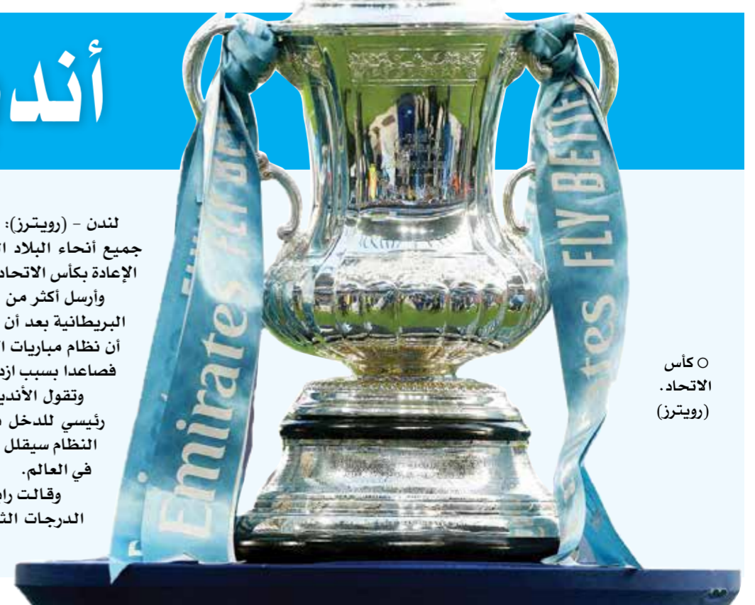
○ كأس الاتحاد.

ويبقى للهلال ست مباريات أمام التعاون، الأهلي، الحزم، النصر، الطائي والوحدة. وأشاد جيزوس بجماهير الهلال على حضورهم ودعمهم أمام الاتحاد «هذا الأمر نشعر به كفريق داخل الملعب». وتابع المدرب البرتغالي المحنك «صحيح أن فوزنا هو السابع بين