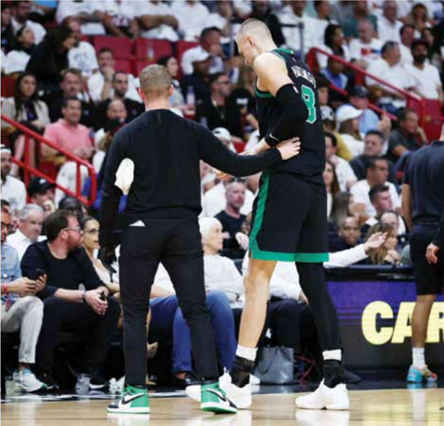
O بورزينغيس يغادر الملعب. (أ ف ب)

نيويورك - (أ ف ب): غاب لاعب ارتكاز بوسطن سلتيكس اللاتفي كريستيان بورزينغيس عن المباراة الخامسة الأربعاء امام ميامي هيت من السلسلة ضمن الدور الأول لدبلاي أوف، دوري كرة السلة الأمريكي للمحترفين بسبب الإصابة، وفقاً لما أعلنه ناديه.