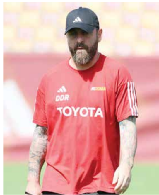
○ دي روسي.

وأبلغ المدرب الأسترالي الصحفيين: «تيمو (فيرنر) يعاني من إصابة في عضلات الفخذ الخلفية. أمامه أسبوعان ونصف فقط حتى يعود، لذلك سيغيب عما تبقى من الموسم». وقال: «تعرض بن