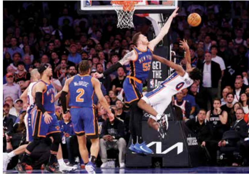
O ماكسي يجلب الفوز لسيكسرز. (رويتزر)

نيويورك - (أ ف ب): انعش كل من فيلادلفيا سفنتي سيكسرز وميلووكي باكس آماله في بلوغ الدور الثاني بفوزيهما على نيويورك نيكس ١١٢-١٠٦ بعد التمديد واندبانا بايسرز ١١٥-٩٢ توالياً، الثلاثاء في مواجهة الخامسة ضمن المنطقة الشرقية في الدور الأول من الأدوار الإقصائية لدوري كرة السلة الأمريكي للمحترفين.