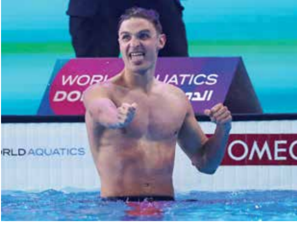
O كليربورت