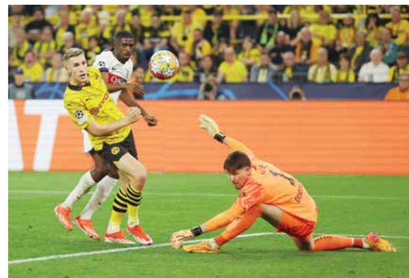
O لقاء باريس سان جيرمان ودورتموند

أن الفشل كان العنوان الأبرز لكل الفرق، لغياب النجاعة الهجومية، وكذا الوقوف الجيد للدفاع الباريسي، لتنتهي بذلك المباراة بانتصار أبناء إيدين تيرزيتش بهدف نظيف على باريس سان جيرمان الفرنسي. وسيستقبل باريس سان جيرمان الفرنسي نظيره بروسيا دورتموند الألماني، يوم الثلاثاء السابع من مايو المقبل في إياب نصف نهائي دوري أبطال أوروبا، علماً أن المتاهل منهما، سيواجه في المشهد الختامي بملعب ويمبلي، الفائز من لقاء ريال مدريد الإسباني وبايرن ميونخ الألماني.