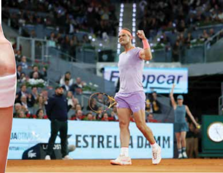
O نادال

مدريد - : بلغت الكازاخستانية إيلينا ريباكينا المصنفة رابعة عالميا الدور نصف النهائي من دورة مدريد للماسترز للألف في كرة المضرب، بعد أن عوضت تأخرها ٥-٢ في المجموعة الثالثة الحاسمة لتنهزم مواطنتها يوليا بوتيتسيفا ٤-٦ و٦-٧ (٧/٤) و٥-٧ أمس الأربعاء. وكانت بوتيتسيفا في طريقها للفوز عندما