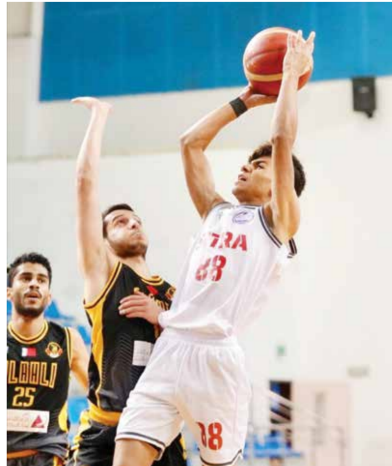
O من لقاء سترة والأهلي

ويضم الفريقان مجموعة مميزة من اللاعبين المهاريين والموهوبين، ومن المتوقع أن تكون المواجهة مثيرة ومتكافئة من الجانبين.