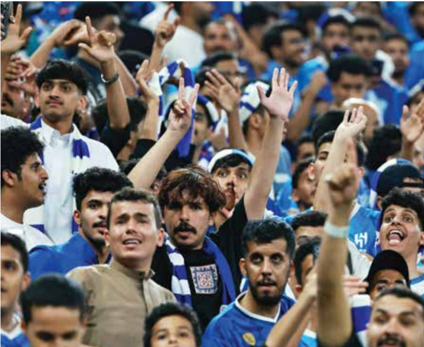
○ جماهير الهلال