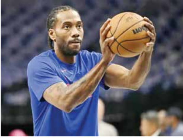
O كواي لينارد