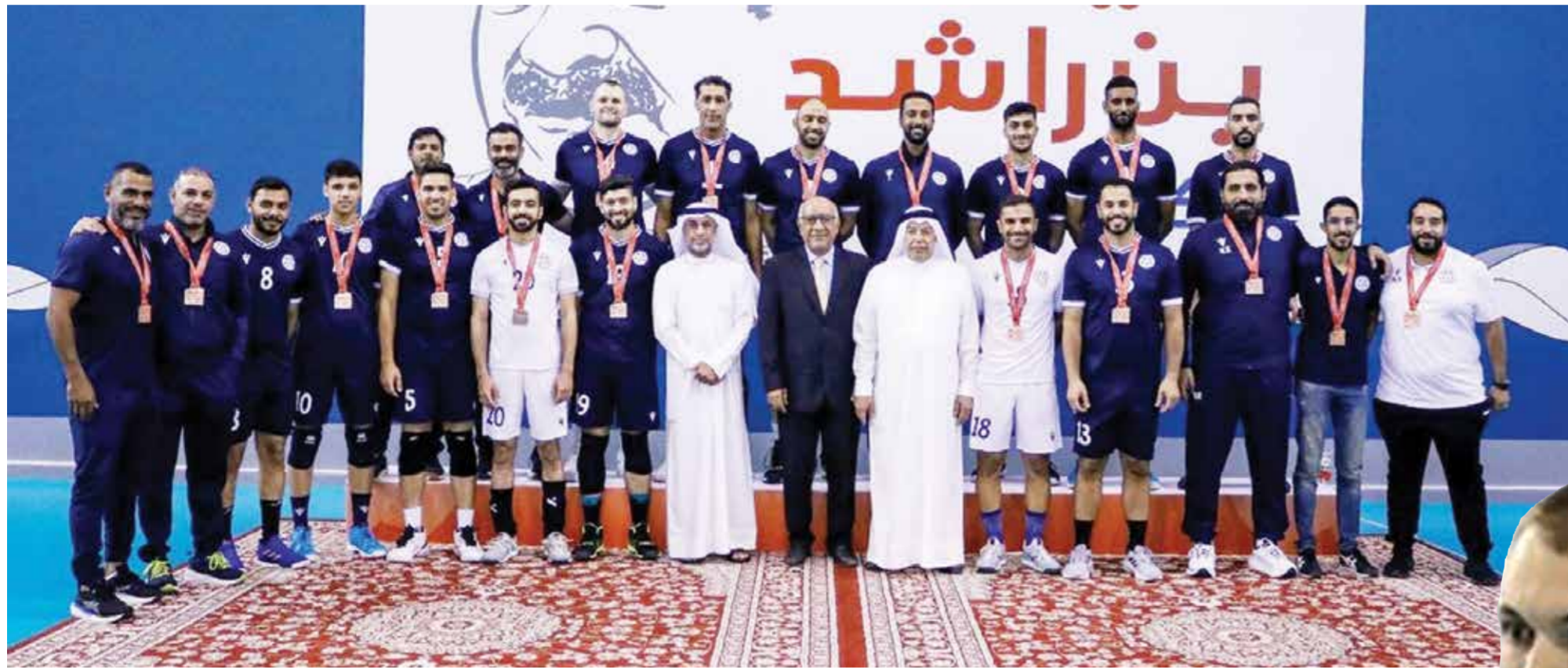
تتويج فريق النجمة ببطولة دوري عيسى بن راشد.