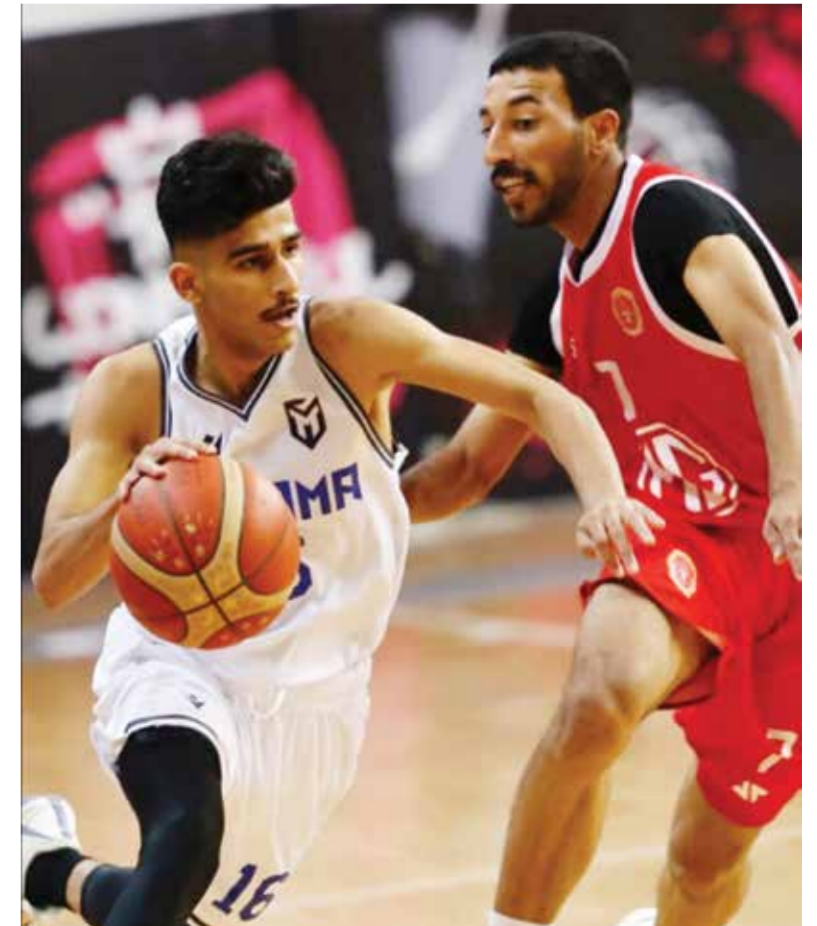
O من لقاء المنامة والمحرق