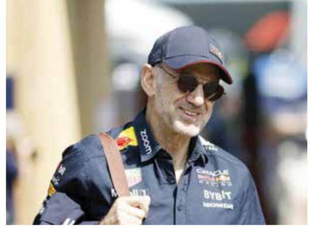
O نيوي.

المحتمل أن يحتوي على «خطط أمنية، مرتبطة بالبنى التحتية داخل القرية الأولمبية في فيلنوف-داسك في مدينة ليل. وحصلت واقعة السرقة مساء الاثنين حسب المصدر نفسه، كاشفاً أنه تم حظر الوصول الى المعلومات على الشبكة من قبل القسم التكنولوجي في أولمبياد باريس ٢٠٢٤. وقال مصدر آخر في الشرطة لوكالة فرانس برس إن شارة التعريف المسروقة «لا تسمح بفتح أي باب، والكمبيوتر كان مغلقاً». وفي نهاية شهر فبراير، سُرقت حقيبة تعود إلى مهندس من مجلس بلدية مدينة باريس من قطار في محطة «غار دو نور» فيها جهاز حاسوب وناقلا للبيانات (يو اس بي) يحتون على الخطط الأمنية للأولمبياد.