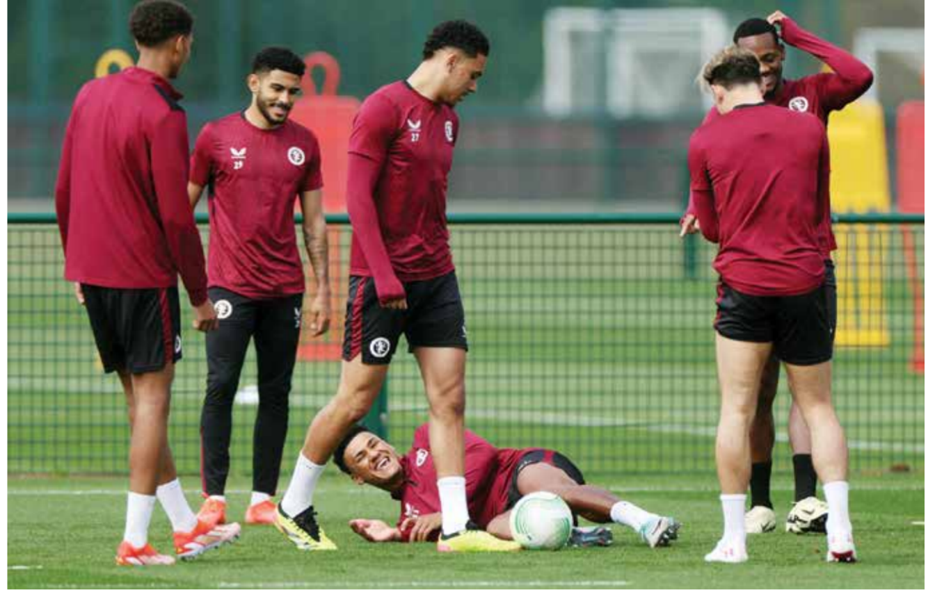
○ تدريبات أستون فيلا .