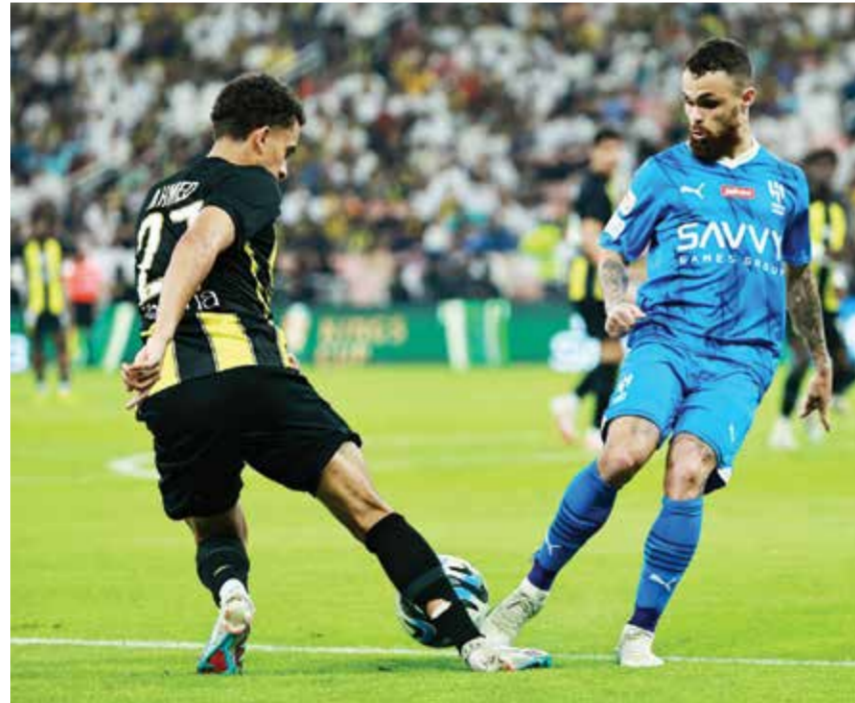
○ لقاء الاتحاد والهلال

فيرمينو، بالإضافة إلى العاجي فرانك كيسييه والحارس السنغالي إدوار ميندي. ويستضيف الحزّم متديبل الترتيب نظيره الأخدود الخامس عشر في لقاء منطقة الهبوط.