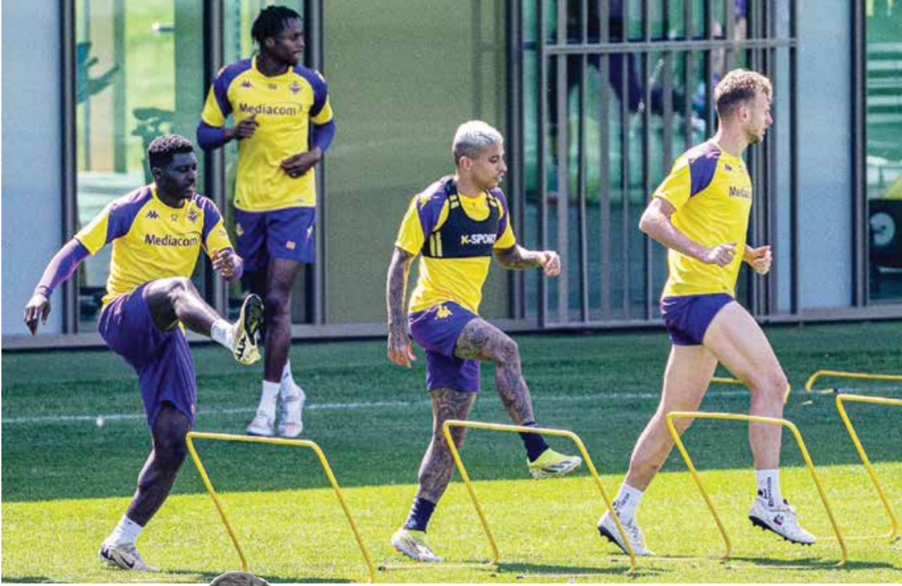
○ تحضيرات فيورتينا .