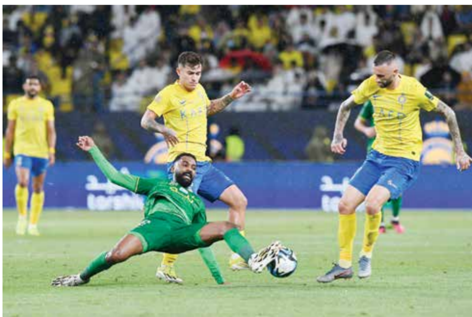
O لقاء النصر والخليج