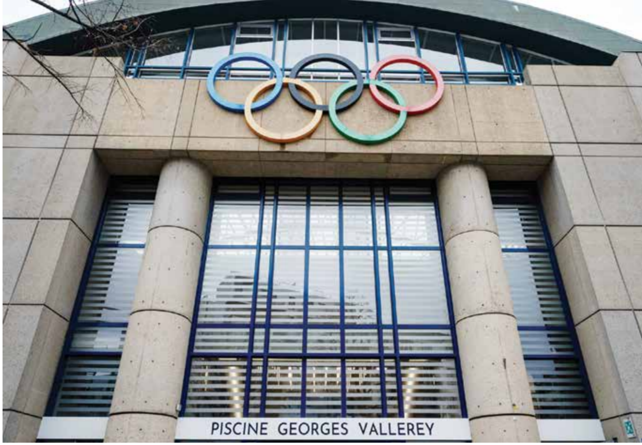
O مسبح أولمبي في باريس.

وتألق الثنائي جيمس هاردن وبول جورج مع كليبرز في غياب لينارد، فبلغت معدلات الأول ٢٦ نقطة و٧ تمريرات حاسمة في المباراة، بينما ساهم الثاني في ٢١ نقطة وه تمريرات حاسمة.