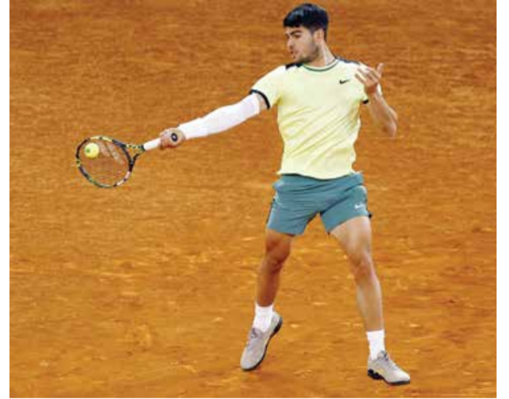
O الكاراس (رويتز)