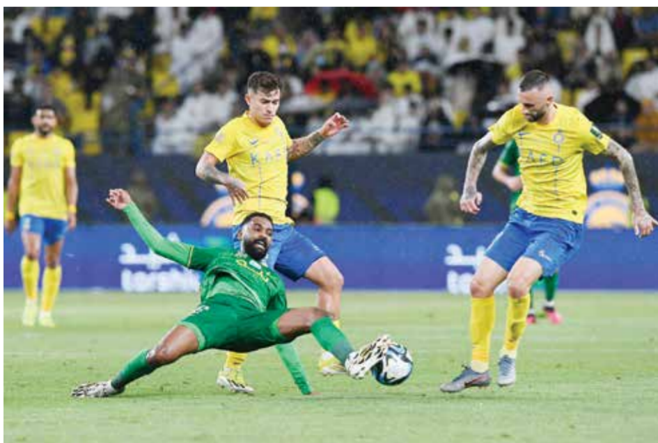
○ لقاء النصر والخليج