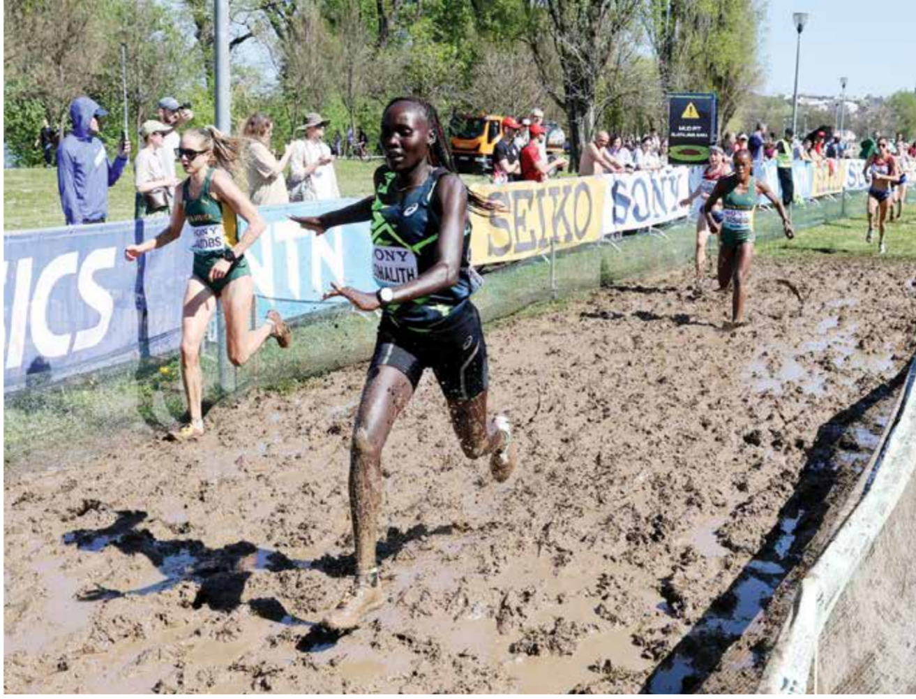
O لوهاليث في إحدى المنافسات

وقال السباح (٢٤ عاما) لرويتز أمس الأربعاء: «قد تشتت هذه القضية انتباه العالم وربما يكون هناك احتجاجات، لست متأكدا تماما، لكن من المؤسف بالتأكيد أن يتم نشر هذا قبل الألعاب الأولمبية مباشرة لأن هذا قد يصرف اهتمام الناس عن الغاية الرئيسية للأولمبياد». وأضاف: «نحن هنا للمشاركة في المنافسات وإظهار رياضتنا في أفضل صورة». وأطلقت الوكالة العالمية لمكافحة المنشطات مراجعة مستقلة للقضية الأسبوع الماضي وسط ضغوط من الرياضيين والسلطات الوطنية لمكافحة المنشطات.