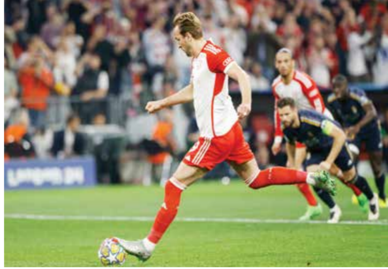
○ كاين. (أ ب ف)

وعن مباراة الرّد، قال مدرب بايرن توماس توخل الذي سيرتك فريقه في نهاية الموسم وكان قاد أقصى ريال مدريد من نصف النهائي في طريقه إلى قيادة تشلسي الإنجليزي للقب ٢٠٢١ «الفائز يأخذ كل شيء». تابع «هذا ممكن (سانتياغو برنابيو) من أصعب الأماكن لتحقيق الفوز في مباراة. الهدف واضح. يجب أن نتحلّى بالشجاعة، الثقة وأن نكون حاسمين». أما مدرب ريال الإيطالي كارلو أنشيلوتي فأرى أنها «نتيجة جيدة قبل مباراة الإياب، لكن لم يتقرّر أي شيء. بايرن يمتلك جودة مرتفعة. يمكن للاعبين مثل (جمال) موسيالا أو (لوروا) سانيه قادرين على ايدائنا». بدوره، قال مسجل هدفي ريال فينيسوس جونير، في هذه المسابقة الأهم هو عدم الخسارة، ونحن هنا لأننا لم نخسر بعد».