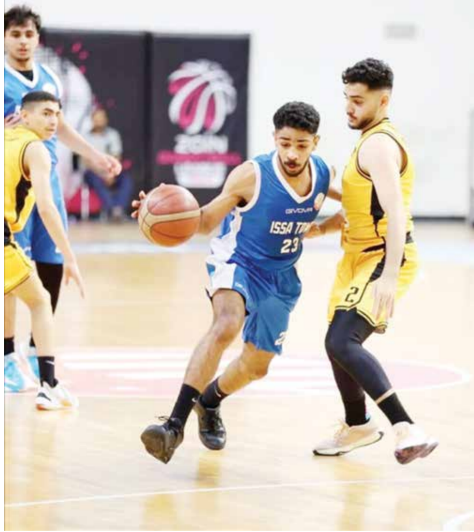
O لقطة من مباريات فئات السلة.