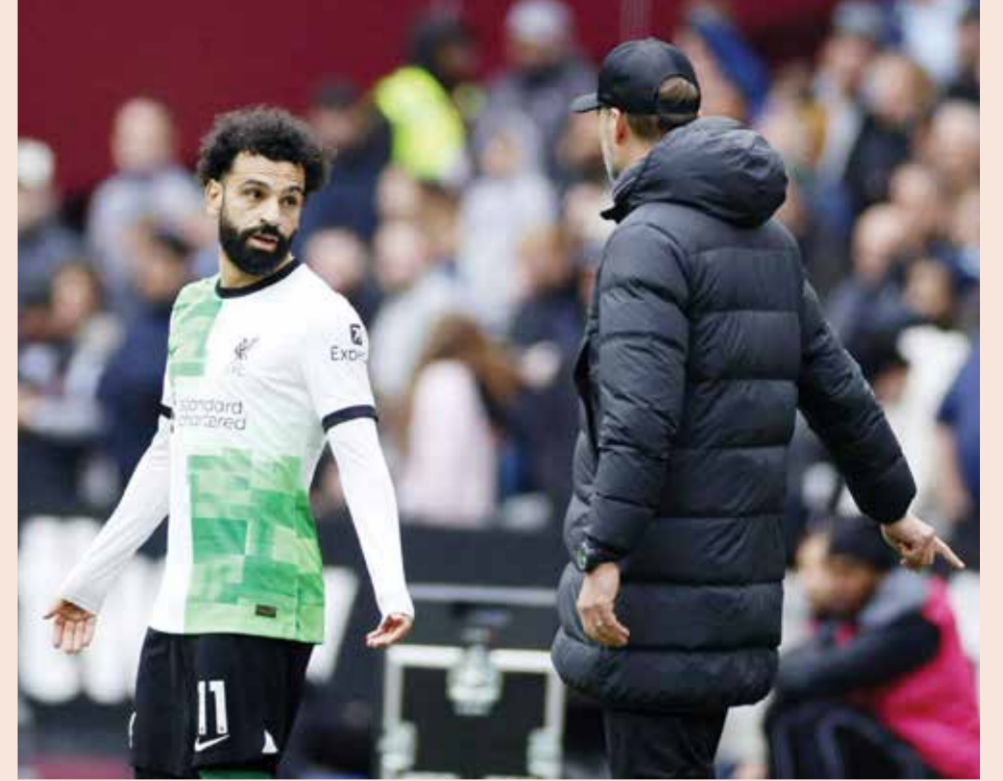
○ مشادة كلوب وصلاح

أما صلاح البالغ من العمر ٣١ عاما فيعاني خلال الفترة الأخيرة حيث سجل هدفا واحدا في آخر ست مباريات، وجلس بديلا في مباراتين خلال آخر ثلاث مباريات.