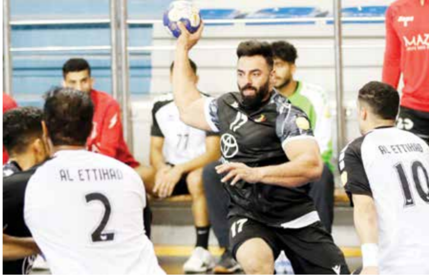
○ من لقاء الأهلي والاتحاد في الجولة الثامنة