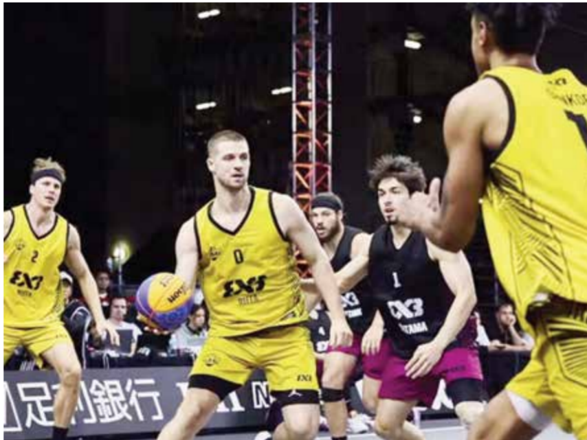
○ من مشاركة الفريق

هذا الكلام لا صحة له أبداً مؤكداً أنه رغم انحساره عن أجواء اللعبة إلا أنه قريب منها عبر متابعتها بالمشاهدة والقراءة. وعن طموحه القادم قال: إنه يتطلع إلى العمل مع قطاع الفئات العمرية خلال الفترة القادمة، ويرى بحسب قناعته أن هذا القطاع هو من يتيح الفرصة للمدرب كي يترك بصمته الحقيقية، ومتى ما حصل على أي عقد فإنه سيخضعه للدراسة واتخاذ القرار بحسب رؤيته.