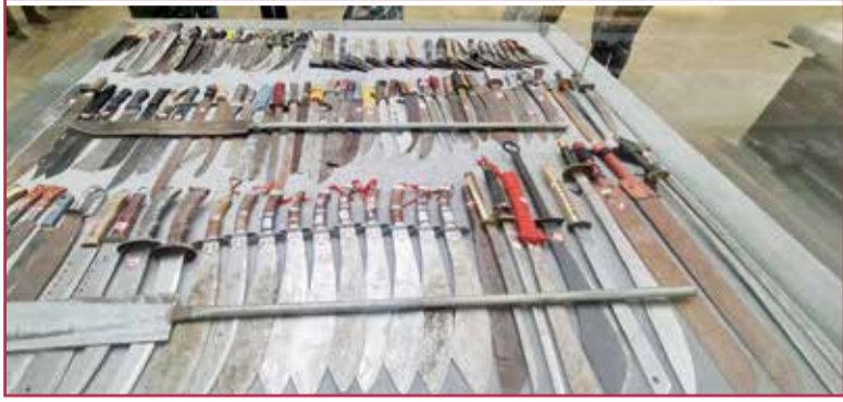
○ نماذج من الأسلحة التي استخدمها الإرهابيون لقتل الأبرياء في «شينجيانغ».