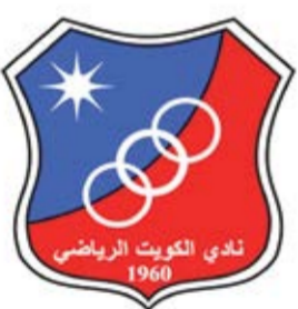
○ شعار نادي الكويت

ويشير الترتيب العام للمسابقة قبل انطلاق الجولة العاشرة إلى تصدر الشباب برصيد (٢٤ نقطة)، ويأتي من بعده النجمة في المركز الثاني برصيد (٢٠ نقطة)، فيما يمتلك الدير والأهلي (١٩ نقطة)، الاتفاق (١٨ نقطة)، باربار وتوبلي والتضامن (١٦ نقطة)، البحرين (١٣ نقطة)، الاتحاد (١١ نقطة)، وأخيراً سماهيح في المركز الأخير برصيد (٨ نقاط).