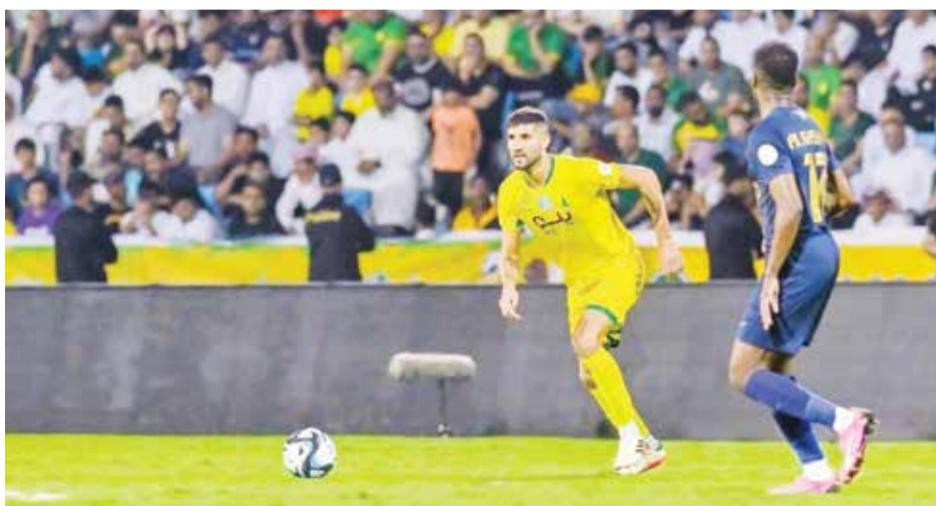
لقاء النصر والخليج

على الجانب الآخر، تجمد رصيد لاس بالاس عند ٣٧ نقطة في المركز الثالث عشر. وتقدم جبرونا عن طريق ديفيد لوبيز في الدقيقة ٢٦، قبل أن يضيف زميله أرتيم