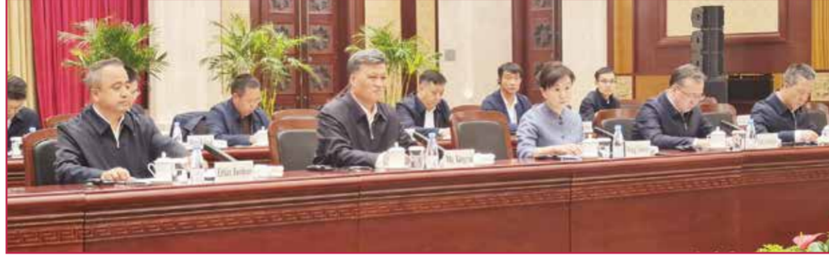
○ أمين لجنة الحزب الشيوعي الحاكم في إقليم «شينجيانغ»، متحدثاً إلى الإعلاميين.

والإيغورية، ومكتبة الكترونية تضم ٤٩ ألف كتاب، ومكتبة متخصصة للمجلات والصحف بمختلف اللغات حول العلوم الإسلامية. ووسط ساحة المعهد، يقف مسجد كبير يشموخ على مساحة ١٤٣٠ متراً مربعاً، ويستوعب أكثر من ألف مصلي. وتقام فيه دروس القرآن والصلوات الخمس ومختلف المناسبات.