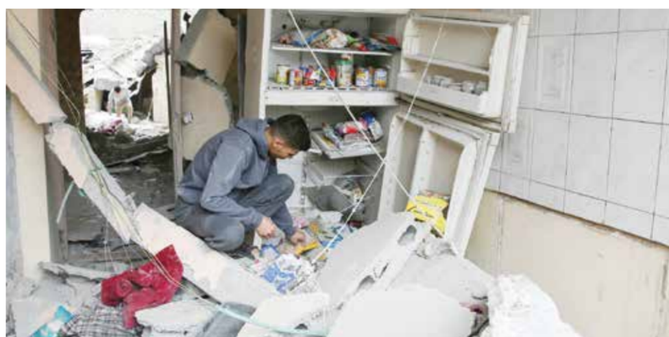
○ إسرائيل مستمرة في استهداف بيوت المدنيين في أنحاء غزة.

مجموعة من المختصين بالملف الفلسطيني، لمناقشة إطار شامل لوقف إطلاق النار في قطاع غزة». وذكرت القناة أن «هناك تقدماً ملحوظاً في تقريب وجهات النظر بين الوفدين المصري والإسرائيلي بشأن الوصول إلى هدنة».