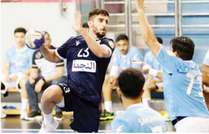
○ من مباراة النجمة وسماهير