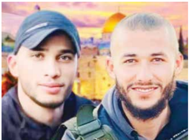
○ الشهيدان في صورة تذكارية.

وتشهد مختلف مناطق الضفة الغربية المحتلة، تصاعداً في وتيرة الاعتداءات الإسرائيلية في أعقاب اندلاع العدوان الإسرائيلي على قطاع غزة اعتباراً من السابع من أكتوبر. ومنذ ذلك التاريخ، استشهد ٤٩٠ فلسطينياً على الأقل بنيران القوات والمستوطنين الإسرائيليين في الضفة الغربية، وفق مصادر رسمية فلسطينية.