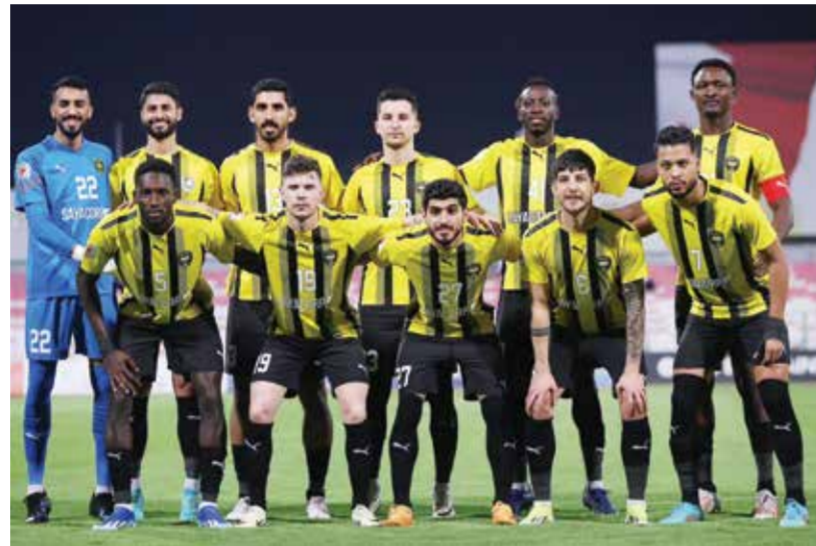
○ فريق الخالدية لكرة القدم