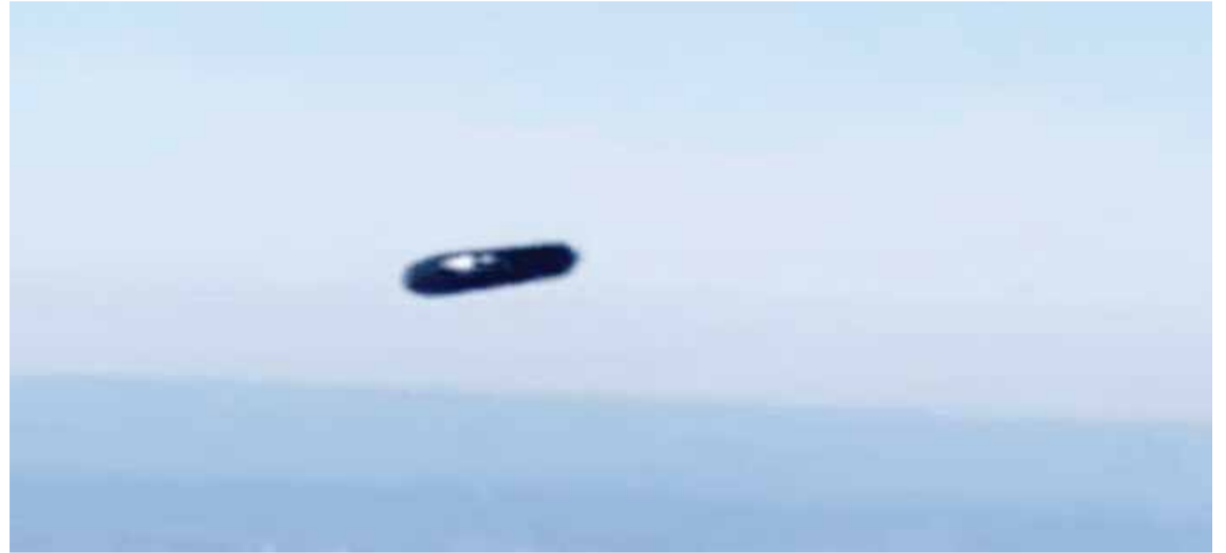
○ صورة من الفيديو الملتقط من الطائرة.

تولي اهتماماً أقل للمقاسات والعمر والوزن، وتركز أكثر على شخصية المتسابقات والقيم