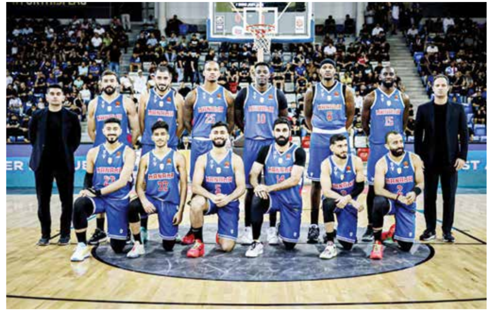
○ فريق المنامة لكرة السلة