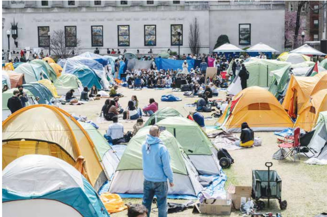
○ مخيم احتجاجي مؤيد للفلسطينيين في جامعة كولومبيا بنيويورك.

نيويورك - (رويترز): قبل أن يقيم الطلاب مخيم احتجاج مؤيد للفلسطينيين في حديقة جامعة كولومبيا الأسبوع الماضي، درس بعضهم مادة (كولومبيا الاختيارية المتعلقة بالاحتجاجات على حرب فيتنام والتي يرونها شبيهة لنشاطهم الاحتجاجي الحالي في الحرم الجامعي. وقف فرانك جوردي، أستاذ التاريخ في جامعة كولومبيا الذي يقوم بتدريس هذه المادة منذ عام ٢٠١٧، مع اثنين من طلابه بجوار المخيم المنصوب في حرم الجامعة الواقعة بمدينة نيويورك يوم الخميس لمناقشة أوجه التشابه بين الاحتجاجات على حرب فيتنام والاحتجاجات الحالية المؤيدة للفلسطينيين في ندوة بعنوان (١٩٦٨: مواصلة القتال). كان المحتجون يستمعون وهم يجلسون على فرش على الأرض العشبية أمام خيامهم بينما يتناولون وجبات مجانية خفيفة. وأوقفت إدارة الجامعة عشرات الطلبة المحتجين وسمحت بإلقاء القبض عليهم الأسبوع الماضي. ويقول بعضهم إنهم يطبقون ما تعلموه ودرسوه في الجامعة فيما يتعلق بمعارضة العدوان الإسرائيلي على غزة.