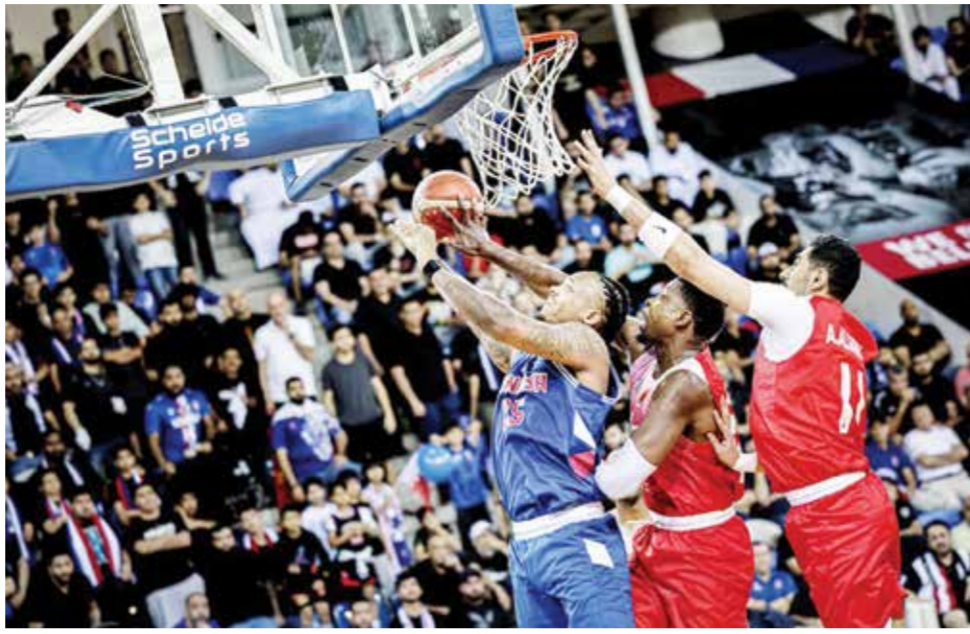
○ من لقاء المنامة والكويت

إقامتها في يوم الجمعة ٣ مايو القادم على صالة خليفة الرياضية بمدينة عيسى. وتأتي التحركات الجماهيرية بسبب تزامن ليلة المباراة مع مناسبة دينية، الأمر الذي سيؤثر على الحضور الجماهيري وعلى التشجيع داخل الصالة، وتأمل الجماهير من اتحاد السلة أن يتجاوب مع هذه المطالب من أجل المصلحة العامة ونجاح هذا الحرس السلوي في مملكة البحرين، حيث تريد الجماهير أن يقام النهائي في موعد آخر حتى تتفاعل بالتشجيع والأهازيج والتصفيق مع دقائق الطبول لتكون الأجواء مميزة للغاية.