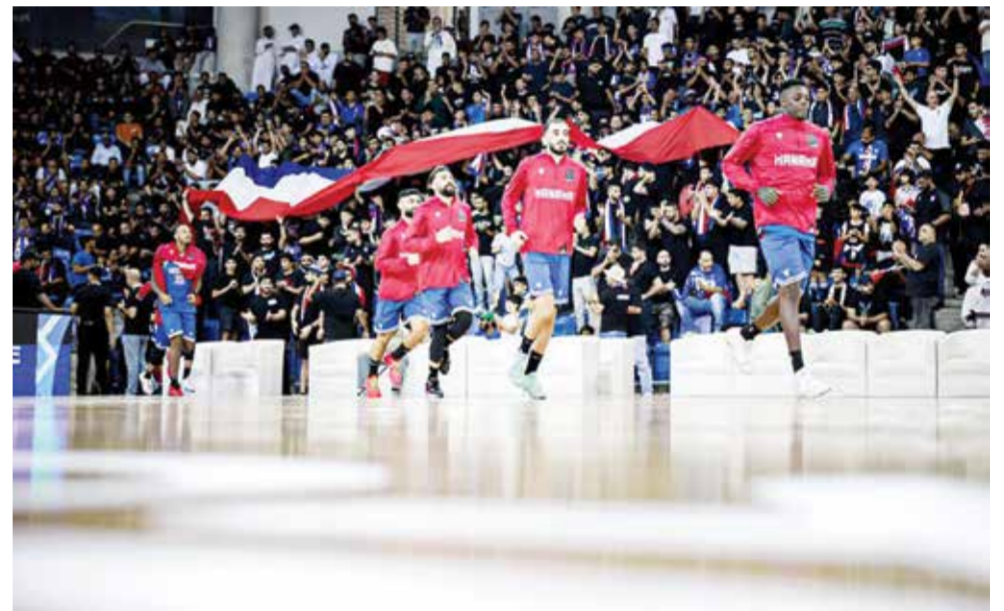
○ جماهير المنامة ستلحق بالفريق إلى الكويت

أكمل فريق المنامة لكرة السلة استعداداته وسيغادر اليوم الأحد إلى دولة الكويت من أجل مواجهة فريق الكويت الكويتي يوم غد الاثنين في مواجهة الثانية من نهائي منطقة الخليج لبطولة دوري غرب آسيا (السيور ليغ). ويسعى المنامة إلى رد اعتباره من خسارته في مواجهة الأولى على أرضه وبين جماهيره بنتيجة ٨٦/٧٤، وإذا ما نجح في ذلك فسيؤجل الحسم إلى مواجهة فاصلة ستقام في مملكة البحرين بتاريخ ٦ مايو القادم. يذكر أن فريق المنامة لم يظهر بمستواه الطبيعي في مواجهة الأولى، حيث قدم واحدة من أسوأ مبارياته في الموسم؛ ومن المؤكد أن الجهاز الفني جلس مع اللاعبين وتم مشاهدة فيديو المباراة وتحليل الاحصائيات ووضع الخطة المناسبة لخوض مواجهة الثانية. والجدير بالذكر أن فريق المنامة حقق ستة انتصارات في بطولة واصل لهذا العام، وجاءت الخسارة الأولى في النهائي، ولذلك يحاول الفريق