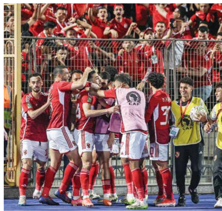
○ فرحة الأهلي بالتأهل

في المقابل، أطاح الترجي بفريق ماميلودي صن داويز الجنوب أفريقي، في مواجهة المربع الذهبي الأخرى للمسابقة، لتكون الكرة العربية على موعد مع لقبها الثامن على التوالي في دوري