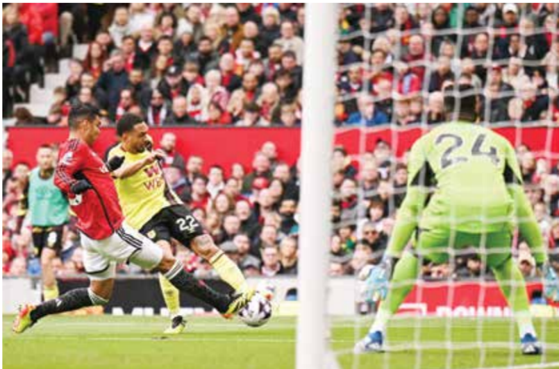
لقاء يوناييتد وبيرنلي

ويغشله في تحقيق فوزه الأول على «روسونيري» في ملعبه منذ ١٠ نوفمبر ٢٠١٩ (-١)، بات يوفنتوس مهتماً بمركزه الثالث كونه يتقدم بفارق ثلاث نقاط عن بولونيا الرابع الذي يلتقي أودينيزي الأحد، لكن المشاركة في دوري الأبطال شبه محسومة بعدما مُنحت إيطاليا