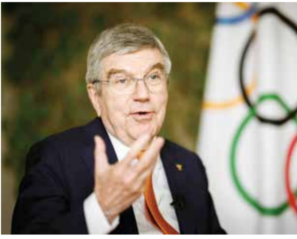
○ توماس باخ