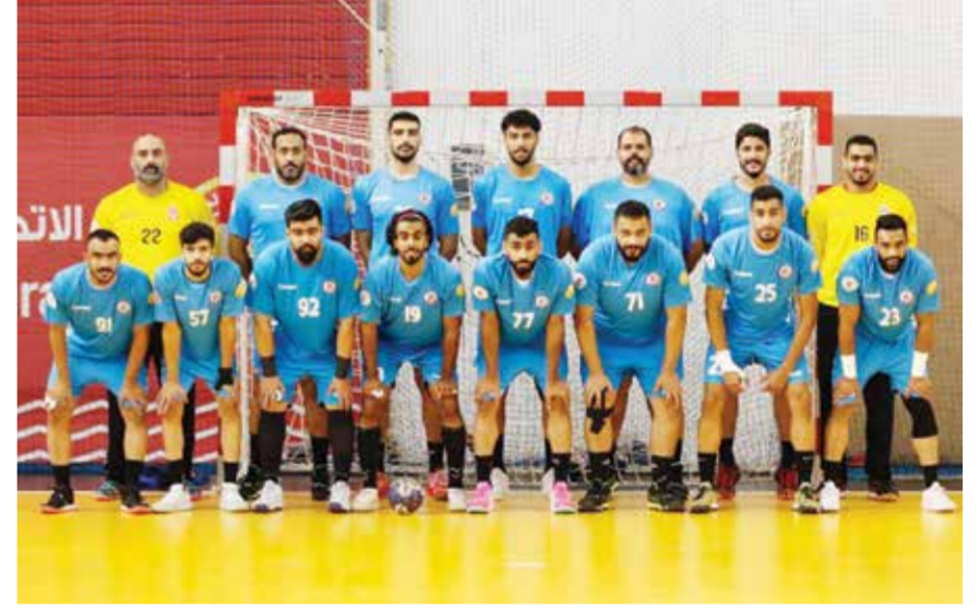
○ فريق الشباب