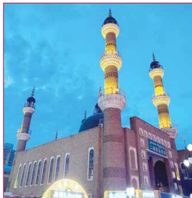
○ مسجد البازار في اورومتشي.

انطلاقا من دراسات امتدت أكثر من ٤٠ عاما، يؤكد المؤرخ ومدير إدارة الدراسات الاجتماعية (ما بين يان) الذي ألف «الكتاب الأبيض» حول تاريخ الأديان والثقافات في «شينجيانغ»، أن هناك محاولات للإساءة إلى سمعة «شينجيانغ»، إلا أن الواقع يثبت أن ما يروج له الإعلام الغربي لا أساس له، حيث لم يفرض عقاب واحد على أي مواطن لأسباب دينية، كما أن حرية المعتقدات مكفولة بشكل يجعل