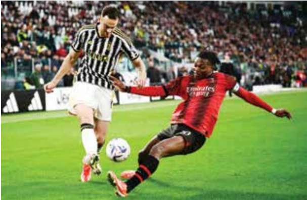
لقاء ميلان ويوفنتوس

زاوية ضيقة في القائم الأيمن (٥٠). ورد ميلان في الدقيقة ٦٦ بتسديدة بعيدة من الإنجليزي روبن لوفتوس-شيك مرت قريبة جدا من القائم الأيسر لمرمى الحارس البولندي فويتشيك شتيفيزني، ثم انتقل الخطر الى الجهة عبر مواطن الأخير اركاديوش ميليك الذي دخل بدلا من فلاهوفيتش، لكن سيورتييلو تائق في صد رأسية مهاجم مرسيليا الفرنسي السابق (٧٣).