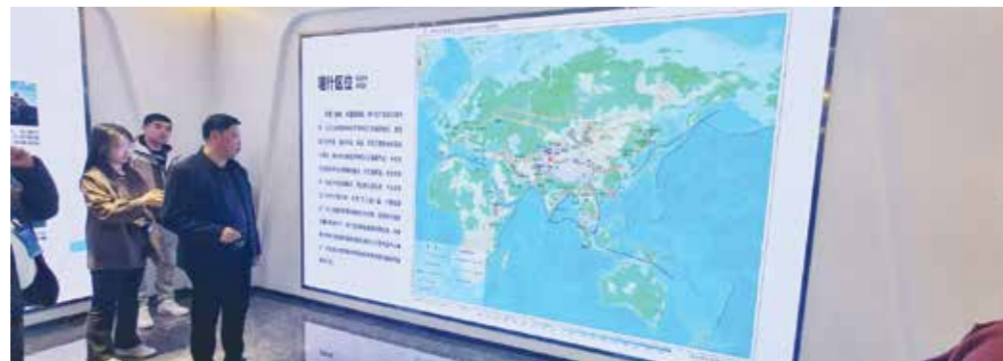
○ منطقة التجارة الحرة في كاشي.

منذ القدم، تمثل مدينة كاشي في «شينجيانغ» نقطة التقاء بين الثقافات الصينية والغربية، وممرًا مهماً بين الصين والدول الأخرى على طول