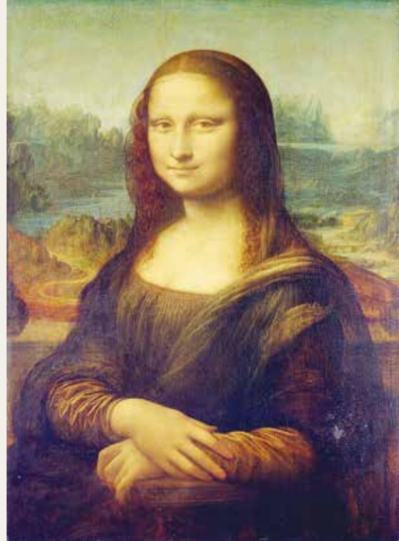
○ لوحة المونا ليزا.

أعلنت مديرة متحف اللوفر أمس السبت، احتمال تخصيص غرفة للوحة «مونا ليزا» الأكثر شهرة في العالم. وقالت لورانس دي كار، في حديث إلى إذاعة «فرانس إنتر»: