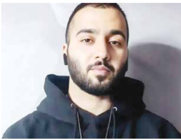
○ المغني الإيراني المحكوم بالإعدام توماج صالح.

ومنذ ١٩ نوفمبر شُن الحوثيون عشرات الهجمات بالصواريخ والمسيرات على سفن تجارية في البحر الأحمر وبحر العرب يعتبرون أنها مرتبطة بإسرائيل أو متجهة إلى موانئها، ويقولون إن ذلك يأتي دعماً للفلسطينيين في قطاع غزة في ظل الحرب الدائرة منذ السابع من أكتوبر الماضي. واستهدف الحوثيون يوم الخميس سفينة «إم اس سي داروين ٦» في خليج عدن معتبرين أنها إسرائيلية. وتأتي موجة الهجمات في الأيام الأخيرة بعد تسجيل تراجع في عمليات الحوثيين مؤخراً. وتقود واشنطن تحالفاً بحرياً دولياً بهدف «حماية» الملاحة البحرية في هذه المنطقة الاستراتيجية التي تمر عبرها ١٢% من التجارة العالمية.