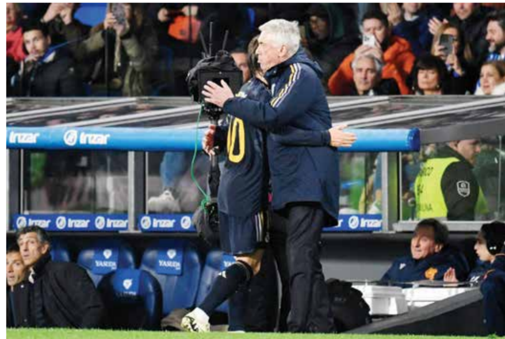
○ أنشيلوتي يعانق مودريتش

وختم بالقول: «ميليتاو وتيبو كورتوا لديهما فرصة للعب ضد بايرن في إحدى المباراتين، دعونا نرى ما إذا كان كورتوا يستطيع اللعب ضد بايرن، سنقيم كل مباراة على حدة».