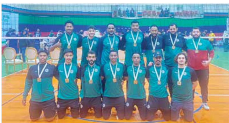
○ فريق الاتفاق لكرة الطائرة