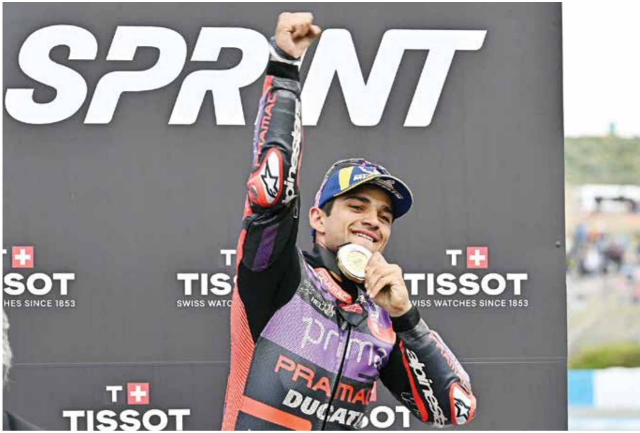
○ تويج مارتن (أ ف ب)

انتقدت وادا منذ انتشار تقارير الأسبوع الماضي حول السماح للسياح بالمشاركة في أولمبياد طوكيو صيف ٢٠٢١، وذلك رغم ثبوت تناولهم بمادة تريمتازيدين التي تساهم في تقوية الاداء، فيما أوضحت السلطات الصينية بأن سبب الضحوص الإيجابية هو طعام ملوث. ورأى باخ أن أولمبياد باريس سيكون مهماً «لإعادة احياء الروح الأولمبية»، بعد النسخة الأخيرة التي شوّتها التدابير الاحترازية خلال جائحة كوفيد-١٩ وأقيمت بمدرجات خالية من الجماهير. قال باخ «المقاربة الدقيقة للغاية والمهنية (من السلطات الفرنسية) تمنحنا الثقة بان هذا الافتتاح على نهر السين سيكون أيقونيا ولا يُنسى للرياضيين وبان الجميع سيكونون آمنين».