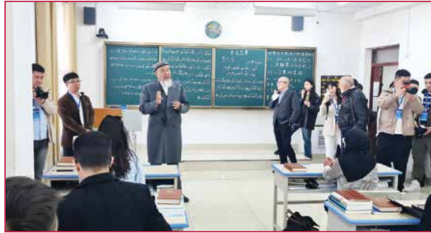
○ معهد الدراسات الإسلامية في «أورومتشي».