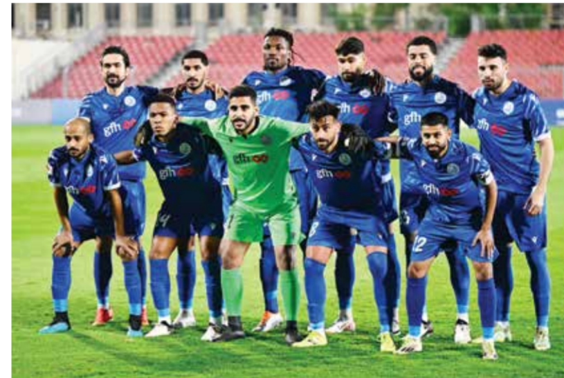
○ فريق الحد لكرة القدم

السابقتين، حيث المنامة يمتلك (٢٣ نقطة) في المركز الخامس ويأمل العودة إلى سلك الانتصارات بعد تعادله سلبياً بالجولة الماضية أمام الأهلي، حيث النقاط الثلاث ستعزز موقعه بسلم الترتيب بين فرق المقدمة، وخسارته إن حدثت تدخله في حسابات أخرى مع وجود منافسين ملاحقين له في هذه الجولة