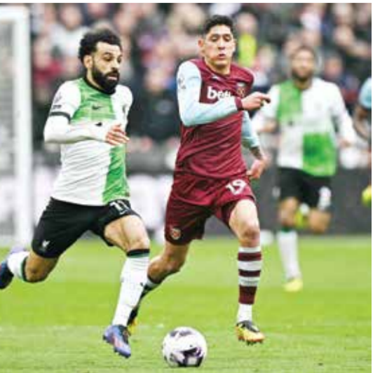
لقاء ليفربول وست هام

ورفع فريق المدرب الهولندي إريك تن هاغ رصيده الى ٥٤ نقطة في المركز السادس، بفارق نقطة فقط أمام نيوكاسل يوناييتد الذي أرسل شيفيلد يوناييتد الأخير الى المستوى الثاني «تساميونشيب» باكتساحه ٥-١، بينها ثنائية للسويدي المتألق الكسندر أيزاك الذي رفع رصيده الى ١٩ هدفاً.