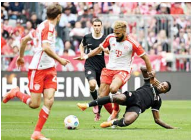
لقاء بايرن ميونخ وفرانكفورت

أمام سان جيرمان في ذهاب نصف نهائي دوري الأبطال، في حين أجرى مديره إدين تريتيتش ٤ تغييرات في التشكيلة الأساسية. وتقدم دورتموند بهدف الانجليزي جايدون سانشو الخالي من الرقابة أمام المرمرى بعد تمريرة عرضية من ماريوس وولف فشل دفاع لايبزيغ في التعامل معها (٢٠). ليرد لايبزيغ بعد ثلاث دقائق عبر هدافه اليلجيكي لوا أوييندا والعودة إلى «في آيه آر» لتأكيد عدم وجود حالة تسلل (٢٣).