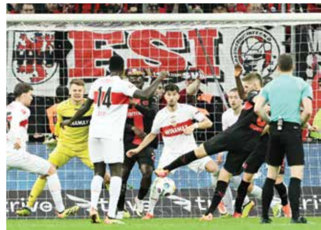
لقاء باير ليفركوزن وشتوتغارت

ومنى دورتموند بضربة معنوية قبل مواجهته الأوروبية