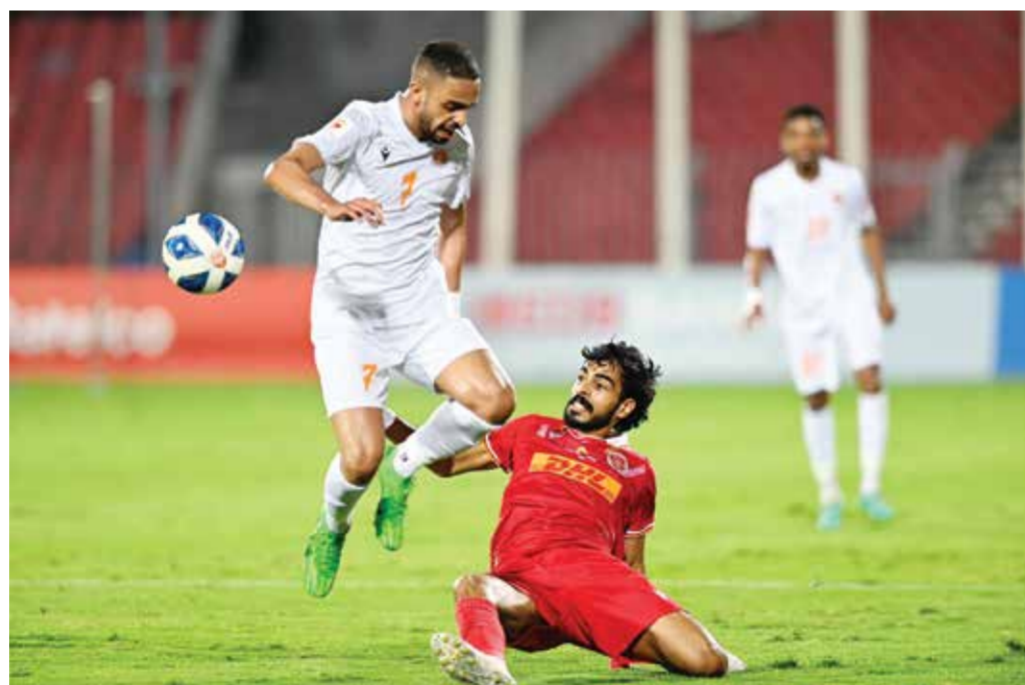
○ لقاء المحرق والحالة

يذكر أن جماهير المنامة ليس بغريب عليها مساندة الفريق خارج الديار حيث عودتنا دائماً على الوقوف خلف الزعيم، وقد سبق لها التواجد في دبي والرياض ومسقط والدوحة، كما تواجدت بقوة أكثر من مرة في الكويت.