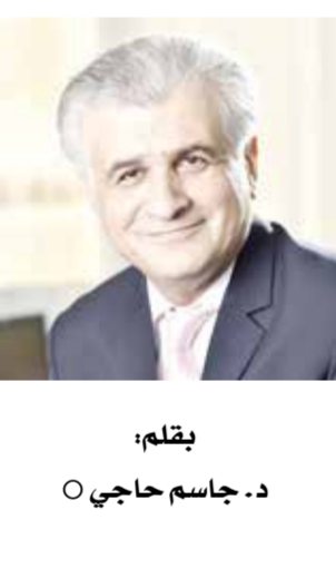
يقلم: د. جاسم حاجي

أمراً حاسماً لضمان تطوير أنظمة الذكاء الاصطناعي والتحقق من صحتها ونشرها بشكل مسؤول، حيث تكون قابلية شرح نماذج الذكاء الاصطناعي وقابلية تفسيرها ضرورية للائتمان التنظيمي وإدارة المخاطر وبناء الثقة مع أصحاب المصلحة. تعد أطر الحوكمة القوية، بما في ذلك الرقابة البشرية وعمليات التدقيق المنتظمة والمراقبة المستمرة، ضرورية لمعالجة هذه المخاطر الداخلية وتعزيز اعتماد الذكاء الاصطناعي المسؤول.