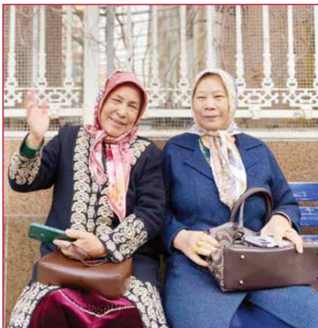
○ مسلمات صينيات من الإيغور.

تفضيلية للمسلمين في بعض المجالات مثل امتحانات القبول في بعض الجامعات لجذب المميزين. لذلك ومن خلال زياراتي للعديد من الدول المسلمة وغير المسلمة يمكنني التأكيد أن وضع حرية المعتقدات في «شينجيانغ» ليست أقل من الكثير من الدول الأخرى.