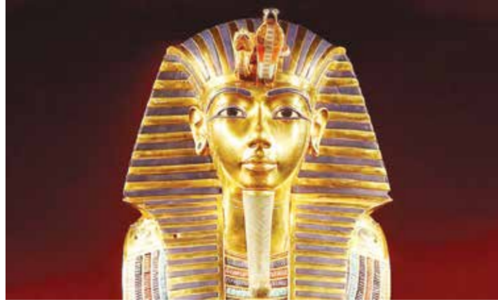
○ قناع توت عنخ آمون.

الحذر، عند فتح أغطية التوابيت المغلقة منذ قرون بعيدة، عبر تركها مفتوحة مدة لا تقل عن نصف ساعة، حتى يخرج الهواء الفاسد من داخل التابوت، ويدخل الهواء النقي، ويمكن بعدها للباحث فحص التابوت وباقي مقتنيات المقبرة، وهو ما يعني -حسبما يقول حواس- أن لعنة الفراعنة تتمثل في تلك الجرائم القديمة القاتلة.