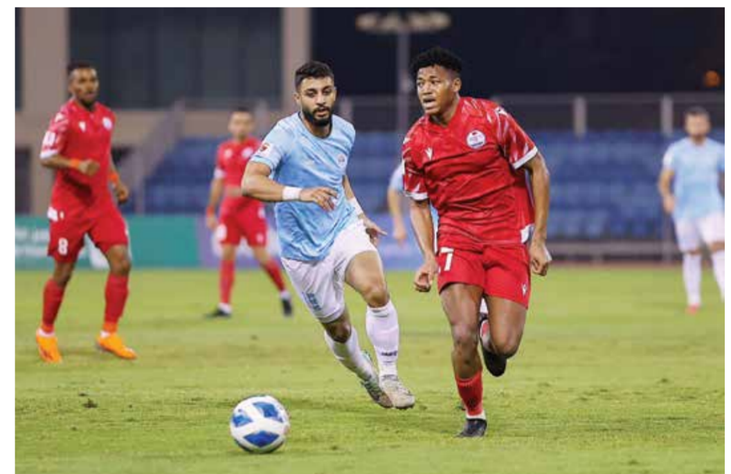
○ لقاء الرفاع وسترة