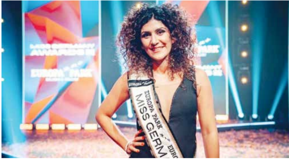
○ آيامه شوناور.

الإيرانيات القويات اللواتي يخرجن إلى الشوارع كل يوم ويقاثلن من أجل حريتهن. هذه هي الأسباب التي جعلتني أقول في قرارة نفسي إن عليّ إنجاز شيء ما».