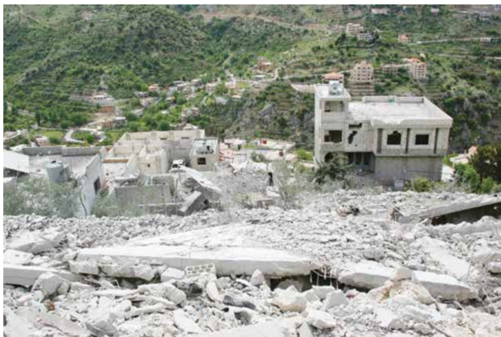
○ منازل في شبعاء دمرت في قصف إسرائيلي. (أ ف ب)

بيروت - (أ ف ب): أعلن حزب الله اللبناني الموالي لإيران أمس السبت أنه استهدف موقعين عسكريين في شمال إسرائيل ردا على قصف طاول ليليا «منازل مدنية» في جنوب لبنان وأسفر عن ثلاثة قتلى، بينهم مقاتلان من الحزب. وقال الحزب في بيان «ردا على اعتداءات العدو على القرى الصامدة والمنازل المدنية وخصوصاً بلدي كفرحلا وكفرشوبا، شن مجاهدو المقاومة الإسلامية اليوم السبت هجوماً مركباً بالمسيرات الانتفاضية والصواريخ الموجهة على مقر القيادة العسكرية في مستوطنة المنارة وتموضع قوات الكتيبة ٥١ التابع للواء غولاني».