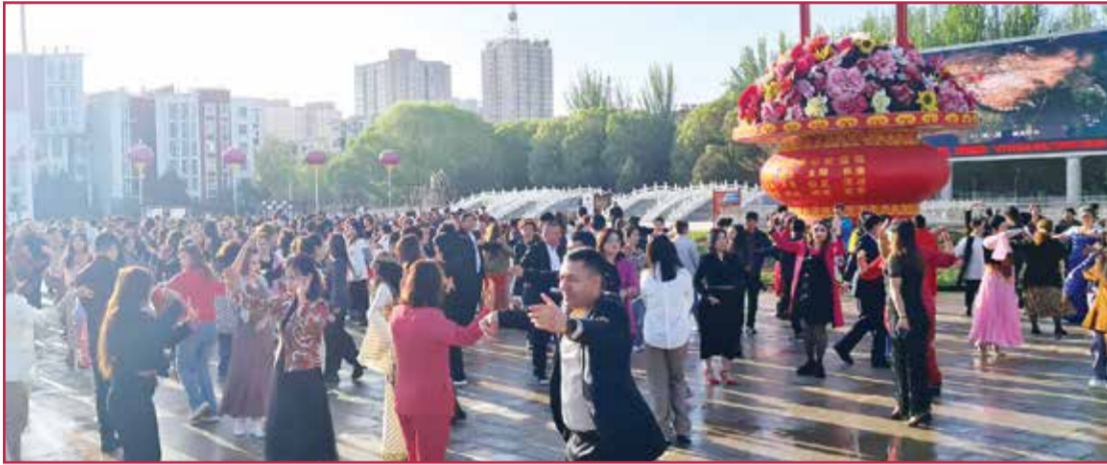
○ احتفالات المسلمين وغيرهم من القوميات بعيد الفطر.