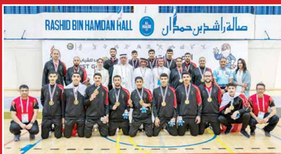
التفاصيل في الملحق الإلكتروني