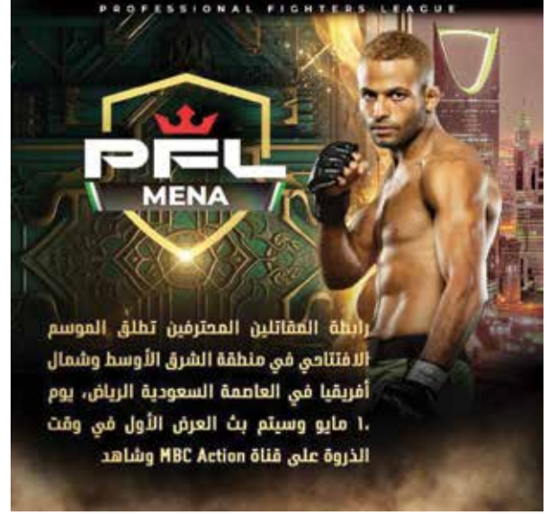
○ إعلان الموسم الافتتاحي

(رويترز): قال الاتحاد الدولي للتنس أمس الخميس إن نهائيات كأس بيلي جين كينج لفرق السيدات ستقام على مدار تسعة أيام مع استبدال دور المجموعات بأدوار إقصائية. وقال الاتحاد الدولي للعبة في بيان: إن البطولة ستبدأ في إشبيلية بإسبانيا في ١٢ نوفمبر المقبل وتنتهي في ٢٠ من نفس الشهر، وستزامن اليومان الأخيران من البطولة مع أول يومين من نهائيات كأس ديفيز للرجال التي