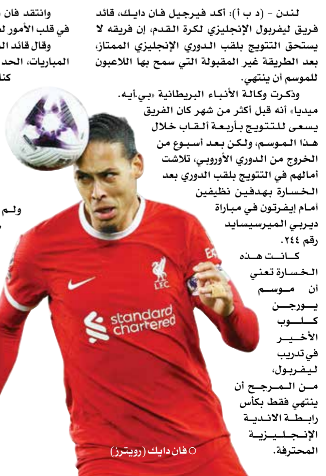
O فان دايك

وكانت هذه الخسارة تعني أن موسم يورجن كلوب الأخير في تدريب ليفربول، من المرجح أن ينتهي فقط بكأس رابطة الأندية الإنجليزية المحترفة.