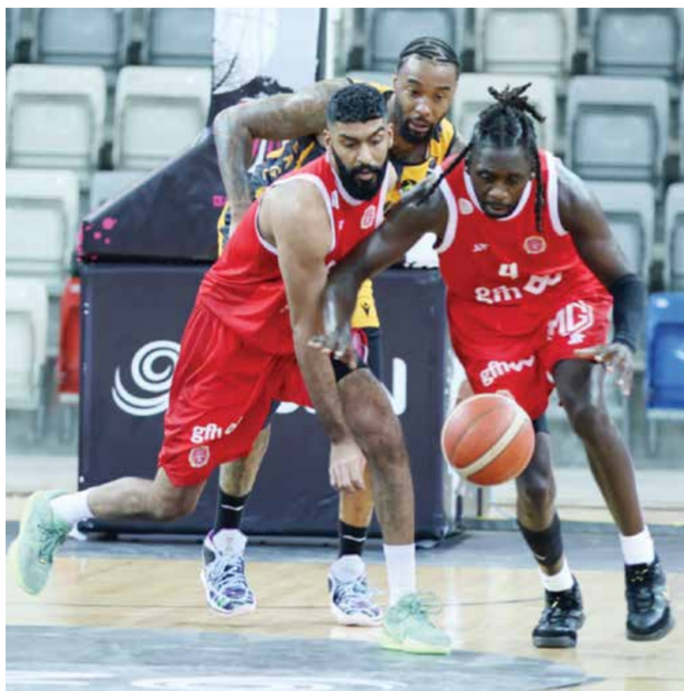
O من اللقاء الأخير بين الفريقين