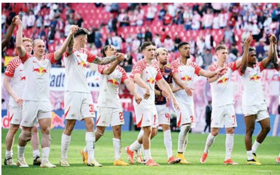
O فريق لايبزغ (رويترز)

برلين - (رويترز): قال الرئيس التنفيذي للأعمال في رازن بال شيبورت لايبزغ أمس الخميس إن النادي عازم على إنهاء الموسم ضمن المراكز الأربعة الأولى في الدوري الألماني لكرة القدم رغم احتمال تأهل صاحب المركز الخامس إلى دوري أبطال أوروبا الموسم المقبل.