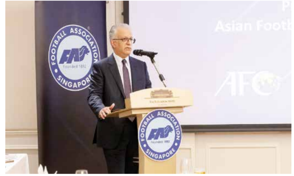
O الشيخ سلمان بن إبراهيم آل خليفة

ثمن الشيخ سلمان بن إبراهيم آل خليفة رئيس الاتحاد الآسيوي لكرة القدم النائب الأول لرئيس الاتحاد الدولي لكرة القدم الاستراتيجية التطويرية البناءة للاتحاد السنغافوري لكرة القدم والتي تهدف إلى الارتقاء بمختلف أركان اللعبة وتعزيز تواجدها في المحافل القارية والدولية. جاء ذلك خلال الزيارة الرسمية التي قام بها الشيخ سلمان بن إبراهيم آل خليفة إلى سنغافورة، واشتملت على عقد اجتماعات ثنائية مع رئيس الاتحاد السنغافوري برنارد تان وأعضاء مجلس الإدارة، بالإضافة إلى السيد إدوين تونغ وزير الثقافة والمجتمع والشباب السنغافوري والوزير الثاني للقانون. وأبدى رئيس الاتحاد الآسيوي لكرة القدم إعجاباً كبيراً بالدعم الذي تحظى به اللعبة في سنغافورة من خلال العديد من المشاريع الهادفة لمشروع «أطلق العنان للزفير» والذي يضم بعض الجهات ذات العلاقة، كوزارة الثقافة والمجتمع والشباب ووزارة التعليم، مشيداً بالدور المحوري للدعم الحكومي في هذا الإطار.