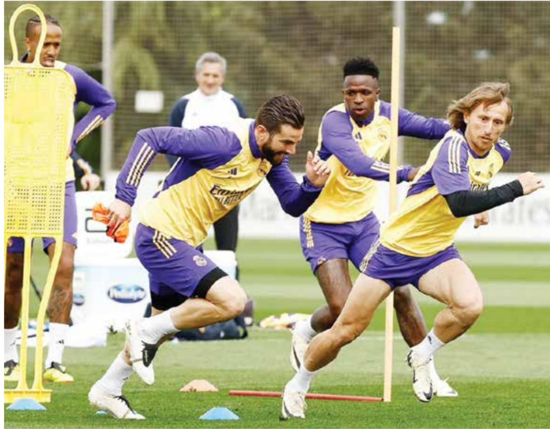
O استعدادات ريال مدريد

وفي مارس، أقال الاتحاد العديد من المديرين المرتبطين بتحقيقات الفساد، فيما فتشت الشرطة مقر الاتحاد على مشارف مدريد إلى جانب ممتلكات روبياليس في غرناطة. ويتعلق الأمر بقرود وقعها روبياليس لإقامة كأس السوبر الإسبانية في المملكة العربية السعودية، من بين أمور أخرى. ومن المقرر إجراء انتخابات لرئاسة الاتحاد في ٦ مايو المقبل، علماً أن روشا هو المرشح الوحيد.