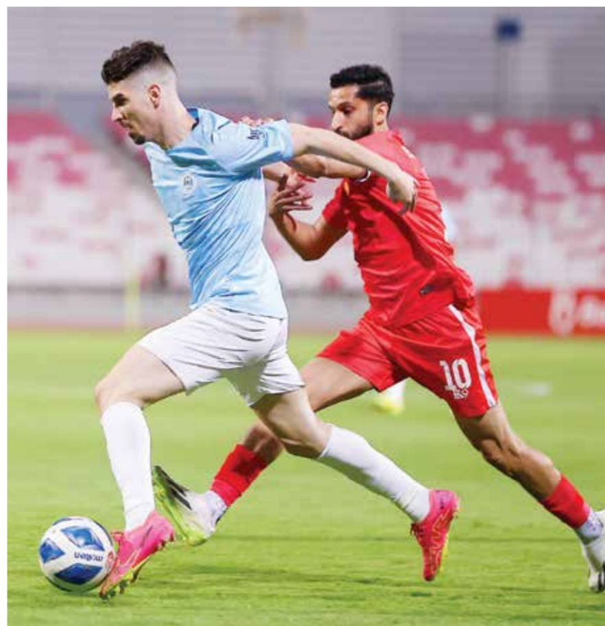
O مباراة الرفاع والرفاع الشرقي.