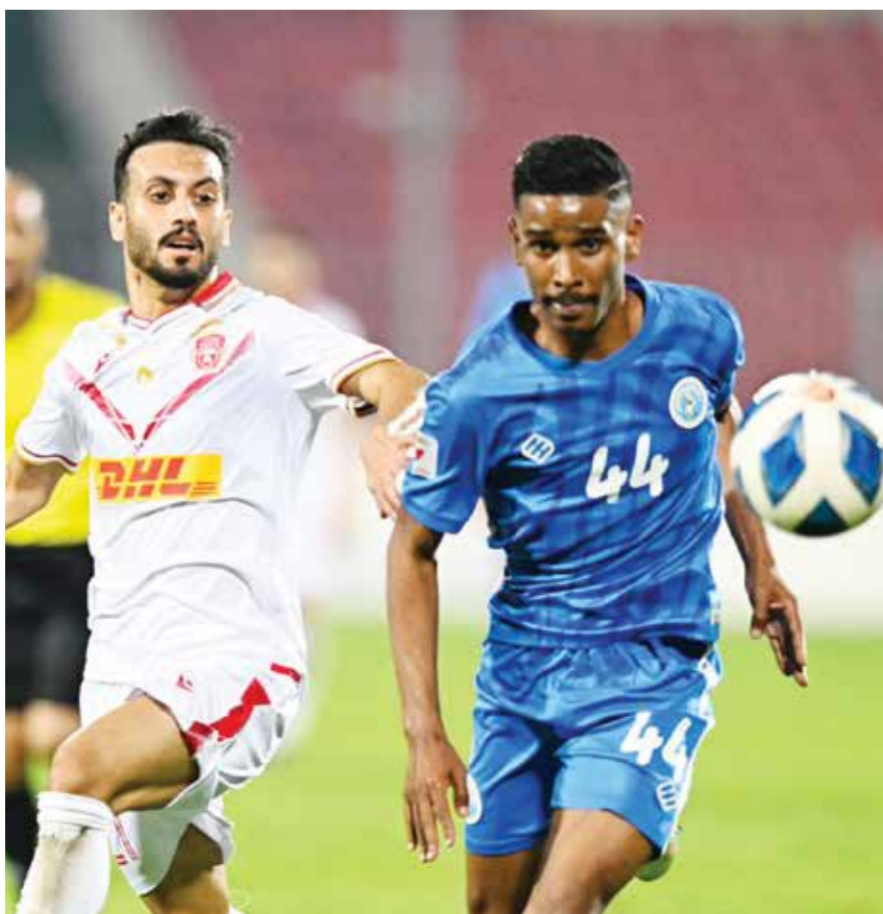
O مباراة المحرق والبستين.