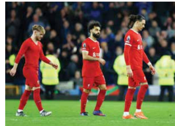
O انتقادات لصالح ونونيس.

لقب البريميرليغ، مع خسارته أمام إيفرتون ٢-٠ في دربي ميرسيسايد الأربعة.