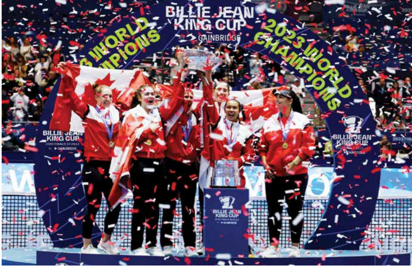
○ الفائزات في النسخة الماضية

وأوضحت: «أداني يستند إلى أساس أرغب في الالتزام به لكن مع احترام الملعب في الوقت ذاته. إنه عمل مستمر بالنسبة لي، لكنني أشاهد الكثير من المباريات على الملاعب الرملية. أحاول الاستعداد جيداً، هذا أفضل ما أستطيع القيام به».