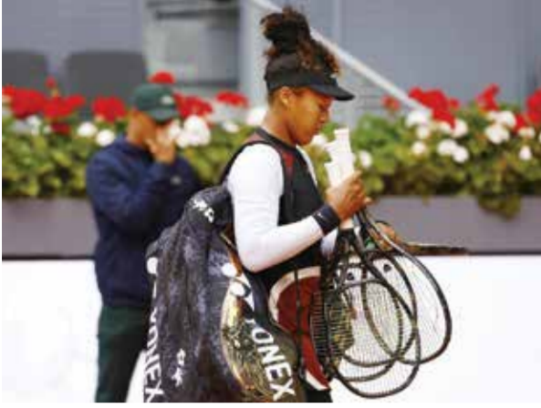
○ أوساكا (رويترز)