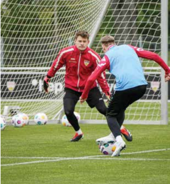
O شوتوجارت الطامح إلى الفوز.

ويلعب المنتخب الألماني، الذي توج بثلاثة ألقاب في أمم أوروبا، بالمجموعة الأولى، التي تضم أيضا منتخبي سويسرا والمجر. واختتم ناغلسمان حديثه بالقول: «في أسوأ السيناريوهات، سيتم إقصاؤنا من البطولة، وما زلنا نسأل أنفسنا كيف لعبنا، وكيف ألهمنا الناس، وكيف ألهمنا أنفسنا، وكيف أثرتنا المشاعر في أنفسنا بطريقة جيدة.»