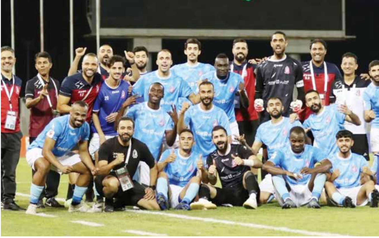
O فرحة الشباب بالانتصار الثمين.