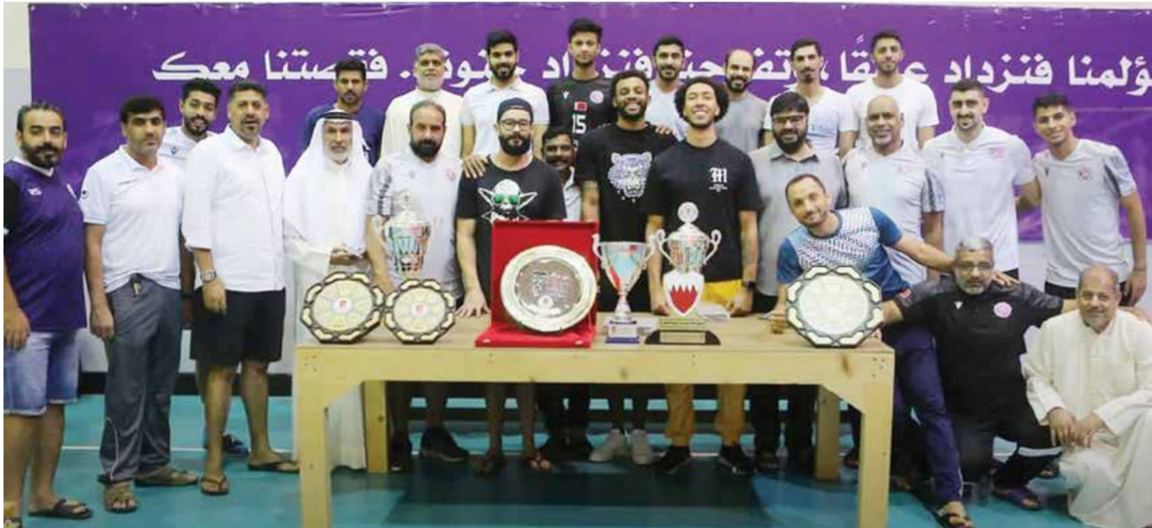
○ لقطة جماعية يتوسطها الثلاثي البرازيلي.

رفع خالد إبراهيم كانو رئيس النادي الأهلي اسمي آيات الشكر والامتنان إلى صاحب السمو الملكي الأمير سلمان بن حمد آل خليفة ولي العهد رئيس مجلس الوزراء، على دعم سموه اللامحدود للحركة الرياضية ورعاية سموه لكأس سمو ولي العهد للكرة الطائرة والذي يعد مصدر تشريف واعتزاز للأسرة الرياضية بشكل عام وأسرة الكرة الطائرة بشكل خاص. كما توجه بالشكر الجزيل إلى سمو الشيخ محمد بن سلمان آل خليفة نجل سمو ولي العهد على حضور وتتويج سموه البطل والوصيف في المباراة النهائية لكأس سمو ولي العهد والتي جمعت الأهلي والمحرق وتوج الأول بلقبها بكل جدارة واستحقاق. وأعرب كانو عن اعتزاز الكبرياء بفوز النادي الأهلي