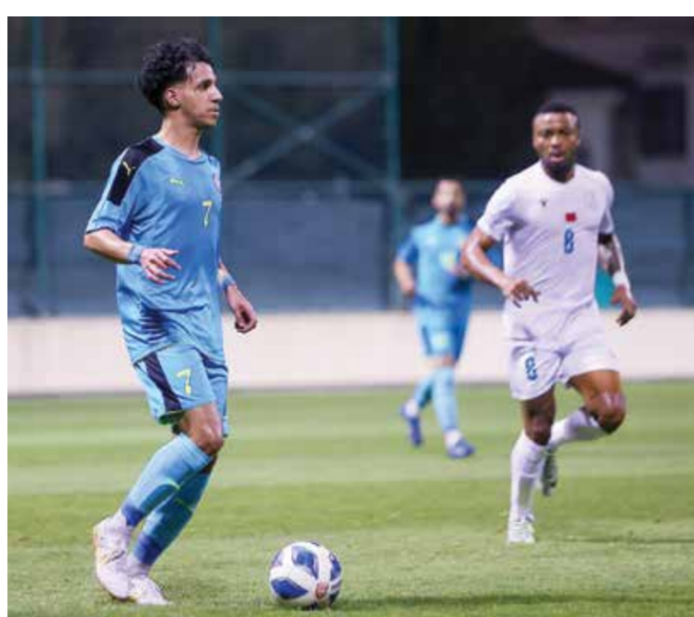
O لقاء عالي وأم الحصم