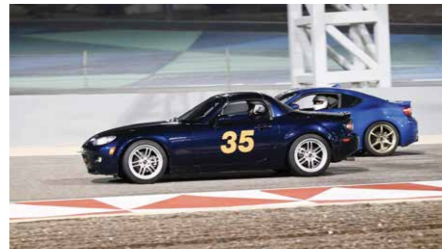
O من منافسات الجولة الماضية.