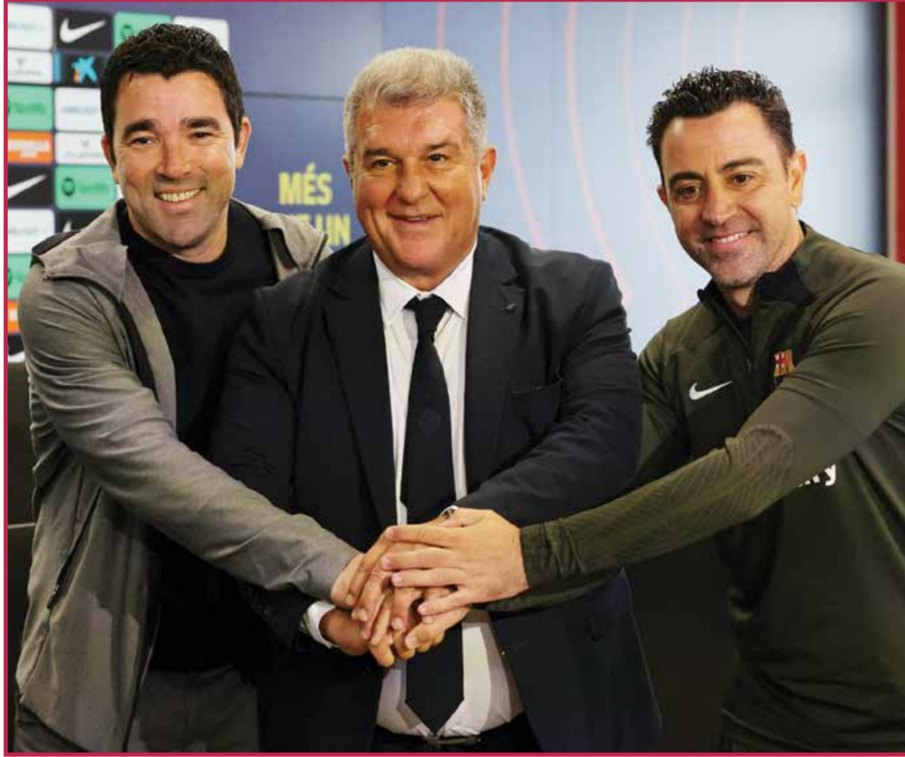
O تشافي مع لابورتا وديكو.

ولكنه، قال إن فريقه الذي يحتل المركز الثالث، «مازال يهدف لتحقيق هدف كبير في البوندسليجا، وهو التأهل لدوري أبطال أوروبا. إنهاء الموسم في أحد المراكز الأربعة الأولى من شأنه أن يضمن هذا، وإذا فاز شوتوجارت في ليفركوزن، وتغلب لايبزج، صاحب المركز الرابع، على بوروسيا دورتموند، صاحب المركز الخامس، سيبتعد شوتوجارت بفارق تسع نقاط كاملة عن دورتموند مع تبقي ثلاث جولات على نهاية الموسم. وقال هونيس: «يجب أن يكون من الواضح لنا أننا مستعدون للذهاب إلى أقصى حد. يجب أن يكون هذا الأمر واضحا للجميع.»