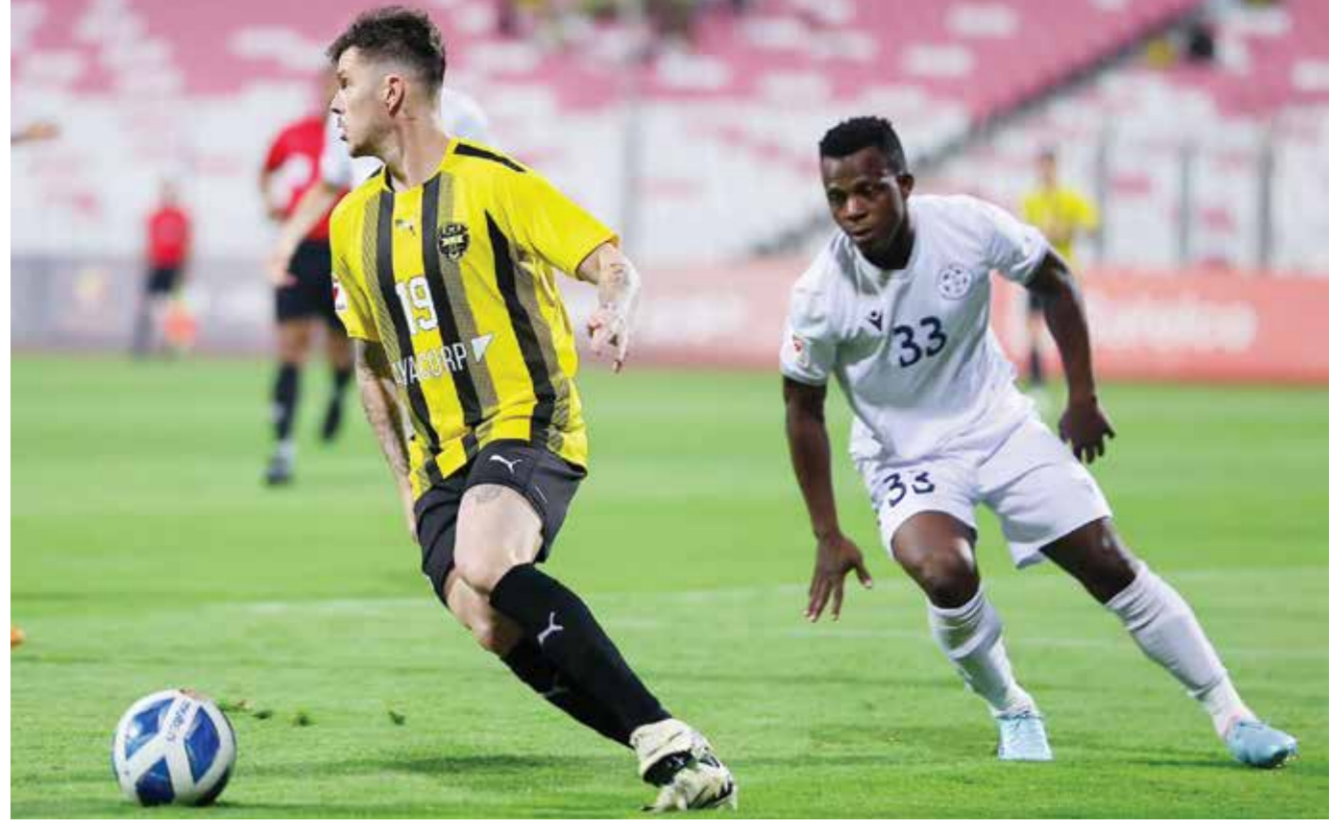
O مباراة الخالدية والنجمة.