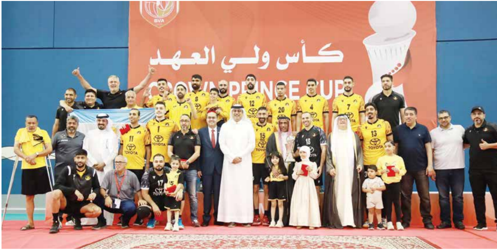
○ من تتويج الأهلي.