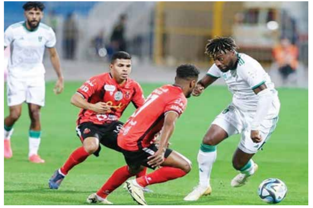
O من لقاء الرياض والأهلي

وأضاف، «لا نضع هذا الأمر في الاعتبار كثيراً. طموحنا احتلال أحد المراكز الأربعة الأولى، ولتحقيق ذلك يجب علينا إنهاء الموسم في المركز الرابع على الأقل».