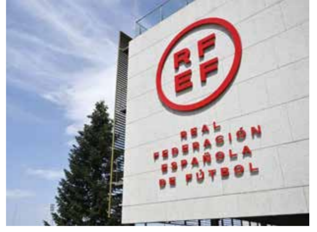
O الاتحاد الإسباني

وأعلن تشافي (٤٤ عاماً)، الذي شارك في أكثر من ٥٠٠ مباراة مع برشلونة خلال مسيرته الكروية داخل المستطيل الأخضر الحافلة بالألقاب، في يناير الماضي، أنه سيتخلى عن منصبه على رأس القيادة الفنية للفريق، مشيرا إلى أن فريقه بحاجة إلى «تغيير في الديناميكية».