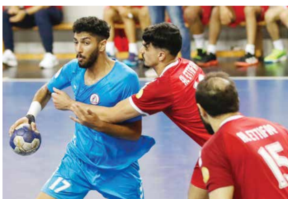
O جانب من لقاء الشباب والاتفاق

وتبدو الضغوط كبيرة على لاعبي المحرق وجهازي