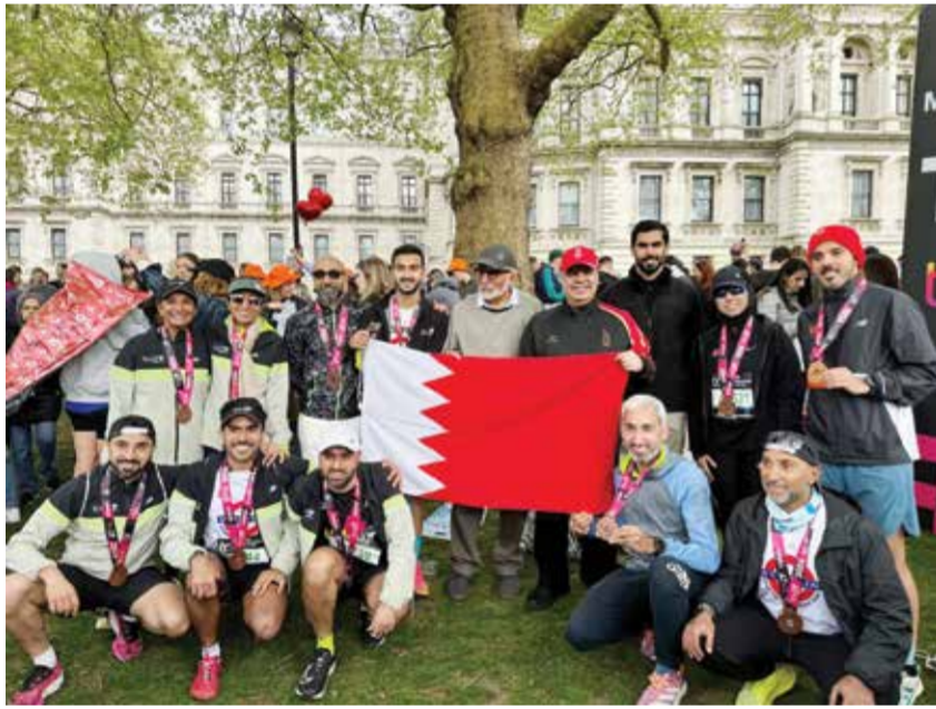
O من المشاركة البحرينية.