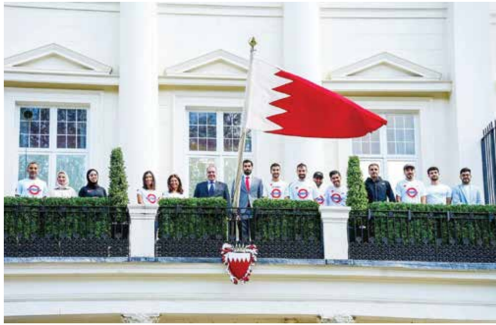
O المشاركون مع السفير.