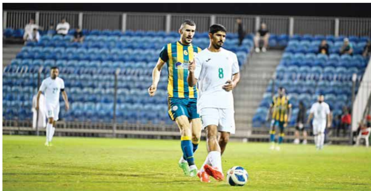
O لقاء المالكية واتحاد الريف

وتعثر عالي أمام أم الحصم بنتيجة الخسارة (١/٠)، ليتجمد رصيد عالي عند (٣٣ نقطة) ويتراجع للمركز الثاني وأم الحصم صار رصيده (١٨ نقطة). تمثر عالي أتى في مصلحة البحرين لانتزاع الصدارة من جهة، وايضاً لفريق المالكية