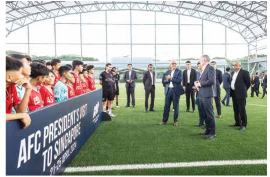
O جانب من زيارة الشيخ سلمان بن إبراهيم إلى سنغافورة