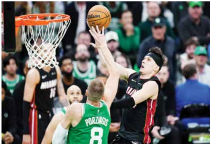
○ من لقاء هيت وستليكس. (رويترز)

لكن مفتاح الفوز لميامي كان من الرميات الثلاثية إذ سجل الفريق ٢٣ رمية من أصل ٤٣ مقارنة بـ ١٢ مسجلة من أصل ٣٢ لأصحاب الأرض، فسجل هيرو ٦ رميات وأضاف مارتن ٥. ويُعد فوز ميامي مفاجئاً خاصة أنه كان خسر بفارق ٢٠ نقطة في المباراة الأولى الأحد، لكن الخسارة حفزت الفريق للمباراة الثانية بحسب هيرو.