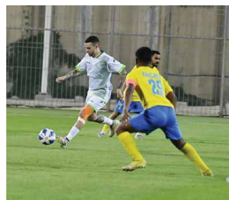
O لقاء البحرين وقلالي