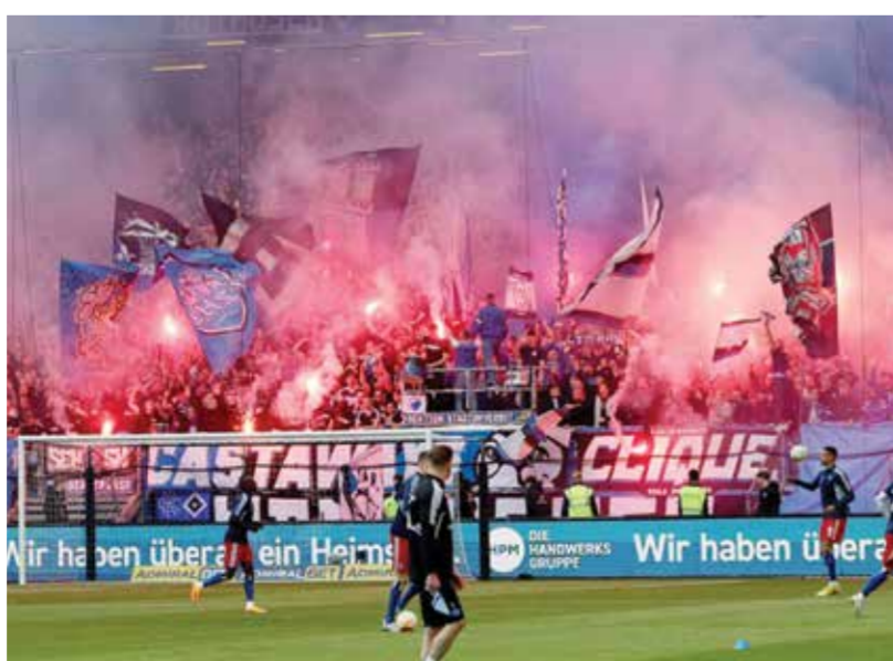
O من أعمال العنف في الملاعب الألمانية

وجرى إخطار المحكمة بأن هناك حاجة لما يصل إلى ٤٠٠ ضابط شرطة إضافي لحماية المباريات التي تتسم بمخاطر عالية، وبأنه يجب على المنظمين أيضاً المساهمة في التكاليف في دول أوروبية أخرى.