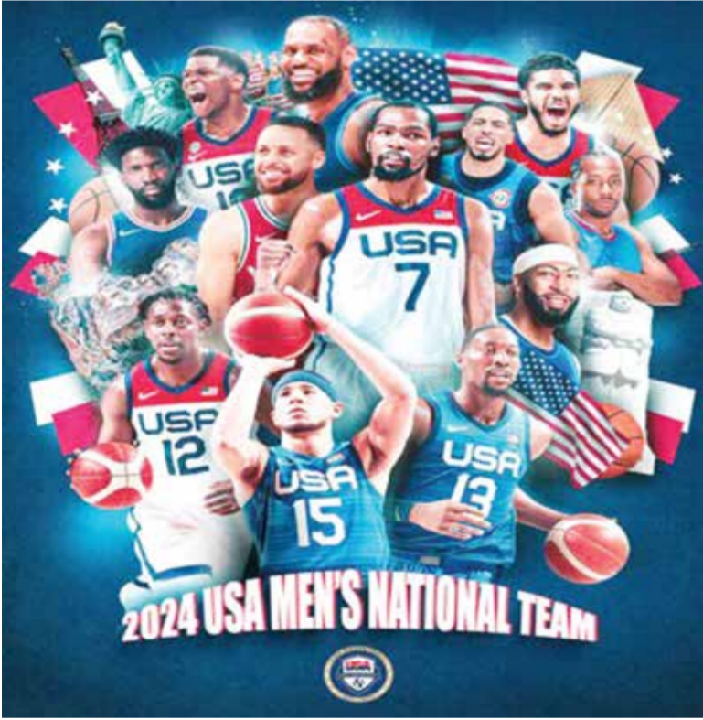
○ انطلاق مبيعات التذاكر في أبوظبي

استعدادات منتخبنا للمشاركة في دورة الألعاب الأولمبية، عقب الأصدقاء الإيجابية لتجربتنا الأولى في الإمارة خلال العام الماضي التي كانت مميزة للغاية. وملتقى منتخبنا صربي وأستراليا، المصنفين ضمن أفضل ٥ منتخبات وطنية، ما يمنحنا فرصة خوض لقاءات قوية تدعم جاهزيتنا للألعاب الأولمبية. ونتطلع إلى انطلاق المباريات صيف ٢٠٢٤».