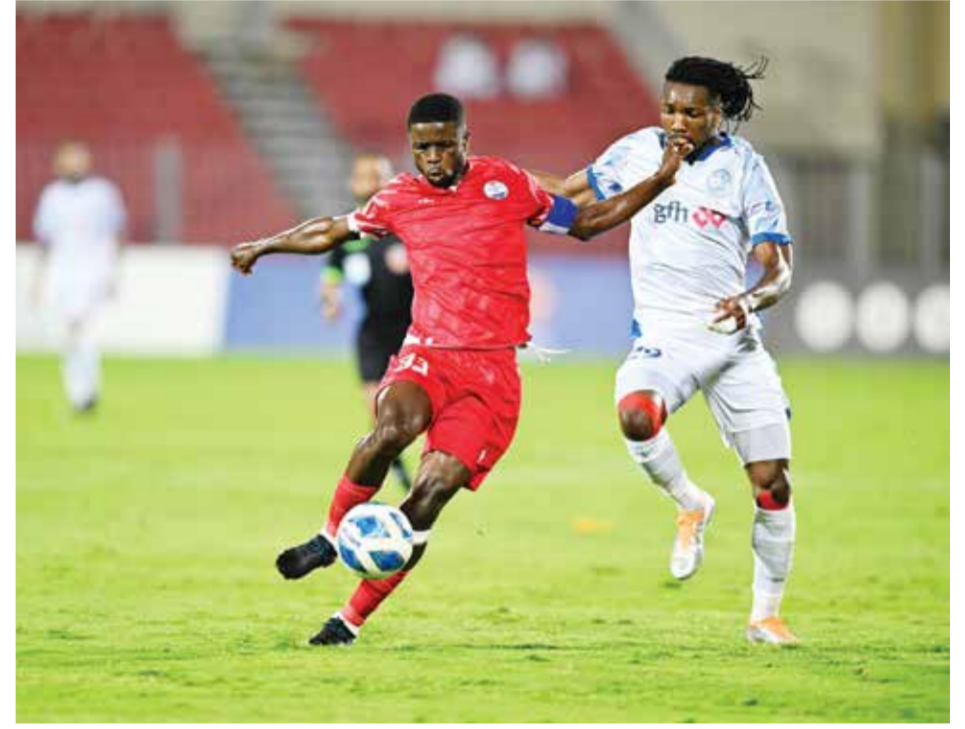
○ من منافسات دورينا