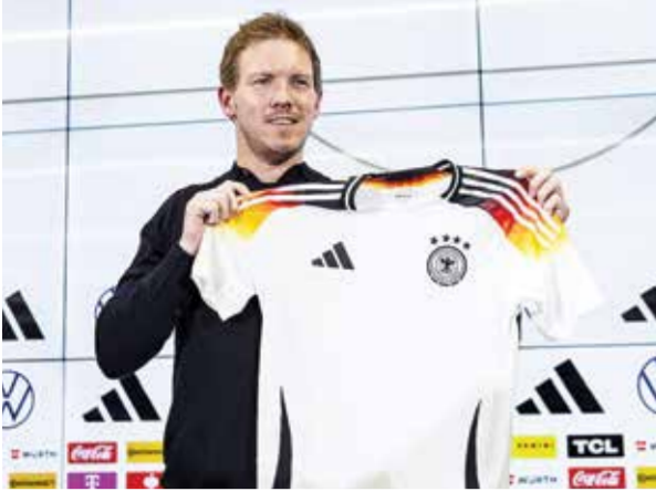
O ناغلسمان يطمح في التتويج