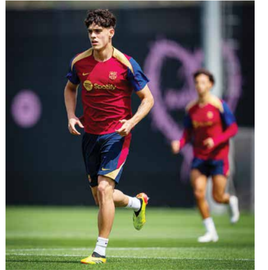
O من تدريبات برشلونة