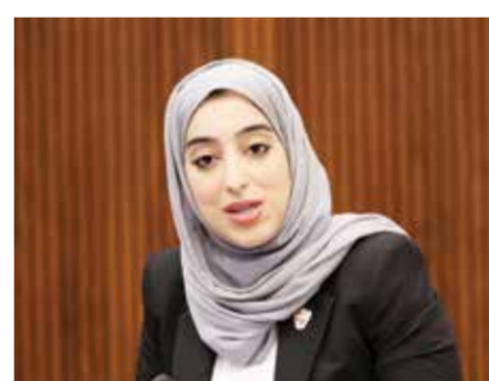
○ وزيرة السياحة.

استحدثت شواطئ جديدة بمرافق مختلفة ذات جودة عالية تسهم في تطوير تنوع المنتجات السياحية المقدمة. ونوهت الوزارة إلى أنه تم تحديد المنتجات المشتركة مع المملكة العربية السعودية الشقيقة وتنوع وتوحيد العروض السياحية المقدمة لشرائح جديدة في السوق السعودي. وذلك بعد أن وقعت مملكة البحرين مذكرة تفاهم مع المملكة العربية السعودية للترويج لكلا المملكتين كوجهة سياحية واحدة للشقيقتين.