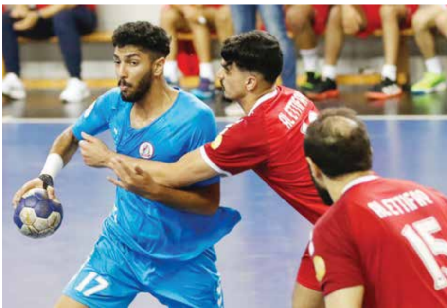
O جانب من لقاء الشباب والاتفاق

وتبدو الضغوط كبيرة على لاعبي المحرق وجهازي