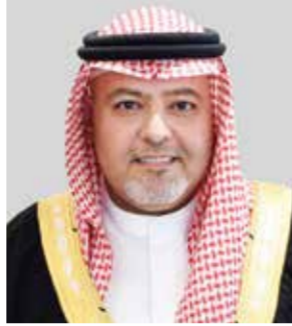
الشيخ خالد بن علي.

تعزيز الأمن والسلم الدوليين. وأضاف الدكتور الرميحي أن مشاركة الشيخ خالد بن علي آل خليفة ونبيل بن يعقوب الحمير، يمثل إضافة نوعية لما لهما من بصمات وحضور ملحوظ ومميز في مسيرة العمل الوطني خلال العهد الزاهر لجلالة الملك المعظم، وباعتبارهما مشاركين أساسيين في هذه المسيرة. واختتم رئيس مجلس أمناء معهد البحرين للتنمية السياسية بتأكيد أن الندوة ستسهم في توثيق مسيرة البناء والتنمية في وطننا الغالي، وتعريف الأجيال القادمة بعظم وأهمية هذه المرحلة من تاريخ الوطن، وذلك انطلاقاً من دور المعهد في تعزيز ونشر ثقافة الديمقراطية والعمل السياسي الوطني، وبما يتوافق مع مبادئ ومركزات ميثاق العمل الوطني ودستور مملكة البحرين.