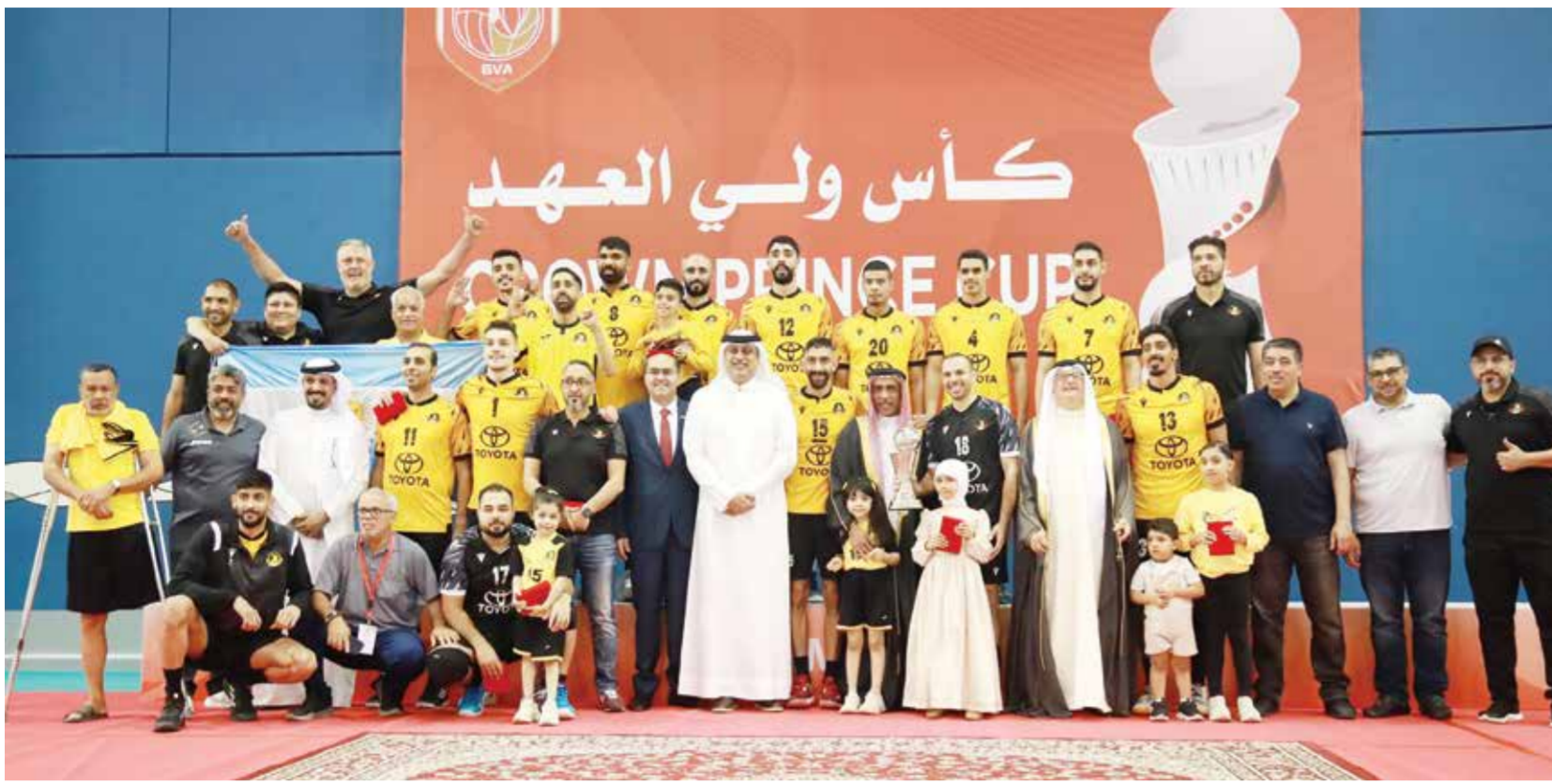
○ من تتويج الأهلي.