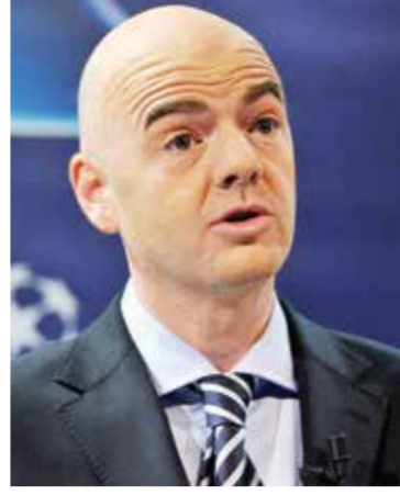
○ جياني إنفانتينو

والترجيح للتطوير على مستوى القواعد الشعبية، كما تنوي أرامكو العمل عن كثب مع فيفا في مجال الابتكار، وتحديد الفرص التي يمكن من خلالها توظيف خبرة الشركة وتقنياتها في تنظيم الضعافات الكروية حول العالم، ويشمل ذلك مبادرات تهدف إلى توفير سبل جديدة ومبتكرة يتفاعل من خلالها جمهور المستديرة الساحرة مع بطولات الاتحاد الدولي لكرة القدم.