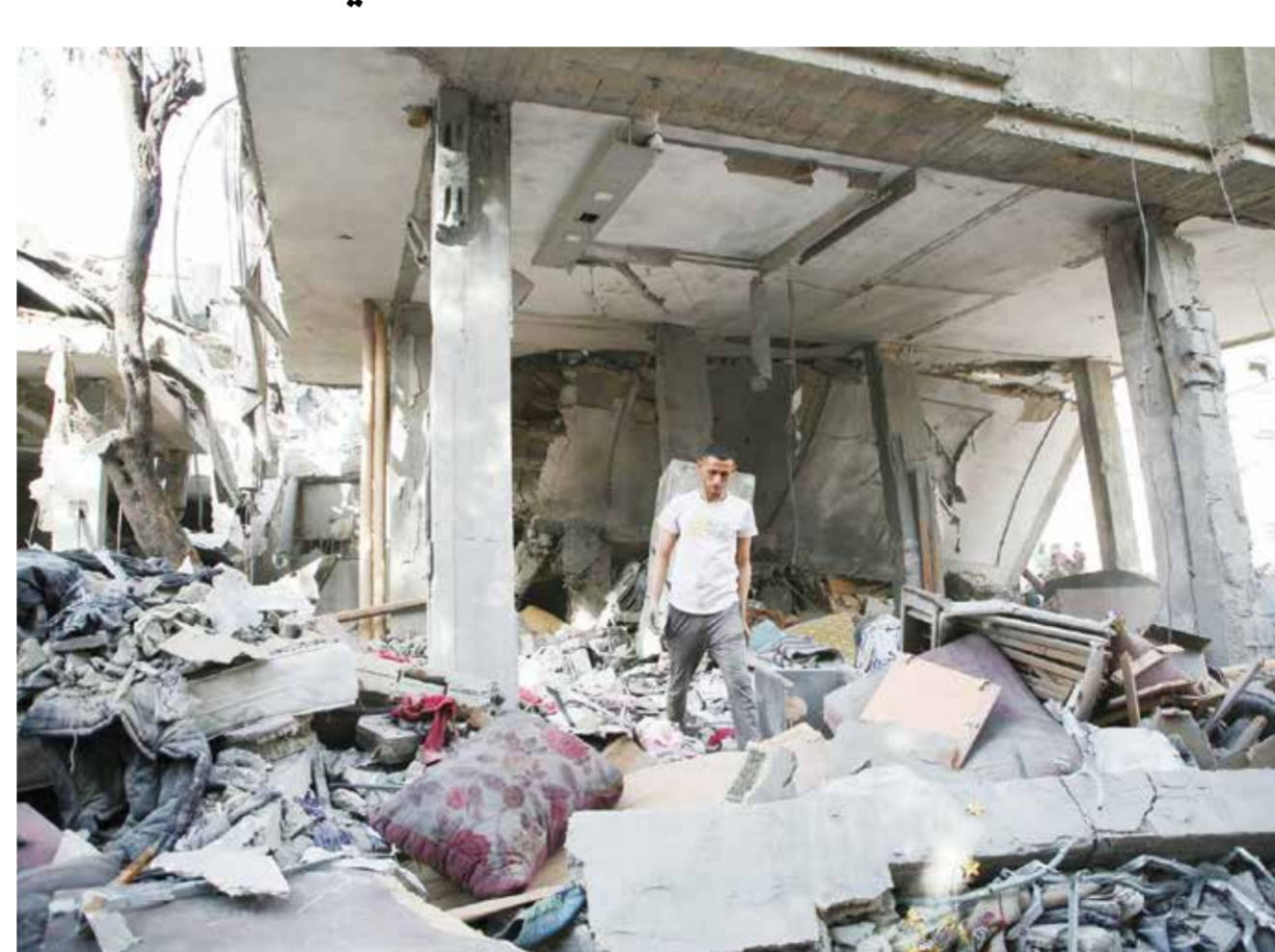
فلسطيني يبحث عن متعلقاته بعد أن قصف الاحتلال منزل عائلته في رفح.

ويوجد لجميع هذه الدول رعايا بين المحتجزين لدى حماس. والموقعون هم قادة الولايات المتحدة والأرجنتين والنمسا والبرازيل وبلغاريا وكندا وكولومبيا والدنمارك وفرنسا وألمانيا والمجر وبولندا والبرتغال ورومانيا وصربيا وإسبانيا وتايلاند وبريطانيا. وجاء في البيان: «نؤكد أن الاتفاق المطروح على الطاولة لإطلاق سراح الرهائن من شأنه أن يقضي إلى وقف فوري وطويل الأجل لإطلاق النار في غزة، وهو ما سيسهل زيادة في المساعدات الإنسانية الضرورية الإضافية التي سيتم توزيعها في أنحاء القطاع، ويقود إلى نهاية موثوقة للأعمال القتالية.» وأضاف: «سيتمكن سكان غزة من العودة إلى منازلهم وأراضيهم مع استعدادات مسبقة لضمان توافر المأوى والإمدادات الإنسانية.» وقال مسؤول أمريكي