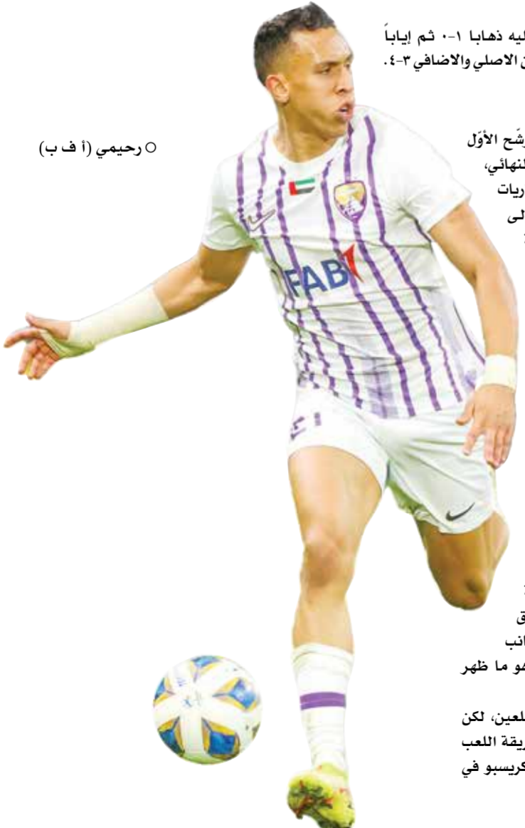
○ رحيمي (أ ف ب)

البرتغالي كريستيانو رونالدو، بعد فوزه عليه ذهاباً ١-٠ ثم إياباً بركلات الترجيح ١-٣ بعد خسارته في الوقتين الأصلي والإضافي ٣-٤.