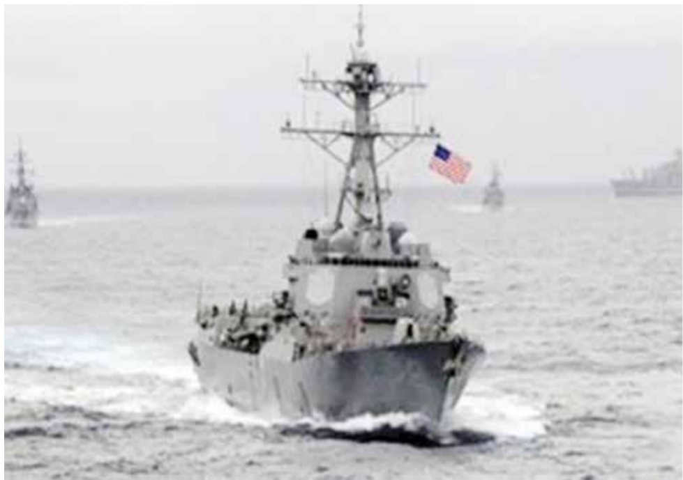
○ سفن حربية تابعة للبحرية الأمريكية.

من جهتها، قالت القيادة الوسطى الأمريكية «ستنكوم»، وقالت السلطات اليونانية قبل ظهر الأربعاء بتوقييت صنعا (٩٠٠٠، ت ج) نجحت سفينة حربية تابعة للتحالف