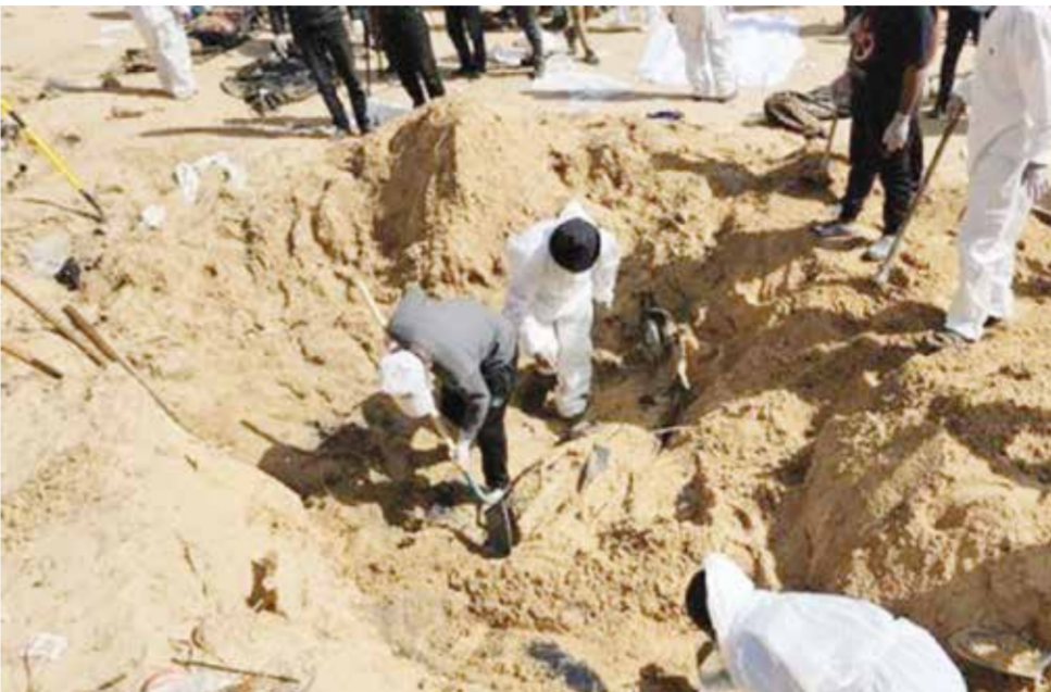
○ الدفاع المدني الفلسطيني: هناك حالات إعدام ميداني لبعض مرضى المستشفيات التي انسحب منها الاحتلال.

دبي - (رويترز): دعا فريق من الدفاع المدني الفلسطيني أمس الأمم المتحدة إلى التحقيق بشأن جرائم حرب في مستشفى بغزة، وقال إنه جرى انتشال نحو ٤٠٠ جثة من مقابر جماعية بعد انسحاب القوات الإسرائيلية من الموقع.