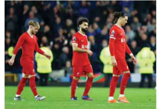
O انتقادات لصالح ونونيس

لقب البريميرليغ، مع خسارته أمام إيفرتون ٢ - ٠ في دربي ميرسيسايد الأربعة.