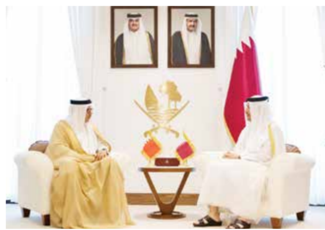
جانب من اجتماع رئيس وزراء قطر مع الزيناني.

استقبل الشيخ محمد بن عبدالرحمن آل ثاني رئيس الوزراء وزير خارجية دولة قطر الشقيقة، في الدوحة أمس، الدكتور عبداللطيف بن راشد الزيناني، وزير الخارجية، وذلك بمناسبة الزيارة التي يقوم بها وزير الخارجية لقطر ضمن جولة في الدول العربية الشقيقة. تم خلال الاجتماع، بحث العلاقات الأخوية الوطيدة التي تربط بين البلدين والشعبين الشقيقين، وسبل تعزيز التعاون الثنائي في مختلف المجالات لما من شأنه خدمة مصالح البلدين وأهدافهما المشتركة، ودفع جهود تعزيز التعاون والتكامل والترابط بين دول مجلس التعاون لدول الخليج العربية لما فيه الخير والنفع لدول المجلس ومواطنيها. وناقش الجانبان تطورات الأوضاع الإقليمية الراهنة، والحرب على قطاع غزة، والجهود الهادفة