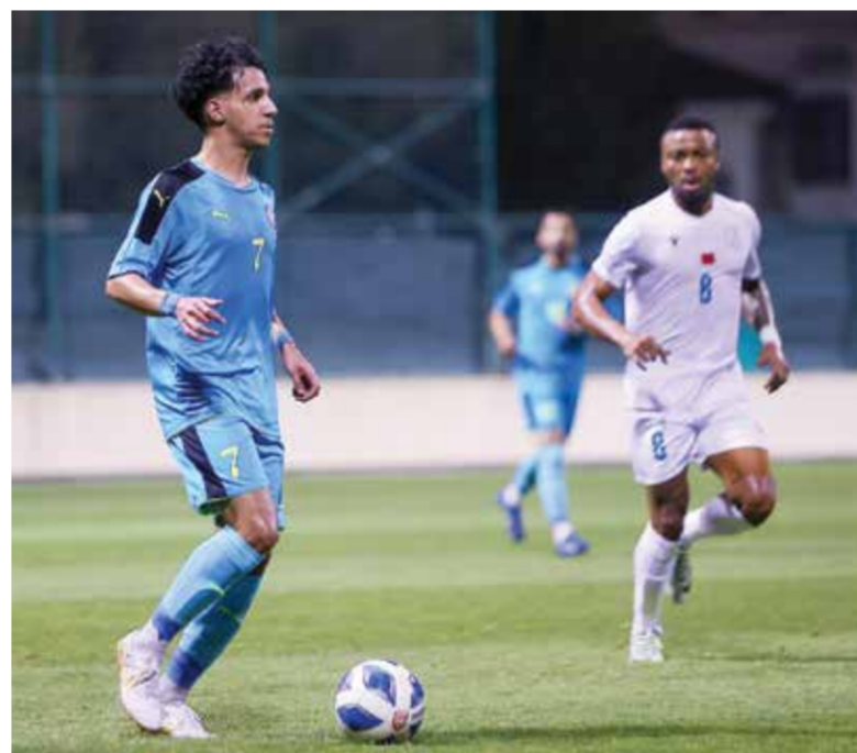
O لقاء عالي وأم الحصم