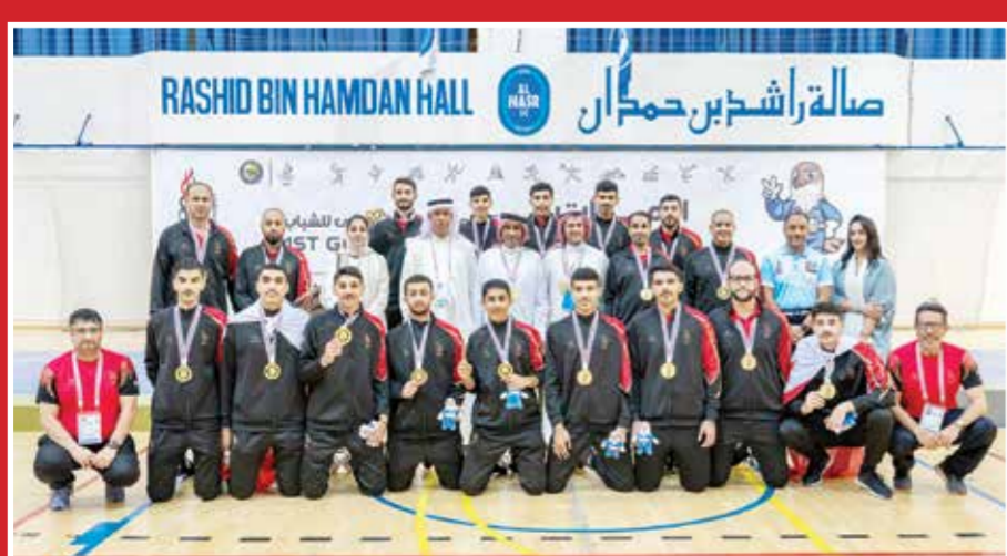
التفاصيل في الملحق الإلكتروني