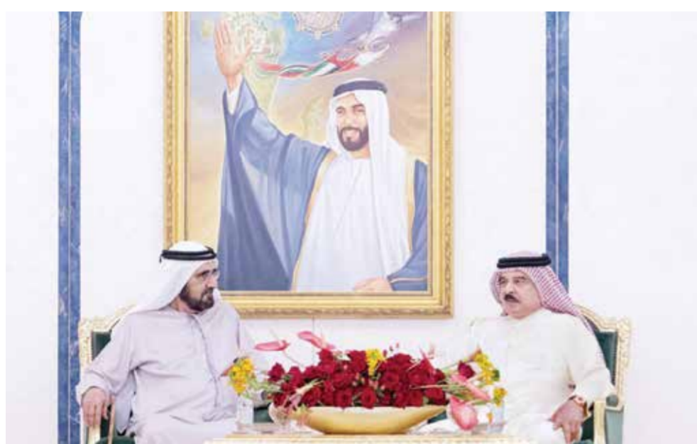
○ جانب من لقاء جلالة الملك المعظم مع نائب رئيس دولة الإمارات العربية المتحدة.

واحد بتهمة الاعتداء بسلاح قاتل. وشهدت جامعات أخرى احتجاجات مماثلة منها جامعة براون في مدينة بروفدينس وجامعة ميشيغان في مدينة آن آربر ومعهد ماساتشوستس للتكنولوجيا في كمبريدج وجامعة كاليفورنيا بوليتكنك في مدينة هومبولت. ويطالب المحتجون الجامعات بإنهاء التعاون مع