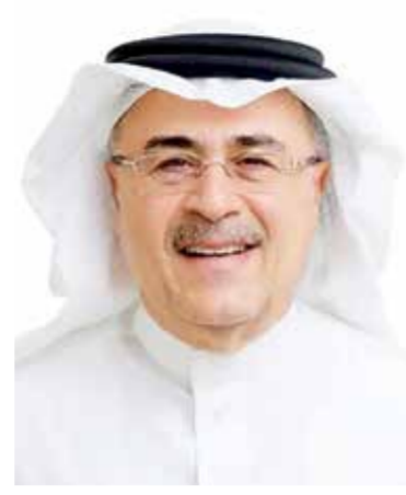
○ أمين الناصر