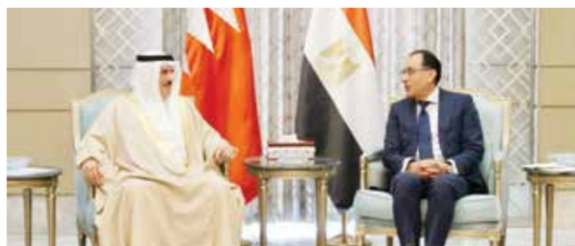
○ لقاء د. مصطفى مدبولي مع المسلم.

ولتعزيز التجربة السياحية الشاطئية قالت الوزارة إنه سيتم تطوير وزيادة عدد الشواطئ العامة والخاصة لتلبية متطلبات القادمين إلى مملكة البحرين لقضاء أفضل الأوقات، عبر