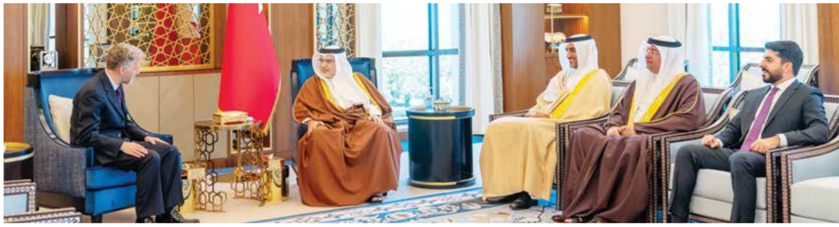
سمو نائب الملك ولي العهد خلال لقاء سفير المملكة المتحدة.