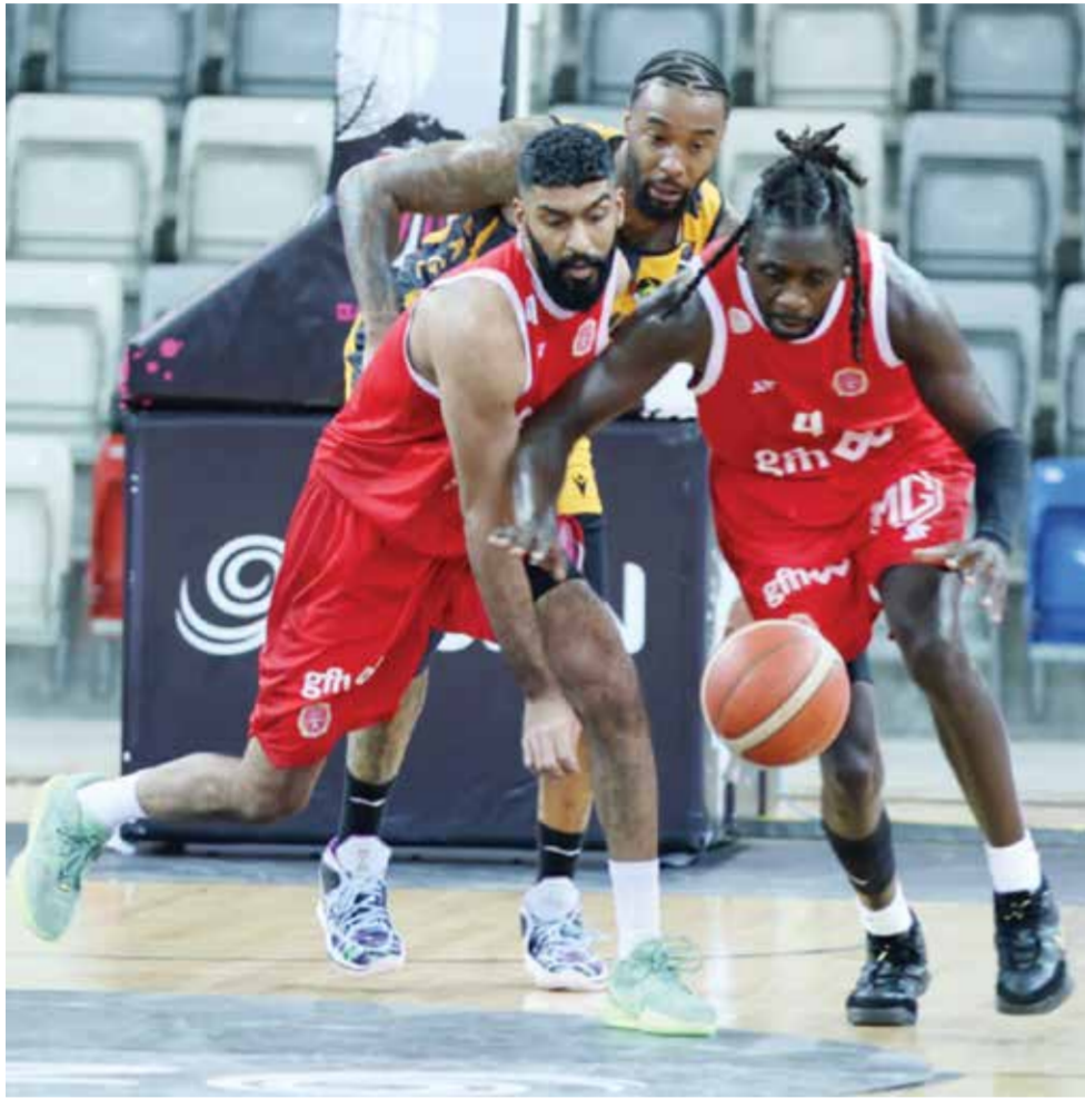
O من اللقاء الأخير بين الفريقين