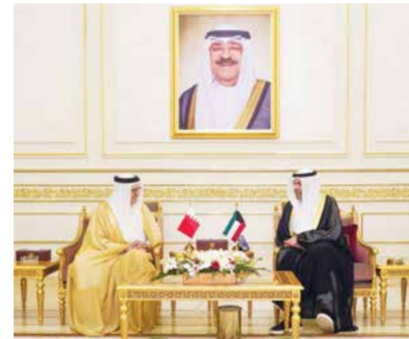
اجتماع وزير الخارجية مع نظيره الكويتي.

اجتمع الدكتور عبداللطيف بن راشد الزيناني وزير الخارجية، في مدينة الكويت، مع وزير خارجية دولة الكويت، الشقيقة، بمناسبة زيارته لدولة الكويت، ضمن جولة في عدد من الدول العربية. تم خلال الاجتماع، بحث العلاقات الأخوية التاريخية الوثيقة التي تجمع بين البلدين والشعبين الشقيقين، وأوجه التعاون الثنائي والارتقاء بها في مختلف المجالات، لما من شأنه خدمة مصالح البلدين وأهدافهما المشتركة، بالإضافة إلى مستجدات الحرب في قطاع غزة وتطورات الأوضاع الإقليمية وانعكاساتها على الأمن والاستقرار الإقليمي. كما استعرض الجانبان الاستعدادات والتحضيرات الجارية لعقد القمة العربية الثالثة والثلاثين في مملكة