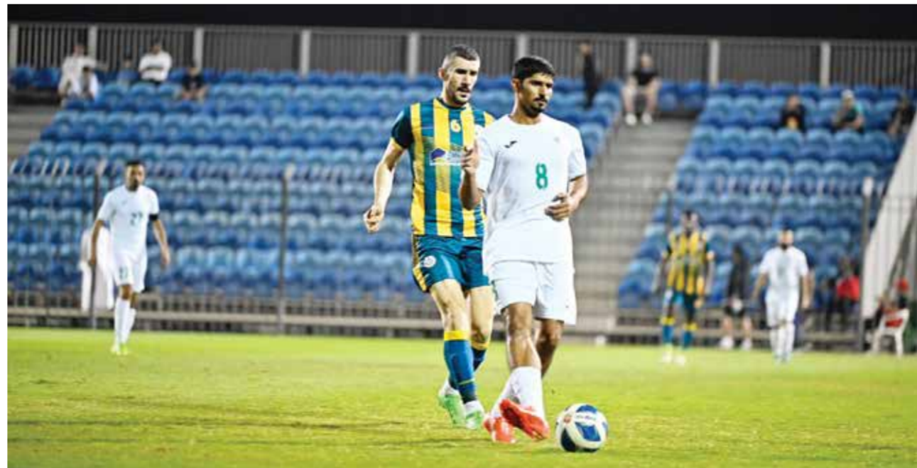
O لقاء المالكية واتحاد الريف

وتعثر عالي أمام أم الحصم بنتيجة الخسارة (١/٠)، ليتجمد رصيد عالي عند (٣٣ نقطة) ويتراجع للمركز الثاني وأم الحصم صار رصيده (١٨ نقطة). تمثر عالي أتى في مصلحة البحرين لانتزاع الصدارة من جهة، وايضاً لفريق المالكية