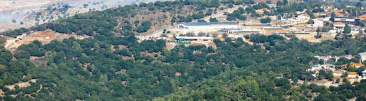
○ حزب الله وإسرائيل يتبادلان يوميا القصف.

وتعود آخر ضربة إسرائيلية على شرق البلاد إلى ١٤ أبريل، حين قصفت إسرائيل مبنى تابعاً لحزب الله في البقاع. ومنذ بدء التصعيد، قتل في لبنان ٣٨٠ شخصا على الأقل بينهم ٢٥٢ عنصراً في حزب الله و٧٢ مدنيا، وفق حصيلة أعدتها وكالة فرانس برس استنادا إلى بيانات الحزب ومصادر رسمية لبنانية. وأحصى الجانب الإسرائيلي من جهته مقتل ١١ عسكريا وثمانية مدنيين.