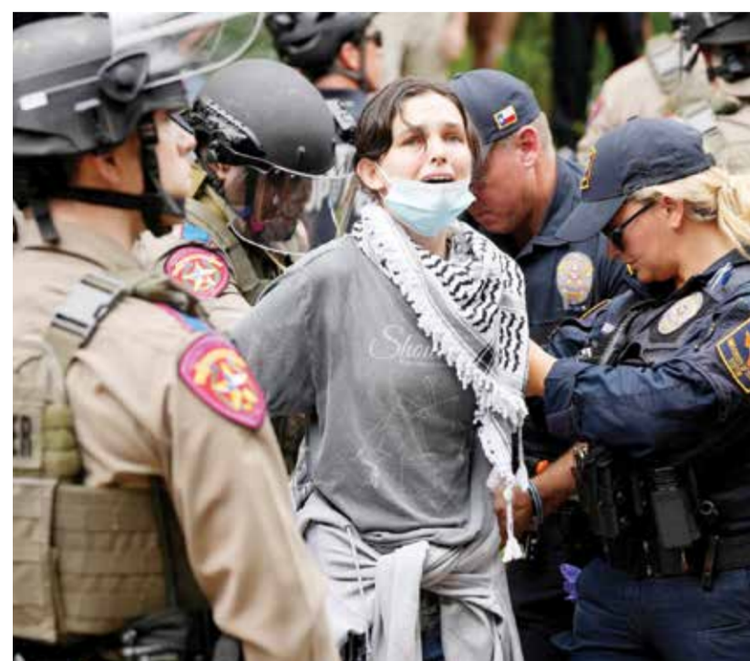
اعتقالات واسعة للمتظاهرين في الجامعات الأمريكية احتجاجا على العدوان الإسرائيلي.