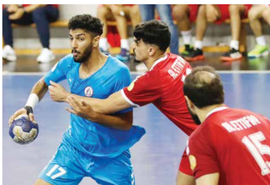
O جانب من لقاء الشباب والاتفاق

تتجه الأنظار اليوم الجمعة إلى صالة خليفة الرياضية بمدينة عيسى التي تحتضن المواجهة الفاصلة بين فريق الأهلي والمحرق في تمام الساعة الثامنة مساءً ضمن منافسات المربع الذهبي من دوري زين البحرين لكرة السلة للموسم الحالي ٢٠٢٣-٢٠٢٤. ولجأ الفريقان إلى المواجهة الفاصلة من أجل كسر التعادل وتحديد هوية الفريق المتأهل لمواجهة المنامة في نهائي دوري زين، وذلك بعد أن تبادل الفوز في الجولتين الأولى والثانية، حيث فاز المحرق في المواجهة الأولى بنتيجة ٨٢/٩٥، فيما نجح الأهلي في تحقيق الفوز بالمواجهة الثانية بنتيجة ٧٧/٩١، وبالتالي مواجهة اليوم لا تعويض بعدها، حيث سيتأهل الفائز إلى نهائي الدوري، فيما سيلعب الخاسر مباراة تحديد المركزين الثالث والرابع أمام فريق الاتحاد. ومن المؤكد أن تحظى المواجهة بحضور جماهيري غفير جداً من أنصار ومشجعي الفريقين لعدة أسباب، أولها أهمية المباراة، يضاف إلى ذلك شعبية الفريقين وامتلاكهما قواعد جماهيرية كبيرة،