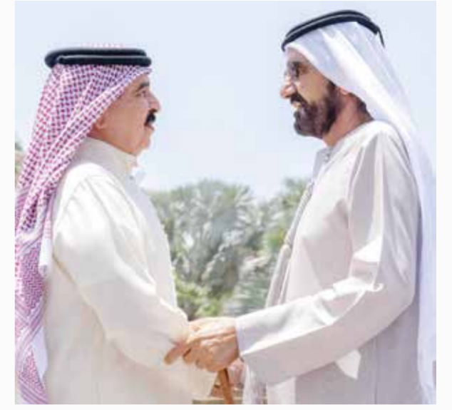
لقاء جلالة الملك المعظم مع سمو الشيخ محمد بن راشد آل مكتوم.