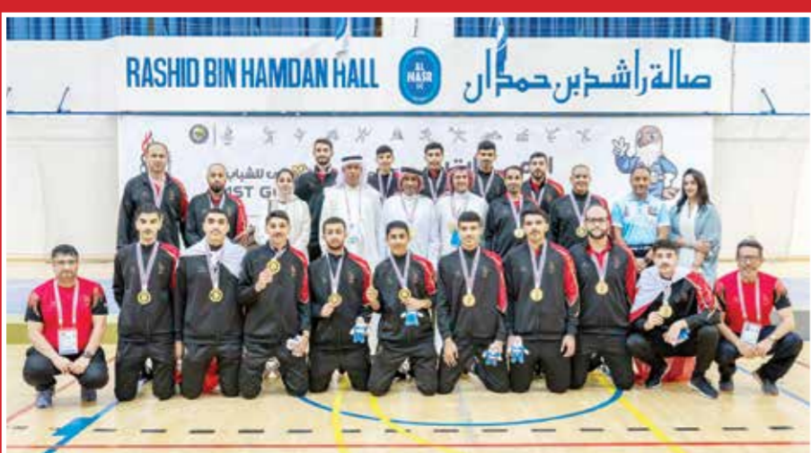
التفاصيل في الملحق الإلكتروني