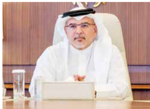
○ سمو نائب الملك ولي العهد يترأس اجتماع اللجنة التنسيقية.

ترأس صاحب السمو الملكي الأمير سلمان بن حمد آل خليفة نائب جلالته الملك ولي العهد اجتماع اللجنة التنسيقية ٤٨١، وأطلقت اللجنة على مستجدات تنفيذ استراتيجية قطاع السياحة (٢٠٢٢-٢٠٢٦) ضمن خطة التعافي الاقتصادي. كما تابعت مستجدات أطر المشاريع ذات الأولوية للجان الوزارية. واستعرضت اللجنة التنسيقية مستجدات مشروع تطوير الخدمات الحكومية. وناقشت آخر مستجدات تطوير عدد من الإجراءات التنظيمية المتصلة بممارسة الأنشطة التجارية. كما استعرضت مقترح تطوير تنظيم قطاع المعارض والمؤتمرات.