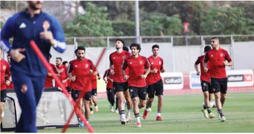
○ تدريبات الأهلي

الفوز لإسعاد الجماهير، ويعود إبراهيم بعدما غاب عن لقاء الذهاب، ليدعم تشكيلة المدرب السويسري مارسيل كولر الذي جهز قوته الضاربة لمواجهة مازيمبي، ولن يكون إبراهيم العائد الوحيد، إذ يمكن لكوثر الاعتماد أيضاً على الحارس المخضرم محمد الشناوي والمهاجم حسين الشحات ولاعب الوسط المالي أبو ديانغ وإمام عاشور بعد تعافيه من الإصابة.