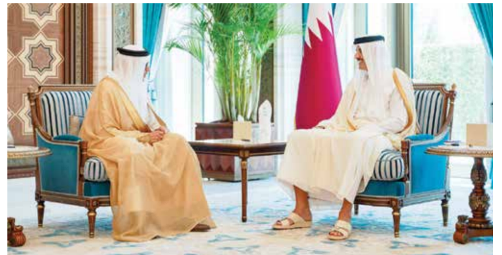
سمو أمير دولة قطر يستقبل د. عبداللطيف الزيناني.

بعث حضرة صاحب الجلالة الملك حمد بن عيسى آل خليفة ملك البلاد المعظم، برقية تهنئة إلى فخامة سامية صولحو حسنة رئيسة جمهورية تنزانيا الاتحادية بمناسبة ذكرى عيد الوحدة لبلادها. أعرب جلالته في البرقية عن أطيب تهنئه وتمنياته لخدماتها وموفور الصحة والسعادة ولشعب جمهورية تنزانيا الاتحادية الصديق تحقيق المزيد من التطور والازدهار.