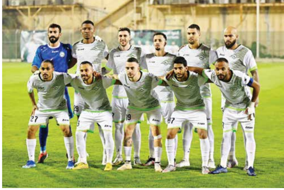
○ فريق البحرين لكرة القدم

الجدير بالذكر أن الشباب يوجد في صدارة الدوري برصيد ٢١ نقطة.