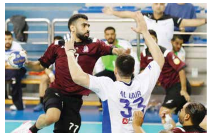
○ من لقاء سابق للشباب

وكان الشوط الأول قد انتهى بتعادل الفريقين بنتيجة (١٠/١٠)، إلا أن توبلي تمكن من الفوز في نهاية اللقاء بفارق