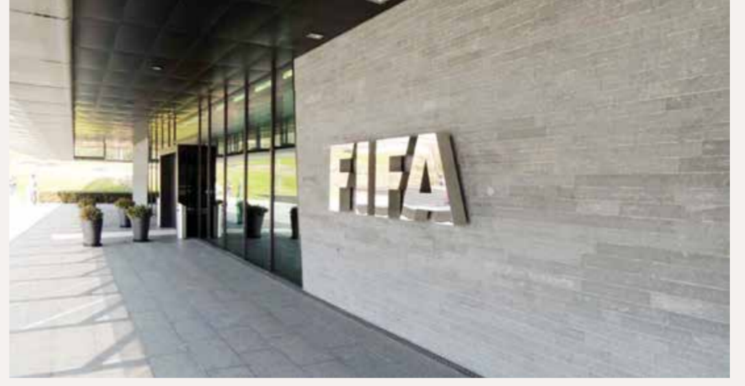
○ من مكاتب فيفا