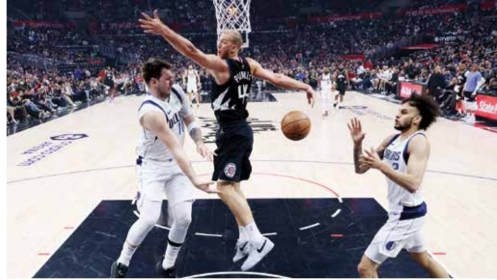
○ دونتشيتش يقود مافريكس إلى الفوز (أ ف ب)

مدريد - (أ ف ب) - استبعد الإيطالي يانك سينر فكرة أنه أفضل لاعب كرة مضرب في العالم راهناً، مفضلاً عدم مقارنته بمنافسيه الصربي نوفاك ديوكوفيتش والإسباني كارلوس ألكاراس. وبحال تتويجه بدورة مدريد للماسترز (١٠٠٠)، سيقرب المصنف ثانياً عالمياً من المتصدر ديوكوفيتش. يصل سينر بثقة مرتفعة، بعد حصده هذا الموسم ٢٥ فوزاً في ٢٧ مباراة. قال حامل لقب بطولة أستراليا الذي حقق بداية سنة رائعة حصد خلالها ثلاث دورات: «أعتقد أنه سؤال يصعب الإجابة عنه. ما زلت أعتقد أنه لا يجب أن أقرن نفسي مع نوفاك بعد كل الذي حققه. والأمر عينه ينطبق على كارلوس. كارلوس أيضاً فاز (باللقاب) أكثر مني». تابع ابن الثانية والعشرين الثلاثاء لمراسلين صحفيين: «أحترهما كثيراً. أحاول فقط أن ألعب بطريقتي، محاولاً فهم الأمور المناسبة لأسلوبي، ثم نرى ما يمكنني تحقيقه». لم يتجاوز سينر الدور الثالث في مباركتين على ملعب كاخا ماخيكا على أرض ترابية، ويتطلع هذه المرة إلى تغيير المعادلة. تابع اللاعب المولود في بلدة شمالية على الحدود الإيطالية-النمسية: «عانيت كثيراً في السنوات الماضية لإيجاد مستوي، لذا سيكون مثيراً للاهتمام أن أعرف كيف سألعب هذه السنة».