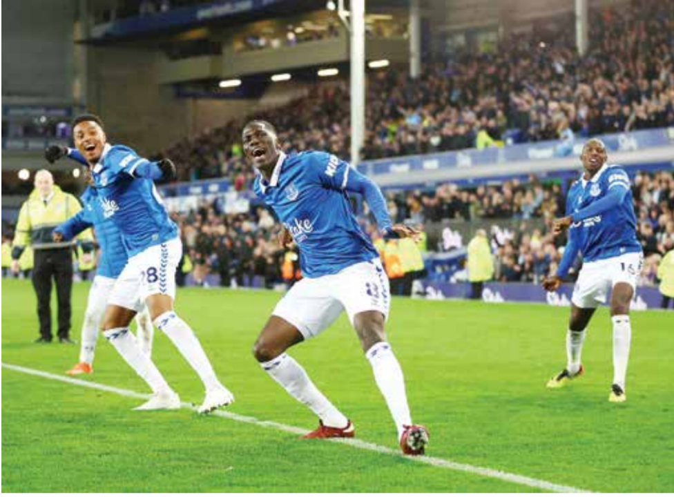
○ فرحة إيفرتون بتحقيق الفوز