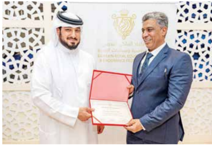
○ من تكريم المشاركين

وقد شهدت الدورة الجانبين النظري والعملي، بالإضافة إلى المسابقات الشخصية والامتحانات، حيث شهدت مشاركة ٢٢ دارساً على النحو الآتي: مملكة البحرين ٥ مشتركين، المملكة العربية السعودية ١٣ مشاركاً، دولة الإمارات العربية المتحدة ١ مشترك، دولة الكويت ٢ والمملكة الأردنية الهاشمية ١ مشترك.