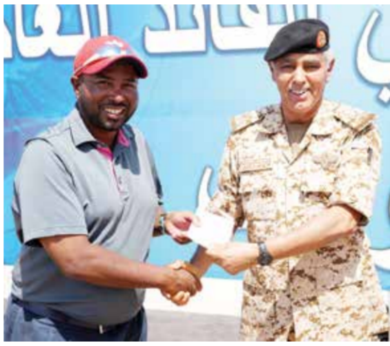
○ من تكريم المشاركين