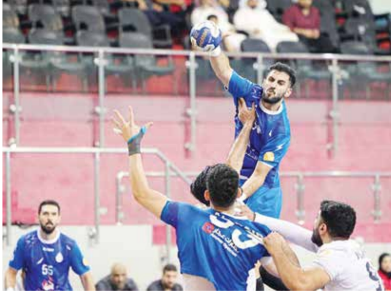
○ جانب من مباريات الدوري.

وأشاد سمو الشيخ عيسى بن عبدالله آل خليفة بتعاون الملاك مع القائمين على الدورة، وذلك لعدم التواني عن توفير جياهم للاستعانة بها خلال الجانب العملي من الدورة على مدى يومين، حيث ترك هذا التعاون انطباعاً رائعاً في نفوس