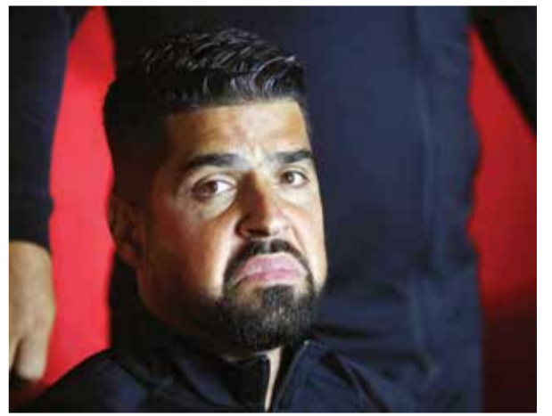
○ أمورييم (أ ف ب)

لندن - (أ ف ب): تلقى مانشستر سيتي ضربةً باستبعاد هدافه النرويجي إرلينغ هالاند عن مواجهة مضيئة برايتون اليوم الخميس في المرحلة التاسعة والعشرين المؤجلة من الدوري الإنجليزي لكرة القدم، بسبب الإصابة. وغاب هالاند (٢٣ عاماً) عن فوز فريقه على تشلسي ١-٠ السبت على ملعب ويمبلي في نصف نهائي الكأس بسبب إصابة عضلية تعرض لها خلال مواجهة ريال مدريد الإسباني في إياب ربع نهائي دوري أبطال أوروبا التي انتهت بفوز الأخير ٤-٣ بركلات الترجيح بعد التعادل ١-١ في الوقتين الأصلي والإضافي وتأهله. ويتصدر هالاند ترتيب هدافي الدوري مشاركة مع كول بالمر مهاجم تشلسي (٢٠ هدفاً). ويسعى مانشستر سيتي حامل اللقب إلى تقليص الفارق مع أرسنال المتصدر (٧٧ نقطة) إلى نقطة واحدة في حال فوزه على برايتون، علماً أنه لم يباراة ناقصة أيضاً. وأكد الإسباني بيب غوارديولا مدرب سيتي أن إصابة هالاند ليست خطيرة ويُمكن أن يعود قبل