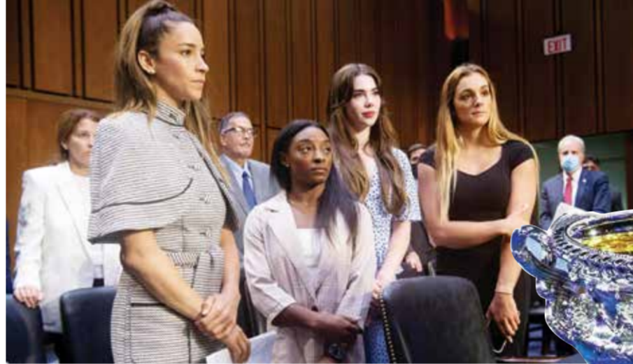
○ ضحايا الاعتداء في المحكمة - أرشيفية (رويترز)

لوس أنجلوس - (أ ف ب): سجل السلوفيني لوكا دونتشيتش ٣٢ نقطة وقاد دالاس مافريكس إلى معادلة سلسلته مع لوس أنجلوس كليبرز ١-١، بعد الفوز على ضيفه ٩٦-٩٣، الثلاثاء في الدور الأول من الأدوار الإقصائية لدوري كرة السلة الأمريكي للمحترفين (إن بي إيه). فيما قطع مينيسوتا تمبروولفز خطوة نحو نصف نهائي المنطقة الغربية. وإلى دونتشيتش الذي مرز أيضاً ٩ كرات حاسمة، سجل الموزع كايري إرفينغ ٢٣ نقطة، ليعود مافريكس بموقف جيد إلى تكساس حيث سيخوض المباراتين الثالثة والرابعة. وشكل دونتشيتش وإرفينغ ثنائياً رائعاً في الربع الأخير، حيث ساهما بتسجيل ١٤ نقطة متتالية وضعت المباراة بعيداً عن متناول كليبرز الذي عاد إلى صفوفه كواهي لينارد (١٥ نقطة) بعد تعافيه من الإصابة. ويعد فوزه في مباراة الأحد على أرضه ١٠٩-٩٧، بدا كليبرز الذي تخلف طوال المباراة أمام