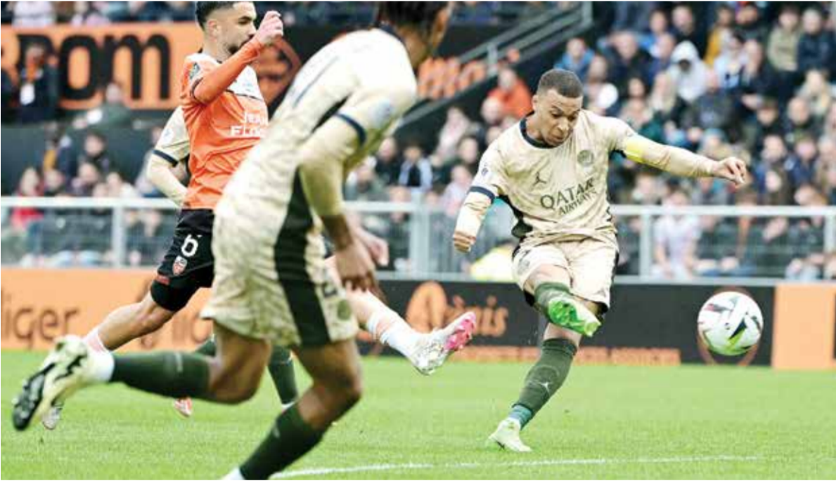
○ من لقاء باريس سان جيرمان و لوريان

باريس - (د ب أ) : تأجل تتويج باريس سان جيرمان بلقب الدوري الفرنسي ، بفوز موناكو على ضيفه ليل بنتيجة ١/صفر أمس الأربعاء في مباراة مؤجلة من الجولة ٢٩ للمسابقة. وسجل يوسف هوفانا هدف المباراة الوحيد للفريق الإيمارة في الدقيقة ٦١. ورفع موناكو رصيده إلى ٥٨ نقطة في المركز الثاني خلف باريس سان جيرمان الذي جمعته ٦٩ نقطة بعد فوزه على لوريان بنتيجة ١/٤ في وقت سابق أمس الأربعاء.