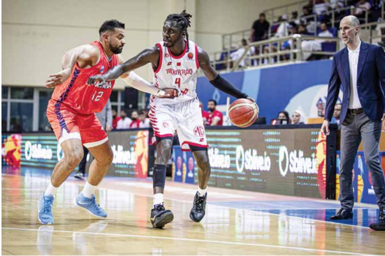
○ من لقاء المحرق وكاظمة