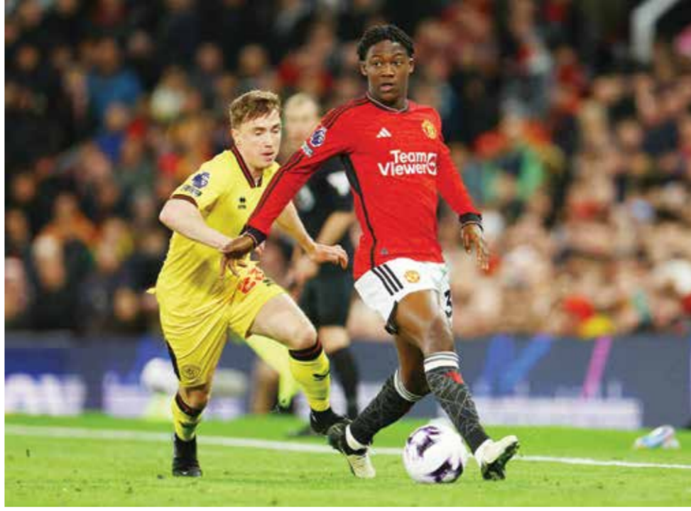
○ من لقاء مانشستر يونايتد و شيفيلد يونايتد