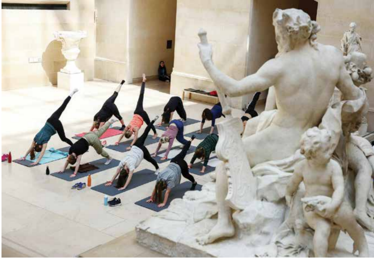
○ تمارين اليوغا في اللوفر.

وقد يواجه ليفربول منافسةً من بايرن ميونخ الألماني وبرشلونة الإسباني اللذين يبحثان بدورها عن مدربين جديدين، مع رحيل توماس توخل عن الأول وتشافي هيرنانديس عن الثاني. وكان شابي ألونسو الذي قاد باير ليفركوزن إلى لقب الدوري الألماني للمرة الأولى في تاريخ النادي، المرشح الأول لخلافة كلوب الذي أعلن أنه سيرحل عن النادي في نهاية الموسم قبل نحو أربعة أشهر، لكنّ الإسباني مدد عقده حتى ٢٠٢٦. وتضمّ لائحة المرشحين البرتغالي روبن أمورييم مدرب سبورتنينغ، في حين أشارت وسائل إعلام أنه تواصل مع وست هام الاثنين لخلافة الاسكتلندي ديفيد موييس.