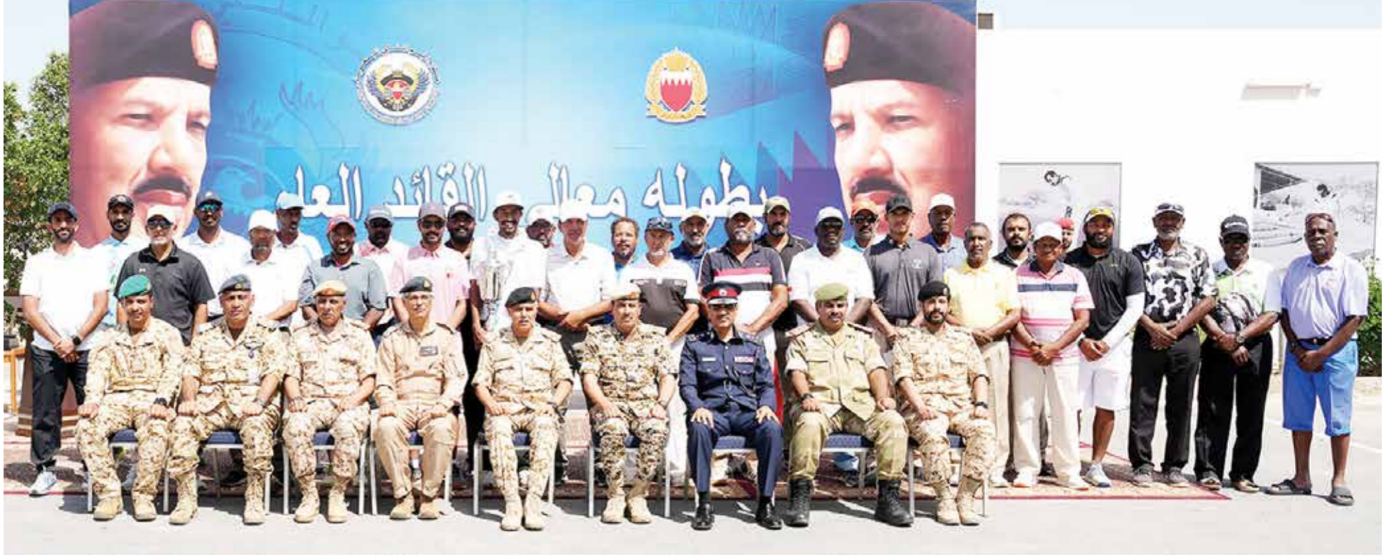
○ صورة جماعية للمشاركين في البطولة

وكان كاكاروتو قد حقق نتائج إيجابية خلال الفترة التي أمضاها في قيادة طائرة دار كليب كان آخرها محافظة الفريق على لقب دوري عيسى بن راشد للموسم الرياضي ٢٠٢٣-٢٠٢٤. وكشف كاكاروتو من جانب آخر أنه خلال الفترة القليلة القادمة ستكون له مهمة مع منتخب بلاده الذي سيلعب منافسات كأس العالم، إذ سيكون كاكاروتو ضمن الطاقم التدريبي للمنتخب.