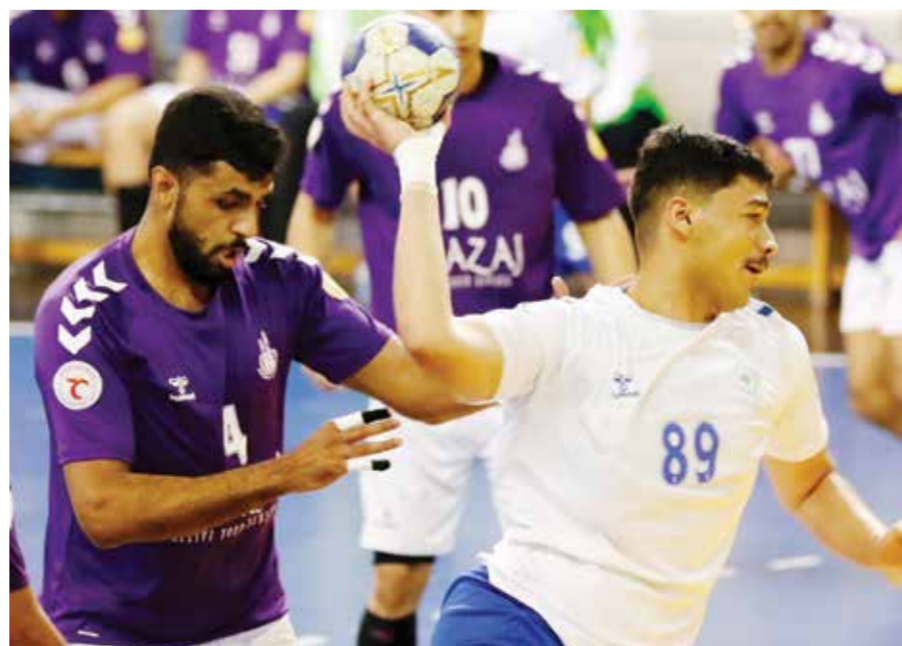
○ من لقاء توبلي والاتحاد

يد الدير تعبر البحرين بنجاح وفي مباراة أخرى عبر فريق الدير نظيره البحرين بعد