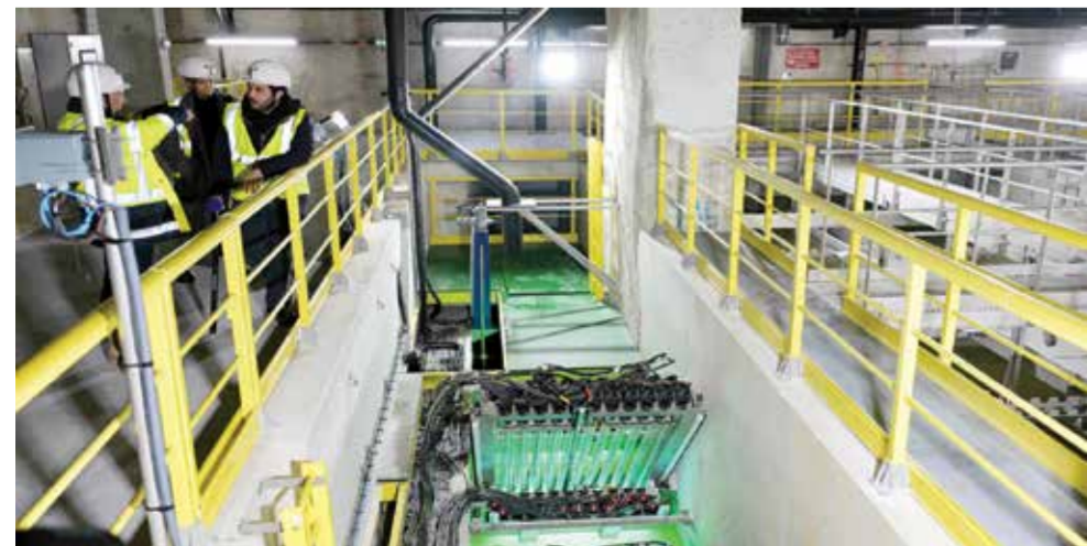
○ محطة معالجة مياه نهر السين. (أ ف ب)

باريس - (أ ف ب) - يواجه منظمو دورة الألعاب الأولمبية والبارالمبية في باريس تحدياً وقلقاً كبيرين، بشأن التزامهم بإجراء منافسات السباحة في المياه المفتوحة في نهر السين الخلاب لكن الملوث تاريخياً. في أغسطس الماضي، ألغيت اختبارات ماراثون السباحة لأن المياه كانت متسخة للغاية، وكذلك مراحل السباحة في يومين من الأيام الأربعة لاختبارات الترياتلون والباراتريثلون. في المقابل، أصرت مدينة باريس على أنه «لا توجد خطة بديلة». ستبدأ منافسات الرجال والسيدات التي يبلغ طولها ١٠ كيلومترات على جسر الكسندر الثالث