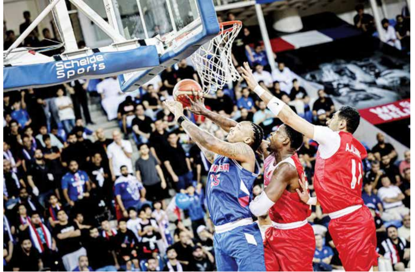
○ من لقاء المنامة والكويت