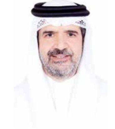
○ الشيخ عبدالعزيز بن مبارك آل خليفة

في هذه البطولة العالمية، مؤكداً سعادته أن البحرين ستقدم أجواء مثالية للمشاركين والجمهور من حيث التنظيم والضيافة.