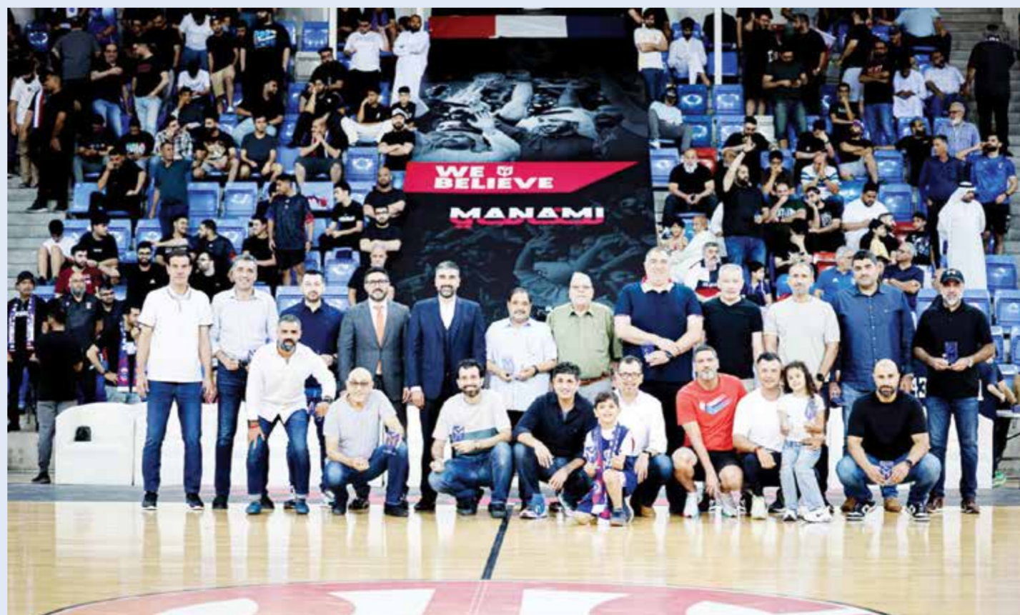
○ صورة جماعية للمكرمين