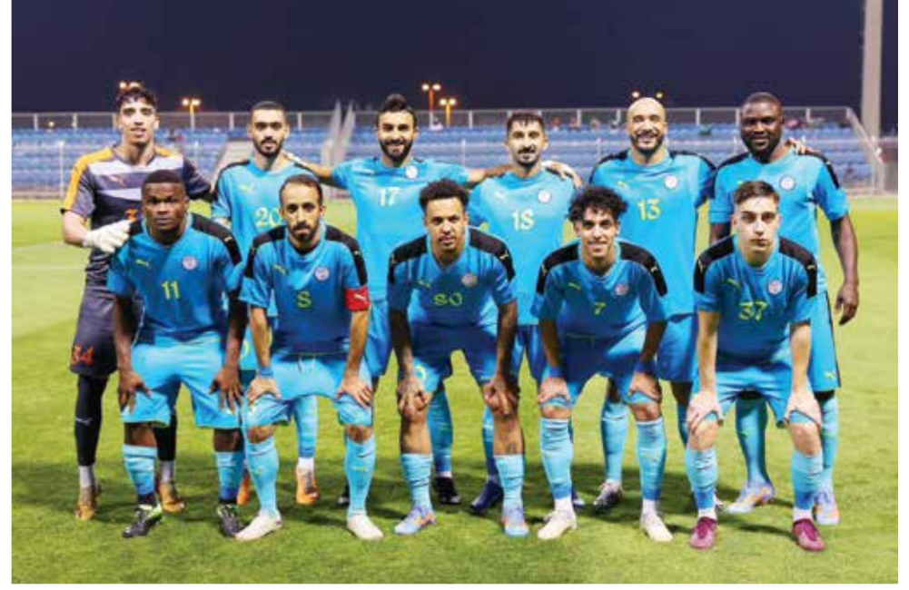
○ فريق عالي لكرة القدم