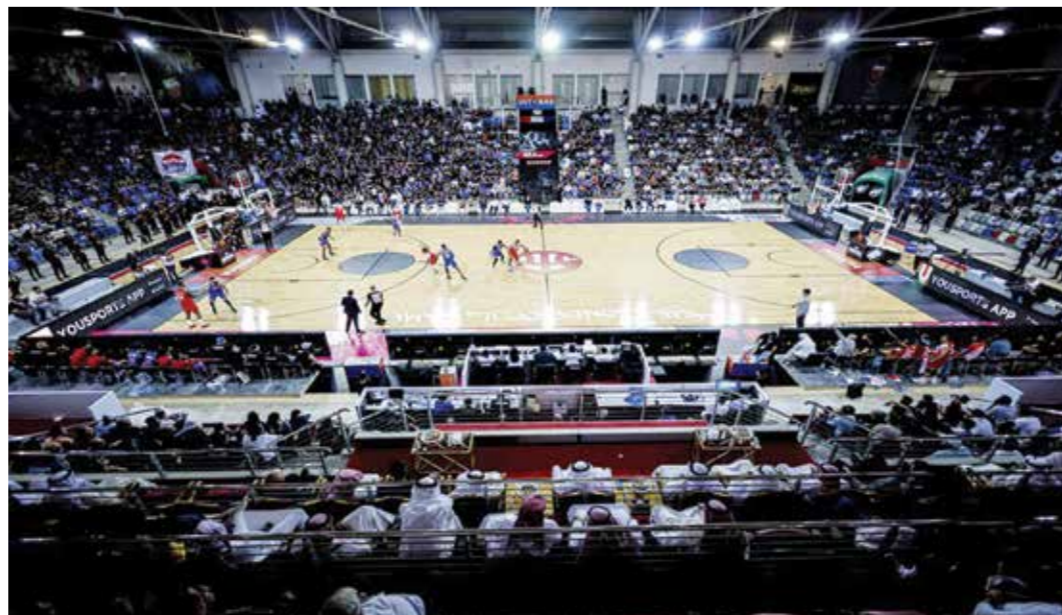
○ الحضور الجماهيري في النهائي