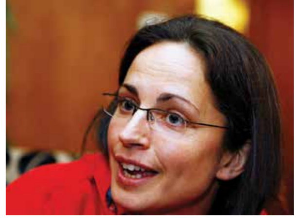
○ سو داي.