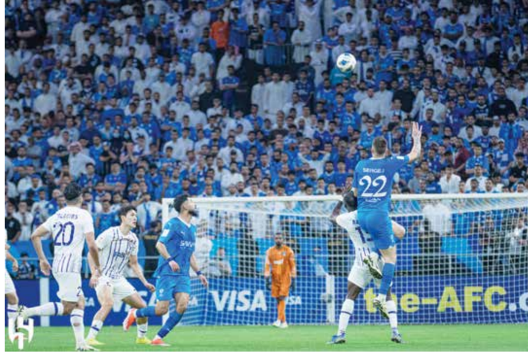
○ من لقاء الهلال والعين

الهلال والذي فقد لقبه رسمياً، لرد اعتباره لخسارته ذهاباً أمام الشباب ١-٠، فيما يطعم الشباب الحادي عشر في تحسين ترتيبه. ويعقب عن الشباب لاعب وسطه الكولومبي غوستافو كويرار إثر تعرضه لتمزق في العضلة الخلفية، في حين سيخضع الكرواتي إيفان راكيتيتش لاختبارات لياقية من أجل تحديد مصيره من المشاركة. على الجانب الآخر يبتعد عن تشكيلة الاتحاد لاعب