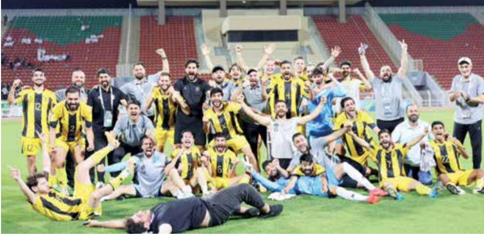
○ فرحة التأهل للنهائي

ويُميّن العهد نفسه بنيل اللقب الثاني أملاً في منح الدوري اللبناني نقاطاً إضافية في التصنيف القاري، حيث ستشهد مسابقات الاتحاد الآسيوي تغييراً جذرياً في الموسم المقبل باعتماد ثلاث بطولات للأندية: دوري أبطال آسيا للدرجة، دوري أبطال آسيا ٢، وكأس الاتحاد الآسيوي. ويأتي تأهل «الأصفر» في ظل الظروف الصعبة للكرة اللبنانية، إذ اضطر الفريق إلى اللعب بعيداً عن أرضه وجمهوره لعدم وجود ملعب في لبنان مطابق للمواصفات المطلوبة من الاتحادين الآسيوي والدولي، شأنه شأن الممثل الثاني للبلاد في المسابقة القارية، النجمة الذي خرج من دور المجموعات، ومنتخب لبنان في التصفيات المزجوجة المؤهلة لكأس العالم ٢٠٢٢ وكأس آسيا ٢٠٢٧.