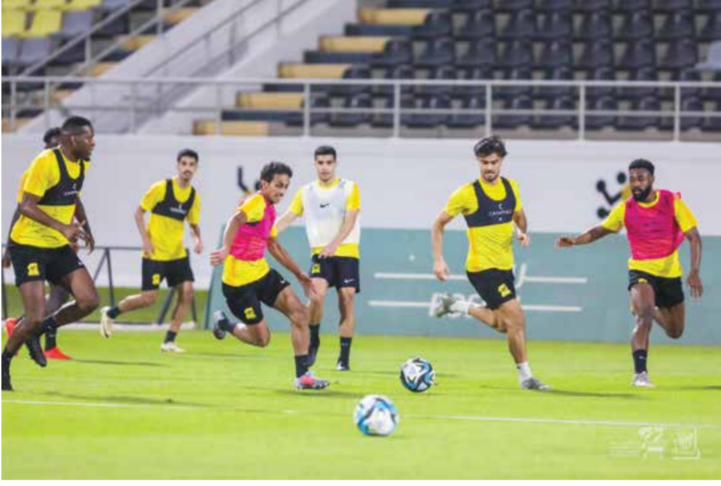
○ من تدريبات الاتحاد

الوسط البرازيلي فابينييو، بسبب إصابة في الفخذ امتدت إلى وتر داخل النسيج العضلي. ويحظى مدرب الشباب البرتغالي فيكتور بيريرا بسجل باهر ضد الاتحاد، حيث لم يخسر أمامهم خلال ٤ مواجهات. ويتطلع الأهلي، الثالث بفارق نقطتين عن الاتحاد، إلى حصد النقاط أمام ضيفه الرياض اليوم الخميس، عوضاً تعادله الأخير أمام الوحدة ١-١.