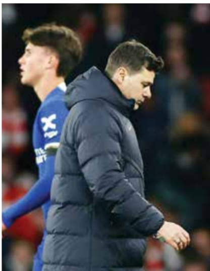
○ بوكيتينو المحبط

بسبب أدائنا، لكنني لن أقول شيئاً غير عادل لوصف فريقنا ولاعبينا وتشكيلتنا». ويحل تشيلسي ضيفاً على أستون فيلا صاحب المركز الرابع يوم السبت قبل أن يستضيف توتنهام هوتسبير صاحب المركز الخامس في الثاني من مايو.