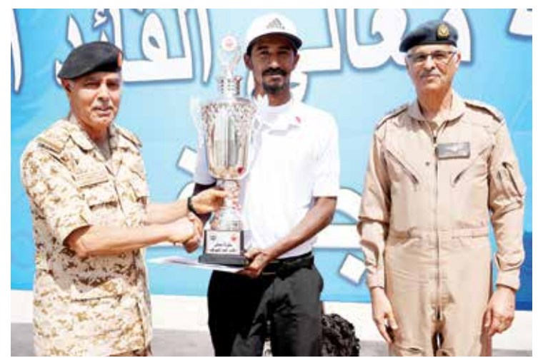
○ تتويج المرسي

خلال مجريات البطولة، التي شارك فيها ٦٦ لاعباً من منتسبي قوة دفاع البحرين ووزارة الداخلية والحرس الوطني، متمنياً لكل المشاركين التوفيق في البطولات القادمة. حضر ختام البطولة عدد من كبار ضباط قوة دفاع البحرين، ووزارة الداخلية، والحرس الوطني.