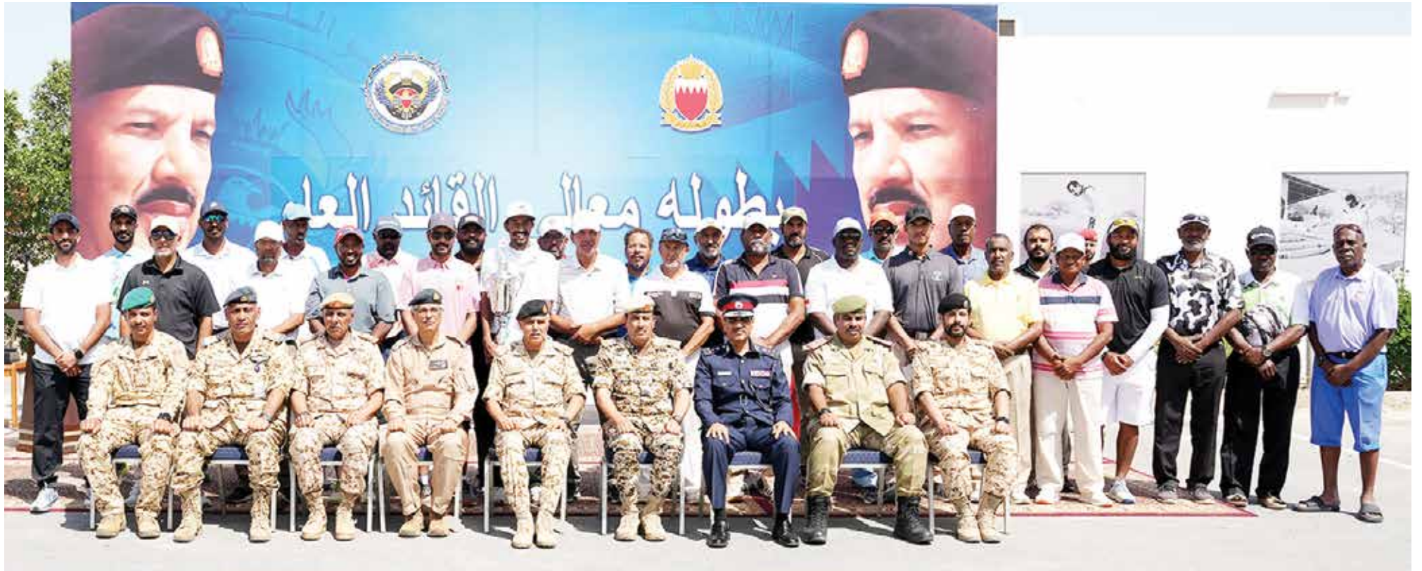
○ صورة جماعية للمشاركين في البطولة

وكان كاكاروتو قد حقق نتائج إيجابية خلال الفترة التي أمضاها في قيادة طائرة دار كليب كان آخرها محافظة الفريق على لقب دوري عيسى بن راشد للموسم الرياضي ٢٠٢٣-٢٠٢٤. وكشف كاكاروتو من جانب آخر أنه خلال الفترة القليلة القادمة ستكون له مهمة مع منتخب بلاده الذي سيلعب منافسات كأس العالم، إذ سيكون كاكاروتو ضمن الطاقم التدريبي للمنتخب.