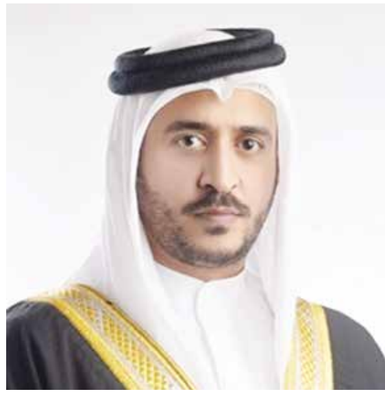
سمو الشيخ خالد بن حمد آل خليفة.