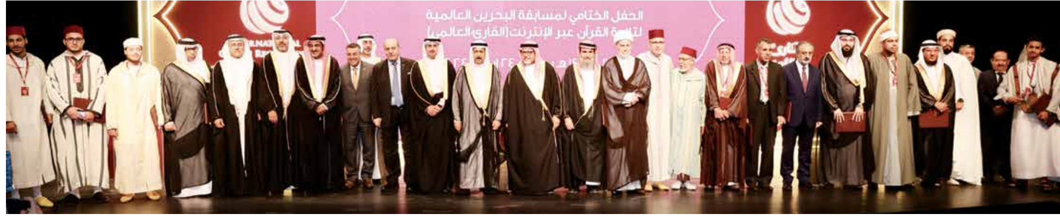
كتبت: ياسمين العقيقات

الشيخ عبدالرحمن آل خليفة؛ حرص دائم من جلالة الملك على تكريس الهوية الإسلامية في البلاد