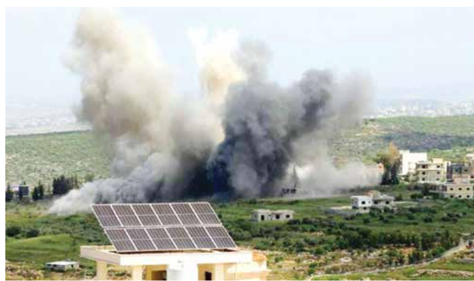
○ إسرائيل أعلنت القضاء على نصف قادة حزب الله في الجنوب اللبناني.

منطقة عيتا الشعب لضرب «الجهة الداخلية الإسرائيلية» من جهتها، ذكرت الوكالة الوطنية للإعلام الرسمية اللبنانية أن إسرائيل تستهدف