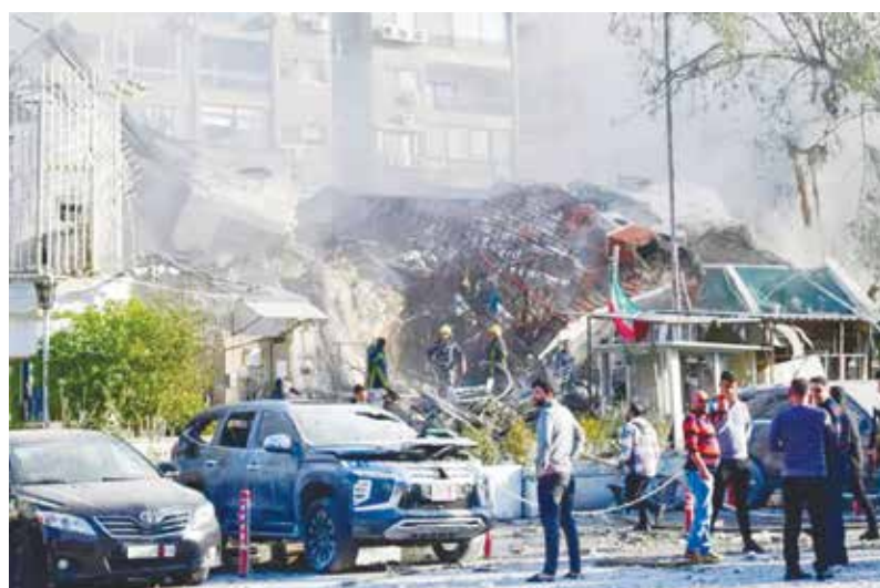
○ قصف القنصلية الإيرانية في دمشق ١٣ الشهر الجاري.

من جانبه، أكد متحدث من قوة الأمم المتحدة المؤقتة في لبنان (يونيفيل) لوكالة فرانس برس أنه «نرصد أي عبور بري اليوم». وفي وقت سابق أمس،