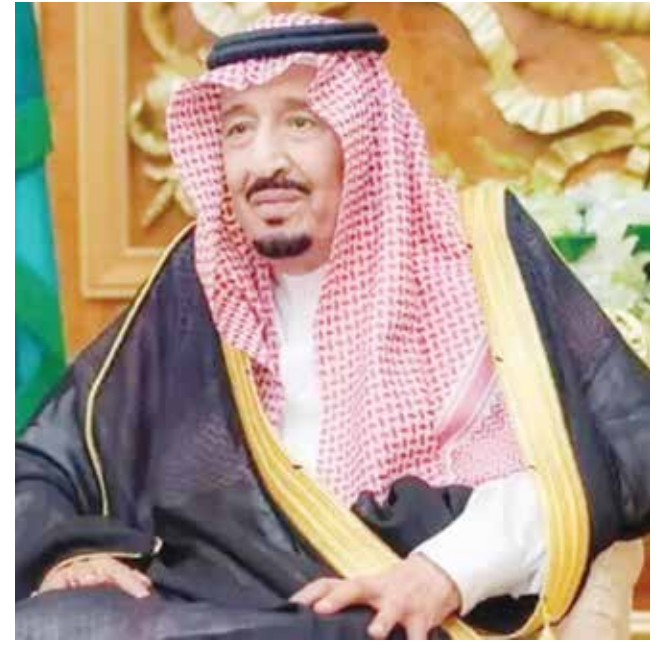
○ الملك سلمان بن عبدالعزيز.

غادر خادم الحرمين الشريفين الملك سلمان بن عبدالعزيز مستشفى الملك فيصل التخصصي في جدة بعدما استكمل الفحوصات الروتينية، وكان الملك سلمان دخل إلى المستشفى لإجراء فحوص روتينية لبضع ساعات، بحسب البيان الذي صدر عن الديوان الملكي السعودي. وكما اختار كل متضرر أو ورثته حال وفاته. كما أكدت جلسة المجلس التي رأسها الملك