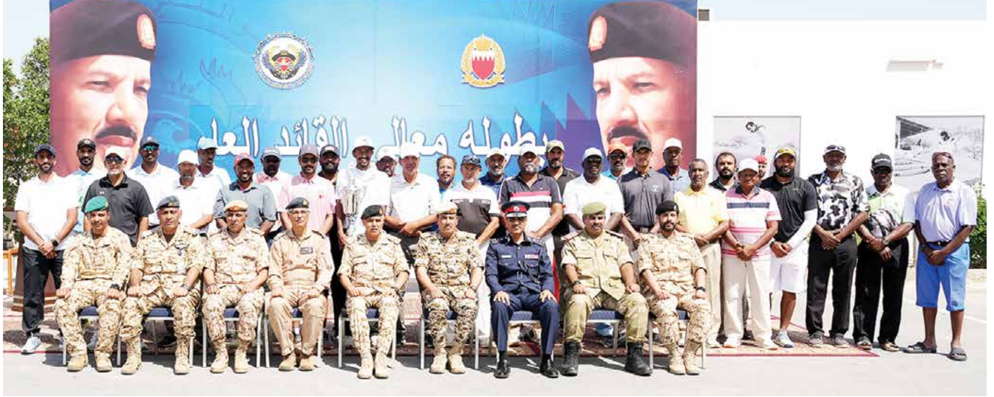
○ صورة جماعية للمشاركين في البطولة