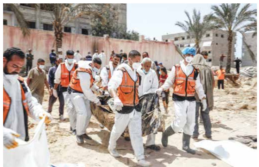
○ الرياض طالبت المجتمع الدولي بمحاسبة إسرائيل على المجازر التي ارتكبتها. (أ ب)