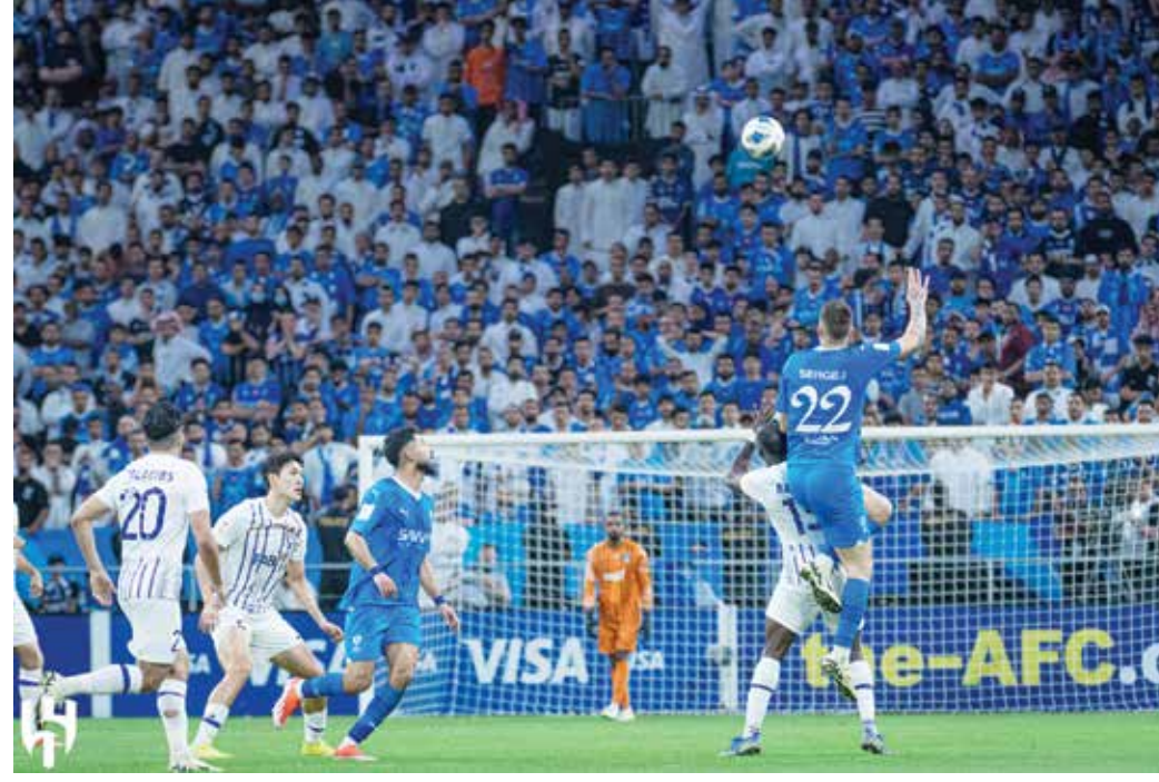
○ من لقاء الهلال والعين