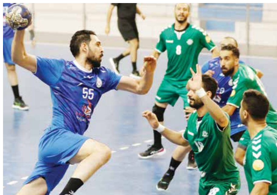
○ من لقاء الدير والبحرين