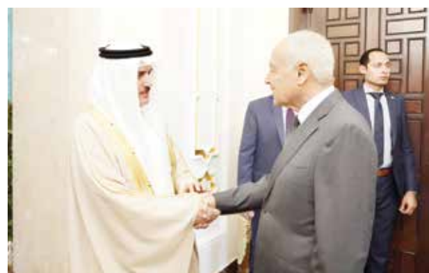
أبو الفيض يلتقي رئيس مجلس النواب.

أحمد أبو الفيض الأمين العام للجامعة العربية أحمد بن سلمان المسلم رئيس مجلس النواب أمس الأربعاء، بمقر جامعة الدول العربية بالعاصمة المصرية القاهرة، وذلك بمناسبة زيارة وفد مجلس النواب لجمهورية مصر العربية الشقيقة، والمشاركة في الاجتماع السنوي للبرلمان العربي ورؤساء المجالس والبرلمانات العربية.