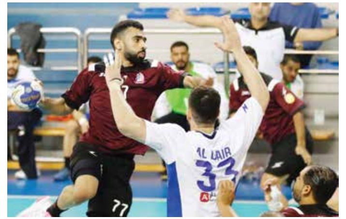
○ من لقاء سابق للشباب

وكان الشوط الأول قد انتهى بتعادل الفريقين بنتيجة (١٠/١٠)، إلا أن توبلي تمكن من الفوز في نهاية اللقاء بفارق