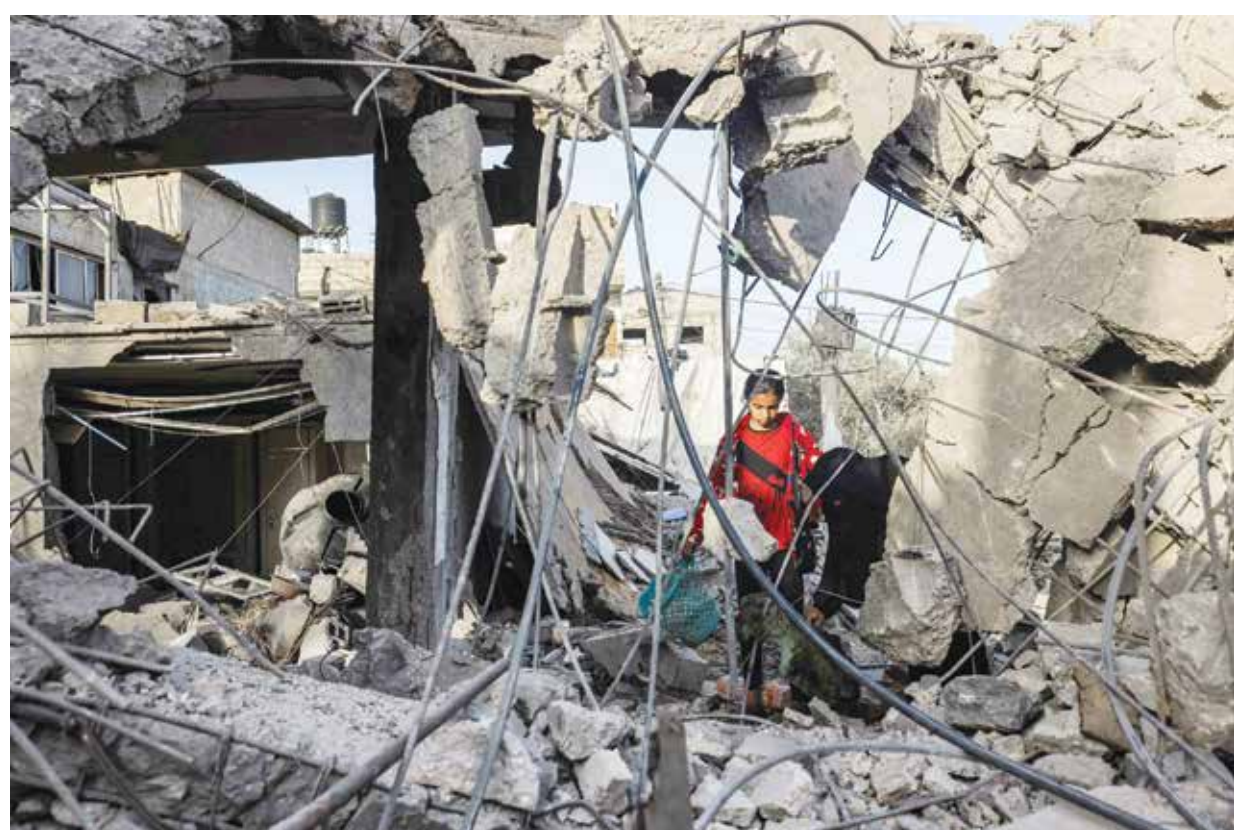
○ أحد المنازل التي طالتها القصف الوحشي في رفح.

وجه الأرض، من شأنه أن يؤدي إلى وضع مروع». وفي واشنطن، وافق مجلس الشيوخ الأمريكي على تقديم مساعدات عسكرية لإسرائيل بقيمة ١٣ مليار دولار، ولا سيما لتعزيز درعها المضاد للصواريخ، «القبة الحديدية»، المنتشر على حدودها. وشكر وزير الخارجية الإسرائيلي إسرائيل كاتس مجلس الشيوخ على إقراره المساعدة. وكتب على منصة إكس: «أشكر مجلس الشيوخ الأمريكي على تبنيه بأغلبية كبيرة من الحزبين هذه المساعدة لإسرائيل التي تعتبر ضمانا واضحة لقوة تحافظنا وتوجه رسالة قوية إلى جميع أعدائنا».