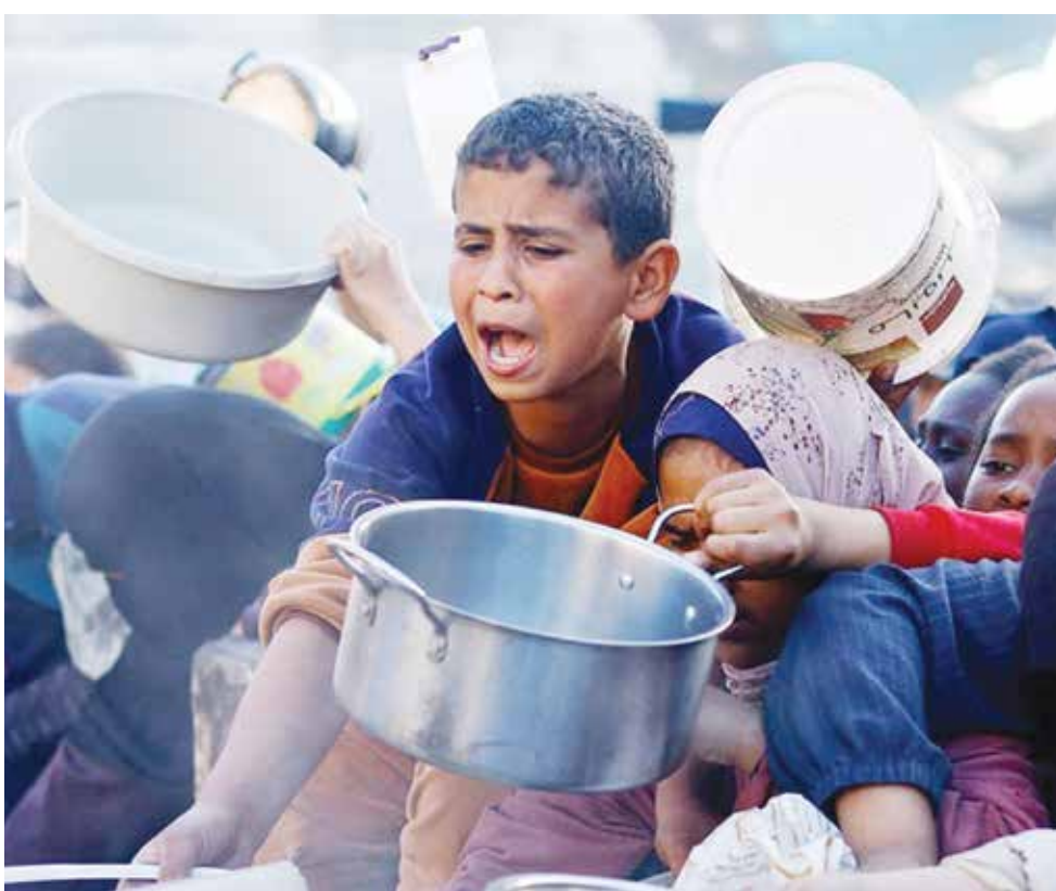
○ قيود صارمة للاحتلال على وصول المساعدات إلى غزة.

جنيف - (رويترز): قال مسؤول في برنامج الأغذية العالمي أمس إن قطاع غزة قد ينزلق إلى المجاعة في غضون ستة أسابيع بعد انتشار انعدام الأمن الغذائي وسوء التغذية والوفيات. وقال جيان كارلو سيري مدير برنامج الأغذية العالمي في جنيف «نقترب يوما بعد يوم من حالة المجاعة». وأضاف «هناك أدلة مقنونة على أن محددات المجاعة الثلاثة وهي