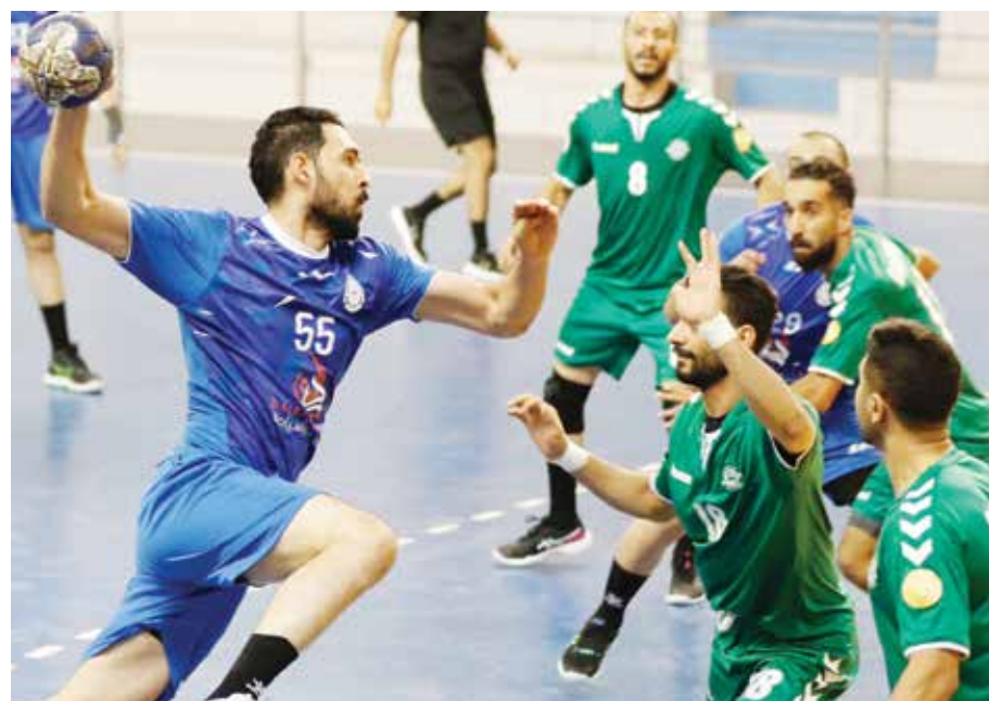
○ من لقاء الدير والبحرين