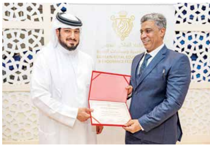
○ من تكريم المشاركين

وقد شهدت الدورة الجانبين النظري والعملي، بالإضافة إلى المسابقات الشخصية والامتحانات، حيث شهدت مشاركة ٢٢ دارساً على النحو الآتي: مملكة البحرين ٥ مشتركين، المملكة العربية السعودية ١٣ مشاركاً، دولة الإمارات العربية المتحدة ١ مشترك، دولة الكويت ٢ والمملكة الأردنية الهاشمية ١ مشترك.