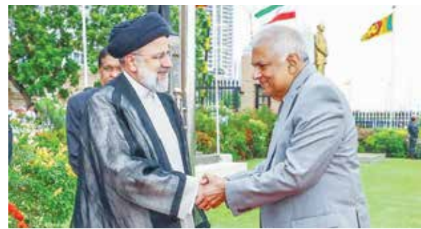
○ الرئيس السريلانكي يرحب بنظيره الإيراني بالقصر الرئاسي في كولومبو.

الغربية والهندسية والعلمية والمعرفية في هذا السياق. وأضاف أنه «على الرغم من أن عملية إنشاء سد أويا انجزت في إطار مشروع ضخم، فإن الأهم في ذلك هو التضامن والتعاطف والعمل الجماعي الذي تحقق بين البلدين والشعبين الآسيويين (الإيراني والسريلانكي)». ولفت رئيسي إلى أن «العدو لا يريد التقدم للجمهورية الإسلامية، إلا أن إرادة الشعب الإيراني أشد من مؤامراته، ودفعت بالبلاد نحو الأمام». وضمم المجمع خزائن مخصص لري ٤٥٠٠ هكتار من الأراضي، وسدا كهربائياً بقدرة ١٢٠ ميغافوات. وبلغت الاستثمارات في المجمع ٥١٤ مليون دولار، وكان من المقرر أن يتم تشغيله في مارس ٢٠١٤. ويعد استثمار أولي بقيمة ٥٠ مليون دولار من قبل بنك تنمية الصادرات الإيراني في ٢٠١٠، وأجبه المشروع تأخيراً بسبب العقوبات التي تستهدف الجمهورية الإسلامية، وموت سريلانكا الباقي.