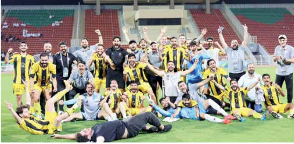
○ فرحة التأهل للنهائي

ويُميئ العهد نفسه بنيل اللقب الثاني أملاً في منح الدوري اللبناني نقاطاً إضافية في التصنيف القاري، حيث ستشهد مسابقات الاتحاد الآسيوي تغييراً جذرياً في الموسم المقبل باعتماد ثلاث بطولات للأندية: دوري أبطال آسيا للدرجة، دوري أبطال آسيا ٢، وكأس الاتحاد الآسيوي. ويأتي تأهل «الأصفر» في ظل الظروف الصعبة للكرة اللبنانية، إذ اضطر الفريق إلى اللعب بعيداً عن أرضه وجمهوره لعدم وجود ملعب في لبنان مطابق للمواصفات المطلوبة من الاتحادين الآسيوي والدولي، شأنه شأن الممثل الثاني للبلاد في المسابقة القارية، النجمة الذي خرج من دور المجموعات، ومنتخب لبنان في التصفيات المزجوجة المؤهلة لكأس العالم ٢٠٢٢ وكأس آسيا ٢٠٢٧.