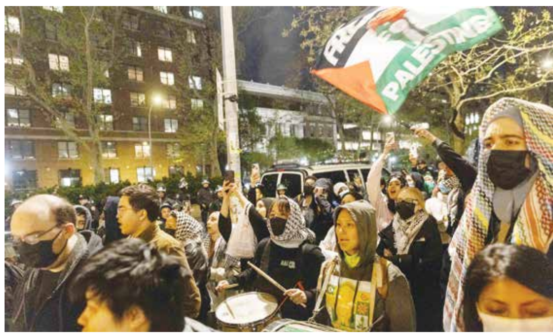
○ تظاهرة مؤيدة للفلسطينيين في خارج جامعة كولومبيا.

نيويورك - (رويترز): أقام طلاب مؤيدون للفلسطينيين مخيمات في المزيد من الجامعات في شتى أنحاء الولايات المتحدة احتجاجاً على الهجوم الإسرائيلي على غزة، رغم وقائع الاعتقال الجماعي في مظاهرات مماثلة في عدد من جامعات الساحل الشرقي في الأيام الماضية. تشمل الاحتجاجات الأخذة في الاتساع اعتزام ائتلاف جماعات يهودية معارضة للعمليات الإسرائيلية في غزة إغلاق شارع بروكلين حيث يقام تجميم الأغلبية في مجلس الشيوخ الأمريكي تشاك شومر.