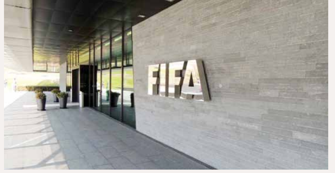
○ من مكاتب فيفا