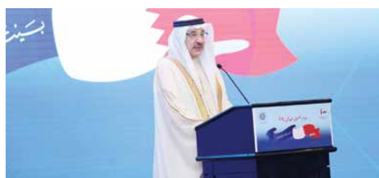
جانب من حفل التكريم.

أي بحريني الاستعانة بخبرتها وجهودها للحصول على فرصة عمل ملائمة في القطاع الخاص متاحة له بحسب اختياره، لافتاً إلى أن هناك جهوداً داعمة لجهود الحكومة لتنويع الفرص واستخدام الطاقات والخبرات الشركات. وأشار الوزير إلى أن مراكز التوظيف الخاصة «توظيف» تأتي ضمن الخطة الوطنية لسوق العمل، وهناك مكاتب متخصصة قائمة تسهم في مساعدة الشركات وتم توسيع دورها، وبإمكان