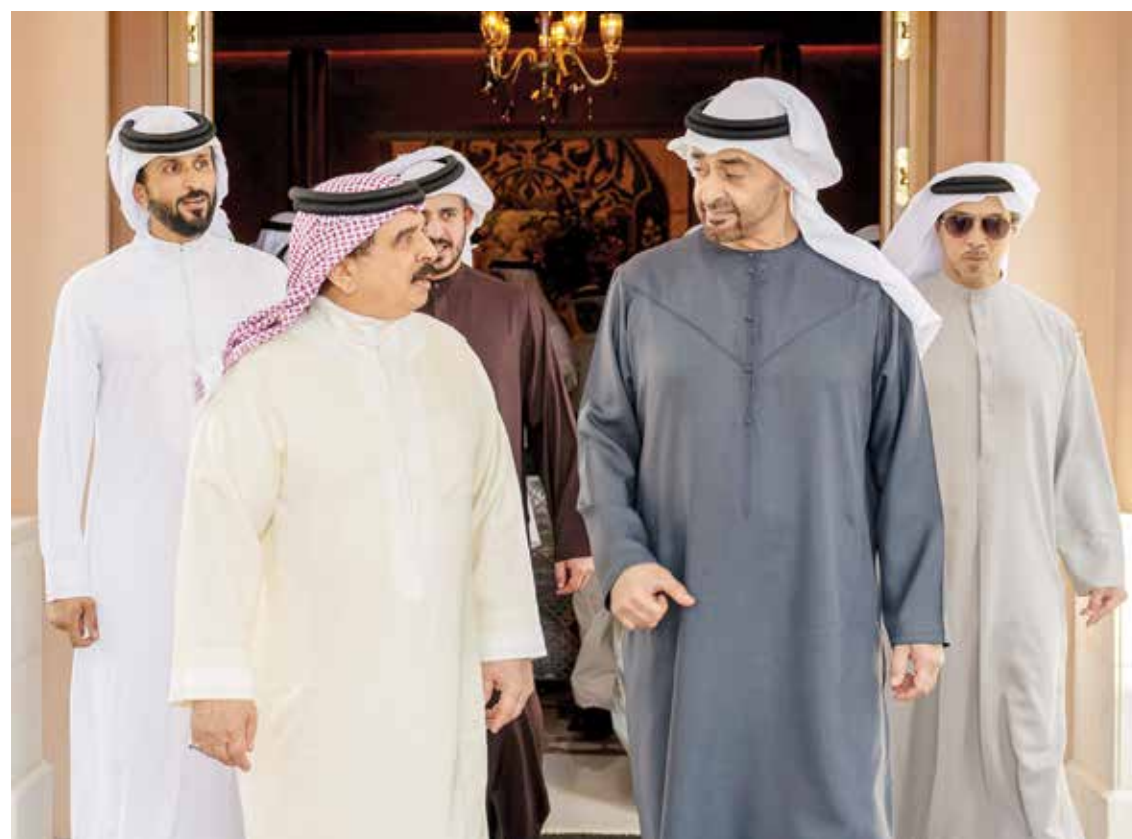
جلالة الملك المعظم خلال لقاء رئيس دولة الإمارات العربية المتحدة.

الدبلوماسية وتسوية النزاعات كافة بالحوار والتفاوض. كما دعا الجانبان المجتمع الدولي إلى تحمل مسؤولياته في تنفيذ قرارات الوقف الفوري لإطلاق النار في قطاع غزة بما يحفظ أرواح المدنيين ويوفر لهم المساعدات الإنسانية والإغاثية الضرورية من دون عوائق. وأكد ضرورة التحرك الدولي الفاعل من أجل إيجاد أفق سياسي حقيقي لتحقيق السلام الإقليمي العادل والشامل بحصول الشعب الفلسطيني الشقيق على حقوقه المشروعة وإقامة دولته المستقلة على أساس مبدأ حل الدولتين. كما أكد جلالته الملك المعظم ورئيس دولة الإمارات العربية المتحدة الشقيقة أهمية مواصلة التشاور والتنسيق وفق رؤية استراتيجية موحدة تتشدّد تحقيق المصالح الأخوية لكلا البلدين والشعبين الشقيقين وتقوية روابط الأخوة الخليجية والعربية والتعاون الدولي في نشر السلام وقيم التسامح والتآخي الإنساني.