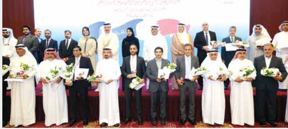
تغطية: أمل الحامد

أكد جميل حميدان وزير العمل أن السياسات التي تتبعها البحرين في مجال العمل وإدماج الكفاءات الوطنية في القطاع الخاص ما كان لها أن تتحقق لولا منظومة التعاون المتميز بين كافة الجهات الحكومية والأهلية المعنية، وإيمان أصحاب العمل بالشراكة، وتعاونهم الجاد والمخلص في تحقيق النمو في معدلات التوظيف، جاء ذلك خلال الحفل الذي نظمه الاتحاد العام للنقابات عمال البحرين بمناسبة يوم العمال العالمي أمس، والذي أقيم تحت رعاية سامية من لدن حضرة صاحب الجلالة الملك حمد بن عيسى آل خليفة عاهل البلاد المعظم، وشهد تكريم ٢٥٢ عاملاً وعاملة من مختلف الشركات.