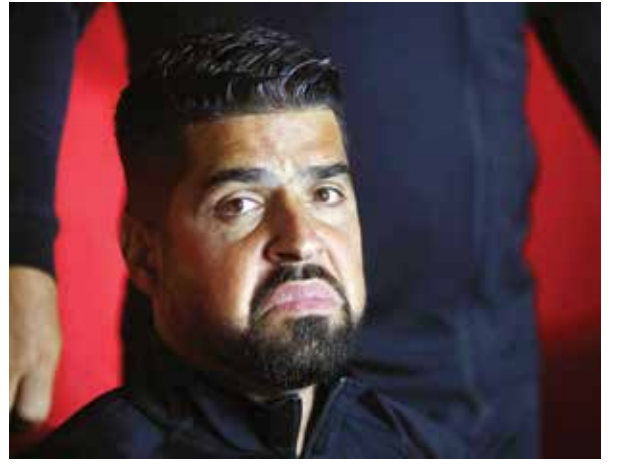
○ أمورييم

افتتح لياندرو تروسار التسجيل على ملعب الإمارات قبل أن يسجل بن وايت وكاي هافرتس لاعب تشيلسي السابق هدفين لكل منهما في الشوط الثاني. وجاءت الخسارة الثقيلة بعد أن خاض تشيلسي ثماني مباريات دون هزيمة في الدوري ووجهت ضربة لأماله في الحصول على مكان في مسابقة أوروبية الموسم المقبل. وقال بوكيتينو للصحفيين: «عندما نمر بأيام سيئة نكون في أسوأ حالاتنا. عندما نكون في حالة جيدة نكون قادرين على فعل كل شيء. لن ألوم اللاعبين. لا يمكننا إلقاء اللوم على لاعبين شيان جاءوا إلى هنا للقتال ضد منافس يستعد للفوز بالدوري الإنجليزي الممتاز». وواصل: «صحيح أننا نشعر بخيبة أمل