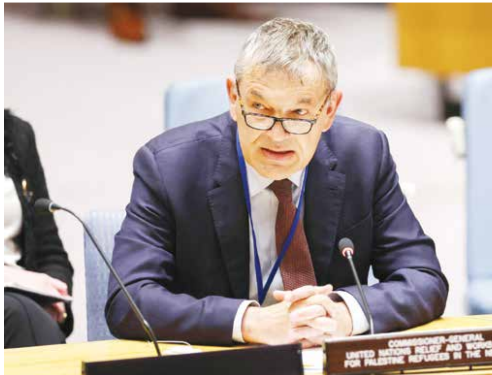
○ المفوض العام لوكالة (الأونروا) فيليب لازاري خلال حديثه أمام مجلس الأمن.

الأمم المتحدة - الوكالات: وجه المفوض العام لوكالة غوث وتشغيل اللاجئين الفلسطينيين (الأونروا) فيليب لازاري الثلاثاء انتقادات لإسرائيل، داعيا مجلس الأمن الدولي إلى التحقيق في التجاهل الصارخ، لعمليات الأمم المتحدة في غزة بعد مقتل مئات من موظفيها وتدمير مبانيتها. وتأتي تصريحات لازاري غداة صدور تقرير للجنة مستقلة كلفتها الأمم المتحدة بإجراء تقييم لآداء الوكالة، وأشار التقرير إلى أن إسرائيل لم تقدم دليلا يدعم اتهاماتها لموظفين في الأونروا بأنهم على صلة بمنظمات إرهابية. لكن التقرير خلص إلى أن الوكالة تعاني من «مشاكل تتصل بالحيادية»، خصوصا على صعيد استخدام موظفيها لشبكات التواصل الاجتماعي. وعلى الرغم من إقراره بما خلص إليه التقرير، قال لازاري في تصريح صحفيين إن الاتهامات للوكالة «مدفوعة في المقام الأول