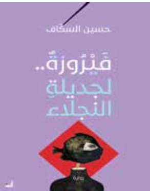
○ غلاف الرواية.

من الذاكرة التونسية. كما تتميز هذه الرواية بتعدد الشخصيات التي تطل من فناء الرواية ولكل شخصية رواية بالمكان حتى أنك تشعر وأنت تقرأ الرواية أن الكاتب يريد أن يأخذك معه إلى هذه الأماكن التي يتردد عليها التونسيون وتشكل جزءا من المجال الحيوي لتونس مثل شارع الحبيب بورقيبة وأنهج القاهرة وكمال أتاتورك وشارع باريس والمدينة العتيقة ونهج جامع الزيتونة والقصبة وشارع باب بنات إلى جانب المقاهي والمطاعم التي يرد ذكرها في الرواية.