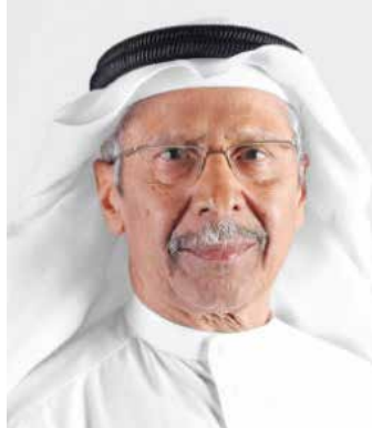
بقلم: د. محمد عيسى الكويتي

حددت الرؤية أهم التحديات وهي أن النموذج الاقتصادي الحالي لا يتلاءم مع متطلبات التنمية الاقتصادية المنشودة ولا يتناسب مع السياسات العامة والتطلعات، والتحدي الثاني هو «عدم قدرة التعليم على تزويد الشباب بالمهارات والمعارف المناسبة». بالنسبة إلى التحدي الأول رأت الدولة أن الحل في جعل القطاع الخاص هو المحرك للاقتصاد، ماذا يعني ذلك؟ وما الدلائل التاريخية في البحرين التي تدعم هذه الخلاصة وما العلاقة المنطقية بين التحدي والحل؟ هل هو تأثر بالفكر النيو ليبرالي أم نتيجة تحليل دقيق للوضع. آیا كان السبب فيان النتيجة بعد ١٥ سنة لا تدعم هذه العلاقة. فما زال القطاع الخاص غير قادر على القيادة ولم يؤسس مشاريع كبيرة تستقطب العاطلين ولم يتخلص من العمالة الرخيصة الوافدة ولم يستخدم التكنولوجيات لرفع الإنتاجية. والقطاع الخاص ما زال يحتاج إلى أن تأخذ الدولة مبادرات في إنشاء صناعات ومشاريع كبيرة (غير عقارية) تخلق فرص عمل وفرصا للشركات الصغيرة والمتوسطة ورواد الأعمال في التشبيك معها. النتيجة مازال الاقتصاد أقل من الطموحات في إيجاد فرص عمل مجزية للبحرنيين، ولم يصل البحريني في بعض المجالات إلى أن