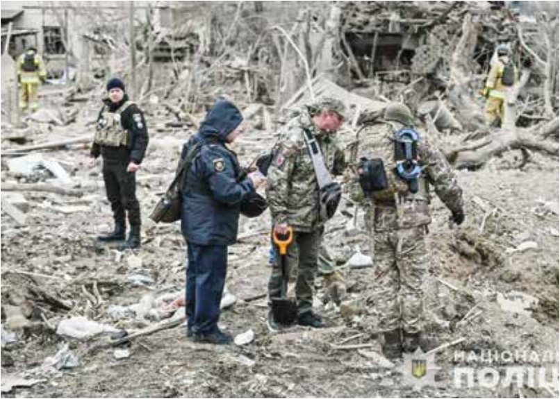
○ آثار الضربات الروسية على زباروجيا.

هذا الإرهاب.. وأوضح زيلينسكي أنّ الهجمات استهدفت خصوصا «محطات توليد طاقة وخطوط توتر عال، وسدّا للطاقة الكهربائية، ومباني سكنية عادية، وحتى عربة ترولي باص». وأفادت شركة أوكرينغرو، المشغلة بأنّ هذه الضربات أدت إلى انقطاع التيار الكهربائي في سبع مناطق على الأقل في البلاد والحقت أضرارا بدعشرات، المنشآت. وحرمت خاركييف، ثاني كبرى المدن الأوكرانية التي كان يقطعها قبل الحرب حوالي مليون ونصف مليون نسمة، من الكهرباء والتدفئة بسبب القصف الذي «الحق أضرارا جسيمة» بمنشآت الطاقة. على ما قال رئيس بلديتها إيغور تيرخوف، مشيرا إلى أنه «أقوى» هجوم طال المدينة منذ بدء الحرب. وقال وزير الطاقة الأوكرانية غيرمان غالوشتشينكو من جهته: إن القصف الليلي الذي طال بلدة كان «أكبر هجوم على قطاع الطاقة الأوكرانية في الآونة الأخيرة». وتسبب القصف بانقطاع أحد الخططين الكهربائيين اللذين يغذيان محطة الطاقة النووية الأوكرانية في زابوريجيا التي استولى عليها الروس، قبل إعادة التيار. وحُرم أكثر من ١,٥ مليون شخص من الكهرباء في ثمانية مناطق أوكرانية على الأقل، وفق ما أفادت بعثة مراقبة حالة حقوق الإنسان في أوكرانيا التابعة للأمم المتحدة.