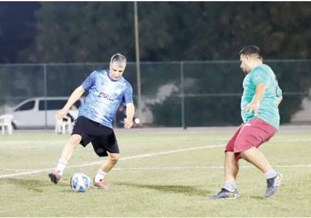
O جانب من لقاء الأبراج وأخبار الخليج