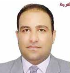
بقلم: حيدر علي الاسدي

فلايد من التنوع على مستوى الصوت والفكرة ويتحول الجدل خصوصية التأليف لمسرح الطفل عبر (مسرح الدمى) فإن الإيجاز تعد سمة تسيطر على مفردة الجملة الحوارية في بناء النص المسرحي لدى مهودر، ومحاولة أنسنة الفعل للشخصيات الحيوانية التي تهيمن غالبًا على مسرح الدمى لطبيعة هذا النوع المسرحي الذي يحافظ على محاولة رسم الشخصيات وفقًا لما تقدمه من قيم سيم في بناء ثقافة الطفل وتنشئته على الجوانب التربوية المهمة في حياة الإنسان، كما أن مهودر له قدرة في صياغة شخصية تشظى أصواتها بين المونودراما لمحاولة كسر نمطية الشخصية الواحدة والصوت الواحد