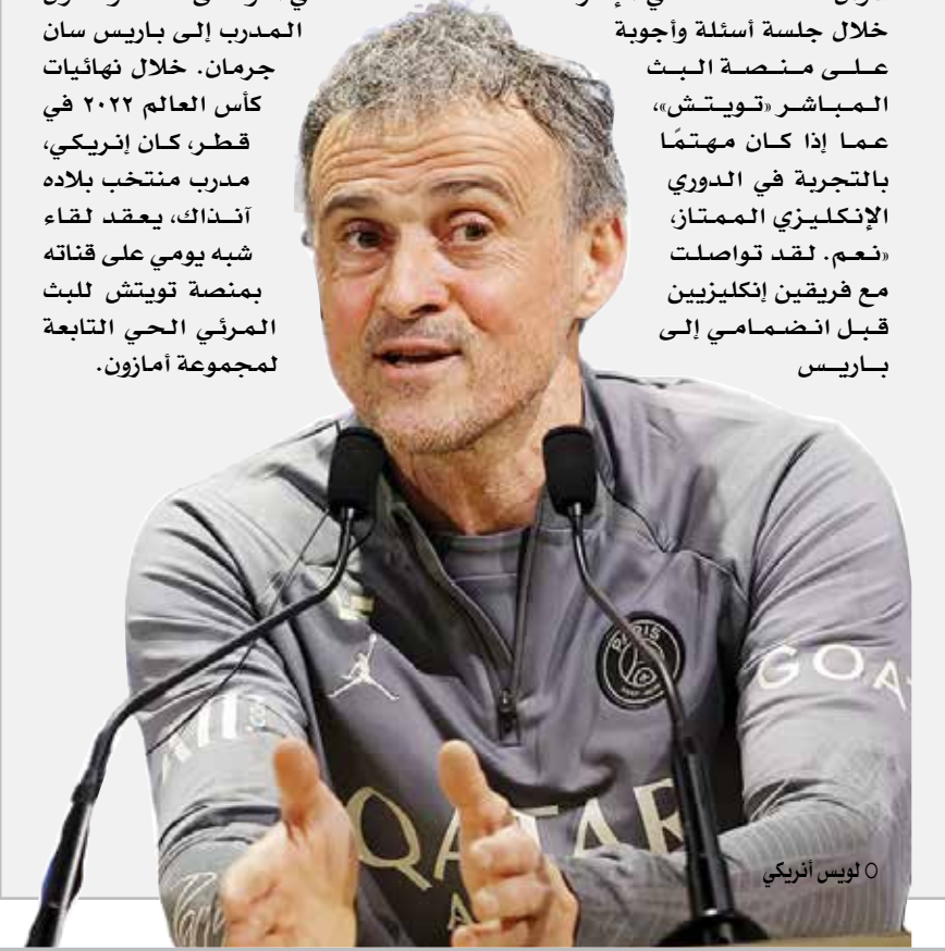
○ لويش أنريكي

باريس - (أ ف ب): قال المدرب الإسباني لباريس سان جرمان متصدّر الدوري الفرنسي لويش إنريكي الخميس إنه لا يستبعد التدريب يوما ما في الدوري الإنكليزي الممتاز لكرة القدم، حتى لو كان «ملتزما بشكل كامل» في الوقت الحالي مع النادي الباريسي. وأكد أنريكي في معرض رده على سؤال لأحد مستخدمي الإنترنت، خلال جلسة أسئلة وأجوبة على منصة البث المباشر «تويتش»، عما إذا كان مهتما بالتجربة في الدوري الإنكليزي الممتاز، «نعم. لقد تواصلت مع فريقين إنكليزيين قبل انضمامي إلى باريس