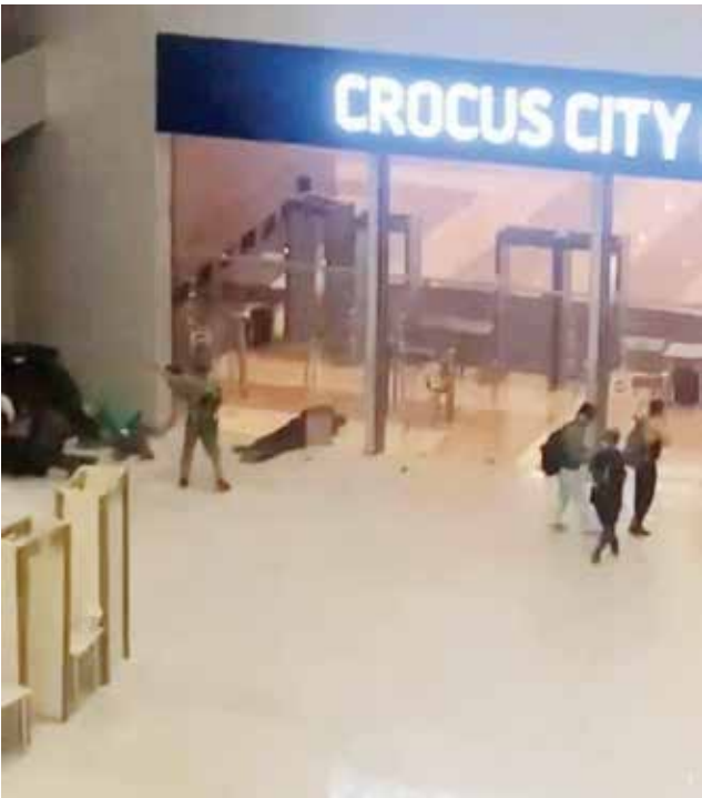
○ مسلحون يطلقون النار داخل القاعة.

موسكو - الوكالات، قُتل ٤٠ شخصا على الأقل وأصيب أكثر من ١٠٠ في إطلاق نار أعقبه حريق ضخم مساء أمس في قاعة للحفلات الموسيقية بضواحي موسكو بعدما اقتحمها عدد من المسلحين، بحسب السلطات الروسية التي نددت باعتداء إرهابي دام. وأعلن جهاز الأمن الفدرالي (إف إس بي) أن «الحصيلة الأولية للاعتداء الإرهابي وقع داخل مجمع كروكوس سيتي هول في حاليا ٤٠ قتيلا وأكثر من ١٠٠ جريح، وفق ما نقلت عنه وكالات أنباء محلية. ونددت المتحدثة باسم الخارجية الروسية ماريا زاخاروفا بهذا «الاعتداء الإرهابي الدامي» والجريمة الفظيعة»، فيما أعلنت اللجنة المكلفة بالتحقيقات الجنائية الكبرى في البلاد أنها «فتحت تحقيقا جنائيا في عمل إرهابي». ووقع الهجوم الذي نفذه عدة مسلحين في المساء في قاعة كروكوس سيتي هول، وهي قاعة للحفلات الموسيقية تقع في ضاحية كراسنوغورسك في شمال غرب العاصمة الروسية. ووفق صحفي من وكالة أنباء