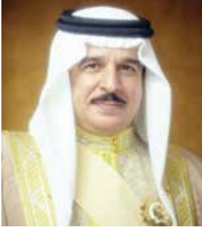
○ جلالة الملك المعظم.