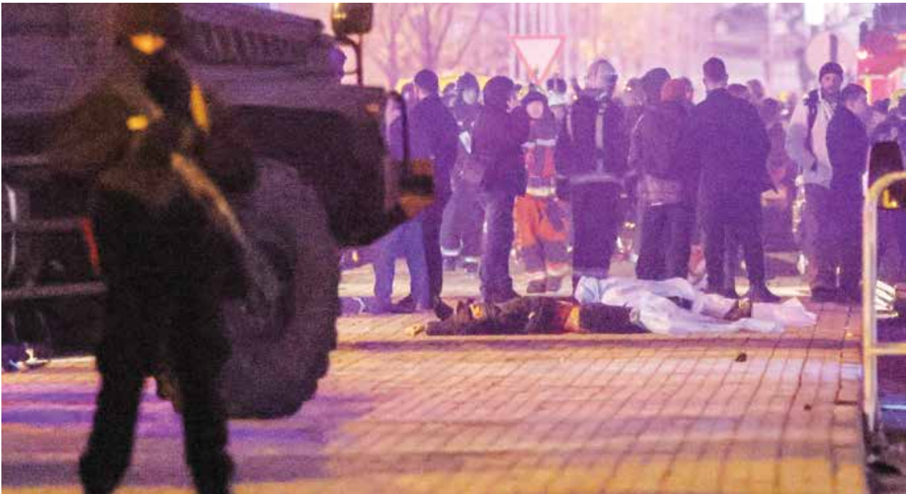
○ بعض من جثث ضحايا الاعتداء قرب قاعة الاحتفالات.