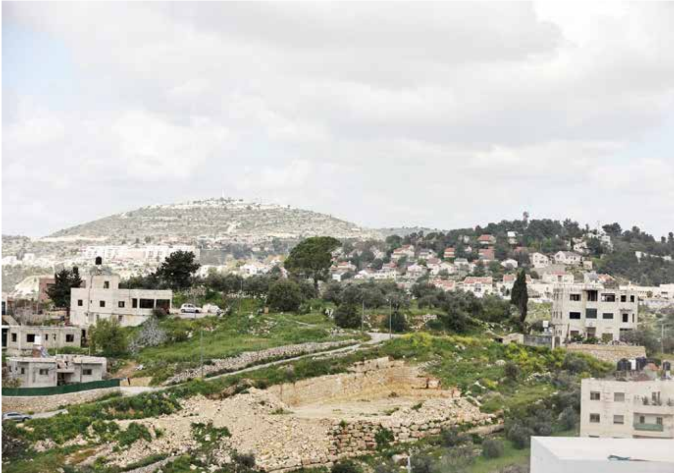
○ مستوطنة إسرائيلية في الضفة الغربية المحتلة.

والعالم إلى تقويض حقنا في منطقة يهودا والسامرة والبلاد بشكل عام، فإننا نعرّز الاستيطان من خلال العمل الجاد وبطريقة استراتيجية في جميع أنحاء البلاد». ويعيش حاليا أكثر من ٤٩٠ ألف مستوطن في مستوطنات في الضفة الغربية التي يبلغ عدد سكانها نحو ثلاثة ملايين فلسطيني.