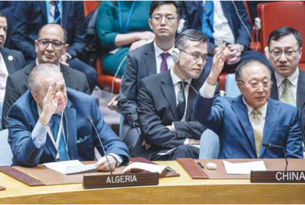
○ مندوبو الجزائر والصين خلال تصويتهما ضد مشروع القرار الأمريكي.

البلدان العربية أيدت معارضة الجزائر للنص نظرا إلى أنه لم يتضمن دعوة صريحة لوقف إطلاق النار. في المقابل، وصفت مندوبة الولايات المتحدة لدى الأمم المتحدة ليندا توماس-جرينفلد الفيتو الروسي والصيني بأنه ليس «خييئا فحسب»، بل «سخيف» أيضا. وقالت «بكل بساطة لا ترغب روسيا والصين بالتصويت لصالح قرار صاغته الولايات المتحدة». وتابعت «بكل صراحة، في ظل هذا الخطاب الحماسي كله، نعرف جميعا أن روسيا والصين لا تبذلان أي جهود دبلوماسية باتجاه تحقيق سلام دائم أو للمساعدة بشكل مؤثر في جهود الاستجابة الإنسانية». وفي وقت لاحق من أمس افادت مصادر دبلوماسية أن مجلس الأمن الدولي سيصوت اليوم على مشروع قرار يدعو بوضوح الى «وقف فوري لإطلاق النار» في غزة. وسيتم التصويت على المشروع الذي أعده العديد من أعضاء مجلس الأمن غير الدائمين في الساعة ١٤:٠٠ ت ج، وفق ما قالت المصادر المذكورة لوكالة فرانس برس.