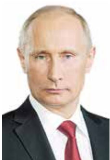
○ الرئيس الروسي.