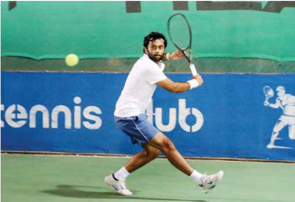
O من منافسات البطولة