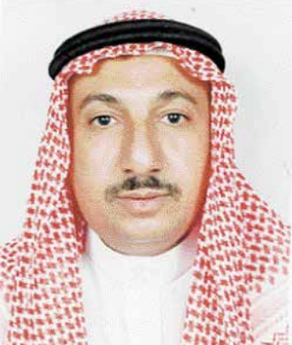
بقلم: د. أسعد حمود السعدون ○

إن هذه الحرب الأوكرانية ضد روسيا الاتحادية هي حرب بالوكالة لصالح الغرب أما تصريحات ماكرون ما هي إلا صدى لهذا التورط الغربي.