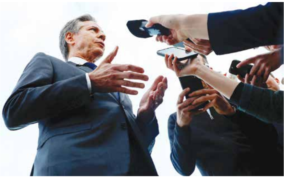
○ بلينكن يرد على أسئلة الصحفيين في تل أبيب.

كشف مكتب رئيس الوزراء الإسرائيلي بنيامين نتنياهو، في بيان نشر أمس، أن رئيس الموساد دافيد برنياع سيتوجّه إلى قطر أمس الجمعة للقاء وسطاء، في محاولة للتوصل إلى اتفاق لوقف إطلاق النار في غزة يشمل الإفراج عن رهائن.