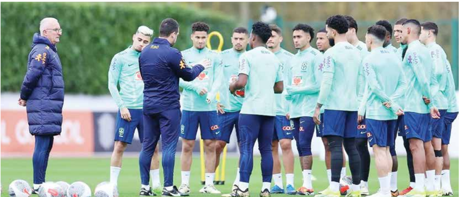
○ دوريفال يعد السيليساو بالعودة

العمر ٢٠ عاماً والذي يحقّق بداية واعدة مع باريس سان جيرمان. وسبق لبييرالدو اللعب تحت إشراف دوريفال جونيور في ساو باولو، أسوة بلوكاس باكتا، رودريغو أو أندرياس بيريرا. وتبرز خصوصية أخرى في المجموعة المختارة لمواجهة إسبانيا وإنكلترا: ٩ لاعبين من أصل ٢٦ يلعبون في الدوري البرازيلي، وهو عدد أكبر بكثير من المعتاد. وقال لاعب الوسط الأسطوري السابق زيكو الثلاثاء خلال تشدين تمثال شمعي له في ريو دي جانيرو «البرازيل في وضع سيء (...) لذلك لدى دوريفال كل الحق في إجراء تغييرات». وأضاف «لقد فضل استدعاء لاعبين يعرفهم وحقق معهم سابقا نتائج جيدة».