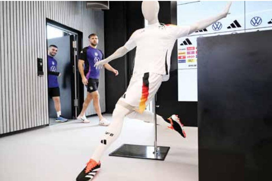
○ الاتحاد الألماني يفك الارتباط مع أديداس