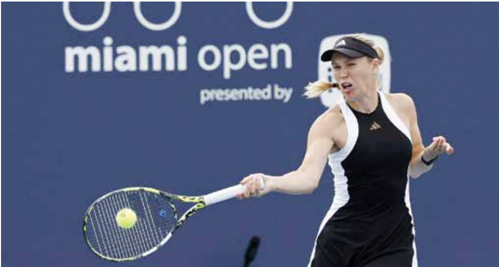
○فوزنياكي تودع البطولة

كارولين فوزنياكي على بُعد نقطة للفوز بمباراتها في الدور الثاني أمام الأوكرانية أنهيليينا كاليبنينا بمجموعتين، إلا أن الأخيرة قلبت الطاولة على منافستها لتخرج فائزة ٧-٥ و٥-٦ و٤-٦.