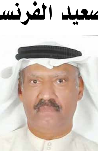
بقلم: د. نبيل العسومي

هذا بالإضافة إلى العوامل الأخرى التي يعلمها القاصي والداني اليوم وهي تتصل دول حلف الناتو عن عهودها في التسعينيات تجاه روسيا الماضي بعدم توسع هذا الحلف الذي يفترض أن يكون دافعا في اتجاه الحدود الروسية إلا أن هذا الحلف قد سعى باستمرار إلى محاصرة روسيا حتى وصل حلف الناتو إلى أعقاب الحدود الروسية بعد انضمام فنلندا والسويد إلى الحلف.