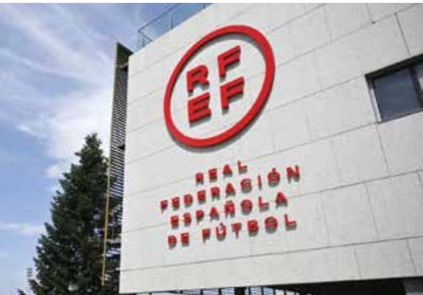
○ الاتحاد الإسباني

أن أنكر ذلك لأن الحمض النووي الخاص بي لم يكن موجودا، لكنني لست كاذبا.. كما اتهم النظام القضائي الإيطالي ب«العنصرية». لعب روبينيو الذي استهل مسيرته الكروية في سانتوس عام ٢٠٠٢ في آخر محطة له مع باشاك شهر إسطنبول في الدوري التركي عام ٢٠٢٠، قبل أن يغادر عائدا إلى البرازيل. وعاصر روبينيو الجيل الذهبي للبرازيل أمثال رونالدو وريفالدو ورونالدينيو، وانتقل عام ٢٠٠٥ إلى ريال مدريد للعب إلى جانب الفرنسي زين الدين زيدان ورونالدو والإنكليزي ديفيد بيهكام. دفاع عن ألوان سيتي بين عامي ٢٠٠٨ و٢٠١٠ ثم ميلان لأربعة أعوام حتى ٢٠١٤.