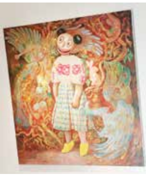
○ لقطة من أعمال الفنان.

في العوالم العميقة المُتداخلة للوحات معرض «مركز المدينة» يسمّع المُتلقي بصصره استغاثات الأزواح