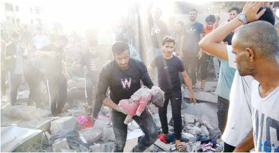
○ من الجرائم الصهيونية في غزة.