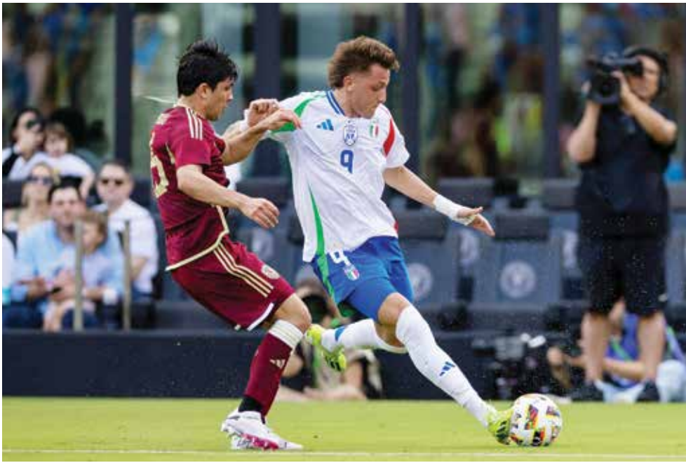
○ ريتغي ينقذ إيطاليا

لكن فرحته لم تدم سوى ثلاث دقائق حيث أدركت فنزويلا التعادل سريعاً مستفيدة من قرار سيّئ لدوناروما الذي راوغ ورندون وحاول تمرير الكرة إلى لاعب وسط فيورنتينا جاكومو بونافينتورا لكن مهاجم قادش الإسباني داروين ماشيس ضغط عليه وخطفها قبل أن يودعها المرمى الخالي. وتألق دوناروما في الشوط الثاني بتصديه لتسديتين لروندون (٦٠) وخوندر كاديس (٦٤)، قبل أن يتمكن ريتغي من تسجيله هدفه الشخصي الثاني والفوز لإيطاليا إثر تمريرة من لاعب وسط أرسنال الإنجليزي جورجينيو (٨٠).