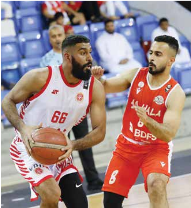
○ من لقاء المحرق والحالة