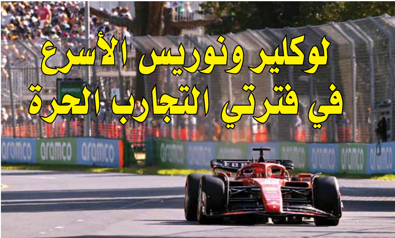
○لوكلير الأسرع

الثالث خلف زميله لوكلير وفيرستابين، علماً انه كان سجل ثامن أسرع توقيت في الفترة الأولى. وأكمل سائقا فريق أستون مارتن الكندي لانس سترول والمخضرم الإسباني فرناندو ألونسو، بطل العالم مع رينو عامي ٢٠٠٥ و٢٠٠٦ والذي كان الحق أضراا بالقسم السفلي لسيارته، مما استدعى تغييره في الفترة الأولى، المراكز الخمسة الأولى.