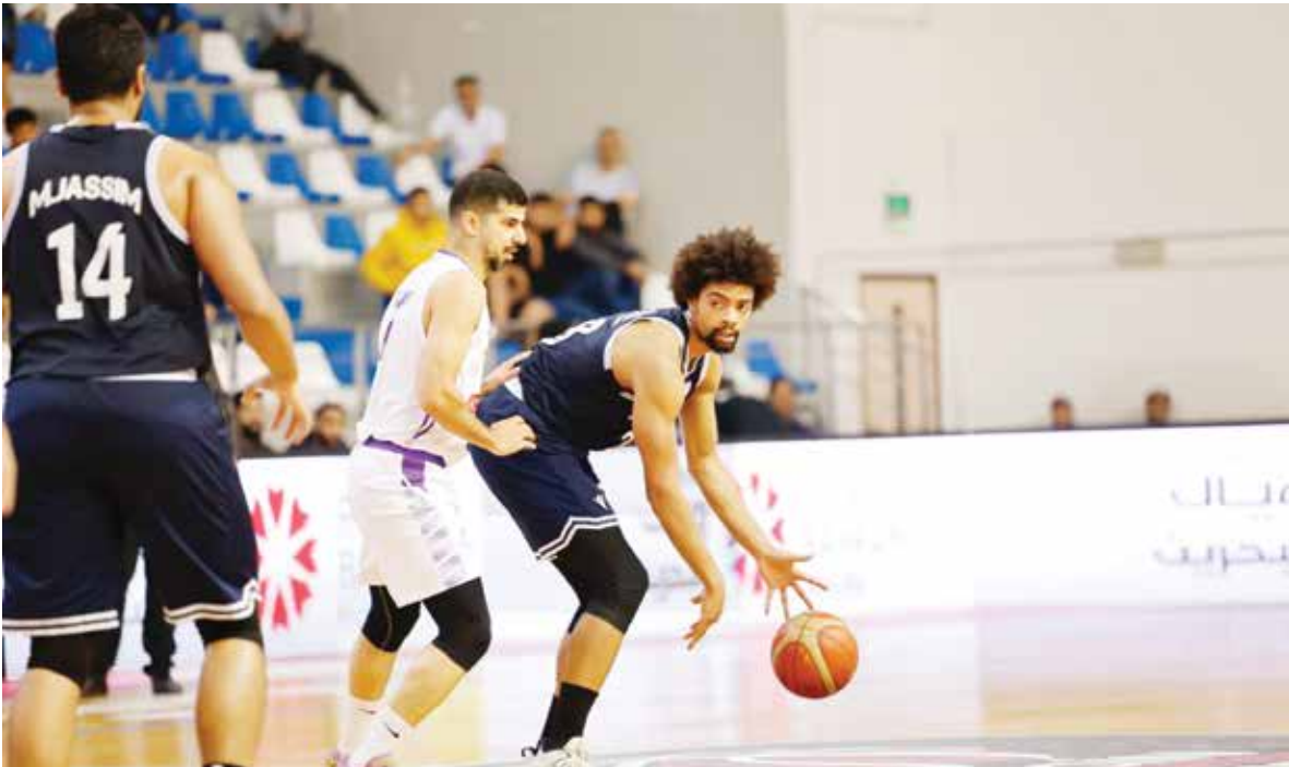
O من لقاء سابق بين الاتحاد والنجمة

ويدخل الاتحاد المباراة ويمتلك في رصيده ٦ نقاط من انتصاريين على الحالة والمنامة وخسارتين أمام الأهلي والمحرق، وهو ذات رصيد النجمة الذي حقق انتصاريين على الحالة والمحرق وخسر أمام المنامة والأهلي. وتبدو حظوظ الفريقين متساوية