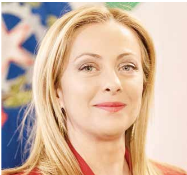
O جورجيا ميلوني.

اقتحم مئات المهاجرين غير الشرعيين الحاجز الذي أقامه حاكم ولاية تكساس غريغ أيبوت على طول نهر ريو غراندي في إل باسو بعد أن عجز جنود الحرس الوطني في تكساس عن صدhem. اخترق المهاجرون حواجز الأسلاك الشائكة بعد وقت قصير من الساعة ٨:٣٠ صباح يوم الخميس ٢١ مارس، على أمل الاستسلام لعملاء حرس الحدود الأمريكية، بعد أن خيم بعضهم على الضفة الشمالية لنهر ريو غراندي مدة تصل إلى ثلاثة أيام. وكتب أيبوت في منشور على منصة «إكس» حول زيادة عدد المهاجرين غير الشرعيين في إل باسو: «استعاد الحرس الوطني في