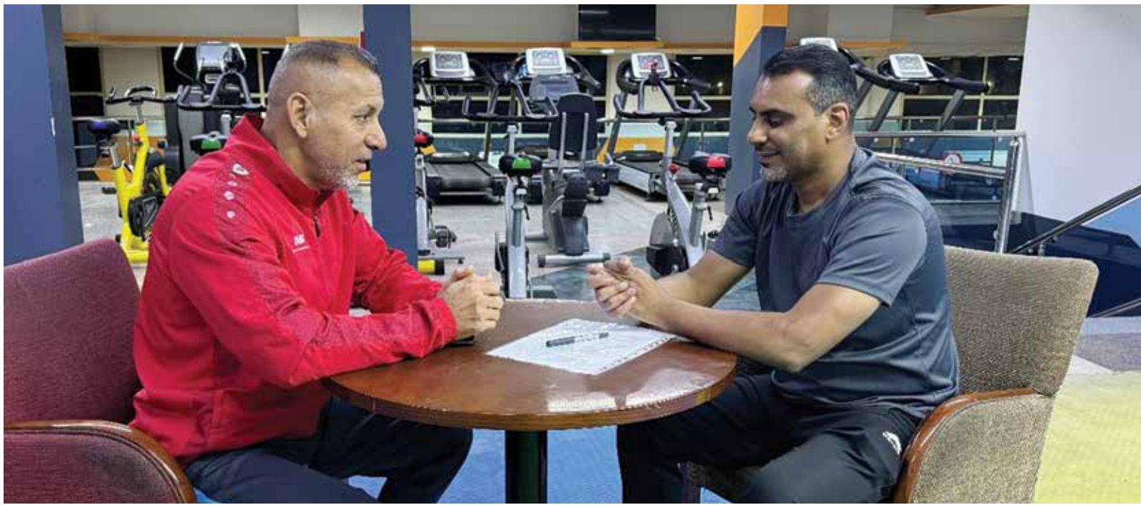
O جانب من الحوار