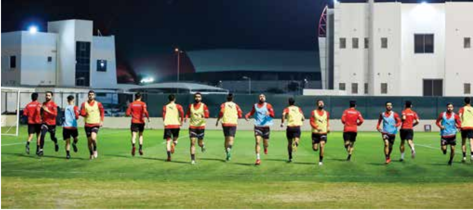
○ جانب من التدريب.