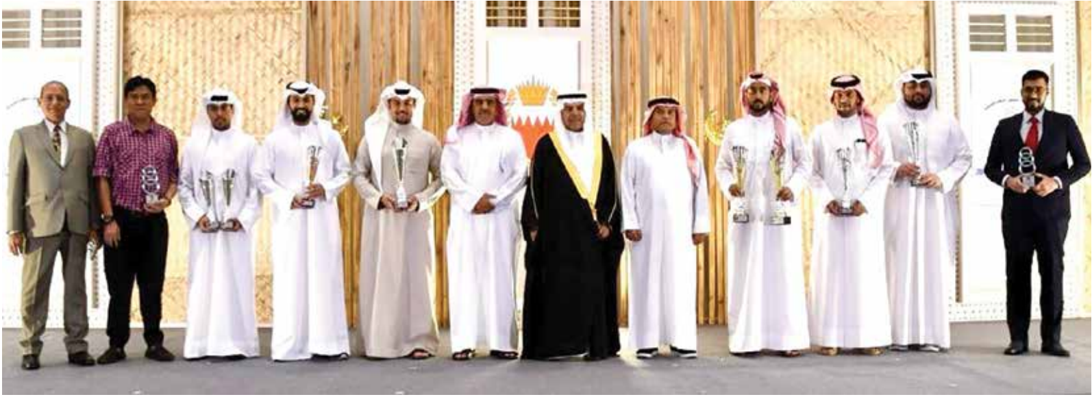
○ جانب من تكريم الفائزين

الذي ظهره به خلال مشاركته في منافسات البطولة، وأعرب عن شكره للجميع على المشاركة وحسن التنظيم، حضر الحفل عدد من كبار ضباط قوة دفاع البحرين.