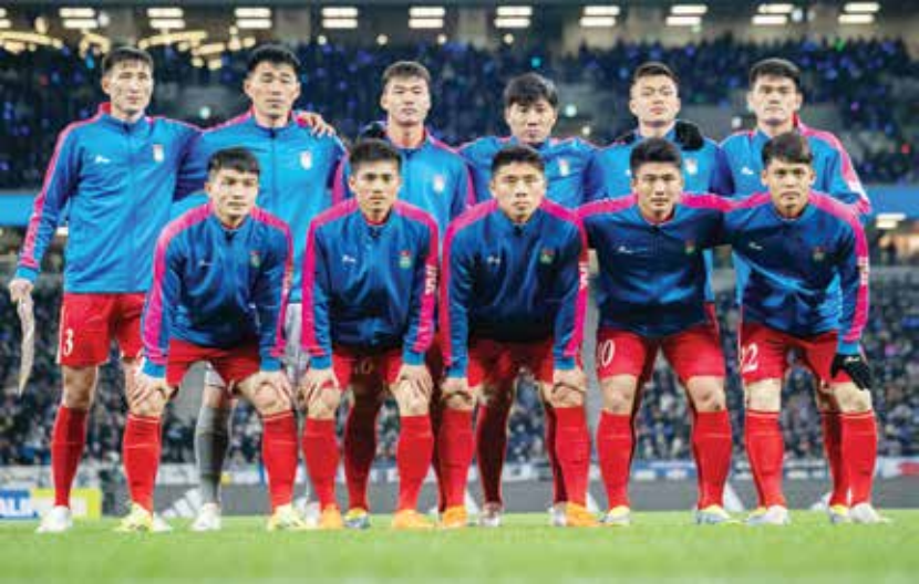
○ منتخب كوريا الشمالية

من جهته، قال بيكيه المدافع السابق لبرشلونة «ولا روخا، في أبريل ٢٠٢٢ إن «كل شيء قانوني، وإنه، فخور، بالصفقة».