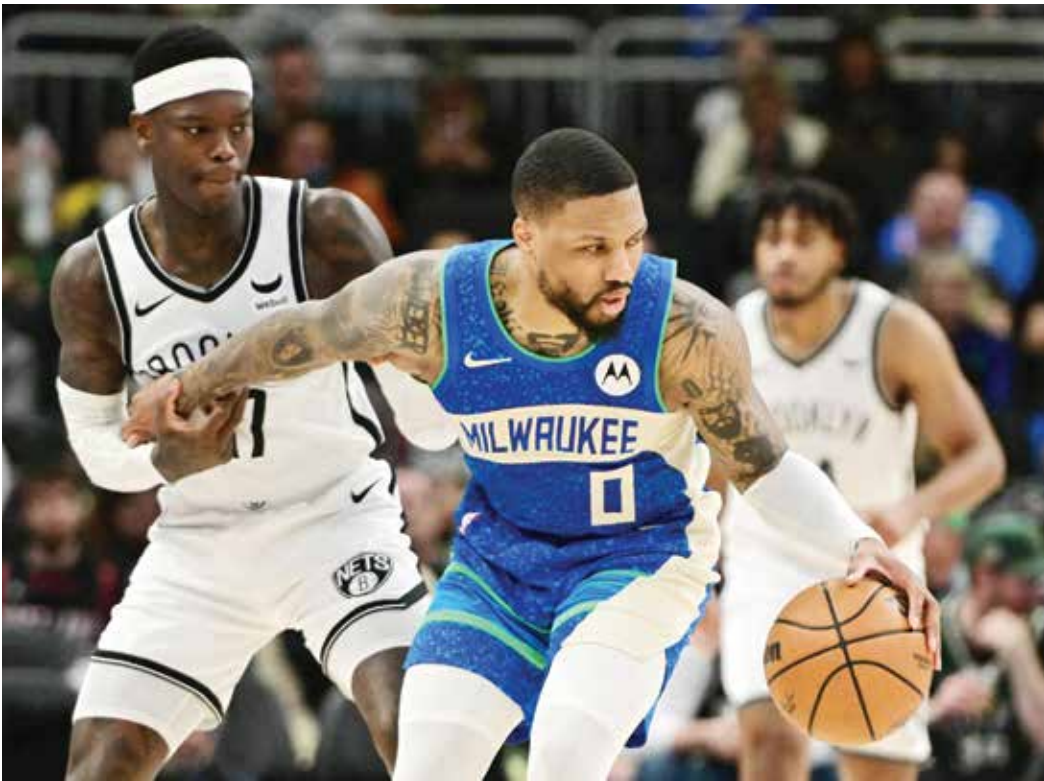
○ليلارد يعود بميلووكي للفوز (رويترز)

وفي أورلاندو، سجل باولو بانكيرو ٢٠ نقطة وأضاف إليها ١٠ متابعات و١١ تمريرة حاسمة، محققا ثاني «تريبيل-دايل» في مسيرته وساهم في الفوز الخامس تواليا لفريقه ماجيك على حساب ضيفه نيو أورليانز إصابتها في ركبتة.