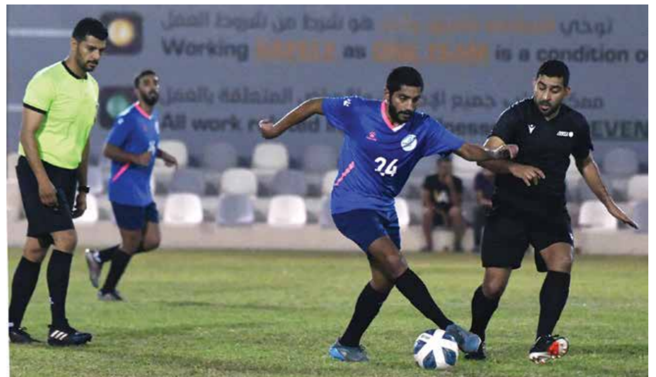
من لقاء أسري وبابكو للاستكشاف.

خرج فريق أسري من عنق الزجاجة بعدما حول تأخره على فريق «بابكو» للاستكشاف والإنتاج، بهدف دون رد في الشوط الأول إلى فوز صعب بهدفيين لهدف في الشوط الثاني، في المباراة التي جمعتها أمس الأول في افتتاح مباريات الأسبوع الثاني من منافسات دوري الشركات والمؤسسات لكرة القدم. وأقيمت المباراة على ملعب نادي ألبا بالرفاع. وتختتم اليوم مباريات الأسبوع الثاني بقاءً يجمع بين بابكو وجيبك في تمام الساعة ٧:٠٠ مساءً. وتقام المباراة على ملعب نادي ألبا بالرفاع.