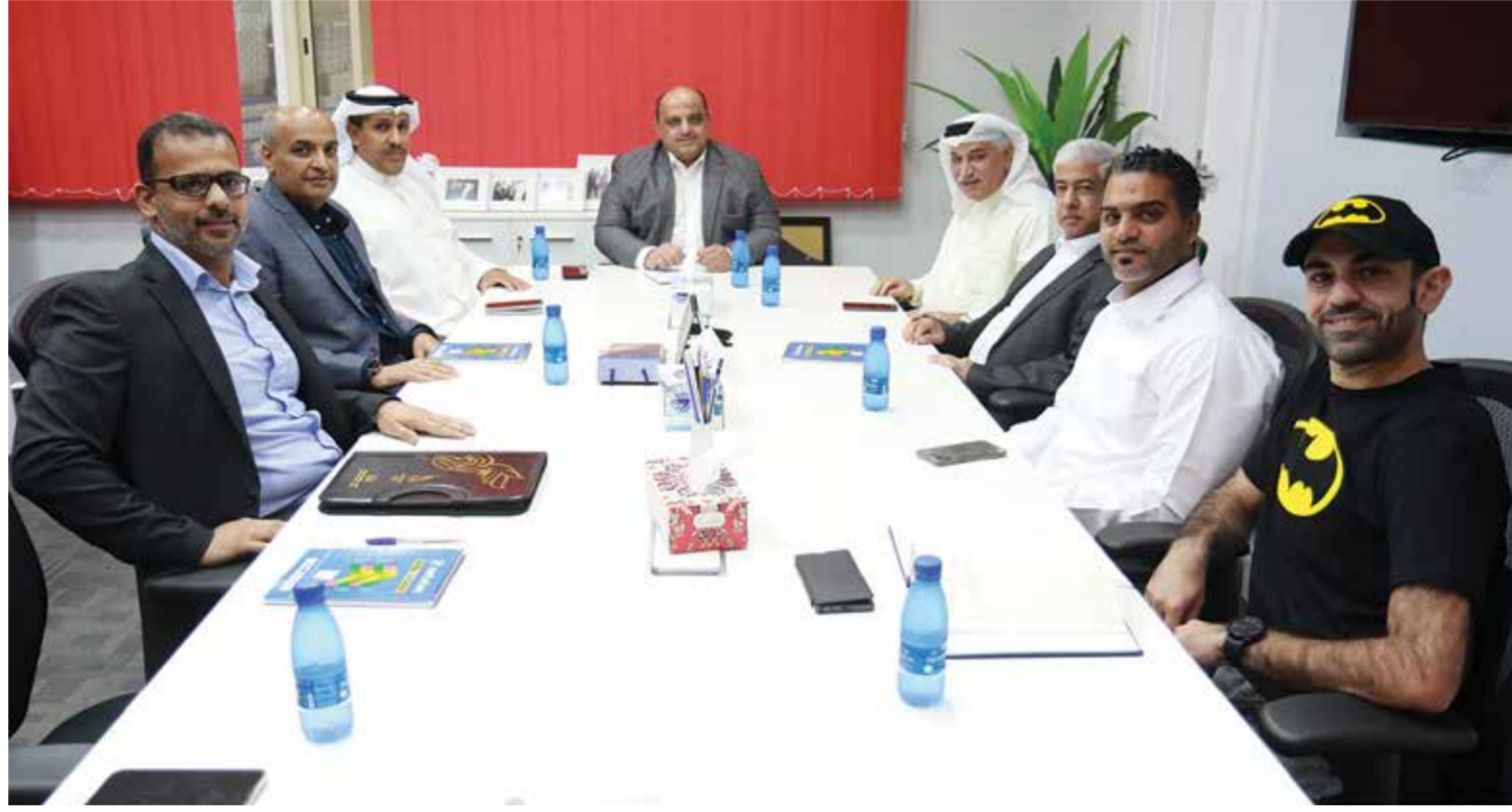
اجتماع حفل الاعتزال

وتستكمل المنافسات يوم غد الأربعاء بمواجهتي البحرين وباربار، الاتفاق والأهلي. وتعتبر مباراة اليوم بين الشباب والدير قوية، باعتبار أن الفريقين هما الأكثر قوة من ناحية اللاعبين الموجودين «الخبرة والعناصر الشابة»، بالإضافة لما ظهر عليه في الجولات السابقة، حيث الدير يمتلك (٦ نقاط) من انتصاريين على الأهلي والتضامن، أما الشباب الذي يلعب مباراته الثانية اليوم فقد كسب باربار بالجولة الماضية وله (٣ نقاط).