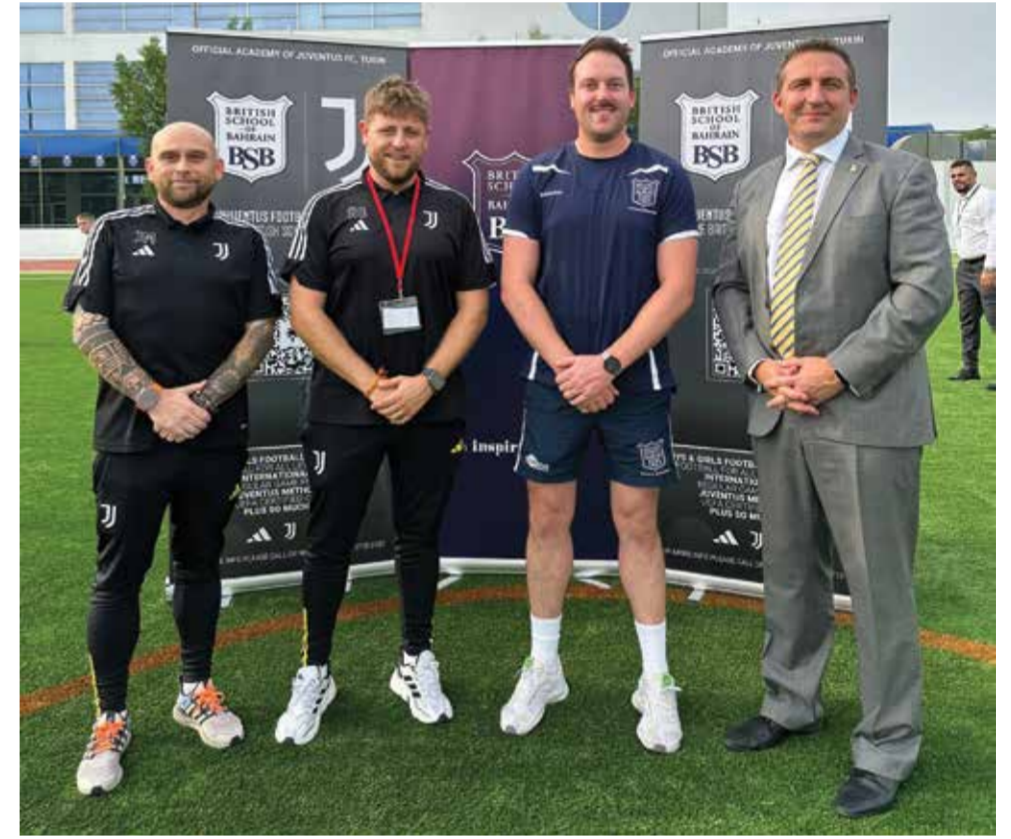
صورة جماعية لممثلي المدرسة والأكاديمية