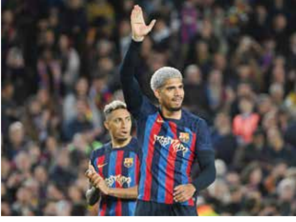
○ رونالد أراوخو