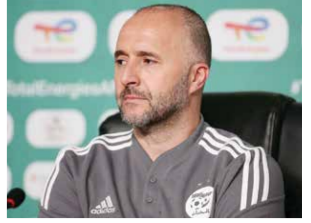
○ جمال بلماضي

لكن فيما كانت النتيجة ١-١ قبل عشر دقائق من انتهاء الوقت الأصلي، هز أسنسيو الشباك على ملعب كامب نو. ويعد التحقق من حكم الفيديو المساعد، تبيّن أن المهاجم في حالة تسلل. قال الإيطالي كارلو أنشيلوتي مدرب ريال: «لم نفض بسبب حالة تسلل لا نزال نشكك فيها». تابع: «لم تكن مؤكدة. لدينا شكوك حيالها، ونحمل معنا إلى مدريد هذه الشكوك». لكن رأى مدرب برشلونة تشافي كان مختلفاً تماماً «هذا واضح، التسلل واضح، هذا شيء علمي، أليس كذلك؟». فأجاب تشافي: «تصريح أنشيلوتي». تابع: «من دون في إيه آر، تكون الأمور أصعب. أصبحت الأمور أكثر عدلاً، وخصوصاً في حالات التسلل». أضاف المدرب السابق لنادي السد القطري: «قد يكون من الصعب الحكم على ركلة جزاء أو لمسة يد، لكن في هذه الحالة أنا متأكد من أنشيلوتي». وفيما اعتبر أن لقب الدوري لم يجم بعد، رأى تشافي أن فريقه أصبح في موقع مربح: «لم نفض سوى بلقب تكأس السوبر، لكن يمتلكني شعور أن مصير اللقب يتوقف علينا». ورأى تشافي أن فريقه قام برّد فعل قوي بعد بداية صعبة للموسم: «رايتم في نهاية المباراة، كانت