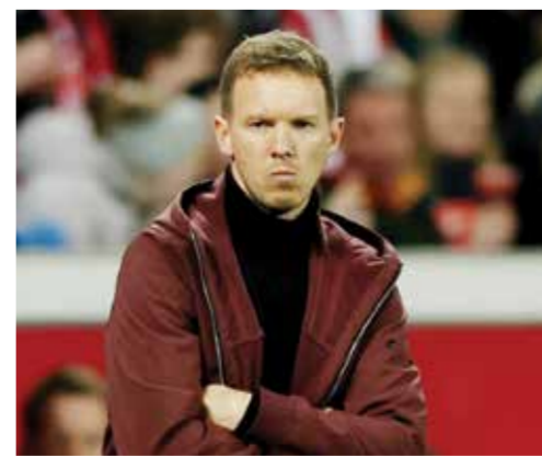
○ جوليان ناجلسمان

جيد، سيشكل هذا أفضلية بالنسبة إلينا، رغم تلقي الهزيمة، وحسم باير ليفركوزن مباراة أمس بضررتي جزء جرى احتسابهما بعد اللجوء لنظام حكم الفيديو المساعد (فار). وسجل إزيكوبيل بالاسيوس، المتوج مع المنتخب الأرجنتيني بكأس العالم، هدفي باير ليفركوزن لينتزع الفريق النقاط الثلاث بعد أن تقدم بايرن ميونخ عن طريق جوشوا كيميشت.