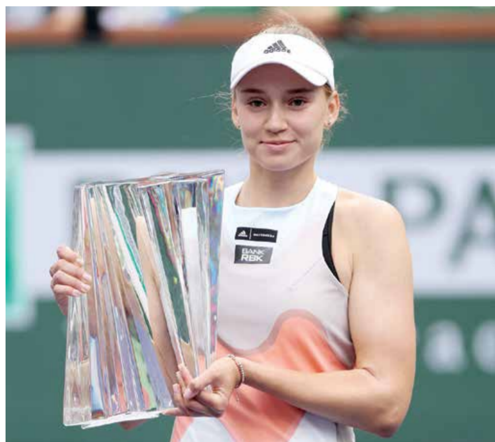
○ إيرينا بلباكيكينا

استعاد الإسباني كارلوس ألكاراز صدارة التصنيف العالمي لرابطة اللاعبين المحترفين الصادر الاثنين، إثر تتويجه بلقب دورة إنديان ويلز الأمريكية، أولى دورات الألف نقطة للماسترز في كرة المضرب، الأحد. واستغل ألكاراز غياب الصربي نوفاك ديوكوفيتش عن الدورة الأمريكية على خلفية عدم تلقيه اللقاح المضاد لفيروس كورونا، كي يزيحه عن الصدارة التي ترعب عليها الإسباني في سبتمبر الماضي بعد تتويجه بلقب بطولة الولايات المتحدة المفتوحة، آخر البطولات الأربع الكبرى، ليصبح بذلك أصغر لاعب يفعل ذلك في التاريخ. ويات ألكاراز يتعد بشارق ٢٦٠ نقطة عن ديوكوفيتش الذي سيغيب أيضا وللسبب ذاته عن دورة ميامي، ثاني دورات الألف نقطة للماسترز، المقرر انطلاقها الأربعاء حتى نهاية الأسبوع المقبل. وكان «دجوكو»، قد حطم الأسبوع قبل الماضي الرقم القياسي المطلق بحوزة الألمانية شتيفي غراف (٣٧٧ أسبوعاً)، وذلك بعد استعادته المركز الأول في يناير إثر تتويجه بلقب بطولة أستراليا في ملبورن، الثانية والعشرين الكبرى في مسيرته بالتساوي مع الأسطورة الإسباني رافاييل نادال. من جهته، صعد الروسي دانييل مدفيديف، وصيف ألكاراز في إنديان ويلز، مرتبة واحدة وصار خامسا أمام الكندي فيليكس أوجيه-إلياسيم الذي ارتقى أربعة مراكز.