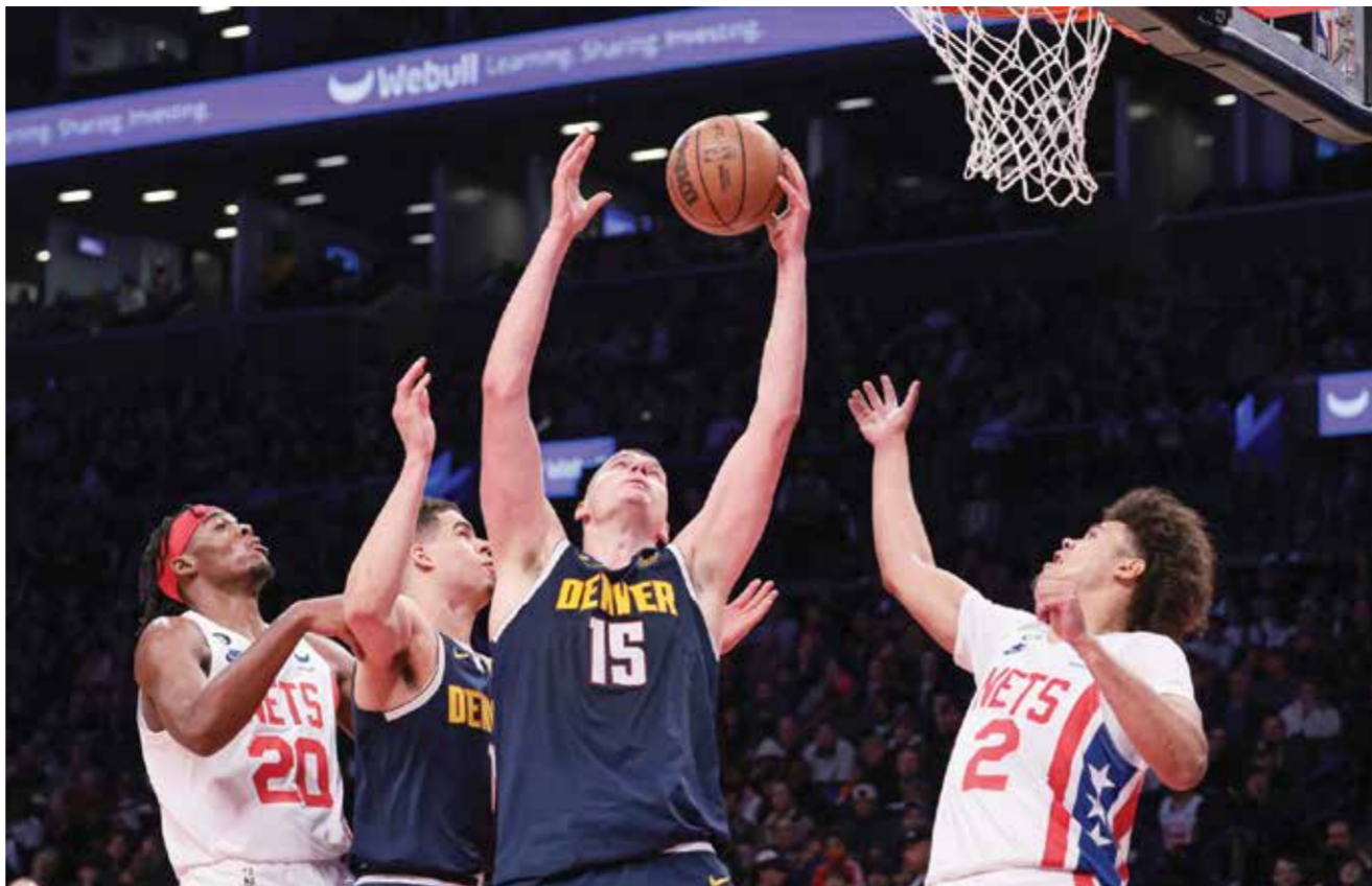
○ جانب من لقاء دنفر ناغتش وبروكلين نتس.