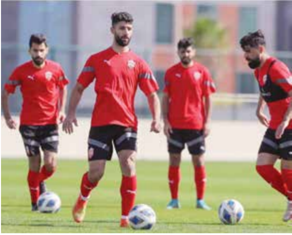
○ جانب من تدريبات منتخبنا