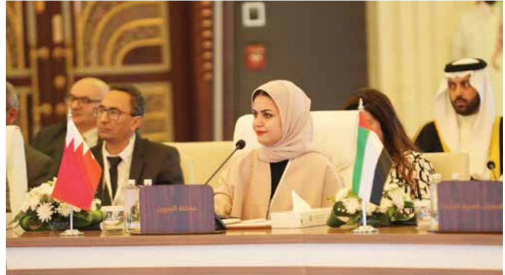
O وزيرة شؤون الشباب خلال مشاركتها في الاجتماع.

كما قدم قطاع الشؤون الاجتماعية بجامعة الدول العربية مشروع استراتيجية عربية للشباب والسلام والأمن ليتم إطلاقها في عام ٢٠٢٣ كأول استراتيجية من نوعها في الوطن العربي والعالم وذلك بهدف التعاون من أجل مشاركة الشباب في قضايا السلام والأمن وتطوير استراتيجيات وطنية حول السلام والأمن من خلال خطة تنفيذية وبرنامج زمني مدته أربعة أعوام.