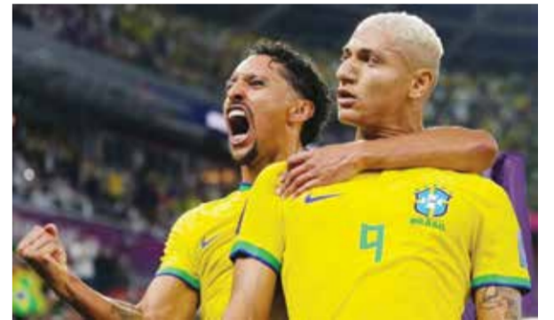
○ ريشارليسون وماركينوس

أعلن الاتحاد الجزائري لكرة القدم الإثنين عبر موقعه الرسمي، أن المدرب جمال بلماضي قرر الاستعانة بخدمات مهاجم السد القطري بغداد بونجاح لتعويض انسحاب إسلام سليمان بسبب الإصابة من التشكيلة المدعوة لمواجهة النيجر ضمن تصفيات أمم إفريقيا ٢٠٢٣. وأوضح الاتحاد الجزائري أن سليمان تعرض لإصابة خلال مباراة فريقه أندرلخت مع مضيفه أود-هيفيرز ليوفن الأحد في المرحلة الثلاثين من الدوري البلجيكي. وانتهت المباراة بفوز أندرلخت بثلاثية نظيفة بينما الهدف الافتتاحي للهدف التاريخي لمحاربي الصحراء (٤١ هدفاً). وتلقت الجزائر مع النيجر في الجولتين الثالثة والرابعة من منافسات المجموعة السادسة في ٢٣ و٢٧ مارس الجاري في الجزائر وملعب حمادي العقربي بمرادس في تونس الذي اختاره الاتحاد الجزائري أرضاً بديلة لمبارياته بسبب عدم اعتماد ملعب الجنرال سيني كونتشي بنيامي غير المطابق لمعايير الاتحاد الدولي للعبة. ويحتل المنتخب الجزائري صدارة المجموعة برصيد ست نقاط من فوزين على ضيفته أوغندا ومضيفته تنزانيا بنتيجة واحدة (٢-صفر) أمام النيجر (نقطتان) وتنزانيا وأوغندا (نقطة واحدة لكل منهما).