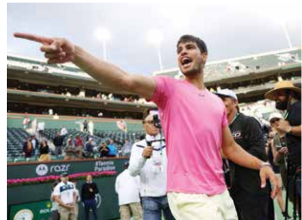
○ كارلوس ألكاراز.

استعاد دنفر ناغتش وميلووكي باكس، متصدرا ترتيب المنطقتين الغربية والشرقية توالياً، توازنهما بفوز الأول على بروكلين نتس ١٠٨-١٠٢ والثاني على تورونتو رابتورز ١١٨-١١١، الأحد في دوري كرة السلة الأمريكي للمحترفين. ودخل ناغتش الذي يبقى الفريق الوحيد الضامن تأهله حتى الآن إلى الأدوار الإقصائية «بلاي أوف»، في المنطقة الغربية، اللقاء على خلفية خسارة أمام نيويورك نيكس كانت الخامسة في ست مباريات، لكنه استعاد الأحد شيئاً من بريقه وعاد منتصراً من ملعب نتس بفضل جهود نجمه الصربي نيكولا يوكيتش بشكل خاص. وحقق يوكيتش ثلاثة أرقام مزدوجة (تريبيل دابل) للمرة الثامنة والعشرين هذا الموسم، بعدما سجل ٢٢ نقطة مع ١٧ متابعاً و ١٠ تمريرات حاسمة، فيما ساهم مايكل بورتر جونور ٢٨ نقطة مع ٩ متابعات. ومهد جمال موراي الطريق أمام ناغتش لتحقيق فوزه الثامن والأربعين في ٧٢ مباراة هذا الموسم بعدما سجل ٢٠ من نقاطه الـ ٢٥ في الربع الأول الذي أنهاه فريقه لصالحه ٣٣-٢١. وكان ناغتش موفقاً تماماً في اللقاء بعدما نجح في ٦٠,٥ بالمئة من محاولاته في الشوط