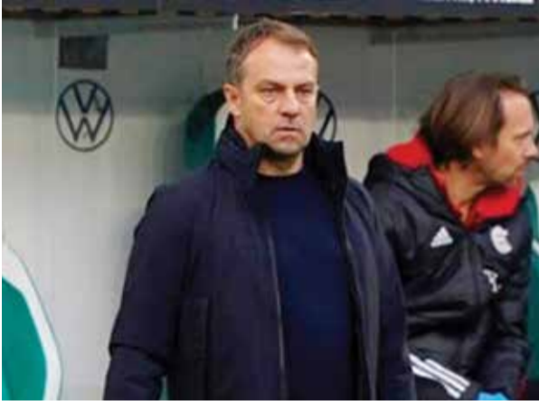
○ هانزي فليك

أعلن برشلونة متصدر ترتيب الدوري الإسباني لكرة القدم الإثنين، أن مدافعه الأوروغوياني رونالد أراوخو تعرض لإصابة في الفخذ خلال الفوز على ريال مدريد في «الكلاسيكو» الأحد. وخاض الدولي الأوروغوياني كامل المباراة التي فاز فيها برشلونة ٢-١ وسجل هدفا عكسيا ضد ناديه. لكن الانتصار أبعد النادي الكاتالوني في الصدارة بفارق ١٢ نقطة عن منافسه وغريمه الملكي. وقال «بلاوغرانا» في بيان إن «رونالد أراوخو أصيب بإجهاض في العضلة المقترية لفخذه الأيسر ولن يتمكن من اللعب حتى تعافيه». من دون الإشارة إلى مدة غياب المدافع البالغ ٢٤ عاماً عن الملاعب. وخاض أراوخو ٢٢ مباراة في مختلف المسابقات مع برشلونة هذا الموسم.