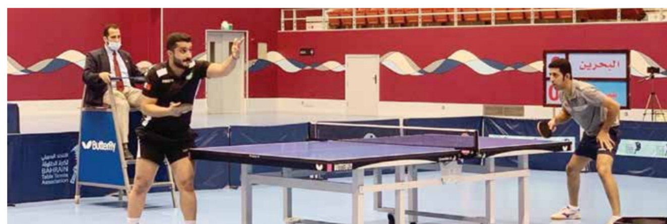
○ لقطة من منافسات الدوري.

ويستعد المنامة المتأهل إلى تأكيد تفوقه على السد القطري الذي فاز عليه ذهابا بنتيجة ٩٩/٩٤، كما يتطلع المنامة من خلال الفوز اليوم إلى استعادة نغمة الانتصارات والثقة خاصة بعد خسارته الثقيلة أمام الكويت في الجولة الماضية بنتيجة ١٠٦/٧٨، يضاف إليها خسارتان على المستوى المحلي أمام الأهلي والنجمة وفقدان الصدارة والدخول في دوامة الحسابات من أجل التأهل