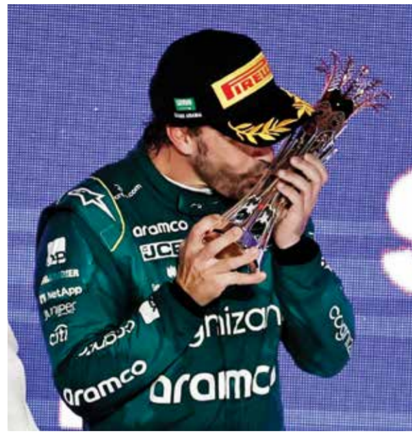
○ فرناندو ألونسو.