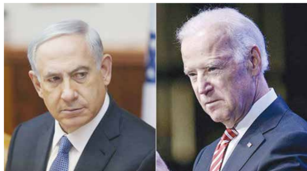
○ جو بايدن وبنيامين نتنياهو.

رام الله - (ا ف ب): استنكر رئيس الوزراء الفلسطيني محمد أشتية أمس الإثنين تصريحات وزير المالية الإسرائيلي اليميني المتطرف بتسليم سموريتش حول عدم وجود شعب فلسطيني بأنها «تحريرية» ودليل «قاطع على الفكر الصهيوني العنصري المتطرف». وقال أشتية «هذه التصريحات التحريضية منسجمة مع المقولات الصهيونية الأولى «أرض بلا شعب لشعب بلا أرض»، وأن الأراضي الفلسطينية (متنازع عليها)، وأنها أرض الميعاد... ادعاءات وأهية وهمية». وكان سموريتش صرح في باريس يوم الأحد خلال إحياء ذكرى وفاة الناشط الفرنسي الإسرائيلي المقرب من اليمين الإسرائيلي جاك كوفنر «لا يوجد فلسطينيون لأنه لا يوجد شعب فلسطيني»، وفق ما جاء في مقطع مصور تم تداوله عبر مواقع التواصل الاجتماعي.