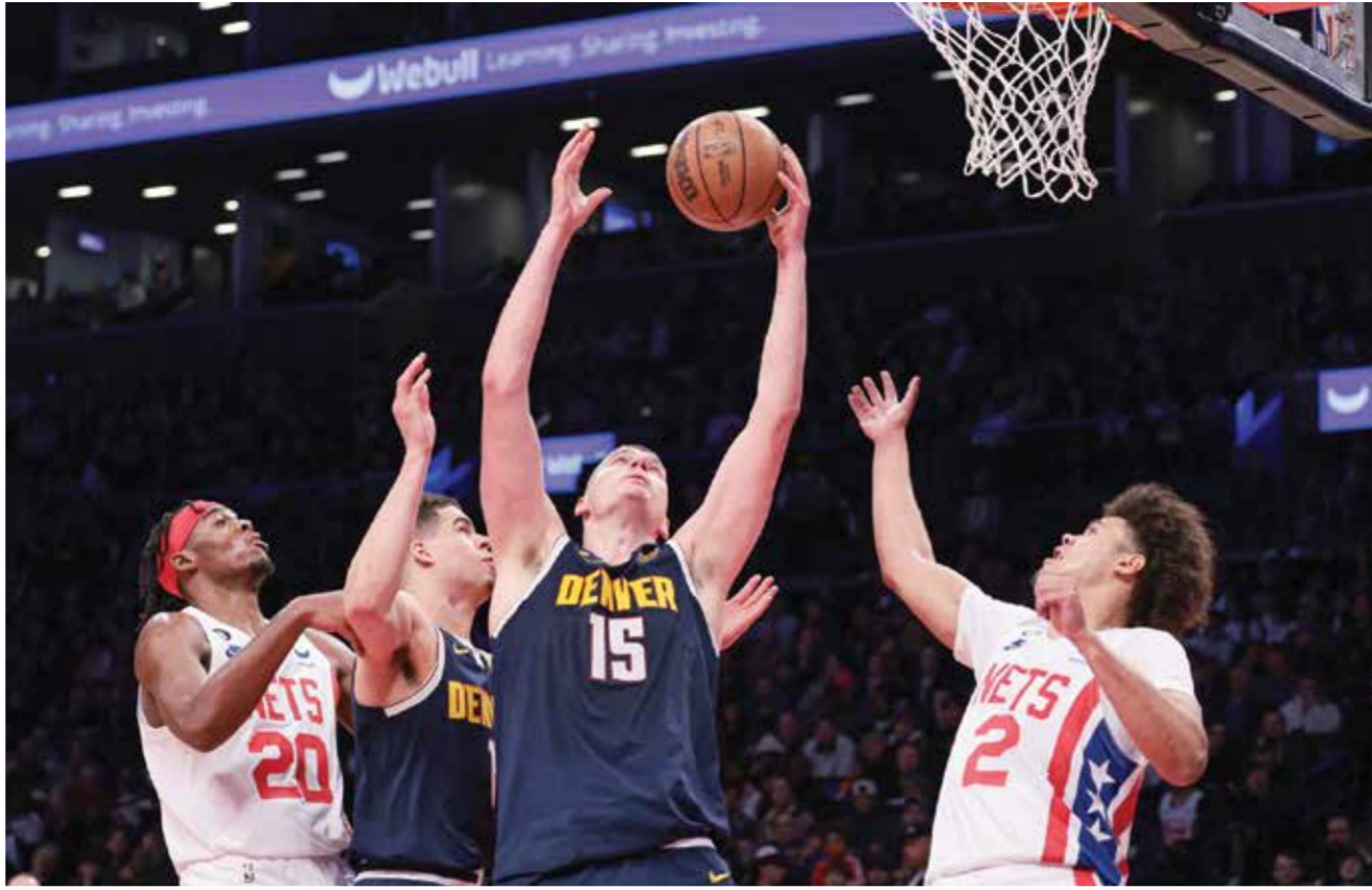
○ جانب من لقاء دنفر ناغتش وبروكلين نتس.