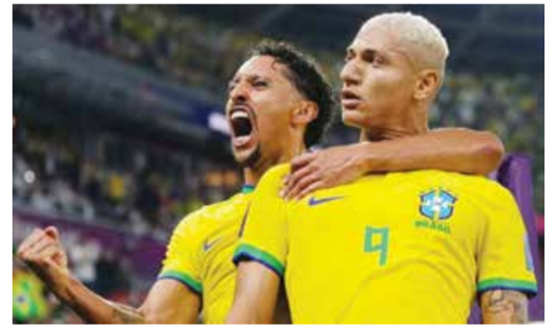
○ ريشارليسون وماركينوس

أعلن الاتحاد الجزائري لكرة القدم الإثنين عبر موقعه الرسمي، أن المدرب جمال بلماضي قرر الاستعانة بخدمات مهاجم السد القطري بغداد بونجاح لتعويض انسحاب إسلام سليمان بسبب الإصابة من التشكيلة المدعوة لمواجهة النيجر ضمن تصفيات أمم إفريقيا ٢٠٢٣. وأوضح الاتحاد الجزائري أن سليمان تعرض لإصابة خلال مباراة فريقه أندراخت مع مضيفه أود-هيفيرز ليوفن الأحد في المرحلة الثلاثين من الدوري البلجيكي. وانتهت المباراة بفوز أندراخت بثلاثية نظيفة بينما الهدف الافتتاحي للهدف التاريخي لمحاربي الصحراء (٤١ هدفاً). وتلقى الجزائر مع النيجر في الجولتين الثالثة والرابعة من منافسات المجموعة السادسة في ٢٣ و٢٧ مارس الجاري في الجزائر وملعب حمادي العقربي بمرادس في تونس الذي اختاره الاتحاد الجزائري أرضاً بديلة لمبارياته بسبب عدم اعتماد ملعب الجنرال سيني كوتشي بنيامي غير المطابق لمعايير الاتحاد الدولي للعبة. ويحتل المنتخب الجزائري صدارة المجموعة برصيد ست نقاط من فوزين على ضيفته أوغندا ومضيفته تنزانيا بنتيجة واحدة (٢-٠ صفر) أمام النيجر (نقطتان) وتنزانيا وأوغندا (نقطة واحدة لكل منهما).