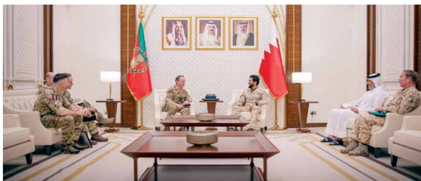
○ سمو اللواء الركن الشيخ ناصر بن حمد مستشار الأمن الوطني قائد الحرس الملكي خلال لقاء العميد نيك كاولي.