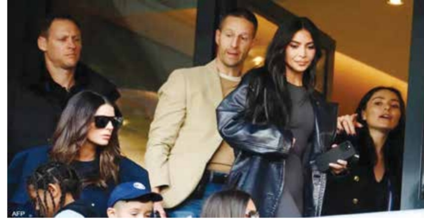
○ كيم كارداشيان خلال مباراة باريس سان جرمان.

على مواقع التواصل الاجتماعي، بسبب حضورها مباراتين تعرض فيهما صاحب الأرض القوي لهزيمة مفاجئة، وتترقب