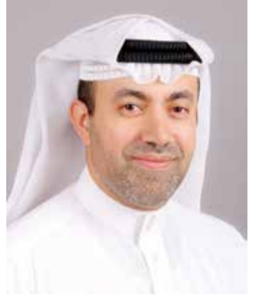
○ باسم المؤذن

وقال محمود إن المباراة النهائية كانت قوية من الطرفين رغم الفارق في الأشواط؛ وذلك لقوة وبراعة اللاعب الألماني ومكاناته العالية ومقدرته على العودة في اللقاء في أي