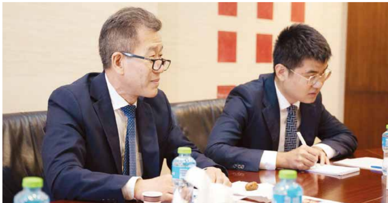
○ السفير الصيني خلال زيارته لأخبار الخليج.