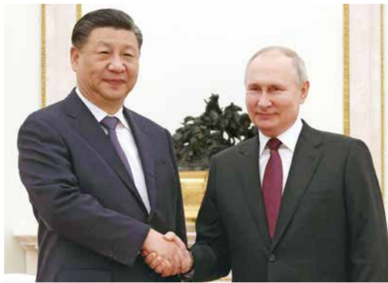
○ القمة تفتتح أفاقاً جديدة من التعاون والصداقة بين البلدين.

أكثر رسمية اليوم وتوقيع اتفاقيات منتظمة لتعميق التعاون الروسي-الصيني.