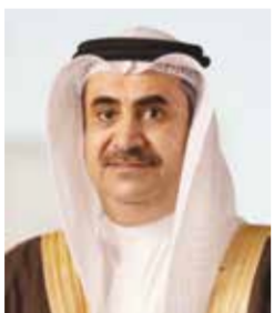
○ النائب العام.

وأكد د. علي بن فضل البوعيين النائب العام أهمية تعزيز حقوق الإنسان في منظومة العدالة الجنائية، لكونه السبيل لسيادة القانون، وهو لن يتأتى إلا باستمرار النهج القائم على التثقيف والتوعية لكافة المعنيين بإفخاذ وتطبيق القانون، وللمواكبة المبادئ والمعايير الوطنية والدولية الحاكمة لحقوق الإنسان على كافة المستويات،