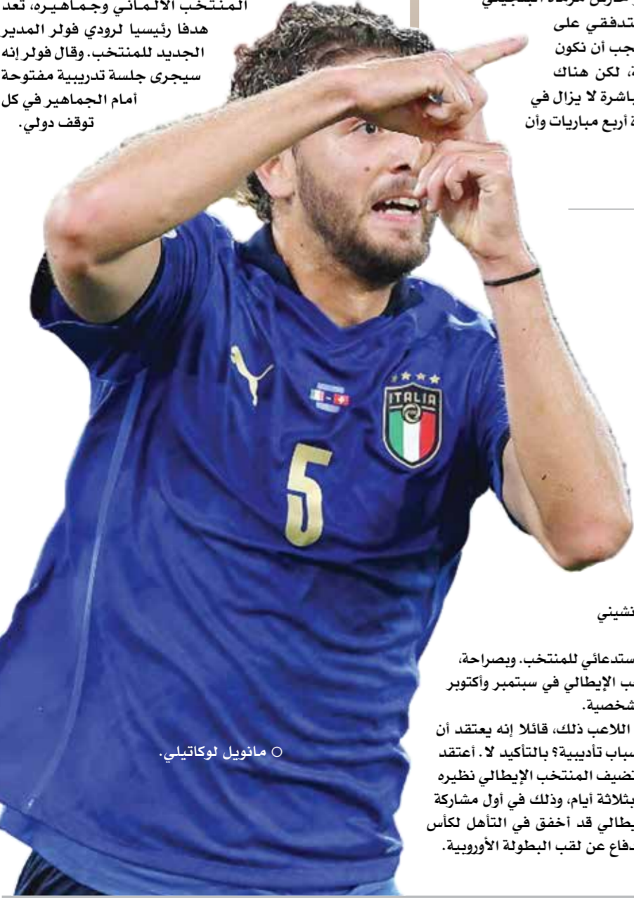
○ مانويل لوكاتيلي

دافع هانزي فليك المدير الفني للمنتخب الألماني لكرة القدم عن استدعاء ما لا يقل عن ستة وجوه جديدة ضمن قائمة المنتخب الألماني لمباراته الودية المقبلتين، ووعده بمحاولة منحهم جميعاً فرصة المشاركة. وقال فليك في مؤتمر صحفي عقد أمس الإثنين: «هذه هي خطتنا. ويجب أولاً أن نرى كيف تسير التدريبات». ويستعد المنتخب الألماني، ممثل الدولة المستضيفة لكأس الأمم الأوروبية «يورو ٢٠٢٤»، لخوض وديتين أمام بيرو وبلجيكا في ماينز وكولونيا يومي السبت والثلاثاء المقبلين، على الترتيب. ويعمل فليك حالياً على إعادة بناء الفريق وتحصينه مساره بعد الخروج من دور المجموعات بكأس العالم للنسخة الثانية على التوالي. وقال فليك: «من المهم للغاية أن نبني الفريق على جميع الجوانب»، وأضاف أنه يريد: «رؤية من لديه القدرة على المشاركة في البطولة الأوروبية». وقال فليك إنه استدعى جوشوا فاغنمان وماتيو كولف وفيليكس نيمشا ومالك ثياو وميرجيم بيريشا وكيفن شفايد: «لأننا ندرك إمكاناتهم». كذلك دافع فليك عن قراره بعدم استدعاء عناصر بارزة أمثال توماس مولر وإلكاي جونودجان وليروي ساني ونيكلاس زوله. وقال فليك: «كان من الممكن أن نجلهم معنا، وكان سيسعدنا التواجد هنا. لن تكون هناك إمكانية لمشاركتهم». وتجدر الإشارة إلى أن إعادة التقارب بين المنتخب الألماني وجماهيره، تعد هدفاً رئيسياً لرودي فولر المدير الفني للمنتخب. وقال فولر إنه سيجري جلسة تدريبية مفتوحة أمام الجماهير في كل توقف دولي.