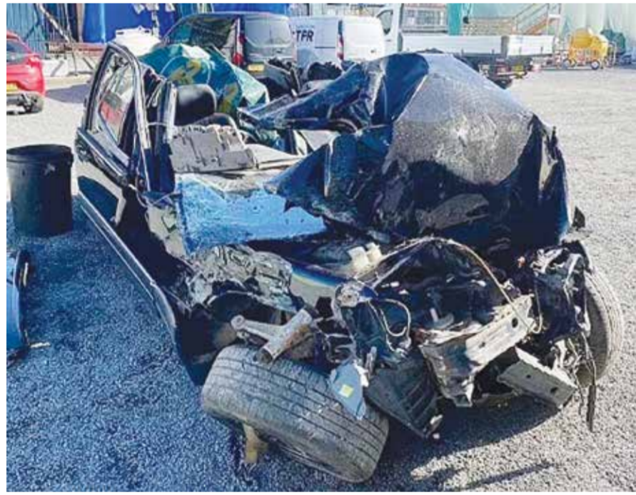
○ صورة السيارة التي أثار الجدل.

أثار مسلسل «ذا كراون»، حالة من الجدل بعد ظهور صور لسيارة مرسيدس محطمة، شبيهة بتلك التي كانت تقل الأميرة ديانا عند وفاتها في حادث مأساوي في عام ١٩٩٧. ويبدو أن هذه السيارة أعيد تصميمها لتكون جزءاً من أحداث الموسم القادم من المسلسل، حيث تصور ليلة وفاة الأميرة ديانا ودودي الفايد بعد تحطم السيارة التي كانا يستقلانها في نفق بونت دي ألما في باريس. وتظهر الصور التي كشفت عنها صحيفة «ديلي ميل» البريطانية نسخة طبق الأصل من السيارة المحطمة بعجلة أمامية ملتوية وغطاء محرك وزجاج أمامي محطم. وأشارت التقارير إلى أن هذه السيارة تم نقلها إلى باريس سراً، وتم إخفاؤها تحت غطاء من القماش المشمع، وهي أيضاً واحدة من مركبتين تم نقلهما العام الماضي إلى باريس للتصوير. وكان قد تم تأكيد إطلاق الموسم الخامس من المسلسل الذي نتجته «نتفليكس»، والذي نال استحسان النقاد العام الماضي، ويركز الموسم السادس والأخير من المسلسل على حياة العائلة المالكة من أواخر التسعينيات إلى أوائل القرن الحادي والعشرين.