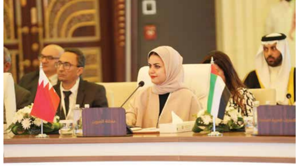
○ وزيرة شؤون الشباب خلال مشاركتها في الاجتماع.

كما قدم قطاع الشؤون الاجتماعية بجامعة الدول العربية مشروع استراتيجية عربية للشباب والسلام والأمن ليتم إطلاقها في عام ٢٠٢٣ كأول استراتيجية من نوعها في الوطن العربي والعالم وذلك بهدف التعاون من أجل مشاركة الشباب في قضايا السلام والأمن وتطوير استراتيجيات وطنية حول السلام والأمن من خلال خطة تنفيذية وبرنامج زمني مدته أربعة أعوام.