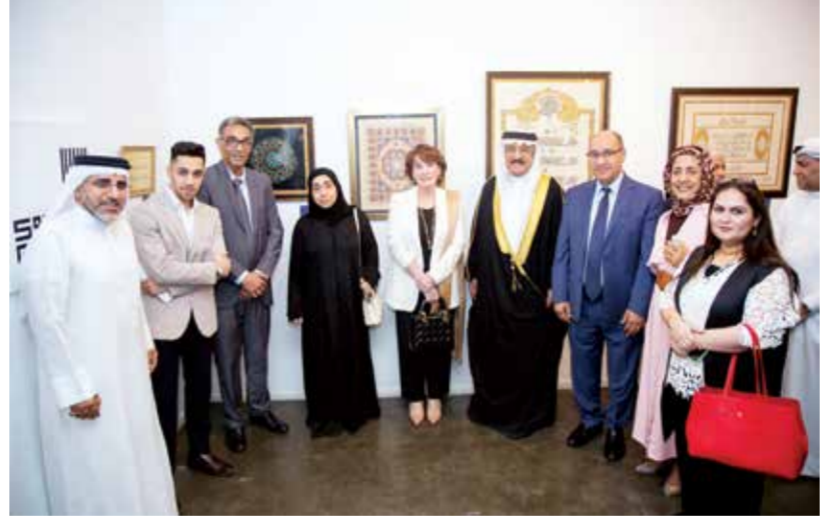
البروفيسور الحواج يفتتح معرض «أثر» للخطاطات.. ويؤكد: نطمح أن تصل إبداعات المرأة البحرينية إلى المحافل العالمية

الدراسات الاستراتيجية والدولية والطاقة (دراسات) استطلاعاً للرأي لقياس وعي المواطنين والمقيمين بالمتلازمات الآتية الداون، والمارفان، والكلينفلتر على عينة تمثل شرائح المجتمع كافة، وذلك في إطار حرص (دراسات) على الإسهام بقياس وعي المواطنين والمقيمين بمختلف القضايا، ونظراً إلى اعتبار التوعية الصحية عاملاً حاسماً في الوقاية من وقوع الأشخاص تحت خطر الأمراض المختلفة ومن بينها الأمراض الجينية. ويهدف الاستطلاع إلى التعرف على مدى الوعي المجتمعي حول هذه الأمراض الجينية، وأبرز أعراضها، علاوة على أهمية الكشف المبكر، والتحديات التي تواجه البعض من حملة هذه الأمراض في الإنجاب، وإذا كان يمكن الكشف عن مثل هذه الأمراض عند الجنين، كما يهدف الاستطلاع إلى تقصي الآراء حول ضرورة