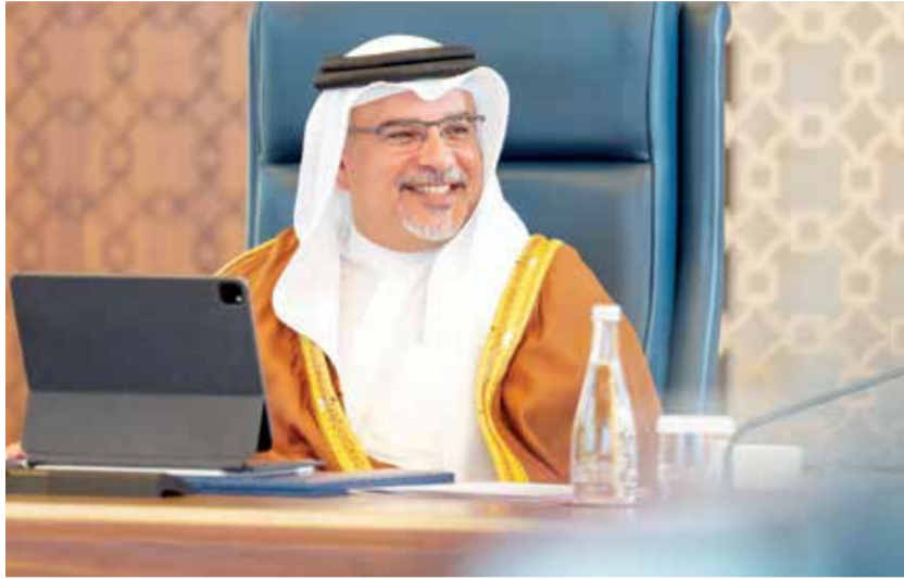
○ سمو ولي العهد رئيس الوزراء خلال ترؤسه الجلسة.