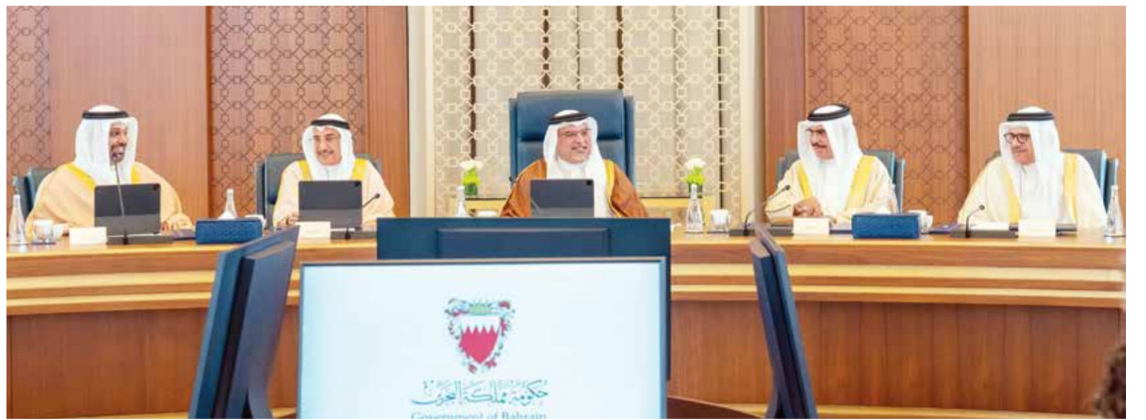
○ سمو ولي العهد رئيس مجلس الوزراء خلال ترؤسه الجلسة.