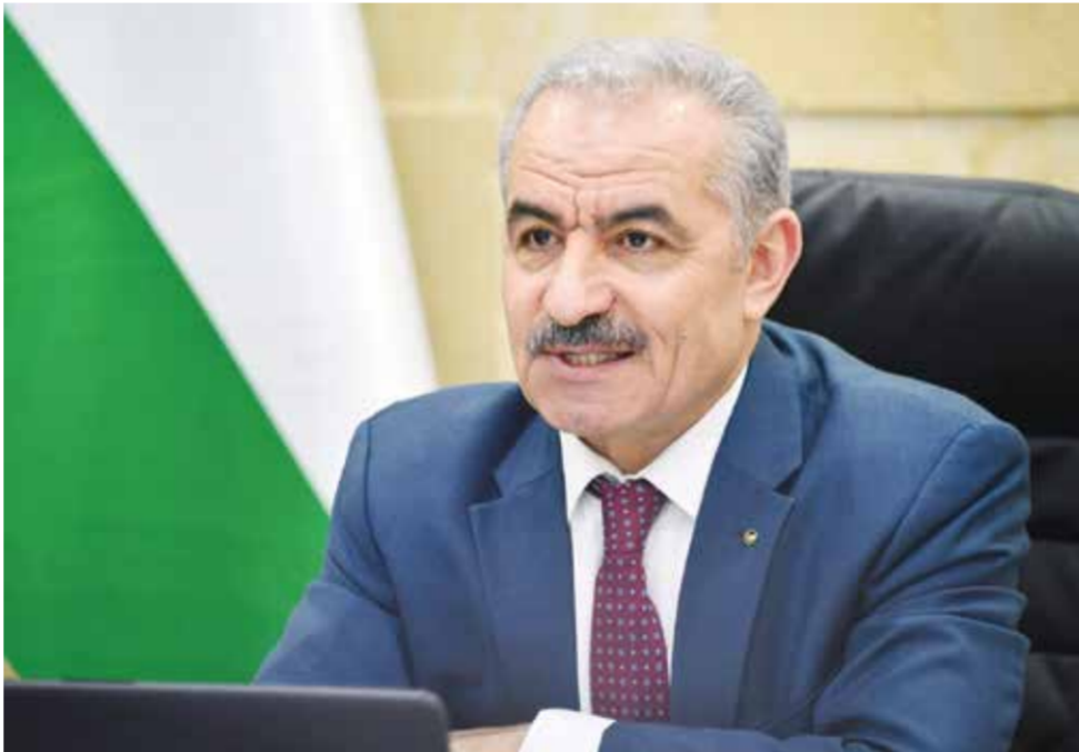
○ رئيس الوزراء الفلسطيني.

وفي مقال نشرته صحيفة روسيسكايا غازيتا الروسية، وصف الرئيس الصيني الزيارة بأنها «زيارة صداقة وتعاون وسلام». وأكد بوتين لشي أمس الاثنين: «لدينا الكثير من المهام والأهداف المشتركة». وتهدف القمة أيضا إلى إظهار التضاهم بين روسيا والصين في وقت تشهد الدولتان