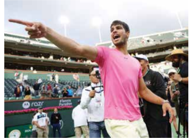
○ كارلوس ألكاراز.

انضمت المصنفة أولى عالمياً في التنس إيغا شفيونتيك، إلى صانع التجهيزات الرياضية «أون»، المملوك من الأسطورة السويسرية روجيه فيدرر، بحسب ما أعلنت البولندية الإثنين على وسائل التواصل الاجتماعي. قالت شفيونتيك التي اعتمدت سابقاً صانع التجهيزات الياباني «إيسيكس»، «يسعدني أن أعلن أنني أول لاعبة تنس لدى أون». كما أعلنت العلامة التجارية السويسرية التي بدأت في تطوير أحذية الجري والتجوال مسافات طويلة، عن التوقيع مع اللاعب الأمريكي بن شيلتون البالغ ٢٠ عاماً والذي بلغ ربح نهائي بطولة أستراليا المفتوحة في يناير الماضي من خلال مشاركته الأولى في البطولة الكبرى. قال فيدرر، حامل لقب بطولة كبرى والذي اعتزل العام الماضي: «يمثل إيغا أون ببراعة الجيل المقبل من الموهوبين في كرة المضرب. يتقاسم هذان اللاعبان روحية أون التنافسية ويتساiban تماماً مع تاريخ أساطير التنس». وبدأ فيدرر (٤١ عاماً) الاستثمار في الشركة عام ٢٠١٩ وصمم أول أحذيتها الخاصة بكرة المضرب.