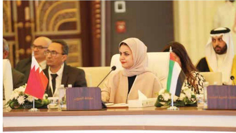
○ وزيرة شؤون الشباب خلال مشاركتها في الاجتماع.

كما قدم قطاع الشؤون الاجتماعية بجامعة الدول العربية مشروع استراتيجية عربية للشباب والسلام والأمن ليتم إطلاقها في عام ٢٠٢٣ كأول استراتيجية من نوعها في الوطن العربي والعالم وذلك بهدف التعاون من أجل مشاركة الشباب في قضايا السلام والأمن وتطوير استراتيجيات وطنية حول السلام والأمن من خلال خطة تنفيذية وبرنامج زمني مدته أربعة أعوام.