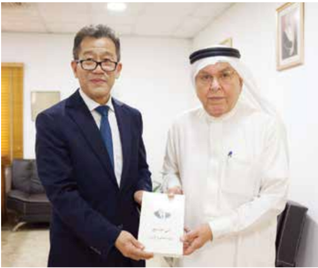
○ السفير الصيني يقدم كتاباً إلى رئيس التحرير.