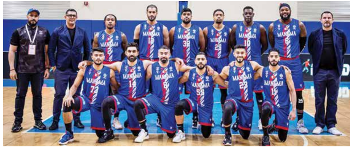
○ فريق المنامة لكرة السلة.

ويتصدر الكويت الكويتي المجموعة برصيد ١٠ نقاط من خمسة انتصارات دون أي خسارة، يليه المنامة ثانيا برصيد ٨ نقاط من ثلاثة انتصارات وخسارتين، ويأتي النصر السعودي ثالثا برصيد ٦ نقاط ثم السد القطري برصيد ٦ نقاط مع الأفضلية لأول في فارق نقاط التسجيل المواجهات المباشرة.