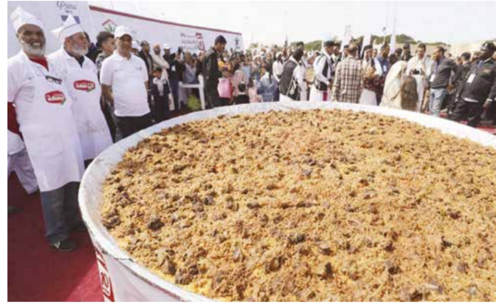
○ طبق الكسكي العملاق في صبراتة.

ونحن فخورون ونعتز به». ومع ذلك، فإن ليبيا هي الدولة الوحيدة في شمال إفريقيا غير المسجلة على أنها معنية بتقاليد الكسكس المدرجة منذ عام ٢٠٢٠ ضمن قائمة اليونسكو للتراث الثقافي غير المادي. ويعود ذلك إلى عدم انضمام ليبيا إلى هذه المعاهدة الدولية، وبالتالي عدم خضوعها لشروطها، والأمر كان توسع التنافس بين الدول المغاربية على ملكية هذا الطبق وأصله.