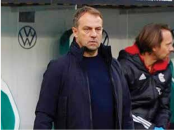
○ هانزي فليك

أعلن برشلونة متصدر ترتيب الدوري الإسباني لكرة القدم الإثنين، أن مدافعه الأوروغوياني رونالد أراوخو تعرض لإصابة في الضخن خلال الفوز على ريال مدريد في «الكلاسيكو» الأحد. وخاض الدولي الأوروغوياني كامل المباراة التي فاز فيها برشلونة ٢-١ وسجل هدفا عكسيا ضد ناديه. لكن الانتصار أبعد النادي الكاتالوني في الصدارة بفارق ١٢ نقطة عن منافسه وغريمه الملكي. وقال «بلاوغرانا» في بيان إن «رونالد أراوخو أصيب بإجهاض في العضلة المقترية لضعفه الأسير ولن يتمكن من اللعب حتى تعافيه». من دون الإشارة إلى مدة غياب المدافع البالغ ٢٤ عاماً عن الملاعب. وخاض أراوخو ٢٢ مباراة في مختلف المسابقات مع برشلونة هذا الموسم.