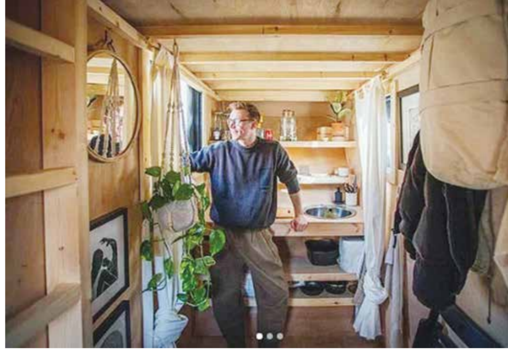
○ المنزل من الداخل والخارج.