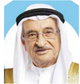
○ الشيخ محمد بن عبدالله.