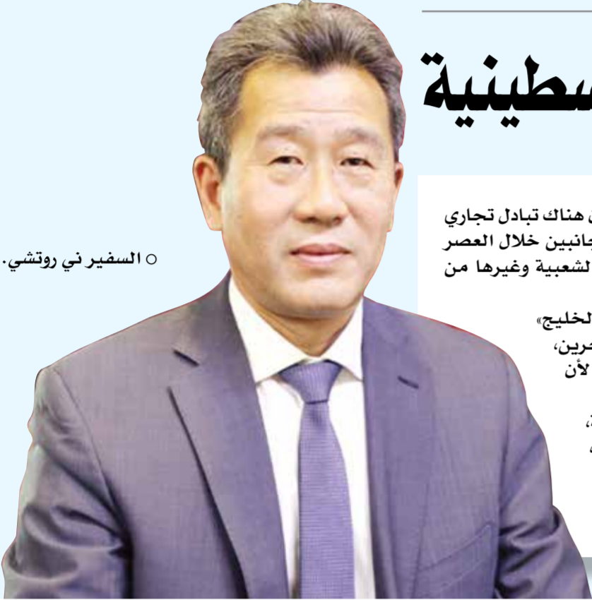
○ السفير ني روتشي.

ونوه السفير بالعلاقات القائمة بين سفارة بلاده وجريدة «أخبار الخليج» وجريدة «جلف ديلي نيوز» باعتبارهما من أهم الصحف في مملكة البحرين، كما قدما مساهمات مهمة في دفع العلاقات البحرينية الصينية، لأن وسائل الإعلام تلعب دوراً حيوياً في التقارب بين الشعبين. ولفت إلى أن الصين ترتبط بعلاقات متميزة مع دول المنطقة، من خلال دعم القضايا العربية وعلى رأسها القضية الفلسطينية، كما أن الصين تحرص على دعم تحقيق الأمن والاستقرار والتنمية وحسن الجوار بين دول المنطقة، مشيراً إلى أن السياسة الصينية في منطقة الشرق الأوسط تلقى ترحيباً من دول المنطقة.