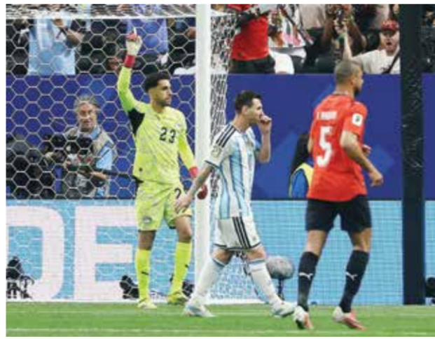
○ ميسي يفضّل تسجيل ركلة الجزاء.

مثل الإيطالي جورجينيو والبرتغالي برونو فرنانديز بطريفة الفنز، المتقطع، والتي حققت بعض النجاح قبل ست أو سبع سنوات. وينفذ معظم مسددي ركلات الجزاء حالياً تقنية الخطوة المتقطعة، ولكن ليس بشكل دائم. وفي فوز إنجلترا على كرواتيا في دور المجموعات، تصدى الحارس لركلة جزاء هاري كاين بعد رضه المتقطع، لكن الحكم أمر بإعادة الكرة لأن الحارس تحرك مبكراً وخرج من خط العرمي. ليسجل كاين من المحاولة الثانية التي نفذها بتسديدة قوية بعد الرض مباشرة نحو الكرة. كما نجح مبابي في التسجيل بطريقة الخطوة المتقطعة ليمتدح فرنسا الفوز 1 / 1 صفر على باراجواي في دور الـ16، وكذلك كريستيانو رونالدو في فوز البرتغال 2 / 1 على كرواتيا في نفس المرحلة، ولجأ إليها نيمار في ظهوره الدولي الأخير خلال الخسارة أمام النرويج. ولكن حراس العرمي أصبحوا أكثر وعياً بمحاولات التسديد بهذه الطريقة، وعندما تفشل هذه المحاولات، يبدو مسدود ركلات الجزاء وكأنهم غير محترفين أو يتسمنون بالاربعونة.