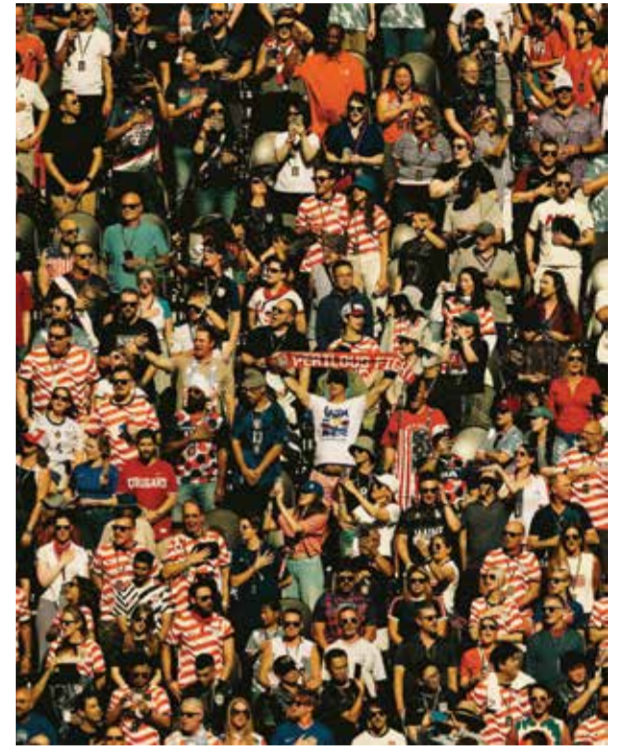
○ من جماهير المونديال

مثل الإيطالي جورجينيو والبرتغالي برونو فرنانديز بطريفة الفنز، المتقطع، والتي حققت بعض النجاح قبل ست أو سبع سنوات. وينفذ معظم مسددي ركلات الجزاء حالياً تقنية الخطوة المتقطعة، ولكن ليس بشكل دائم. وفي فوز إنجلترا على كرواتيا في دور المجموعات، تصدى الحارس لركلة جزاء هاري كاين بعد رضه المتقطع، لكن الحكم أمر بإعادة الكرة لأن الحارس تحرك مبكراً وخرج من خط العرمي. ليسجل كاين من المحاولة الثانية التي نفذها بتسديدة قوية بعد الرض مباشرة نحو الكرة. كما نجح مبابي في التسجيل بطريقة الخطوة المتقطعة ليمتدح فرنسا الفوز 1 / 1 صفر على باراجواي في دور الـ16، وكذلك كريستيانو رونالدو في فوز البرتغال 2 / 1 على كرواتيا في نفس المرحلة، ولجأ إليها نيمار في ظهوره الدولي الأخير خلال الخسارة أمام النرويج. ولكن حراس العرمي أصبحوا أكثر وعياً بمحاولات التسديد بهذه الطريقة، وعندما تفشل هذه المحاولات، يبدو مسدود ركلات الجزاء وكأنهم غير محترفين أو يتسمنون بالاربعونة.