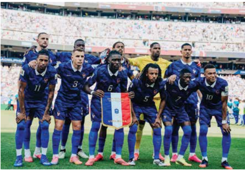
○ منتخب فرنسا.

واشنطن - (د ب أ): لم تخلُ بطولة كأس العالم 2026 من الإثارة والتشويق، حيث تنافست نخبة كرة القدم العالمية للفوز باللقب الثمين. ومع اقتراب مباريات ربع النهائي الحاسمة، من المفاجئ أن تصبح معظم المنتخبات المتنافسة على اللقب في المراكز المتقدمة من تصنيف فيفا العالمي. ويتيح التحديث المباشر للتصنيف، وهو ابتكار نسّم إطلاقه خلال فترة التوقف الدولي في أبريل، متابعة أبرز المنتخبات الخمسة قبل مباريات ربع النهائي المثيرة. ويقدم فيفا تحليلاً شاملاً لأوضاع المنتخبات المشاركة في المواجهات الأربع، التي ستشهد كل منها مواجهة أبطال العالم السابقين ضد منتخبات تسعى لتتوق طعم المجد لأول مرة. ويتصدر المنتخب الفرنسي الترتيب في مواجهة المنتخب المغربي الصاعد بقوة.