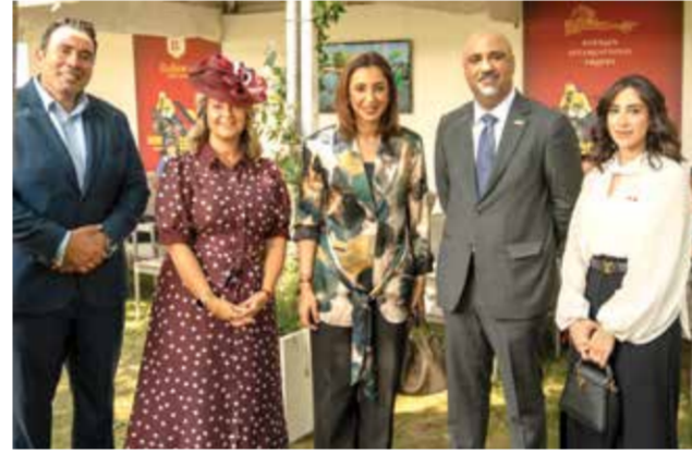
○ جانب من الحضور.

في إطار العلاقات الوثيقة والتعاون المشترك بين مملكة البحرين والمملكة المتحدة الصديقة في مختلف المجالات، وخصوصاً في مجال الفروسية وسباقات الخيل، أقيم سباق كأس مملكة البحرين ضمن فعاليات مهرجان يوليو على مضمار نيوماركت العريق بالمملكة المتحدة، وذلك تزامناً مع الاحتفاء بذكرى اليوم الوطني بمناسبة مرور 50 عاماً على إنشاء نادي راشد للفروسية وسباق الخيل.