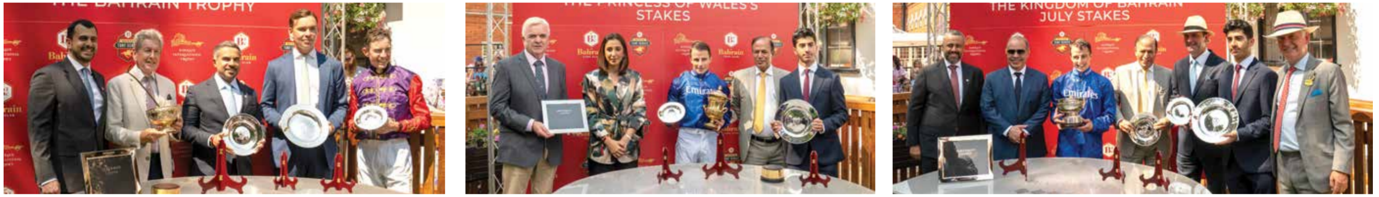
○ جانب من تتويج الفائزين.