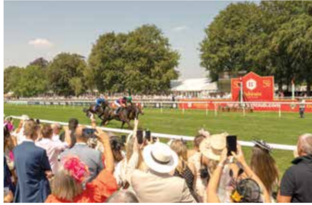
○ جانب من المنافسات.