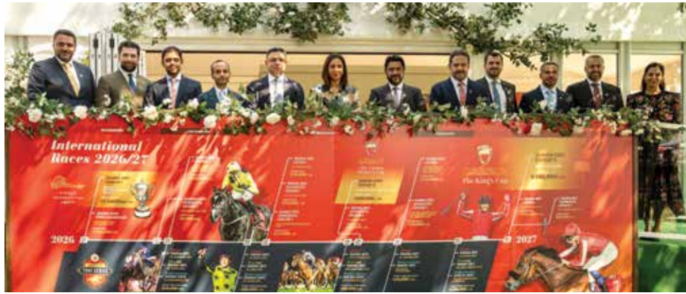
○ حضور رسمي كبير.