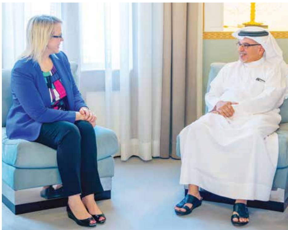
○ سمو ولي العهد رئيس الوزراء خلال استقباله السفيرة الأمريكية.