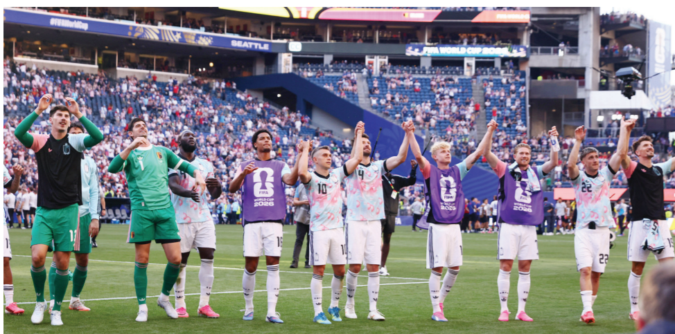
لاعبو بلجيكا يحيون الجماهير.

وأشار: «الحكم تغاضي عن احتساب ركلة جزاء لنا، وألغى هدفا لسبب غير مفهوم». وواصل: «لقد واجهنا بطل العالم، لكن منتخب الأرجنتين يبدو أنه يحظى بمساندة لاعتبارات تسويقية لضمان استمرار ميسي وحامل اللقب في كأس العالم». وشدّد: «لا أحب الخسارة بطبعي، وخاصة عندما تكون ظالمة، وأعتذر لجمهيراتنا، وأقول لهم أنا أسف، كنا نتمنى إسعادكم، وهدفنا كان الوصول إلى مرحلة أبعاد، وأقول لهم لا تحزنوا». واستطرد: «لقد شكلنا فريقاً مشرفاً لمصر في وقت قصير، وطموحاً لا يتوقف، نريد أن نواصل مشوارنا، دخلنا عمق الكرة العالمية». وختم حسام حسن: «لقد أثبتنا أننا لا نهاب أهدا، رغم أن قوامنا أغلبيه لاعبون في الدوري المحلي بينما تواجه منتخبات تضم عدداً كبيراً من المحترفين في أوروبا».