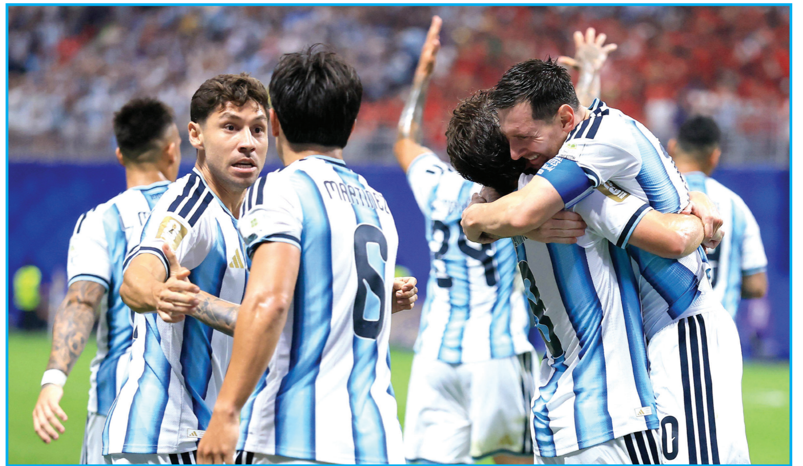
فرحة لاعبي الأرجنتين بانتاهل