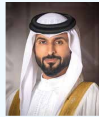
○ سمو الشيخ ناصر بن حمد آل خليفة.

تقديم مستوى مشرف في بطولة العالم، متمنياً له دوام التوفيق والنجاح، ولجمهورية مصر العربية المزيد من الإنجازات في مختلف المحافل الرياضية الدولية. ويأتى تأهل مصر إلى بطولة العالم كإنجاز عربي يبعث على الفخر، ضمن رؤية سمو الشيخ ناصر بن حمد آل خليفة الهادفة إلى زيادة قاعدة المشاركة العربية في بطولات القدرة الدولية، وإتاحة الفرصة أمام المزيد من الفرسان العرب لتمثيل دولهم في المحافل العالمية، بما يعكس تطور رياضة القدرة في الوطن العربي ومكانتها المتنامية على الساحة الدولية. وجاء تأهل الفارس المصري بعد تحقيقه المركز التاسع في سباق سامورين الدولي للقدرة لمسافة 160 كيلومتراً، مع الجواد «بطاح» من إنتاج إسطنبول الإنتاج التابعة للفريق الملكي البحريني، ليجز رسمياً مقعده في بطولة العالم، في إنجاز غير مسبق على مستوى رياضة القدرة في جمهورية مصر العربية.