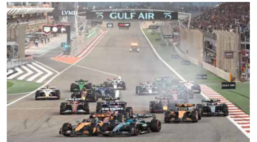
○ من سباقات الفورمولا 1 في حلبة البحرين.