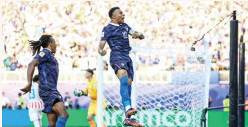
○ مبابي يحتفل بتسجيل هدف الفوز. (أ ف ب)

فيلادلفيا - (أ ف ب): خرج المنتخب الفرنسي ببطاقة العُبر إلى ربع نهائي مونديال 2026، بفوزه على الباراغواي العنيدة (1-0) التي منعت من تقديم أفضل عروضه الهجومية، كما جرت العادة في السابق حين سجل 13 هدفاً في أربع مباريات. وجاء فوز «الزرق» بهدف يتيم سجله كيليان مبابي مهاجم ريال مدريد الإسباني ومن ركلة جزاء، ليرفع رصيده إلى سبعة أهداف في البطولة بالتساوي في صدارة ترتيب الهادفين مع الأرجنتيني ليونيل ميسي، كما قلص الفارق مع الأخير في قائمة الهادفين التاريخيين لكأس العالم (20 مقابل 19).