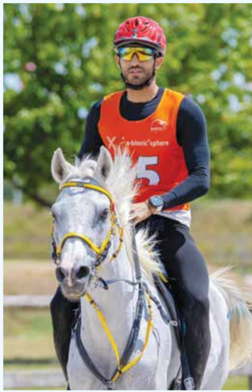
○ الفارس المصري محمود الغريب.

تقديم مستوى مشرف في بطولة العالم، متمنياً له دوام التوفيق والنجاح، ولجمهورية مصر العربية المزيد من الإنجازات في مختلف المحافل الرياضية الدولية. ويأتى تأهل مصر إلى بطولة العالم كإنجاز عربي يبعث على الفخر، ضمن رؤية سمو الشيخ ناصر بن حمد آل خليفة الهادفة إلى زيادة قاعدة المشاركة العربية في بطولات القدرة الدولية، وإتاحة الفرصة أمام المزيد من الفرسان العرب لتمثيل دولهم في المحافل العالمية، بما يعكس تطور رياضة القدرة في الوطن العربي ومكانتها المتنامية على الساحة الدولية. وجاء تأهل الفارس المصري بعد تحقيقه المركز التاسع في سباق سامورين الدولي للقدرة لمسافة 160 كيلومتراً، مع الجواد «بطاح» من إنتاج إسطنبول الإنتاج التابعة للفريق الملكي البحريني، ليجز رسمياً مقعده في بطولة العالم، في إنجاز غير مسبق على مستوى رياضة القدرة في جمهورية مصر العربية.