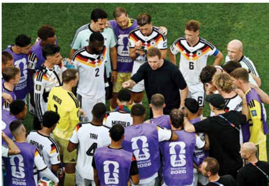
○ ناغلسمان مع لاعبيه

الذي يمتد عقده حتى عام 2028، والذي صرح بعد المباراة بأنه لن يستقيل ويرغب في الاستمرار إذا تم السماح له بذلك. ولم يتحدث ناغلسمان إلى الصحفيين المنتظرين لدى مغادرته مطار ميونخ من الباب الخلفي تحت أمطار غزيرة، وكان نجما بايرن ميونخ الألماني، ألكسندر بافلوفيتش وجمال موسيلا، قد سافرا على متن الطائرة نفسها.