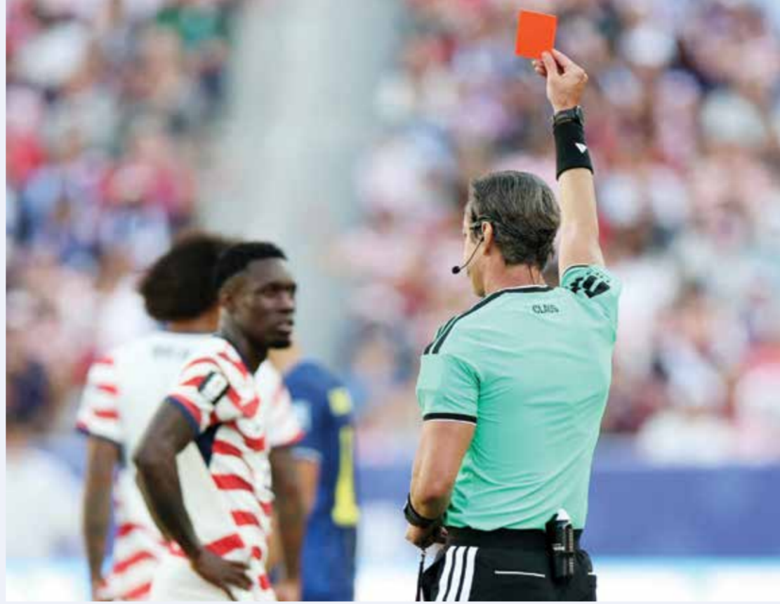
○ طرد بالوغون

ويعتمد منتخب فرنسا على طريقة لعب 4 / 2 / 3، 1. حيث يمنح ديشان اللاعبين حرية الحركة والانسحابية. وشدد جراهام بوتير، مدرب منتخب السويد، على أن منتخب فرنسا هو أفضل فريق رآه في كأس العالم.