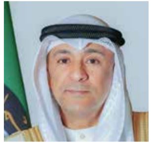
○ جاسم البدوي.

أعرب جاسم محمد البدوي الأمين العام لمجلس التعاون لدول الخليج العربية عن إدانته واستنكاره بأشد العبارات الهجمات الإيرانية الإرهابية على مملكة البحرين ودولة الكويت، بعدد من الصواريخ الباليستية والطائرات المسيّرة. وأكد أن هذه الهجمات