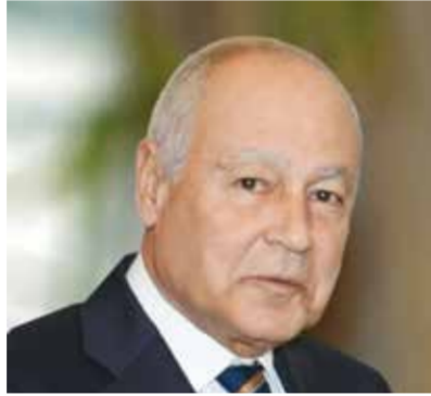
○ أحمد أبو الغيط.

ونقل جمال رشدي المتحدث الرسمي باسم الأمين العام تأكيد أبو الغيط الوقوف إلى جانب مملكة البحرين ودولة الكويت قيادة وشعباً والتضامن الكامل معهما فيما يتخذانه من إجراءات وخطوات لوقف الاعتداءات الإيرانية الغاشمة عليهما، داعياً كل الأطراف المعنية إلى الالتزام بخفض التصعيد ودعم الجهود الرامية إلى التهدئة وصولاً إلى وقف مستدام لإطلاق النار.