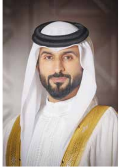
○ سمو الشيخ ناصر بن حمد آل خليفة.

للوطن» وتابع سموه: «نحرص على توفير برامج نوعية تتيح للشباب والفنيات اكتساب الخبرات والمهارات الحياتية التي تعزز جاهزيتهم للمستقبل، وتعرفهم بالدور الوطني الكبير الذي تقوم به الأجهزة العسكرية والأمنية في حماية الوطن وصون منجزاته، بما يعزز لديهم قيم الولاء والمواطنة الإيجابية». ويوفر المعسكر تجربة تدريبية مكثفة بإجمالي 30 ساعة تدريبية، حيث يخوض المشاركون برنامجاً يمتد على مدى 6 أيام لكل مجموعة، يومياً من الساعة التاسعة صباحاً حتى الثانية ظهراً، ضمن بيئة تدريبية متكاملة داخل مركز البحرين العالمي للمعارض. ويُنقل المشاركون خلال المعسكر بين عدد من الميادين والتحديات المصممة لاختبار التحمل والتركيز وسرعة الاستجابة، إلى جانب اكتساب مهارات حياتية تساهم في بناء شخصية أكثر اعتماداً على النفس وقدرة على تحمل المسؤولية، فضلاً عن التعرف بصورة عملية على طبيعة العمل العسكري والأدوار التي