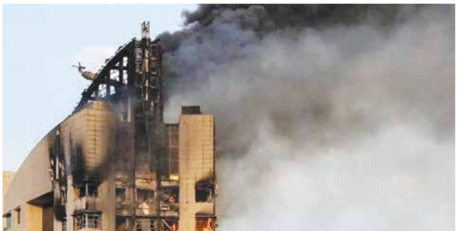
○ من الاعتداءات الإيرانية على الكويت. (أرشيفية)

والعدوان الإرهابي الحالي على دول مجلس التعاون يأتي في سياق هذا النهج وهذه الاستراتيجية الإيرانية. هذا العدوان تم التخطيط له منذ فترة طويلة قبل أن تنشب الحرب. لم يخطط النظام الإيراني للعدوان العسكري الإرهابي المباشر على دولنا فقط، وإنما خطط مبكرا لإنشاء شبكات التجسس والتآمر والتخاير في دول مجلس التعاون على نحو ما تم الكشف عنه