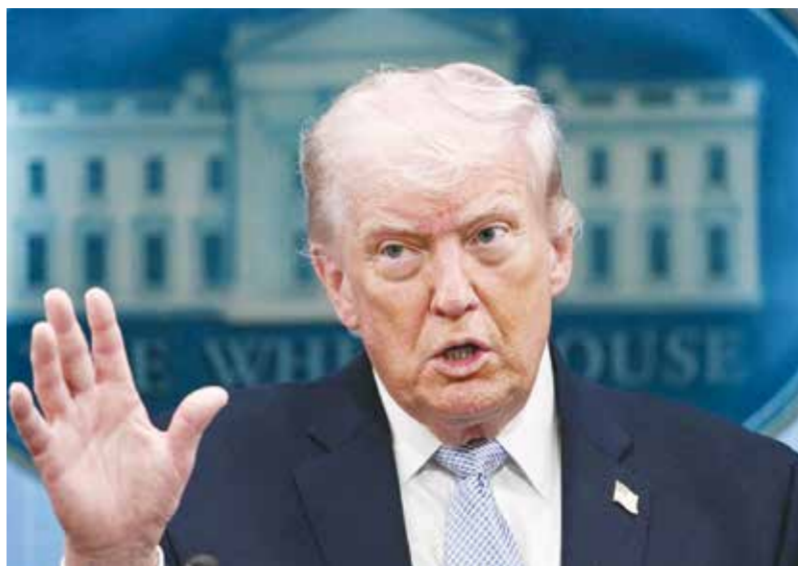
○ دونالد ترامب.

خلال مرورها بالقرب من مضيق هرمز «محملة بأكثر من مليوني برميل من النفط الخام». وورد الحرس الثوري الإيراني أمس، بشن اعتداءات على الكويت والبحرين.