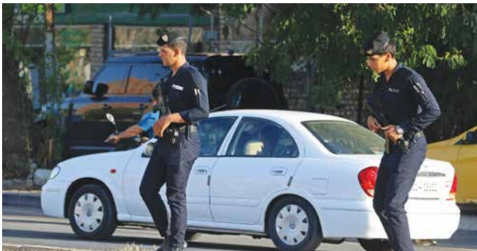
لو كالة فرانس برس.

ويقيم في هذه المنطقة المحصنة الواقعة في وسط العاصمة العراقية، مسؤولون حكومات سابقين ونواب، وتقع فيها كذلك مقار مكاتب حكومية ومؤسسات دولية وبعثات دبلوماسية بينها السفارة الأمريكية. وأظهرت مقاطع فيديو جرى تداولها على تطبيق «تلغرام» قوات أمنية تستخدم مركبات ثقيلة بينها بابات داخل المنطقة الخضراء، إضافة إلى لقطات لرجال أمن داخل مجمع سكني وأخرى داخل منزل.