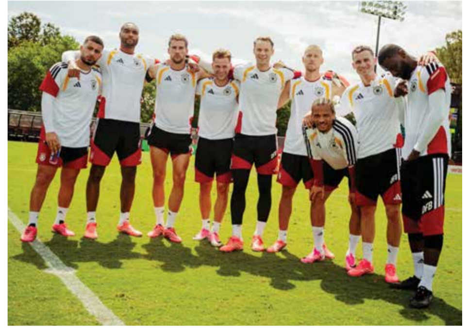
○ لاعبو ألمانيا.

وسجل ميسي خمسة أهداف في أول مباراتين للأرجنتين بالنسخة الحالية للبطولة، المقامة حاليا في الولايات المتحدة والمكسيك وكندا، محققا رقما قياسيا جديدا لأكثر عدد من الأهداف في تاريخ كأس العالم برصيد 18 هدفا. في المقابل، أحرز مبابي أربعة أهداف مع فرنسا، ليحتل المركز الثاني في قائمة الهدافين التاريخيين للمونديال، مناصفة مع الألماني المعتزل ميروسلاف كلوزه، برصيد 16 هدفا لكل منهما. وقال مبابي: «ليو يسجل دائما. سيظل يسجل. إذا أردت أن أرى ما يفعله ليو، يتعين علي أن أبدأ جهدا أكبر». وميسي ومبابي ليسا الوحيدين