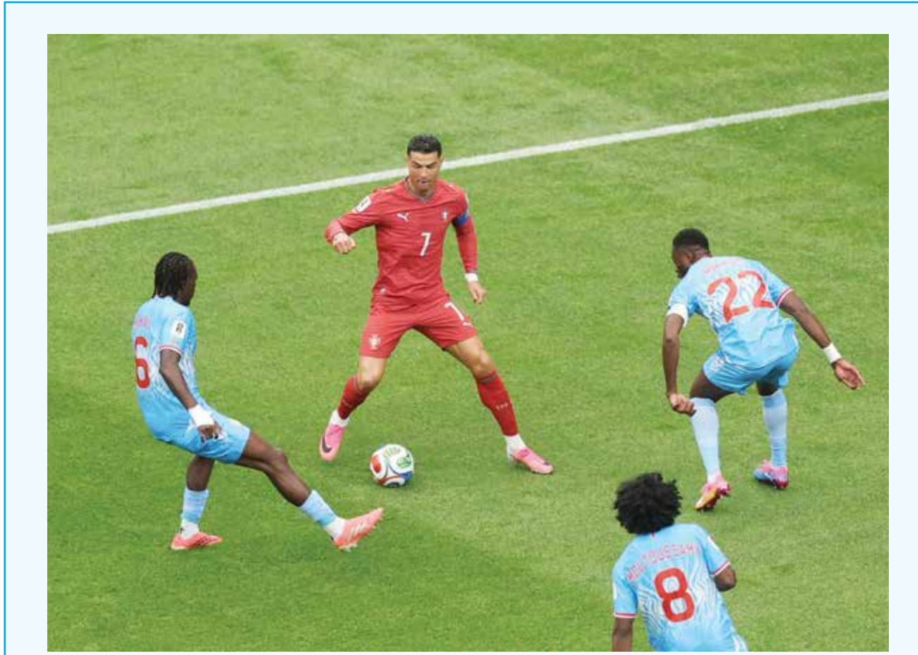
○ موكاو يواجه رونالدو

دالاس - (د ب أ): اشتكى توماس توخل، المدير الفني للمنتخب الإنجليزي، من عدم قدرته على رؤية لاعبيه وهم يرددون النشيد الوطني بسبب كثرة عدد المصورين أمامه، وطالب الاتحاد الدولي لكرة القدم (فيفا) بضرورة التدخل. وقاد المدرب الألماني المنتخب الإنجليزي للفوز على كرواتيا 4 / 2 في افتتاح مشوار الفريقين بطولة كأس العالم 2026. لكن توخل لم يكن سعيداً في أول مباراة له مع الفريق في بطولة كبرى، لأنه لم يتمكن من رؤية لاعبيه أثناء أداء نشيد «فليحفظ الله الملك». وقال توخل في تصريحات، أبرزتها وكالة الأنباء البريطانية (بي إيه ميديا): «أتوسل إلى فيفا بتغيير مكان المصورين أثناء عزف النشيد الوطني، لأنني لم أتمكن من رؤية فرقي أثناء هذه اللحظة». وأضاف: «كنت أنتظر هذه اللحظة الخاصة، ولكن كان يوجد أمامي ما يزيد على 50 مصورا على بعد مسافة قريبة (نصف متر)، لذا لم أتمكن من رؤية لاعب واحد، وهو ما أفسد علي هذه اللحظة الاستثنائية». وختم توخل «إنها لحظة عاطفية للغاية، لم أكن أحلم بها عندما كنت شاباً أو في بداية مسيرتي التدريبية». وتوصلت بي إيه ميديا مع فيفا للتعليق على رغبة المدير الفني لمنتخب إنجلترا.