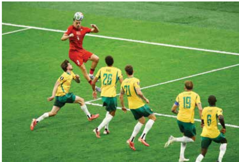
○ من مباراة أستراليا وتركيا

وبهذا الفوز، رفعت أستراليا رصيدها إلى ثلاث نقاط متساوية مع الولايات المتحدة متصدرة المجموعة الرابعة، على أن يلتقي المنتخبان في سياتل يوم الجمعة.