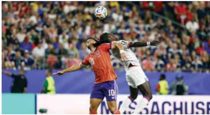
○ من مباراة اسكتلندا وهايتي