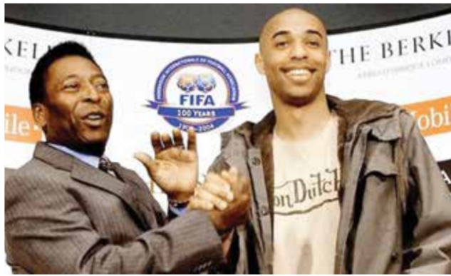
○ هنري وبيليه.

كما أطلقت المدينة اسم بيليه على تقاطع شارع شيا وطريق ميريديان في حي كوينز، تيمناً بالأسطورة البرازيلية المتزوج بكأس العالم ثلاث مرات والذي دافع عن ألوان نادي نيويورك كوزموس بين 1975 و1977. وسيبقى هذا التغيير في اسمي الشارعين حتى الأول من نوفمبر.