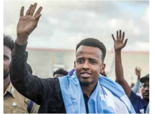
○ عمر عرتن (أ ف ب).

وقاد المدرب السابق لمنتخب إيرلندا، سيلتيك، إلى تسعة انتصارات متتالية ليختتم الموسم بقوة، بعد أن أنقذ الفريق مرتين.