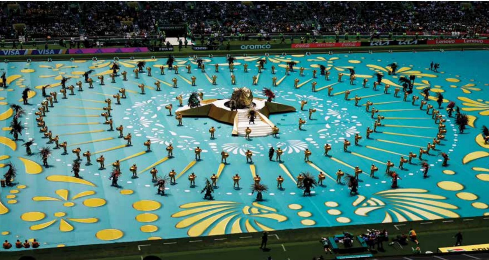
○ من حفل الافتتاح.