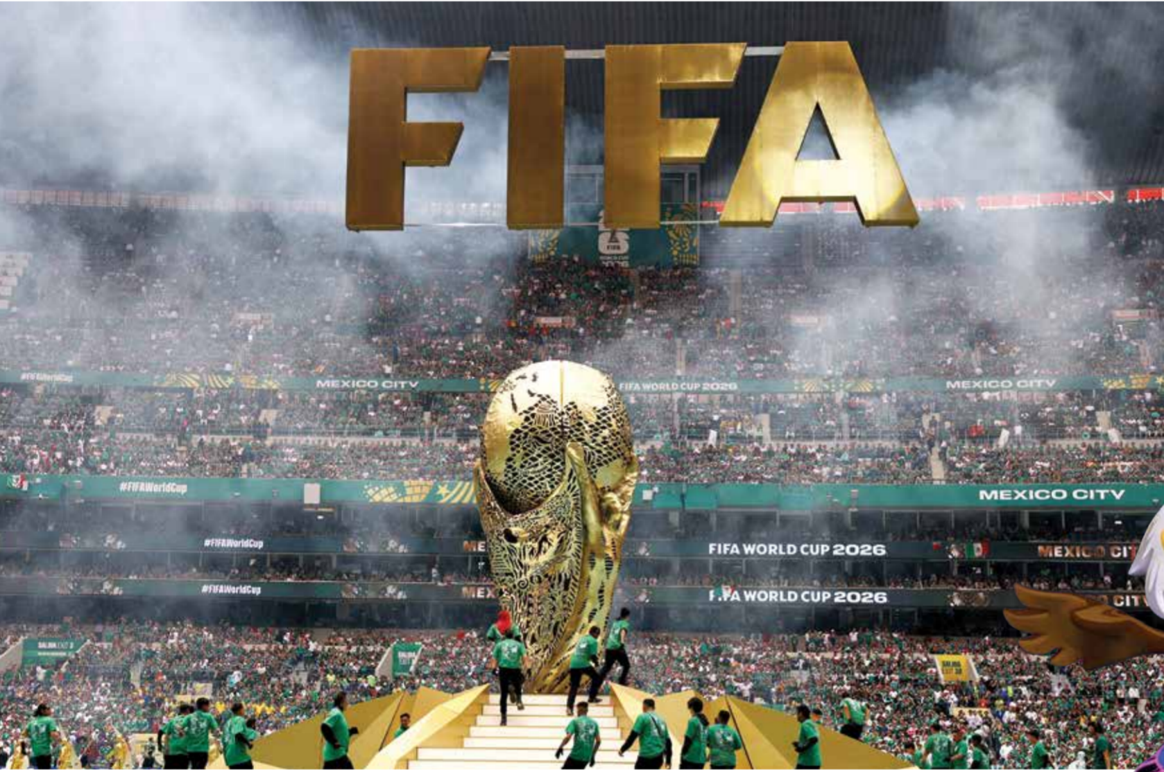
○ حضور جماهيري كبير.

قبلها، تعاقبت على المسرح فرقة «مانا» المكسيكية، ومغني البوب الفنزويلي داني أويسن، وفرقة «لوس أنخليس أسوليس»، ونجم الريغيتون الكولومبي جيه بالفين، وكذلك الإسبانية-المكسيكية بيليندا، وذلك عقب لوحة افتتاحية جسدت راقصين يرتدون أزياء من السكان الأصليين، تتوجهم ريشات كبيرة، ونساء بملابس تقليدية، على إيقاع قارعي للطبول. وتشهد النسخة الثالثة والعشرون من كأس العالم التي تستضيفها بشكل مشترك الولايات المتحدة والمكسيك وكندا حتى 19 يوليو، مشاركة قياسية تضم 48 منتخبا، مع إقامة 104 مباريات.