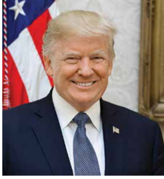
○ الرئيس دونالد ترامب.

أعلنت القيادة العامة لقوة دفاع البحرين أن إيران تواصل نهجها العدائي الممنهج عبر اعتداءاتها الآتية بالصواريخ والطائرات المسيرة التي تستهدف المدنيين في مملكة البحرين. وأوضحت القيادة العامة أنه بإرادة صلبة وجاهزية قتالية عالية تصدت منظومات الدفاع الجوي بقوة دفاع البحرين واعتترضت ودمرت عددا من الاعتداءات الجوية الإيرانية الغادرة. وأكدت القيادة العامة أن جميع أسلحتها ووحداتها في أعلى درجات الجاهزية وعلى أهبة الاستعداد الدفاعي لحماية المملكة. وأكدت وزارة الداخلية أن العدوان الإيراني الآتية الذي تعرضت له البحرين فجر أمس استهدف المناطق السكنية والبنية التحتية، ما أسفر عن إصابة طفلة تبلغ من العمر 11 عاما، وتم معالجتها في الموقع. وأوضحت الوزارة أن العدوان الإيراني السافر أسفر كذلك عن احتراق مركبات وتضرر منازل في مدينة حمد والعاصمة المنامة، لافتة إلى قيام الدفاع المدني والإسعاف الوطني باتخاذ الإجراءات اللازمة في إطار العمل على تعزيز الحماية المدنية وبما يضمن حماية السلامة العامة لكل المواطنين والمقيمين. في الوقت ذاته نوات الإدانات العربية والدولية لاستمرار الاعتداءات الإيرانية التي استهدفت مملكة البحرين ودولة الكويت والمملكة الأردنية الهاشمية، التي تمثل انتهاكا صارخا لسيادة هذه الدول وسلامتها أراضيها، وتصعيدا خطيرا يهدد أمن واستقرار المنطقة ويزيد من حدة التوترات الإقليمية.