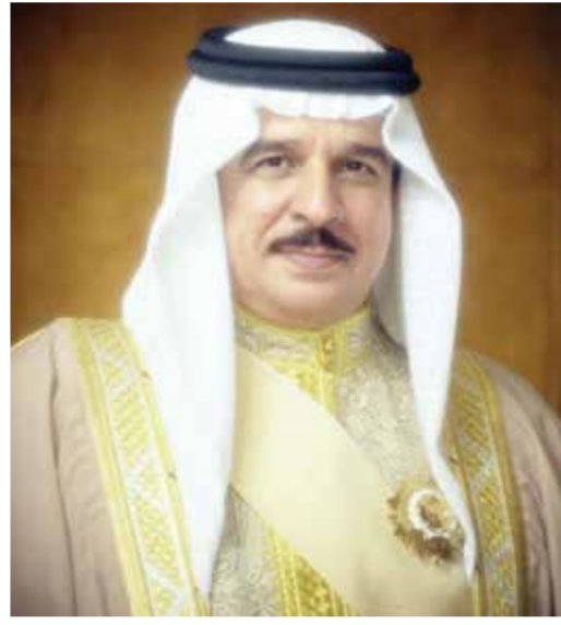
○ جلالة الملك المعظم.