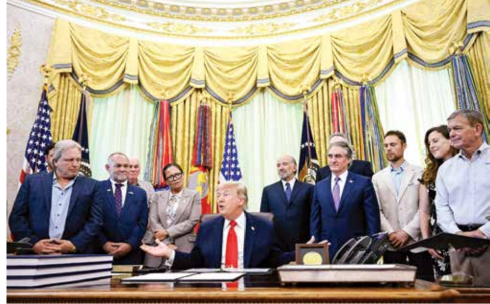
○ ترامب يتحدث للصحفيين بشأن التسوية مع إيران

وستسيطر قريبا على الأسواق والبنية التحتية للنظ والغاز لديها. جاء ذلك في منشور لترامب على منصفته «تروث سوشال» أمس الخميس، كتب فيه: «ستوجه الولايات المتحدة ضربة قوية للغاية للبليلة لإيران (التي فقدت أسطولها البحري وقواتها الجوية وراداراتها ودفاعاتها الجوية وجميع أشكال دفاعاتها الأخرى، بالإضافة إلى معظم قدراتها الهجومية!)». كما أضاف: «وفي وقت ليس ببعيد، سنستولي على جزيرة خارك، وغيرها من مواقع البنية التحتية النفطية، ونسيطر سيطرة كاملة على أسواق النفط والغاز الإيرانية، كما فعلنا مع فنزويلا، وهو ما يحقق نتائج باهرة لكل من فنزويلا والولايات المتحدة الأمريكية.»