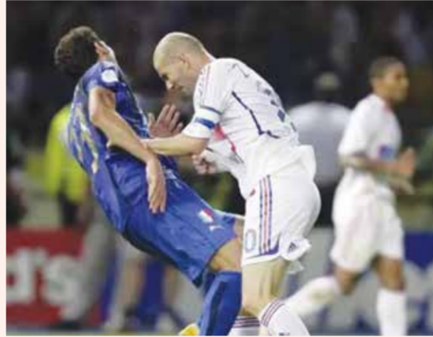
○ زيدان ينطح ماتيراتزي.

أحد أشهر الأهداف في تاريخ كأس العالم سجله الأرجنتيني ديبغو مارادونا بيده في مرمى إنكلترا خلال ربع نهائي مونديال 1986، قبل أن تواصل الأرجنتين مشوارها وتحزن للقب. لم يحاول الأسطورة الأرجنتينية أن «يلطف» ما قام به، إذ اعتبر أنها كانت «يد الله». ولا يزال هذا الهدف يعتبر من أكبر الفضائح