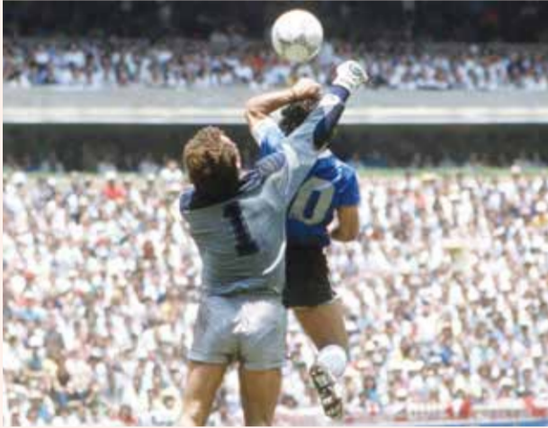
○ مارادونا يسجل هدفة المثير للجدل.

فسي تاريخ التحكم في كرة القدم. طُرد مارادونا في مونديال 1982 ضد البرازيل، واستُبعد في 1994 بسبب تعاطي مواد منشطة محظورة.