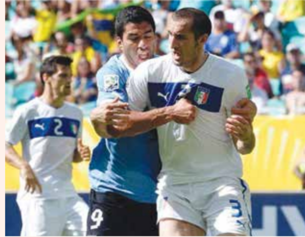
○ سواريس يعض كيبيلي.

في عام 2010، حرم لويس سواريس غانا من بلوغ الدور نصف النهائي. تعادل 1-1 والمباراة تصل إلى لحظاتها القاتلة. تسديدة غانية في طريقها إلى المرمى يقطعها سواريس عن الخط بيده. طرد سواريس، غير أن منتخب بلاده وصل إلى نصف النهائي بركلات الترجيح. في 2014، تصدر سواريس العناوين مجدداً: في دور المجموعات ضد إيطاليا، قام بـ «عض» كنف المدافع جورجو كيبيلي بلا رحمة. صرخ الإيطالي من الألم، وطالب بلا جدوى بمعاذرة سواريس. لم تمر الحادثة مرور الكرام، إذ عوقب بعدها النجم الأوروغواياني بالإيقاف تسع مباريات مع منتخب بلاده.