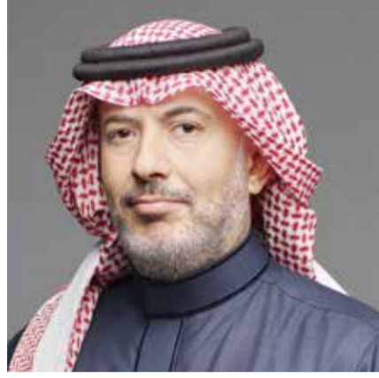
○ الشيخ خليفة بن إبراهيم آل خليفة.

أعلنت لجنة أسواق المال الخليجية مبادرة الرقم الخليجي الموحد للمستثمر (GCC-NIN)، وهي مبادرة استراتيجية تهدف إلى إنشاء رقم مرجعي موحد للمستثمرين الخليجيين، بما يساهم في تعزيز الترابط والتكامل بين الأسواق المالية في دول مجلس التعاون الخليجي. وتهدف هذه المبادرة إلى دعم اتساق وكفاءة إجراءات تعريف المستثمرين عبر الأسواق الخليجية، والحد من الزيادة في عمليات التعريف عند الاستثمار في أكثر من سوق، إلى جانب دعم التطوير المستقبلي لخدمات الحفظ والتسوية وخدمات ما بعد التداول على المستوى الإقليمي، مع مراعاة الأطر التنظيمية والقانونية الخاصة في كل دولة.