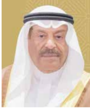
○ رئيس مجلس الشورى.

الراسخة التي تجمع دول مجلس التعاون لدول الخليج العربية ستظل سداً منيعاً في مواجهة كل ما يستهدف أمن منطقتنا واستقرارها، داعياً المولى عز وجل أن يحفظ مملكة البحرين وشعبها الكريم من كل سوء، وأن يدوم عليها نعمة الأمن والاستقرار والازدهار. من جانب، أعرب أحمد بن صالح الصالح، رئيس مجلس الشورى، عن خالص الشكر والتقدير للسيد صقر غباش، رئيس المجلس الوطني الاتحادي الإماراتي، مثمناً ما تضمنه خطابه من مشاعر أخوية صادقة ومواقف داعمة تعكس عمق العلاقات الأخوية الراسخة التي تجمع مملكة البحرين