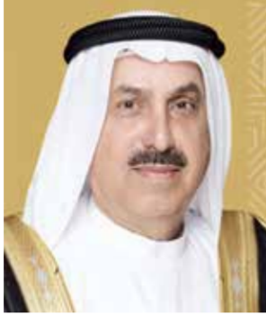
○ صقر غباش.

رعاية واهتمام حضرة صاحب الجلالة الملك حمد بن عيسى آل خليفة ملك البلاد المعظم، وأخيه صاحب السمو الشيخ محمد بن زايد آل نهيان رئيس دولة الإمارات العربية المتحدة الشقيقة.