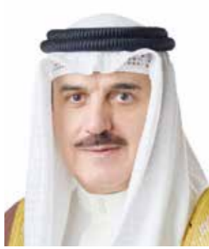
○ رئيس مجلس النواب.

وأني يدوم عليها نعمة الأمن والاستقرار والازدهار. من جانب، أعرب أحمد بن سلمان المسلم رئيس مجلس النواب عن عميق الشكر والامتنان للسيد صقر غباش رئيس المجلس الوطني الاتحادي الإماراتي، وما تضمنه خطابه من تأكيد للموقف الراسخ والعلاقات الوثيقة والمصير المشترك الذي يجمع مملكة البحرين ودولة الإمارات العربية المتحدة الشقيقة في ظل