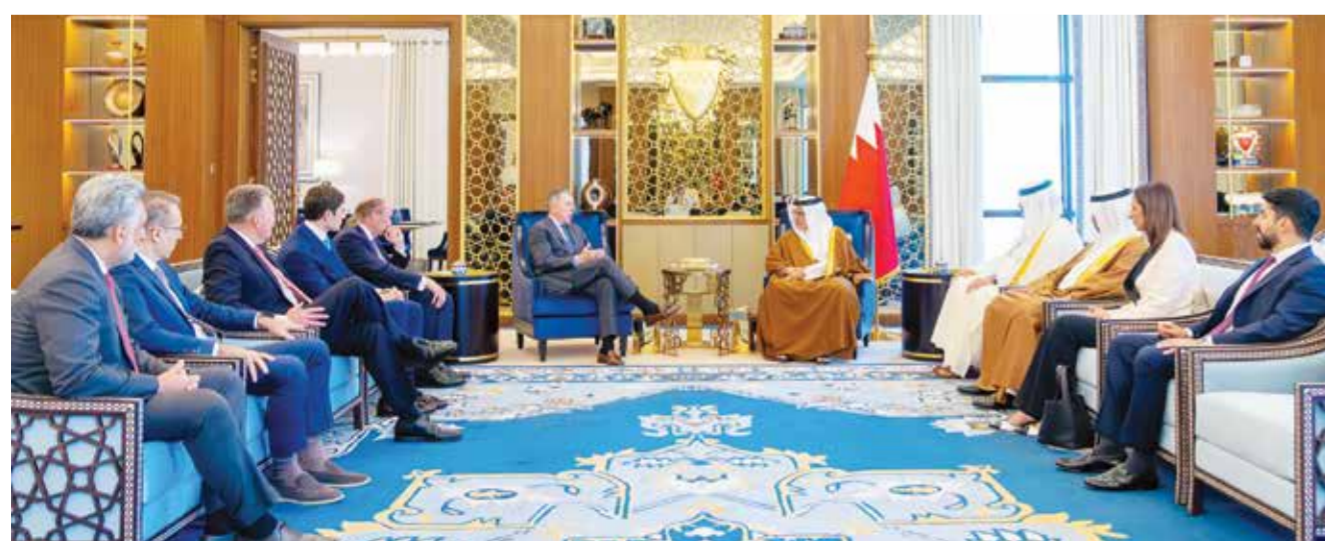
○ سمو ولي العهد رئيس الوزراء خلال لقائه الرئيس التنفيذي والشريك الإداري لشركة أطلس ميرشنت كابيتال.

مع المؤسسات المالية والمصارف بما يساهم في تحقيق الأهداف المرجوة، متمنياً لمملكة البحرين المزيد من التقدم والإنجاز. وتقديره لصاحب السمو الملكي ولي العهد رئيس مجلس الوزراء على ما يوليه من حرص مستمر بتعزيز التعاون وتنمية الشراكات من جانبه، أعرب روبرت دايموند المؤسس والرئيس التنفيذي والشريك الإداري لشركة أطلس ميرشنت كابيتال عن بالغ شكره كما جرى خلال اللقاء مناقشة عدد من القضايا ذات الاهتمام المشترك وآخر المستجدات على صعيد الاقتصاد العالمي.