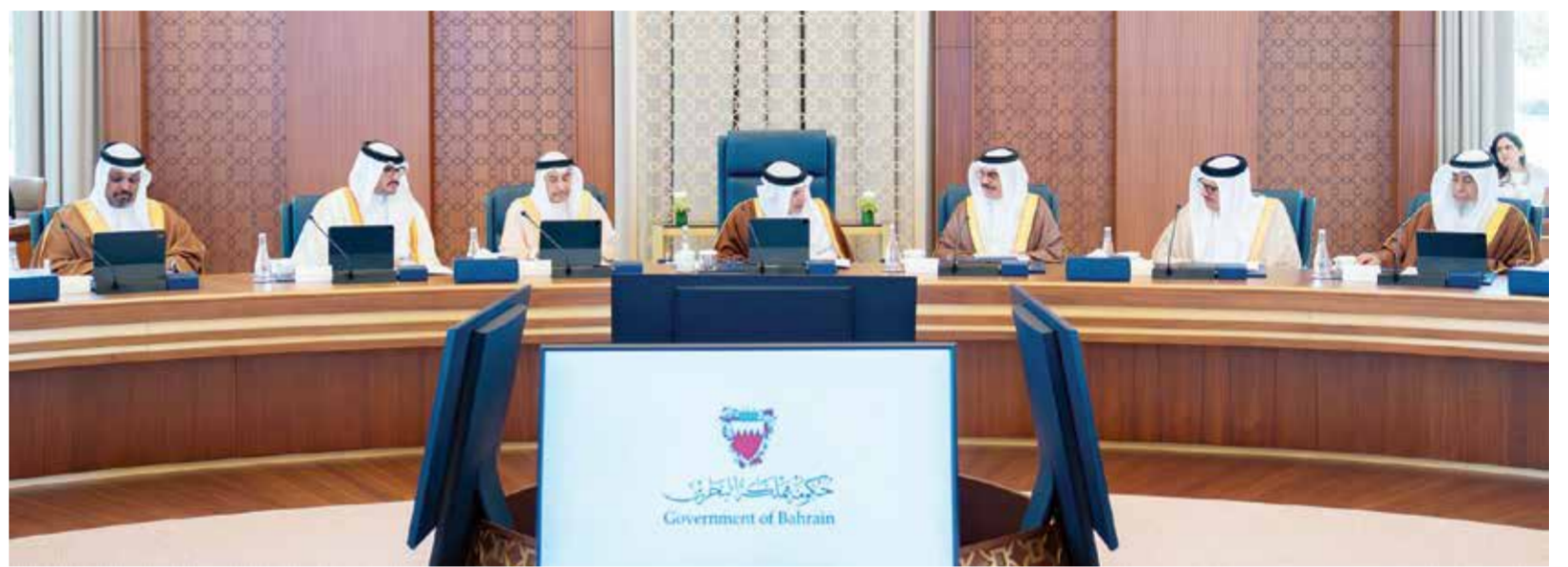
○ سمو ولي العهد رئيس الوزراء يترأس جلسة مجلس الوزراء.