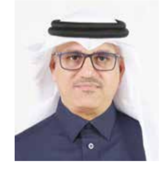
الشيخ محمد بن أحمد.

في إطار الجهود الحكومية المستمرة لتطوير جودة الخدمات وإعادة هندستها طورت وزارة شؤون البلديات والزراعة بالتعاون مع المحافظة الجنوبية خدمة إيداع مبلغ التأمين للتأمين التجاري (موسم البر) إلكترونياً، كخدمة رقمية تهدف إلى تمكين أصحاب طلبات التأمين غير التجاري بالمحافظة الجنوبية من إيداع واسترجاع مبلغ التأمين الخاص بنظام موقع المخيم إلكترونياً، بما يسهم في تطوير الخدمات المقدمة للمستفيدين، وتبسيط الإجراءات، ورفع كفاءة إنجاز المعاملات. وتتبع الخدمة المطورة تم تقليص مدة إنجاز الطلب من 3 أيام عمل إلى إجراء تلقائي وفوري، وذلك عبر التحول الإلكتروني الكامل للخدمة بنسبة 100%، إلى جانب تحسين واجهة وتجربة المستخدم وتبسيط الإجراءات.